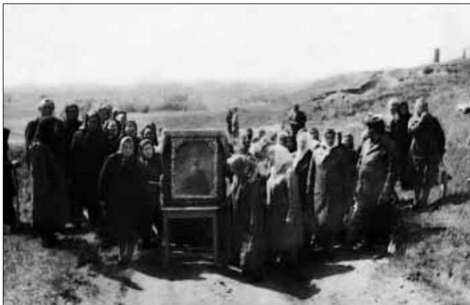
Крестный ход с иконой апостола Иоанна Богослова в 60-е годы