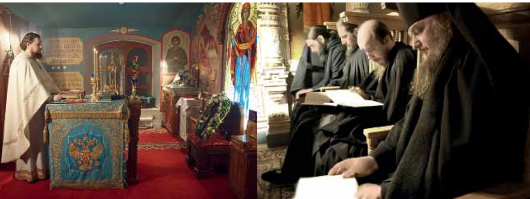
В алтаре храма икона Божией Матери «Скоропослушница»