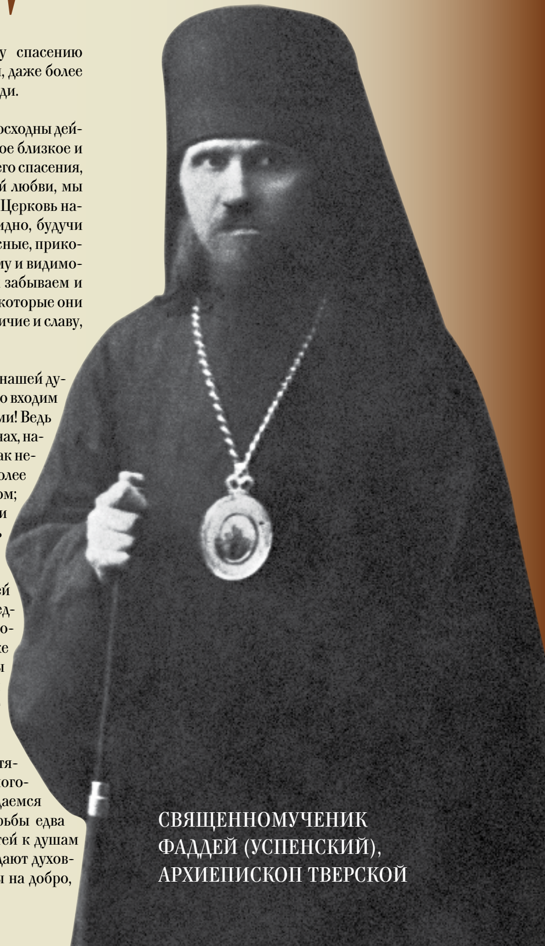
СВЯЩЕННОМУЧЕНИК ФАДДЕЙ (УСПЕНСКИЙ), АРХИЕПИСКОП ТВЕРСКОЙ

М ало того, ведь мы, обложенные тягелою, ленивою, немощною и многострастною плотью, так слабы, так побеждаемся страстями плотскими, уступаем без борьбы едва не всякому натиску или приступу страстей к душам нашим. Ангелы же такую большую обладают духовною крепостию, так они удобоподвижны на добро,