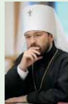
Иларион, митрополит Волоколамский, председатель Редакционного совета «Журнала Московской Патриархии»