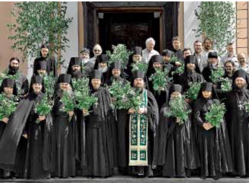
После богослужения на Троицу