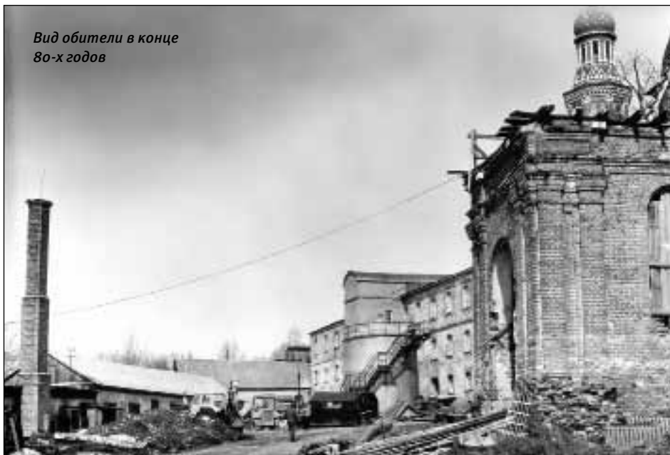
Вид обители в конце 80-х годов

Батюшка был удивительным человеком. Как духовник он был очень кротким, впрочем, и как игумен. Зачастую в наш монастырь присылали послушников из других мест на исправление, потому что знали, что если человек и с отцом Авелем не уживется, то как ему дальше монашествовать? У батюшки всё было в меру: он мог сказать строго и знал, где не-