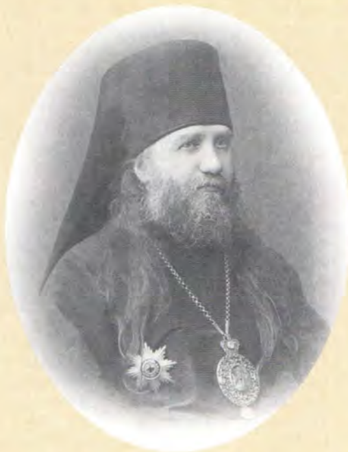
Архиепископ Ярославский и Ростовский Тихон (Беллавин)

Деятельность святителя Тихона в качестве архиепископа Ярославского и Ростовского – важный этап его биографии. Именно в эти семь лет (1907–1914) утвердились те взгляды на жизнь, те нравственные качества, которые впоследствии делают его гордостью Русской Церкви, подобно святому митрополиту Филиппу.