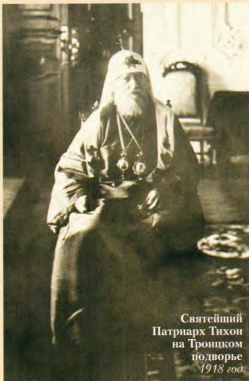
Святейший Патриарх Тихон на Троицком подворье 1918 год

ру, доносившемуся из церкви при покаях Владыки. Смягченный расстоянием, хор звучал так печально, строго, так настраивал к предстоящей беседе с Патриархом.