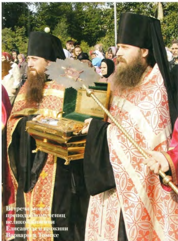
Встреча мощей преподобномученицы великой княгини Елисаветы и щюкини Варвары в Томске

Праздник закончился, но никогда не истощается милость Божия. Через несколько дней после юбилея города Господь подарил православным томичам нечаянную радость. С 14 по 17 сентября 2004 года в Томске находилась великая