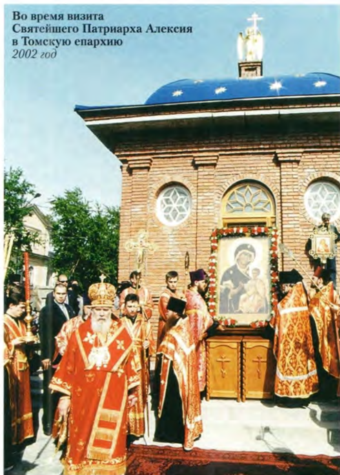
Во время визита Святейшего Патриарха Алексия в Томскую епархию 2002 год

его посещения Томска освятил камень на месте строительства часовни в память Троицкого собора. Вскоре был готов фундамент и составлен проект будущей часовни – точная копия фрагмента разрушенного храма. По замыслу архитекторов, высота часовни будет равна 30 метрам.