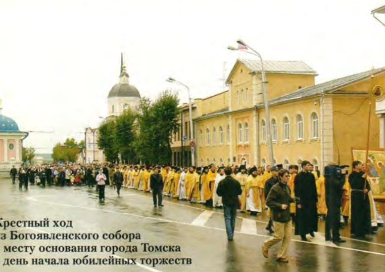
Крестный ход из Богоявленского собора к месту основания города Томска день начала юбилейных торжеств

По невыясненным окончательно причинам обрушился главный купол, но стены остались целы и тридцать лет стояли, омрачая настроение горожан. Только в 1889 году очередная попытка разобрать развалины и закончить строительство увенчалась успехом. 25 мая 1900 года святитель Макарий (Невский) совершил торжественное освящение собора, который сразу стал кафедральным. В Томске начала двадцатого века не было здания бо-