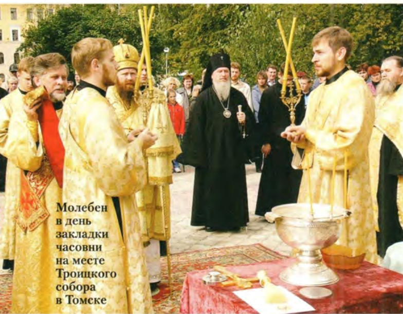
Молебен в день закладки часовни на месте Троицкого собора в Томске

Томск, а затем размещен на воссозданной 14-метровой звоннице. 31 августа при многочисленном стечении народа, в присутствии официальных лиц и гостей архиепископ Томский и Асиновский Ростислав совершил его освящение.