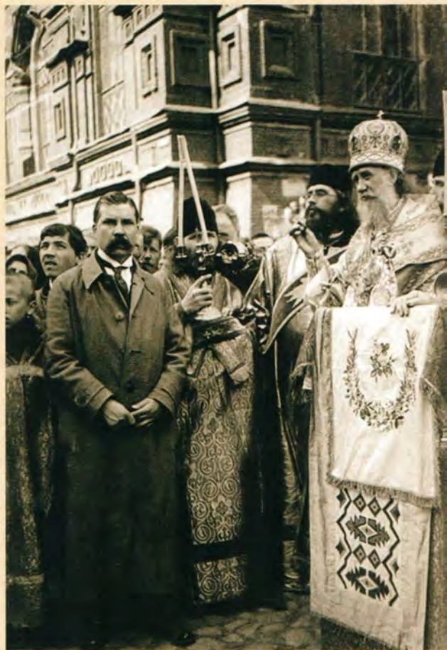
Святейший Патриарх Тихон за молебном в день памяти Святителя и Чудотворца Николая 22 (9) мая 1918 года

Никольские ворота, к которым направлялись крестные ходы, были приведены в праздничный вид. У иконы Николая Чудотворца повешена новая лампада, сама икона убрана живыми цветами. Внизу на воротах, разбитых в октябрьские дни, повешен венок, в середине которого — небольшой образ Николая Угодника.