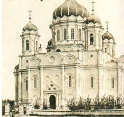
Троицкий кафедральный собор в Томске, разрушенный в 1934 году

сибирская зима, были сильные морозы, но томичи пришли проводить в последний путь свой любимый колокол. Многие не могли удержаться тогда от слез, видя, как разрушается эта святыня. Некоторые, несмотря на лютую стужу, напоследок хотели поцеловать колокол, но при сильном морозе их губы примерзали к металлу, и этот колокол-мученик обагрился человеческой кровью. Он разделит судьбу нашего отечества, судьбу народа, который восходил на свою