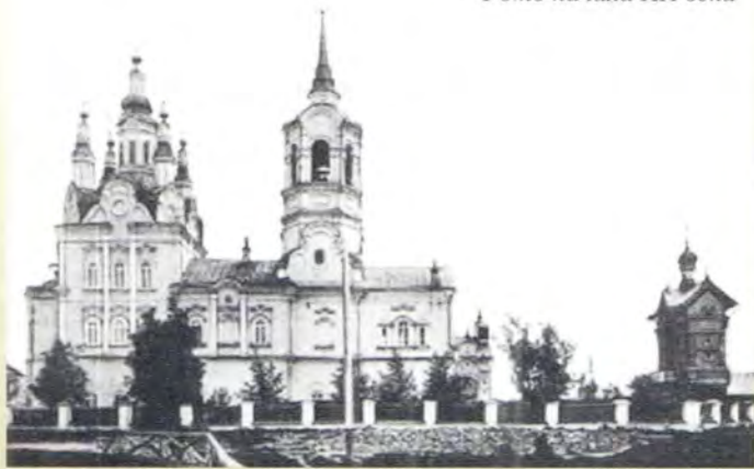
Воскресенский собор в Томске Фото начала XX века

Учредителями фонда «Благовест» стали дирек-