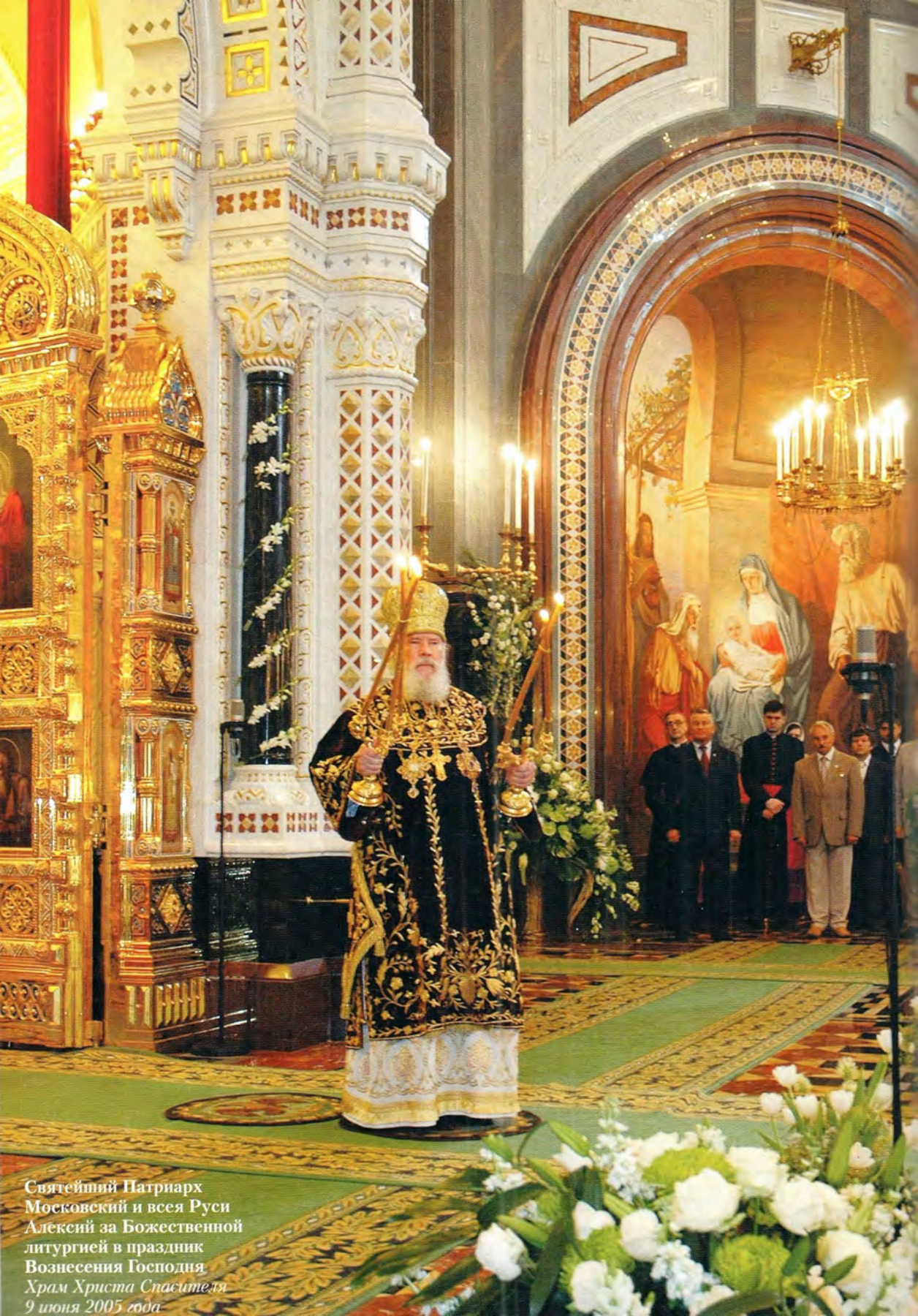
Святейший Патриарх Московский и всея Руси Алексий за Божественной литургией в праздник Вознесения Господня Храм Христа Спасителя 9 июня 2005 года