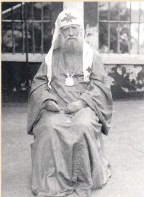
Святитель Патриарх Тихон

По поводу моей заметки «Отцы и пастыри» я слышал несколько отзывов и суждений. В данном случае, конечно, на первый план я ставлю не голоса мирян, а слово пастырей Церкви. Вот вкратце мои беседы с духовными иерархами.