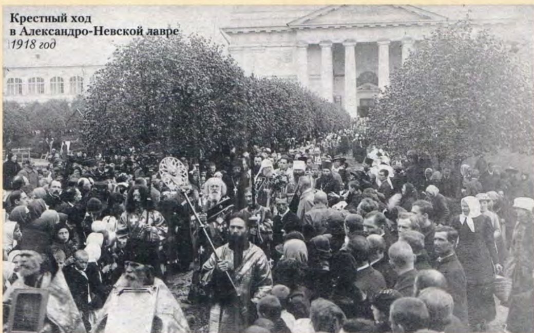
Крестный ход в Александро-Невской лавре 1918 год