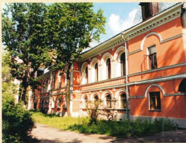
Троицкое подворье в Москве

Какой мир, благообразие... и чистота в патриарших покоях! Подчеркиваю: чистота. Потому что по этой физической опрятности и порядку у скольких стосковалась душа при виде загаженности и заплесневанности всего, где только волей судеб расположился «товарищ».