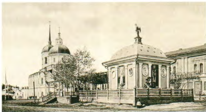
Иверская часовня в Томске

Освящение начала строительных работ состоялось 11 июня 1844 года, а к июлю 1850-го строители уже занимались работами на верхней части главного купола. Казалось, грандиозное дело близится к завершению, когда 26 июля случилось страшное несчастье.