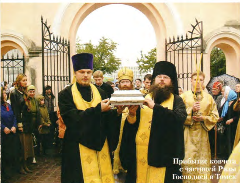
Прибытие ковчега с частицей Ризы Господней в Томск

сяти священнослужителей: клирики Томской, Кемеровской и Новосибирской епархий. После Литургии крестный ход двинулся от Богоявленского собора к мысу Воскресенской горы, на то место, откуда началась первая на Томской земле Троицкая церковь. Священнослужители вместе с чтимым списком иконы