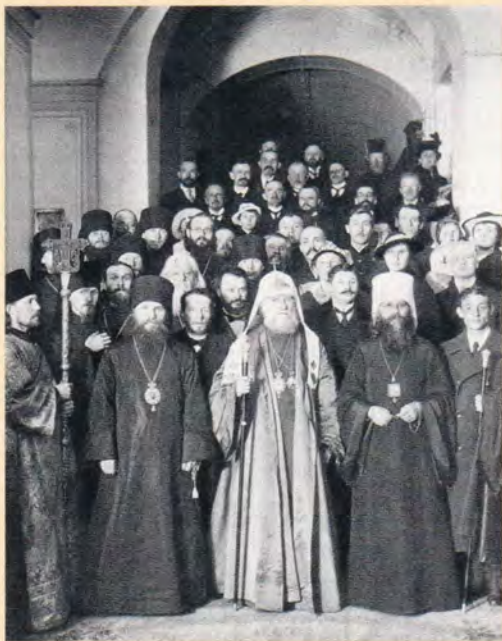
Святейший Патриарх Тихон и митрополит Петроградский Вениамин с группой петроградских священнослужителей и мирян. 1918 год

нее. Многие священнослужители заплатили своей жизнью за исполнение своего долга, за исповедание своей веры. Но надо надеяться, что эти гонения пройдут скоро, ибо в них повинен не русский народ, но только некоторые упорные круги, которые являются гонителями и преследователями Православной Церкви.