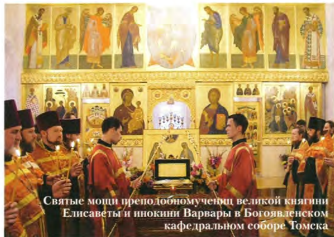
Святые мощи преподобномучениц великой княгини Елисаветы и инокини Варвары в Богоявленском кафедральном соборе Томска