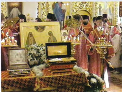
В храме Преображения Господня в Якутске