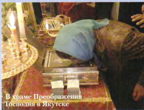
В храме Преображения Господня в Якутске