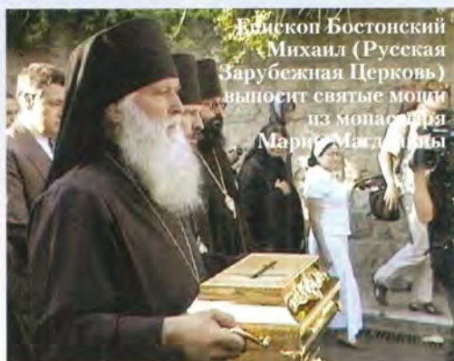
Епископ Бостонский Михаил (Русская Зарубежная Церковь) выносит святые мощи из монастыря Марии Магдалины

лых мраморных раках по обе стороны алтаря.