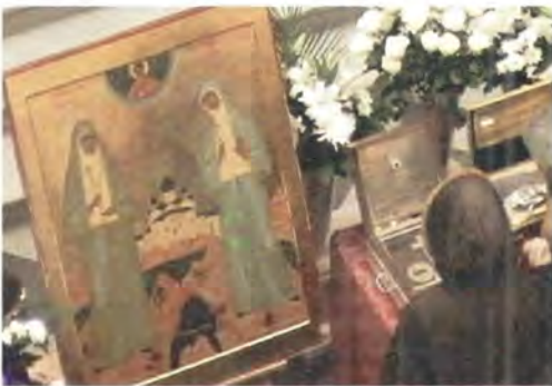
В храме-памятнике на крови, в Екатеринбурге

На другой день православные тобольчане вместе с воспитанниками Тобольской Духовной семинарии проводили их во второй кафедральный город епархии – Тюмень. Основанная в XVII столетии православными казаками, осваивавшими сибирские просторы, Тюмень к концу XIX века имела 18 церквей (вместе с монастырскими), 4 приписные церкви и 56 часовен. Духовное сословие насчитывало более 200 че-