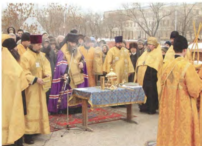
Епископ Саратовский и Вольский Лонгин совершает молебен перед закладкой памятной капсулы

сле закладки капсулы Владыка Лонгин. — Благословение Божие явлено видимым образом, потому что со времени начала стройки и до сего дня сделано немало: столько, сколько могут