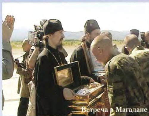
Встреча в Магадане