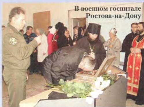
В военном госпитале Ростова-на-Дону

Пока главный ковчег с десной рукой великой княгини находился в кафедральном Андреевском соборе, малый ковчег около суток пробыл в Минеральных Водах – крупном железнодорожном узле, соединяющем Южную Россию и Кавказ. Для поклонения святым мощам преподобномучениц сюда съехались жители всех остальных благочиний Ставропольской епархии из Владикавказа, Пятигорска, Кисловодска. Не менее десяти тысяч человек побывали за это время в Покровском соборе Минеральных Вод. На следующий день честные останки алапаевских преподобномучениц возвратились в Ставрополь, где были торжественно встречены у стен кафедрального собора.