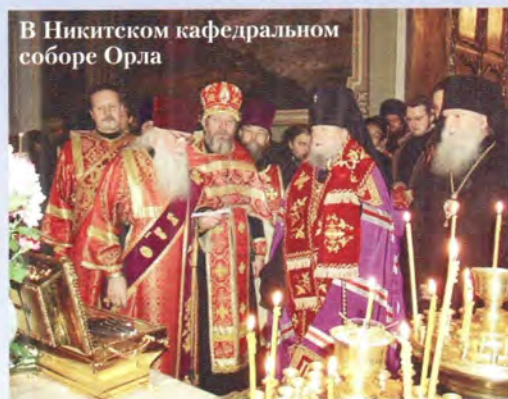
В Никитском кафедральном соборе Орла

главный ковчег с десной рукой великой княгини оставался в кафедральных храмах епархиальных городов, малый ковчег перевозился по больницам, воинским госпиталям, детским домам, интернатам и домам престарелых, тюрьмам и воинским частям, с тем чтобы все желающие могли поклониться великим молитвенницам за наше отечество.