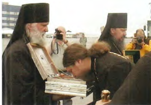
В аэропорту Анадыря

В течение следующих суток святые мощи находились в кафедральном Преображенском храме столицы Чукотской автономной области города Анадыря. Их прибытие совпало с празднованием 115-летия города, некогда называвшегося в честь императрицы Марии Феодоровны, матери императора Николая II, Новомариинском. Весь день проходили народные гулянья на главной площади города, где сейчас возводится новый ка-