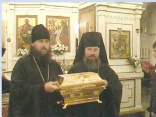
В Воскресенском кафедральном соборе Южно-Сахалинска

нее служило кинотеатром. В течение всего времени их пребывания здесь ежечасно совершались молебны святым преподобномученицам Елисавете и Варваре.