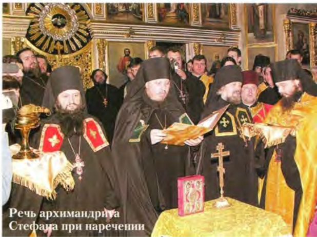
Речь архимандрита Стефана при наречении

От мощей особенно любимого мною пастыря, святого праведного Иоанна Кормянского, не оставляя молитв о его