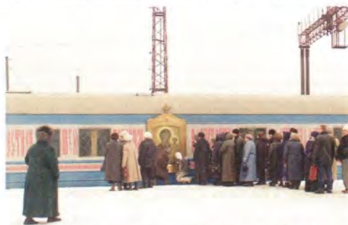
Встреча храма-вагона в Тамбове

Прибытие святых мощей преподобномучениц Елисаветы и Варвары на Донскую