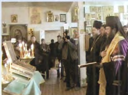
В Преображенском кафедральном соборе