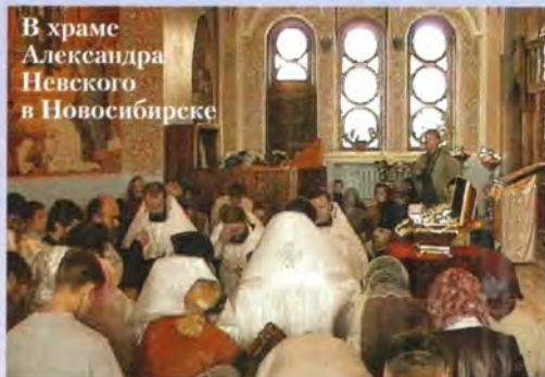
В храм Александра Невского в Новосибирске

ских городах, удаленных от губернского центра на многие сотни километров.