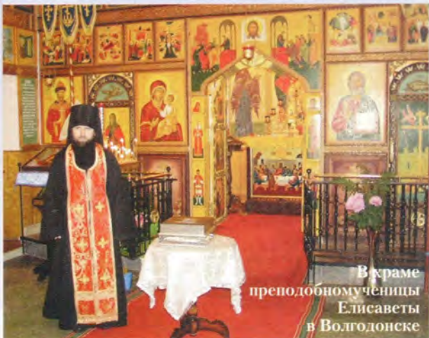
В храме преподобномученицы Елисаветы в Волгодонске

Декабрь 2004 года святыня провела в пути по епархиям Юга и центральной части России. В Ставрополе встречать храм-вагон крестным ходом пришли священнослужители и прихожане всех десяти храмов города, а также шести благочиний Ставропольской епархии. Последний раз молитвенное шествие подобного масштаба состоялось