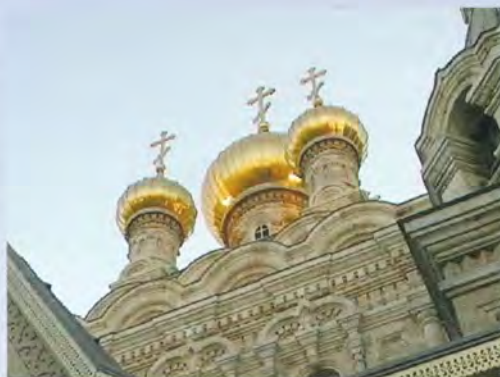
Храм Марии Магдалины в Иерусалиме

ла сама великая княгиня вместе со своим супругом – великим князем Сергеем Александровичем, председателем Императорского Православного Палестинского общества. В 1921 году крипта этого храма стала местом последнего упокоения великой княгини Елисаветы и ее союзницы Варвары. 1 мая 1982 года, когда праздновалось 100-летие Православного Палестинского общества, Русской Православной Церковью Заграницей они были прославлены в Соборе новомучеников Российских, а десять лет спустя канонизированы и Русской Православной Церковью. Их нетленные мощи торжественно перенесли в храм, где ныне они покоятся в бе-