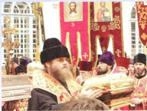
Епископ Тамбовский и Мичуринский Феодосий с мощами преподобномучениц

ский Пантелеимон поздравил свою паству с двенадцатым праздником, отметив, что нынешнее торжество усугублено прибытием святых мощей преподобномучениц Владыка Пантелеимон напомнил о том, что жизнь наших соотечественников сегодня наполнена многими скорбями, от рук террористов часто льется кровь невинных людей, особенно это ощущается на Ростовской земле. «Рядом с нами огнедышащий Кавказ, искры которого долетают и до нас», – подчеркнул он. «Сегодня, – сказал архиепископ Ростовский и Новочеркасский, – чтобы не