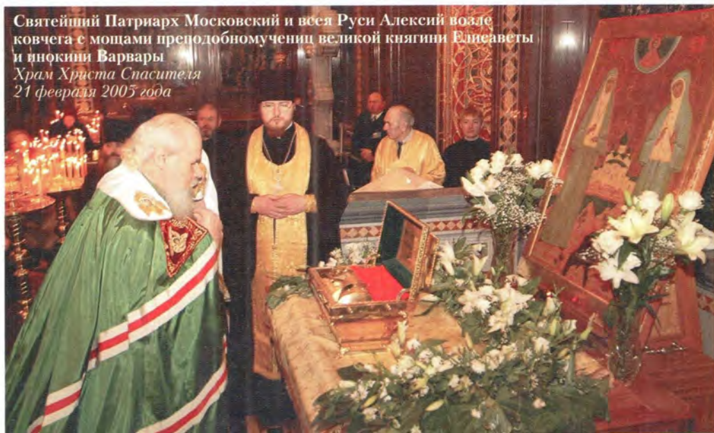
Святейший Патриарх Московский и всея Руси Алексий возле ковчега с мощами преподобномучениц великой княгини Елисаветы и инокини Варвары Храм Христа Спасителя 21 февраля 2005 года