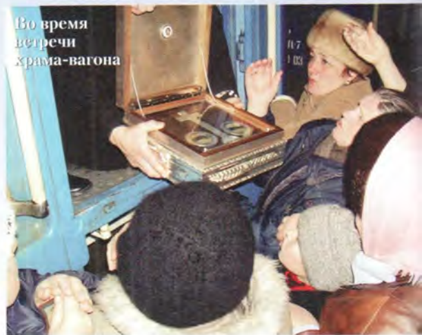
Во время встречи храма-вагона