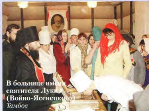
В больнице имени святителя Луки (Войно-Ясенецкого) Тамбов

Святые мощи преподобномучениц прибыли в Тамбовскую епархию в год празднования 90-летия канонизации святителя Питирима, епископа Тамбовского. Великая княгиня Елисавета Феодоровна очень