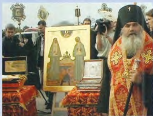
Встреча во Владивостоке