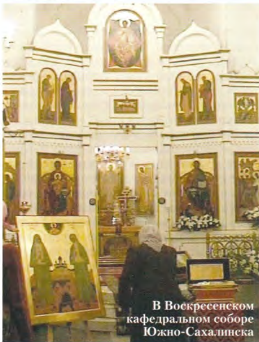
В Воскресенском кафедральном соборе Южно-Сахалинска

Из храма велась прямая теле- и радиотрансляция, а в каждом информационном выпуске звучала информация о святине. В память о ее пребывании на Камчатской земле перед Никольским храмом был водружен и освящен поклонный крест.