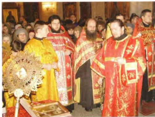
Молебен в Старом Осколе

С Орловской землей тесно связан жизненный путь отца Митрофана Сребрянского. В сентябре 1897 года он был назначен настоятелем Покровского храма квартировавшего в Орле 51-го драгунского Черниговского полка, шефом которого являлась великая княгиня. Трудями отца Митрофана здесь был воздвигнут новый храм, созданы школа и библиотека, за что в 1900 году священник был награжден золотым наперсным крестом. К сожалению, Покровский храм был разрушен в годы богоборчества. Сегодня это место отмечено памятным крестом, к которому православные орловчане совершают крестные ходы.