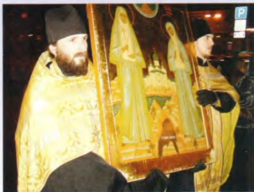
Во время крестного хода в Воронеже

В 1902 году настоятельница Марфо-Мариинской обители присутствовала на торжественном прославлении и обретении