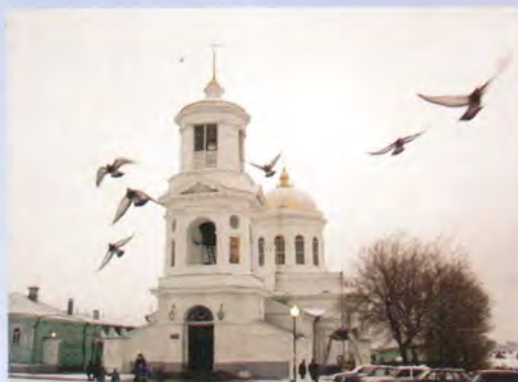
Псковский кафедральный собор

Главный ковчег крестным ходом пронесли по всем храмам Белгорода. В каждом из них перед святыми мощами совершался краткий молебен. Последняя остановка была сделана в Смоленском соборе, возведенном еще в 1743 году: его стены помнят святителя Иоасафа Белгородского, совершавшего здесь богослужения. Провожать свя-