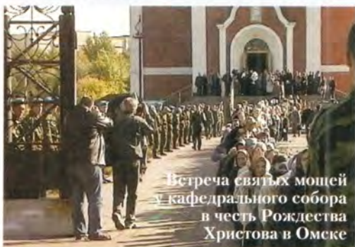
Встреча святых мощей у кафедрального собора в честь Рождества Христового в Омске