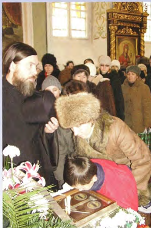
В Старом Осколе

Малый ковчег перевезли во Мценск, а затем в возрождающийся Троицкий Оптин Рождества Богородицы женский монастырь в древнем Болхове, в соборном храме которого освящен придел во имя Царствен-