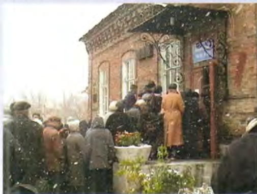
Возле Напольной школы в Алапаевске

Из Екатеринбурга святыни были перевезены в Алапаевск. Название этого небольшого городка, население которого составляет сегодня около сорока тысяч человек, оказалось навсегда вписанным в новейшую историю России. В Свято-Троицкой церкви, в склепе которой были первоначально погребены тела мучеников, извлеченных из шахты, состоялся молебен перед святыми мощами великой княгини и инокини Варвары. В ночь на пятое октября, когда святые мощи преподобномучениц