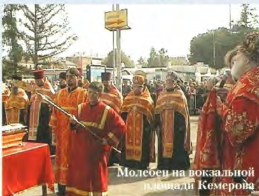
Молебен на вокзальной площади Кемерово

Наиболее протяженная, наземная часть маршрута пролегла по областям России, Белоруссии и странам Балтии. Мощи перевозились по железной дороге в специальном храме-вагоне в честь Смоленской иконы Божией Матери, принадлежащем Миссионерскому отделу Русской Православной Церкви. Их путь из Владивостока пролегал через Уссурийск, Хабаровск, Комсомольск-на-Амуре, Биробиджан, Благовещенск, Читу, Улан-Уде и далее по Транссибирской магистрали вглубь страны, по маршруту, обратному тому, который проделали честные останки жертв алапаевской