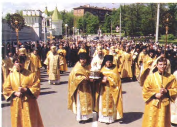
Крестный ход с мощами Святителя и Чудотворца Николая в Николо-Угрешском монастыре