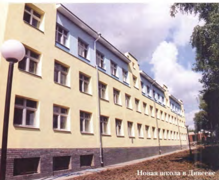
Новая школа в Дивееве

фима Саровского, а Свято-Троицкий Серафимо-Дивеевский монастырь, один из уделов Божией Матери, и впредь будет местом паломничества и молитвы многих людей, с верой обращающихся к великому святому Земли Русской.