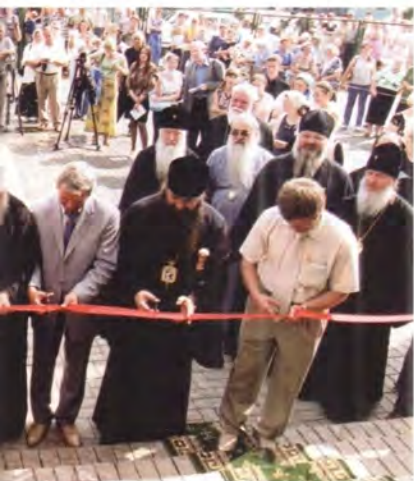
Торжественное открытие школы

В завершение своего визита члены церковной делегации поклонились святыням Сарова: посетили келию преподобного