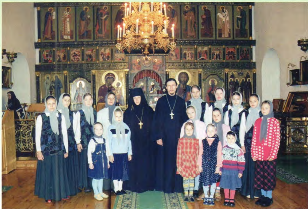
Воспитанницы монастырского приюта со своими духовными наставниками