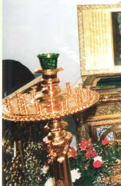
Рака с честными мощами святителя Суздальского и Тарусского Варлаама и преподобного Стефана Махрищского

В Смутное время монастырь разоряется до основания польско-литовским нашествием и указом царя Михаила Федоровича в 1615 году приписывается к Троице-Сергиевому. Однако новое возрождение Стефано-Махрищского монастыря начинается много позднее, с конца XVIII века, и непосредственно связано с именем митрополита Московского Платона (Левшина), выдающегося богослова и проповедника, полю-