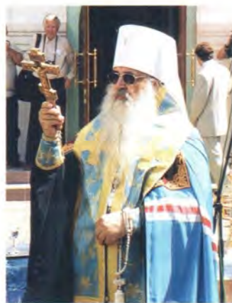
Митрополит Минский и Слуцкий Филарет благословляет народ Божий

Орловский и Ливенский Паисий, епископ Нижегородский и Арзамасский Георгий и другие. Всего в торжествах принимали участие более пятидесяти архиереев Московского Патриархата из России, Украины и Белоруссии.