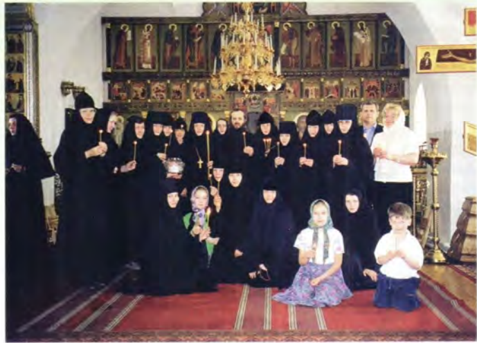
Сестры обители в храме во имя преподобного Стефана Махрицкого Пасха 2004 года

Махрицкое урочище, увенчанное Троицким монастырем, словно древо, обильно плодоносило на ниве духовной, одаривая благодатью Божией всякого приходящего – от самого именитого до последнего нищего. Монастырь рос и