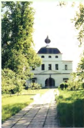
Надвратный храм во имя Преподобного Сергия Радонежского

княжеский прием, иннок Стефан отказался водвориться в Москве и поселился в урочище реки Махры на Владимирской земле. Несколько лет провел преподобный Стефан в трудах и молитве, которым не суждено было остаться в тайне, ибо никто зажегши свечу, не ставит ее в сокровенном ме-