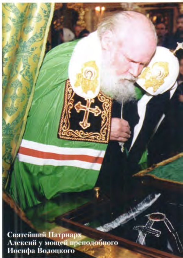
Святейший Патриарх Алексей у мощей преподобного Иосифа Волоцкого

Святейший Патриарх Алексей совершил Божественную литургию и краткий молебен перед святыми мощами преподобного Иосифа Волоцкого в Успенском соборе Свято-Успенского Иосифо-Волоцкого мужского монастыря в Московской области. По окончании богослужения временно исполняющий обязанности наместника архимандрит Феохист