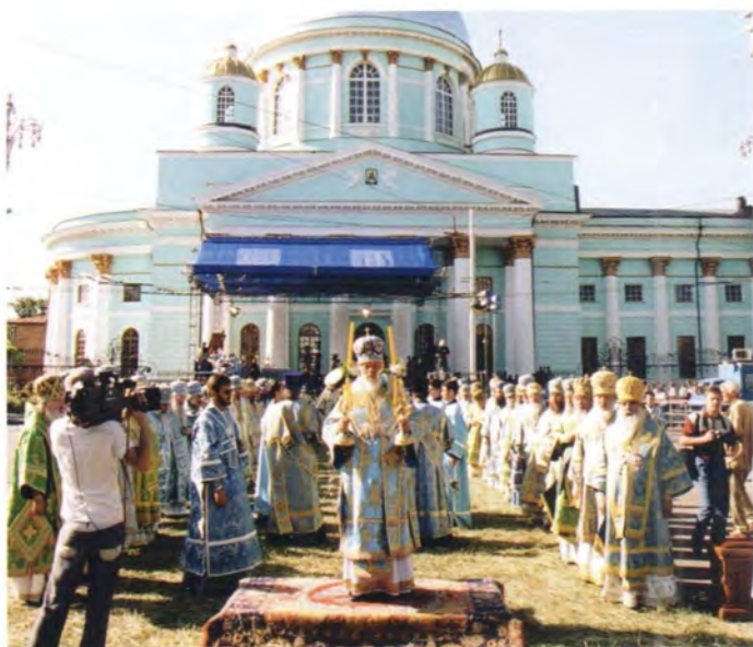
За Божественной литургией