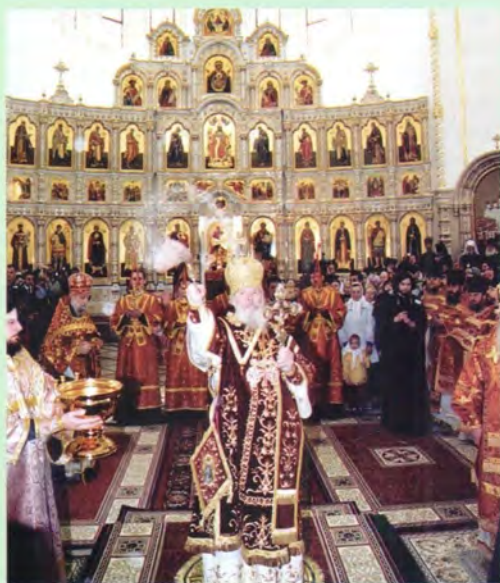
Освящение храма во имя Живоначальной Троицы на Борисовских прудах в Москве

Святейший Патриарх Алексей совершил великое освящение храма-памятника во имя Живоначальной Троицы на Бо-