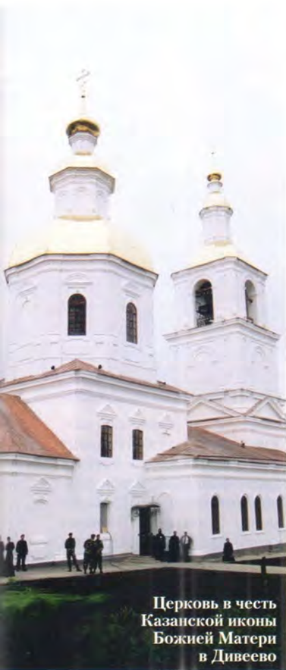
Церковь в честь Казанской иконы Божией Матери в Дивеево