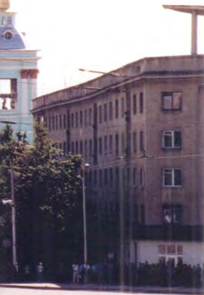
Знаменский кафедральный собор Курска