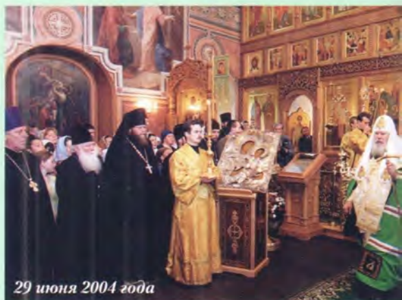
29 июня 2004 года

Святейший Патриарх Алексий совершил чин молебного пения в храме Пре-