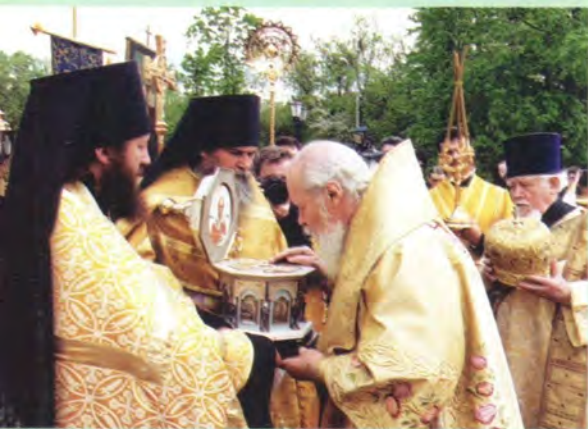
Во время молебна в день памяти Святителя и Чудотворца Николая Николо-Угрешский монастырь

22 мая – память перенесения мощей Святителя и Чудотворца Николая из Мир Ликийских в Бари.