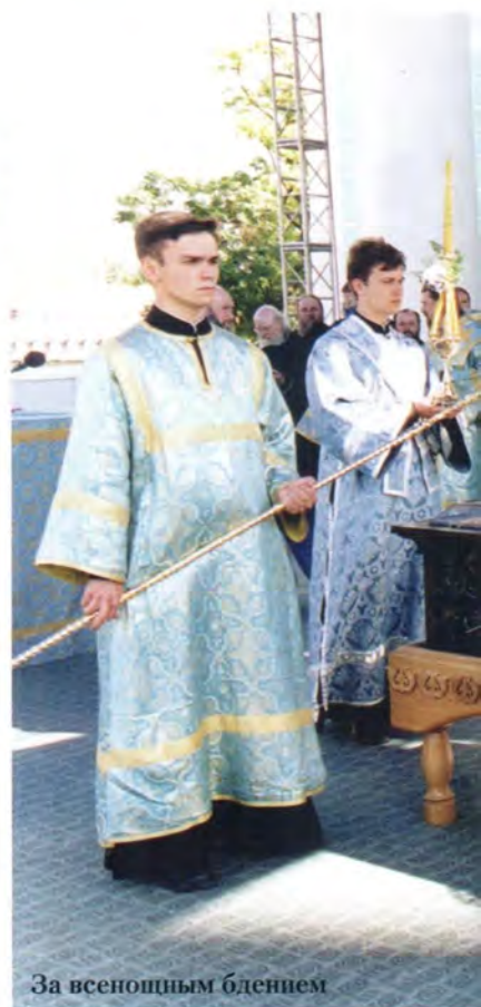
За всеобщим бдением

задумается о сохранении и возрождении духовных традиций. В нашем стремлении привести людей к православному веру нет никакого вызова, никакого противопоставления миру окружающему – напротив, мы призываем всех войти в нашу радость (Мф. 25, 21), так как вера Христова всегда несла людям добро, мир, радость и любовь.