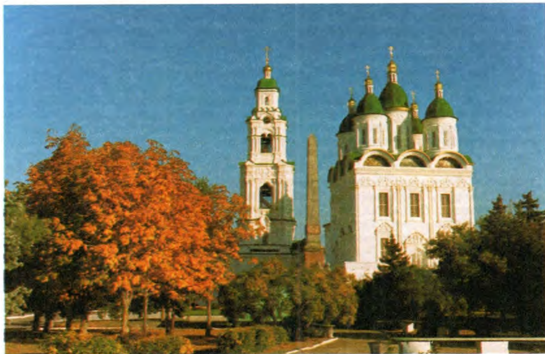
Успенский собор Астраханского кремля

Говоря о вкладе Русской Православной Церкви в облегчение участи заложников и их родственников, Его Святей-