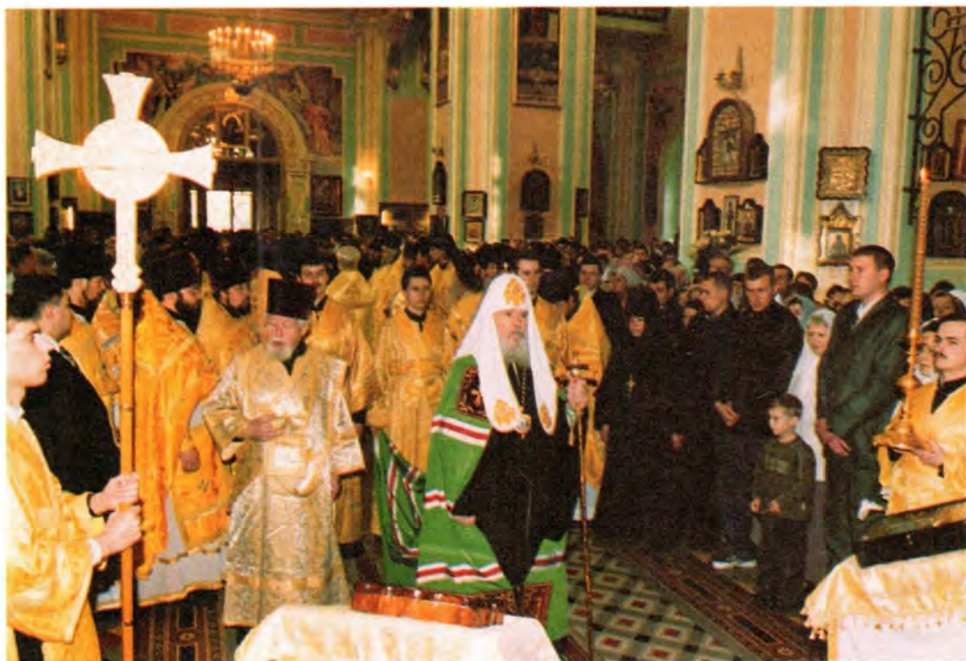
Перед началом Божественной литургии в храме в честь Казанской иконы Божией Матери

Восстановление дома Божия явилось истинным благословением верующим астраханцам к 400-летию юбилею епархиальной жизни. Святейший Патриарх поблагодарил руководителей области и города за помощь в восстановлении православных святынь в Астраханской области.