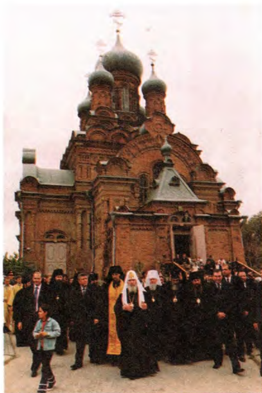
Посещение Святейшим Патриархом Предтеченского мужского монастыря в Астрахани

сослужили митрополиты Волгоградский и Камышинский Герман, Екатеринодарский и Кубанский Исидор, архиепископы Вере́йский Евгений, Астраханский и Ено́таевский Иона, епископы Элистинский и Калмыцкий Зосима, Дмитровский Александр и Сергиево-Посадский Феогност.