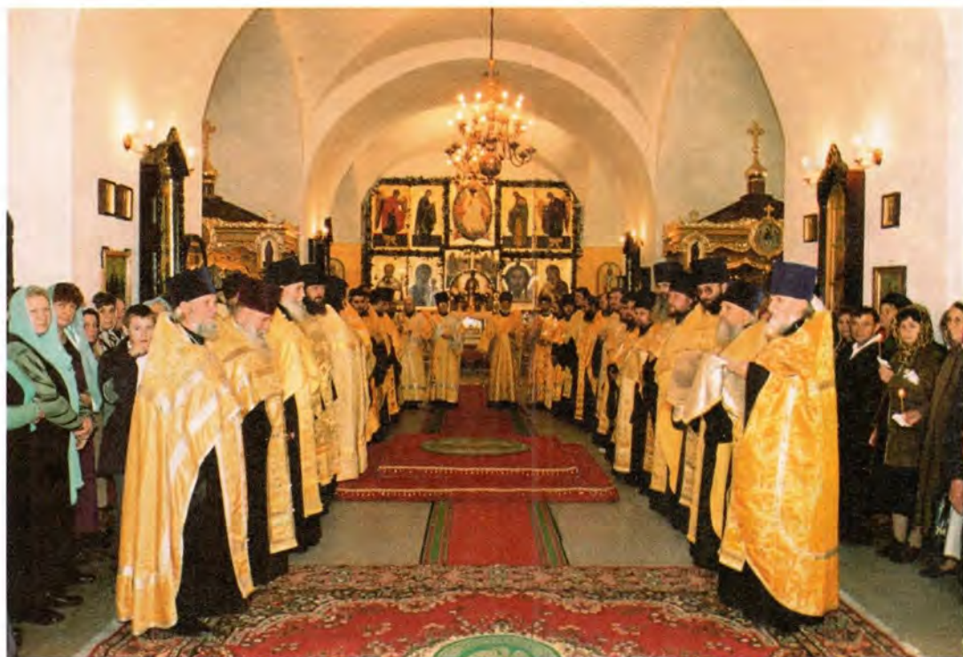
В ожидании Святейшего Патриарха. Успенский собор Астраханского кремля

увидеть произошедшие изменения», – констатировал Святейший Патриарх. Эти слова, сказанные в Успенском соборе, прозвучали глубоко символично. Ведь и сам этот древний храм пережил немало изменений, в том числе и за последние десять лет.