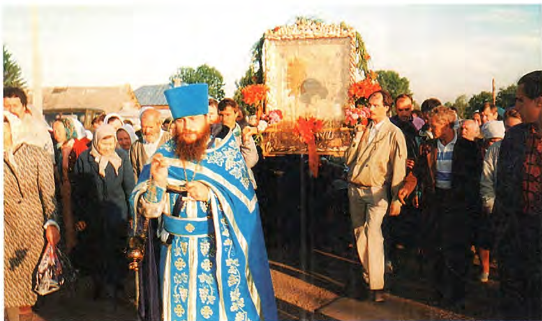
Крестный ход со списком Табынской иконы Божией Матери