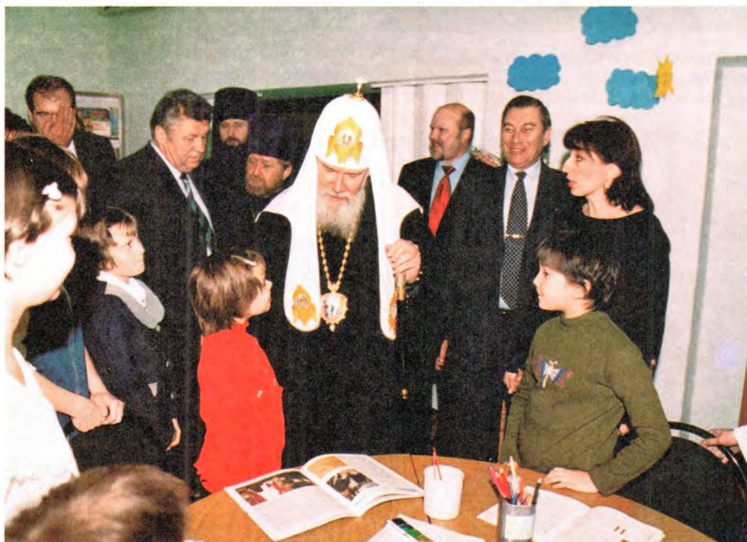
Посещение Святейшим Патриархом приюта для девочек «Улитка»