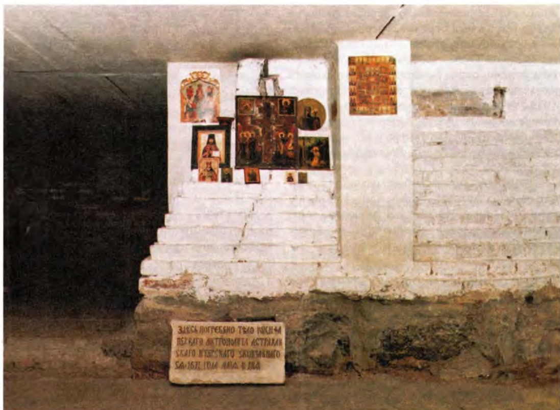
Место погребения первого митрополита Астраханского и Терского Иосифа

В воскресенье, 27 октября, Святейший Патриарх Алексей возглавил Божественную литургию в храме в честь Казанской иконы Божией Матери. Первоиерарху Русской Православной Церкви