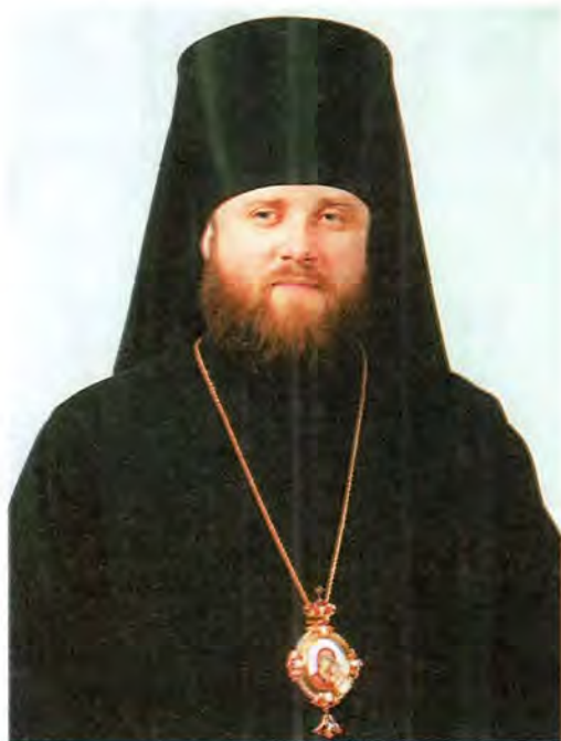
Преосвященный Иоанн, епископ Борисовский, викарий Минской епархии

Постановлением Патриарха и Священного Синода от 13 марта 2002 года архимандриту Иоанну (Хоме), секретарю Минского Епархиального управления, определено быть епископом Борисовским, викарием Минской епархии.