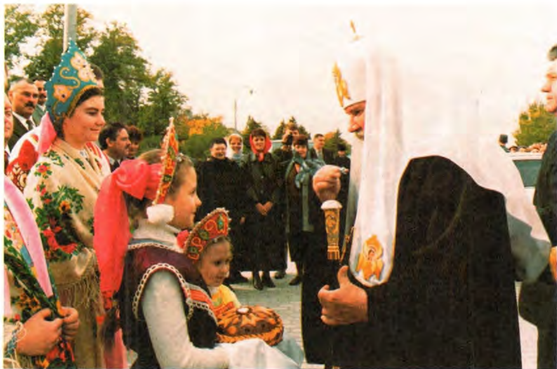
Встреча Святейшего Патриарха Московского и всея Руси Алексия в Астраханском кремле

шествво заметил, что уже на второй день после начала трагических событий в Театральном центре на Дубровке в Реабилитационном центре для родственников заложников была устроена молитвенная комната. Здесь православные священники постоянно оказывали моральную и духовную поддержку освобожденным заложникам и их близким.