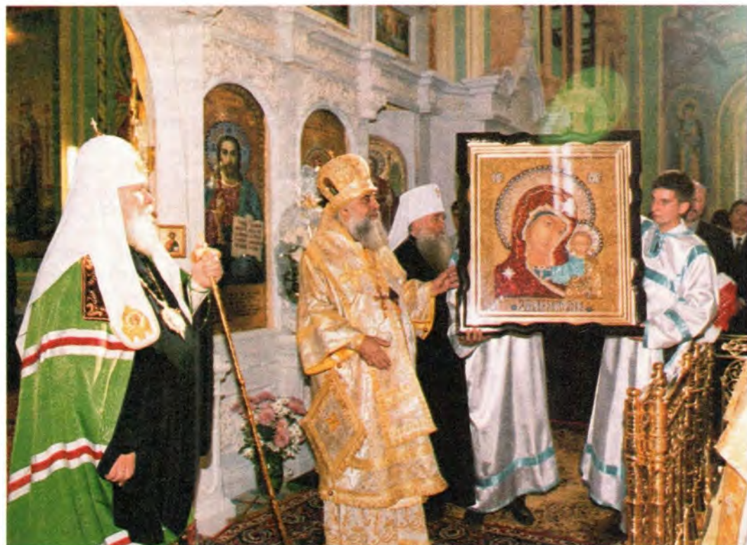
Архиепископ Астраханский и Енотаевский Иона преподносит Святейшему Патриарху Казанскую икону Божией Матери

в построение будущего Астраханской земли и России».