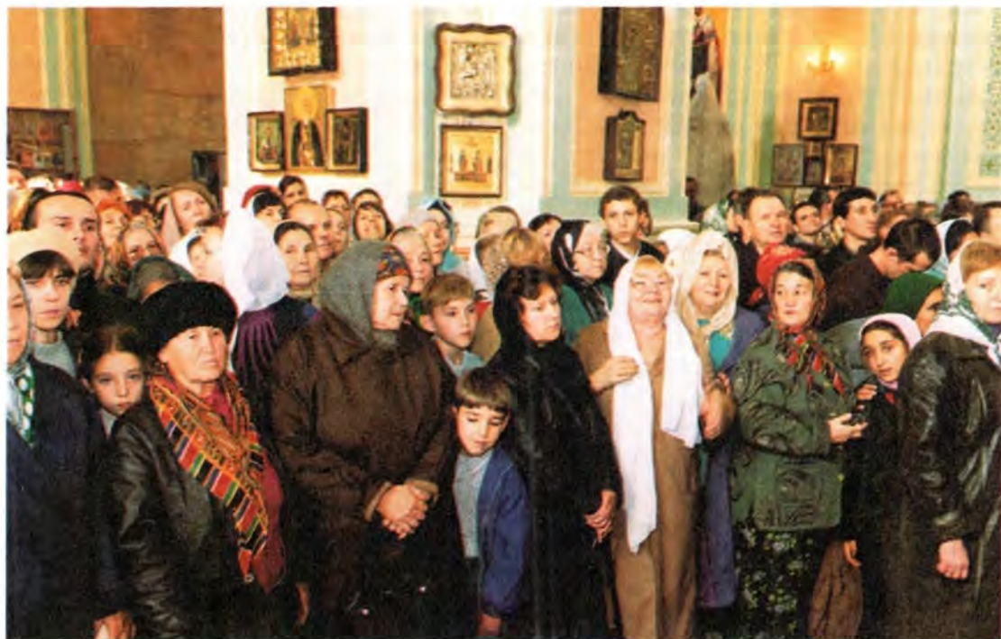
Прихожане Казанского собора

Возрождение храмов и монастырей потребовало громадных сил и средств. Большинство храмовых зданий, в том числе и причисленных к историческим памятникам, на момент передачи их верующим являло собой удручающие картины разрухи и запустения. Восстановить утраченное можно было только объединенными усилиями, всем миром. И лишь благодаря совместной работе и жертвованиям верующих, органов власти, предприятий и общественных организаций в епархии постепенно удалось наладить приходскую жизнь, осуществлять дела милосердия и образовательную деятельность. Таково продолжение четырехвекового пути астраханского Православия и наш вклад