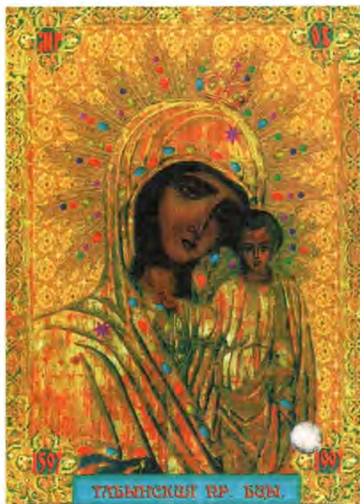
Табынская икона Пресвятой Богородицы

поры добавилась еще одно внешнее отличие: довольно значительный разруб в верхней части.