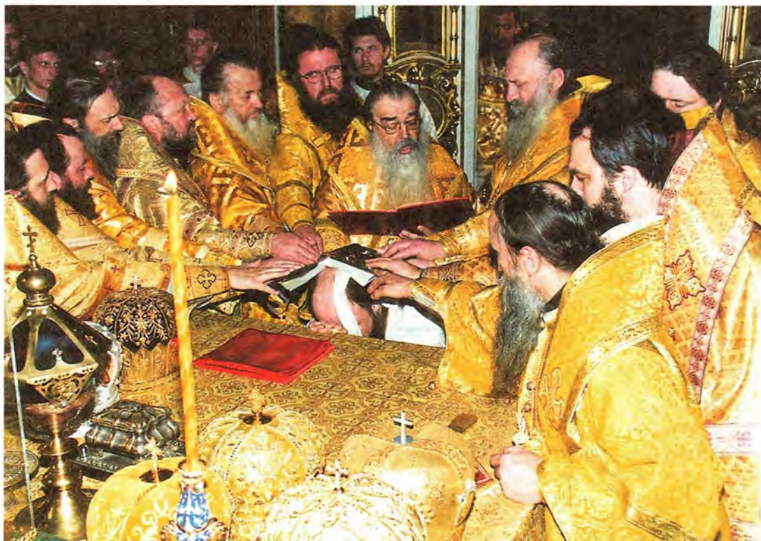
Хиротония архимандрита Иоанна

Земно кланяюсь Вам, милостивейший Владыка Филарет, и паки благодарю за то, что Вы вмещали меня в свое любве-