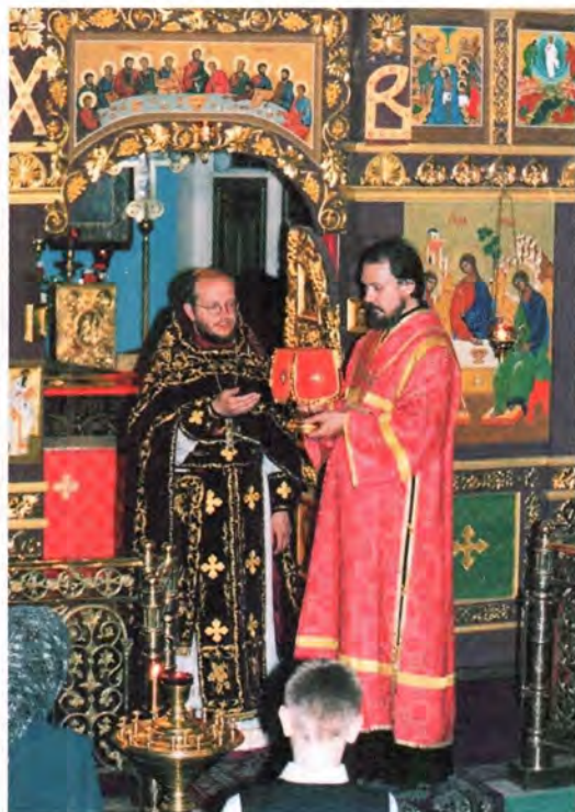
«Верую, Господи, и исповедую...» Пасха Христова, 2001 год