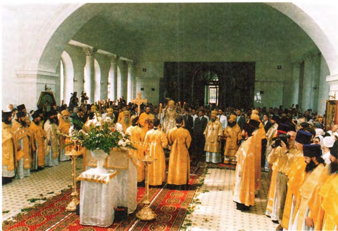
Молитва перед началом крестного хода со святыми мощами