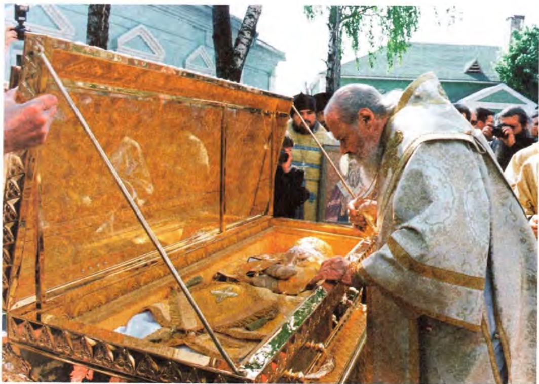
Святейший Патриарх Алексей у мощей святителя Феофана Затворника

который, как и всю обитель, придется восстанавливать и возрождать. Впереди много трудов, но сегодня совершилось самое важное: великий подвижник вышенский вернулся своими святыми мощами в ту обитель, которую он возлюбил, где он нес свое служение где закончил свой жизненный путь. Ныне, через 28 лет, он вернулся в Свято-Успенскую Вышенскую обитель, и мы верим, что его молитвы помогут возрождению этого святого места...»