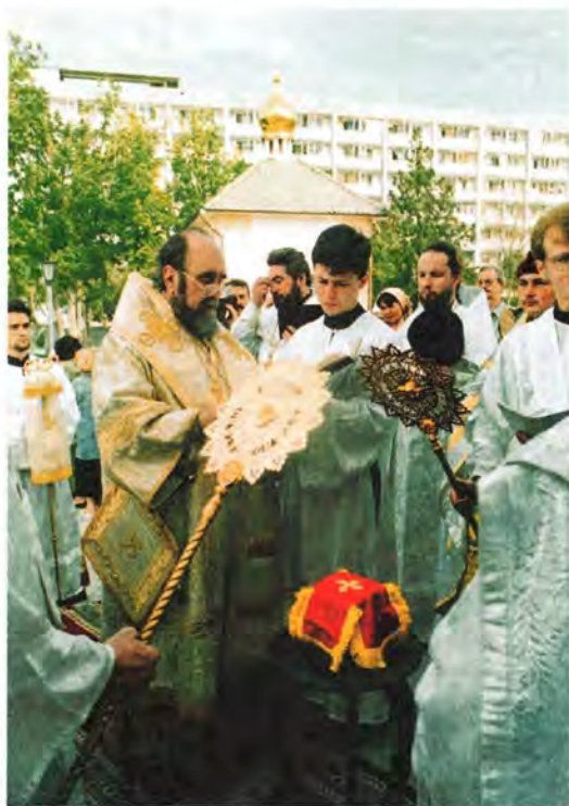
Чтение молитвы перед внесением святых мошей в храм