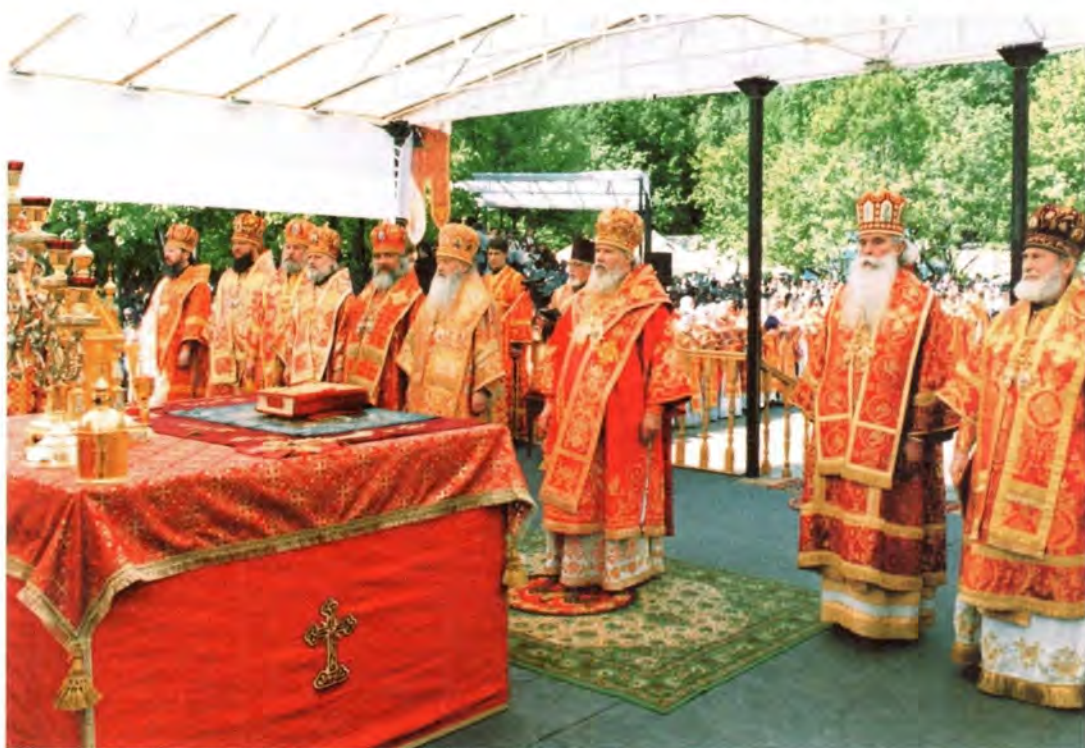
За Божественной литургией в Бутове. 1 июня 2002 года

Накануне вечером Святейший Патриарх Алексий совершил всенощное бдение и в самый день праздника –