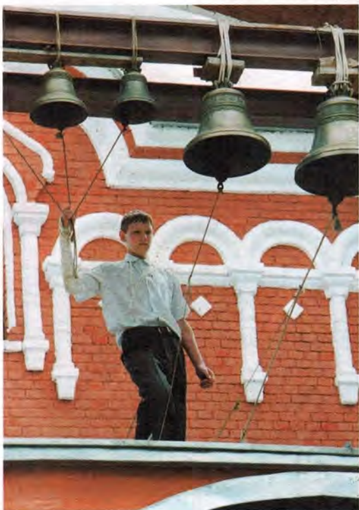
Юный звонарь Троицкого храма

новительных работах. Без помощи этих добрых людей невозможно было бы ничего сделать.