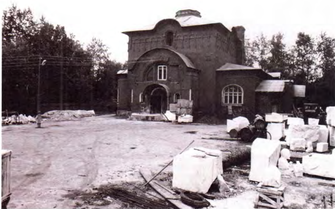
Церковь Святой Троицы. 1990 год

22 июня 1909 года было получено благословение на строительство храма во имя Святой Троицы с приделом Святителя и Чудотворца Николая. Строительство было завершено в декабре 1910 года. Храм, построенный в русском стиле, характерном для начала двадцатого века, отличался красотой и своеобразием. 8 сентября 1911 года великое освящение храма совершил епископ Дмитровский (впоследствии митрополит) Трифон (Туркестанов).