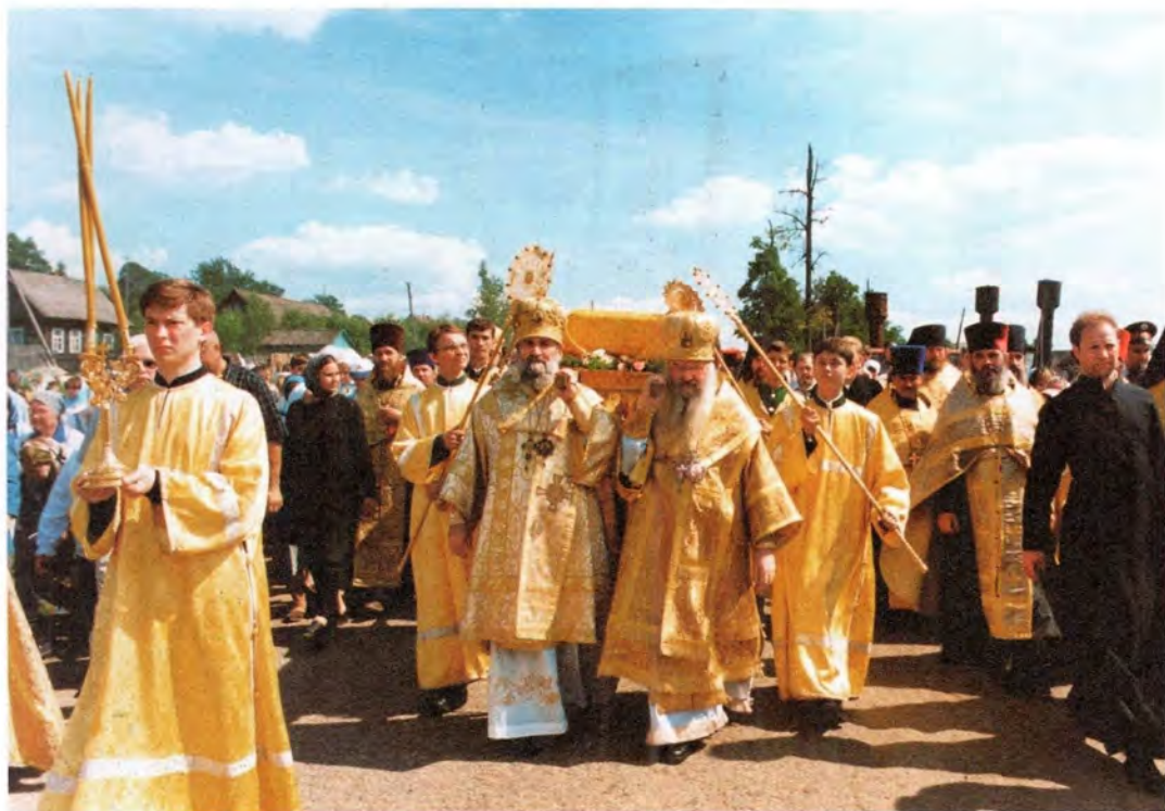
Крестный ход из села Эммануиловка в Вышенский монастырь