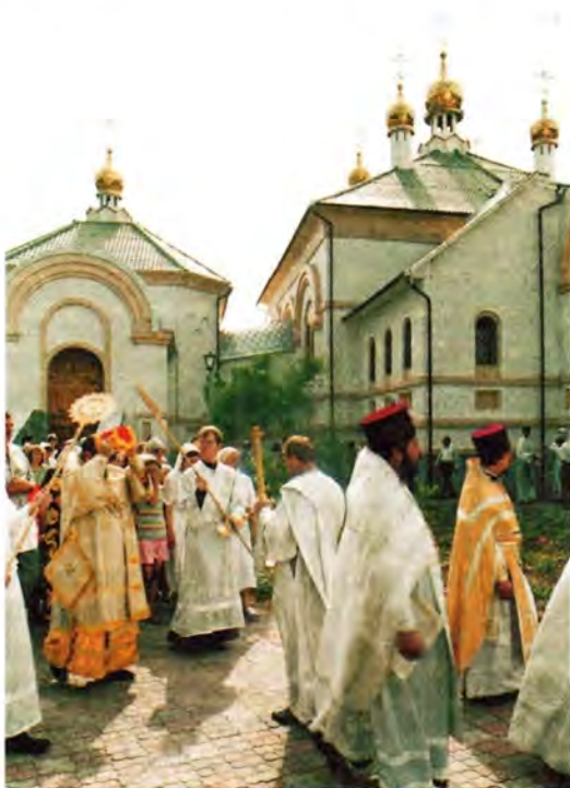
Крестный ход со святыми мощами