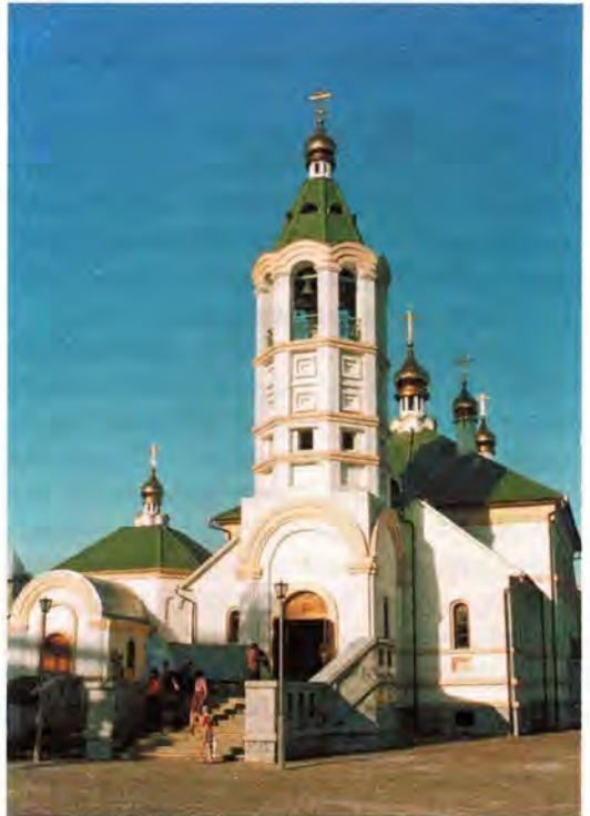
Храм Преподобного Сергия Радонежского в городе Навои

Золочение резьбы иконостаса и царских врат выполнили мастера-позолотчики из Ташкента («Медиана-Рос»), сложнейшую кровлю алтарной абсиды, над переходами между крестильней и храмом, а также полусферическую кровлю над всеми входами – мастера из Академии художеств Узбекистана, мраморные ограждения балконов, входные лестницы, полы, оконные и дверные блоки – мастера Центра международных связей «Хамар» (при Академии художеств Республики),