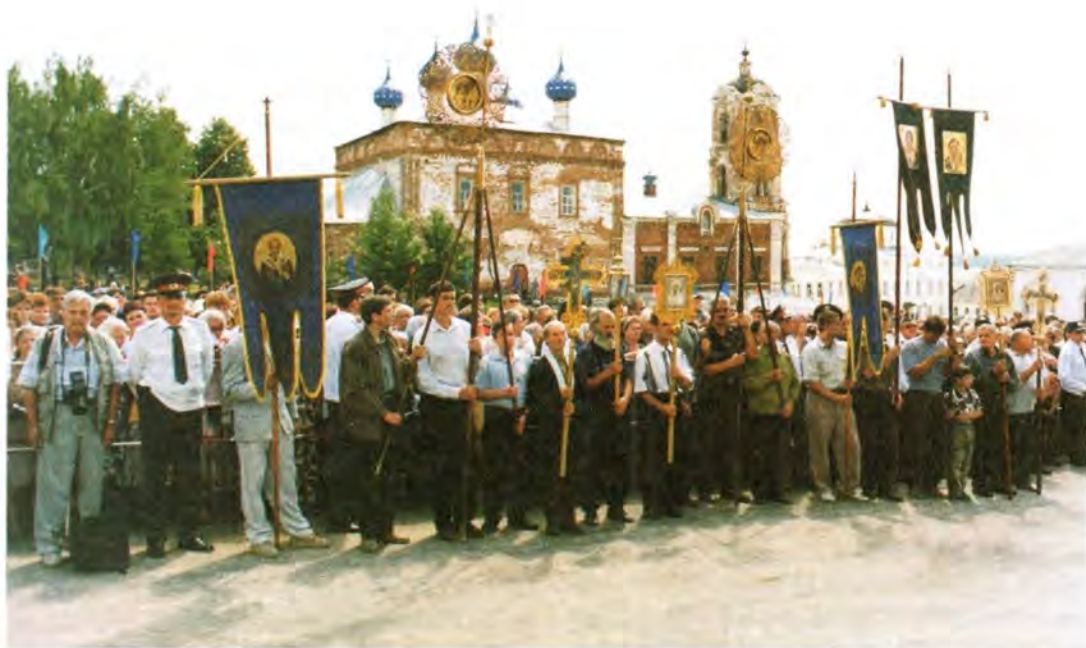
Православные касимовцы – участники крестного хода

В Касимове создана и первая православная школа. Это произошло год назад. Школа эта негосударственная, подход к обучению детей православный,