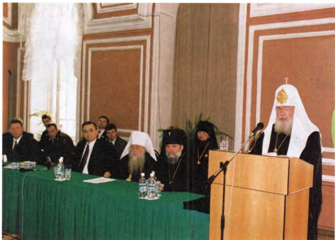
Выступление Святейшего Патриарха Алексия в Рязанском педагогическом университете

всем миром – на него не было затрачено ни копейки бюджетных денег. Святейший Владыка осмотрел новостроенный храм и отметил, что он так же, как домовый храм Московского государственного университета, посвящен мученице Татиане, которая считается покровительницей студенчества.