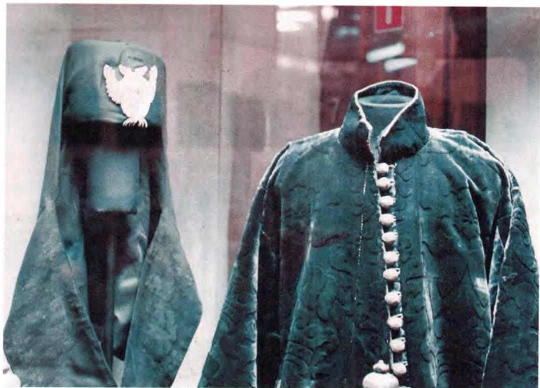
Экспонаты выставки – монашеский кlobук и домашняя ряса Патриарха Никона

Воскресенском Новоиерусалимском монастыре, где Первосвятитель безвыездно прожил восемь лет после оставления им патриаршего престола.