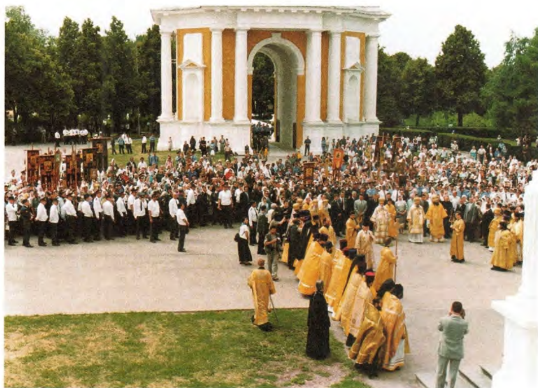
Молебен святителю Василию Рязанскому в кремле