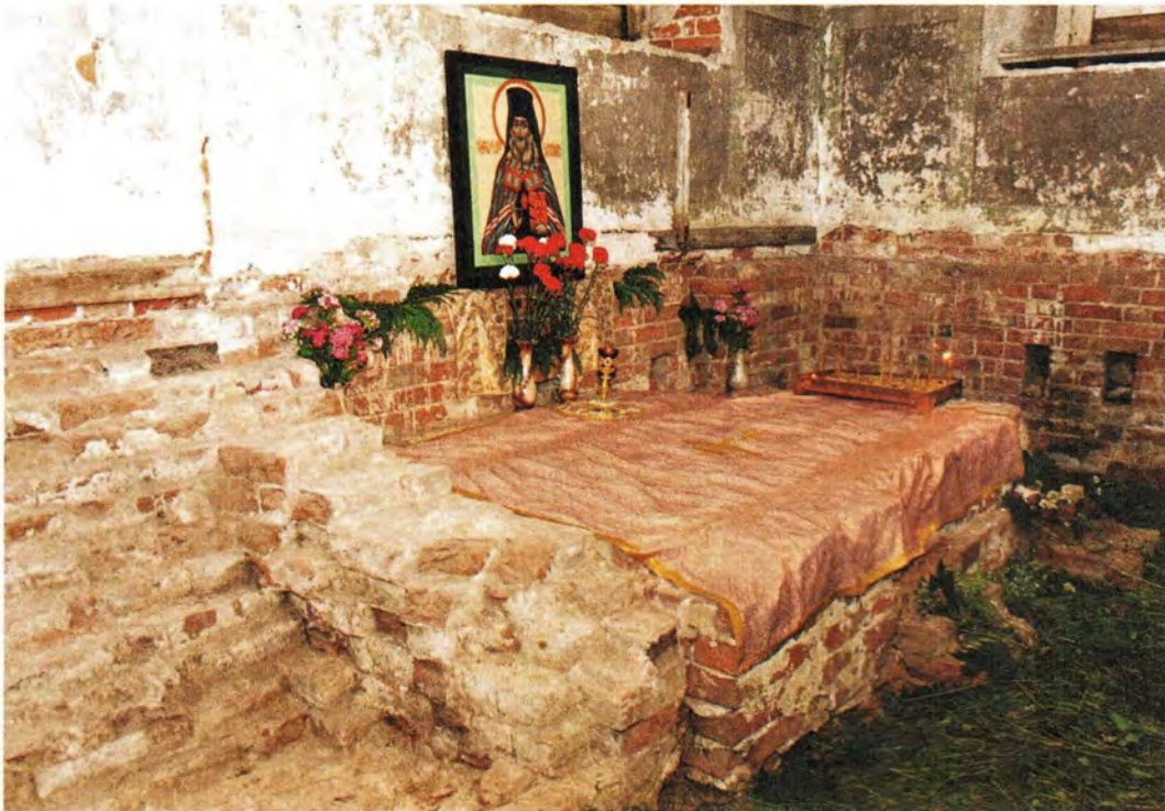
Место в Казанском соборе, где почивали честные мощи святителя Феофана