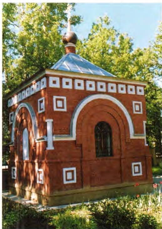
Часовня во имя блаженной Матроны Московской

В настоящее время храм полностью восстановлен. Установлены дубовые