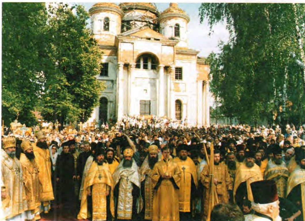
Во время молебна святителю Феофану в Вышенском монастыре

«Сегодня совершилось возвращение святых мощей великого подвижника земли нашей – святителя Феофана, Затворника Вышенского, в обитель, где в течение шести лет он нес труды по ее управлению, а затем 22 года пребывал в затворе, руководя оттуда многими и многими духовными чадами своими. Эту обитель постигла судьба многих обителей земли нашей – разорение и опустошение. С болью взираем мы сегодня на Казанский соборный храм,