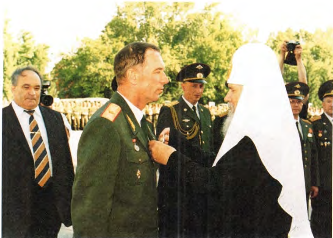
Награждение военачальников, потрудившихся для восстановления храма

кафедру и получил разрешение удалиться в Вышенскую пустынь. В своем прошении, направленном в Святейший Синод, епископ Феофан писал: «Я ишу покоя, только чтобы покойнее предаться занятиям желаемым... Имею мысли служить Церкви Божией, только иным образом служить». С того времени и до своей кончины в 1894 году святитель пребывал в любимой обители, занимаясь в уединении чтением, перепиской со своими духовными чадами, создавая творения, которые стали руководством в духовной жизни для многих и многих тысяч людей. Он был похоронен в Казанском соборе Вышенского монастыря.