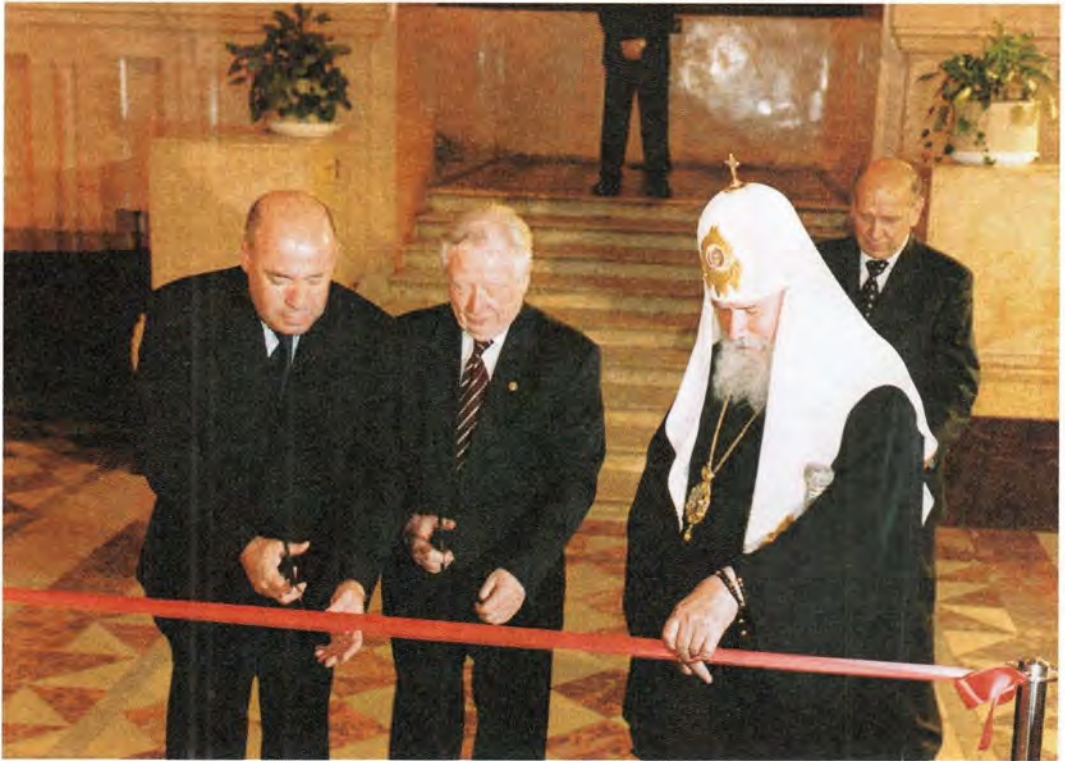
Торжественное открытие выставки