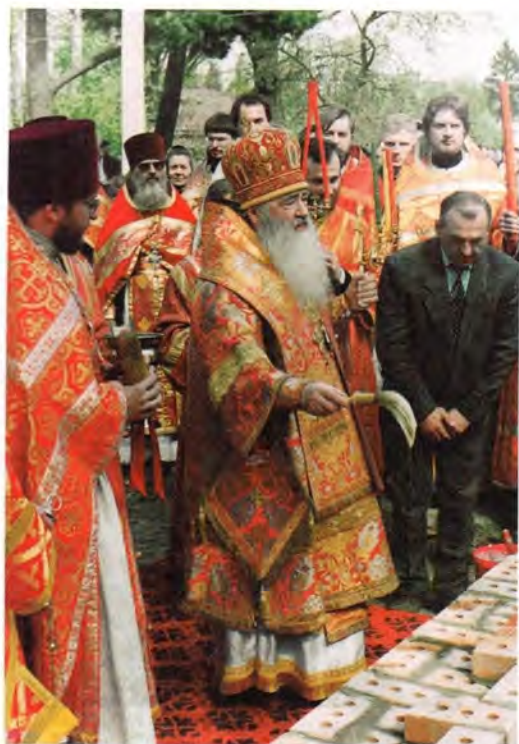
Освящение митрополитом Крутицким и Коломенским Ювеналием закладного камня в основание часовни блаженной Матроны Московской при Троицком храме в городе Сходня. 2 мая 2000 года

Приближался великий христианский юбилей – 2000-летие Рождества Христова, и мы старались завершить восстановление храма к этой дате. Удалось многое: были полностью по старым фотографиям восстановлены купола и звонница, установлены пять колоколов, пожертвованных местными жителями, поставлены иконостасы в обоих приделах, храм был полностью покрашен, к нему был проведен магистральный газ, оборудована котельная.