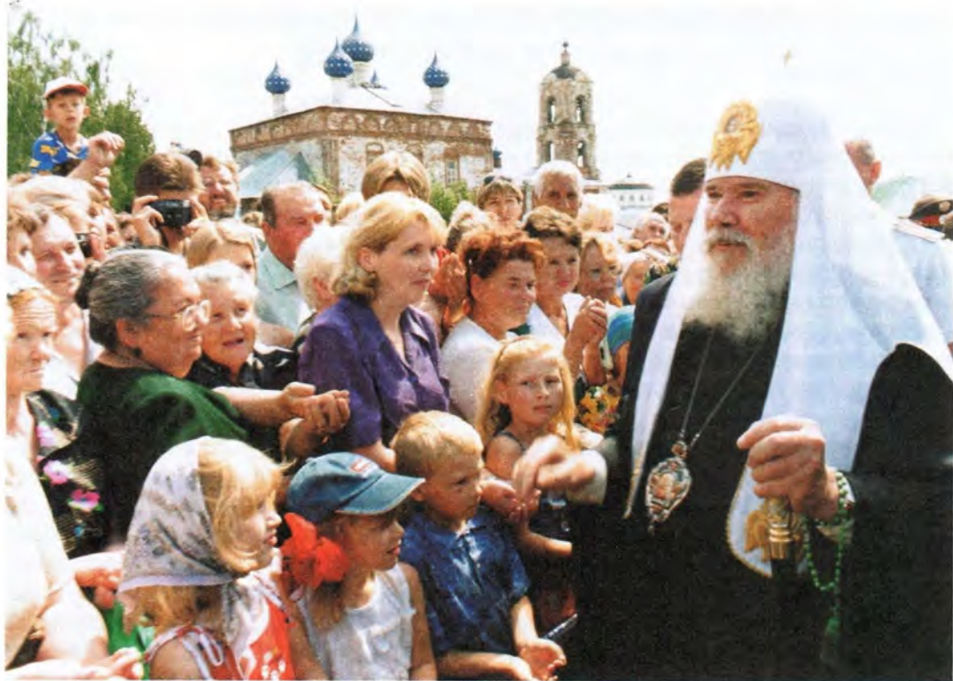
Благословение Предстоятеля Русской Православной Церкви