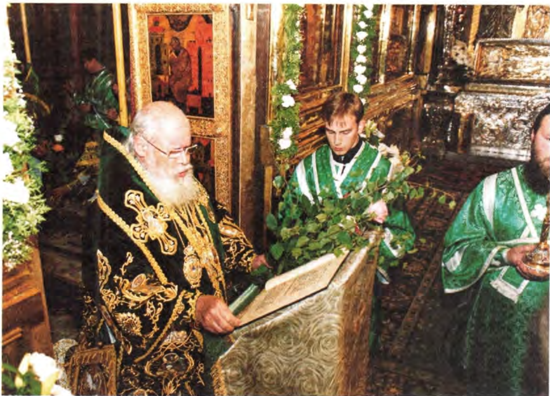
Праздник Святой Троицы. Троицкий собор Троице-Сергиевой Лавры