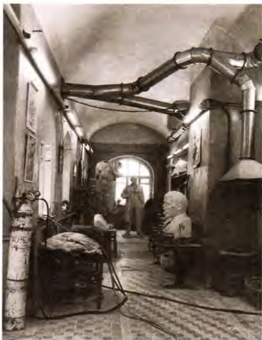
Интерьер западного притвора. 1990 год

В 1936 году храм Святой Троицы постигла участь многих и многих православных церквей – он был закрыт и разорен. Обезглавленный дом Божий подвергся поруганию: в здании церкви была устроена скульптурная мастерская и его заполнили фигуры «ильичей» и тому подобное.