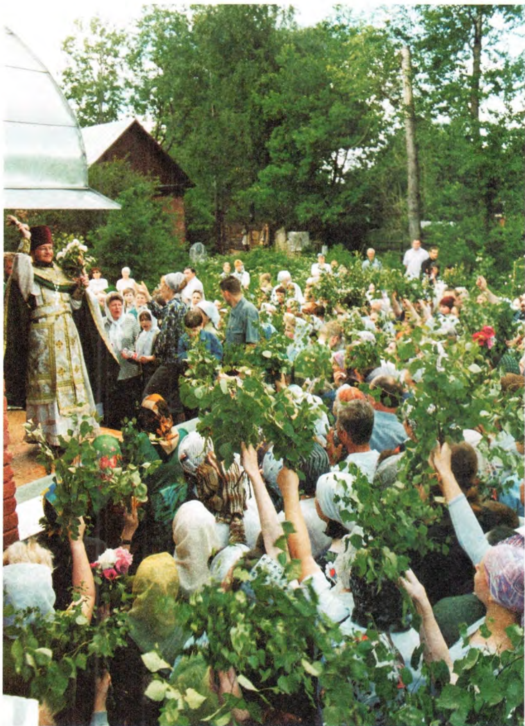
Праздник Святой Троицы. 2002 год