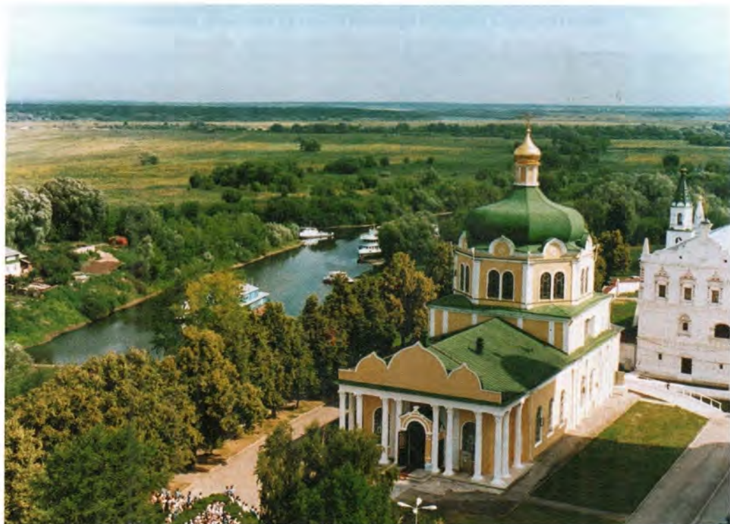
Собор в честь Рождества Христова в Рязанском кремле

В тот же день Предстоятель Русской Православной Церкви посетил старейшее учебное заведение Рязани – педагогический государственный университет имени Сергея Есенина. Здание, в котором размещается вуз, – одно из