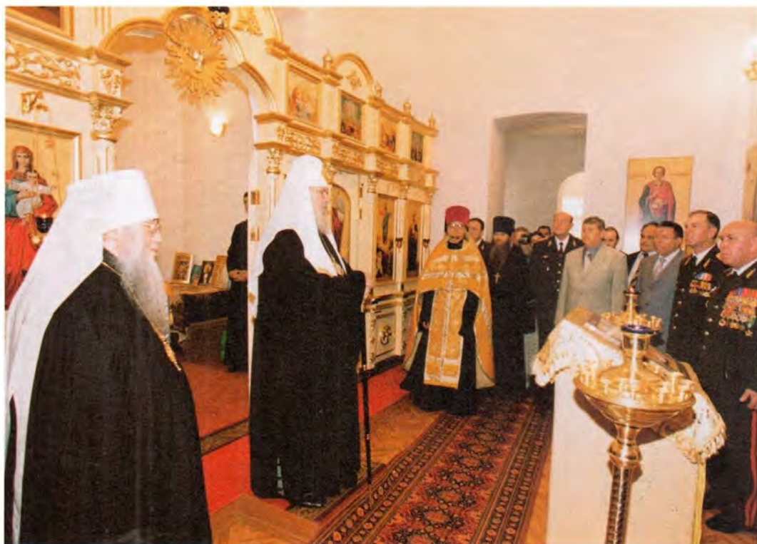
В храме Воскресения Христова в Рязанском военном автомобильном институте

Во время Первой мировой войны здесь находился храм 138-го Болховского полка 35-й пехотной дивизии. Здание церкви сохранилось и в советское время использовалось для библиотеки располагавшегося здесь военного училища. Пока под храм отдана бывшая алтарная часть полковой церкви, но в недалеком будущем планируется вернуть все помещение.