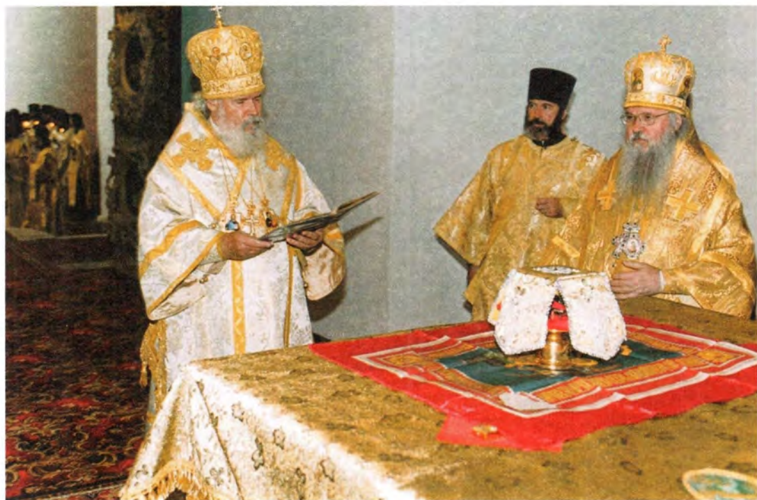
За Божественной литургией в Христорождественском соборе