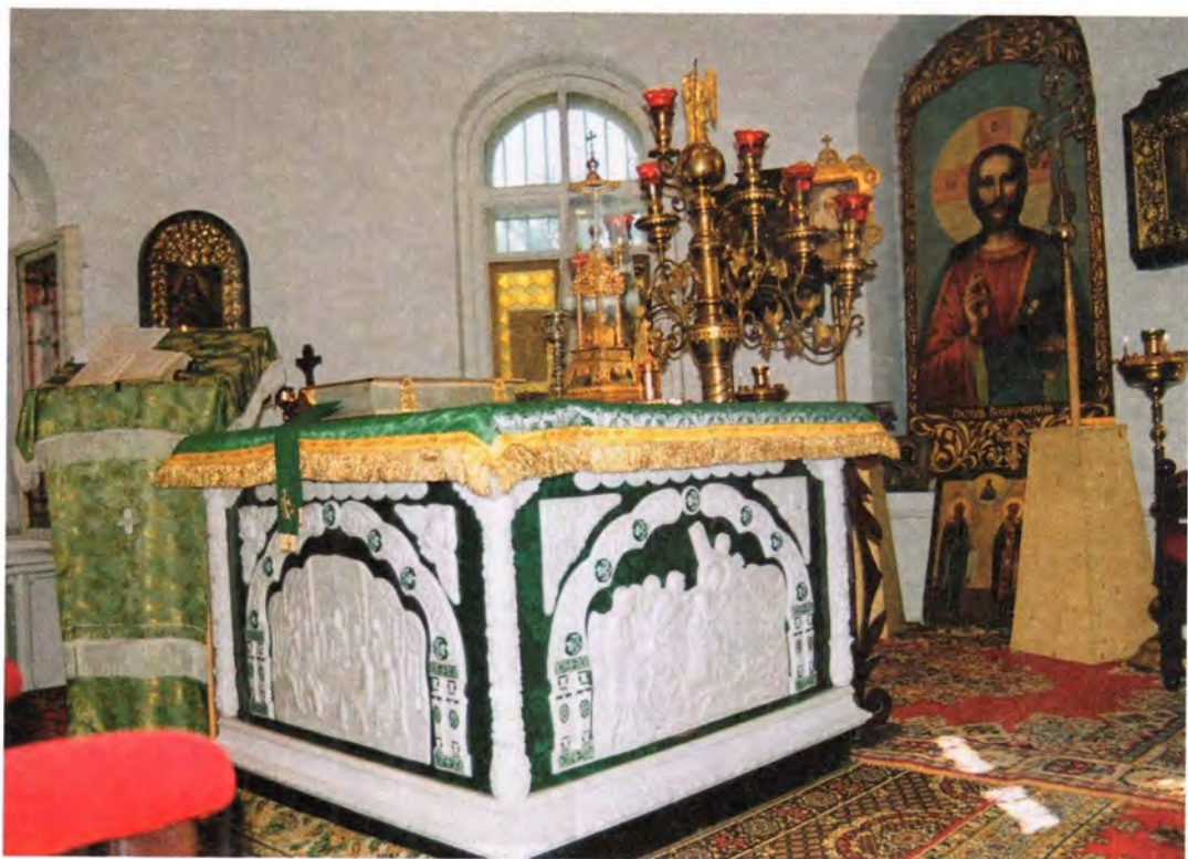
Главный алтарь Троицкого храма