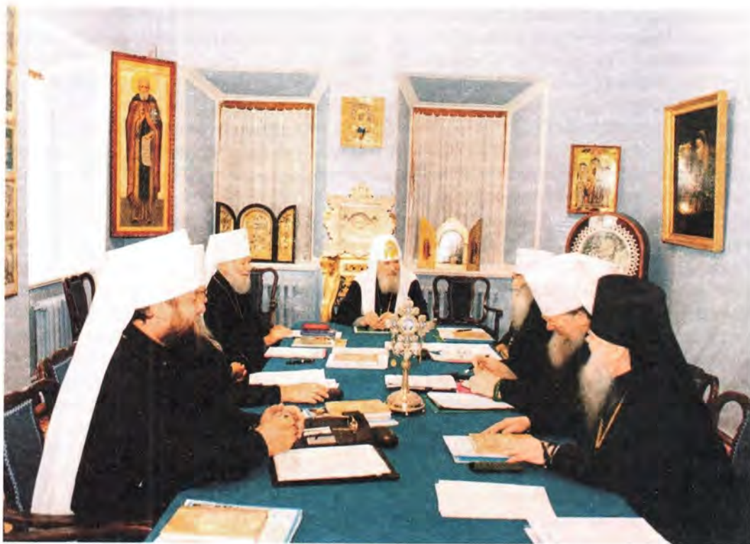
Заседание Священного Синода Русской Православной Церкви. 17 июля 2002 года

Украинской Православной Церкви и избрания на Предстоятельское служение Блаженнейшего митрополита Киевского и всея Украины Владимира. Митрополит Владимир был избран на Киевскую кафедру вместо ушедшего в раскол бывшего митрополита Филарета (Денисенко).