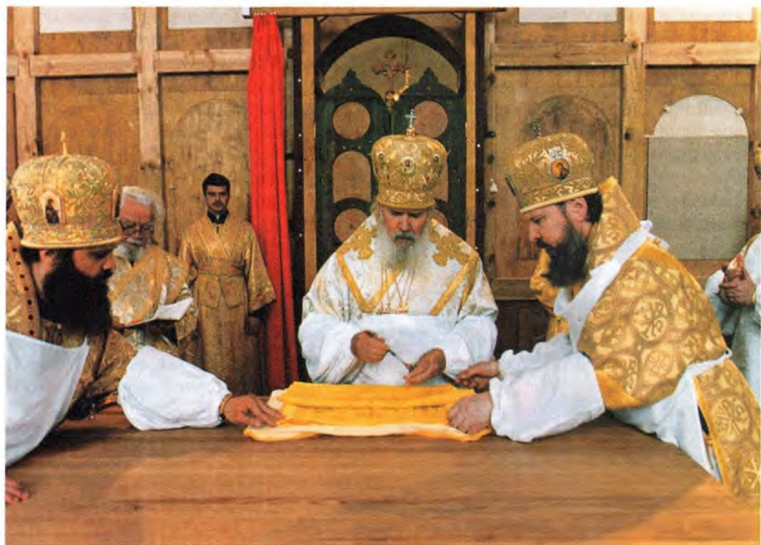
Во время освящения престола Вознесенского собора в Касимове

храма Святейшим Патриархом в сослужении тех же Преосвященных архипастырей была совершена Божественная литургия. Затем Святейший Владыка совершил молебен на Соборной площади Касимова и обратился к своей пастве со Словом, в котором, в частности, отметил: «Сегодня для Касимова особый день. Только что нами был освящен Вознесенский собор, всего лишь несколько месяцев назад возвращенный Церкви. Однако за эти несколько месяцев удалось вернуть этому храму его благолепие и ныне, в преддверии 850-летия города, освятить его. Я поздравляю всех жителей Касимова с грядущим юбилеем. Возрождение храма Вознесения Господня – это восстановление исторической справедливости на Касимовской земле. Ныне мы видим здесь не спортивный зал, а храм Божий, где будут возноситься молитвы о Рязан-