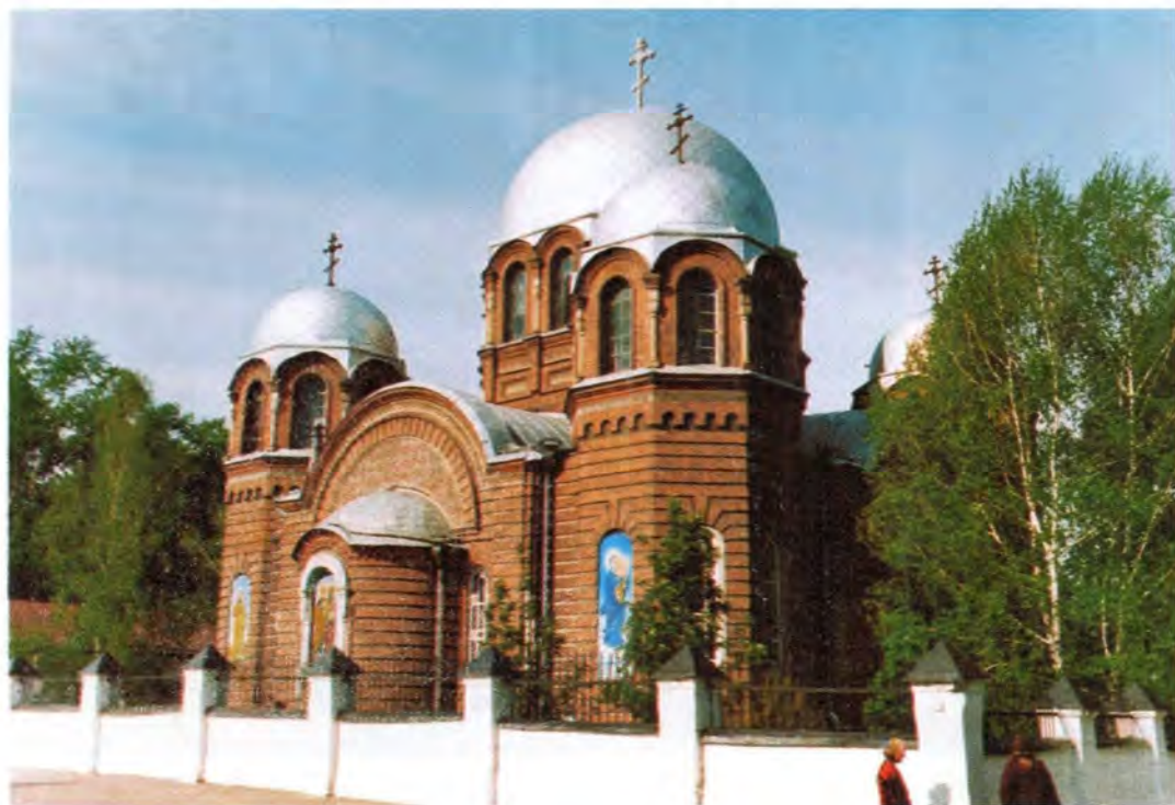
Петропавловский кафедральный собор Томска