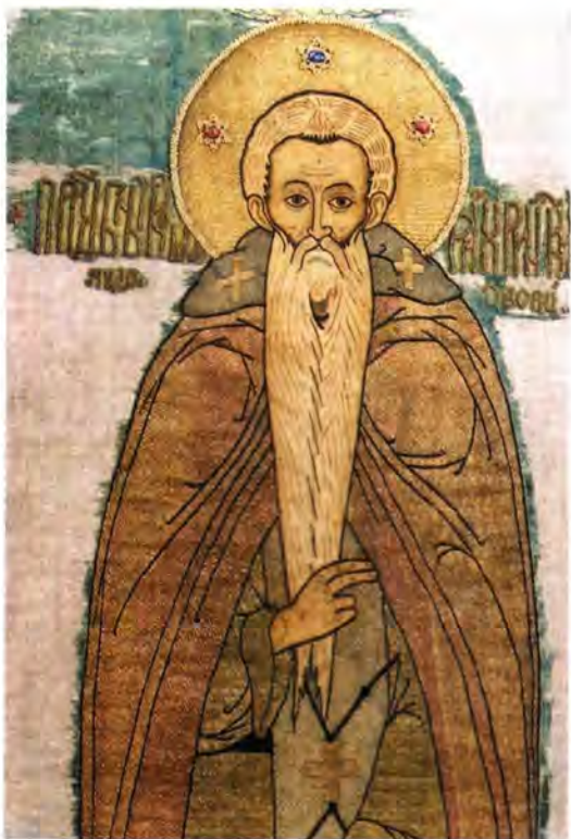
Покров преподобного Космы Яхренского Конец XVI века Владими́ро-Сузда́льский музей

Когда монастырь был закрыт, монахи изгнаны и рассеяны, простые