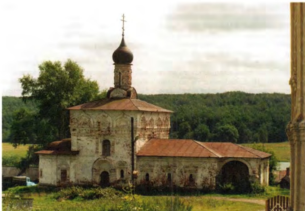
Успенский собор Яхренского Космина монастыря. Середина XVII века

В течение нескольких столетий обитель Космы Яхренского была центром духовной и хозяйственной жизни большой округи. На монастырские праздники – в девятую пятницу по Пасхе (в память явления преподобному Косме иконы Успения), 14/27 октября (в день празднования явленной Яхромской иконы Божией Матери) и 18 февраля/3 марта (память блаженной кончины и погребения преподобного Космы) – в монастырь стекались многочисленные благочестивые посетители. За монастырскими стенами, на площади устраивались многолюдные ярмарки, приуроченные к этим праздникам. Обитель влекла к себе паломников святым гробом преподобного Космы, от которого происходили исцеления с верою к нему приходящим, чтимыми святынями, а также небогатым, но благолепным уютом и молитвенной тишиной ее храмов, весной утопавших в нежном