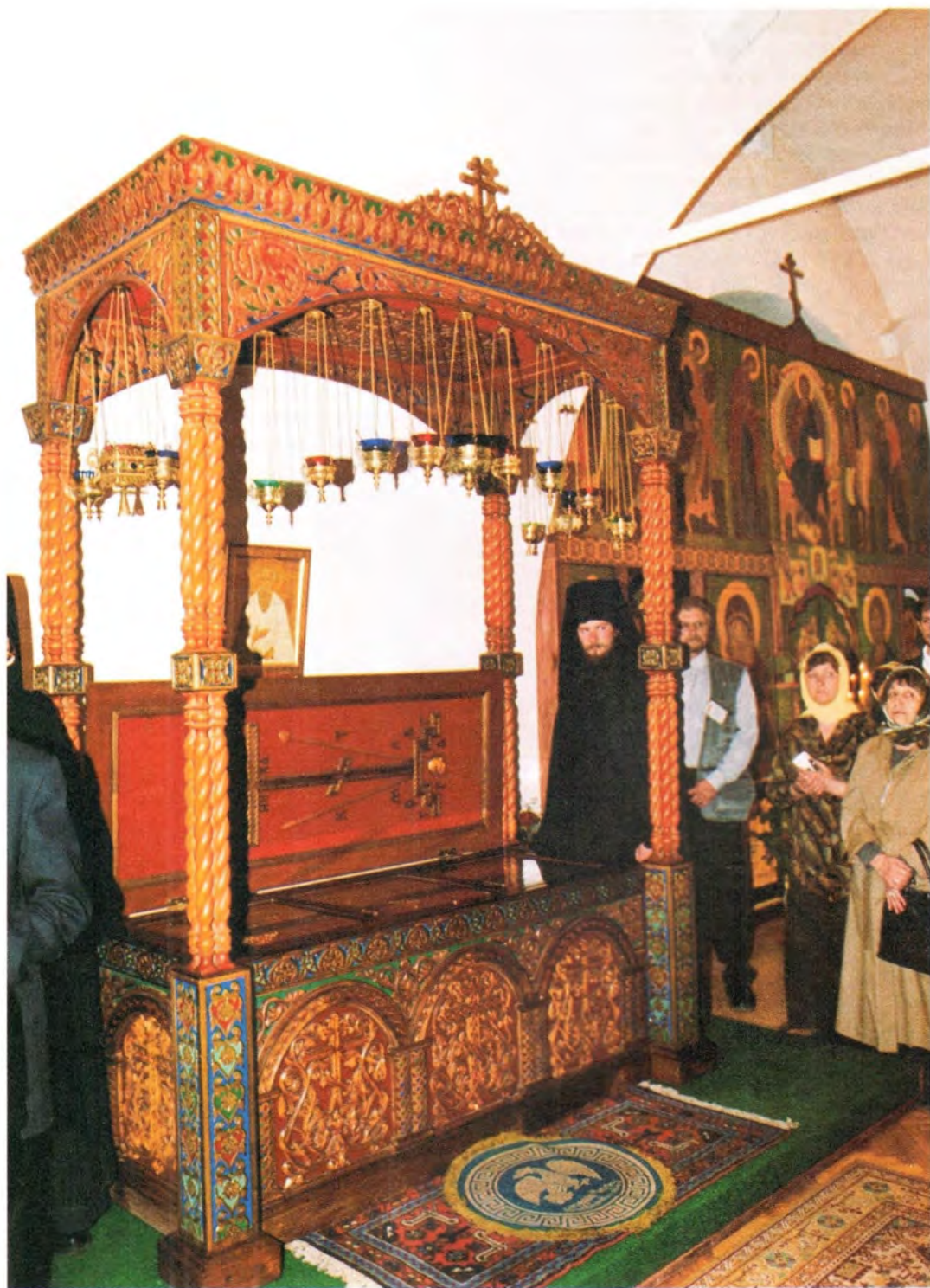
Рака с мощами святого праведного Феодора Томского