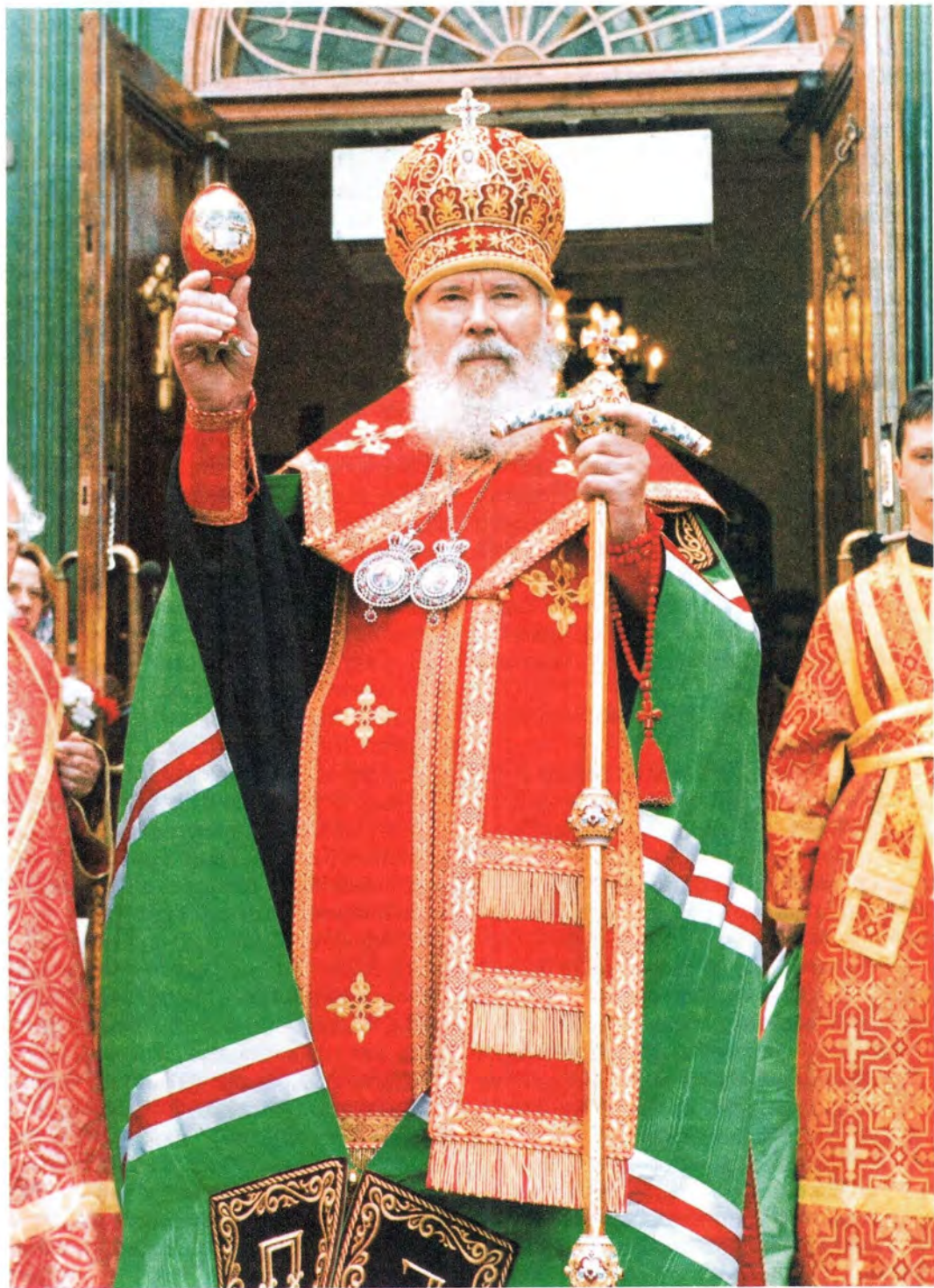
Возле Иверской часовни в Москве. Вторник Светлой седмицы