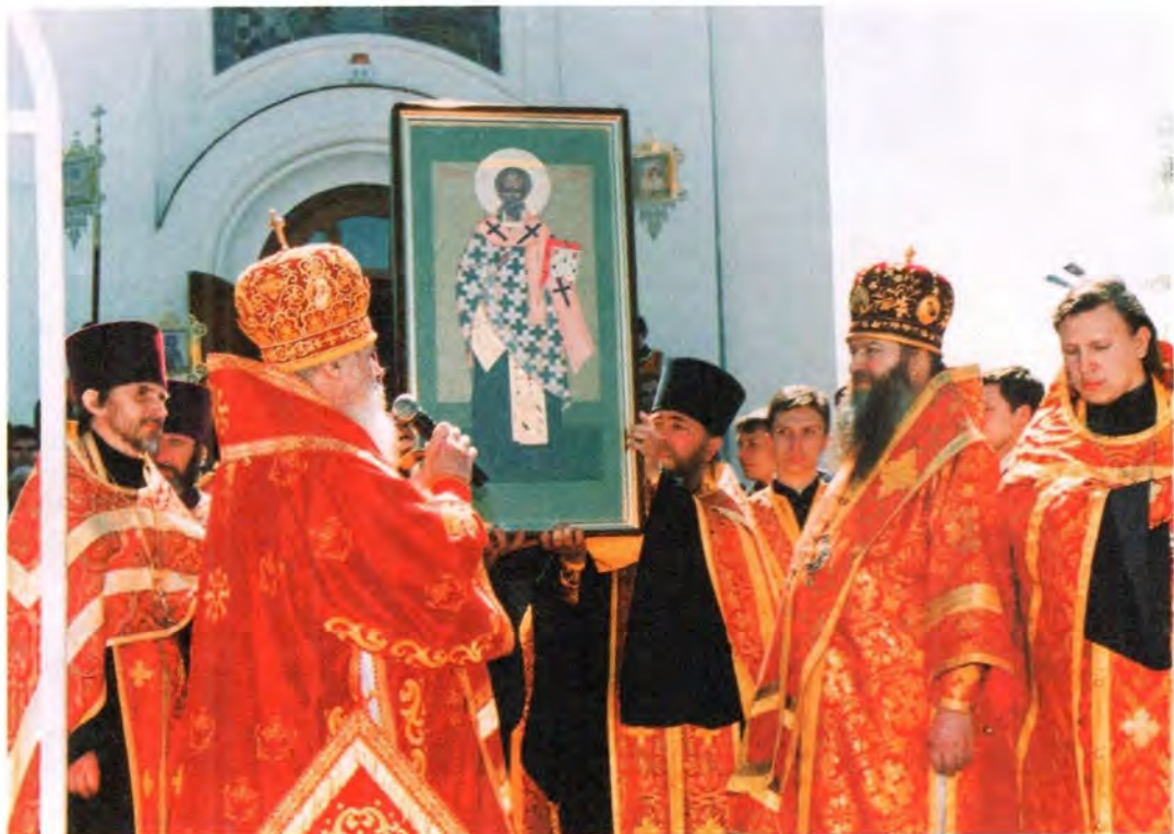
Дар Святейшего Патриарха – икона Святителя и Чудотворца Николая

День славянской письменности и культуры – это прежде всего православный праздник – во славу святых Кирилла и Мефодия, праздник в честь созданной ими славянской азбуки и письменности, праздник славянской школы и науки. Именно благодаря созданию славянской письменности стало возможным просвещение славян. Это великий праздник всей славянской культуры.