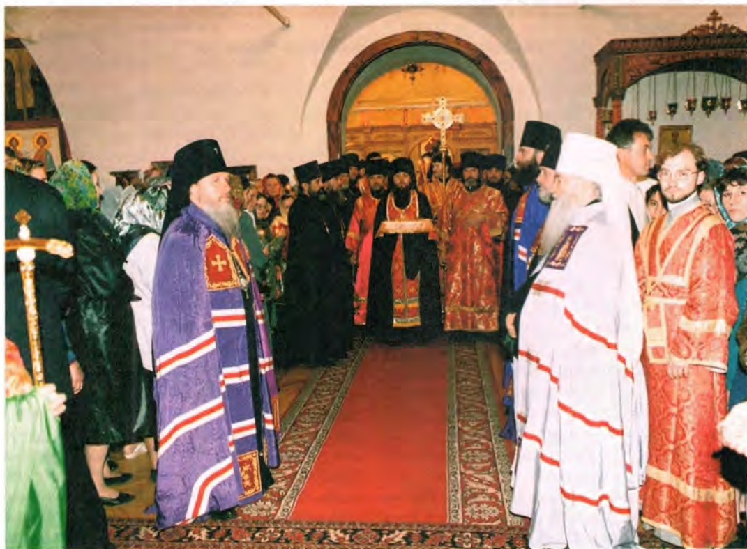
Торжественная встреча Святейшего Патриарха в Богородице-Алексиевском монастыре

В том же году начали строить новую церковь, но и она, будучи выстроена в 1760 году, сгорела в 1779 году. После этого решили строить каменный храм. В 1789 году была освящена новая каменная трехпридельная церковь с колокольней. Главный придел освящен в честь явления иконы Божией Матери во граде Казани. Южный придел – во имя преподобного Алексия, человека Божия (построен в 1779 году), а северный придел – во имя святых мучеников Флора и Лавра. Монастырь был обнесен кирпичной оградой с четырьмя башнями по углам. С учреждением Томской епархии местопребыванием епископа стал служить монастырь. После приобретения нового архиерейского дома в прежних архиерейских помещениях разместилась Духовная семинария, действовавшая на территории монастыря с 1884 по 1899 год.