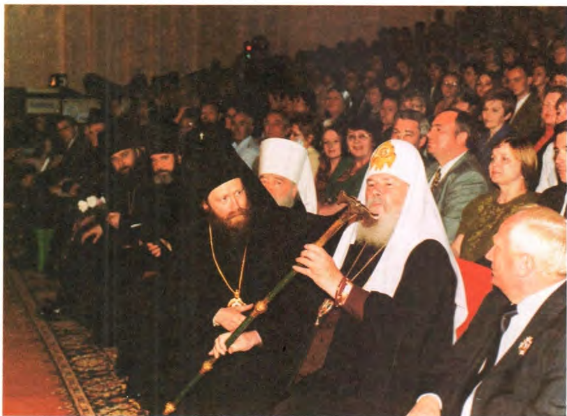
Святейший Патриарх Алексий рассматривает возвращенный Церкви посох святителя Феодосия Черниговского

Патриарх пожелал епископу Томскому, чтобы посох святителя Феодосия Черниговского – символ архипастырской власти Томских архиереев – укреплял его в архиерейском служении.