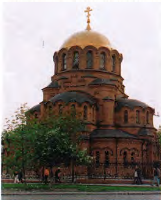
Собор Александра Невского в Новосибирске

В XX веке Сибирь стала местом великого исповеднического подвига и местом мученической кончины сонма новомучеников и исповедников Российских, многие из которых были причислены к лику святых на Юбилейном Архиерейском Соборе Русской Православной Церкви в августе 2000 года, когда весь христианский мир праздновал 2000-летие Рождества Христова. Эти угодники Божии, по существу, явились продолжателями миссионерской деятельности отечественных благовестников предшествующих времен. Свидетельство словом они подкрепляли примером христианской жизни во Христе и мученической смертью за Господа. Они стали солью земли (Мф. 5, 13) и светом