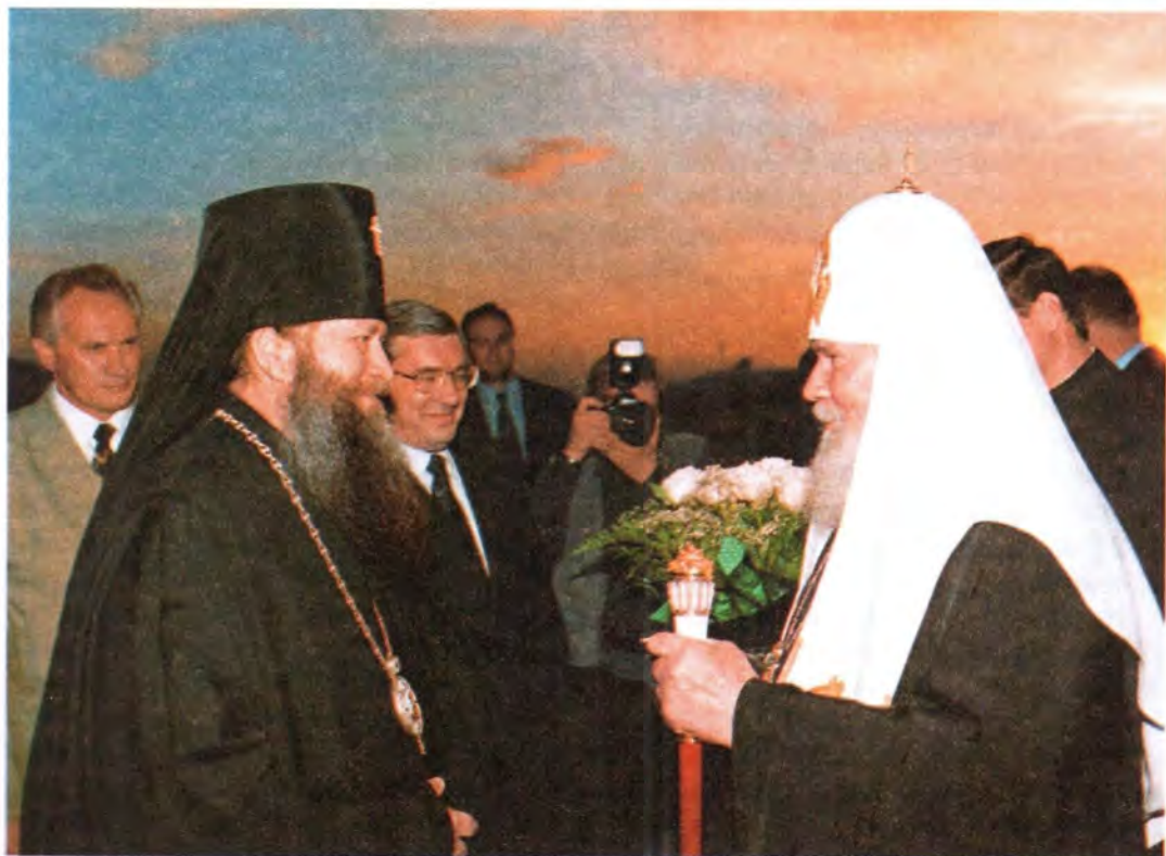
Святейшего Патриарха приветствует архиепископ Новосибирский и Бердский Тихон

В 1986 году в Мурманске любителями родной старины был организован праздник: День славянской письменности и культуры. В 1987 году эстафету этого праздника приняла Вологда, а в