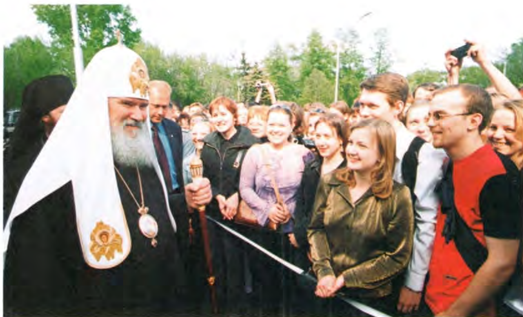
Встреча со студентами

личности». Он также поблагодарил за присвоение ему звания Почетного профессора Томского политехнического университета и награждение золотой медалью этого высшего учебного заведения.