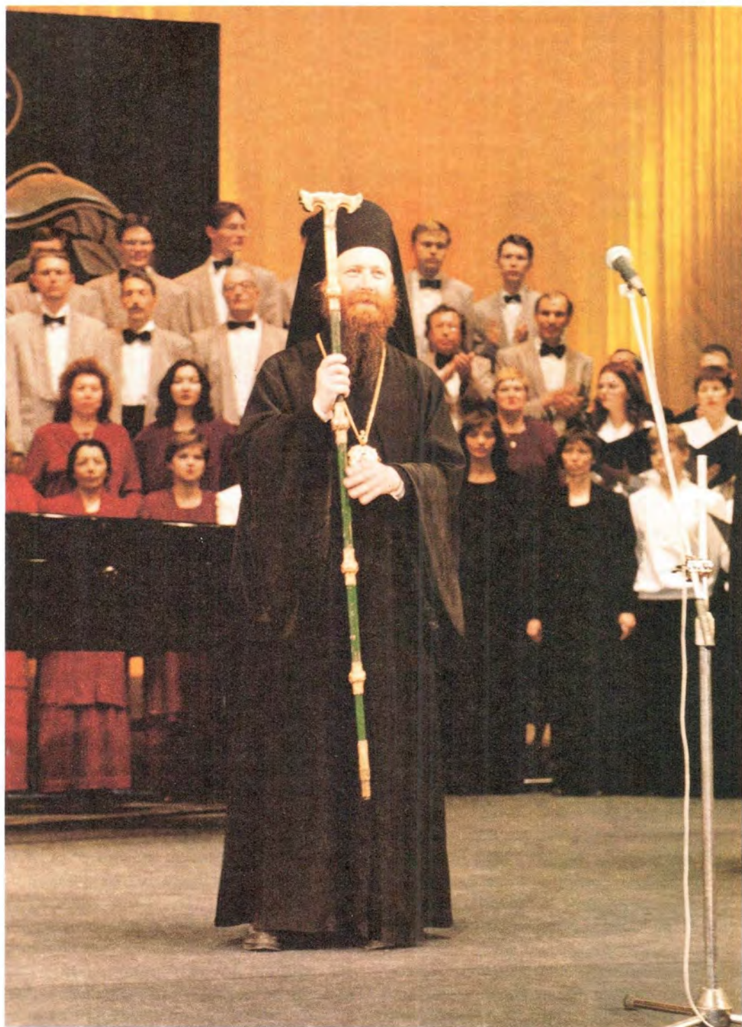
Епископ Томский и Асиновский Ростислав с посохом святителя Феодосия Черниговского