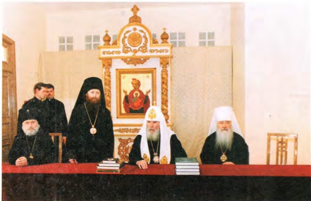
В новом здании Томской Духовной семинарии

(также недавно восстановленного) в часовню, и Святейший Патриарх совершил торжественный молебен на площади в честь этого радостного события.