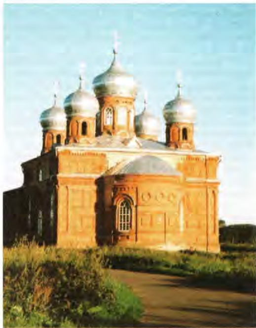
Храм Вознесения Господня в селе Старая Степановка

Еще одна святыня этих мест – чудотворный источник в соседнем селе Тёпловка. Особенно много чудес и исцелений на этом источнике произошло в тяжелые 50–60-е годы XX столетия. На источнике являлись иконы и святые кресты, вода вспыхивала огнем от