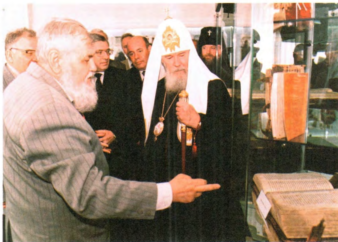
Академик Н. Н. Покровский показывает Его Святейшеству книжные раритеты