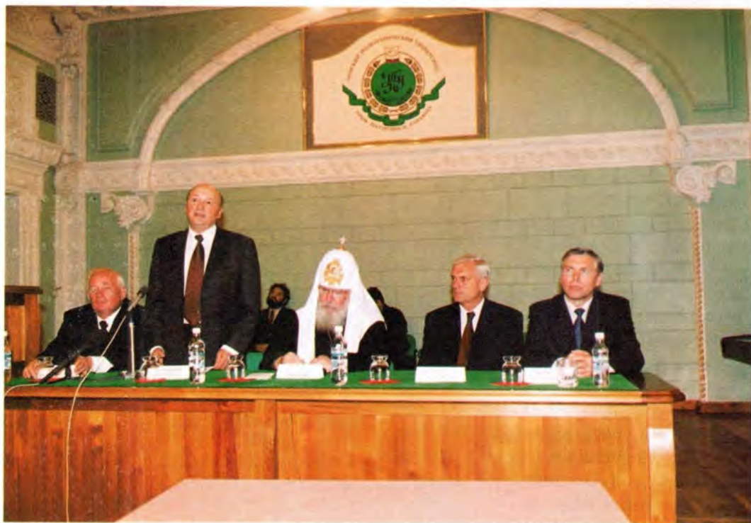
В Томском политехническом университете

В Томском государственном политехническом университете Святейшего Владыку также ждал теплый прием. Вновь, через одиннадцать лет, Его Святейшество встретился с коллективом его преподавателей. В своем выступлении он отметил отрядные перемены, происшедшие в вузе, подчеркнув, что руководство университета успешно провело свой корабль через трудности и испытания последних лет. «Сегодня многим нашим согражданам становится ясно, что высшее образование само по себе, без правильного воспитания не воздвигает в человеческой душе твердого духовного стержня, – сказал Святейший Патриарх. – Молодежи необходимо прививать понятие об истинных, высших ценностях. Любовь к родине, самоотверженное служение ей всеми Богом данными талантами должны лежать в основе гармонического развития человеческой