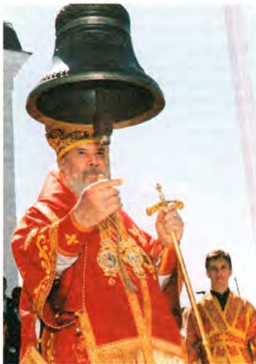
Святейший Патриарх ударяет в вечевой колокол

Полномочный представитель Президента в Сибирском федеральном округе Леонид Драчевский зачитал приветст-