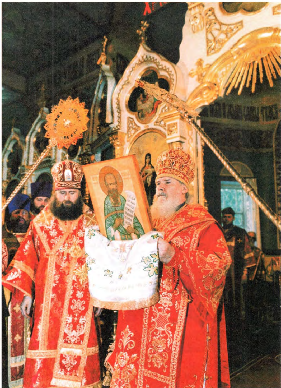
Святейший Патриарх благословляет народ Божий иконой священномученика Иннокентия