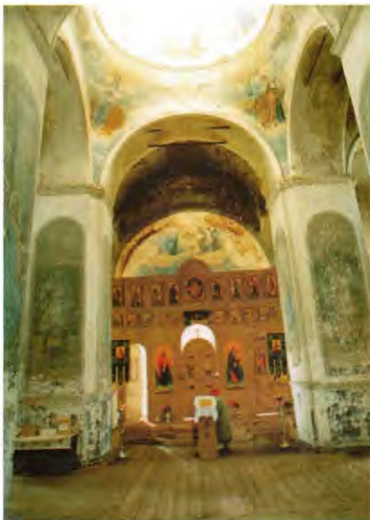
Внутренний вид храма Вознесения Господня

Есть надежда, что былая слава возвратится к нашим святыням и местные жители очнутся от тяжелого греховного сна. Для них это очень нелегко, ведь у