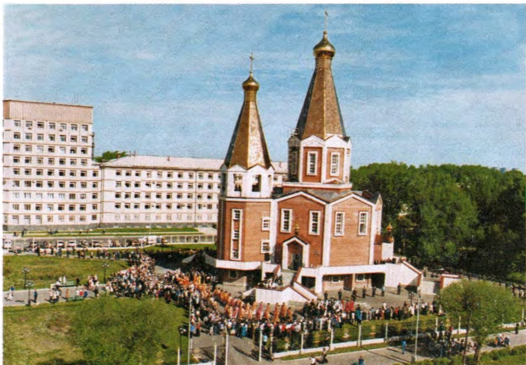
Возле храма в честь Владимирской иконы Божией Матери в городе Северске