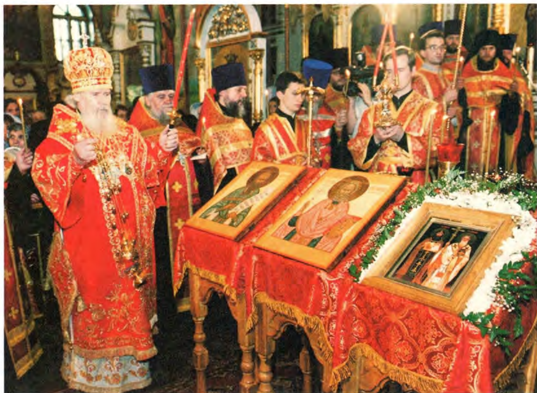
За всенощным бдением в Вознесенском кафедральном соборе