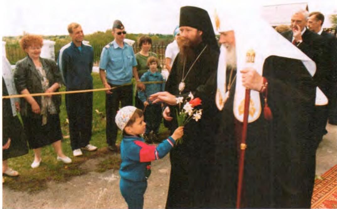
Встреча Святейшего Патриарха в селе Коларово