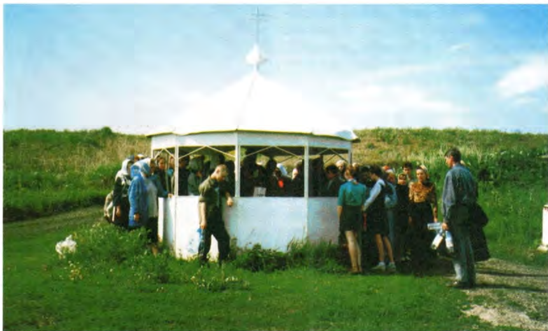
Молебен Преподобному Серафиму Саровскому у святого источника села Тёпловка. Вознесение Господне. 2000 год

Для желающих оказать помощь в восстановлении храма и часовни над источником «Троеручицы» приводим адрес: 442734, Пензенская обл., Лунинский р-н, с. Ст. Степановка, церковь Вознесения Господня.