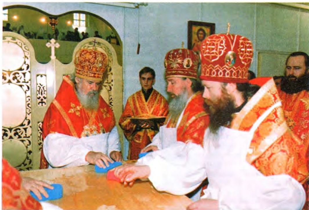
Освящение престола храма в честь Владимирской иконы Божией Матери в Северске

богослужением она молилась и молится о богохранимей стране Российской , и мы верим, что Господь услышал молитву нашу: в конце двадцатого века, после тяжелейших испытаний, репрессий и гонений, разорения наших отечественных святынь мы вновь возвращаемся к своим традициям, к своей отеческой вере».