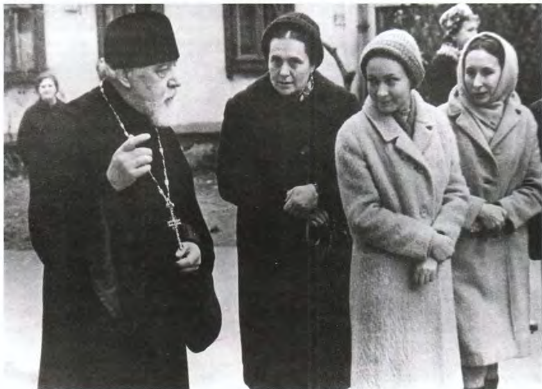
Во дворе Николо-Кузнецкого храма