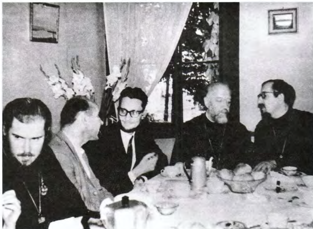
В Отделе внешних церковных сношений (крайний слева – будущий Святейший Патриарх Московский и всея Руси Алексий II)

Но главным для отца Всеволода всегда было пастырство. Он обладал ред-