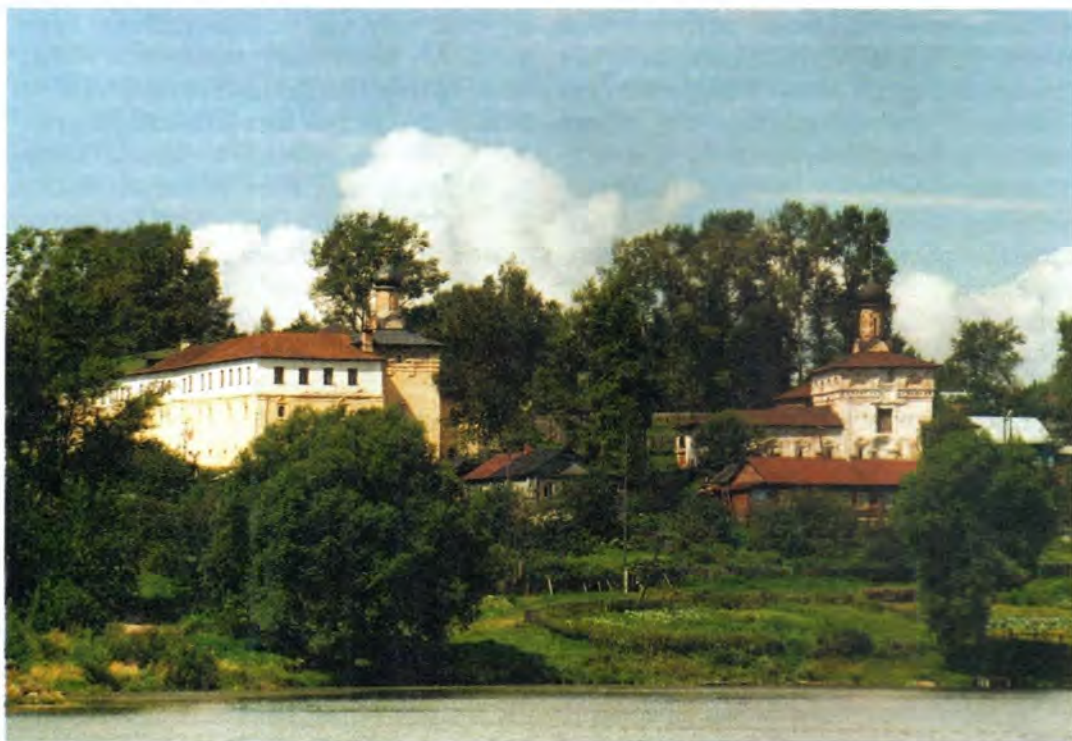
Яхренский Космин монастырь. Вид со стороны озера

общается, что между 1464 и 1473 годами великий московский князь Иван Васильевич выменял у митрополита Филиппа «его сельцо у Кузьмина монастыря Небылую деревеньку». В грамоте 1477 года назван игумен Пахомий (а не Косма), в грамоте 1500 года – игумен Протасий. Из этого следует, что основатель обители, бывший, по всей вероятности, ее первым игуменом, преставился до 1477 года. Вероятно, Космы уже не было в живых в тот период, когда великий князь выменивал у митрополита его «Небылую деревеньку у Кузьмина монастыря». Обитель, возникшая на земле митрополита Московского, первоначально, видимо, была митрополичьей, а затем находилась под покровительством великого князя Московского.