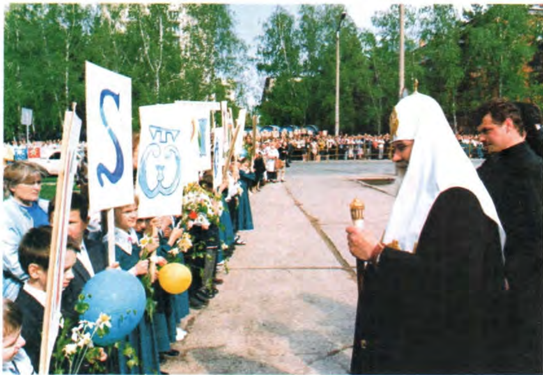
Предстоятель Русской Церкви в Новосибирском академгородке

1988 году, когда весь православный мир отмечал 1000-летие Крещения Руси, центром празднования Дня славянской письменности и культуры стал Новгород. Сюда приехали многие выдающиеся писатели и другие деятели отечественной культуры, чтобы в день памяти святых Кирилла и Мефодия вспомнить истоки родной письменности и культуры.