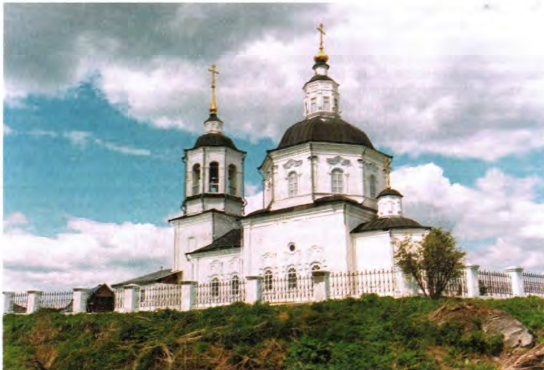
Спасский храм в селе Коларово

Старинный сибирский город в 2004 году готовится отметить свое четырехсотлетие. Томск – образовательный центр Сибири, город студентов,