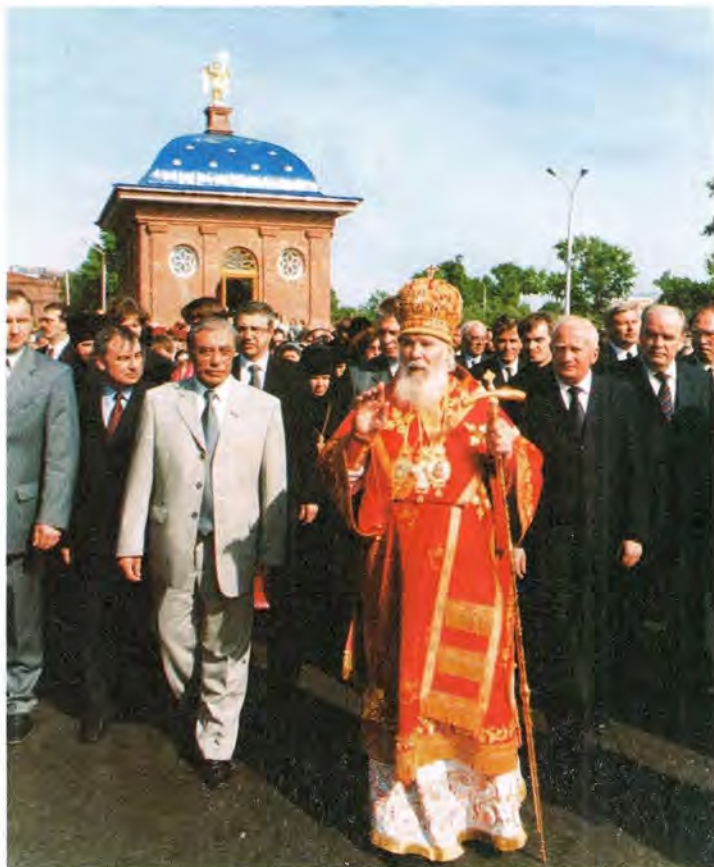
После молебна у Иверской часовни в Томске

Православной Церкви, несомненно побудит их сделать решительный шаг к Церкви, к храму Божию. И тот, кто сегодня еще, может быть, находится за церковной оградой, кто только первые шаги делает навстречу Церкви, сделает более решительный шаг и окажется в спасительной ограде Церкви Христовой».