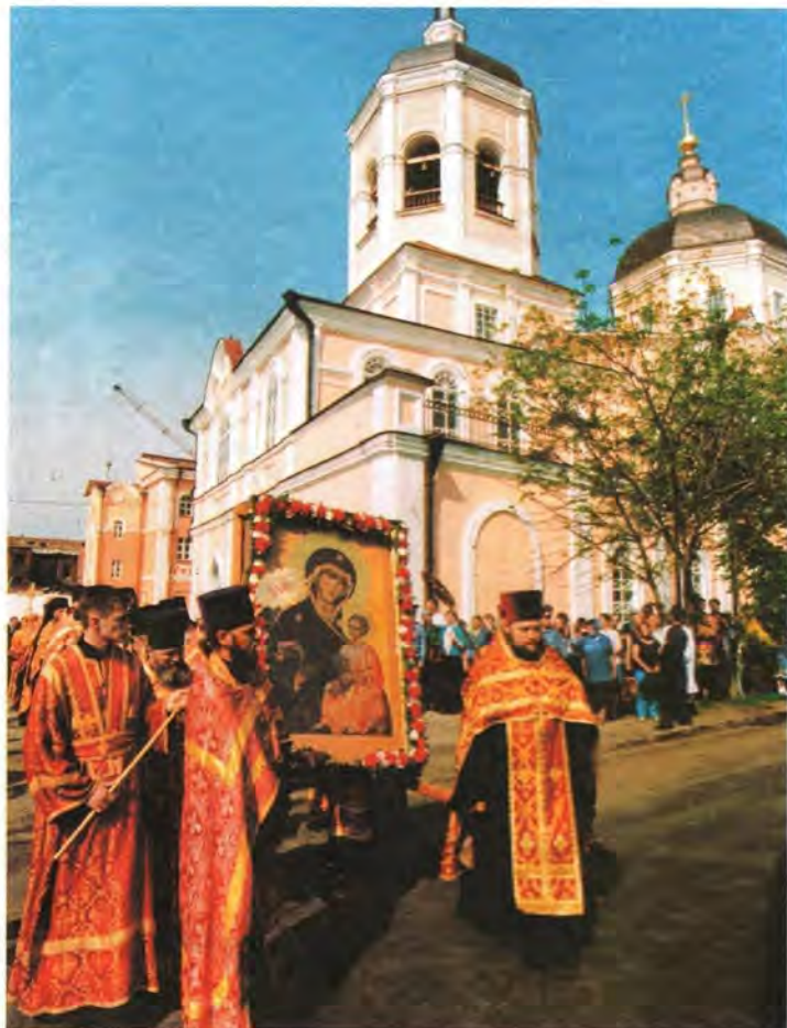
Крестный ход с Иверской иконой Божией Матери из Богоявленского собора

Ежегодно память святого праведного Феодора совершается в обители в день его представления 2 февраля (20 января по старому стилю) и 5 июля – в день обретения чест-