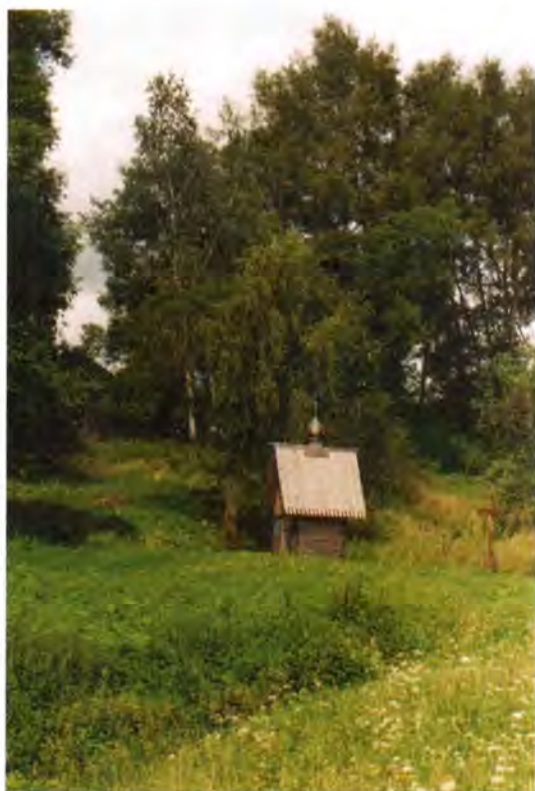
Часовня над колодцем преподобного Космы в окрестностях Яхренского Космина монастыря

беззаботной жизни совесть, зовут к созиданию, к заботе о возрождаемой святыне.