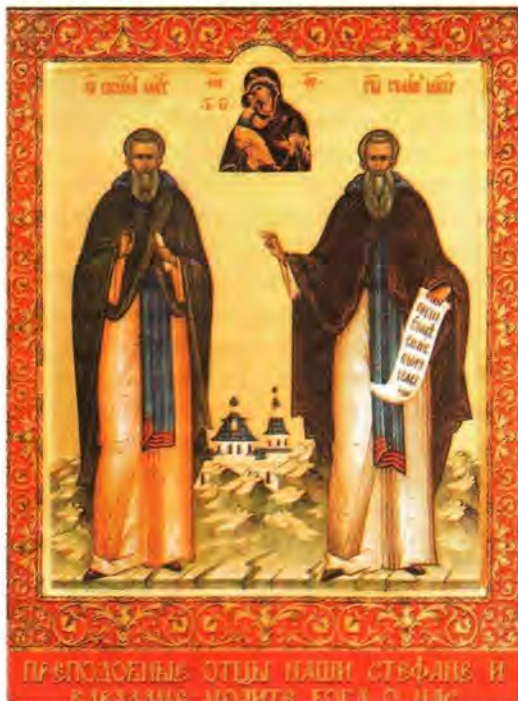
Преподобные Варлаам и Стефан Махрицкие

В 1560 году по благословению митрополита Макария игумен Варлаам возрождал Троице-Авнежский монастырь преподобных Григория и Кассиана, учеников преподобного Стефана Махрицкого. В этом монастыре стараниями игумена Варлаама были устроены Троицкий храм с приделом великомученика и Победоносца Георгия и Благовещенский храм, а также трапезная и келлии 12 . «Совершая молебствие при заложении церкви, он был свидетелем чудесного исцеления крестьянина Акакия» 13 . Позднее, при освящении построенного храма, на праздник Покрова, получил исцеление страдавший глухотой некто Михаил 14 . Авнежская обитель, возрожденная игуменом Варлаамом, была затем приписана к Махрицкому монастырю, а преподоб-