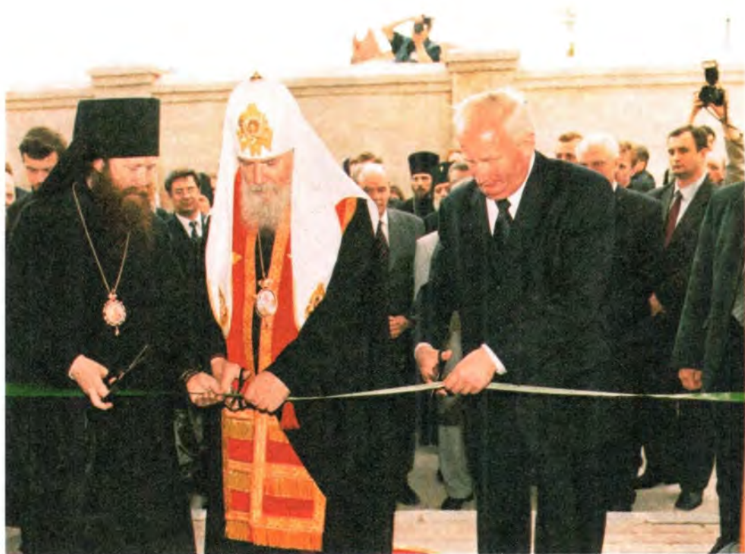
Торжественное открытие Томского Епархиального управления

чтобы «работалось здесь с пользой для Церкви, с пользой для епархии, для православного верующего народа, который будет духовно окормляться отсюда, из Епархиального управления, ибо все нити приходской жизни, духовного образования, социального церковного служения будут сходиться здесь, в этом доме». Святейший Патриарх передал правящему архиерею образ Спасителя – в укрепление и помощь в его архипастырских трудах.