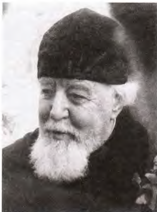
Протоиерей Всеволод Шпиллер в последние годы жизни

14 июля 2002 года исполнилось 100 лет со дня рождения протоиерея Всеволода Шпиллера – замечательного пастыря и проповедника, известного богослова. В жизни протоиерея Всеволода ярко отразилась многогранная история XX века, более всего – история церковная.