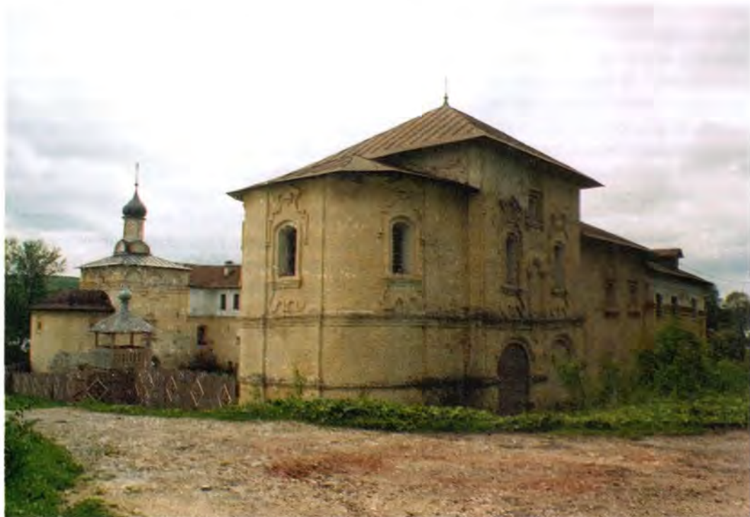
Яхренский Космин монастырь. На переднем плане – церковь Святителя Николая, на заднем плане – церковь Спаса Нерукотворенного Образа

На основании современных исследований о чтимых иконах Косминой обители можно сказать следующее. Первая святыня – «чудотворный медный литой