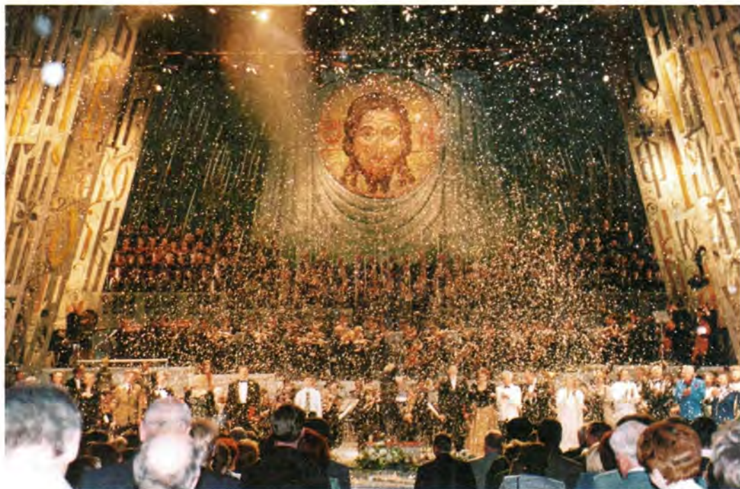
В зале Новосибирского государственного театра оперы и балета

церковной службе святые Кирилл и Мефодий вспоминаются и прославляются как первые учители Словенские .