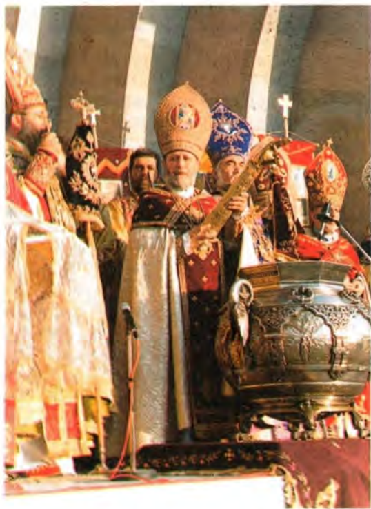
Святейший Патриарх и Католикос всех армян Гарегин II с дланью святого Григория просветителя

В посвященном мученичеству Апостола Фаддея и девы Сандухт свидетельстве «История Апостола Фаддея и девы Сандухт» говорится, что Апостол Петр «Коснувшееся Бога Копье как оружие дал Фаддею, чтобы оно было помощником Апостолу в его проповеди». А длань Григория-просветителя считается самой главной национально-церковной святыней и согласно утвердившемуся со средневековья восприятию, Армянский Первопрестол может находиться там, где находится длань просветителя, без которой не может проводиться освящение святого мира.