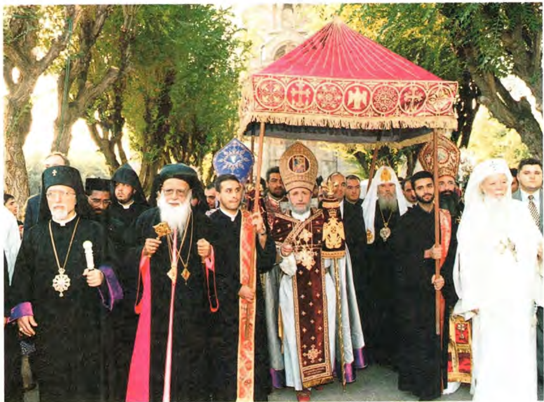
Праздничное шествие в Эчмιάдзине 22 сентября 2001 года

архиереи и священнослужители Армянской Апостольской Церкви.