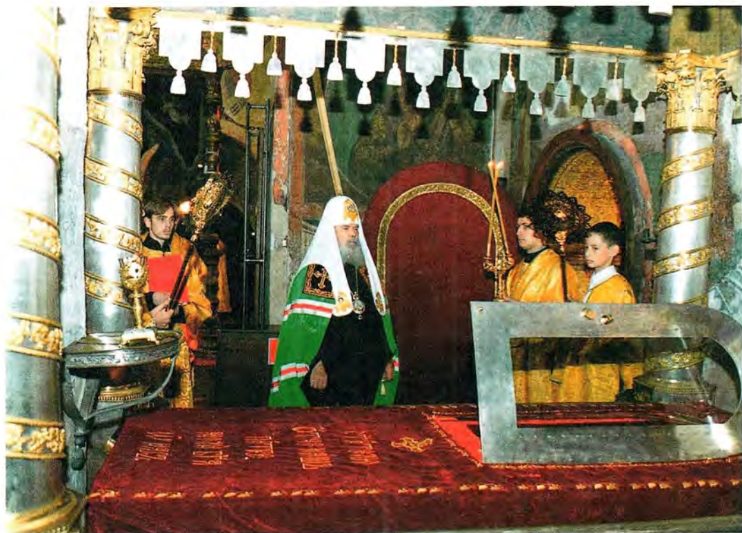
Святейший Патриарх Алексий у раки с мощами святителя Московского Петра Успенский собор Московского Кремля, 6 сентября 2001 года

Святейший Патриарх совершил освящение часовни в честь святителя Василия Великого на территории Всероссийского выставочного центра. За богослужением молился епископ Дмитровский Александр.