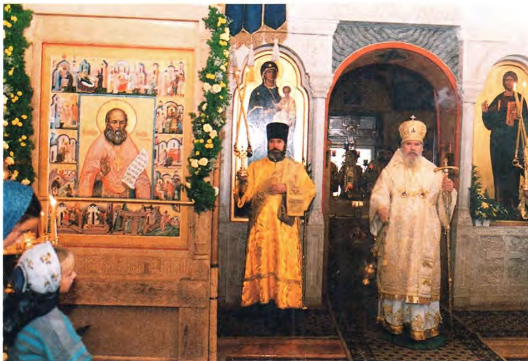
За Божественной литургией в храме Святителя Николая в Клённиках 30 сентября 2001года

Многие из нас, взирая в недавнем прошлом на фото- и кинохронику подобных шествий, снятых в конце XIX и начале XX столетий, с болью переживали утрату былого величия Святого Православия на Руси. Однако прошедший крестный ход, ставший поистине одним из значимых событий нынешнего года, показал, что, несмотря на все тяготы и невзгоды минувшего столетия, православная вера по-прежнему жива в сердцах русских людей и что она вновь объединяет их вокруг Святой Православной Церкви.