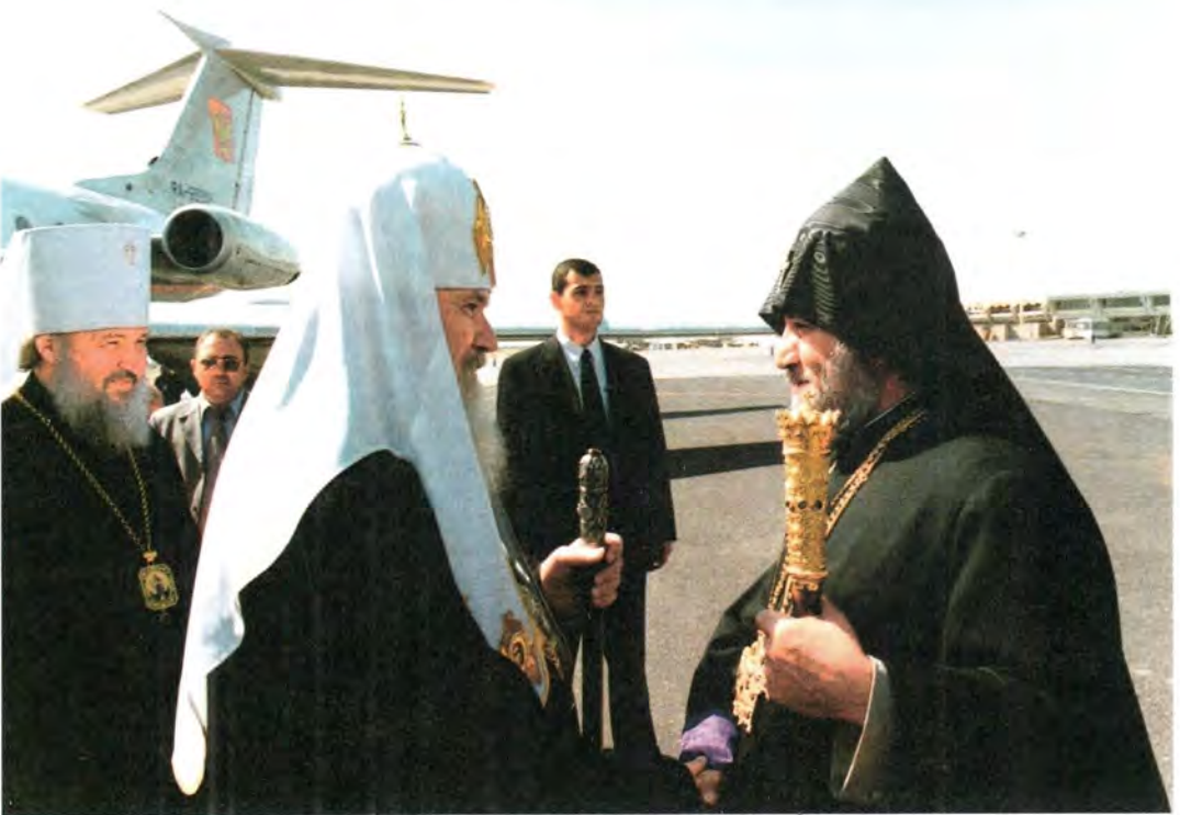
Встреча в аэропорту Еревана

тил Святейший Верховный Патриарх и Католикос всех армян Гарегин II. Затем Предстоятели Церквей отправились в резиденцию Президента Республики Армения Роберта Кочаряна, где состоялась их встреча с главой государства. Русский и армянский народы связывают многолетние дружеские узы, и эта встреча стала новым видимым знаком их крепости. В ходе встречи состоялся широкий обмен мнениями по вопросам российско-армянских государственных отношений, а также взаимоотношений между Русской Право-