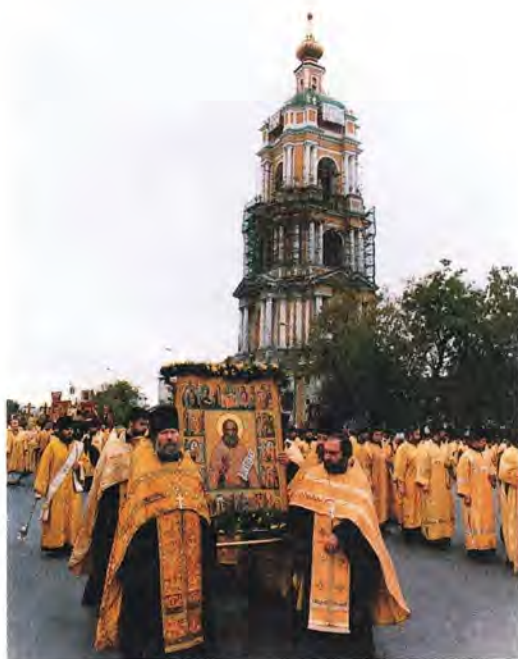
Начало крестного хода Новоспасский монастырь