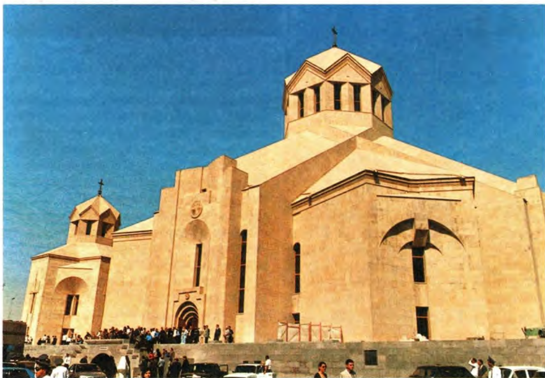
Новопостроенный храм в Ереване

В своей речи при освящении собора Святейший Верховный Патриарх и Католикос всех армян Гарегин II, в частности, сказал: «Господь возжелал, чтобы армянский народ воздвигнул храм святости, когда в 301 году перед взглядом