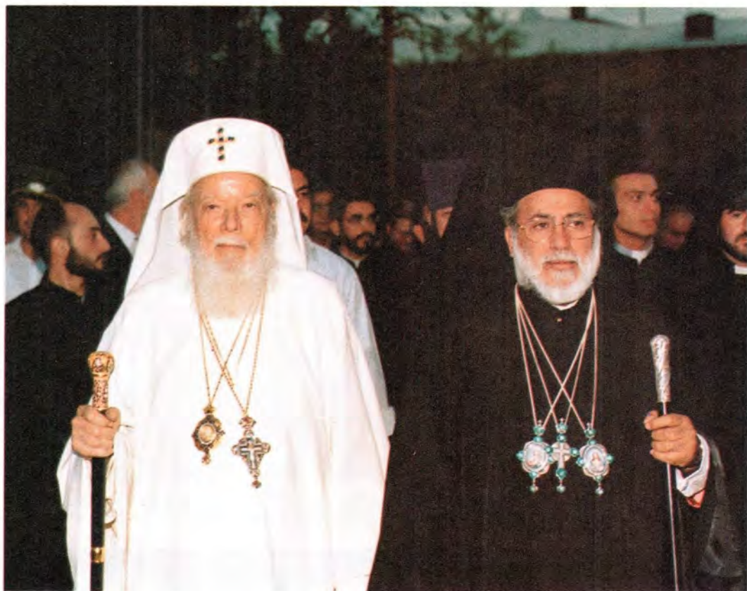
Святейший Патриарх Румынский Феоктист и Блаженнейший Папа и Патриарх Александрийский Петр VII в Эчмиадзине

Чин освящения святого мира, обычно совершающийся раз в семь лет, был приурочен к нынешним торжествам и стал одним из центральных событий великого праздника армянского народа. Последний раз миро в Святом Эчмиадзине освящалось пять лет назад.