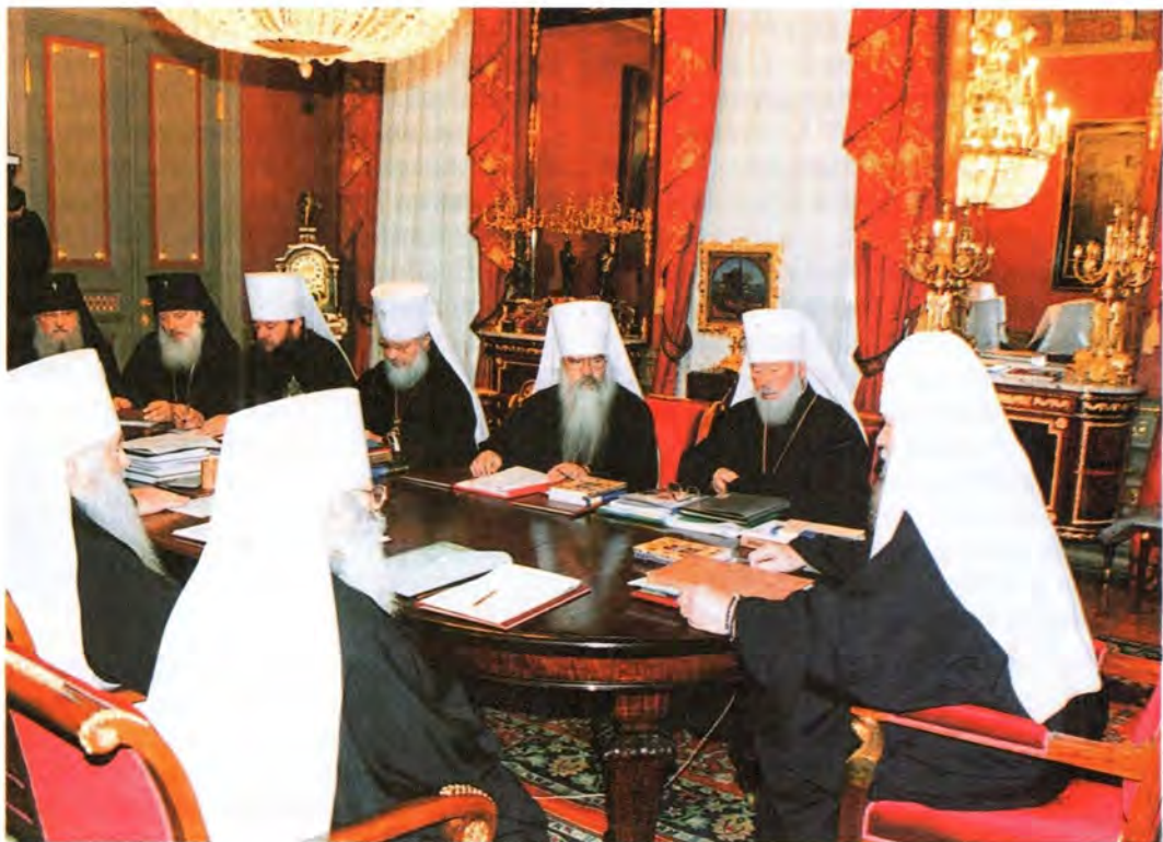
Заседание Священного Синода Русской Православной Церкви 6 октября 2001 года

для Храма Христа Спасителя в Москве две воссозданные торжественные хоругви – дар белорусского народа. Торжества завершились оглашением совместного Обращения Святейшего Патриарха Московского и всея Руси Алексия и Президента Республики Беларусь А. Г. Лукашенко к народам России, Белоруссии и Украины. В ходе визита состоялась встреча Президента Республики Беларусь А. Г. Лукашенко, Патриарха Московского и всея Руси Алексия и митрополита Минского и Слуцкого Филарета, Патриаршего Экзарха всея Беларуси, с членами Синода Белорусской Православной Церкви.