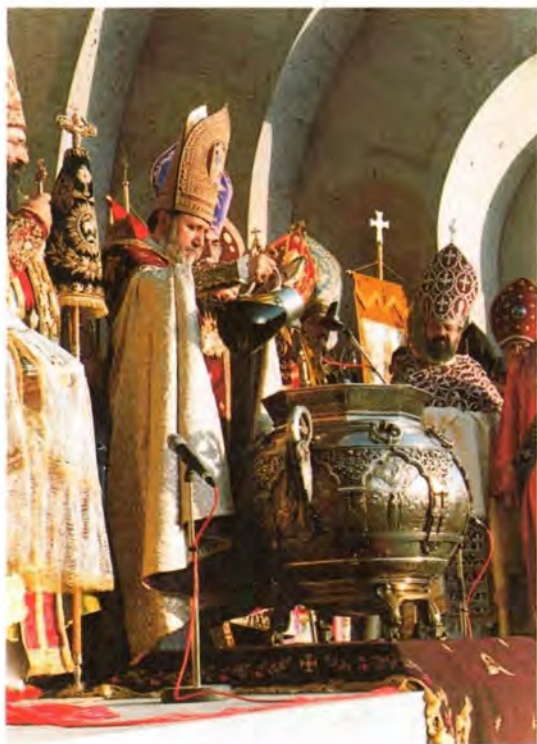
Святейший Патриарх и Католикос всех армян Гарегин II совершает чин освящения мира

в тот день, было бесчисленное количество из царского войска».