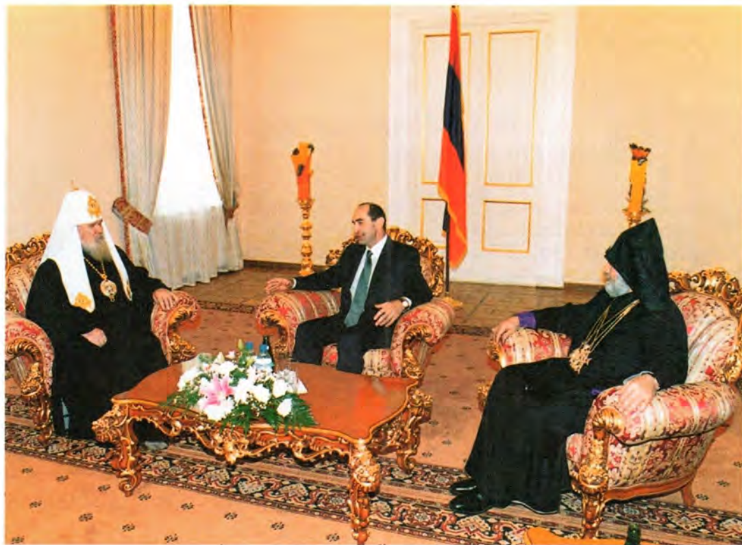
В резиденции Президента Республики Армения

славной и Армянской Апостольской Церквами. Было отмечено, что построить сильное государство можно только опираясь на твердый фундамент в душах людей, фундамент духовности и нравственности. Христианство, принятое Арменией 1700 лет назад, стало таким прочным фундаментом, объединяющим армянский народ и дающим ему силы противостоять всем невзгодам и испытаниям – в этом собеседники были единодушны.