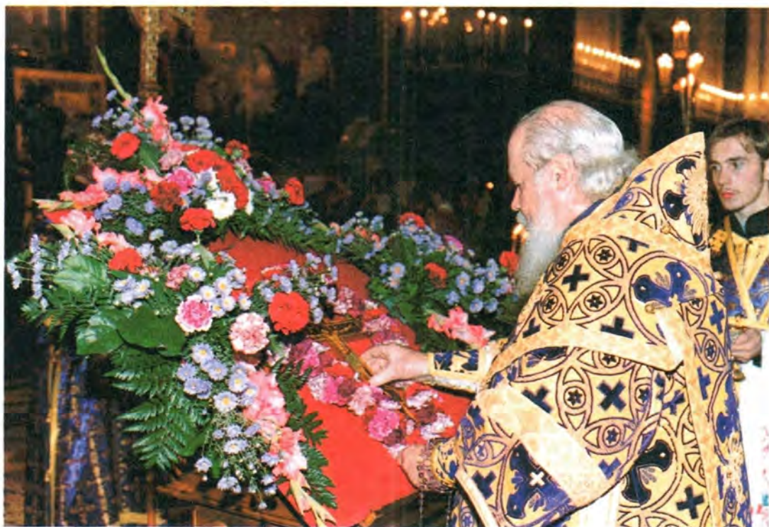
За богослужением в праздник Воздвижения Честного и Животворящего Креста Господня. Храм Христа Спасителя

литургию в Успенском Патриаршем соборе Московского Кремля. После славения и молитвы Святейший Владыка обратился к верующим со Словом.