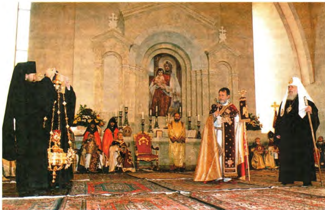
Святейший Патриарх Алексей передает Предстоятелю Армянской Апостольской Церкви лампаду – дар Русской Православной Церкви