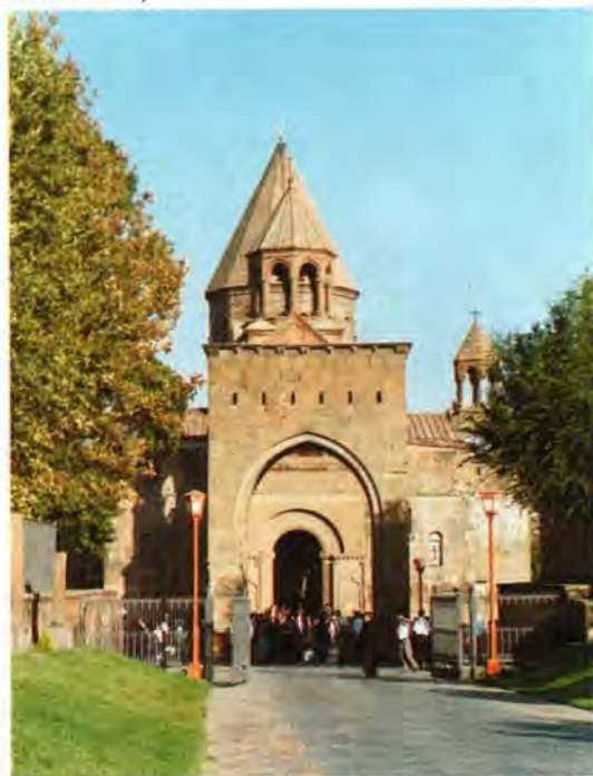
Собор Святого Эчмиадзина

Святой Эчмиадзин стал центром армянского христианства в начале IV века. Построенный в 303 году кафедральный собор, его большой и малый купола (1627), колокольня (1658), пристроенный музей (1869) составляют интересную архитектурную композицию.