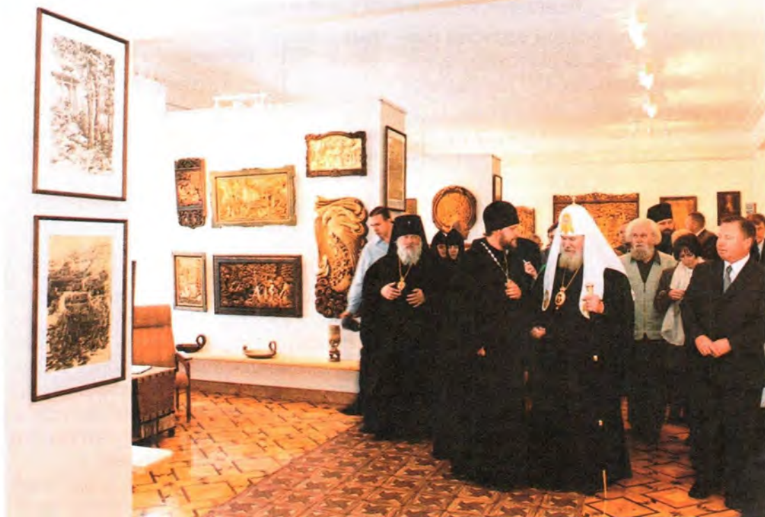
Во время осмотра экспозиции сортавальского музея