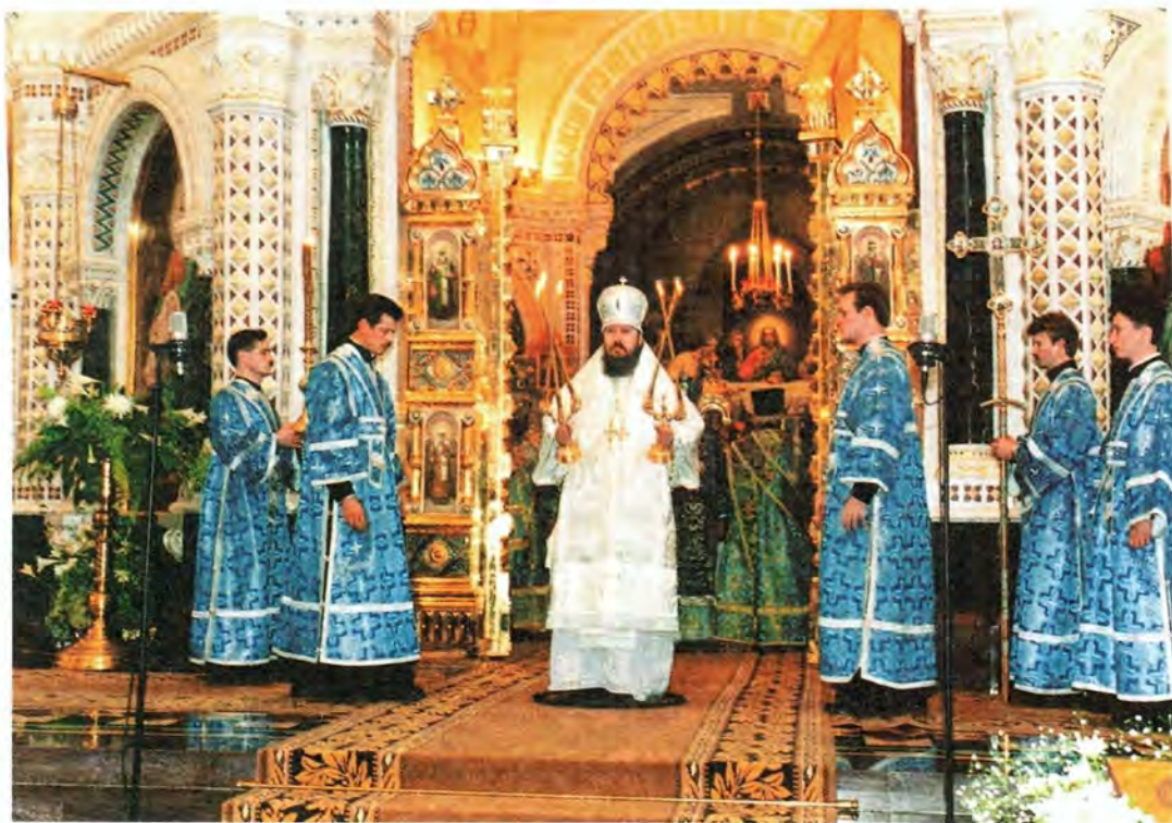
За Божественной литургией в день епископской хиротонии, 2 сентября 2001 года

степень священнического достоинства и служения.