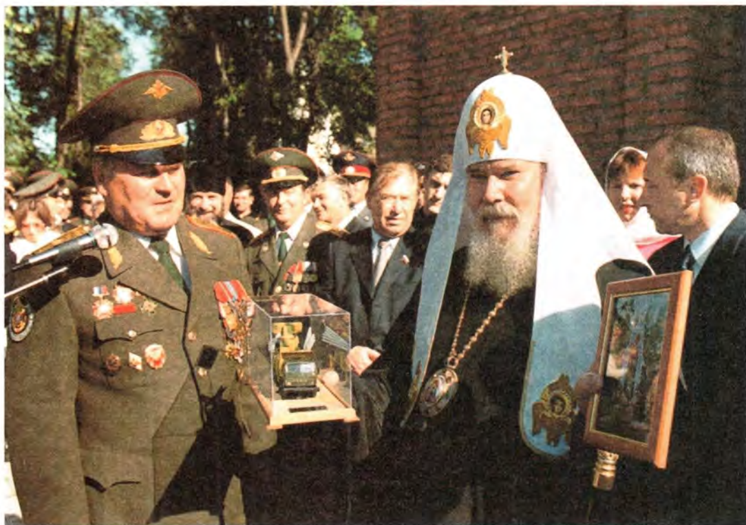
Дары Святейшему Патриарху от воинов