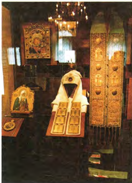
Облачение Святейшего Патриарха Ермогена Фрагмент экспозиции выставки

Алексием, Макарием, Филиппом и Ермогеном, ныне хранящиеся в музеях Московского Кремля. Был на выставке и раздел, посвященный Первосвятителям Русской Православной Церкви XX века – святителю Тихону, Патриархам Сергию, Алексию I, Пимену и нынешнему Предстоятелю – Святейшему Патриарху Алексию II. Их облачения были предоставлены Церковно-археологическим кабинетом Московской Духовной академии и Патриаршей ризницей.