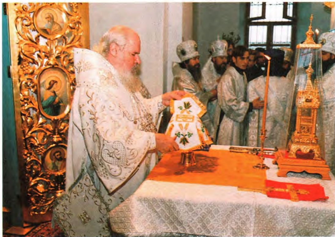
Во время освящения храма