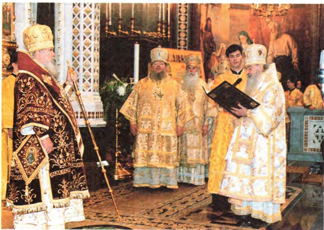
Приветствие от имени Священного Синода зачитывает митрополит Ювеналий

Да, все было на этой земле. Было море, бушующее непониманием, отчуждением, разногласиями, отторжением. Но было и другое. Была и купина неопалимая, благодатная, которая светила Вам, которая согревала Ваше сердце. Было и законодательство великое, которое написано и пишется на скрижалях сердца человека верующего. Было и чудо, когда люди вкушали хлеб Небес-