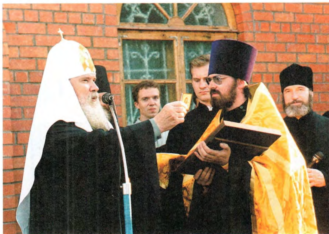
Святейший Патриарх благословляет жителей села Левинка