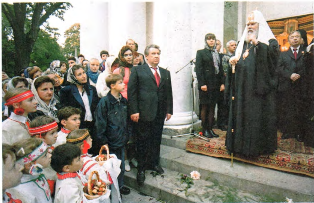
Святейший Патриарх приветствует жителей Богородицка