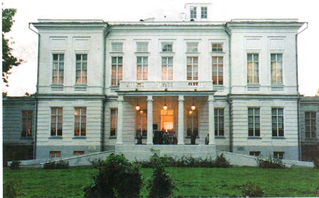
Дворец графа Бобринского в Богородицке