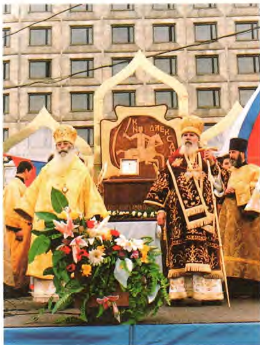
Во время молебна на площади перед Александро-Невской лаврой

Первосвятитель Русской Церкви. – Сегодня мы молимся о упокоении всех, кто погиб, и просим Господа дать терпение и мужество тем, кто потерял родных и близких в результате этого страшного террористического акта. Мы разделяем переживания, которые постигли Соединенные Штаты Америки, потому что на себе испытывали акты терроризма со стороны чеченских боевиков, во время которых гибли наши соотечественники. Печально, что наш праздник – праздник святого благоверного князя Александра Невского – омрачился трагическими известиями. Дай Бог, чтобы все здоровые силы мира объединились, чтобы противостоять международному терроризму. Мы должны возлагать свои надежды на Господа Бога, на предстательство Царицы Небесной, на молитвенную поддержку святого благоверного великого князя Александра Невского», – сказал Святейший Патриарх.