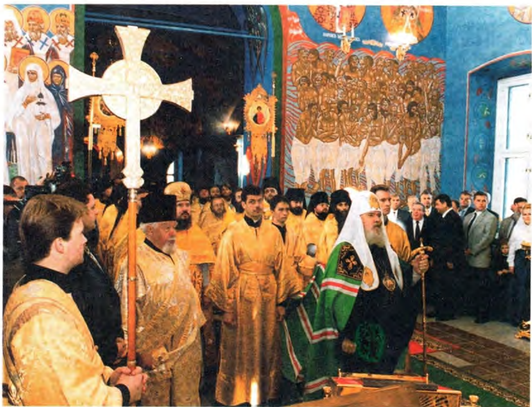
Перед началом богослужения в Покровском храме в селе Недельное