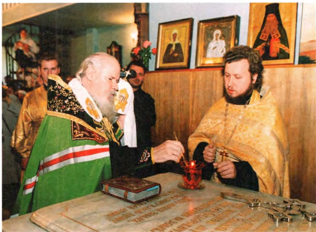
Святейший Патриарх в часовне блаженной Ксении Петербургской

Затем Первоверховный Русской Православной Церкви вернулся в Петербург и посетил Смоленское кладбище, где отслужил молебен в часовне святой блаженной Ксении Петербургской. Каждый раз, приезжая в северную столицу, Святейший Патриарх совершает поклонение святой матушке Ксении, которую особенно почитает. Напомним, что именно его трудами в бытность его митрополитом Санкт-Петербургским часовня на Смоленском кладбище была вновь открыта после долгих годов запустения.