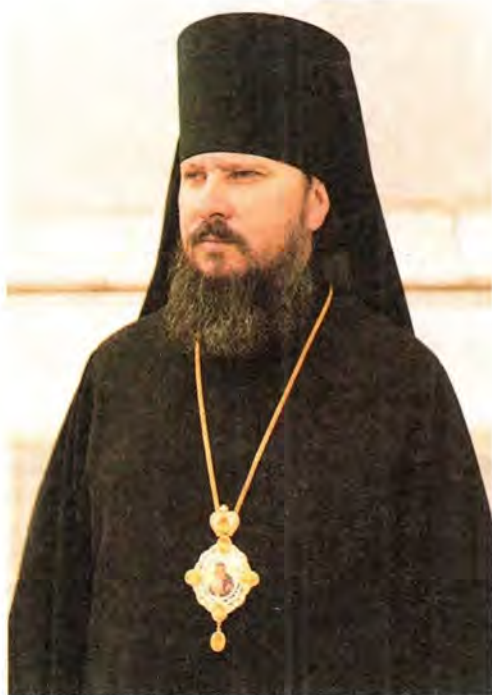
Преосвященный Александр, епископ Дмитровский

Постановлением Патриарха и Священного Синода от 18 июля 2001 года игумену Александру (Агрикову), клирику города Мытищи, определено быть епископом Дмитровским, викарием Московской епархии.