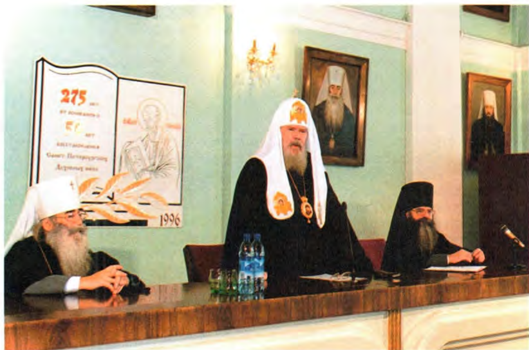
Выступление Святейшего Патриарха Алексия перед преподавателями и студентами Санкт-Петербургских Духовных школ

званы духовно окормлять, — от их прихожан.