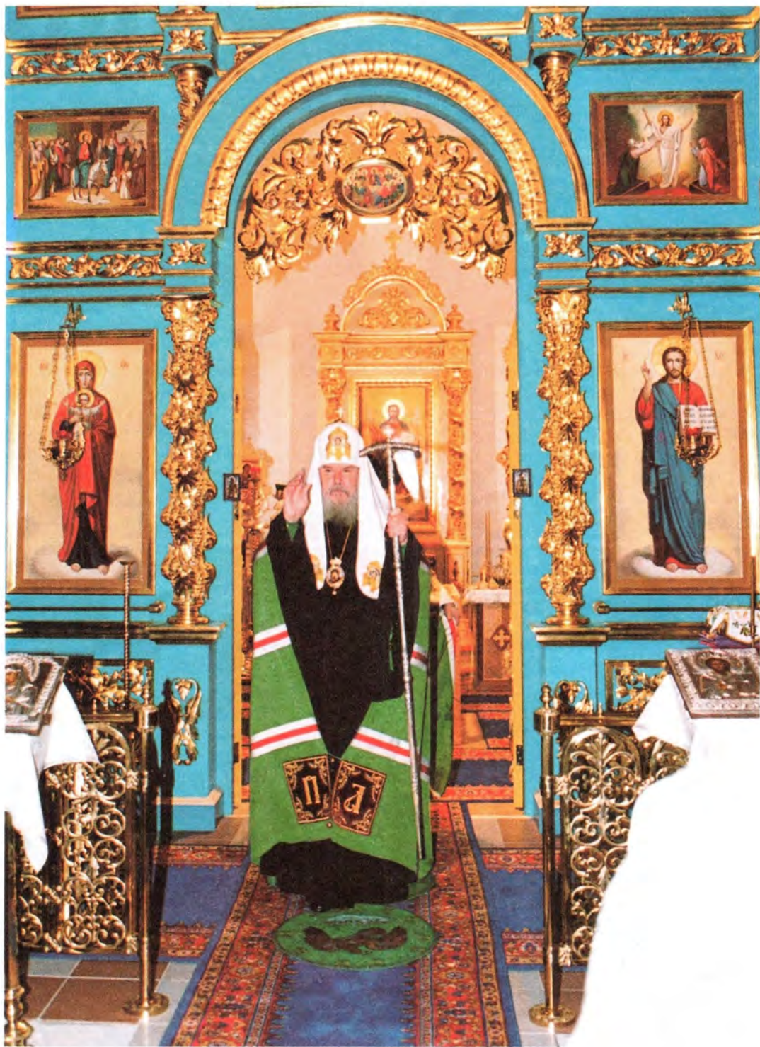
Святейший Патриарх благословляет прихожан Покровского храма