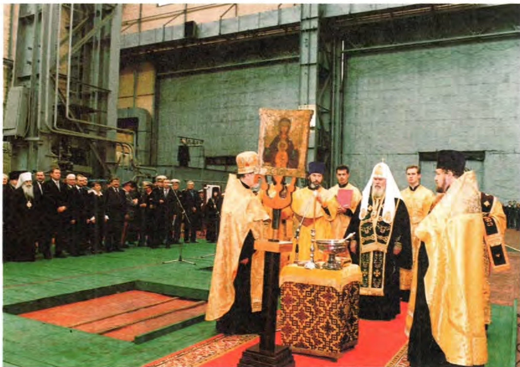
Освящение закладки судна «Святитель Алексей»

рой представлены снимки множества возрождающихся из руин церквей.