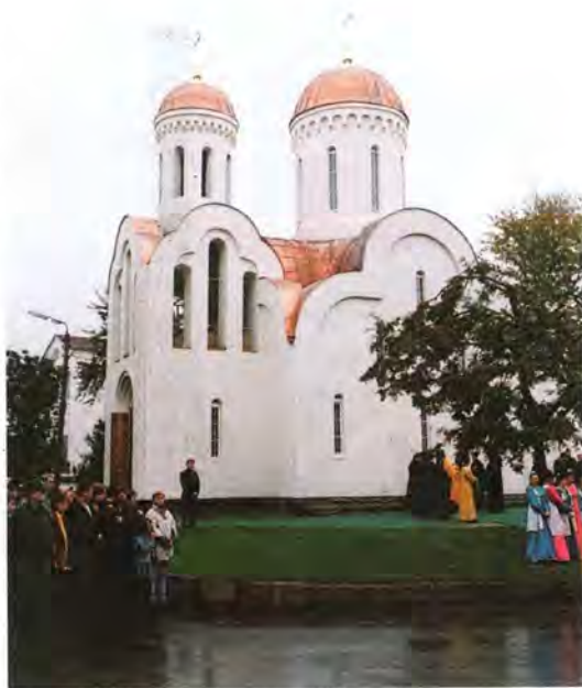
Храм в честь Воскресения Христова на Тульском оружейном заводе

«Слава Богу, что в нашу жизнь возвращена память о Куликовской битве, – сказал, обращаясь к собравшимся Предстоятель Русской Церкви, – ведь эта битва во многом определила ход нашей истории. Великий князь Димитрий Донской получил на нее благословение от Преподобного Сергия Радонежского, который как видимую поддержку дал ему двух иноков – Пересвета и Ослябю. Все мы сегодня волнуемся, находясь на этом святом месте, обильно политом кровью сынов нашего отечества. Куликовская битва