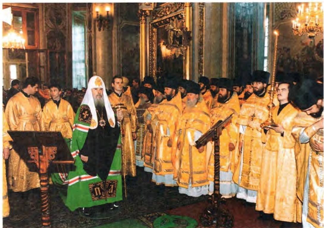
Перед началом Божественной литургии в кафедральном соборе Тулы