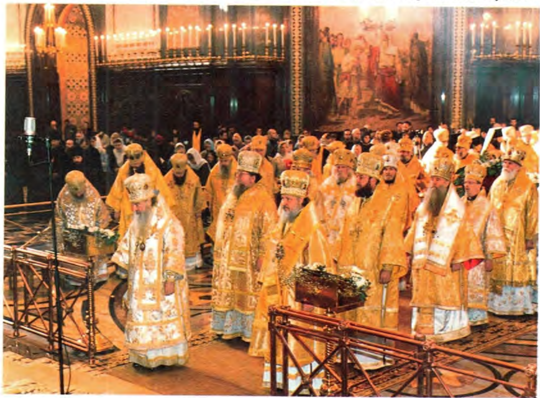
Архипастыри Русской Православной Церкви за праздничным богослужением

скромные дары, просим их принять. Это дары с особым, символическим смыслом. Прежде всего крест. Этот крест сделан из окаменевших, очень твердых и тяжелых древесных пород, потому что Патриарший крест, который вы подняли на свои рамена, есть спрессованный крест миллионов людей. В этом кресте есть трещина, которая напоминает о землетрясении на Голгофе, когда Крест Христов достиг дна ада и извел оттуда пленников. Эта трещина пусть напоминает Вам, Ваше Святейшество, о горе, о слезах, о скорбях, о стенаниях миллионов людей. Эта трещина никогда не зарастает в любящем сердце. Но чтобы не было так тяжело, так горестно, так неизбежно тяжело, – вот еще две панагии, два вертепа: спасительные Вифлеемские ясли, откуда воссияла вера Христова, потому что в тишине сердца каждого верующего человека, в самых его сокровенных глубинах