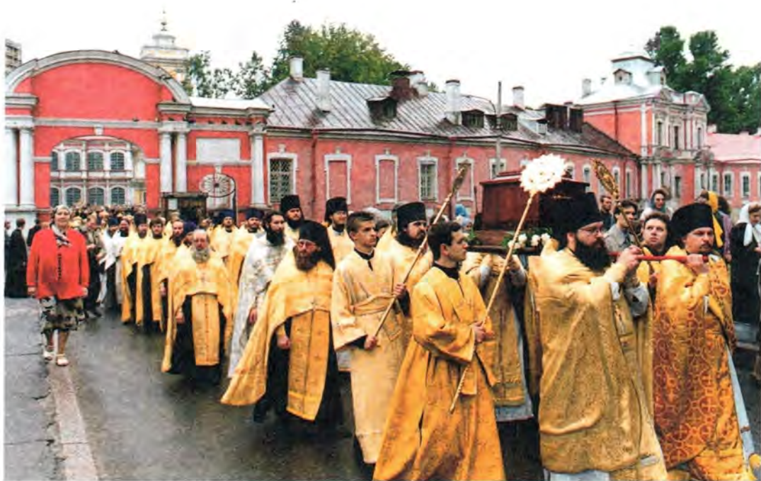
Крестный ход в день памяти святого благоверного князя Александра Невского

«Мы совершили молебное пение перед святыми мощами святого благоверного великого князя Александра Невского, покровителя и защитника отечества нашего и этого града, – сказал