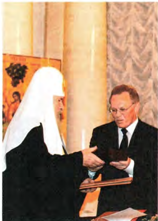
Президент Российской Академии наук Ю. С. Осипов вручает Святейшему Патриарху Алексию приветственный адрес

церковный корабль среди всех этих подводных препятствий спокойно и уверенно, сохраняя единство Церкви, сохраняя веру православную чистой и незамутненной.