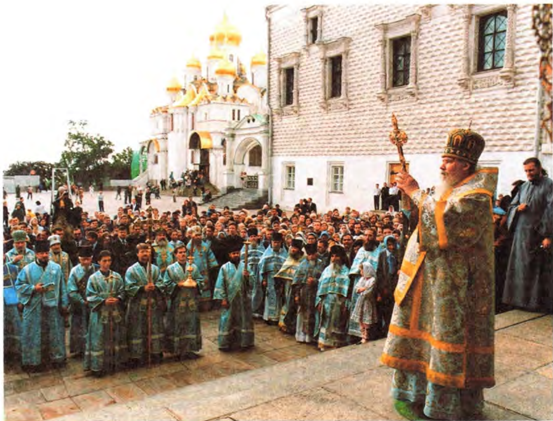
Во время молебна перед Успенским собором Московского Кремля. 28 августа 2001 года

кафедральном соборном Храме Христа Спасителя.