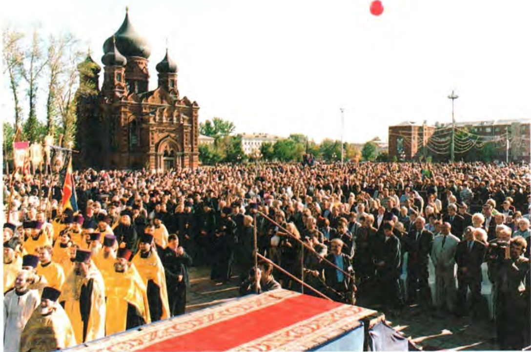
Во время открытия Дня города на центральной площади Тулы возле здания Успенского собора, возвращенного Тульской епархии

будущего Тульской земли. Девиз сегодняшнего праздника: “Тула – наш общий дом” – обязывает всех жителей города вместе трудиться, в единении созидая будущее своего города, своей земли.