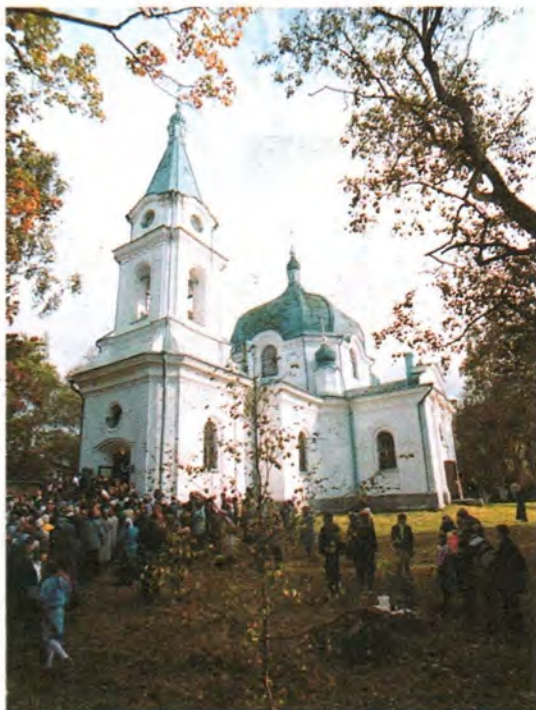
Храм во имя Святого и Чудотворца Николая в Сортавале

Последний день был посвящен мероприятиям, связанным с Валаамским монастырем. Утром 13 сентября Святейший Патриарх Алексей вылетел на вертолете в Карелию, в город Сортавалу (по-русски – Сердоболь), где недавно построен дом для переселенцев с острова Валаам. Постройка этого дома была осуществлена в рамках программы возрождения Валаама, проводимой