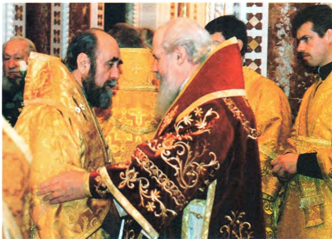
Предстоятеля Русской Православной Церкви поздравляет архиепископ Ташкентский и Среднеазиатский Владимир

ный – спасительную воду благодати Божией. Все это было под Вашим водительством и все это продолжается. Вы ведете крепкой архипастырской десницей народ Божий ко спасению в священной ограде Русской Православной Церкви