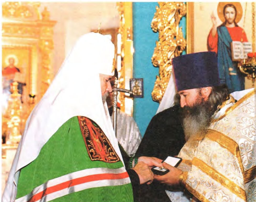
Награждение настоятеля Покровского храма

щее время здесь обучаются 250 человек. Дети принимают активное участие в жизни школы, помогают в храме, участвуют в проведении церковных праздников.