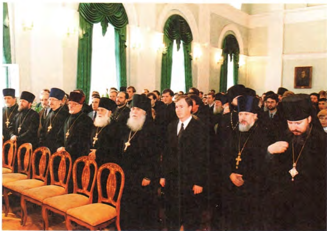
Молитва перед началом встречи

Отрадно, что областная власть с пониманием относится к нуждам Петербургской епархии, помогая Церкви в восстановлении порушенных в годы безбожной власти храмов. Святейший Патриарх осмотрел в здании областной администрации фотовыставку, на кото-