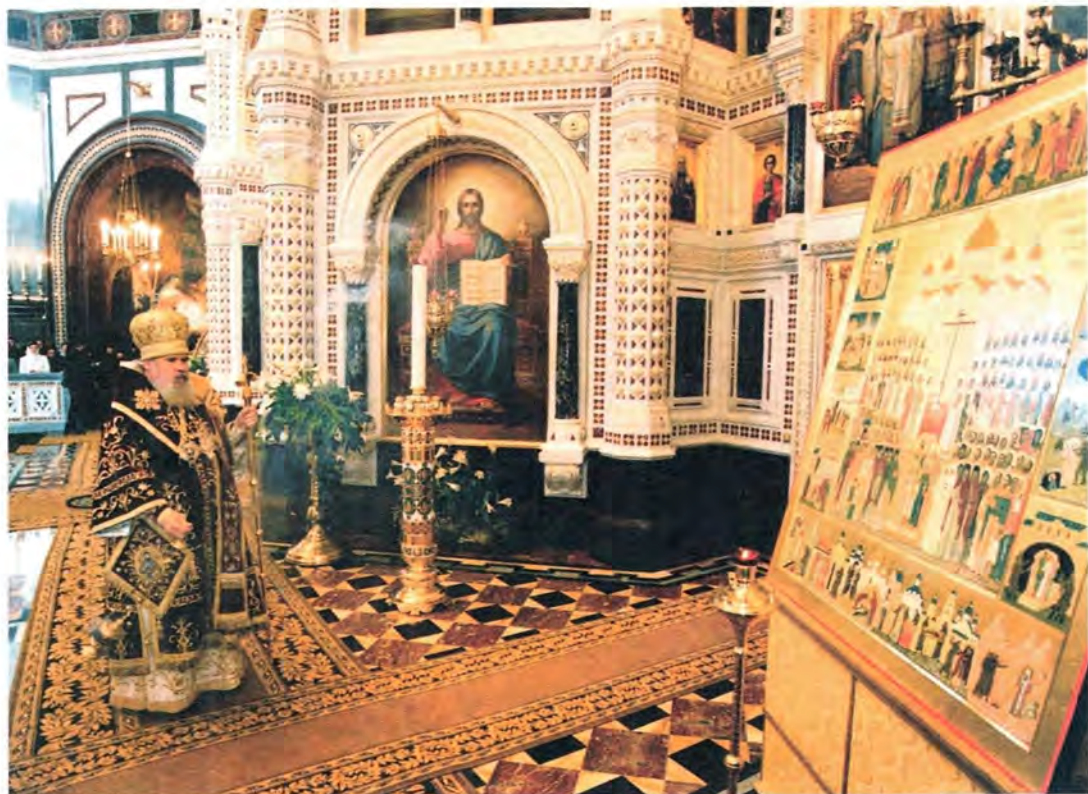
Святейший Патриарх Алексий за Божественной литургией в Храме Христа Спасителя в день своего юбилея, 3 сентября 2001 года

Архиерейский Собор 2000 года, прославивший в лике святых сонм новомучеников и исповедников Российских – ходатаев и молитвенников у Престола Божия за наше многострадальное отечество.