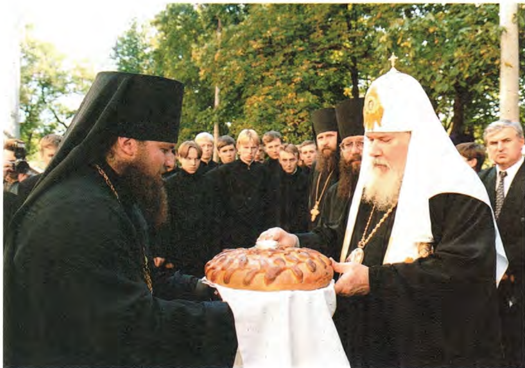
Встреча Святейшего Патриарха Алексия возле здания Тульской Духовной семинарии

меня, – отметил он, – особенно дорого то, что ректором Тульской Духовной семинарии был Святейший Патриарх Алексий I в бытность свою архимандритом... Хочется высказать благодарность администрации города и области за возвращение этого прекрасного здания, которое, конечно, потребует многих трудов для своего восстановления, но, как говорится, глаза боятся, а руки делают».