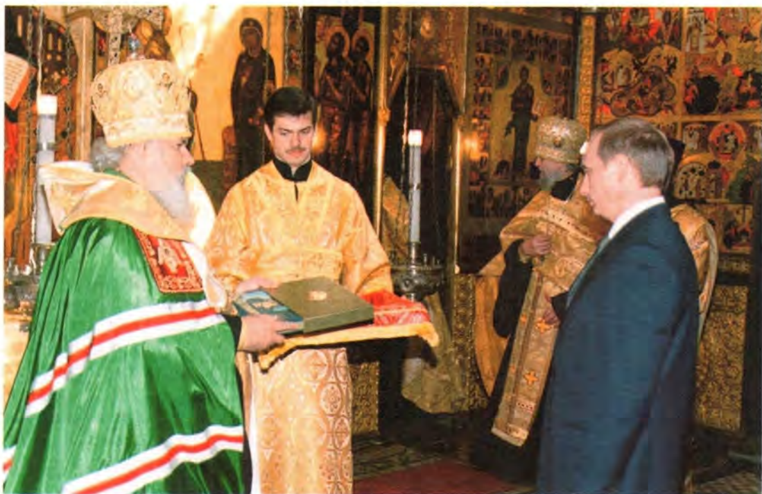
Благословение Святейшего Патриарха Президенту в день его инаугурации, 7 мая 1999 года

Несмотря на то, что Его Святейшеству Патриарху Московскому и всея Руси Алексию II довелось вести церковный корабль в нелегкое и противоречивое время, годы его патриаршего служения стали уникальной эпохой реального возрождения нравственных основ жизни общества. В этот ответственный момент отечественной истории миллионы наших сограждан с глубоким уважением прислушиваются к каждому сердцем выстраданному слову пастыря.