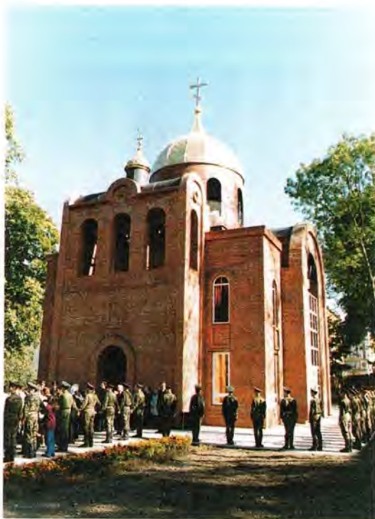
Храм во имя святителя Московского Алексия в Артиллерийском институте

Первосвятитель Русской Православной Церкви встретился с курсантами Тульского артиллерийского инженерного