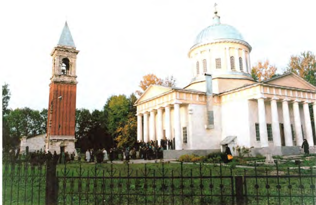
Храм Сретения Господня в селе Богучарове

В селе Богучарово, бывшем имении славянофила Алексея Степановича Хомякова, Предстоятель Русской Православной Церкви посетил храм Сретения Господня. «Я рад посетить этот восстановленный храм, с колокольной особой архитектуры, – сказал, обращаясь к местным жителям, Святейший Владыка. – Мне рассказали, что есть только две такие колокольни-звонницы – одна в Венеции, а другая в Богучарове. Этот храм связан с обетом: он был построен после Отечественной войны 1812 года. В этом я усматриваю связь с Храмом Христа Спасителя в Москве, который также является памятником героям этой войны. Слава Богу, что восстанавливаются святыни. Еще со-