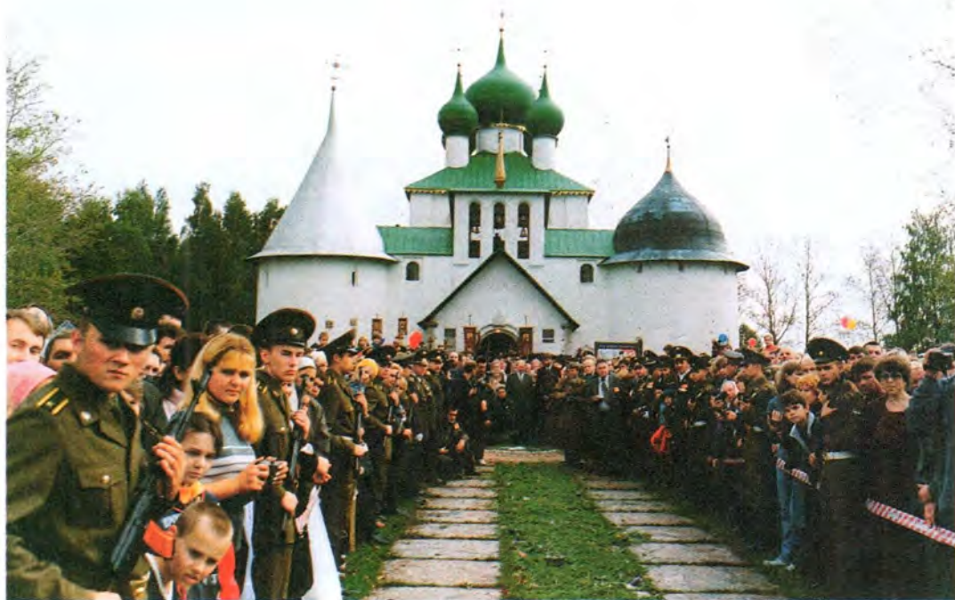
Храм во имя Преподобного Сергия Радонежского

ное целое. Ежегодный праздник на поле Куликовом, который приобретает все больший размах, этому всемерно способствует. Его Святейшество поблагодарил губернатора области за его прекрасную организацию.