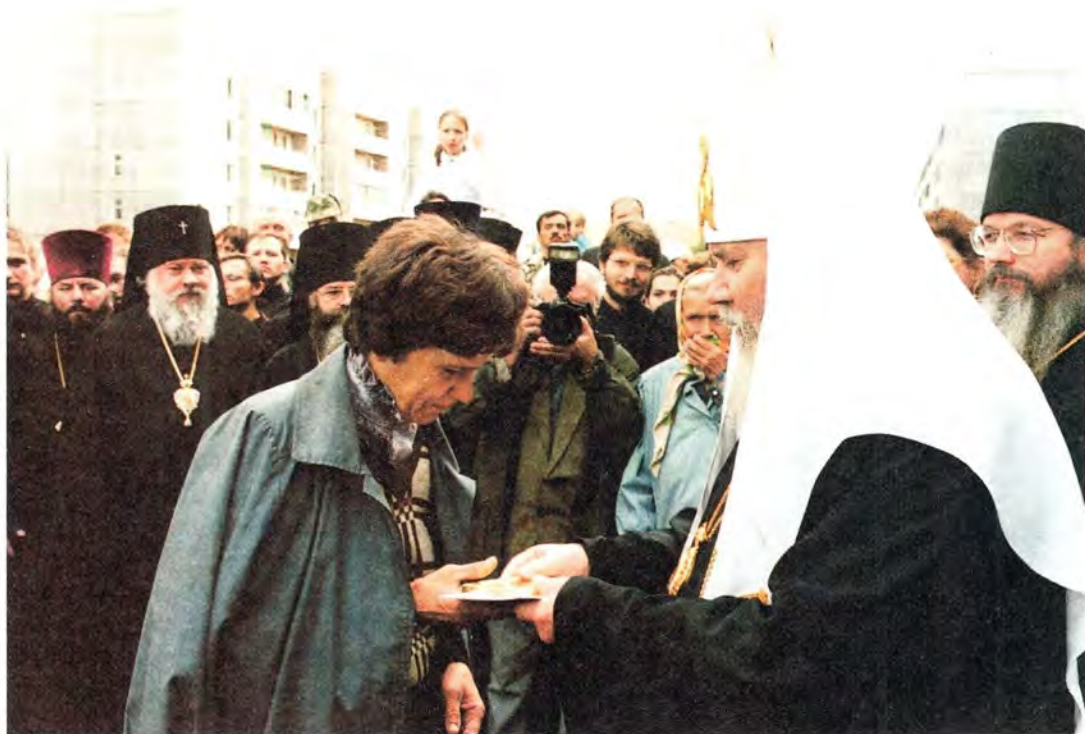
Вручение ордера переселенцам с Валаама

именные ордера тридцати первым семьям (более 120 переселенцам), всего несколько дней назад переехавшим в Сортавалу. Всего в доме будет проживать шестьдесят семей.