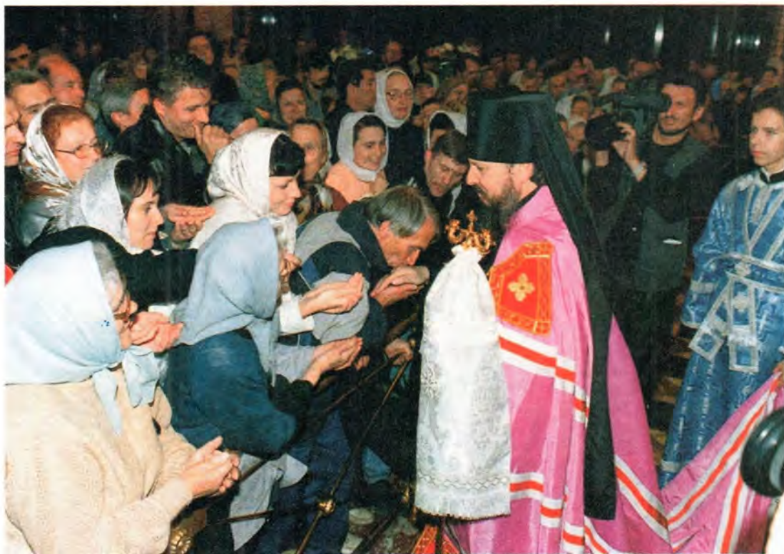
Первое благословение новопоставленного епископа

Ты исповедал сегодня перед нами свою веру, ты дал обеты верности Святой Церкви и ее Священноначалию и, надеюсь, готов ко многим трудам, многим подвигам, лишениям и испытаниям.