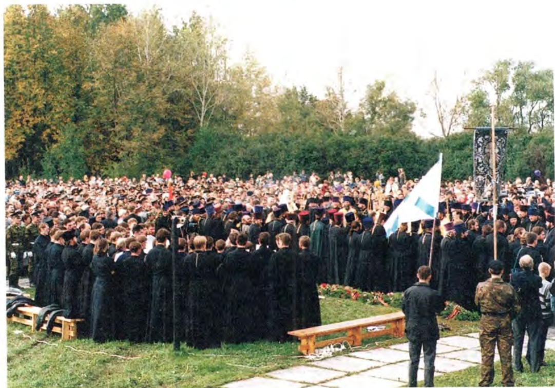
Во время панихиды на поле Куликовом

Для нашей родины очень важно восстановление прерванной цепи, связующей поколения русского народа в еди-