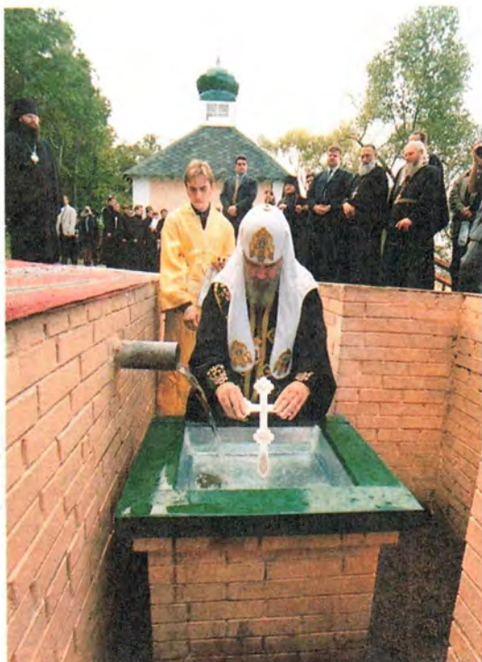
Во время молебна с водоосвящением на Прощеном колодце