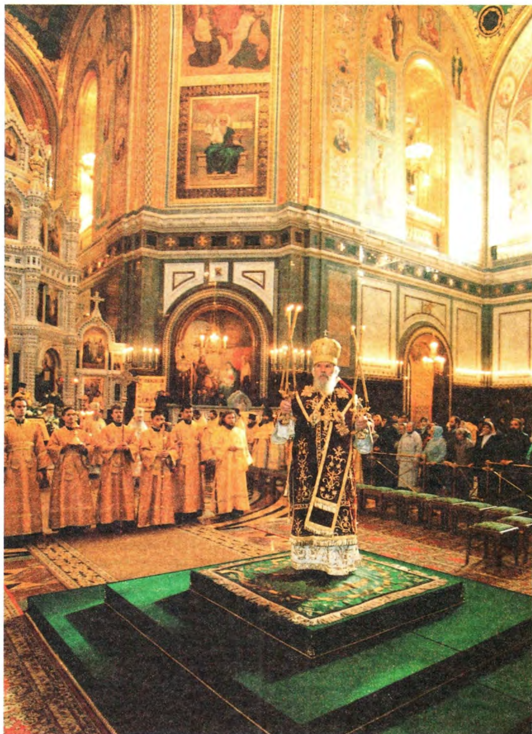
Благословение Первоверховного Патриарха Русской Православной Церкви Храм Христа Спасителя, 3 сентября 2001 года