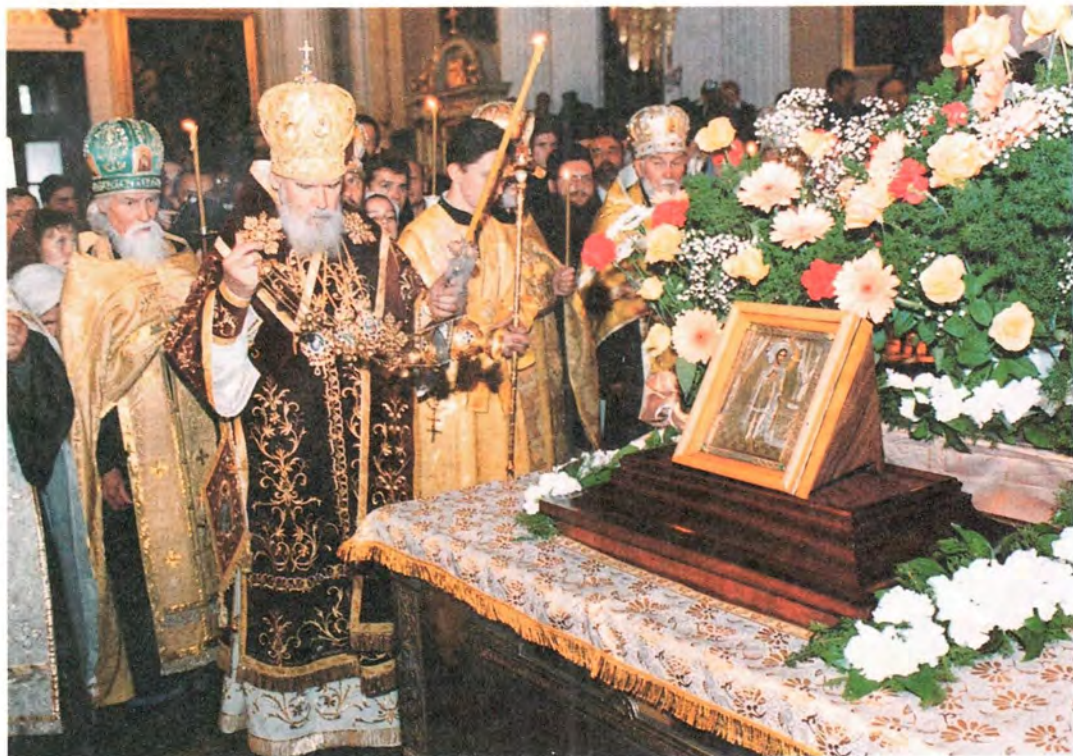
За всеобщим бдением в Троицком соборе Александро-Невской лавры