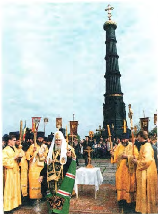
Панихида на Куликовом поле

Кулишках, который поставлен в память воинов, погибших на поле Куликовом. Московский монастырь Рождества Пресвятой Богородицы – также современник Куликовской битвы, он был основан в память этого сражения. То, что к нам возвращается историческая память, что уже в течение девяти лет совершаются панихиды в субботу перед праздником Рождества Пресвятой Богородицы здесь, на поле Куликовом, – это добрый знак, знак возвращения исторической памяти. Молодое поколение должно знать нашу славную историю: она многому научает нас – и главный ее урок в том, что мы должны быть едиными и любить свою родину».