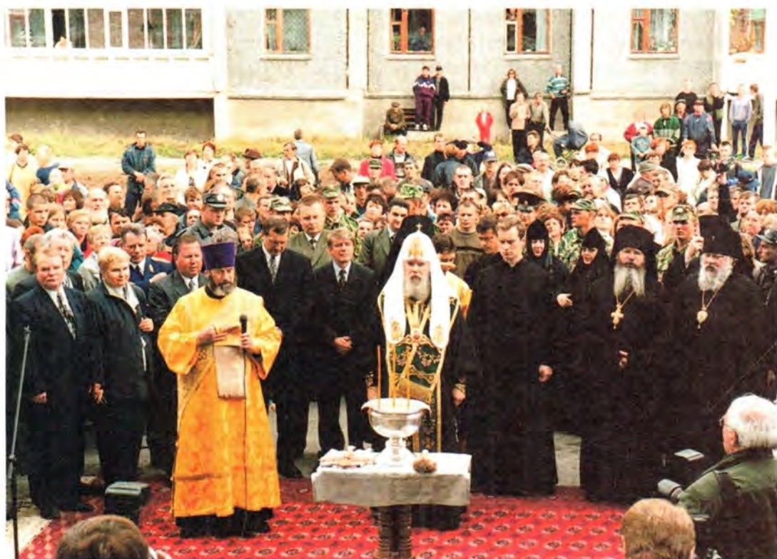
Во время освящения нового дома в Сортавале

Международным фондом единства православных народов. В настоящее время на острове проживают 150 насельников монастыря и около 400 мирян. Программой предусмотрено строительство благоустроенных домов на материке для добровольного переселения валаамцев, проживающих в монастырских постройках.