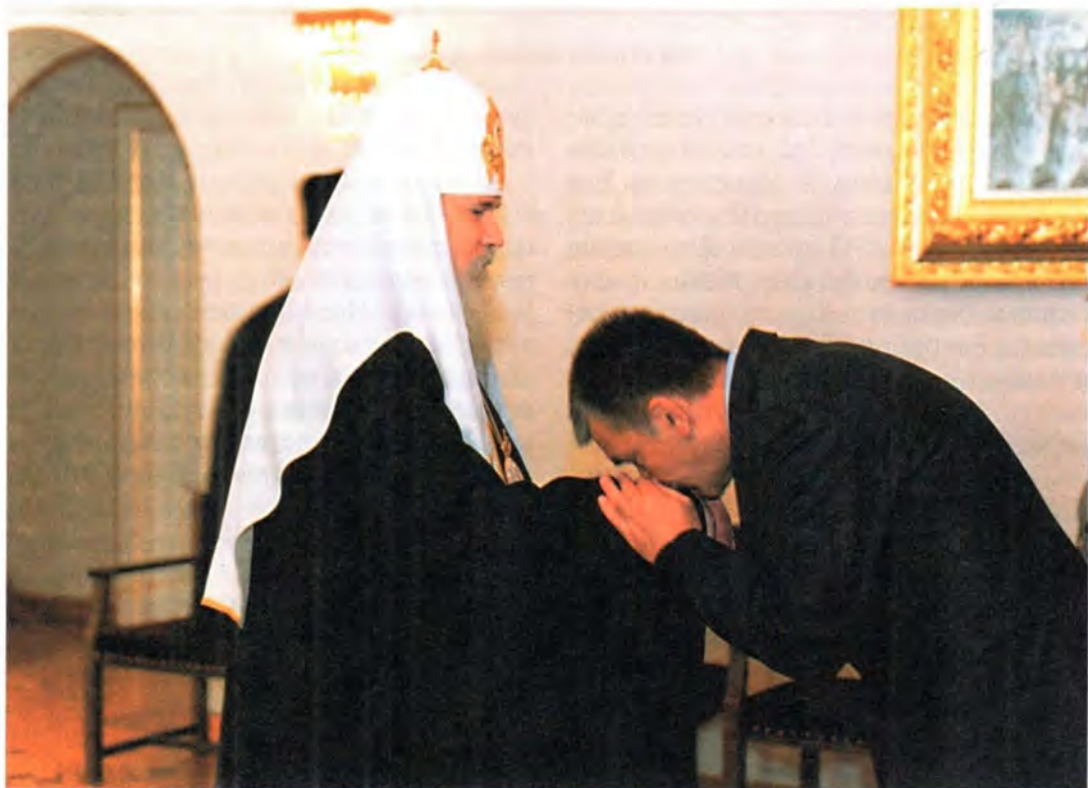
Председатель Правительства СРЮ берет благословение у Святейшего Патриарха Алексия

Традиционно братские отношения двух наших стран, а также Русской и Сербской Православных Церквей снова нашли подтверждение в этой встрече. Сербский народ с большой любовью относится к Святейшему Патриарху Алексию, видя в нем своего молитвенника и зная, что Первосвяtitель