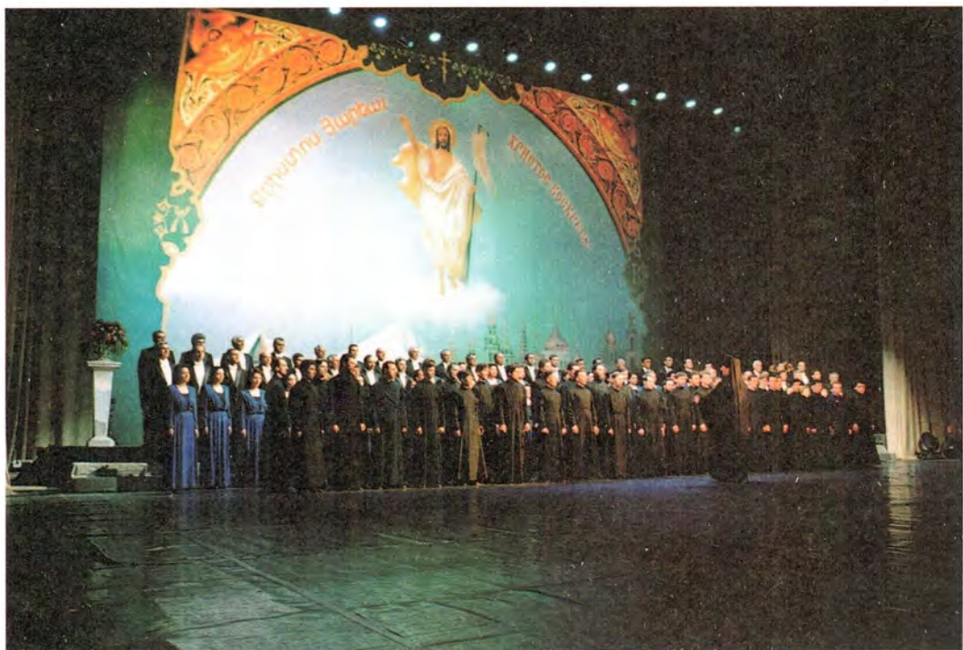
Концерт «Пасха в Кремле»