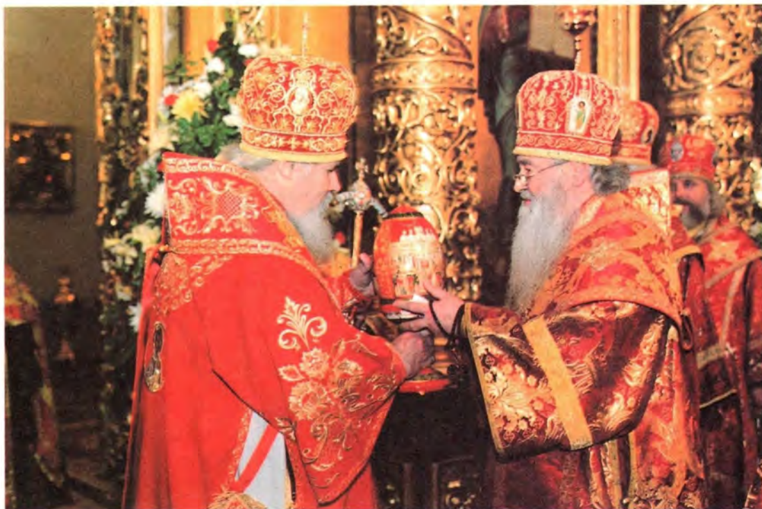
Митрополит Крутицкий и Коломенский Ювеналий преподносит Святейшему Патриарху Алексию пасхальный подарок

великий праздник Пасхи Христовой. Отметив, что отец архимандрит долгое время нес послушание в Русской Духовной Миссии в Иерусалиме, Его Святейшество напомнил о том, что в эти минуты в Храме Гроба Господня в Иерусалиме ожидают схождения Благодатного огня. (Вскоре, к началу пасхальной заутрени, Благодатный огонь будет доставлен в Храм Христа Спасителя на Патриаршее богослужение.)