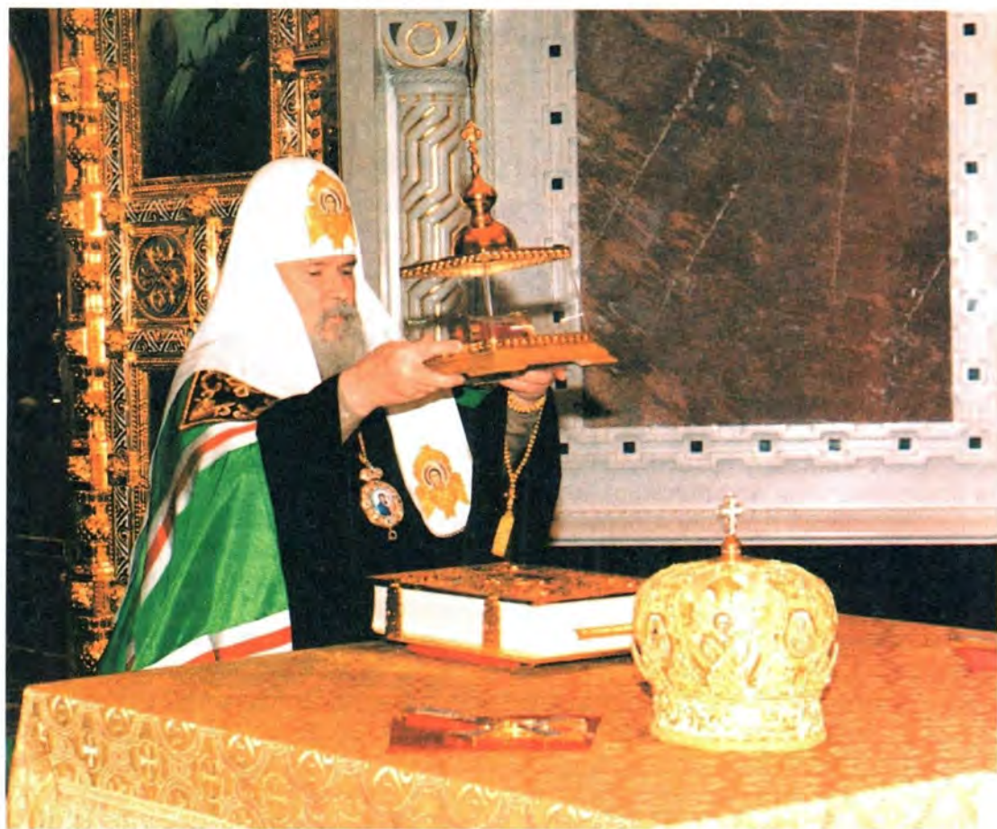
Святейший Патриарх Алексий переносит на престол Храма Христа Спасителя мощи святого Апостола Андрея Первозванного. 3 марта 2001 года

11 марта – Неделя 2-я Великого поста, святителя Григория Паламы.