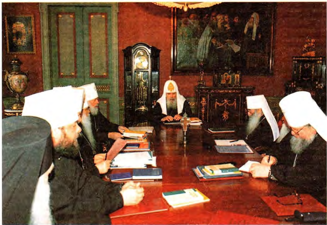
Заседание Священного Синода Русской Православной Церкви 3 апреля 2001 года

Кирилла, Председателя Отдела внешних церковных связей, о результатах заседания Координационного комитета Смешанной комиссии по диалогу Русской Православной Церкви с Ближневосточными Ориентальными Церквями, состоявшегося в Москве 20–21 марта 2001 года.