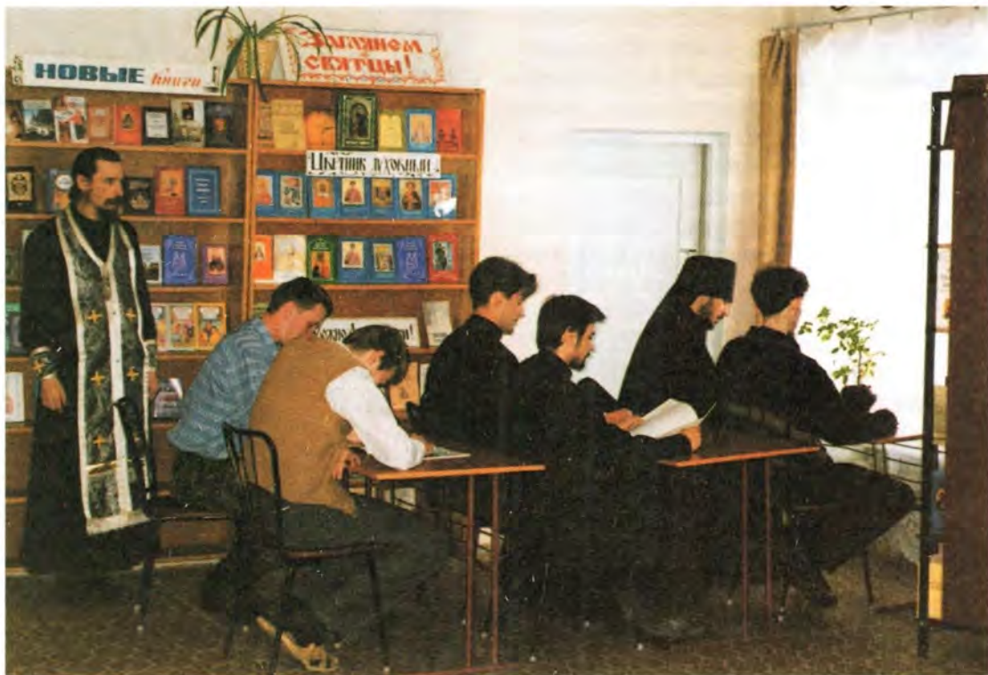
В библиотеке Ивановского Духовного училища

Божией Матери, а также в других городах епархии.