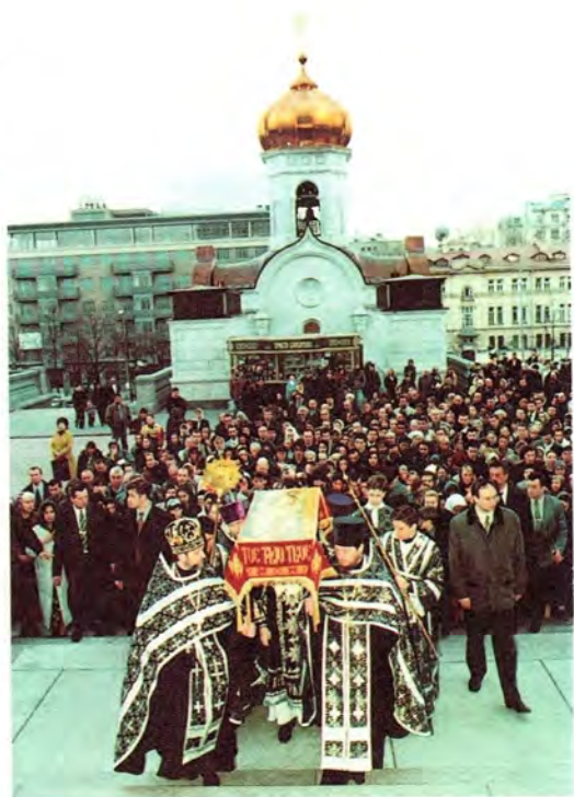
Крестный ход со Святой Плащаницей

Все богослужения сопровождалось Словом Первосвященителя, обращенным к верующим. В Великую Пятницу Святейший Патриарх выразил надежду на то, что «пройдя длинный путь подготовки к святым и спасительным дням Страстной седмицы, в течение которого Церковь своими богослужениями и молитвами научала нас строить свою жизнь во всем полагаясь на волю Божию, каждый извлек спасительные для себя уроки и к этим святым дням подошел