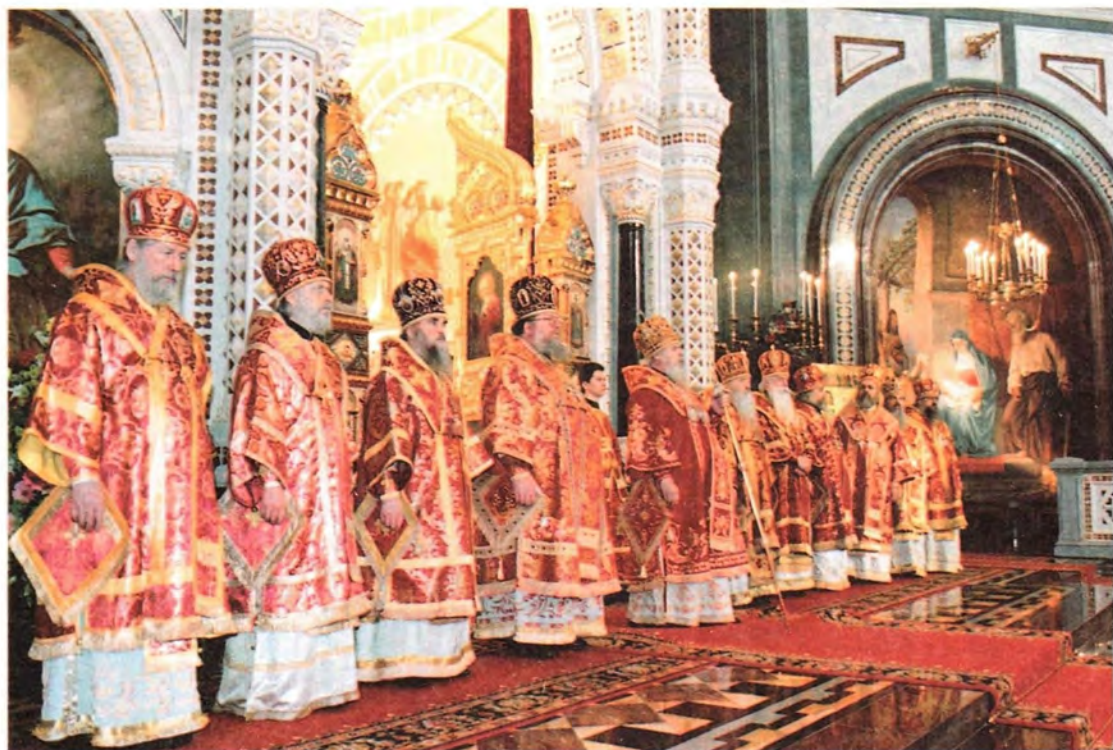
Светлое Христово Воскресение в Храме Христа Спасителя.