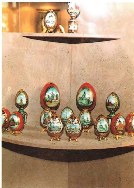
Экспонаты выставки в Историческом музее Пасхальные яйца и лицевое шитье

папье-маше, дерева, серебра, стекла, бисера. Уникальным памятником и своеобразной святыней собрания является деревянное пасхальное яйцо с образом преподобного Серафима Саровского, датированное примерно 1903 годом. Из фарфоровых пасхальных яиц большая часть изготовлена на Императорском фарфоровом заводе в Санкт-Петербурге. Среди них – пять с вензелями Императрицы Марии Феодоровны, Императора Николая II, Императрицы Александры Феодоровны и Цесаревича Алексея Николаевича. Современная часть коллекции Его Святейшества относится в основном к последним десяти годам. Несколько редких экземпляров начала 80-х годов XX века были изготовлены для Патриарха Пимена. Разнообразие и количество пасхальных яиц в собрании Святейшего Патриарха – свидетельство возрождения традиции, которая складывалась на протяжении нескольких веков. Небольшая