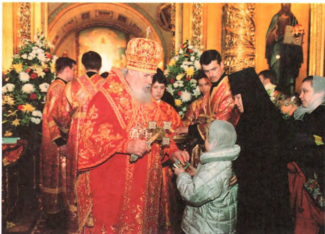
Поздравление Святейшего Патриарха с Пасхой Христовой. Богоявленский собор

Во время крестного хода в Светлый понедельник. Успенский собор Московского Кремля