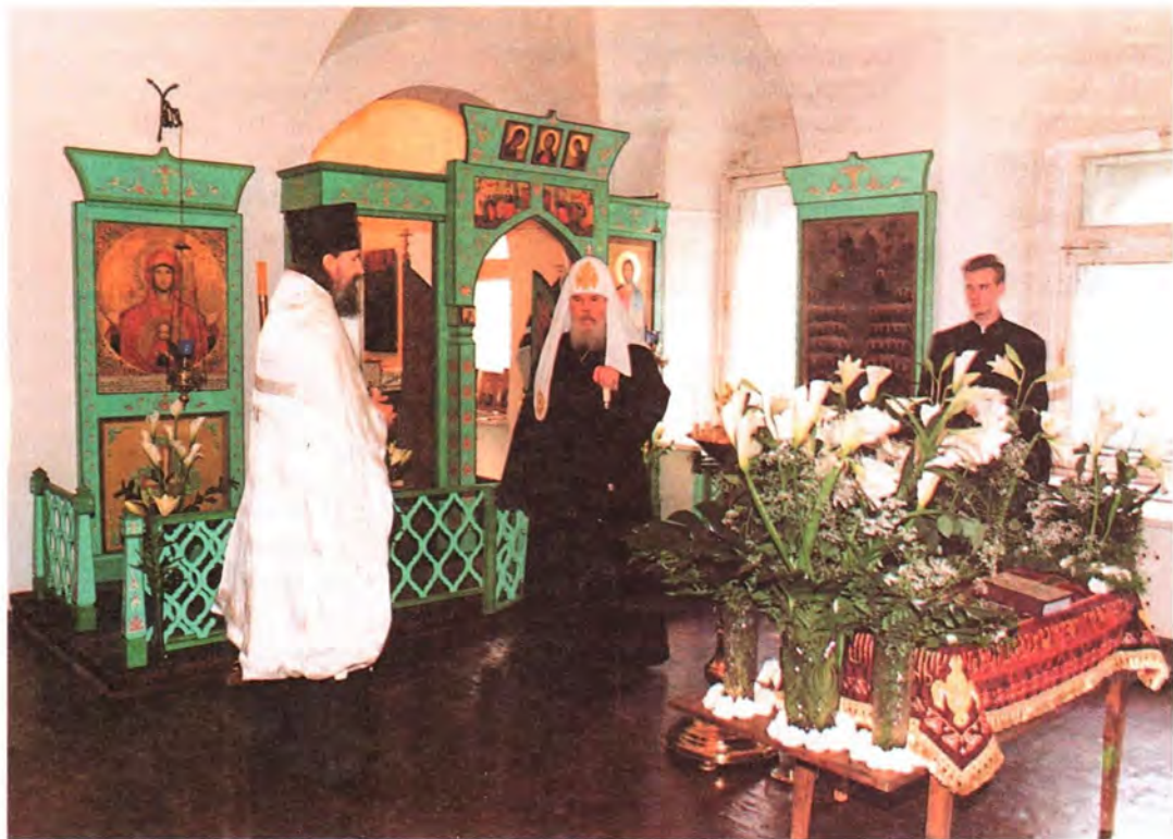
Во время посещения Святейшим Патриархом Алексием московских храмов в Великую Субботу

подготовленным, проверив свою совесть и принеся Господу покаяние в совершенных прегрешениях».