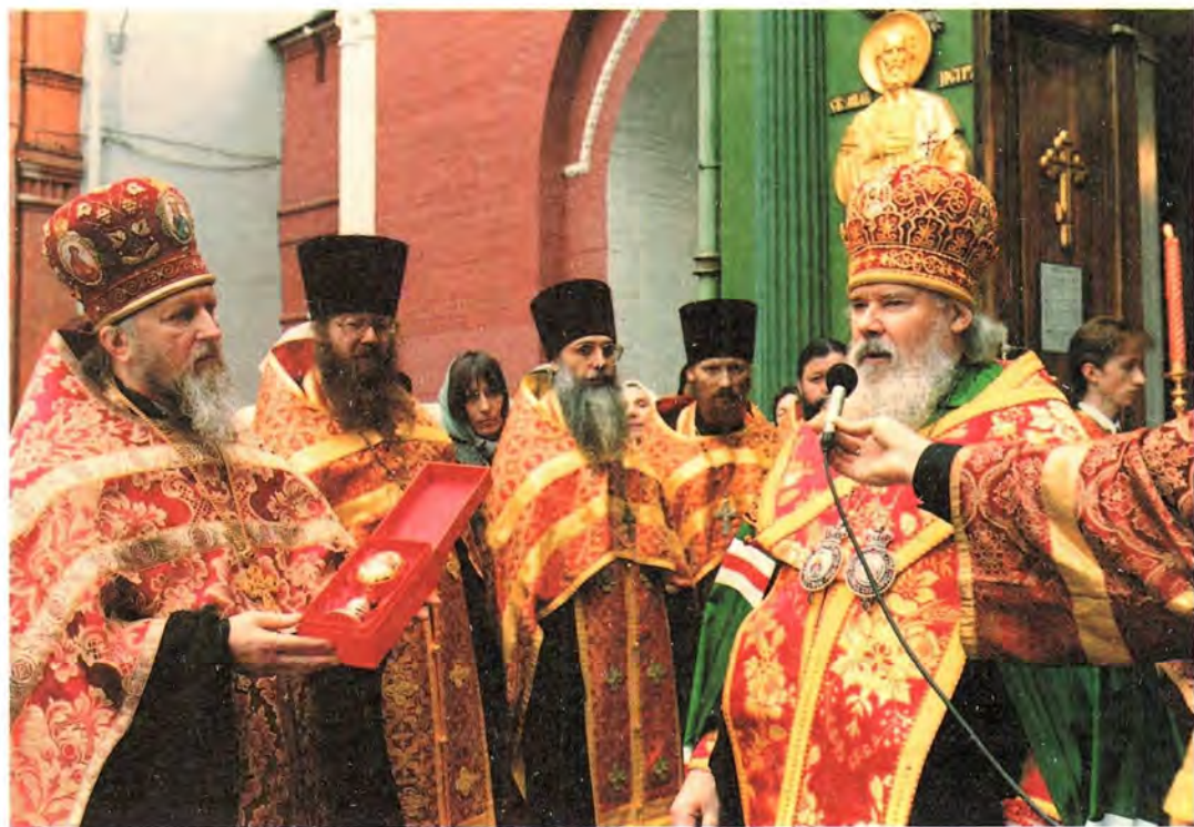
Слово Святейшего Патриарха после молебна у Иверской часовни. 17 апреля 2001 года

Краткий отдых перед ночным богослужением – и снова открываются двери Храма Христа Спасителя, православная паства приветствует своего Первосвященителя. Начинается полунощница: звучит дивный канон «Волною морскою...» – и вот торжественный крестный ход выходит из нового кафедрального собора. Впервые пасхальное богослужение совершается в возрожденной московской святыне и происходит это в первый год нового века и нового тысячелетия. Пишется новая летопись Храма Христа Спасителя, и надеемся, что милостью Божией его история теперь будет светлой и радостной и многие поколения москвичей вырастут рядом с этим прекрасным храмом, под сенью его святых стен, под его духовной защитой.