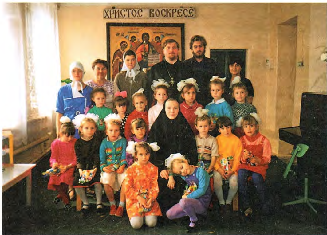
Воспитанницы детского приюта при Никольском женском монастыре в Приволжье

гимназии обучается около двадцати. Здесь они также получают так необходимую им заботу и поддержку.