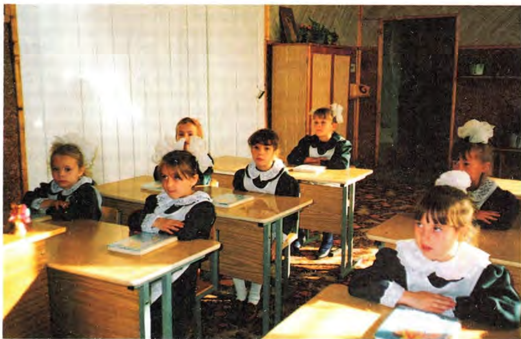
В детской православной гимназии при Никольском женском монастыре в Приволжье

К концу 1998 года не менее тесное сотрудничество наладилось у епархии и с Ивановским государственным университетом. В стенах этого главного вуза Ивановской области неоднократно проходили занятия с учащимися Ивановских епархиальных пастырско-богословских курсов, различные богословские