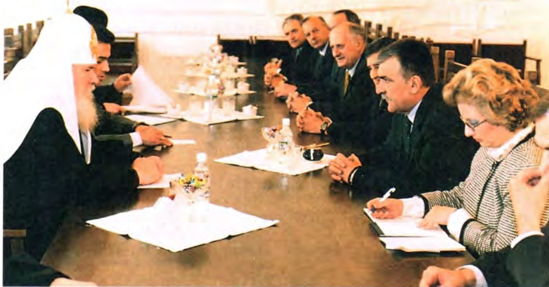
За столом переговоров

Русской Церкви всегда выступает в защиту православных братьев. Многочисленные воззвания и обращения Его Святейшества по поводу незаконной агрессии стран НАТО против Югославии, его протесты против разрушения православных святынь в Косове, наконец, поездка в Белград на Радоницу 1999 года, в период натовских бомбардировок, — все это хорошо известно югославам и бережно хранится в их сердцах.