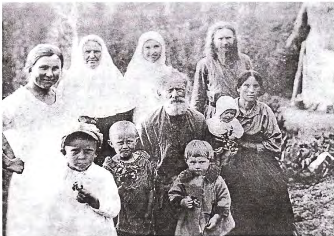
В скиту на Мохнатой сопке