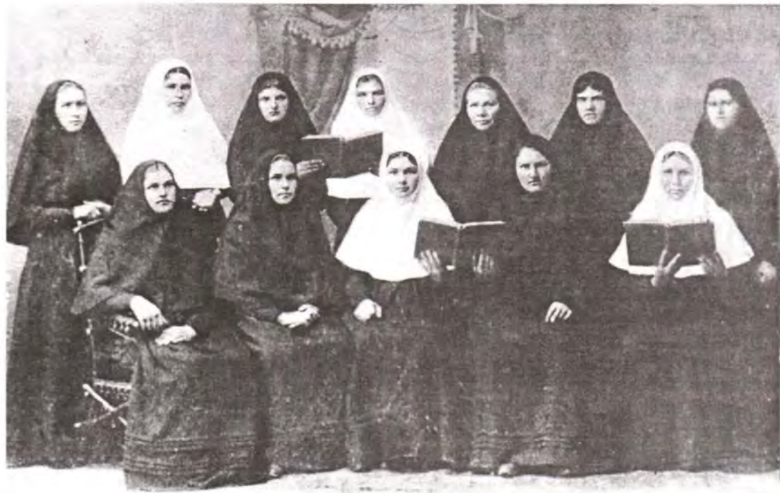
Насельницы Иверско-Серафимовского Верненского монастыря

И разглаживались жестокие лица, и смирялись жестокие сердца, и люди, загнанные жизнью в угол, изголодавшиеся по доброму человеческому слову, тесно сидя в кругу, жадно слушали живительную речь и одухотворялись животворящим словом Божиим.