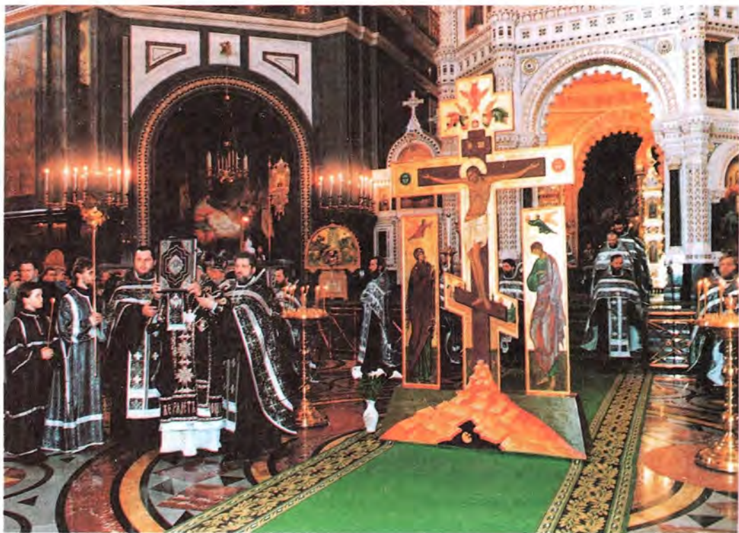
Вечернее богослужение в Великий Четверг в Храме Христа Спасителя

Нынешняя Пасха для Москвы была и похожей, и непохожей на предыдущие. Новым было то, что впервые главная пасхальная служба совершалась в возрожденном Храме Христа Спасителя, освященном в прошлом году и занявшем подобающее ему место кафедрального собора Первопрестольной. Все богослужения Страстной седмицы