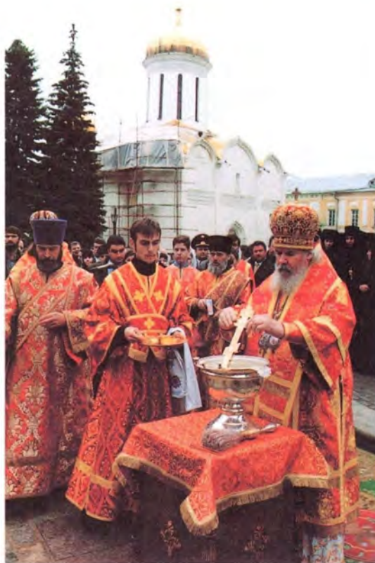
Освящение воды в день празднования в честь иконы Божией Матери «Живоносный Источник». Троице-Сергиева Лавра

Обращаясь к духовенству храмов, Его Святейшество просил передать всем, кто придет на праздничное пасхальное богослужение, его благословение и поздравления со Светлым Христовым Воскресением.