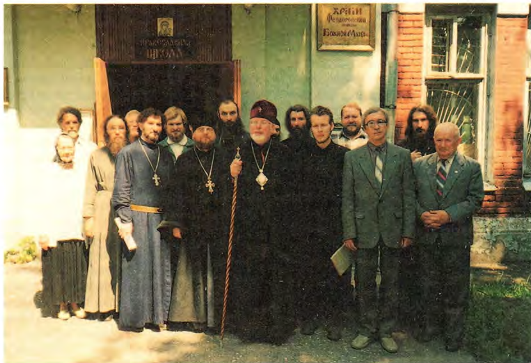
Третий выпуск Ивановских пастырско-богословских курсов. 1997 год

В данный момент Ивановская епархия в церковной издательской деятельности является одной из первых в Русской Православной Церкви (после Московской и Петербургской). Если собственные газеты имеются практически во всех епархиях, то журналы