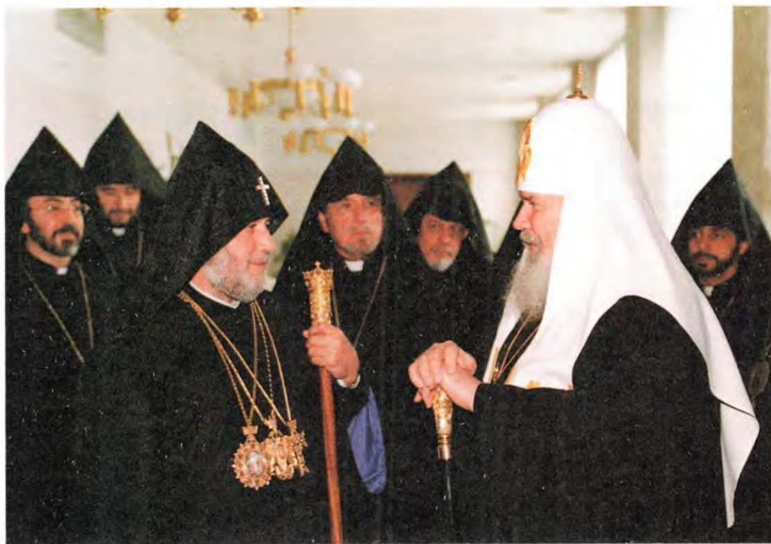
Предстоятель Русской Церкви приветствует Католикоса всех армян Гарегина II

коллекция лицевого шитья дает представление о возрождении традиционного русского художественного ремесла в конце XX века. Труды первых дарителей ценны не менее даров изощренных в своем деле мастериц, чьи работы по техническому и художественному уровню приближаются к памятникам русского средневекового шитья.