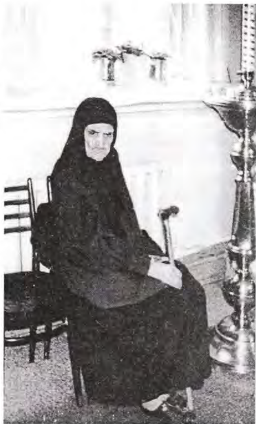
В Никольском соборе Алма-Аты. 1991 год

Прокручивая кинолентку своей памяти, я вижу этот спасенный дом Ноевым ковчегом и отца с дочерьми, спасшихся от гнева Божия своей праведностью, подобно Лотовому семейству. И стоит этот дом как символ пламенной веры, надежды, упования, любви и молитвы