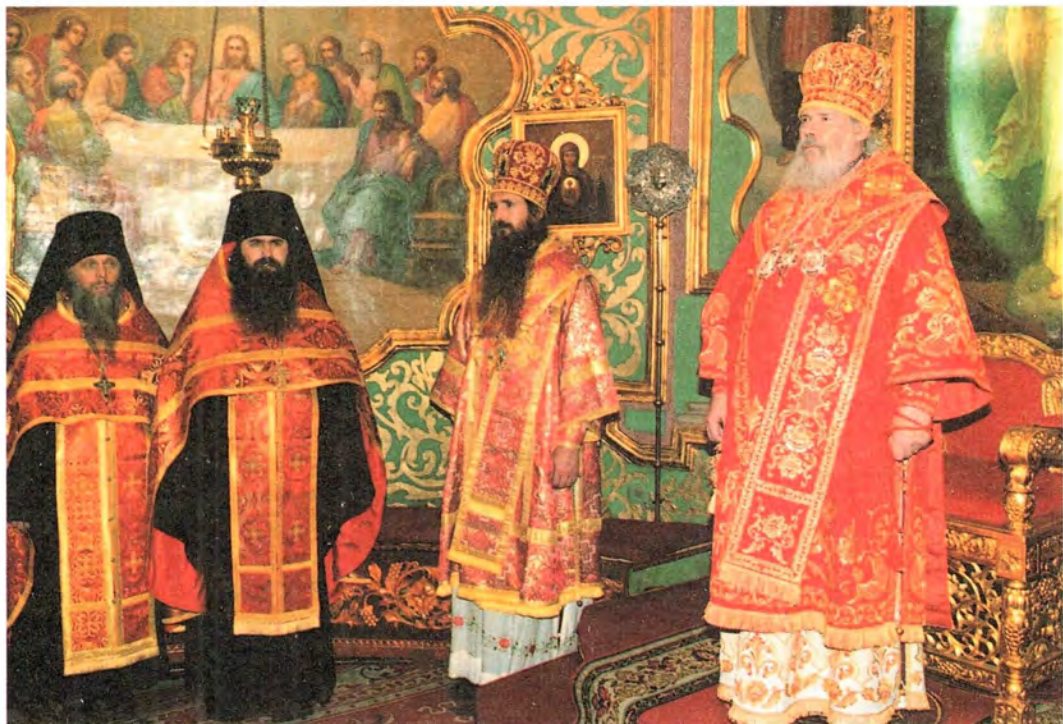
За пасхальной вечерней в трапезном храме Троице-Сергиевой Лавры. 19 апреля 2001 года