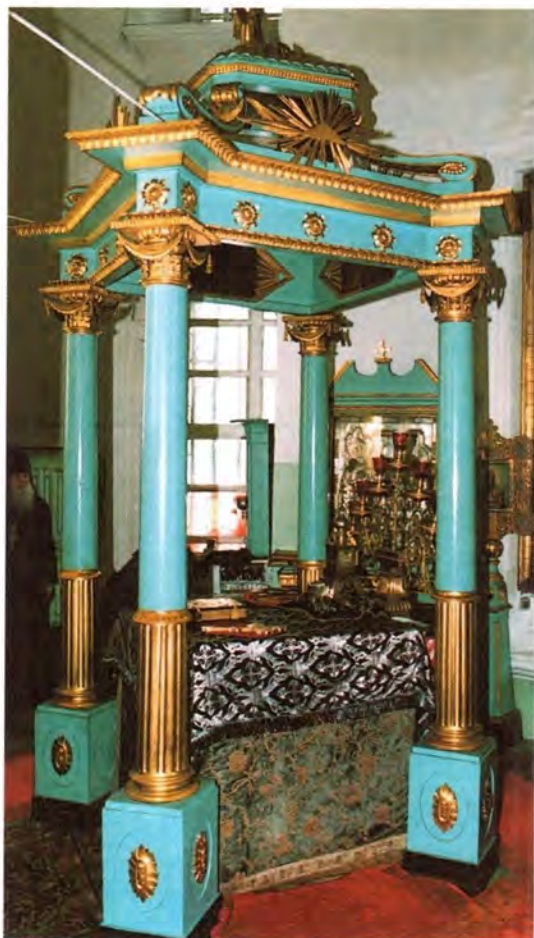
Престол, под которым хранилась глава Преподобного Сергия