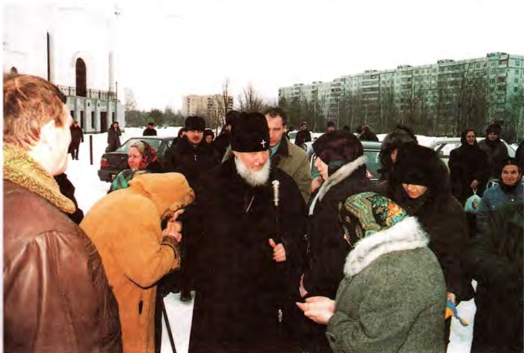
Митрополит Смоленский и Калининградский Кирилл с жителями Смоленска

Смоленская епархия – одна из древнейших в Русской Православной Церкви. Об этом свидетельствуют храмы XII века во имя святых первоверховных Апостолов Петра и Павла и во имя Архангела Михаила. Участники торжеств молились в этих древних храмах, после чего посетили Смоленскую Духовную семинарию, Межъепархиальное Духовное