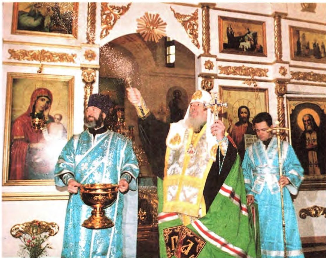
Освящение храма в честь иконы Божией Матери «Утоли моя печали» в Марьине