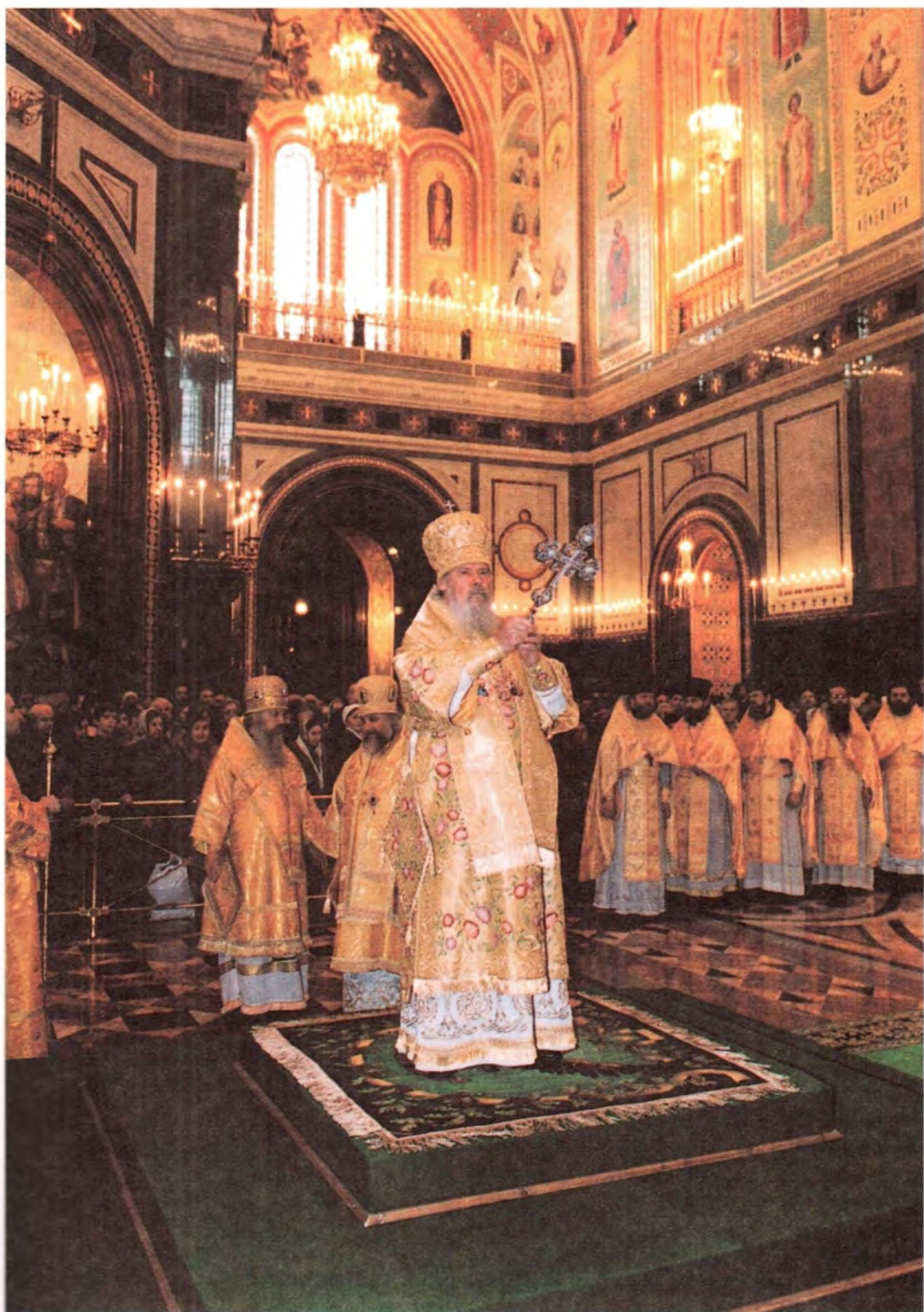
Всенощное бдение в Храме Христа Спасителя