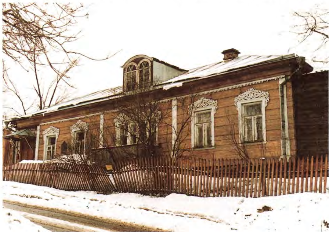
Дом священника Павла Флоренского в Сергиевом Посаде

но мощей Преподобного Сергия». Записка написана почерком Ю. А. Олсуфьева и не датирована, но из самих вопросов явно, что они составлены после вскрытия мощей 11 апреля 1919 года.