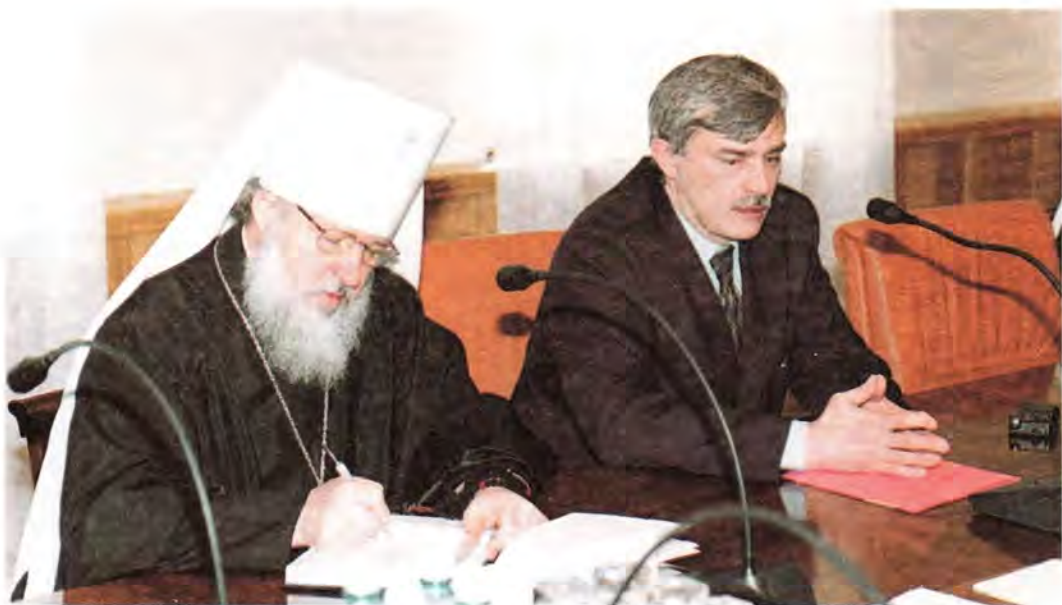
Полномочный представитель Президента РФ по Центральному федеральному округу Г. С. Полтавченко и митрополит Смоленский и Калининградский Кирилл

туризм, помогая изучению нашими гражданами истории Государства Российского. «Наш округ – это сердце России, – подчеркнул Г. С. Полтавченко, – поэтому для нас особенно важно опираться на историческую память».