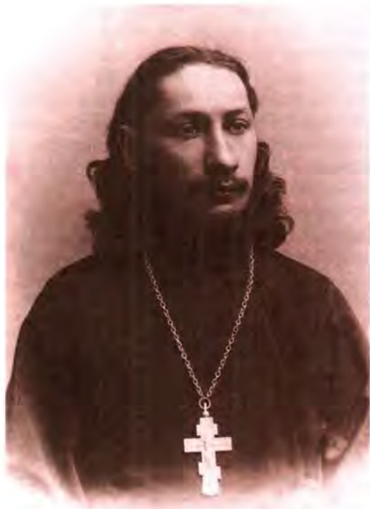
Священник Павел Флоренский. 1912 год

Преподобного Сергия и ее дальнейшем местонахождении.