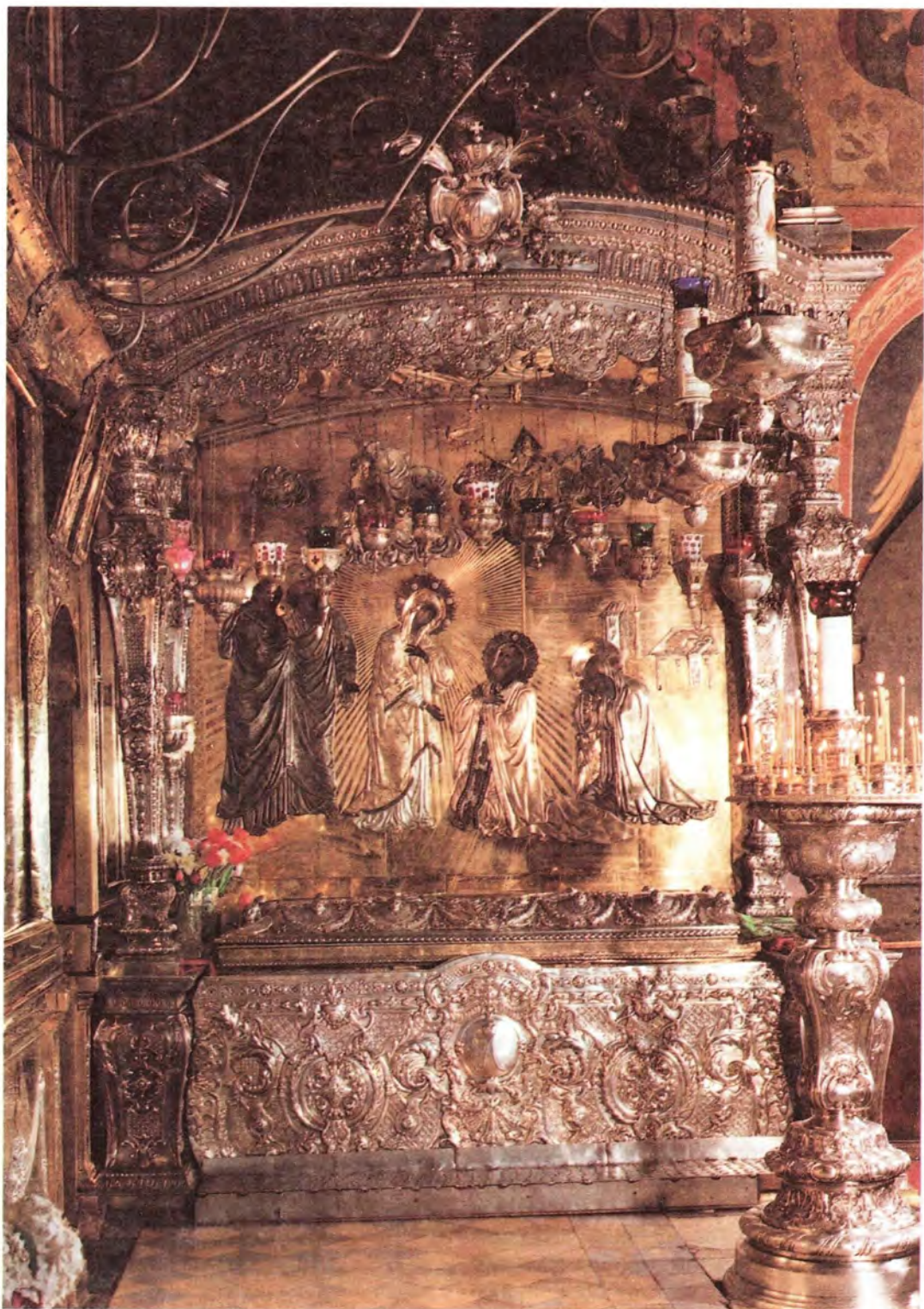
Рака с мощами Преподобного Сергия Радонежского в Троицком соборе