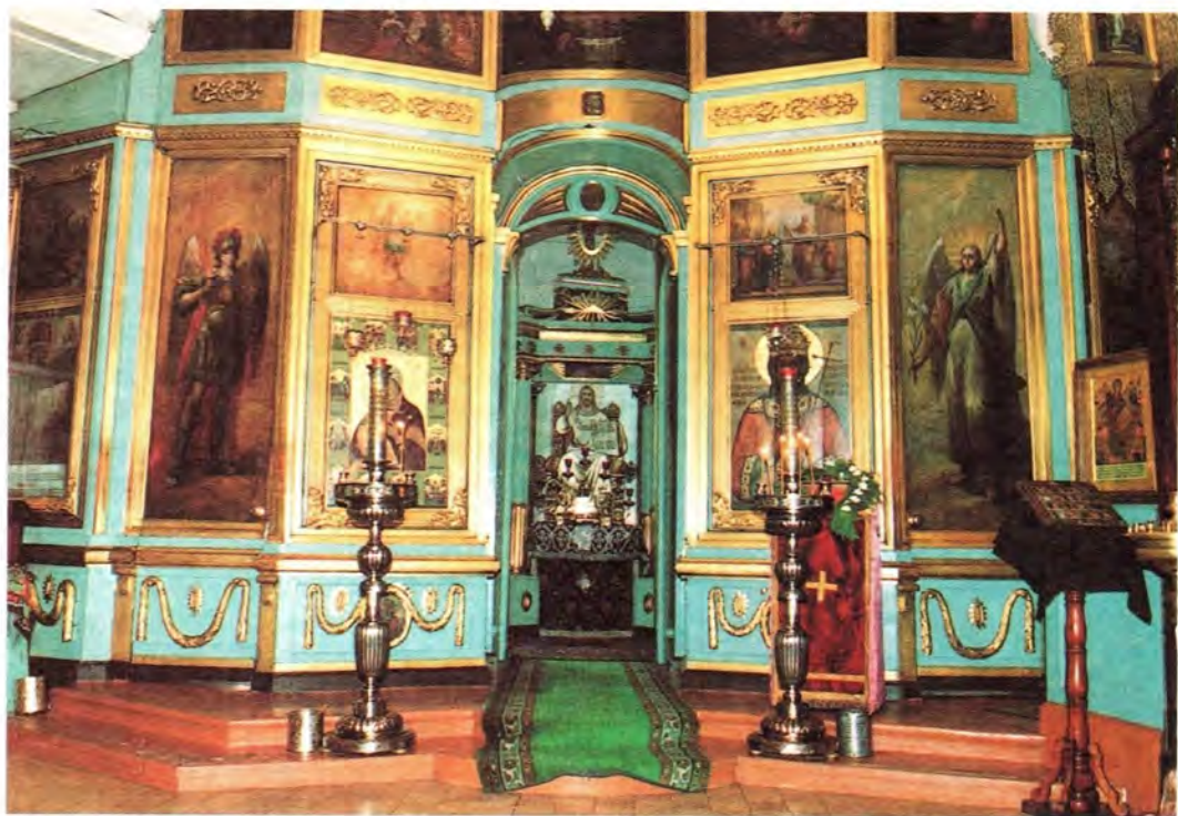
Иконостас Владимирского храма в селе Виноградово

Е. В.: «Были, но я сейчас, честно сказать, не помню. Не были записаны. Постоянно были. Ярких не было, но проявления были. Ну, я была больна чахоткой 16 лет, и выздоровела. Потом масло. Были [чудеса], но записывать