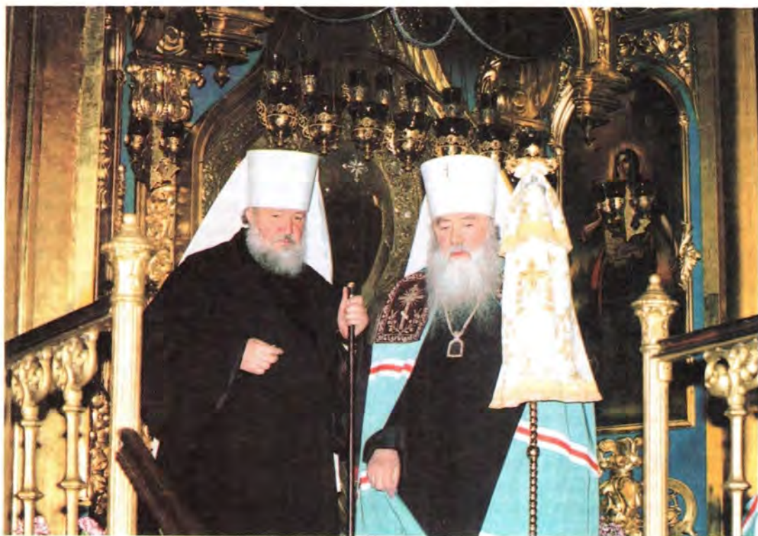
Митрополит Смоленский и Калининградский Кирилл с митрополитом Крутицким и Коломенским Ювеналием

училище, православные гимназии и детский сад, Епархиальное управление, строящийся в одном из густонаселенных районов города храм во имя новомучеников и исповедников Российских. Священнослужители и прихожане храмов, учащие и учащиеся Духовных школ, сотрудники епархиальных учреждений, жители Смоленска тепло приветствовали Преосвященных архипастырей, обсуждали возрождение церковной жизни в Смоленске. Воспитанники православного детского сада подарили митрополиту Кириллу свои рисунки.