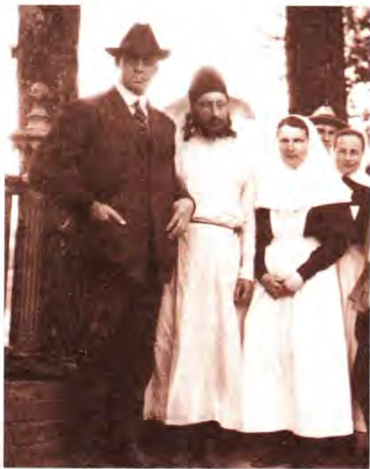
Священник Павел Флоренский показывает Троице-Сергиеву Лавру представителю АРА м-ру Кольтону. 14 мая 1923 года

дашние события, колебалась, было ли изъятие главы Преподобного Сергия до вскрытия его мощей 11 апреля 1919 года или после. В беседе со мной на Пасху 1990 года она также не решалась определенно назвать дату, но особенно подчеркивала, что изъятие главы Преподобного Сергия было совершено по благословению Патриарха Тихона.