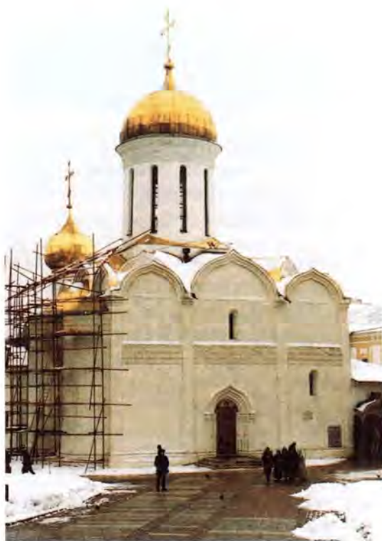
Троицкий собор в Троице-Сергиевой Лавре