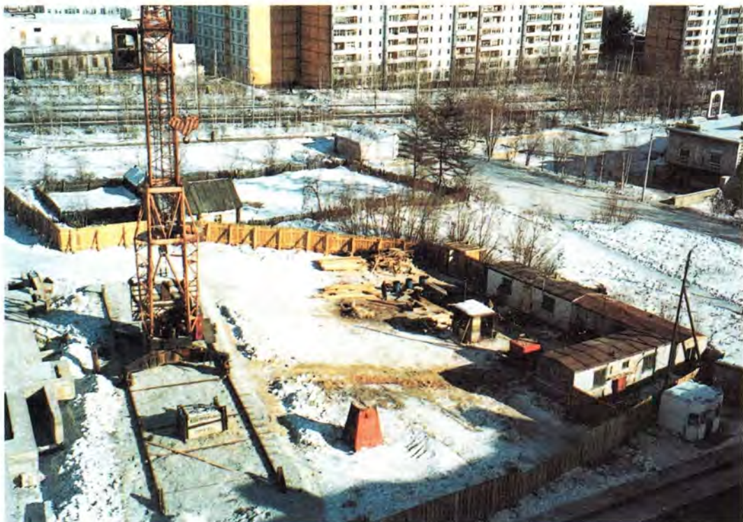
Строительная площадка и фундамент храма во имя Святой Троицы в городе Тында Амурской области. Март 2001 года

директора Балтийской компании о строительстве часовни на железнодорожной ветке Улукан-Эльга. Епископ обещал дать ответ на это предложение по возвращении, на обратном пути из Февральска.