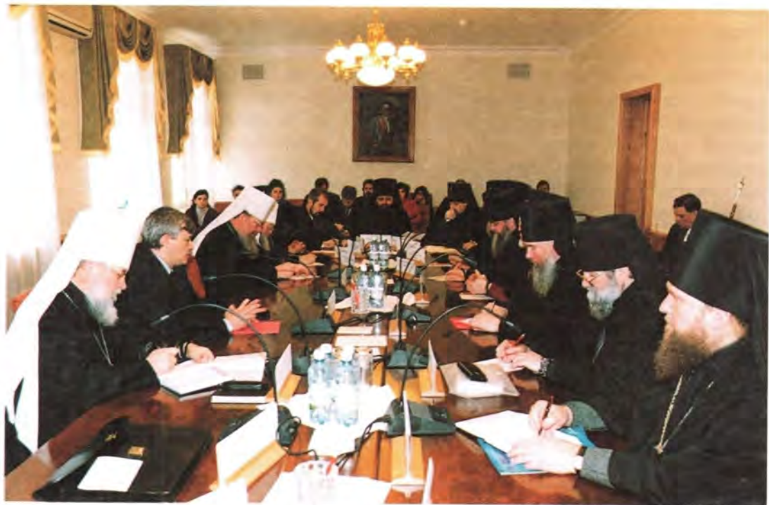
Во время заседания в Администрации Президента РФ

было бы координировать деятельность епархий, расположенных в Центральном федеральном округе, и местных властей. Владыка Иоанн привел некоторые данные: на 1 января 2001 года в России существовало 1300 сайтов по религиозной тематике, из них православных – 90. Для сравнения можно указать, что существует 82 сайта по оккультизму и 134 – по магии. Надо развивать это перспективное, особенно в молодежной среде, направление информационной деятельности, подчеркнул архиепископ Иоанн, и конечно здесь не обойтись без государственной поддержки.