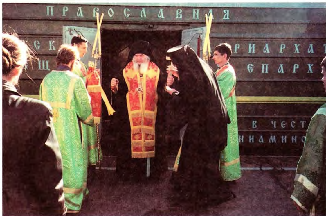
Храм-вагон в честь святителя Московского Иннокентия