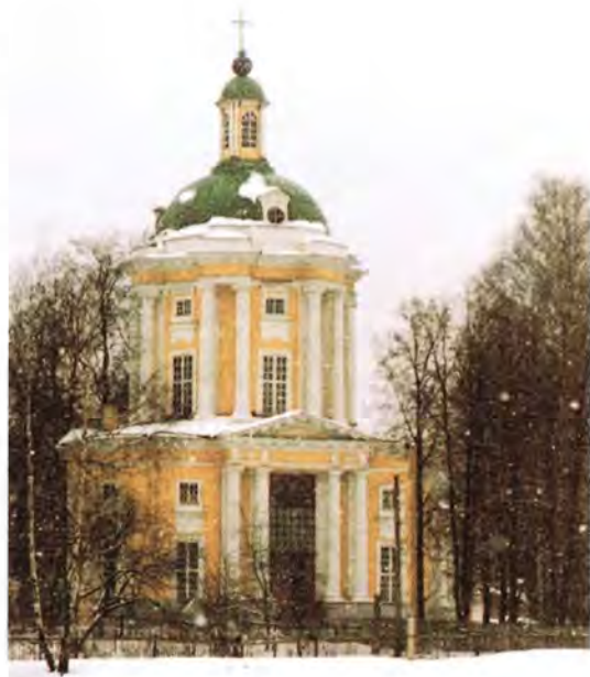
Храм в честь Владимирской иконы Божией Матери в селе Виноградово