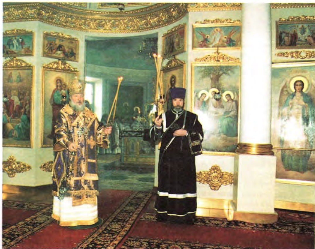
Митрополит Смоленский и Калининградский Кирилл за Божественной литургией в Троицком соборе Свято-Данилова монастыря

Празднование 25-летия архипастырского служения митрополита Кирилла продолжилось в Успенском кафедральном соборе, где вечером собор архиереев и духовенства совершил всенощное бдение, а на следующий день, в воскресенье, 11 марта, – Божественную