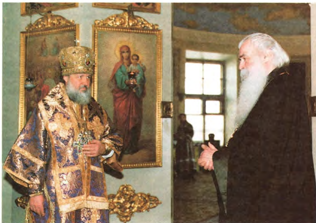
Митрополита Смоленского и Калининградского Кирилла поздравляет митрополит Волоколамский и Юрьевский Питирим Троицкий собор Свято-Данилова монастыря

литургию. Затем со словами поздравления к митрополиту Кириллу обратился митрополит Крутицкий и Коломенский Ювеналий. В ответном слове митрополит Кирилл возблагодарил Господа и всех, кто своими молитвами и трудом помогает ему осуществлять служение Церкви. Своего правящего архиерея поздравили священнослужители и миряне Смоленской епархии, представители государственных и общественных структур, руководители предприятий, военачальники, деятели науки и культуры.