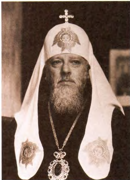
Святейший Патриарх Алексий I

малое освящение престола в [Успенском] соборе и по окроплении собора святой водой началась вечерня. Пришел старец схиархимандрит Иларион (Удодов), вдвоем с отцом Гурием они выносили Плащаницу. В шесть часов вечера началась утренняя по чину Великой Субботы, с обнесением Плащаницы вокруг собора. Служили отец Гурий и отец Иларион <...>