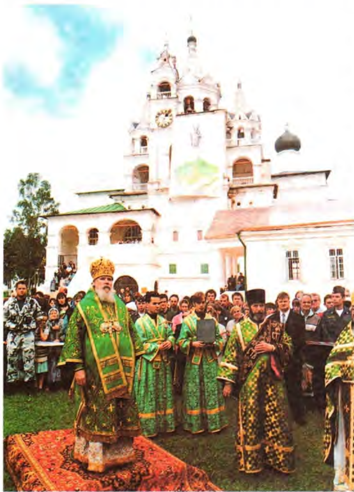
Во время крестного хода

Пользователем всех сооружений на территории Саввино-Сторожевской обители был Звенигородский историко-архитектурный музей. Однако на сегодняшний день все это передано в бессрочное пользование Русской Православной Церкви. Пока в совместном пользовании с музеем у нас находится главный храм Рождества Пресвятой Богородицы, где почивают святые мощи преподобного Саввы. Я на-