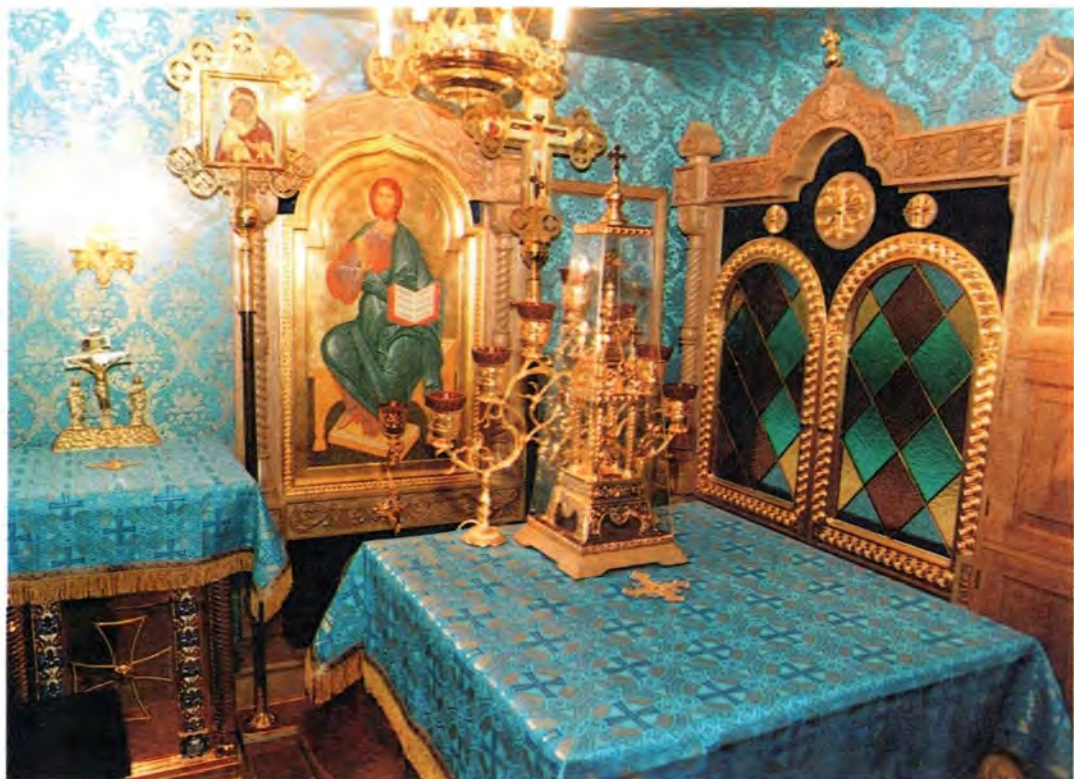
В алтаре храма-вагона

ским или скорым, но чаще всего нам давался отдельный локомотив. Наш маршрут пролегал на Коношу – это юг Архангельской области. В этих местах сегодня практически нет храмов. Вокруг на многие километры – леса и брошенные леспромхозы. Железная дорога является здесь единственной нитью, связующей с Большой землей.