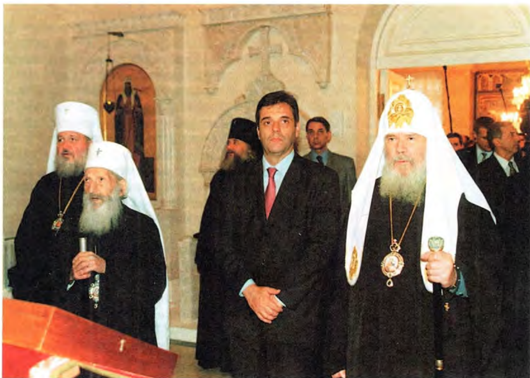
В домовом храме Патриаршей резиденции в Свято-Даниловом монастыре

распада бывшего Советского Союза мы знаем, какими человеческими трагедиями и гуманитарными проблемами оборачивается дезинтеграция прежде единого государства. Аналогичный опыт, как мы знаем, связан и с разрушением Союзной Федеративной Республики Югославии», – сказал Святейший Патриарх Алексий.