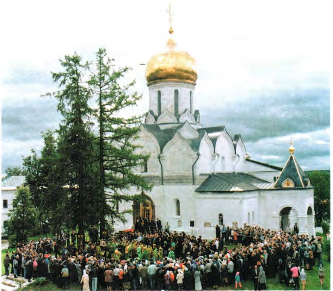
В день праздника в Саввино-Сторожевском монастыре

что, когда порушенные храмы, обители, святыни возвращаются Церкви, происходит их духовное возрождение. То, что создавалось и строилось во славу Божию, должно принадлежать Богу». Первосвященитель Русской Церкви отметил труды наместника архимандрита Феоктиста и братии обители, которые возрождают эту порушенную святыню. «Первый раз я посетил Саввино-Сторожевский монастырь в 1974 году, – отметил Его Святейшество. – Тогда он произвел на меня очень тяжелое впечатление: в трапезной в качестве экспоната демонстрировался кусок колокола, пожертвованного монастырем царем Алексеем Михай-