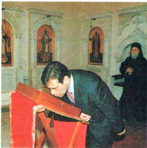
Президент Югославии В. Коштуница

После прекращения бомбардировок Югославии Русская Церковь продолжала выражать озабоченность развитием ситуации в Косове и прилагала все необходимые усилия для достижения справедли-