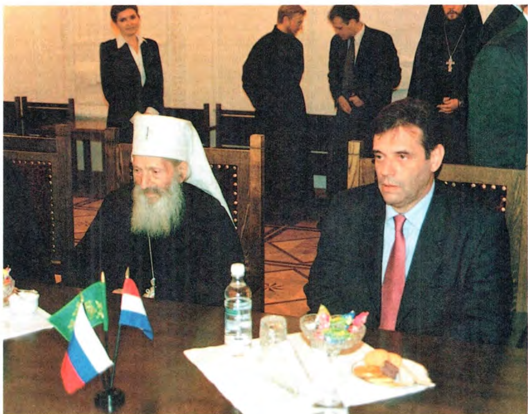
Патриарх Сербский Павел и Президент Югославии во время переговоров