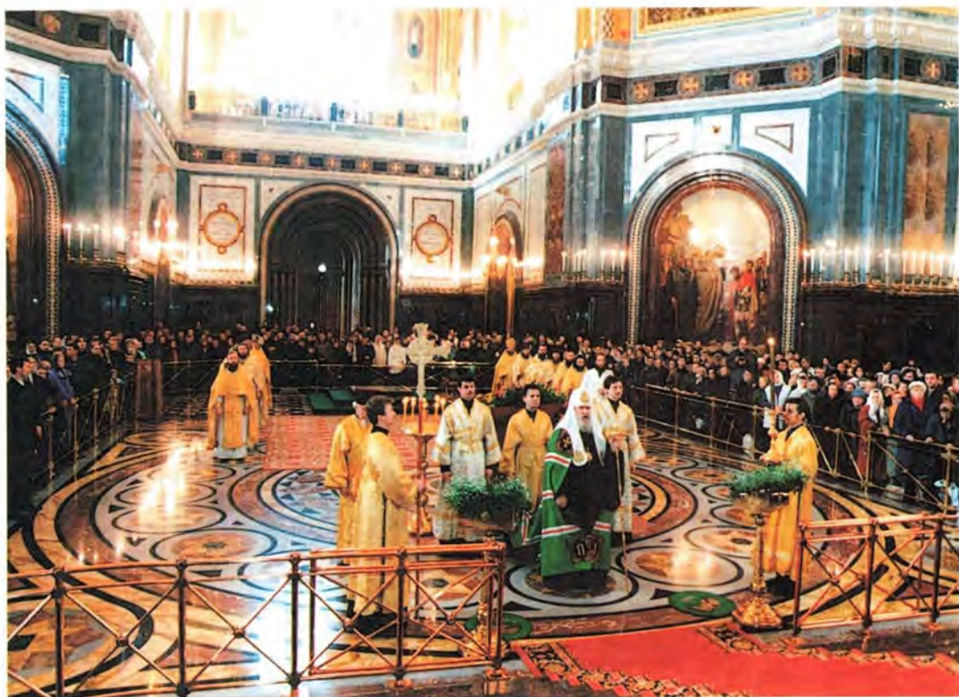
Божественная литургия в Храме Христа Спасителя. 29 октября 2000 года