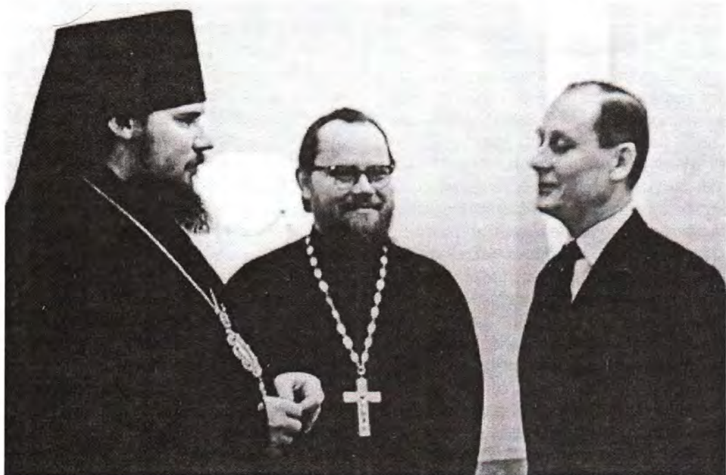
Отец Матфей Стаднюк с епископом Таллинским и Эстонским Алексием