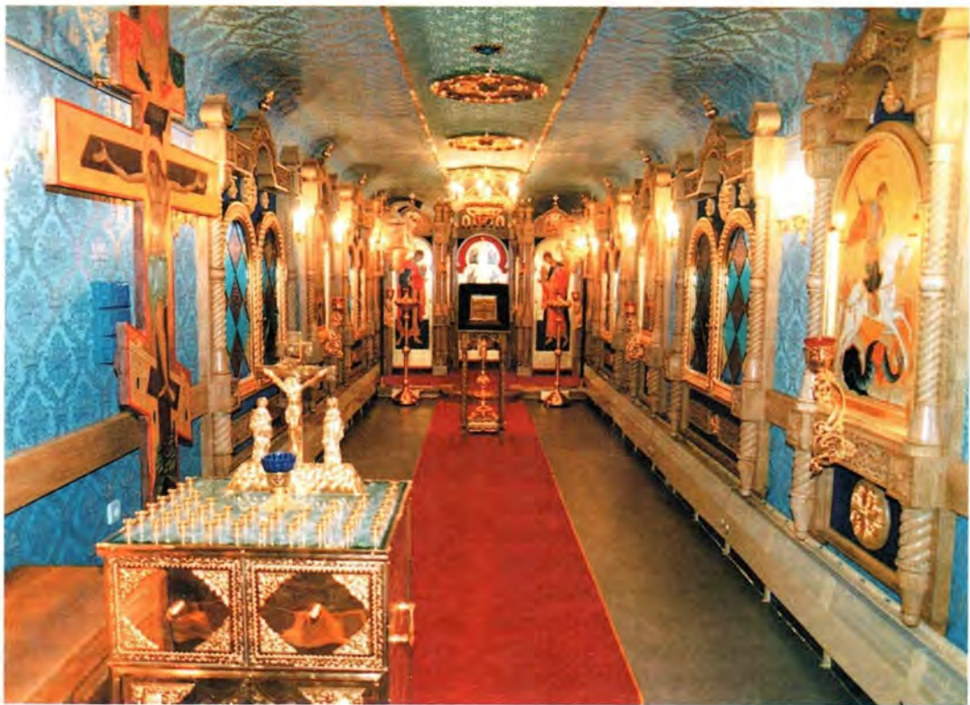
Интерьер церкви «на колесах»

В Архангельской области сильны позиции сектантов, которые очень активно обращают часть нашего не очень образованного в вопросах веры русского народа. Наш приезд нанес им весьма ощутимый удар. В трех поселках, которые мы посетили, уже организуются православные общины, и наш приезд для верующих местных жителей оказался очень большим подспорьем. В остальных местах люди, вероятно, впервые воочию увидели красоту и силу Православия. Может быть, принимав-