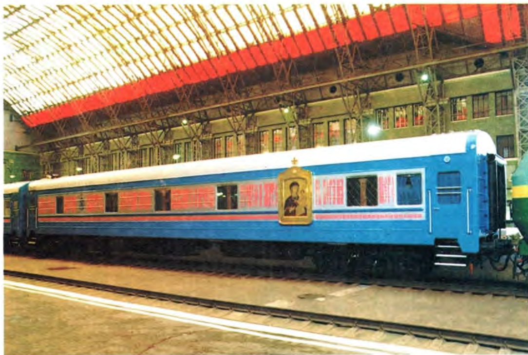
Храм-вагон на Киевском вокзале

18 октября 2000 года на Киевском вокзале столицы Святейший Патриарх Московский и всея Руси Алексий в присутствии министра путей сообщения Н. А. Аксененко освятил передвижной храм. В напутственном Слове Его Святейшество пожелал, чтобы