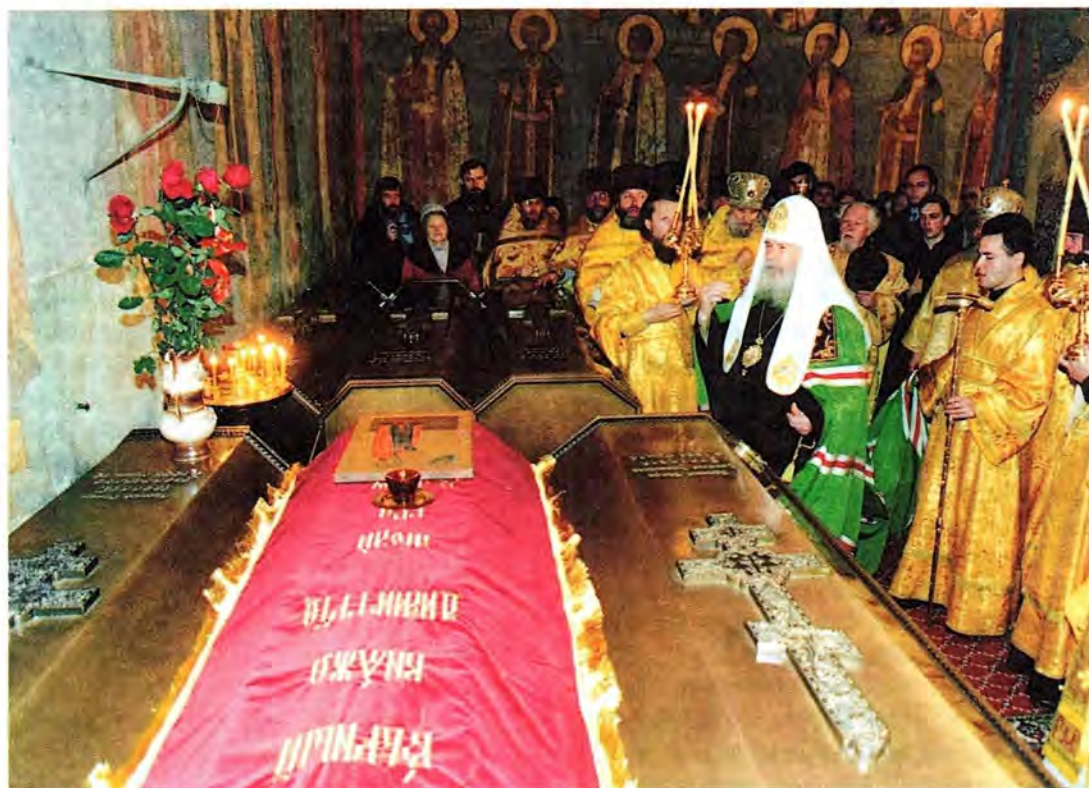
Святейший Патриарх Алексей у мощей святого благоверного князя Димитрия Донского. Архангельский собор Московского Кремля, 25 октября 2000 года