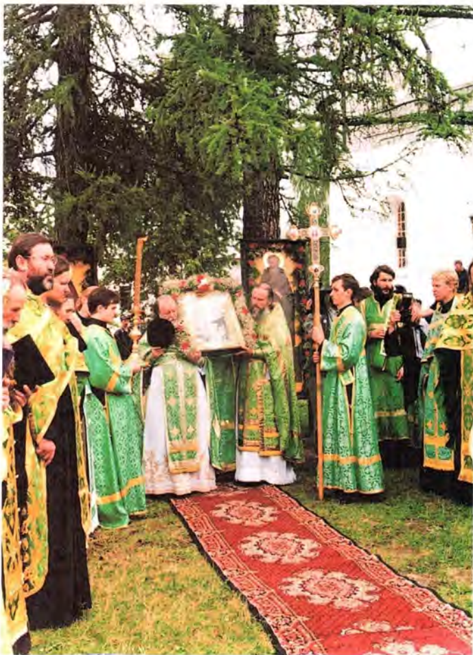
Молебен в Саввино-Сторожевской обители

В настоящее время в Саввино-Сторожевском монастыре семьдесят монахов и послушников. Среди них есть и москвичи, есть и жители Сибири, Белоруссии, Казахстана. У монастыря налажено тесное сотрудничество с военны-