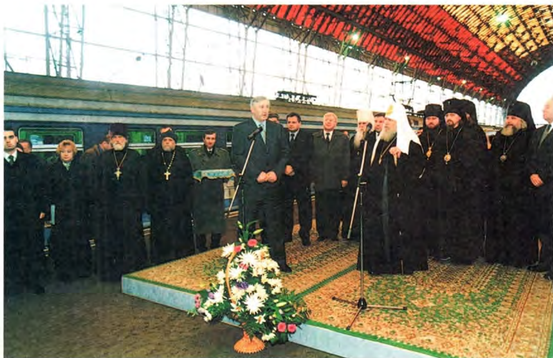
Святейший Патриарх Алексей и министр Н. А. Аксененко во время церемонии

посещение церкви в честь Смоленской иконы Божией Матери, именуемой «Одигитрия» (Путеводительница), помогало людям найти путь к Богу и к храму.