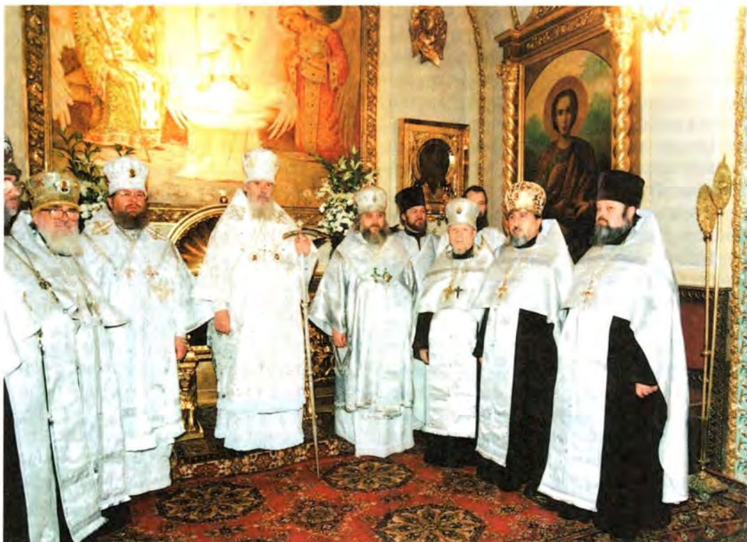
В алтаре Богоявленного кафедрального собора в Москве

не раз был удостоен наград Русской Православной Церкви, а также братских Поместных Православных Церквей: Константинопольской, Александрийской, Антиохийской, Румынской, Болгарской, Чешской и Словацкой, Финской, Синайской. В рамках одной статьи, конечно, трудно подробно рассказать о судьбе и пастырском подвиге этого замечательного человека, который являлся очевидцем и непосредственным участником многих памятных и значимых для истории нашей Церкви событий.