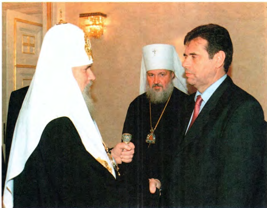
Святейший Патриарх Алексий приветствует вновь избранного Президента Югославии

Предстоятель Русской Церкви подчеркнул, что дальнейшая судьба Югославии не может оставить нас равнодушными. «Относясь с полным уважением к свободе народов в определении пути своего государственного развития, мы вместе с тем считаем весьма важным сохранение Союзной Республики Югославии. На выстраданном опыте