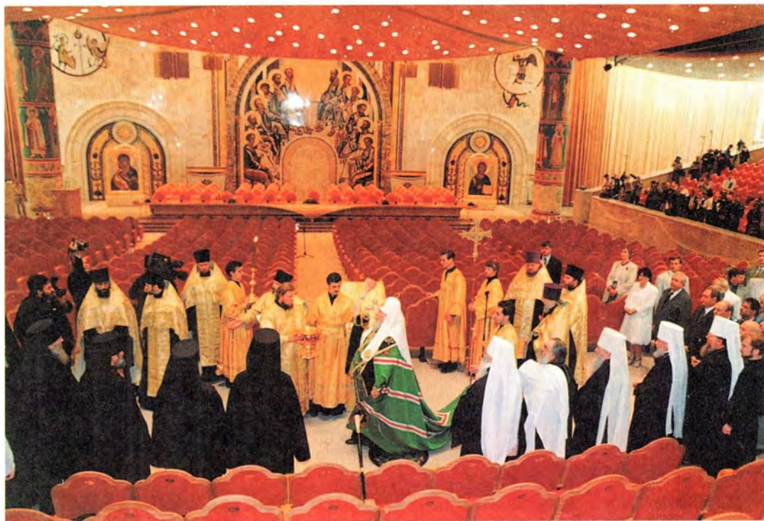
Освящение Зала Церковных Соборов в Храме Христа Спасителя. 11 августа 2000 года