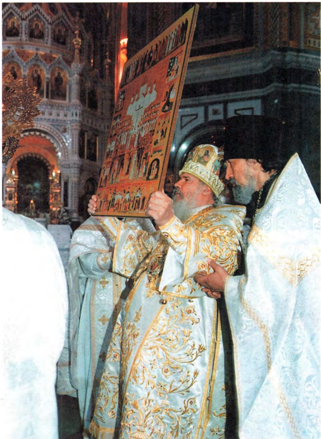
Святейший Патриарх Алексий благословляет народ иконой Собора новомучеников и исповедников Российский. Храм Христа Спасителя, 20 августа 2000 года