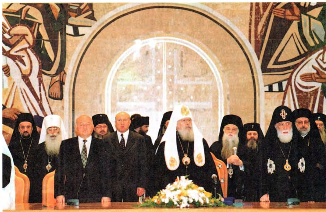
Перед началом Торжественного акта в Зале Церковных Соборов. 18 августа 2000 года