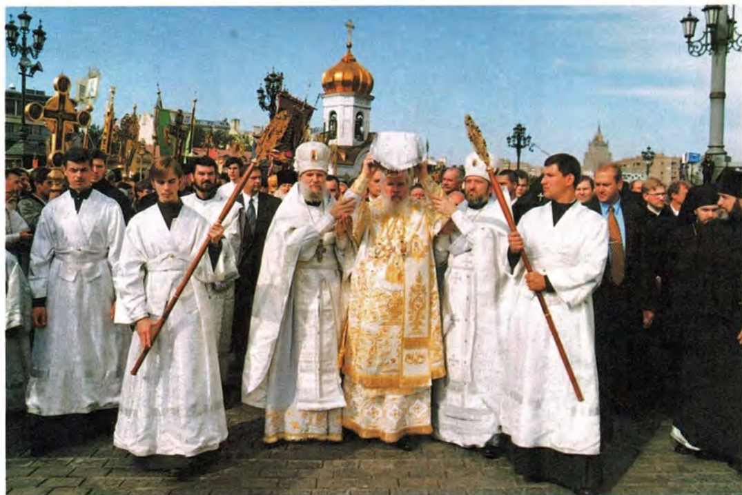
Крестный ход в день освящения Храма Христа Спасителя. 19 августа 2000 года