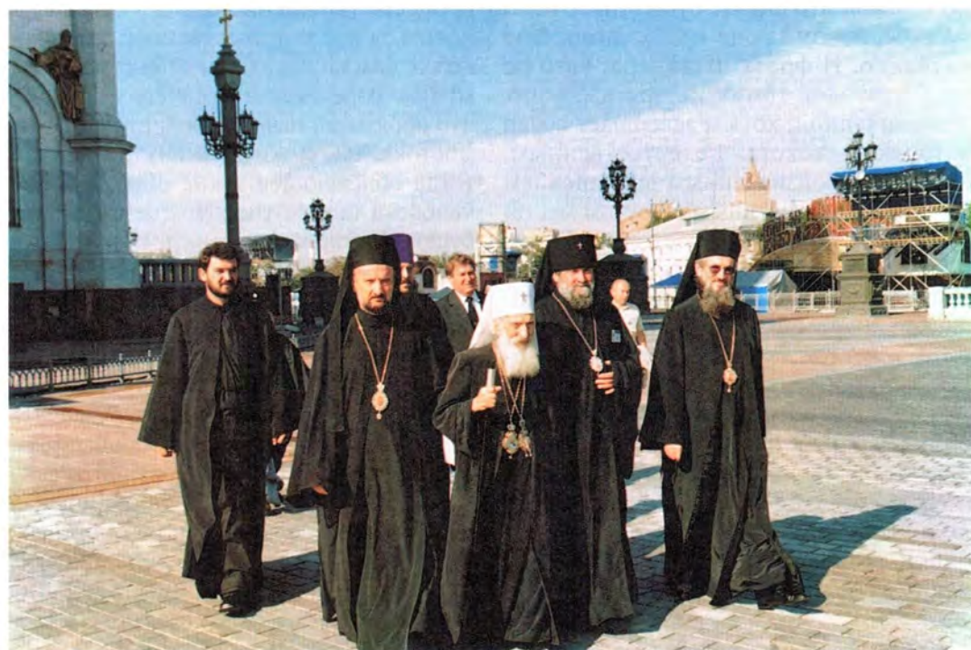
Святейший Патриарх Сербский Павел возле Храма Христа Спасителя. 18 августа 2000 года