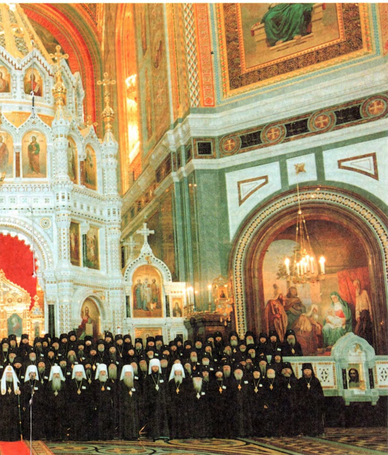
в Храме Христа Спасителя. 16 августа 2000 года