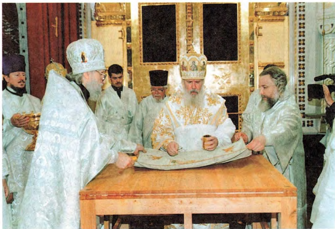
Освящение престола в честь Рождества Христова. Храм Христа Спасителя