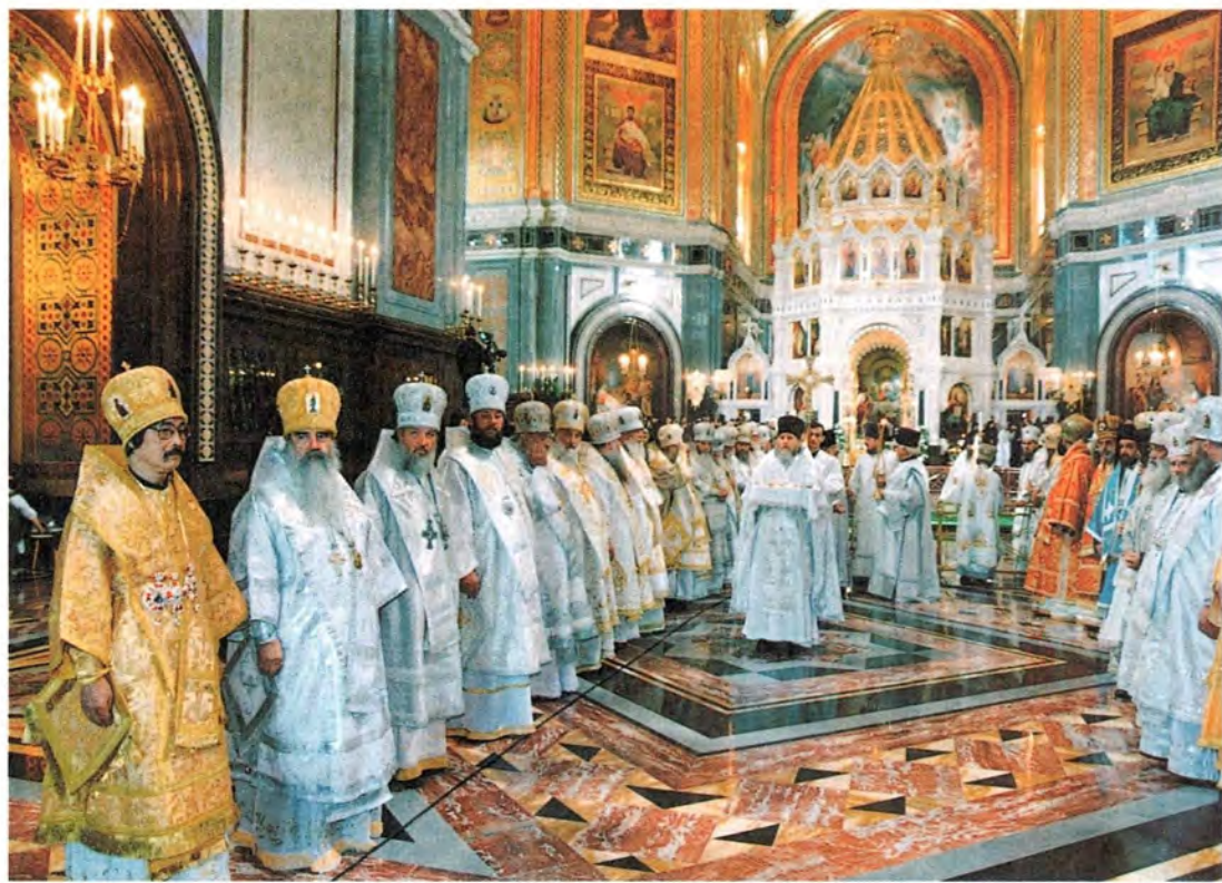
За Божественной литургией в Храме Христа Спасителя в день его великого освящения.