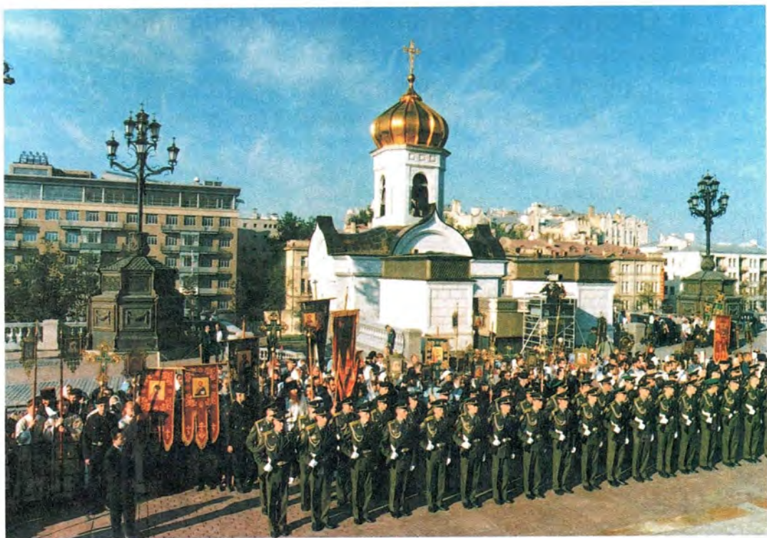
Возле Храма Христа Спасителя в день его освящения. Преображение Господне