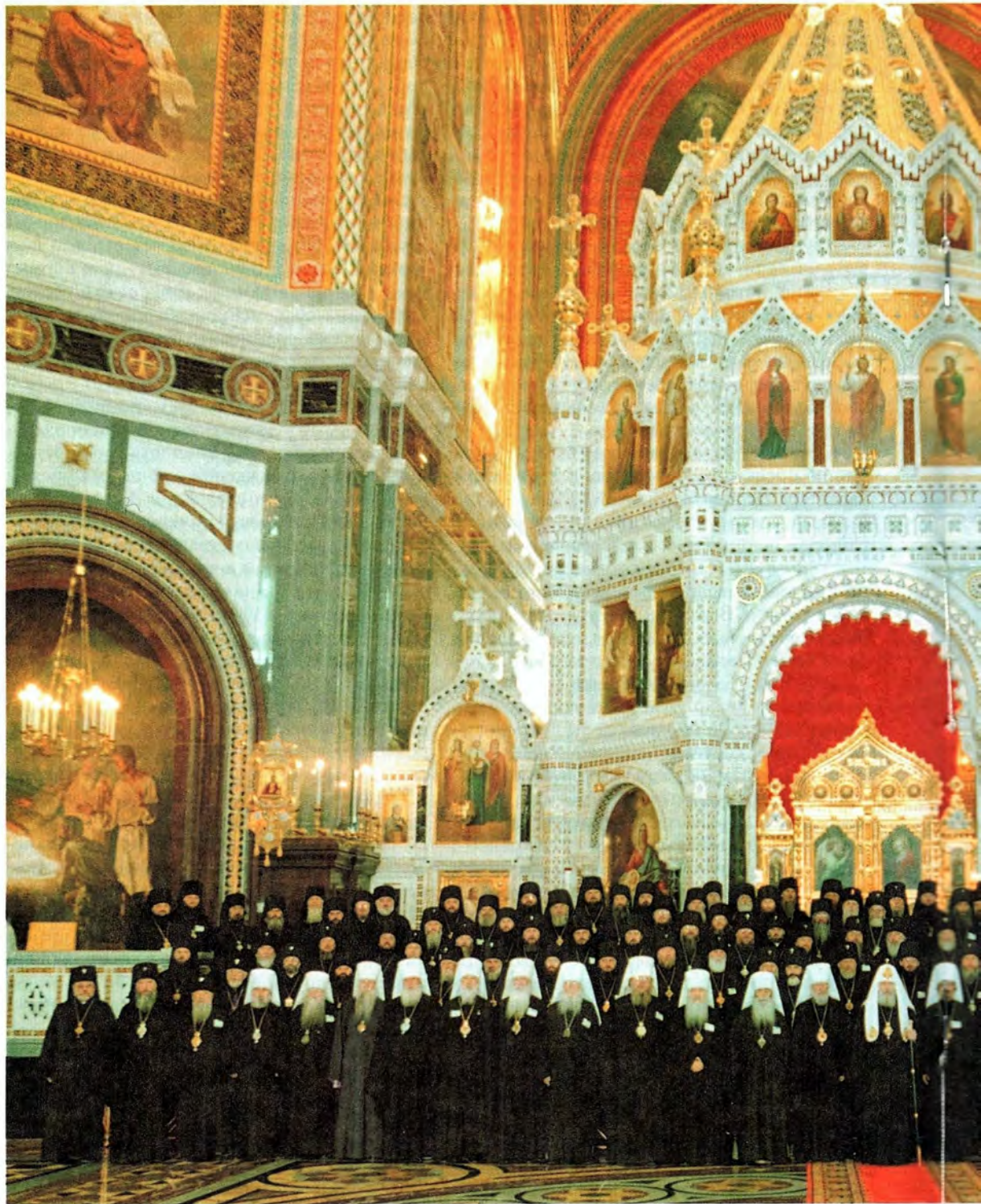
Участники Юбилейного Архиерейского Собора Русской Православной Церкви