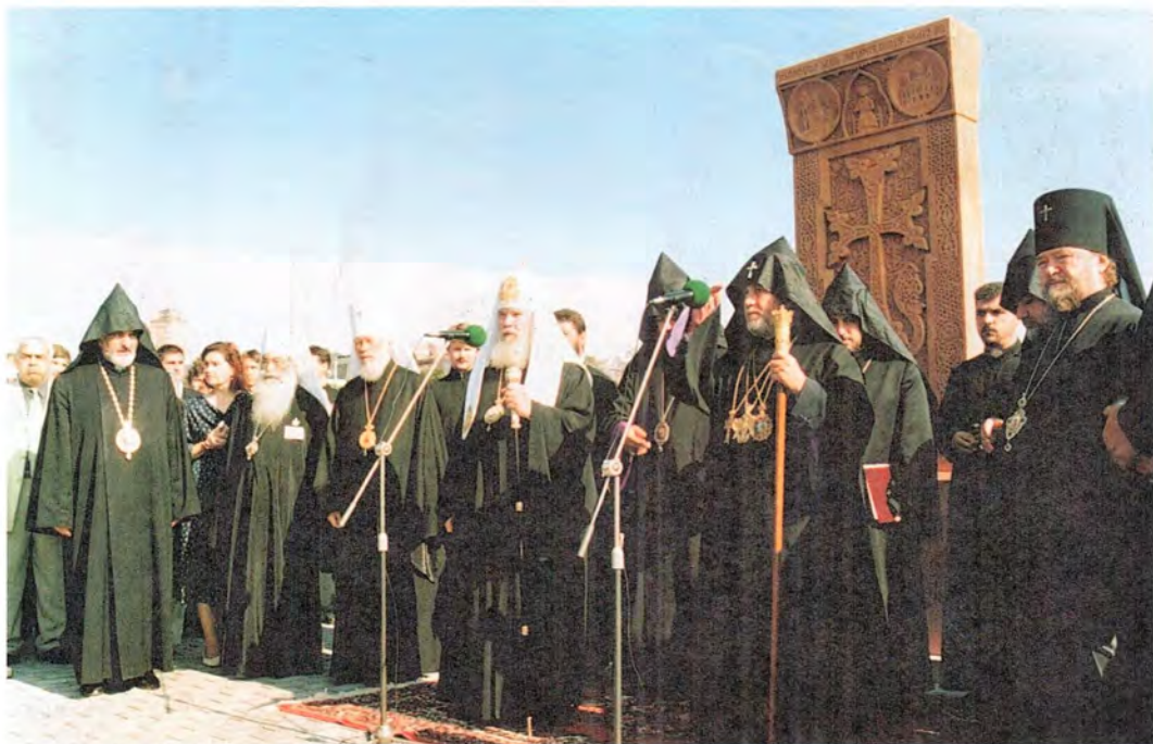
Установка крестового камня – хачкара, дара Армянской Апостольской Церкви, возле Храма Христа Спасителя. 18 августа 2000 года