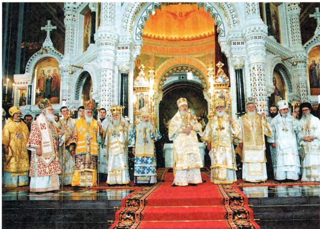
Праздник Преображения Господня, 19 августа 2000 года