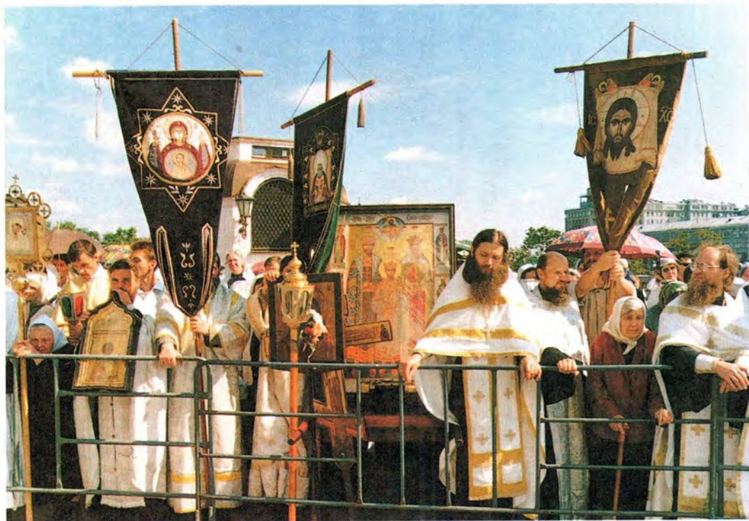
Участники крестных ходов возле Храма Христа Спасителя. 19 августа 2000 года