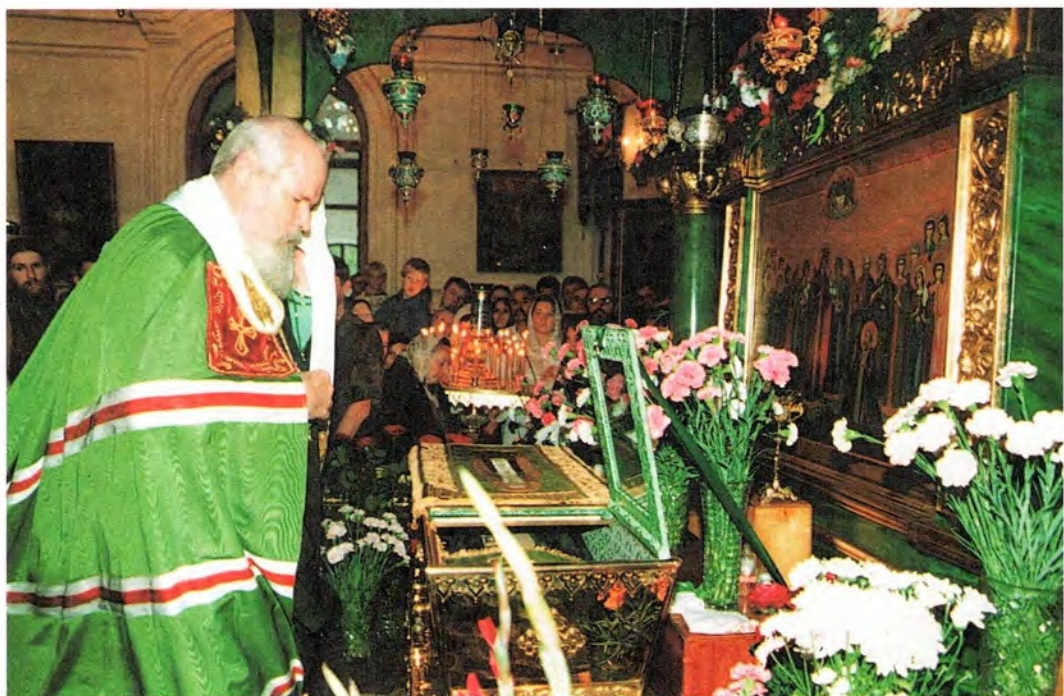
Святейший Патриарх Алексий у мощей преподобного Серафима Саровского