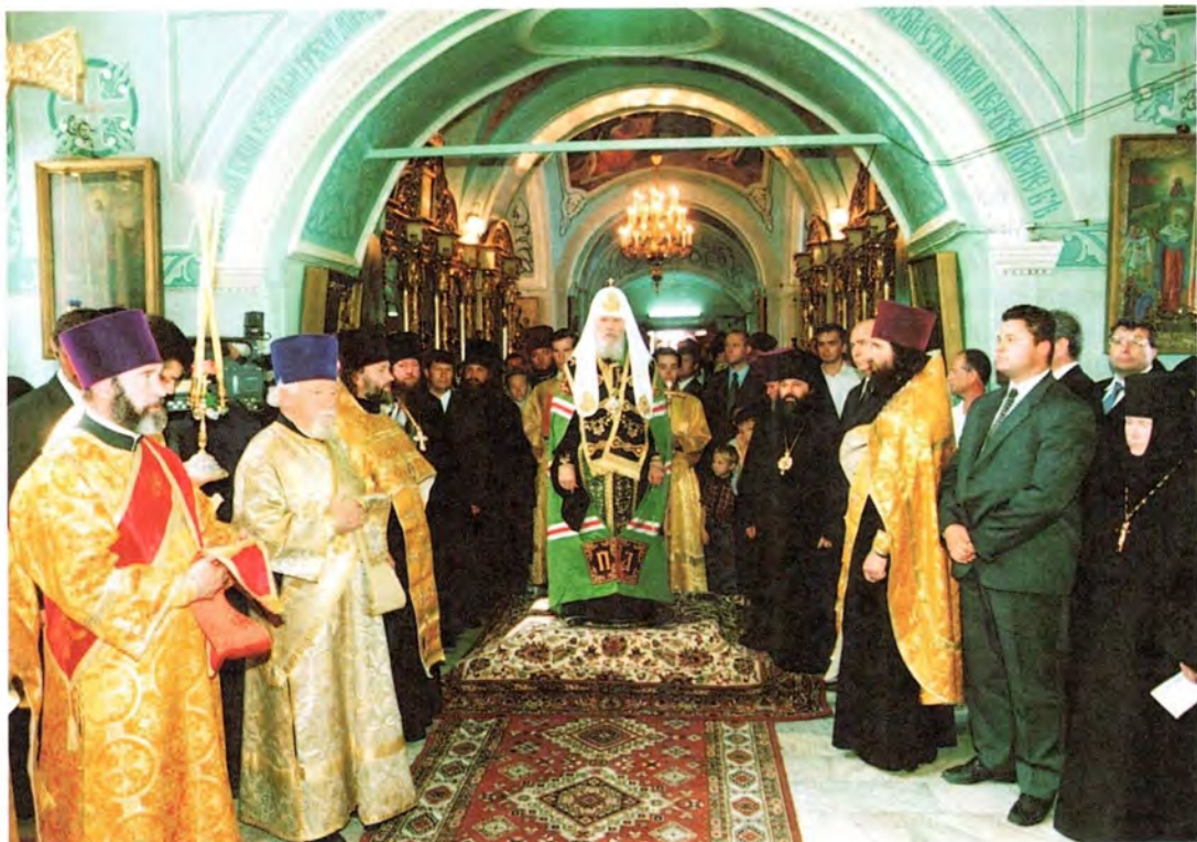
Молебен в Иоанно-Богословском соборе