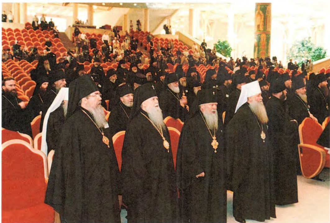
Молитва перед началом Юбилейного Архиерейского Собора