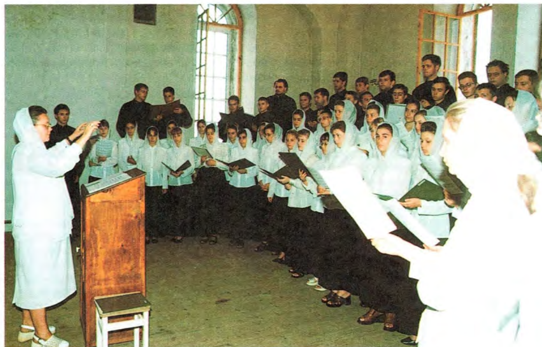
Хор Нижегородской Духовной семинарии и Епархиального Духовного училища