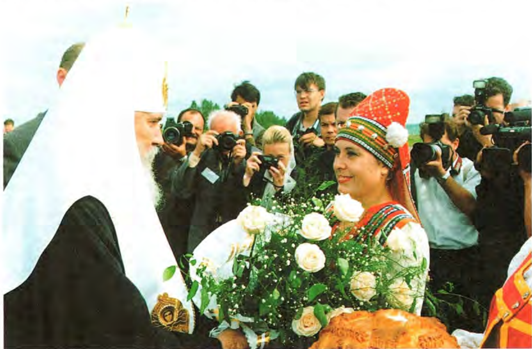
Встреча Святейшего Патриарха Алексия на Мордовской земле

Затем состоялось освящение новой часовни во имя святого благоверного князя Александра Невского, построенной в память о погибших в Великой Отечественной войне. Святейший Патриарх Алексий освятил