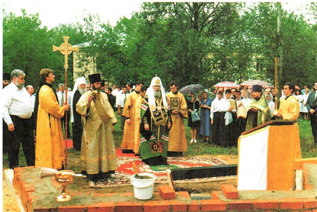
Закладка больничного храма во имя великомученика и целителя Пантелеимона в Сарове