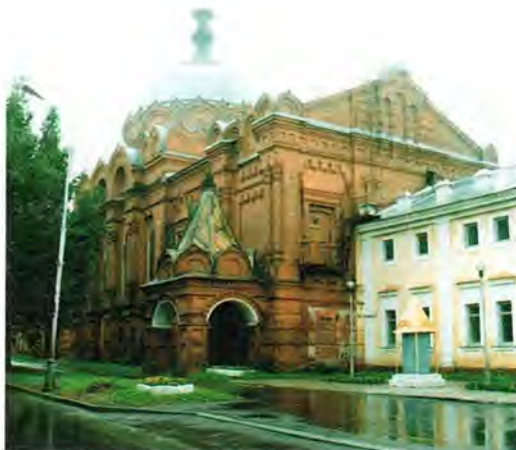
Здание бывшей Троицкой церкви в Сарове

Святейший Патриарх Алексей начал свое паломничество с посещения Дальней пустыньки преподобного Серафима Саровского, где совершил молебен. Четыре года назад на этом месте ничего не было, теперь построен небольшой храм-часовня, где в летнее время можно совершать Божественную литургию. Затем Его Святейшество направился к памятнику преподобному Серафиму, установленному неподалеку. После этого состоялась закладка храма во имя великомученика и целителя Пантелеимона на территории саровской больницы. Святейший Патриарх освятил камень, положенный