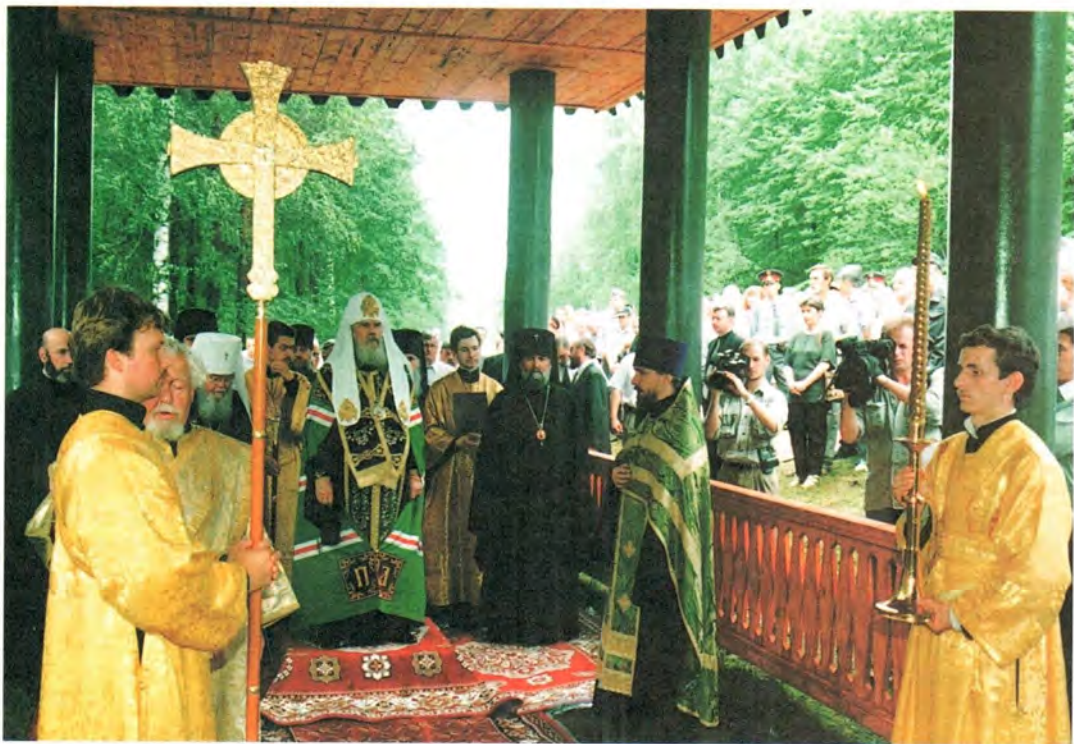
Молебен в Дальней пустыньке преподобного Серафима