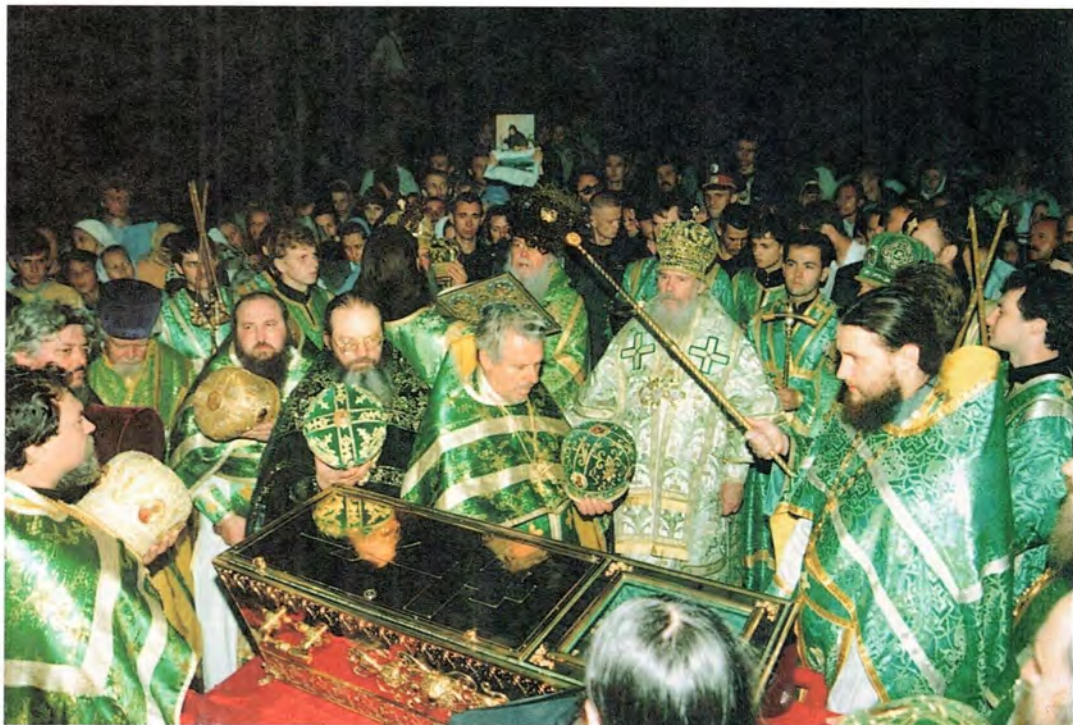
Во время крестного хода в день памяти преподобного Серафима Саровского. 1 августа 2000 года