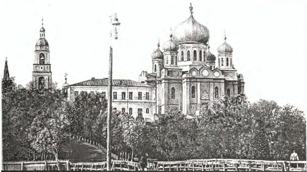
Разрушенный в 1930-е годы Спасский кафедральный собор Саранска