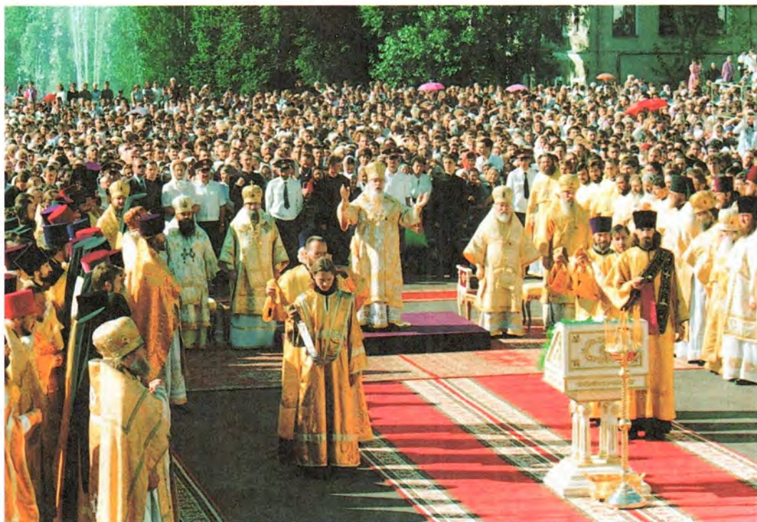
За Божественной литургией, совершаемой Святейшим Патриархом Алексием