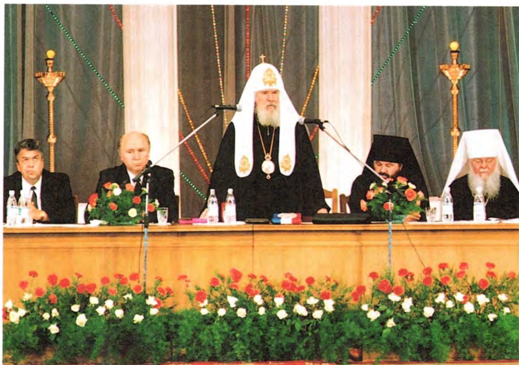
Выступление Святейшего Патриарха Алексия на Торжественном акте