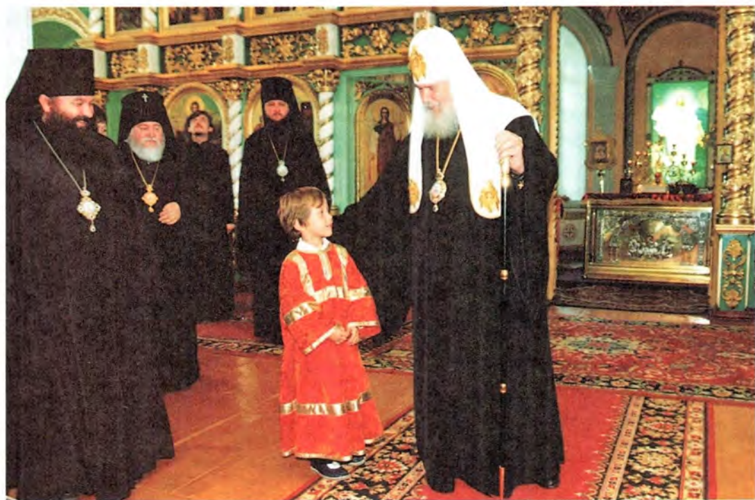
Святейший Патриарх Алексей с юным православным

В ожидании приезда Святейшего Патриарха. Пайгармский Параскево-Вознесенский женский монастырь