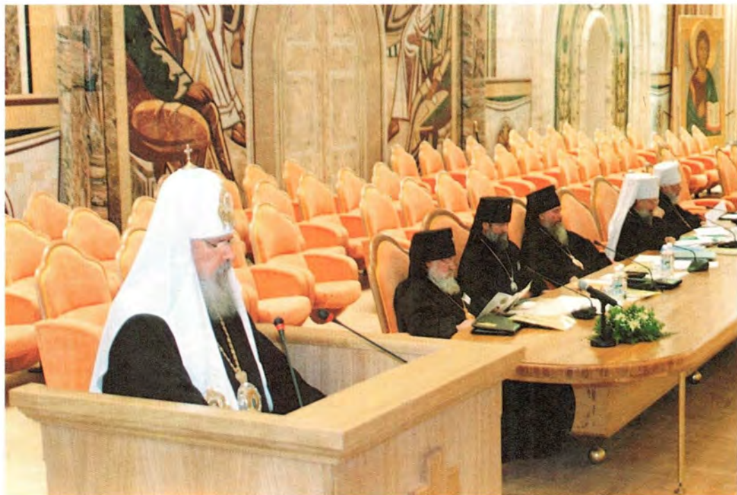
Доклад Святейшего Патриарха Московского и всея Руси Алексия