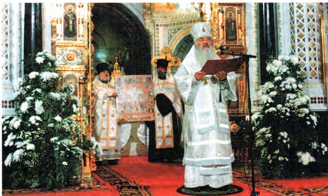
Прославление новомучеников и исповедников Российских. Храм Христа Спасителя, 20 августа 2000 г.

4. Правящим Преосвященным в контакте с Синодальной комиссией по канонизации святых продолжить сбор и изучение предания и мученических актов о свидетелях веры XX века для последующего включения их имен в Собор новомучеников и исповедников Российских.