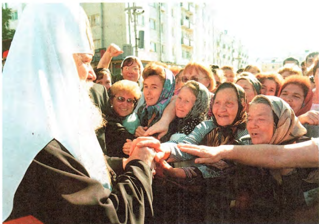
Святейший Патриарх благословляет саранскую паству