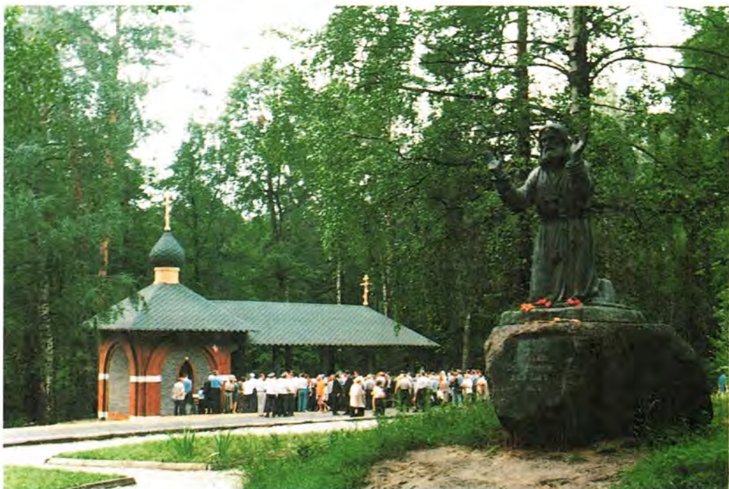
Памятник преподобному Серафиму Саровскому возле Дальней пустыньки

Сразу же после получения этого необыкновенного известия была создана специаль-