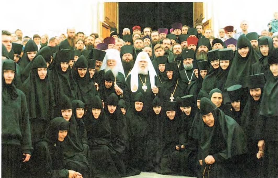
Святейший Патриарх Алексей с насельницами Дивеевской обители

Колокольня Серафимо-Дивеевского монастыря