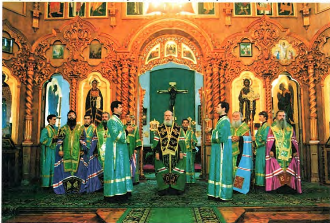
Перед началом чтения Акафиста преподобному Серафиму Саровскому в Троицком соборе

За богослужением присутствовали представители государственной власти Нижегородской области, а также полномочный представитель Президента Российской Федерации в Поволжье С. В. Кириенко. Выступая на приеме, устроенном в новой прекрасной монастырской трапезной на 500 человек, Его Святейшество подчеркнул, что «в последнее время пришло осознание того, что у нас есть история, есть наши традиции, которыми Русь жила на протяжении тысячи