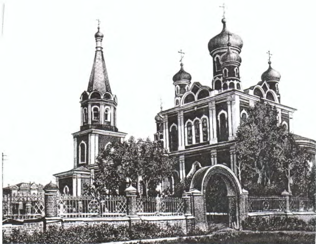
Разрушенная в 1960-х годах церковь Рождества Христова