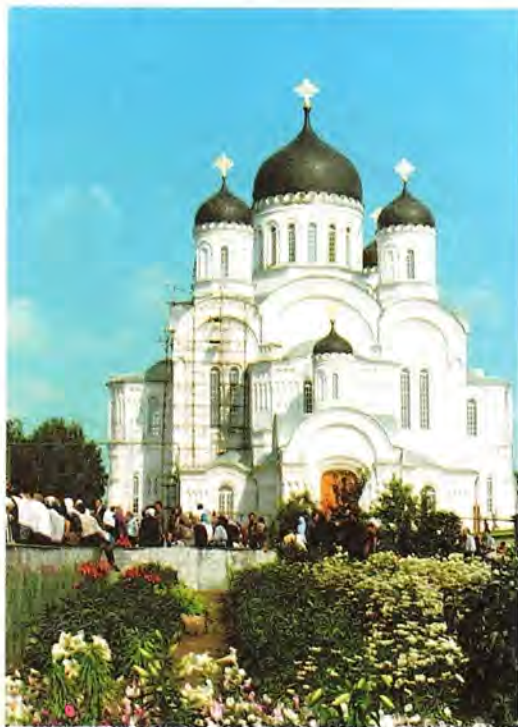
Преображенский собор Дивеевской обители

За эти годы значительно возросло число насельниц монастыря: если на 1 августа 1996 года их было 217 (среди них 2 схимонахини, 16 монахинь и 64 инокини), то сейчас 314 сестер (среди них одна схимонахиня, 26 монахинь и 85 инокинь) несут различные монастырские послушания не только в Дивееве, но и в скитах, число которых достигло