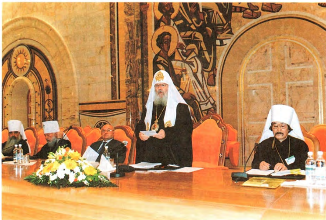
Вступительное слово Святейшего Патриарха Алексия на открытии Архиерейского Собора