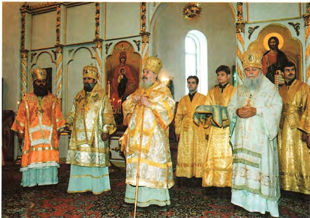
Слово Святейшего Патриарха после Божественной литургии в день памяти пророка Илии

За Божественной литургией Святейшему Патриарху сослужили те же Преосвященные. Обращаясь после богослужения к верующим, Святейший Владыка, в частности, сказал: «Сегодня, совершая богослужение в этом обновленном Преображенском храме, мы благодарим Господа за то, что еще один величественный храм на Нижегородской