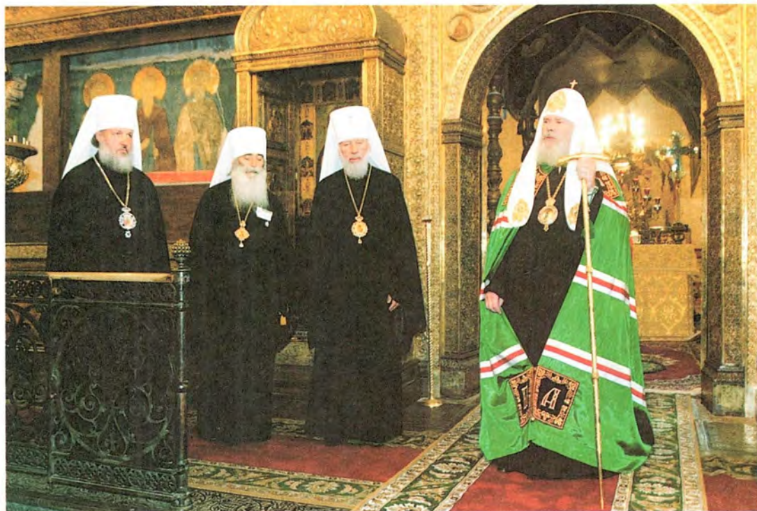
Слово Святейшего Патриарха Алексия после Божественной литургии в Успенском соборе Московского Кремля. 13 августа 2000 года