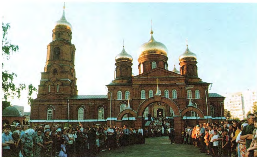
Никольский храм в Саранске