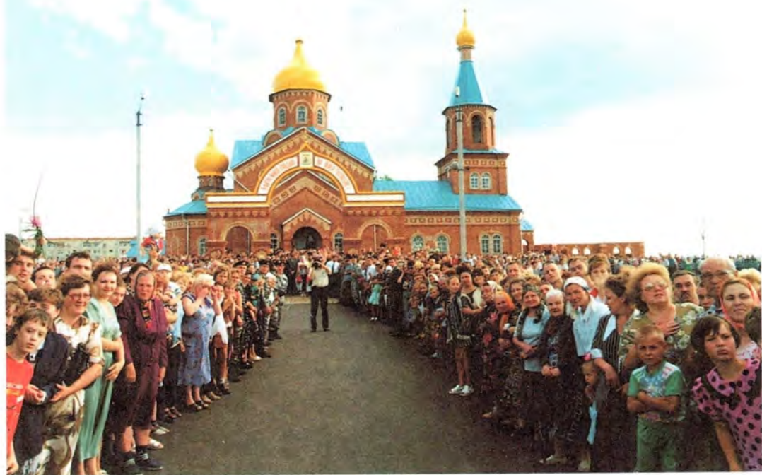
Православные верующие города Рузаевки встречают Святейшего Патриарха