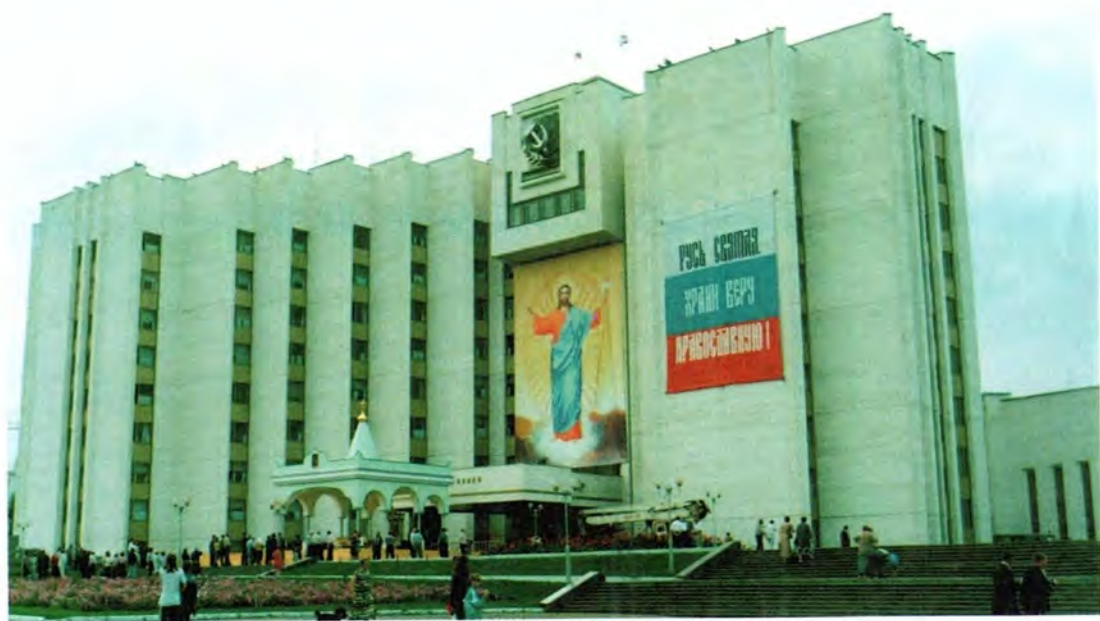
Здание администрации Республики Мордовии, находящееся на месте Христорождественской церкви