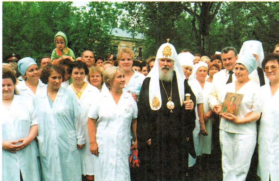
Святейший Патриарх с медицинским персоналом больницы