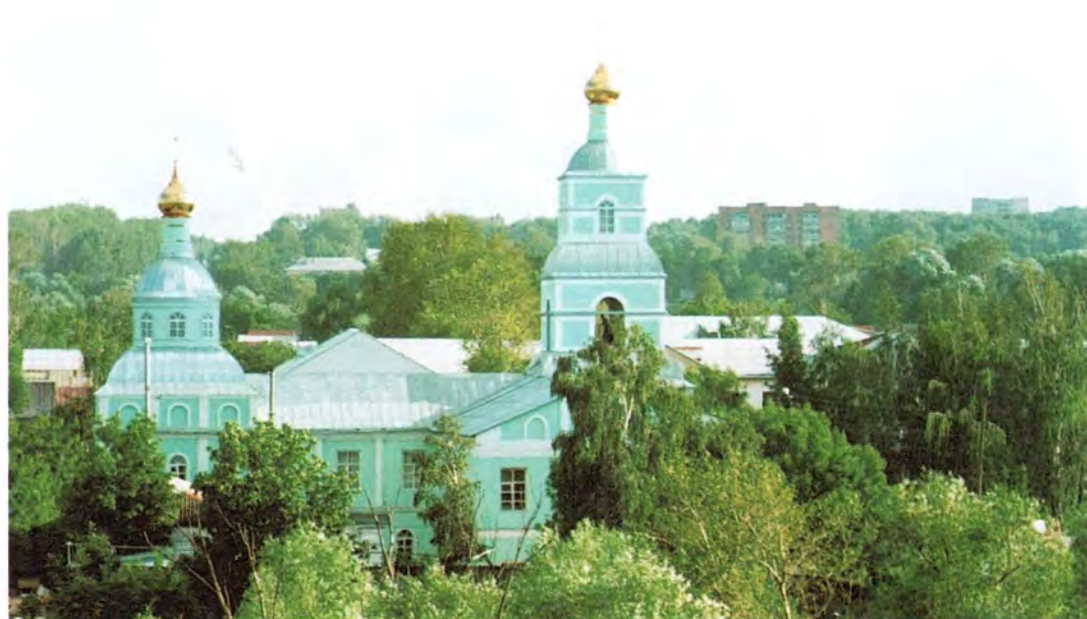
Саранская Духовная семинария