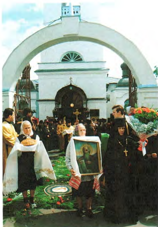
Святейшего Патриарха встречают хлебом-солью. Иоанно-Богословский собор Саранска

Затем Святейший Владыка побывал в Саранском Духовном училище, открытом три года назад, и встретился с его учащимися и духовенством епархии. Следующим пунктом программы было посещение Никольского храма Саранска, где множество людей собралось, чтобы увидеть и услышать Патриарха всея Руси. Вечером Святейший Патриарх приехал в Иоанно-Богословский Макаровский мужской монастырь, загородную резиденцию правящего епископа Саранской епархии.