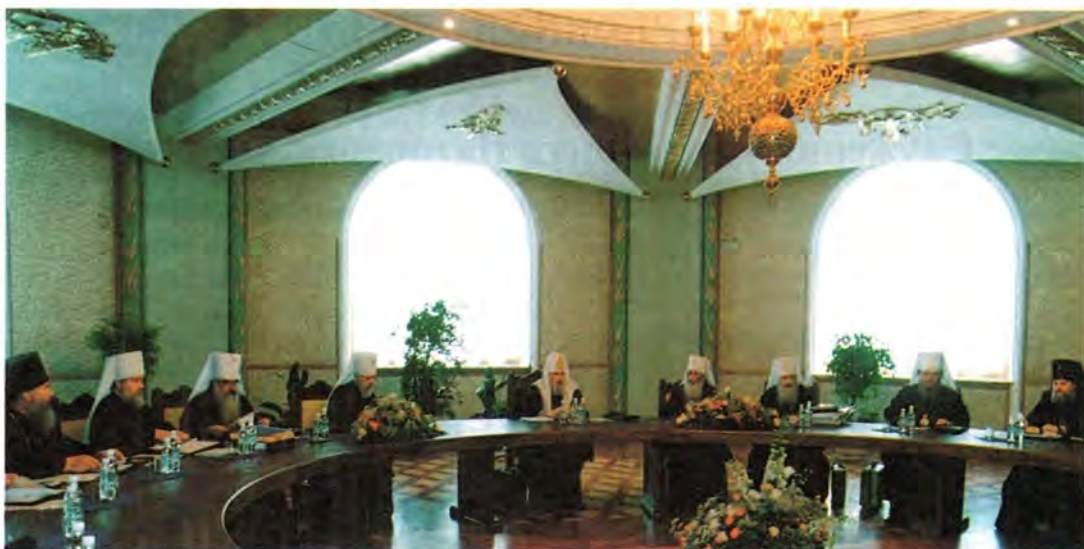
Заседание Священного Синода Русской Православной Церкви 11 августа 2000 года. Синодальный зал в Храме Христа Спасителя

скому диалогу между Православной и Римско-Католической Церквами, проходившей с 9 по 19 июля 2000 года в городе Балтиморе (США).