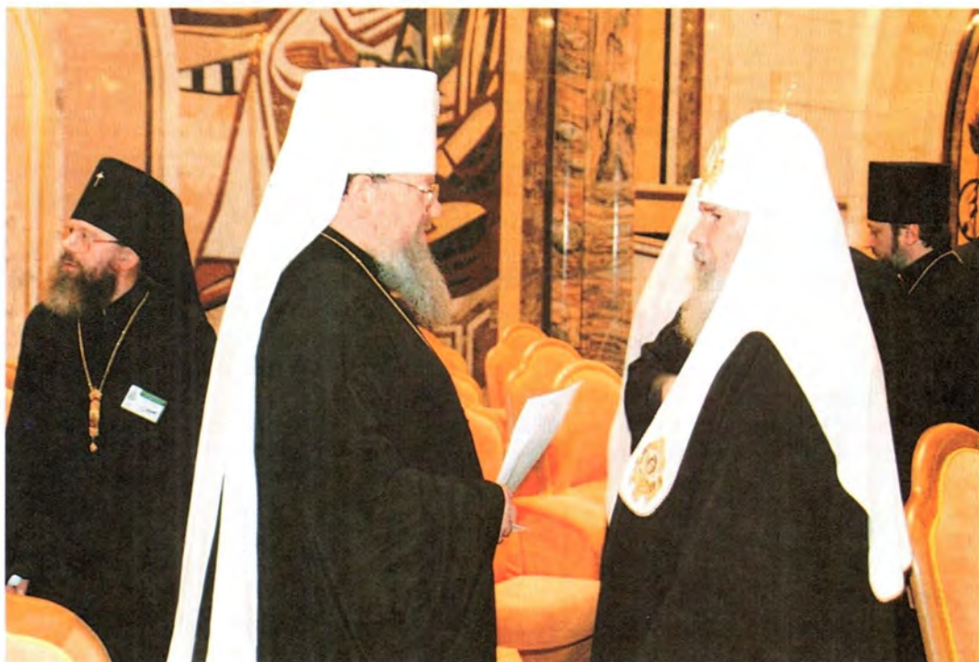
В перерыве между заседаниями