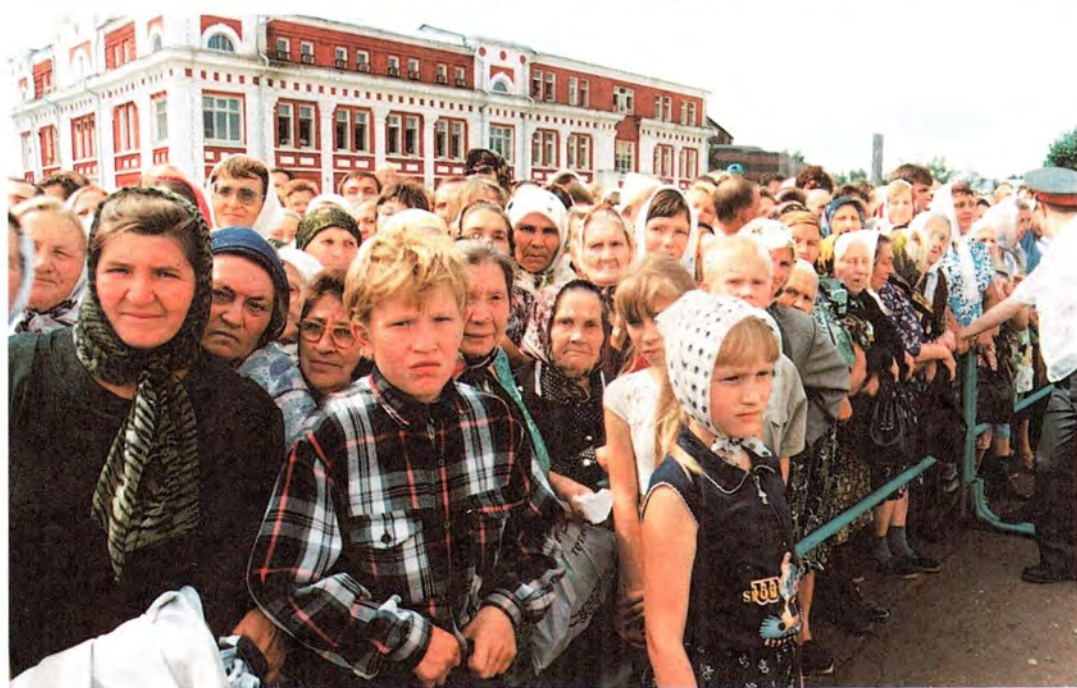
Во время Божественной литургии