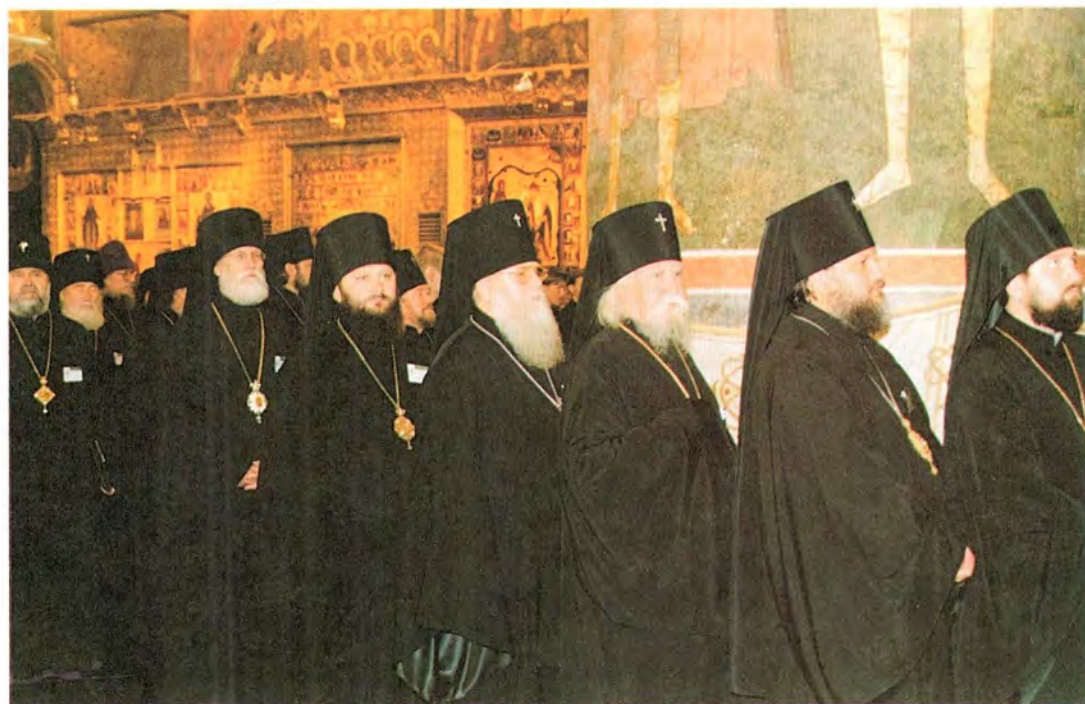
За Божественной литургией в Успенском соборе Московского Кремля