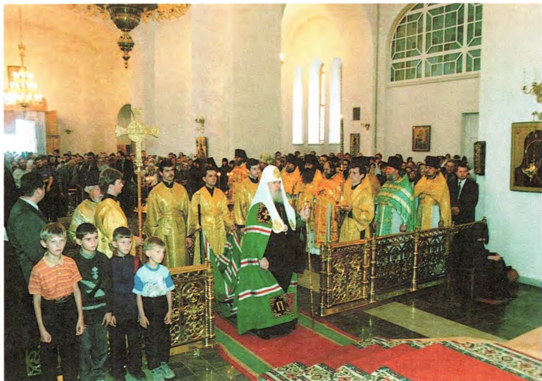
Перед началом Божественной литургии в Преображенском соборе