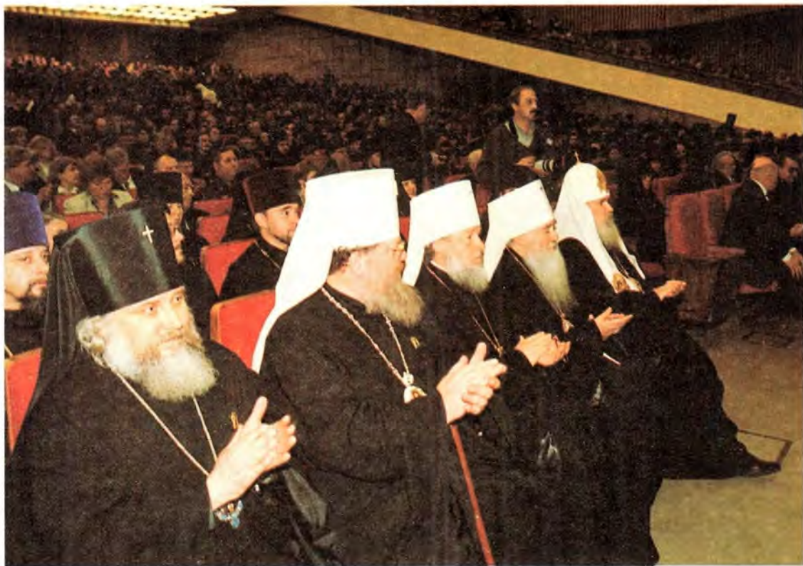
Святейший Патриарх и архиепископы Русской Православной Церкви в зале Кремлевского дворца

дит при взаимодействии с местными властями, но без вмешательства во внутренние дела друг друга.