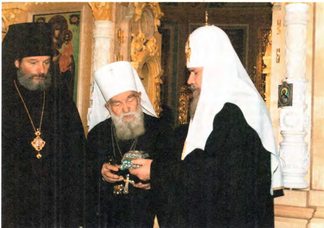
Блаженнейший Архиепископ Пражский, Митрополит Чешских земель и Словакии Дорофей передает Святейшему Патриарху Алексию частицу мощей мученицы Людмилы, княгини Чешской. Храм Святителя Николая в Котельниках, 28 ноября 1999 года