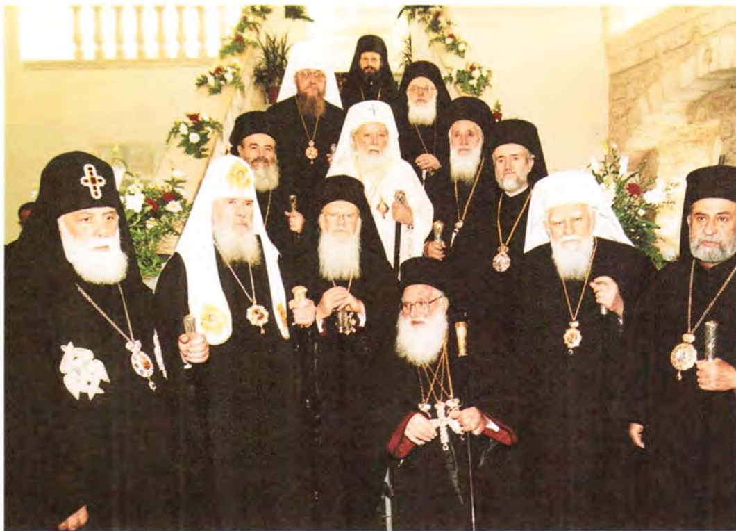
Участники Собора Православных Первоиерархов в Иерусалимской Патриархии

В документе обращено особое внимание на необходимость развития диалога с монотеистическими религиями – иудаизмом и исламом – «ради мирного сосуществования всех народов». «На основании Евангельского учения и нашего Священного Предания Православная Церковь, – подчеркивается в тексте Послания, – отвергает ненависть к другим убеждениям и религиозный фанатизм, в каком бы виде они ни проявлялись». Осуждение со стороны Православных Первоиерархов вызвал прозелитизм некоторых инославных исповеданий и религиозных групп в тех регионах, где на протяжении столетий Православная Христова Церковь осуществляет свое пастырское служение. Приветствуя усилия по техническому усовершенствованию условий человеческой жизни, Церковь в лице своих Предстоятелей отметила опасность,