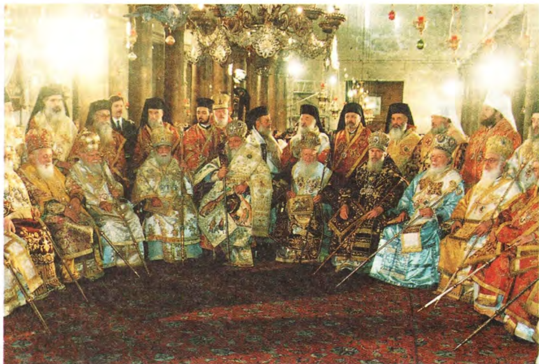
Предстоятели Поместных Православных Церквей за Божественной литургией в базилике Рождества Христова