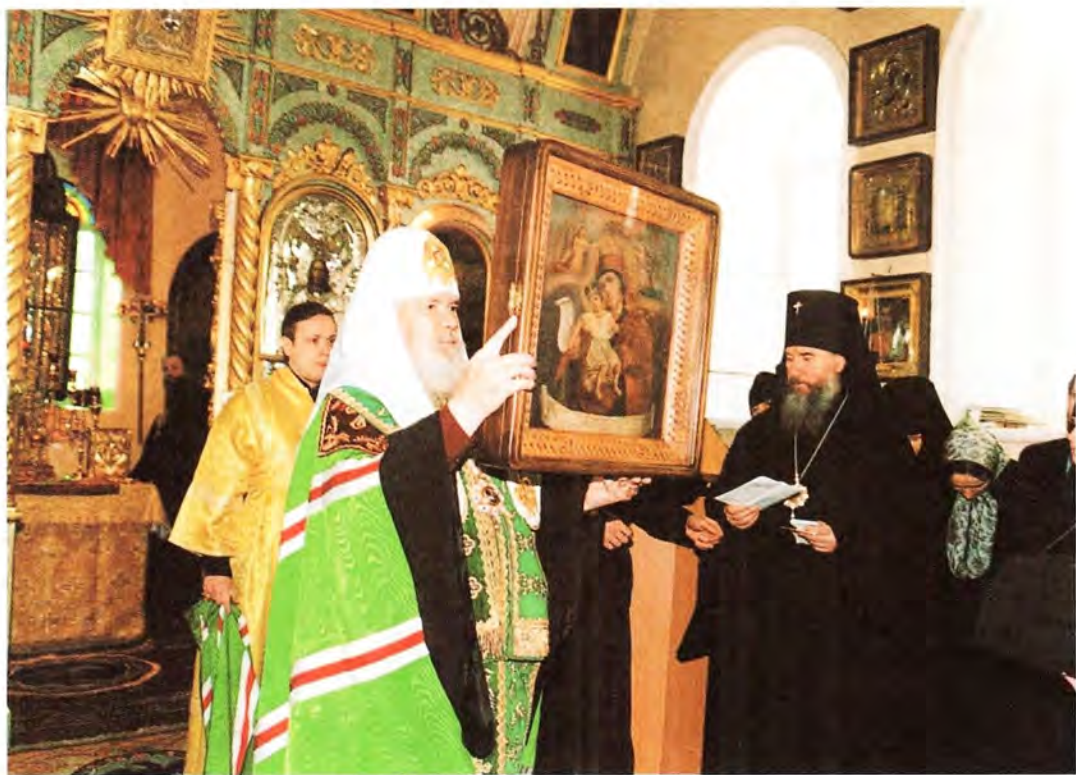
Патриаршее благословение обители – икона Божией Матери «Достойно есть»

градил наиболее отличившихся сотрудников Миссии.