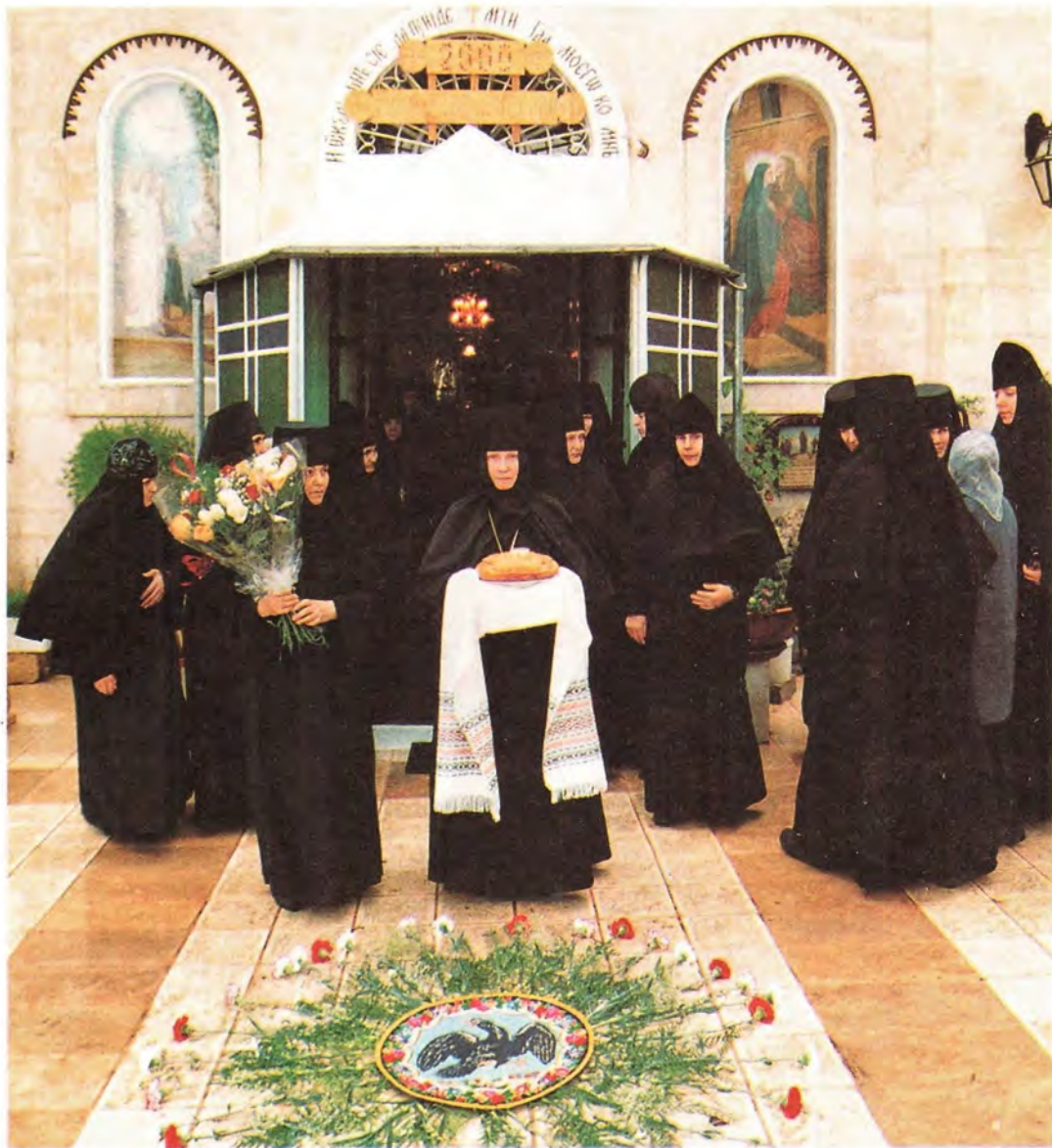
Встреча Первосвященника Русской Православной Церкви в Горнем монастыре

тырь, которому предназначалась изначально. Насельницы обители с благовоением и благодарностью приняли патриарший дар.