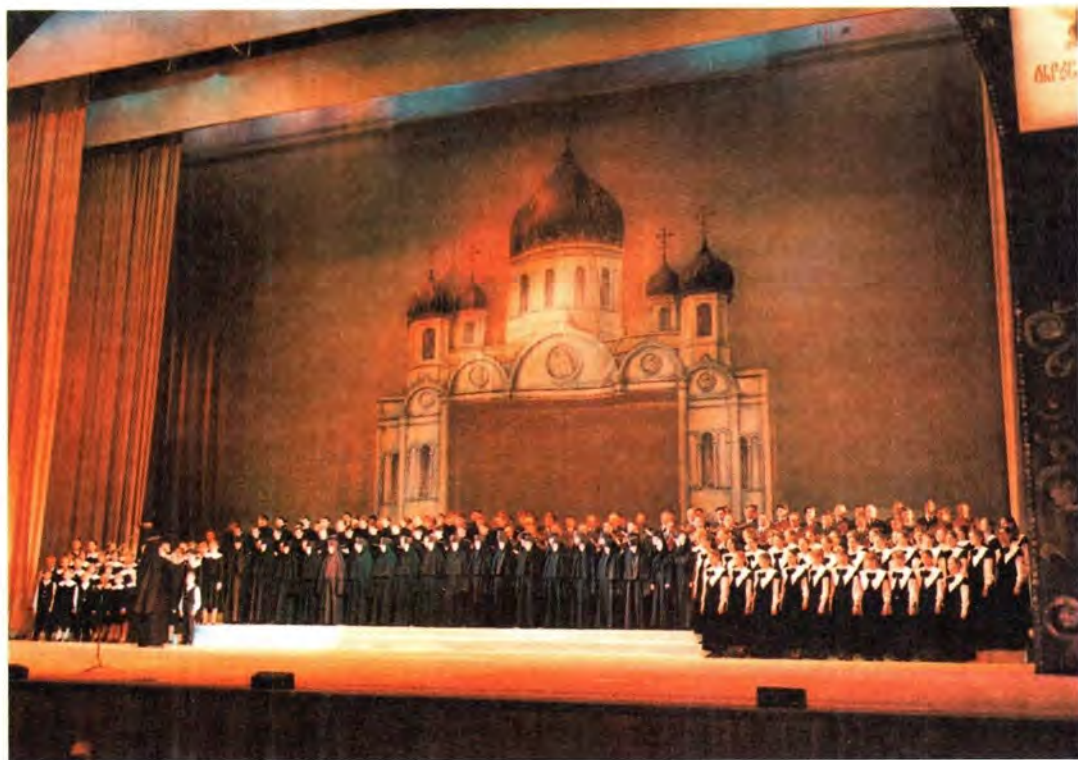
Завершающий момент юбилейного концерта в Кремлевском дворце

возвращением к такому пониманию защиты благополучия Церкви, которое бы унизило ее и принизило вас до уровня действий ее хулителей». И на исходе XX века, в эпоху новых нестроений и смут, Вы, Ваше Святейшество, кормчий великого церковного корабля России, не жалуете себя для блага Церкви и нас призываете следовать тому же.