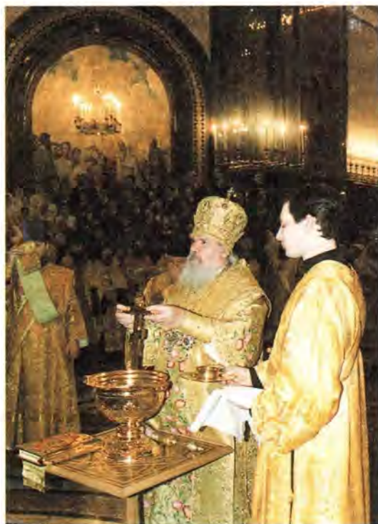
Малое освящение Храма Христа Спасителя

Его Святейшеству сослужили митрополит Крутицкий и Коломенский Ювенал