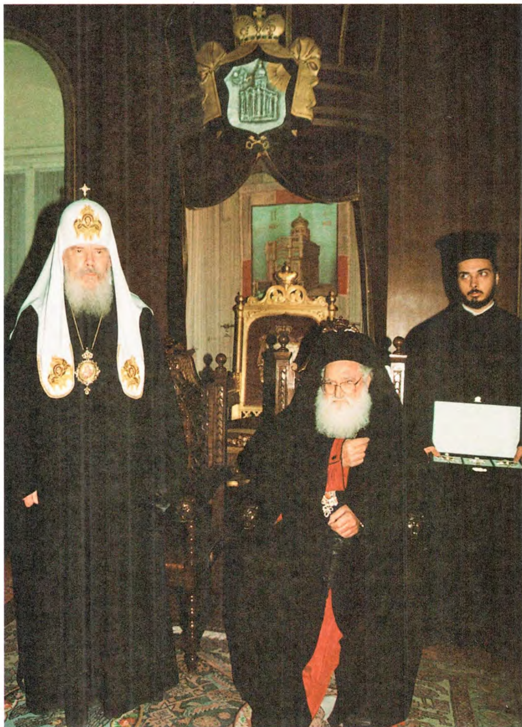
Встреча Святейшего Патриарха Московского и всея Руси Алексия с Блаженнейшим Патриархом Святого Града Иерусалима и всей Палестины Диодором