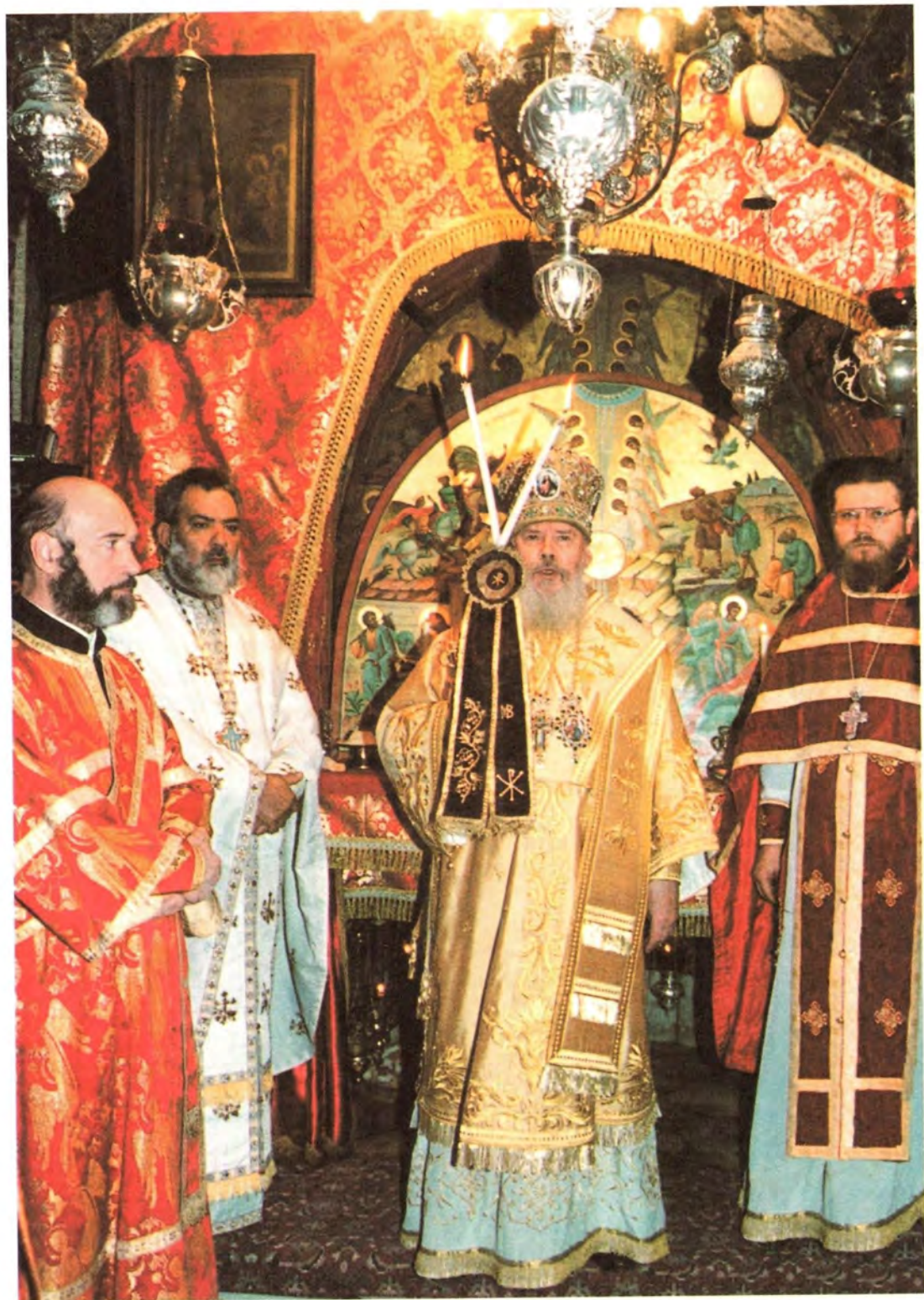
Божественная литургия в Святой пещере