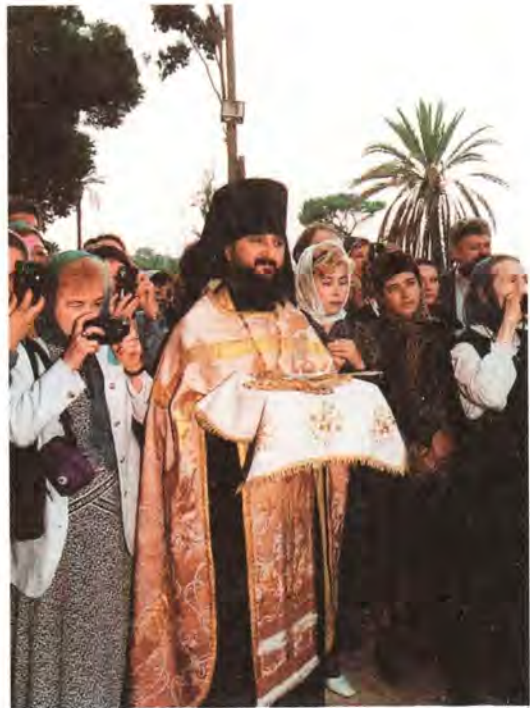
Встреча Святейшего Патриарха Алексея в Яффском монастыре святого Апостола Петра