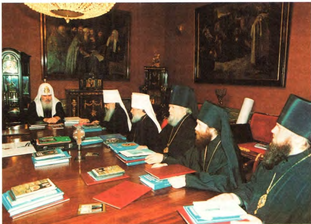
Заседание Священного Синода Русской Православной Церкви

ных сношений, об участии делегации Русской Православной Церкви в Юбилейной международной межконфессиональной конференции, посвященной 2000-летию христианства, на тему «Иисус Христос вчера и сегодня и во веки Тот же (Евр. 13, 8). Христианство на пороге третьего тысячелетия», проходившей с 23 по 25 ноября сего года в Москве.