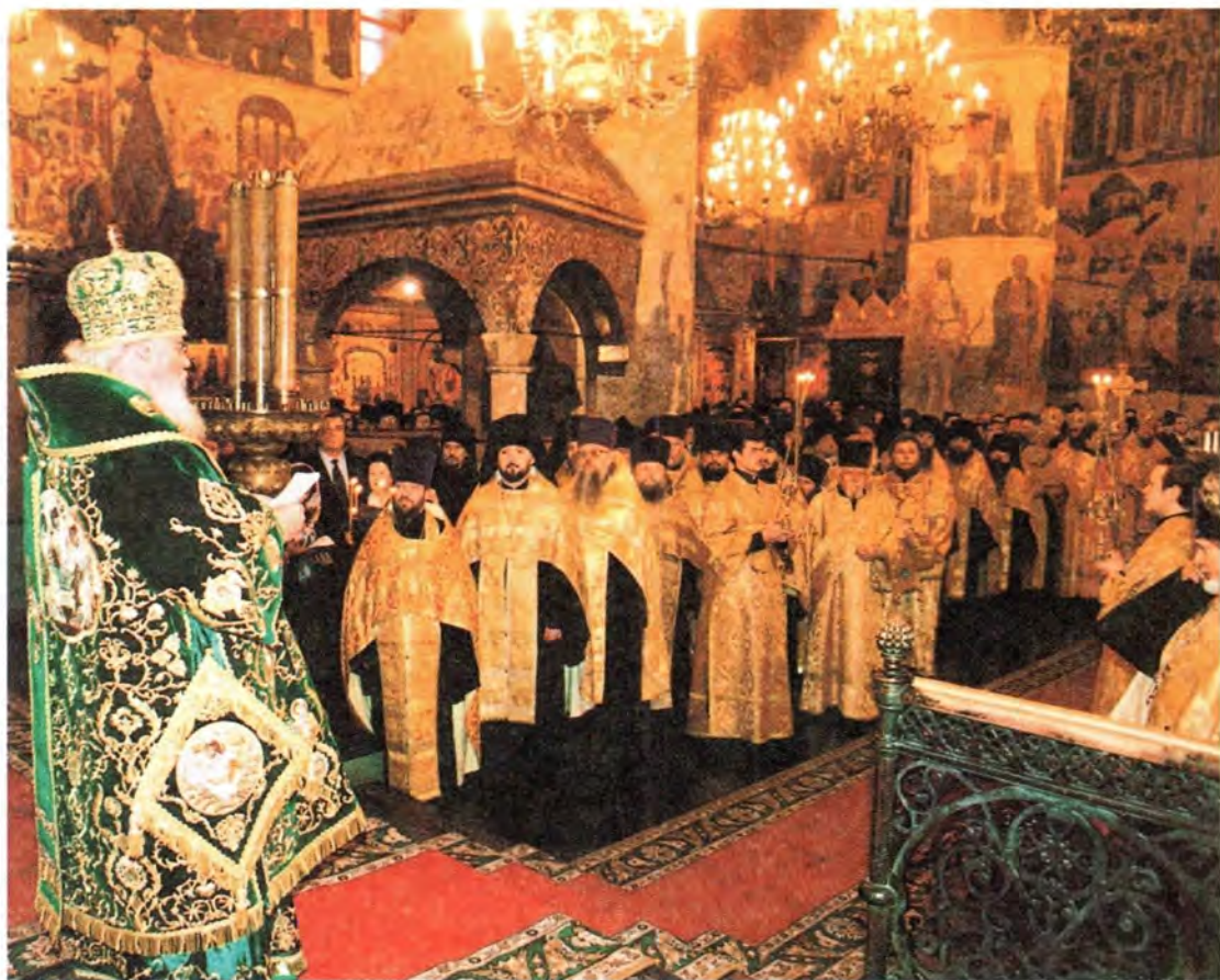
Слово Святейшего Патриарха Алексия после молебна в Успенском соборе

Мы благодарим Господа за Небесное водительство, которое было многократно явлено в истории нашего государства на протяжении прошедших столетий. Праведный своею верою жив будет (Евр. 10, 38), – эти слова Апостола получили свое совершенное исполнение в исторической судьбе нашего народа. Расколы и нестроения, иноземные завоевания и внутренние смуты возникали всякий раз, когда охладевали любовь и благочестие, умножалось себялюбие и земные пристрастия начинали властвовать душами и сердцами людей. И лишь духовное возрождение, обретаемое в покаянии, в возвращении на путь христианского добродетельства, в следовании евангельским идеалам Христова смирения и любви, позволяло нашему народу все это преодолевать.