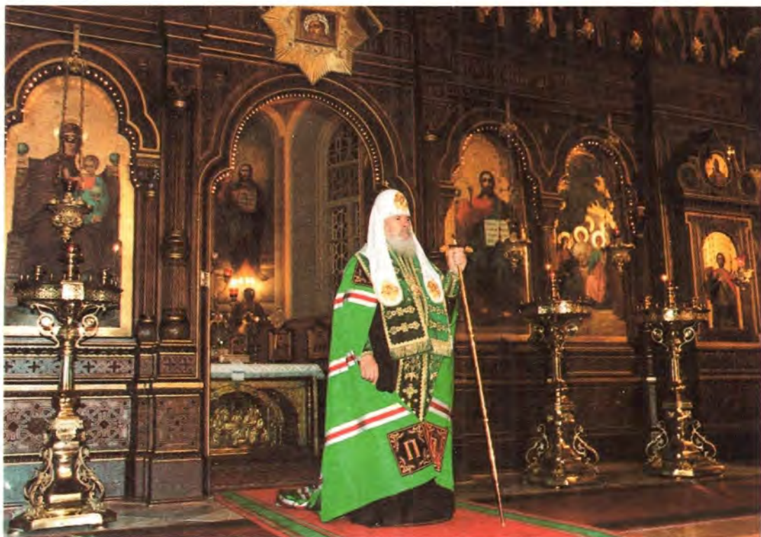
В Троицком соборе Русской Духовной Миссии

внутренней политики Президента России А. В. Логинов, президент Российской Академии наук Ю. С. Осипов, член Совета Федерации Федерального Собрания РФ губернатор Брянской области Ю. Е. Лодкин, советник Председателя Государственной Думы, президент Фонда единства православных народов В. А. Алексеев. Сопровождение Святейшего Патриарха и обеспечение его безопасности в ходе визита было поручено сотрудникам специального подразделения Управления «А» ЦСН ФСБ России. Такие меры предосторожности не были излишними, поскольку местом проведения всеправославных празднеств стала территория государства, где конфликты на национально-религиозной почве являются повседневной реальностью. Следует подчеркнуть, что четкая и слаженная работа сотрудников спецназа, к которой они отнеслись с величайшим благоговением, позволи-