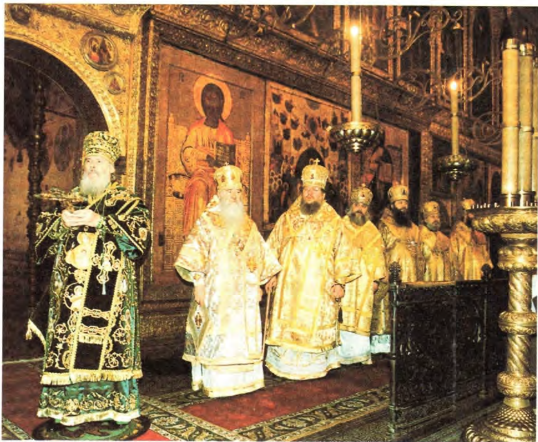
Во время богослужения в Успенском соборе Московского Кремля

По окончании молебна в Государственном Кремлевском дворце состоялся торжественный акт, который открылся показом видеофильма о жизни Московской епархии. Затем выступил митрополит Крутицкий и Коломенский