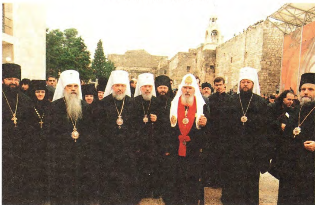
Делегация Московского Патриархата на площади Волхвов перед базиликой Рождества Христова