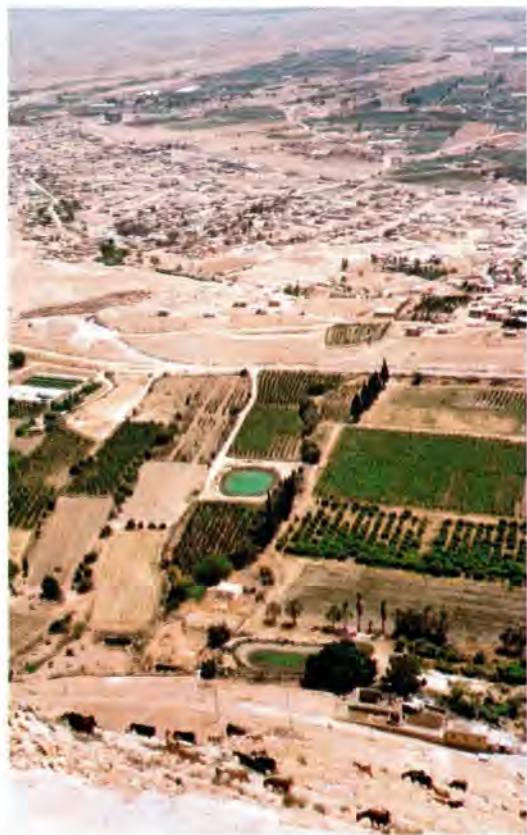
Вид с Сорокадневной горы на Иерихон

Паломники прибыли в Назарет, город, где отроком пребывал Спаситель. Сохранился источник,