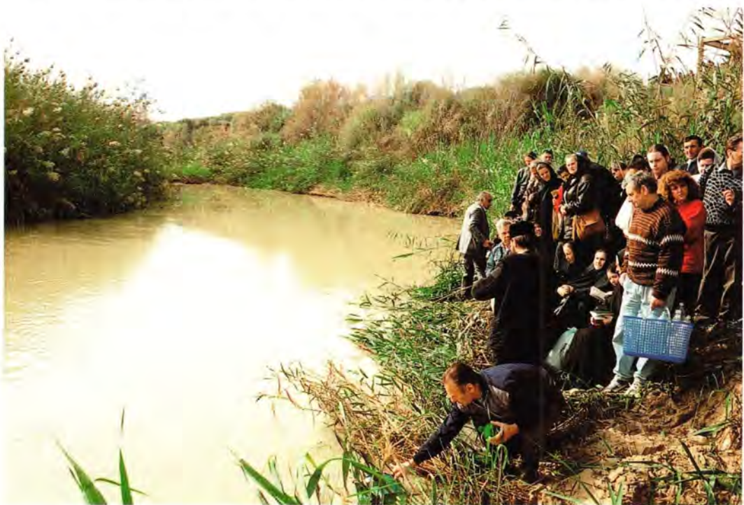
Русские паломники на Иордане

– Так если не молиться, никто никогда это послушание нести не сможет. В Горнем богослужение начинается в полшестого утра и заканчивается в девять: утренние молитвы, полунощница, акафист, Литургия. Потом завтрак – и на послушание. Если у Гроба Господня служится Литургия – значит, сестры ночью идут ко Гробу Господню (начинается Литургия в 12 часов ночи). Возвращаются они в 3 часа ночи, часа три поспят, а в 6 часов – на нашу службу.