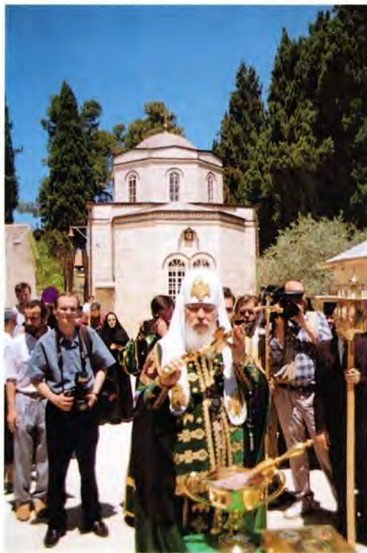
Святейший Патриарх Алексий II в Горнем монастыре

Паломники посетили также Галилею. Дорога была нетрудной. Первую остановку автобус сделал у базилики Хлебов и Рыб. Именно здесь, по преданию, Иисусом Христом было совершено чудо умножения хлебов. Первый храм на этом месте был построен царицей Еленой в IV веке, нынешний принадлежит католикам. Во внутреннем убранстве храма обращают на себя внимание иконы Спасителя и Матери Божией, установлен-