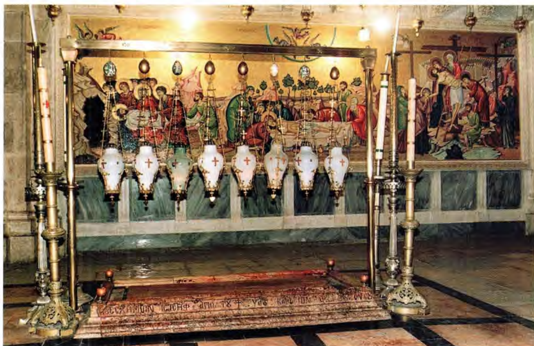
Камень Помзания в Храме Гроба Господня

Здесь Гефсиманский гроб, из которого в день всеобщего суда никто не воскреснет, ибо Божия