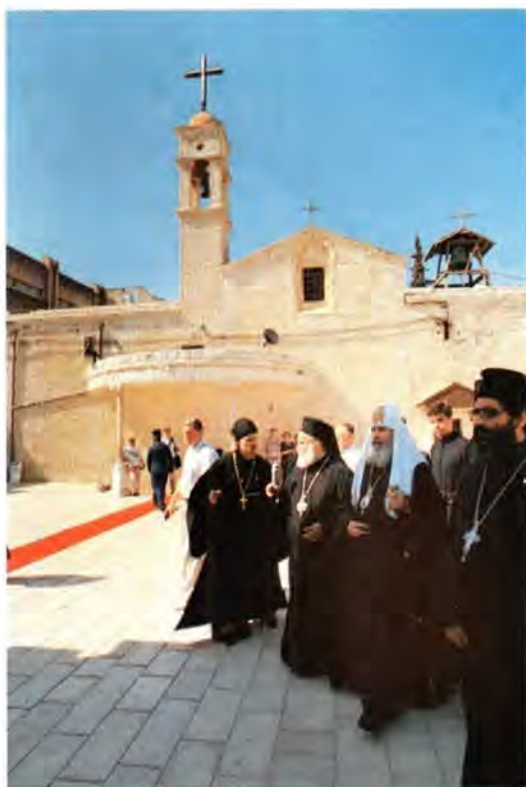
Назарет. Храм Архангела Гавриила

Всякое посещение неизвестной дотоле страны связано с ощущением новизны и представляет много интересного для любознательного путешественника.