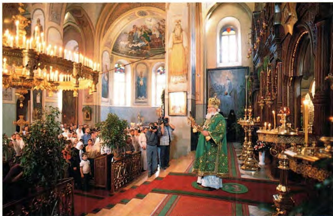
Святейший Патриарх Алексий II в Троицком соборе в день престольного праздника

Во время пребывания в Святом Граде паломники усердно потрудились в Горненской обители,