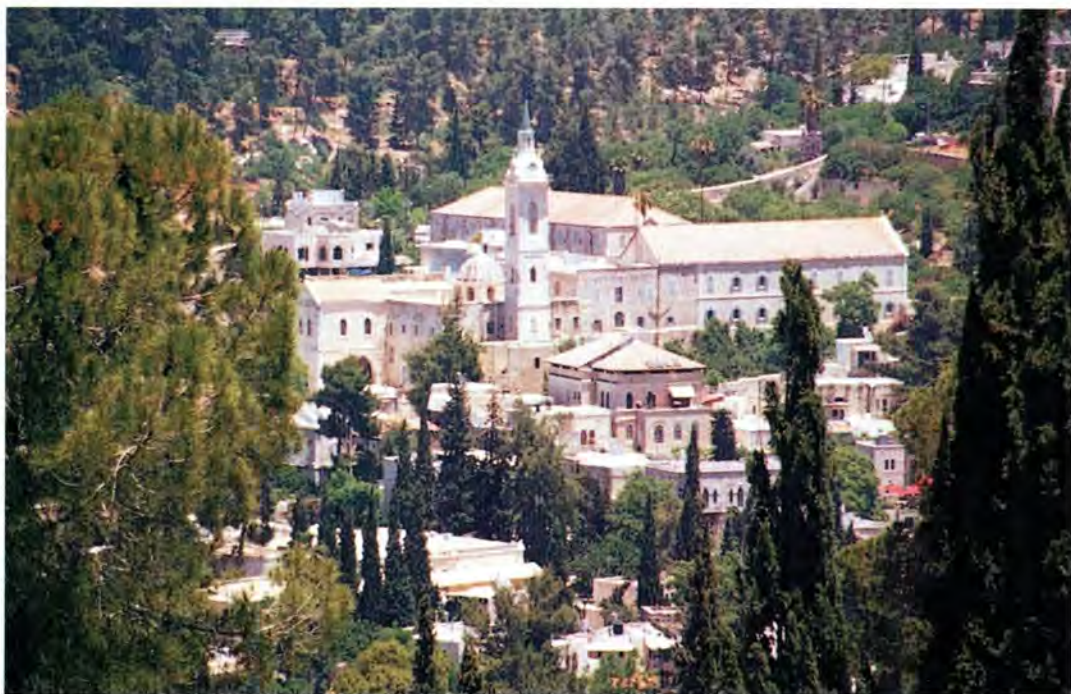
«Айн-Карем». Вид из Горнего монастыря на соседний католический монастырь

После посещения Иерусалимской Патриархии паломники пошли к Храму Воскресения Христова – величайшей святыне христианского мира. Через единственную дверь (вторая замурована) вошли в храм. Перед ними – продолговатая низкая плита, покрытая мрамором. Над ней мерцают восемь больших лампад. Это – Камень Помазания.