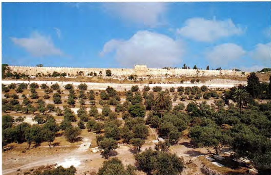
Вид на Иерусалим с Елеонской горы

Из Хеврона паломники поехали по той же дороге в Вифлеем, к Вифлеемскому храму в честь Рождества Христова. Храм этот основан в IV веке по Рождестве Христовом царицей Еленой. Это древнейший храм в Палестине. Построен он в