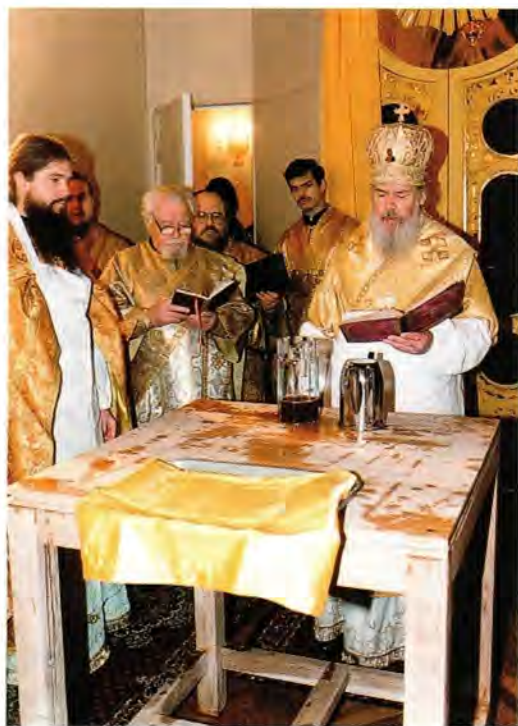
Освящение престола в храме Святой Троицы в селе Ершово

Днем Святейший Владыка посетил Богоявленский собор в Китай-городе и присутствовал на годовичном акте в Московской регентско-певческой семинарии при этом соборе.