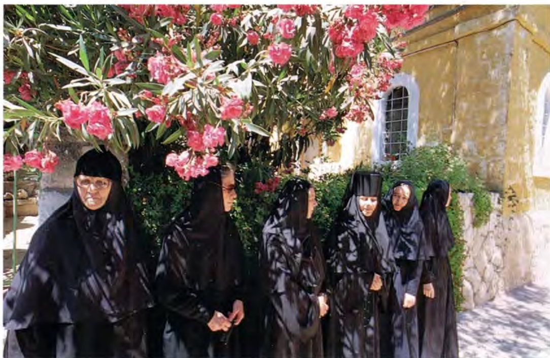
Насельницы русского Горнего монастыря

Прежде всего паломники отправились в Вифлеем. Вифлеем! Сколько священных воспоминаний связано с этим древнейшим городом Палестины! Вифлеем (Бет-лехем) в переводе с древнееврейского значит «Дом хлеба»; так назван он за плодородие своих полей, садов, виноградников, оливковых и масличных деревьев, смоковниц, окружающих его со всех сторон; по свидетельству древних, этот город был некогда торговым и обменным пунктом для местных жителей и приезжих; Вифлеем связан с родом Давида: там, по преданию, родился Давид и там пророк Самуил помазал юношу Давида на царство вместо Саула (1 Цар. 16, 1, 13)