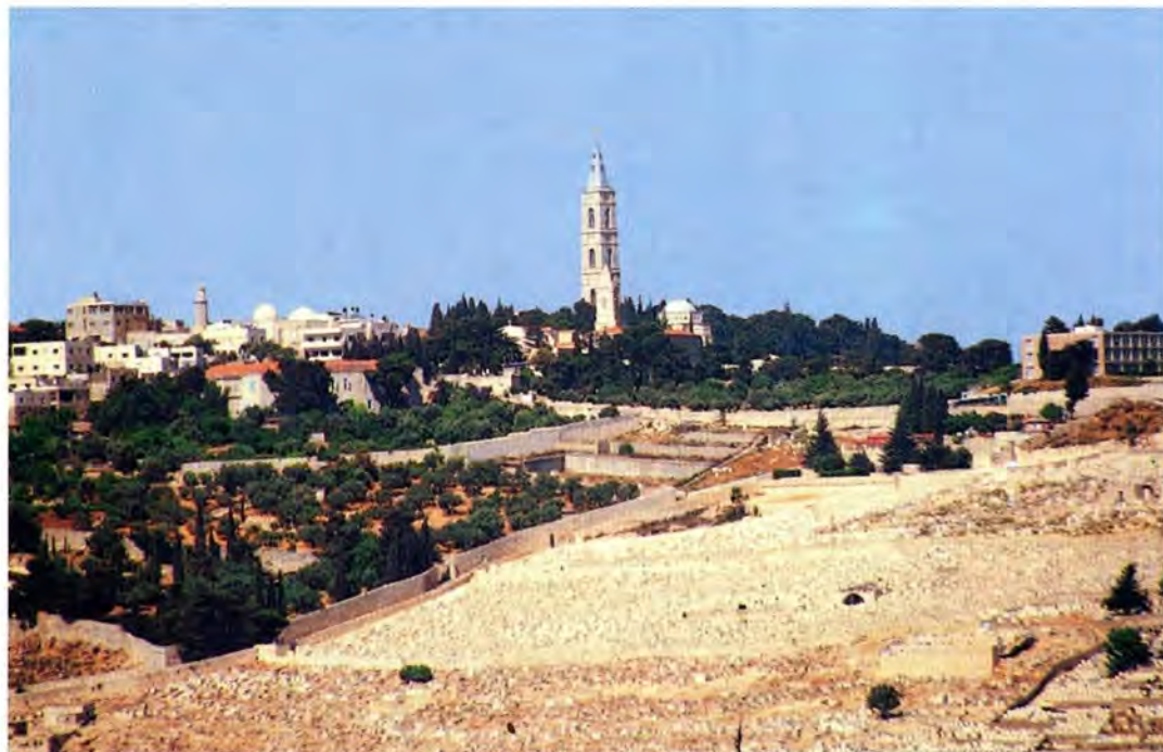
Русский Вознесенский женский монастырь на Елеонской горе

Вот Вифания. Здесь жил Лазарь и его сестры, увековеченные Евангелием. Здесь совершилось