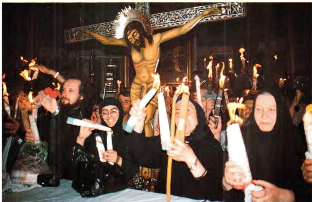
Благодатный огонь в Храме Гроба Господня

творителями на русском участке в Тиверии. Гостиница на Тивериадском озере, возведенная на средства Фонда единства православных народов, была передана Русской Православной Церкви.