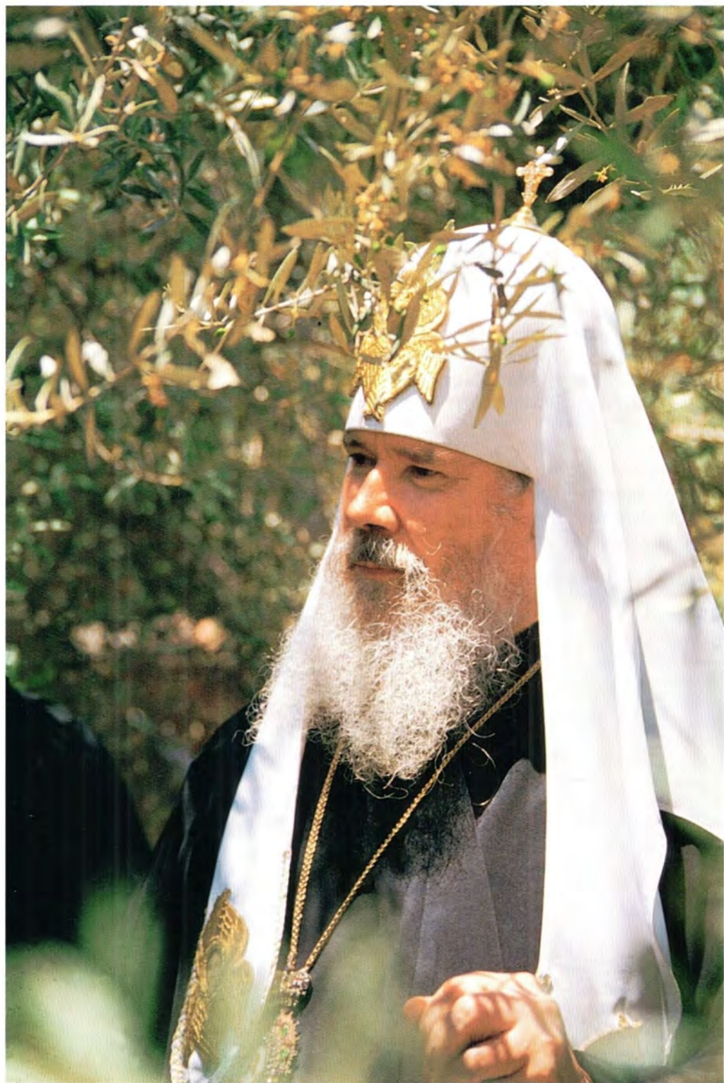
Святейший Патриарх Московский и всея Руси Алексий II на Святой Земле. 1997 год