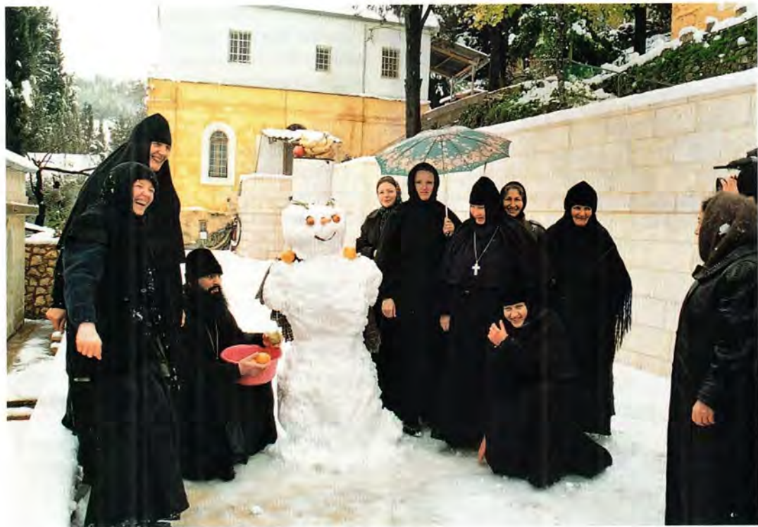
Редкая в Горнем снежная зима. 1998 год

обидели. Они готовы были к смерти. Их постоянно видели в храме – они плакали, словно предчувствовали свой конец. В тот день прибежала схимонахиня Мария и говорит: «Я вижу – их в храме нет. Думаю: почему? Пошла к ним. А они лежат все в крови. Уже скончались». Их мальчик-еврей убил. Он на суде рассказывал, как они просили: «Не убивай!» Дочка просила, она на иврите говорила. Маму-то он сразу убил. А у дочери очень много ножевых ран было – все руки порезаны, видимо, она за нож хваталась. Спрашивали: «Почему ты убил?». «Это мне дух велел», – отвечал.