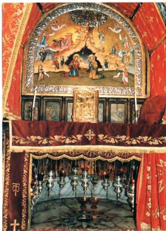
Престол над местом Рождества Христова

Паломники направились в близлежащую Кану Галилейскую – место совершения Иисусом Христом первого чуда (Ин. 2, 1–11). На берегу Геннисаретского озера паломники увидели развалины Капернаумской синагоги – свидетельницы проповеди Спасителя, видели издали храмы на месте чудесного насыщения Им пяти тысяч Его слушателей, окинули беглым взглядом не-