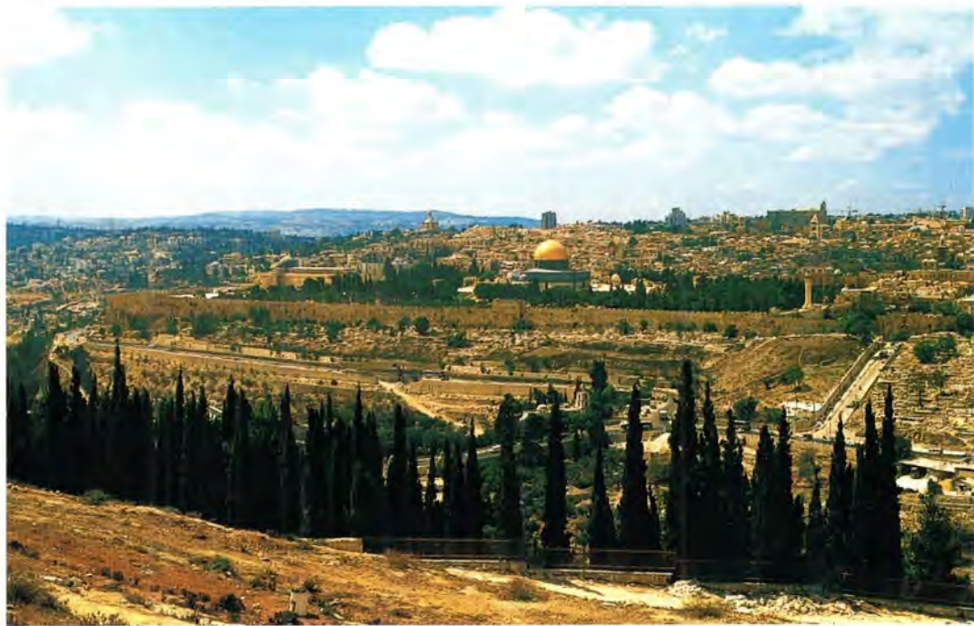
Святой Град Иерусалим. Вид с Елеонской горы

Уже в первые столетия по Рождестве Христовом благочестивые богомольцы предпринимали паломничества к местам земной жизни Спасителя. В начале IV века Святую Землю посетила