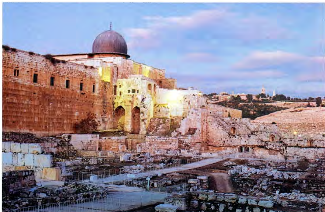
Древние стены Иерусалима

У входа в Гроб Господень на Святейшего Патриарха Алексия возложили мантию красного цвета, епитрахиль и малый омофор. На привет-