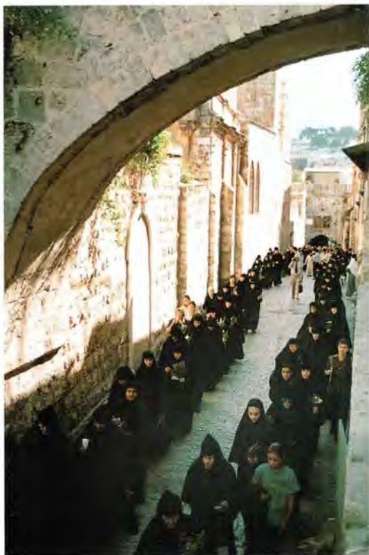
Проводы Божией Матери (за три дня до Успения). Крестный ход от Гроба Господня в Гефсиманию