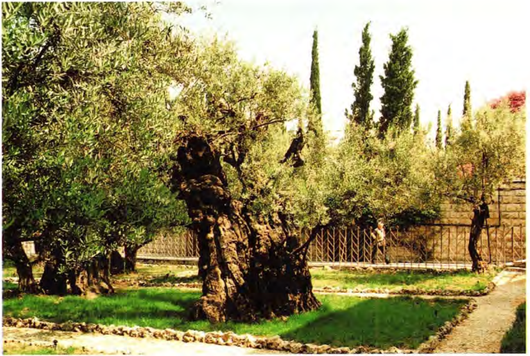
Древние оливковые деревья в Гефсиманском саду

ются. Я часто ездил в арабскую часть страны (все почему-то боятся: как, в Палестину?), так там намного спокойнее себя чувствуешь. Там уважают священство. В Израиле, среди светского населения, тоже ощущаешь себя нормально, но если попадешь туда, где живут религиозные фанатики, то можно нарваться на неприятность. Стоит кого-то слегка задеть – так начнут кричать! Полицию вызовут. Поэтому мы стараемся вообще в такие кварталы не заходить. Вот недавно произошел инцидент с иудейским фанатиком, пытавшимся поджечь храм.