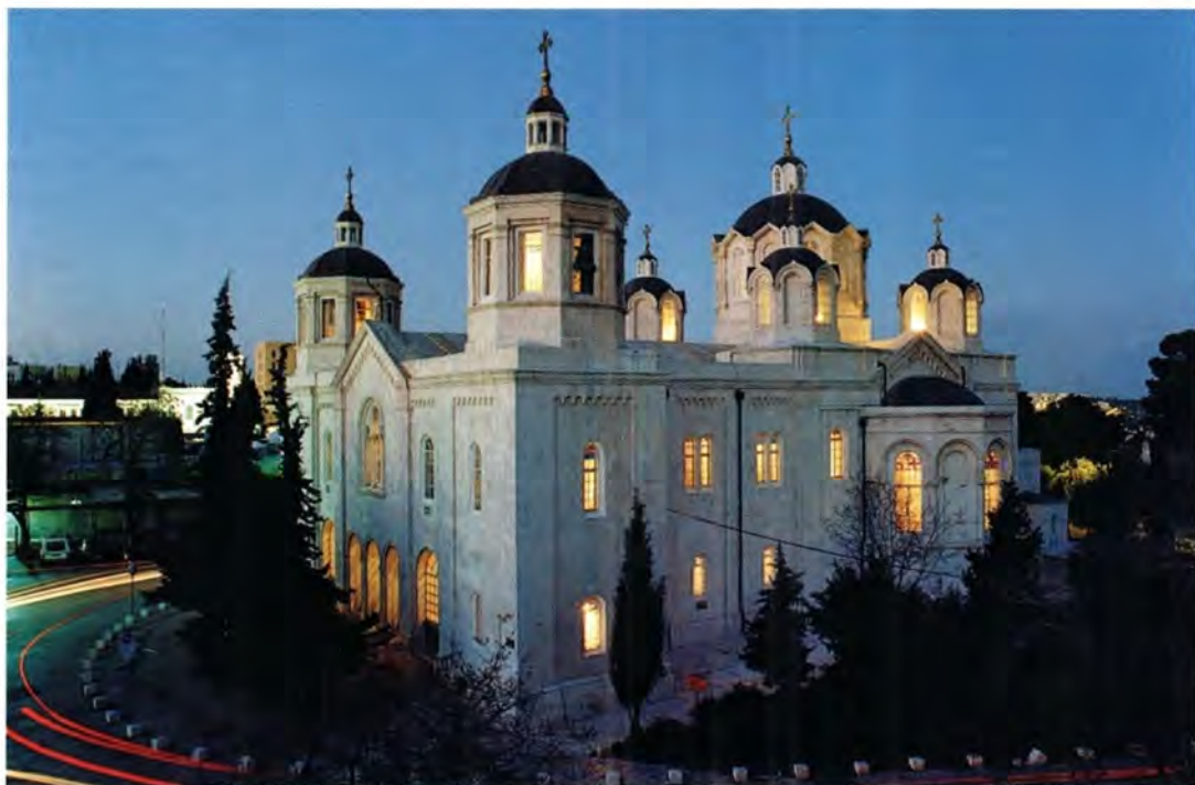
Русский Троицкий собор в Иерусалиме

С 1960 года паломничество в Святую Землю из России (Советского Союза) постепенно начало развиваться. В тот период паломнические группы составлялись из духовенства и работников церковных структур и, как правило, возглавлялись архиереем. Сначала паломнические поездки приурочивались к