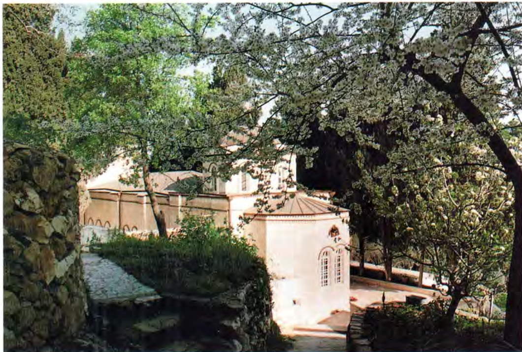
Храм в честь Казанской иконы Божией Матери в Горнем монастыре

несенского монастыря, которые приняли Патриарха Московского, даже были похоронены вне кладбища. Они и рады были бы уйти, но не смогли.