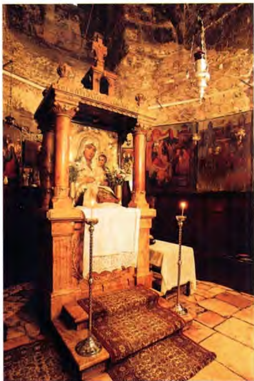
Иерусалимская икона Божией Матери. Храм Успения в Гефсимании

империя и мандат на управление Палестиной получила Великобритания.