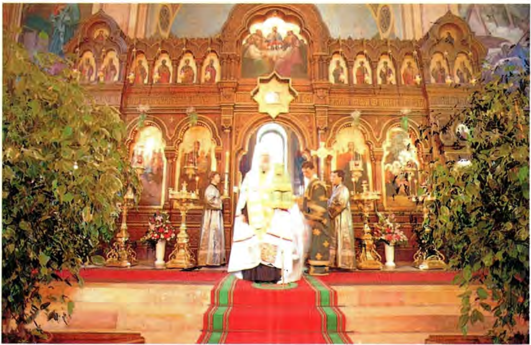
Праздник Святой Троицы в 1997 году. Троицкий собор Русской Духовной Миссии

же отправили благодарственную телеграмму в Москву на имя Святейшего Патриарха Алексия II, в которой выражалась надежда на то, что акция, осуществленная благодаря политике перестройки и расширению гражданских свобод населения Советского Союза, станет вехой на пути возрождения старинной традиции массового паломничества российских христиан в Святую Землю.