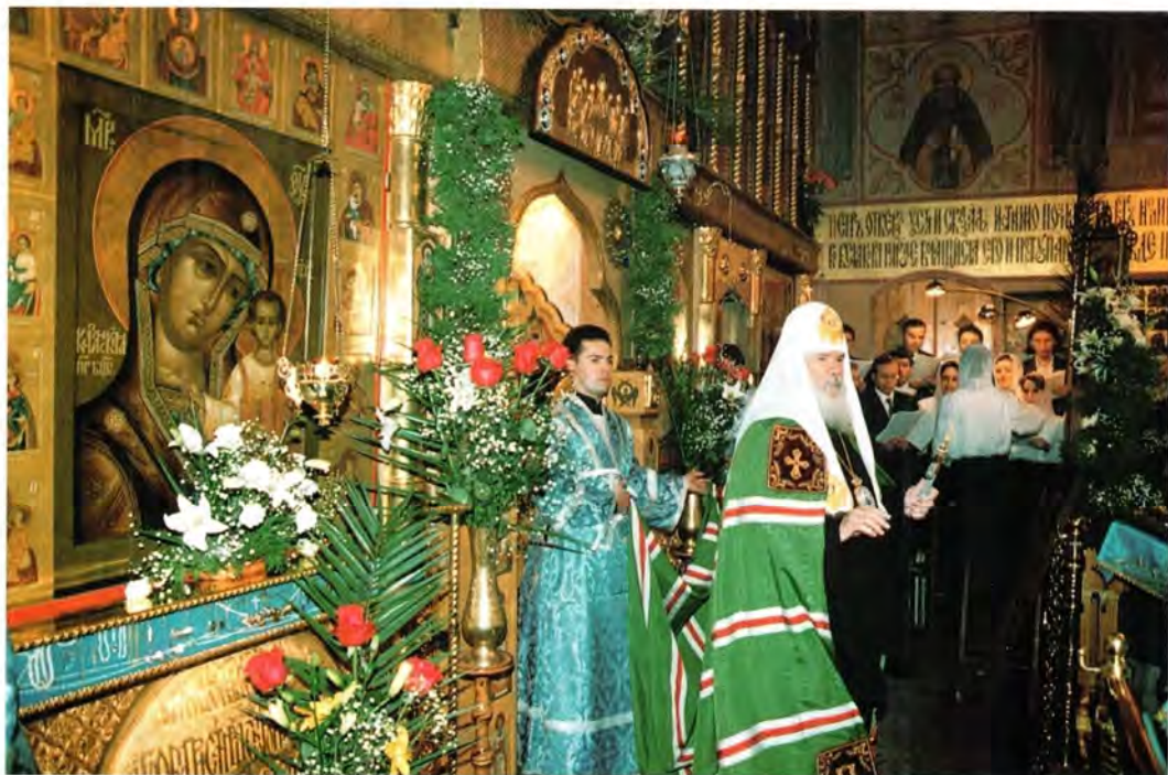
В Казанском соборе на Красной площади. 4 ноября 1999 года