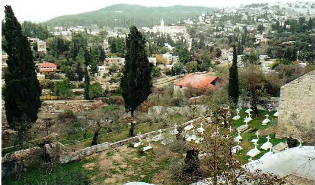
Вид на «Айн-Карем». На переднем плане – кладбище Горнего монастыря

Но сегодня отношения с греками у нас хорошие. Бывают, правда, отдельные случаи небратского отношения со стороны некоторых греческих клириков.