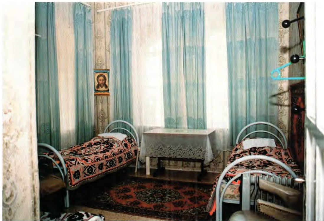
Монашеская келья в Горнем

Взять хотя бы последних горненских мучениц – монахинь Варвару и Веронику, которые были убиты в 1983 году. Смерть претерпеть, да еще мученическую, на Святой Земле – это награда. Не каждого Господь такого удостоивает. А эти матушки никого никогда не