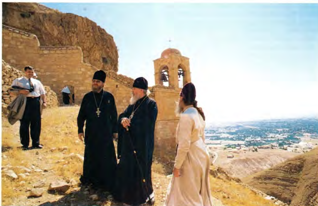
Святейший Патриарх Алексий II на Сорокадневной горе

ные справа и слева от алтаря и выполненные в византийском стиле. Следующая остановка была в Капернауме. Здесь паломники осматривали остатки синагоги, где Господь исцелил бесноватого (Лк. 4, 31–35), место, где стоял дом святого Апостола Петра.