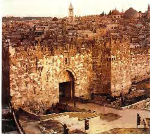
Дамасские ворота в Иерусалиме

Возвращаясь с Сиона обычно к вечеру, паломники начинают собираться к утрени Великого Пятка – чтению 12-ти Евангелий. И эта служба, и последующие (вынос Плащаницы, утрена Вели-