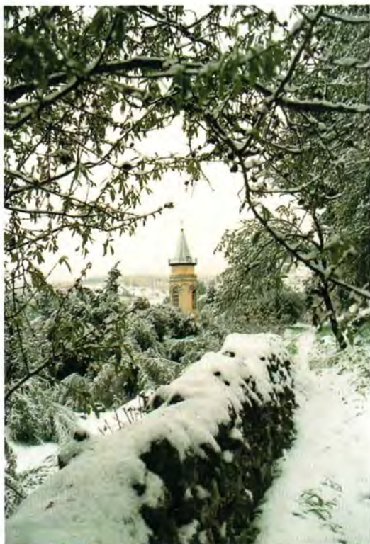
Виды Горнего под снегом

из Пюхтицкого монастыря, на них в общем-то наш монастырь тогда и держался) все изменилось. Через несколько дней подошел ко мне один: «Батюшка, мне бы поисповедоваться», затем другой. Через 10 дней уезжали они от туда настоящими паломниками.