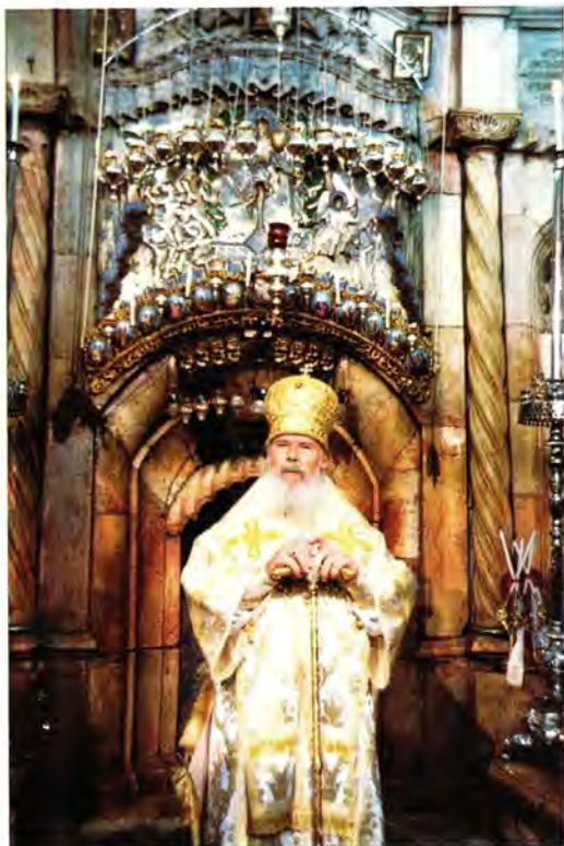
Святейший Патриарх Алексий II перед Кувуклией в Храме Гроба Господня

помогая насельницам в исполнении трудоемких работ. Прибыв обратно в Тель-Авив, часть паломников на следующий день посетила русский участок, расположенный недалеко от Яффы, где за имуществом Русской Духовной Миссии постоянно присматривали две монахини.