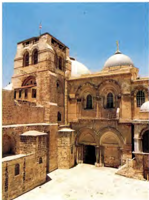
Вход в Храм Воскресения Христова (Гроба Господня) в Иерусалиме

ее. Публикуемые в «Журнале Московской Патриархии», они давали православным читателям в России (Советском Союзе) возможность хотя бы мысленно побывать в святых местах Палестины, увидеть их глазами современников. Напомним, что это были годы хрущевских гонений на Русскую Православную Церковь. У людей, живших в стране, где официальной идеологией был атеизм, не было никакой надежды на то, что они когда-нибудь смогут совершить паломничество в Святую Землю, и рассказы о ней очевидцев были особенно драгоценны.