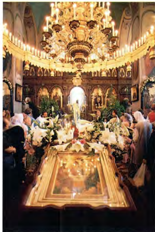
В Троицком соборе Русской Духовной Миссии. Праздник Святой Троицы

9 сентября 1990 года паломники ступили на Святую Землю. Основная цель долгого и трудного путешествия была достигнута. Они сразу