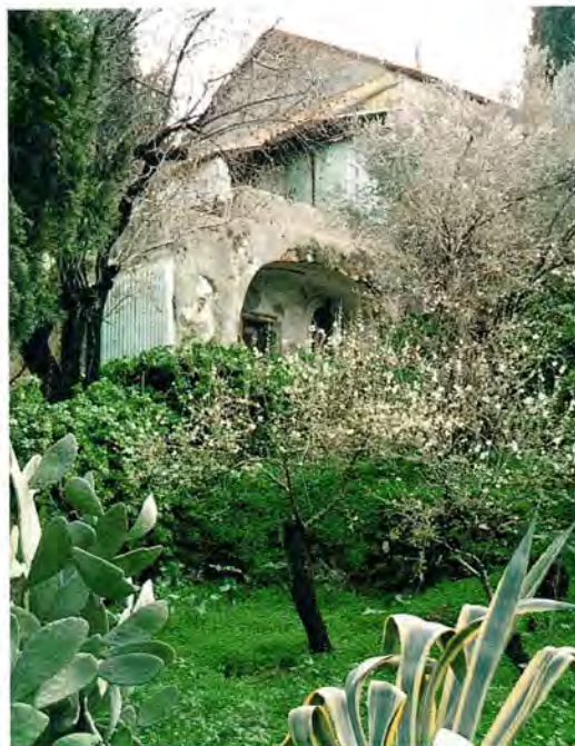
Один из домиков, в которых живут насельницы Горнего монастыря

Мы, скорее, были как два крыла у птицы: на ней все административные,