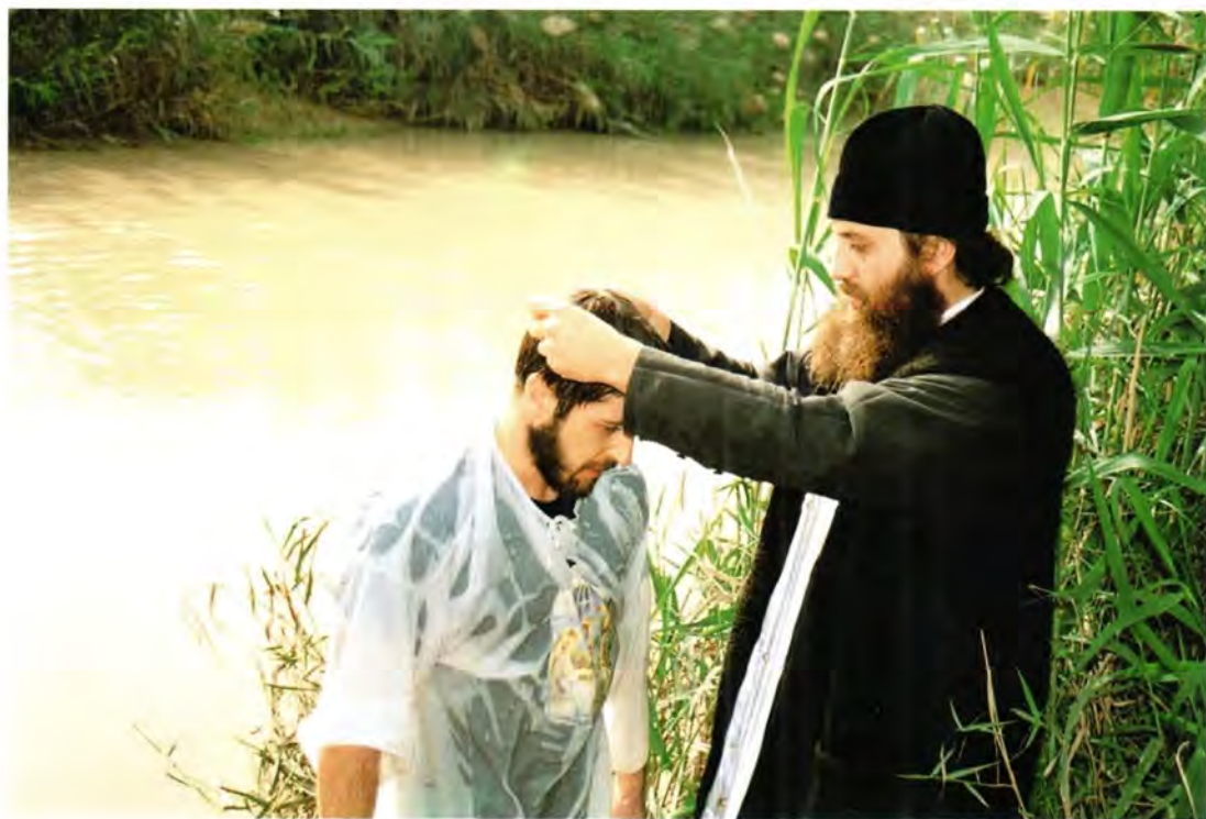
Крещение в Иордане в Крещенский сочельник

паломнических групп в Святую Землю. Так я стараюсь заранее позвонить в монастырь и попросить, чтобы ту или иную группу сопровождала определенная монахиня. Хотя в Горнем и так самых лучших монахинь посылают сопровождать паломников. Это очень тяжелое послушание, очень. Порой бывает, что сестры возвращаются из поездки и пластом лежат. Представляете, в группе 50 человек. Одному то надо, другому другое, водитель чем-то своим возмущается. Я однажды решил испытать – что, думаю, здесь тяжелого, подумаешь, поехали, рассказали... Так я полпути проехал и не выдержал, вышел и говорю: «Матушка, я больше не могу. Просто не могу». Я не выдержал, а они должны выдерживать. Вот такое наши матушки послушание несут.