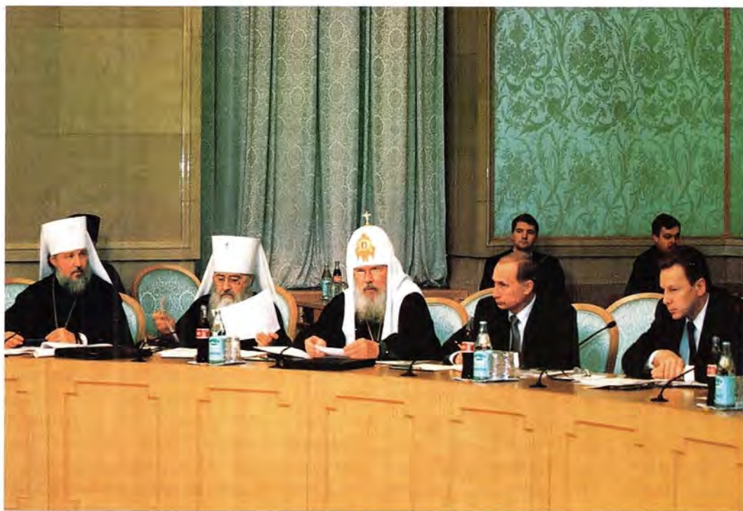
Святейший Патриарх Алексий выступает на заседании Российского организационного комитета

ментом предстоящих торжеств. В то же время мы открыты к взаимодействию со светским миром в подготовке к встрече третьего тысячелетия и уважаем мнение тех, для кого основной смысловой акцент празднования связан с наступлением Нового года.