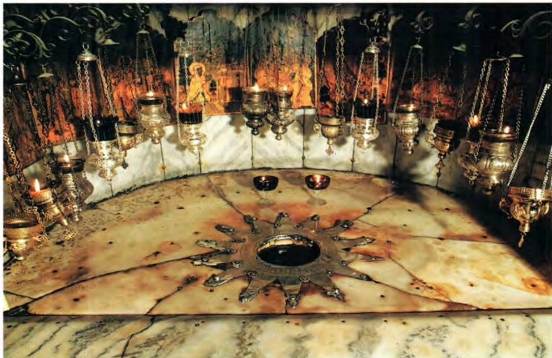
Вифлеемская звезда, которой отмечено место Рождества Спасителя