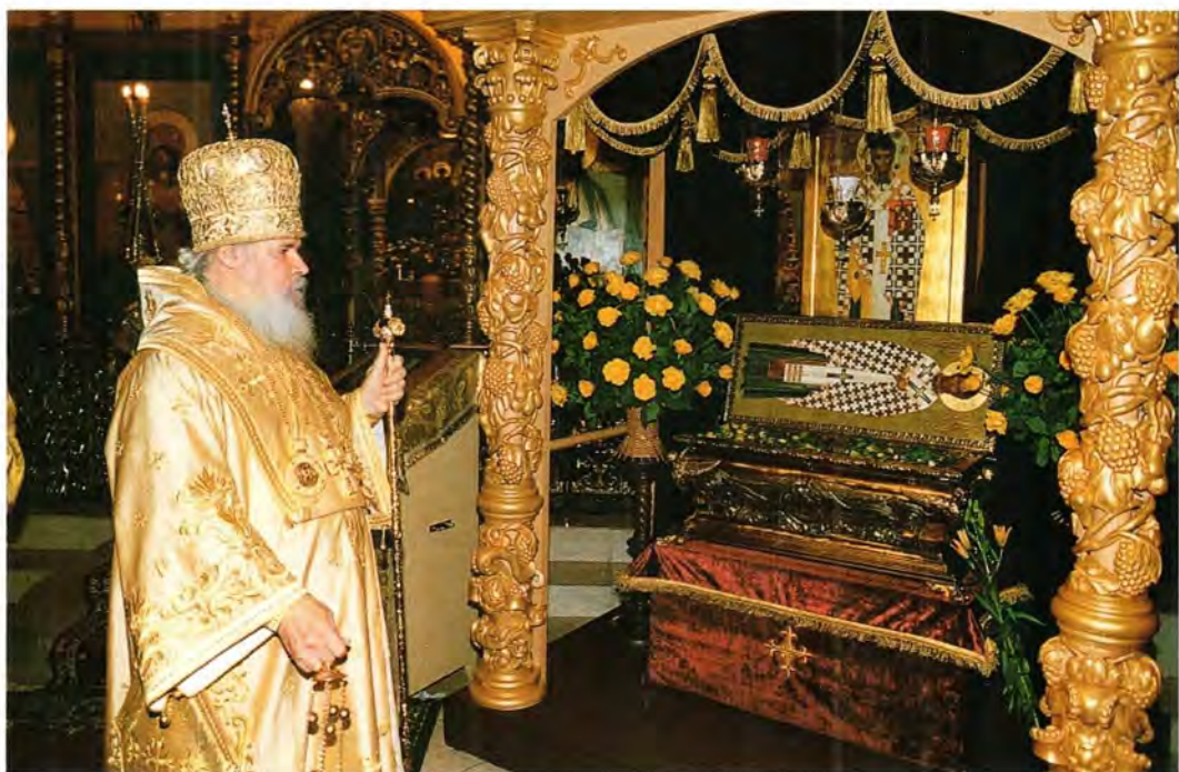
Святейший Патриарх Алексий у мощей святителя Григория Неокесарийского

епископы Филиппопольский Нифон (Антиохийский Патриархат), Оломоуцкий и Брненский Христофор (Православная Церковь Чешских земель и Словакии).