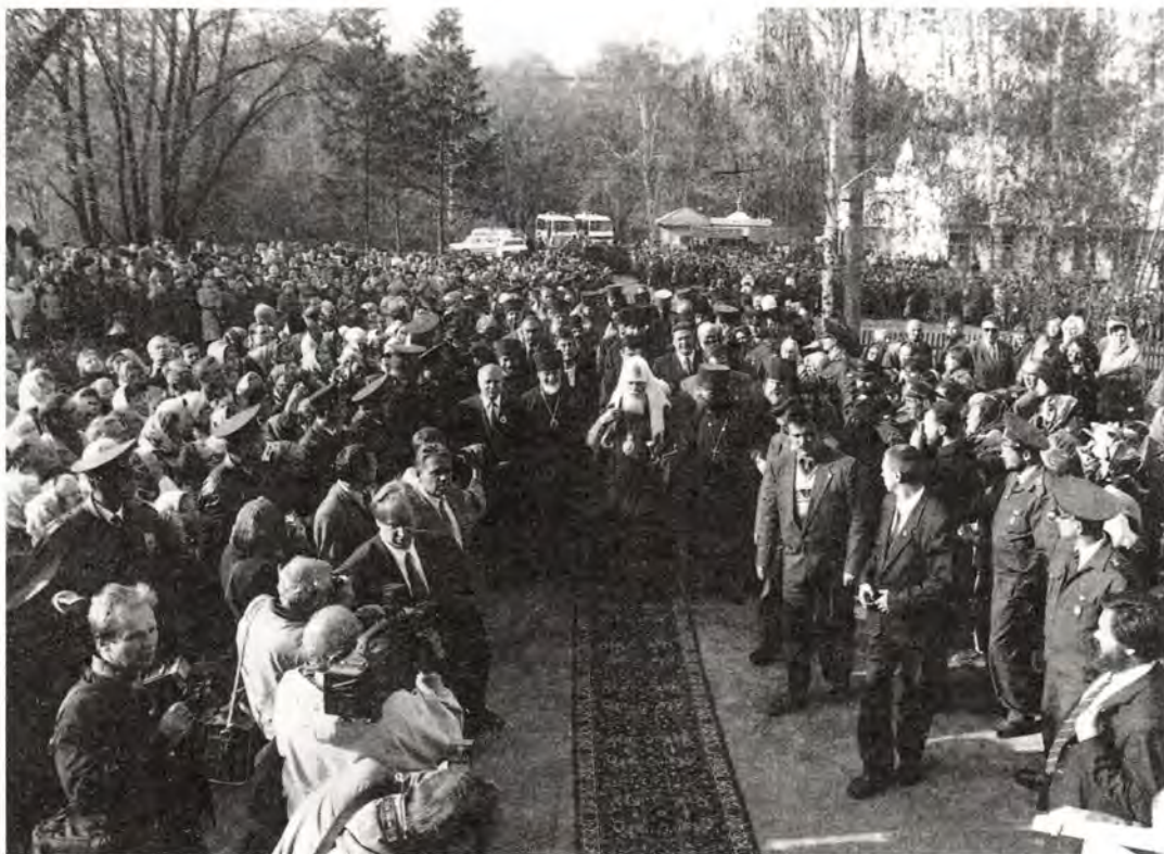
Первосвятительское посещение прихода во имя святых равноапостольных Мефодия и Кирилла, учителей Словенских

строящегося кафедрального собора во имя святых равноапостольных Мефодия и Кирилла, учителей Словенских. Приходская община существует здесь уже пять лет, а богослужения пока проводятся в маленьком храме, который по завершении строительства собора предполагается сделать крестильным.