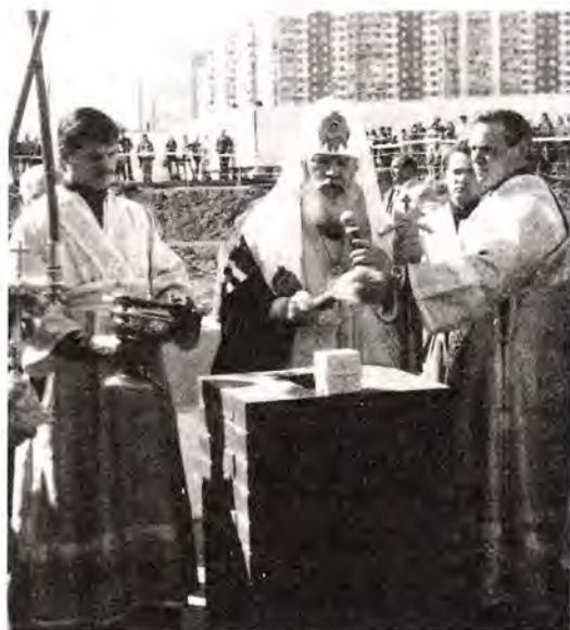
Освящение закладного камня

гию в марьинском храме совершил архиепископ Истринский Арсений.