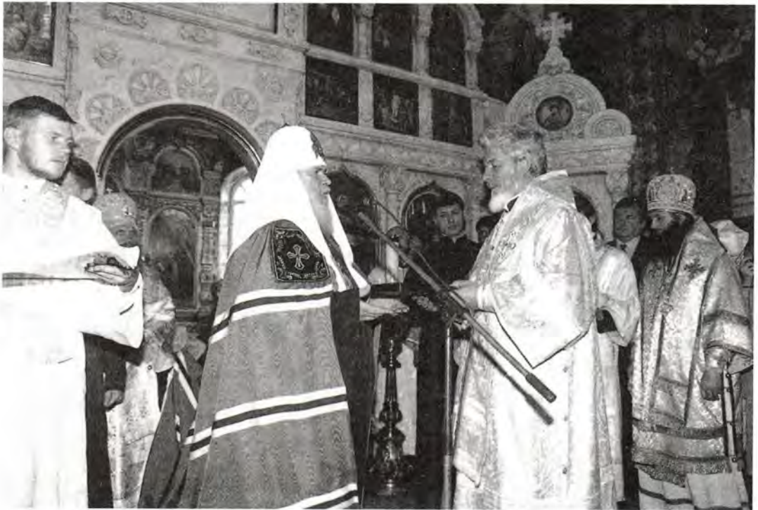
Праздничная всенощная в Покровском соборе

Жизнь горожан самым тесным образом связана с этим предприятием, отчего город Тольятти нередко называют Автоградом. В 1981 году православные тольяттинцы духовно окормлялись в единственном деревянном молитвенном доме, а ныне в городе с почти семи-