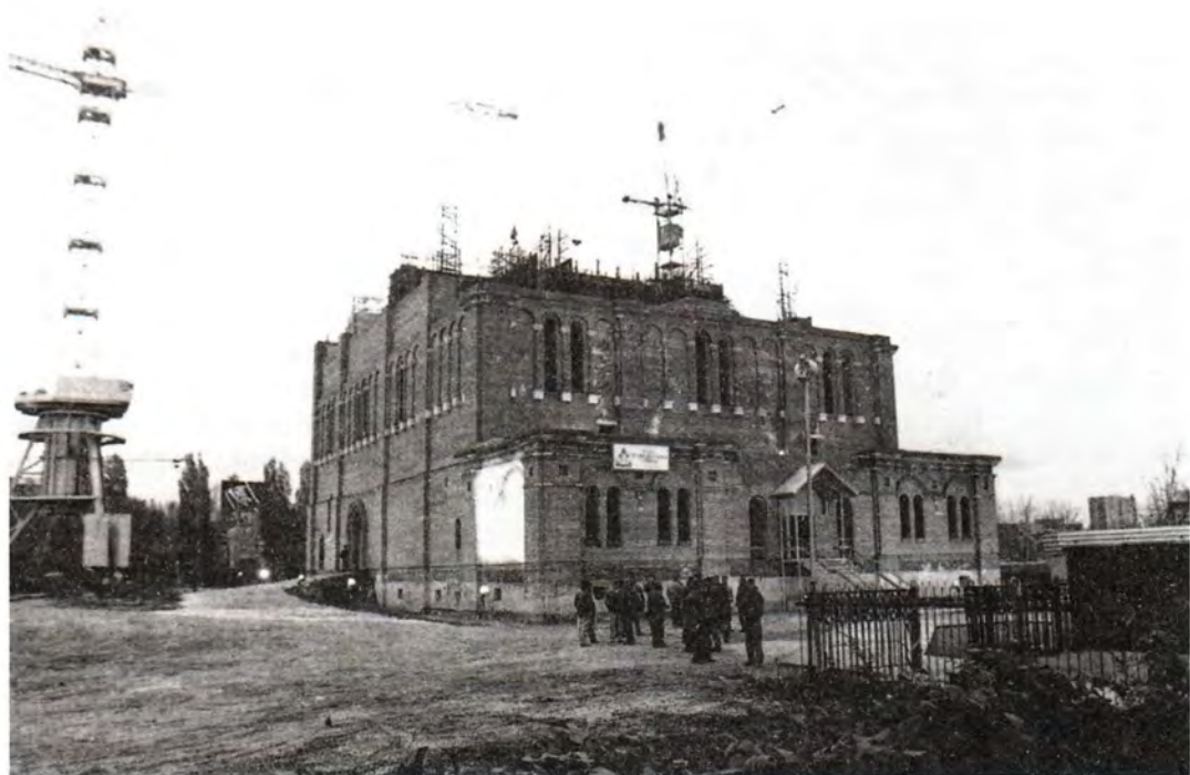
Сердце будущего церковного комплекса города Тольятти – строящийся Спасо-Преображенский храм