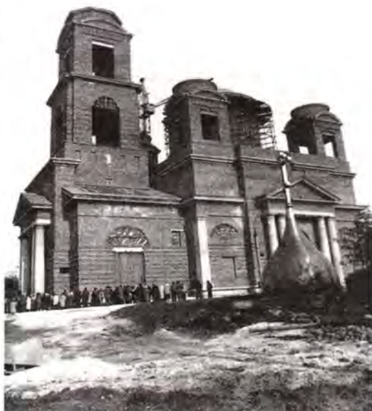
Строящийся Кирилло-Мефодиевский храм

Первосвятитель Русской Православной Церкви пожелал своей самарской пастве милостей от Господа, терпения в несении жизненного креста, здоровья, мужества и мудрости, возрастания в христианских добродетелях, чтобы до-