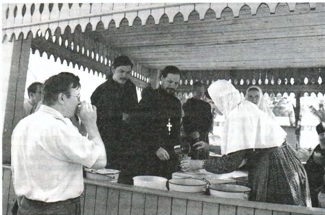
Насельницы Свято-Введенского Толгского монастыря угощают паломников квасом