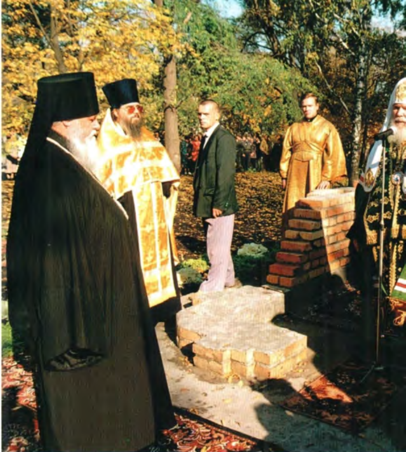
Закладка камня в основание часовни на месте бывшего Спасского кафедрального собора в Пензе. 2 октября 1999 года