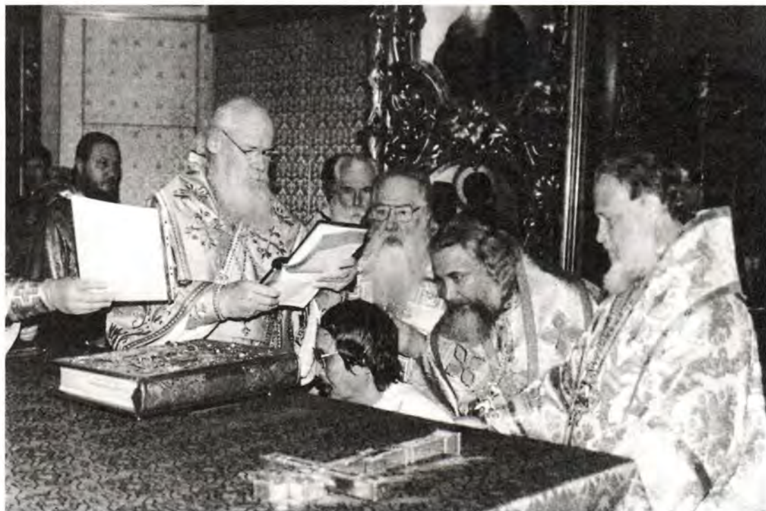
Хиротония архимандрита Даниила во епископа Киотоского

оказывать сугубую честь, особенно тем, которые трудятся в слове и учении (1 Тим. 5, 17). Я понимаю, что в обязанности епископа входит и сохранение мира в Церкви, и активизация ее просветительной деятельности.