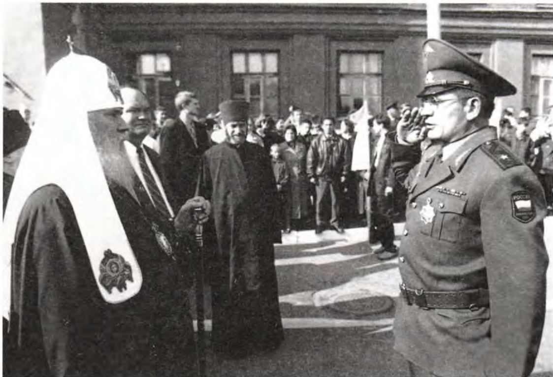
Встреча Святейшего Патриарха в Пензенском артиллерийском институте