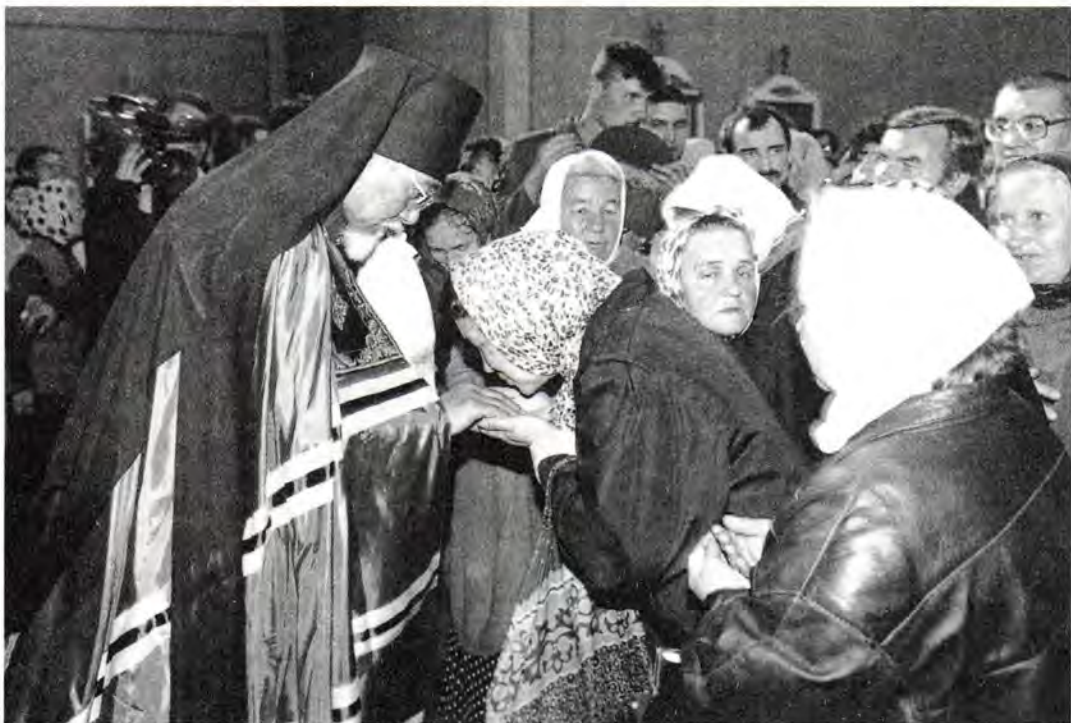
Новопоставленный епископ Петр благословляет православных москвичей

лась без архипастырского окормления. Ныне по воле Пастыреначальника Господа Иисуса Христа из среды этого благочестивого народа, как плоть от плоти его, восстает новый иерарх, и Матерь-Церковь возлагает на тебя, этого избранника, высокие и ответственные церковные послушания, которые ты должен исполнять во славу Божию и для спасения своего народа.