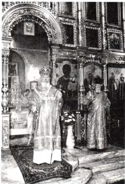
Святейший Патриарх Алексий во время богослужения

Христианская жизнь духовенства, братии и прихожан храма выходит церковными воротами на широкое миссионерское поприще. Православное слово уверенно звучит в средствах массовой информации. Более двух лет студия местного кабельного телевидения «Аметист» транслирует телевизионные передачи «Живоносный Источник». Часовой