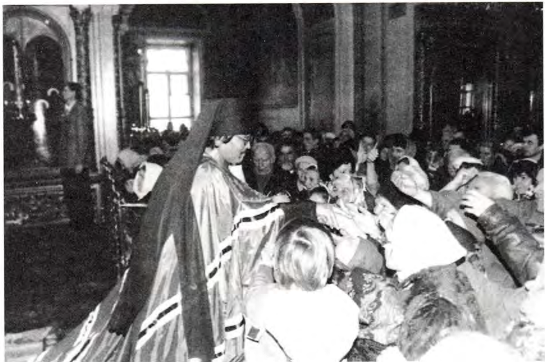
Первое благословение новопоставленного епископа

Сохрани эту веру до конца дней своих, как сохраняли и передавали ее друг другу твои благочестивые предшественники – от святителя Николая, архиепископа Японского, до престопамятного митрополита всей Японии Феодосия.