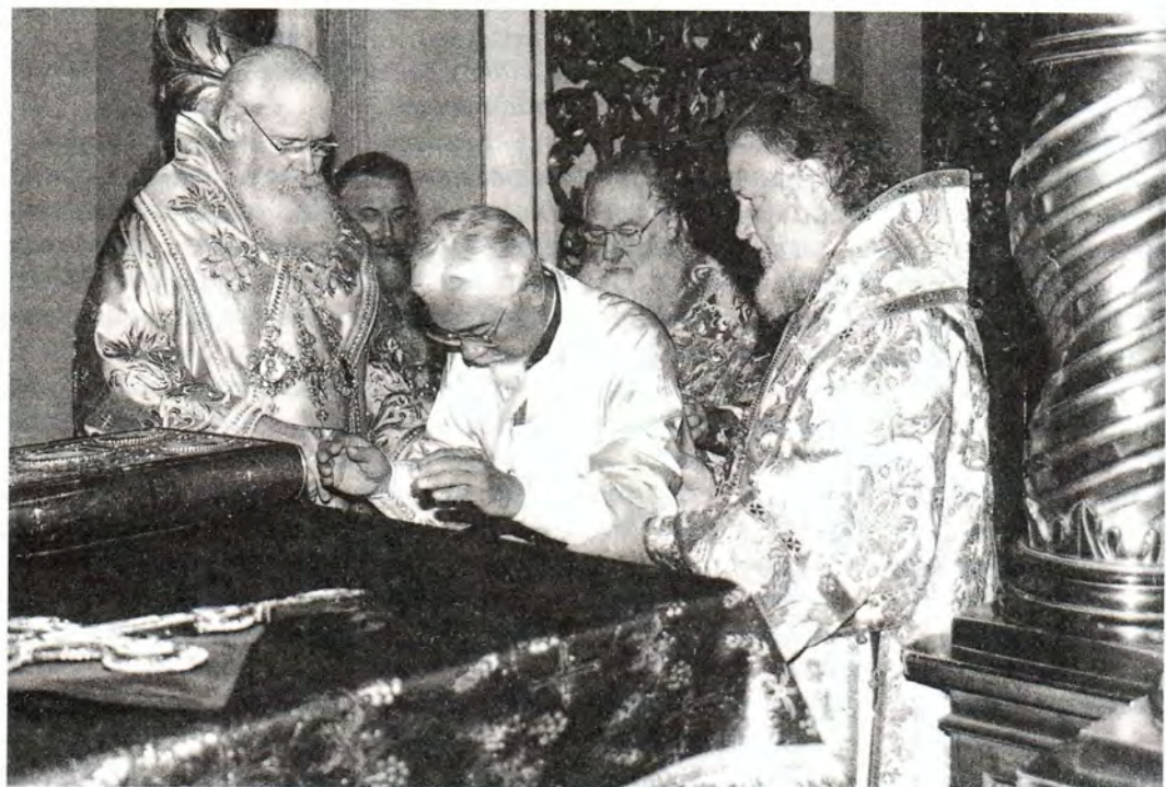
Молитва перед хиротонией