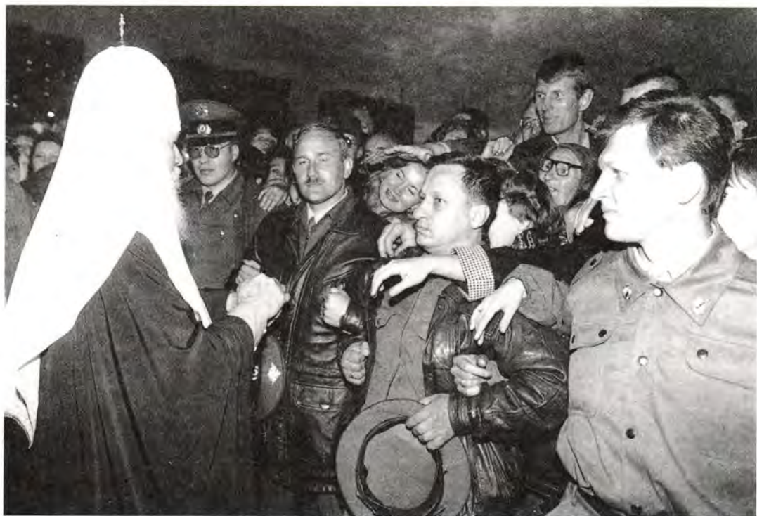
«Благословите, Ваше Святейшество!»

К 55-летию Победы нашего народа в Великой Отечественной войне на городской площади Славы будет возведен храм-памятник во имя святого великомученика и Победоносца Георгия. Строительство, в поддержку которого в свое время было собрано шесть тысяч подписей горожан, предполагается осуществить на народные пожертвования: средства на это благое дело уже внесли около двухсот человек. Значительную часть работ предприятие-под-