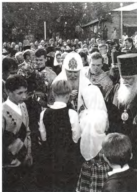
Патриаршее благословение юным пензенцам

теплые слова и радушный прием. «Знаменательно, – отметил он, – что мы начинаем молитвенные торжества, посвященные 200-летию Пензенской епархии, с посещения этого храма, который не прекращал духовного окормления православных людей в тяжелые десятилетия борьбы с верой, с Церковью, геноцида против верующего народа. Здесь всегда совершалась служба Божия, люди получали духовное утешение и укрепление в своем жизненном подвиге, несении своего жизненного креста. Мы знаем, что на этой земле родились многие выдающиеся деятели русской истории и культуры. Это свидетельствует о том, что Пензенская земля благодатная... Несколько часов нашего пребывания здесь показали, что существует взаимопонимание между властями светскими и духовными, ими осознается необходи-