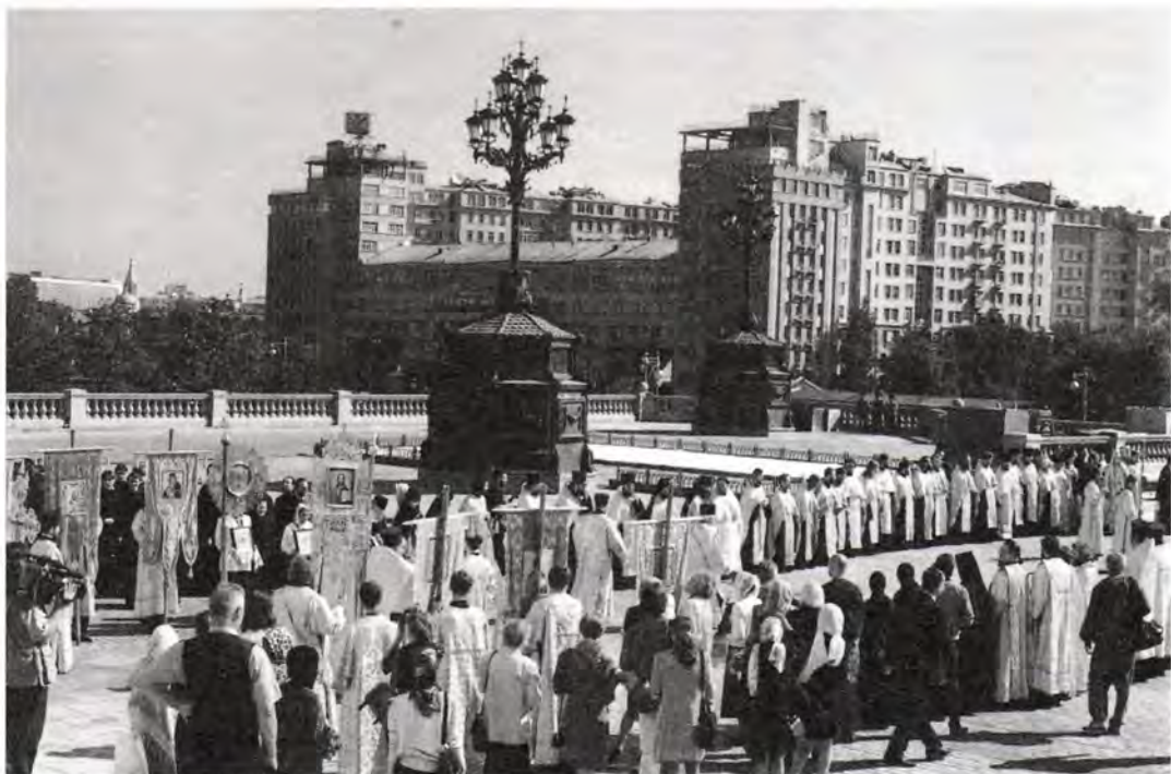
Торжественная встреча крестного хода в Москве у Храма Христа Спасителя

путь теплоход «Святой князь Владимир», на борту которого священнослужители и паломники продолжили путь крестного хода.