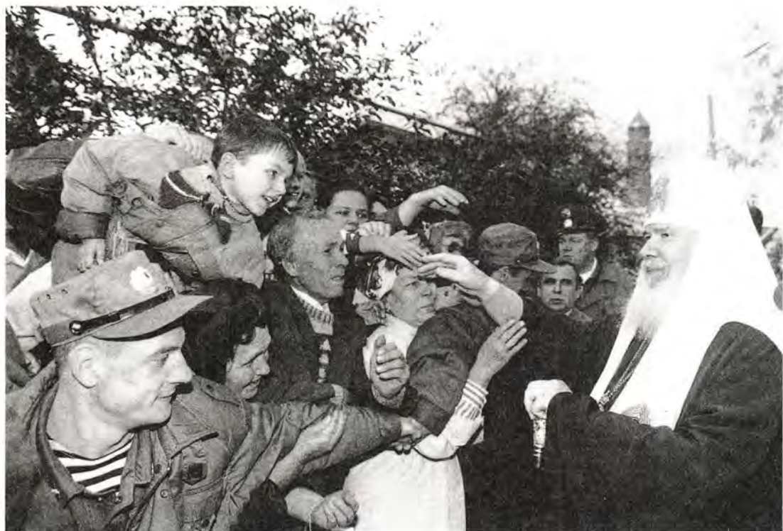
Святейший Патриарх с прихожанами Казанского храма города Тольятти

сотысячным населением действуют девять православных приходов и во множестве создаются новые. Святейший Патриарх ознакомился с жизнью старейшего храма города в честь Казанской иконы Божией Матери. Он был возведен в 1985 году на месте Казанско-Богородицкого молитвенного дома, куда были перенесены иконы и утварь из Троицкого кафедрального собора, разрушенного в 1953 году, когда большая часть старого Ставрополя попала в зону затопления Куйбышевского водохранилища.