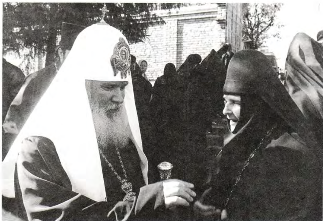
Святейший Патриарх Алексий с настоятельницей Свято-Троицкой женской обители игуменией Митрофанией (Перетягиной)