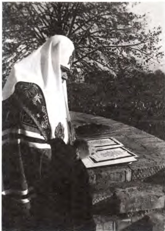
Святейший Патриарх подписывает закладную грамоту в основание храма-памятника во имя святого великомученика и Победоносца Георгия

Как и в других местах, у часовни Святейшего Владыку приветствовали православные самарцы. В интервью местным журналистам, освещавшим визит, Его Святейшество сказал: «Думаю, что главным богатством этого края являются люди – добрые, сердеч-