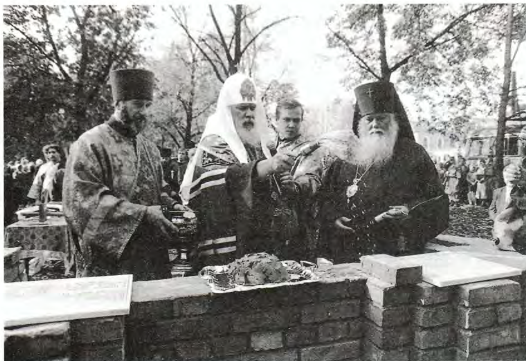
Закладка памятной часовни на месте разрушенного Спасского кафедрального собора

Собор посещали Российские Государи: от Александра I до Николая II.