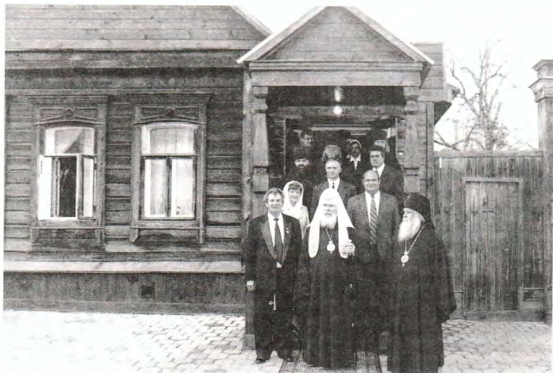
У Дома-музея В. О. Ключевского