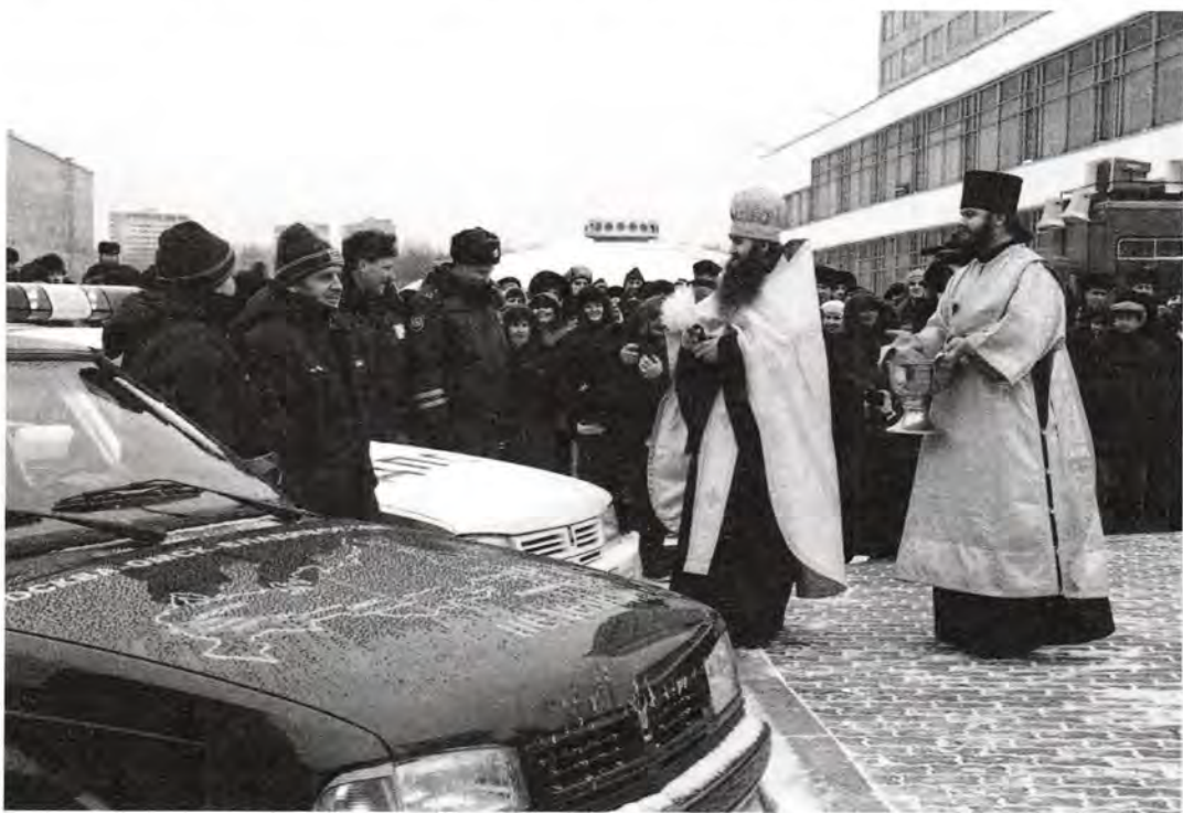
Перед началом автопробега

Уже ощущается, что заводчане с появлением часовни немного изменились. Конечно, у этого строительства были и противники, но я хочу сказать, что в целом атмосфера на предприятии стала более доброжелательной. Мы нашли людей из числа верующих, которые уха-