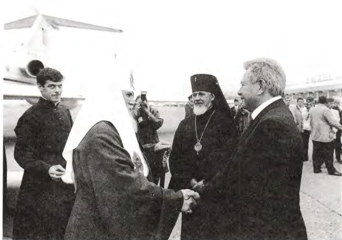
Встреча Предстоятеля Русской Православной Церкви в аэропорту Самары

множество православных просветительных центров. На телевидении и радио Самарской губернии регулярно выходят православные передачи, выпускается несколько епархиальных периодических изданий. Стали уже традиционными ежегодные Иоанновские и Кирилло-Мефодиевские чтения, участие в которых принимают клирики и представители светской науки и образования. Крепнет сотрудничество епархии с военными, с правоохранительными и пенитенциарными учреждениями. Живое и действенное развитие духовных православных традиций на Самарской земле несомненно является заслугой правящего архипастыря.