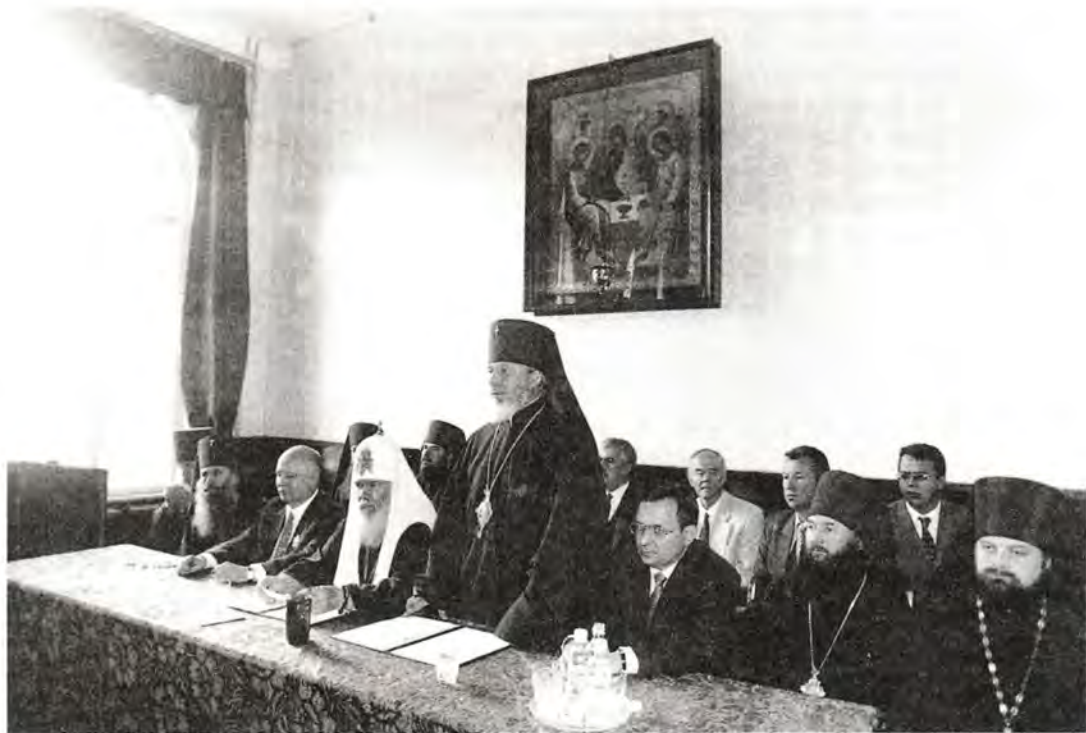
Торжественное заседание в Самарской Духовной семинарии

«Россия, а затем СССР, отличались высоким уровнем подготовки своих кадров, – напомнил он. – Но в течение семидесяти лет в программах наших светских вузов и средней школы был определен пробел, связанный с тем, что не преподавались духовные основы – о них не говорили, это была запрещенная тема... Ныне основы православной педагогики уже преподаются в ряде вузов Самары. В некоторых местах пытаются ввести преподавание религиоведения, но мне кажется, что чаще всего ведут этот курс бывшие лекторы научного атеизма, и поэтому происходит размывание понятий: православие, католицизм, протестантство и секты – все ставится в один ряд. Самара все-таки город православный – я неоднократно об этом здесь слышал и считаю, что в школах Самары надо вводить курс православной педагогики или православной культуры, чтобы при-