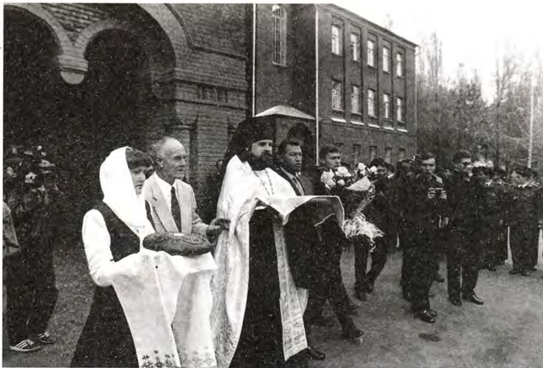
Встреча Святейшего Патриарха Алексея в Самарской Духовной семинарии

Одним из главных событий следующего дня визита явилось посещение Святейшим Патриархом Самарской Духовной семинарии. Ее преподаватели и учащиеся собрались на встречу Первосвятителя Русской Православной Церкви в своем домовом храме, освященном во имя преподобных Кирилла и Марии – родителей Преподобного Сергия Радонежского. В честь прибытия Святейшего Владыки в семинарии состоялось торжественное заседание с участием руководства области и города, представителей высших учебных заведений и православной общественности. Святейший Патриарх Алексей с удовлетворением констатировал наличие доброго сотрудничества между Самарской Духовной школой и светскими вузами города.