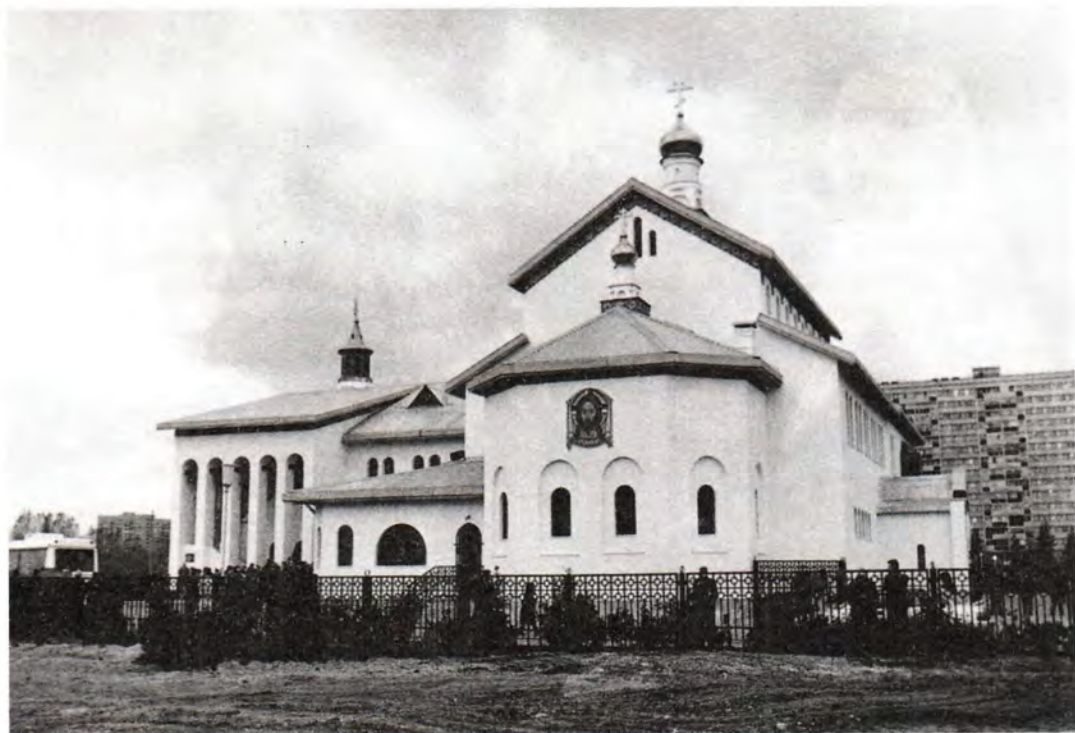
Крестильный храм во имя святого Иоанна Предтечи