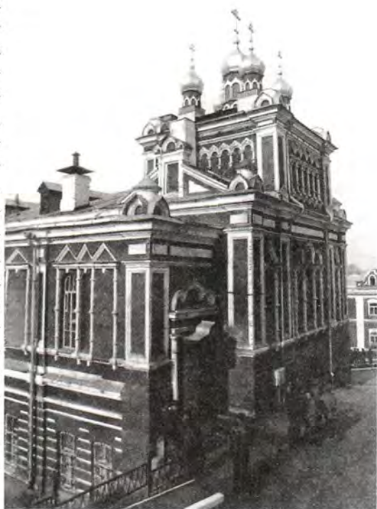
Храм в честь Иерусалимской иконы Божией Матери Иверского монастыря