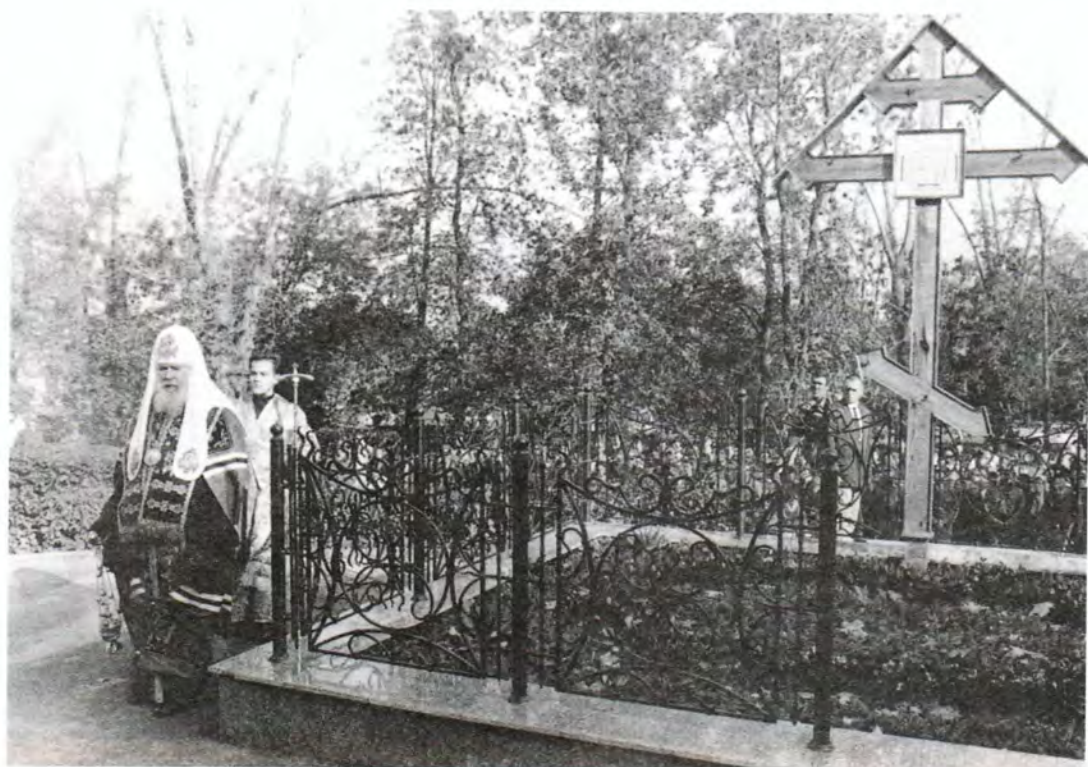
Лития на месте захоронения Пензенских архипастырей