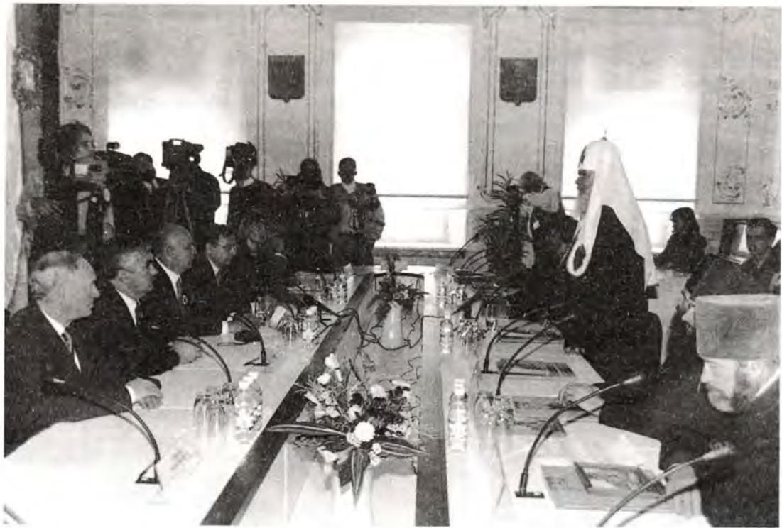
Посещение городской администрации

ное для Вас выпало время. Дай Бог, чтобы любви Вашего большого сердца хватило бы и на нас, а мы постараемся сторицей воздать Вам за отеческую любовь и попечение».