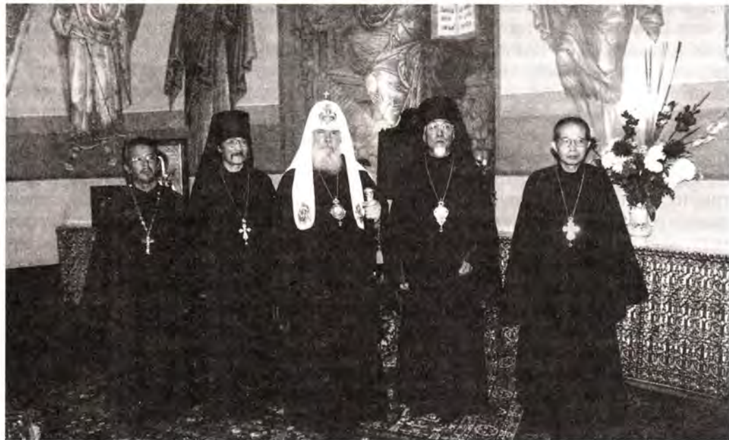
Святейший Патриарх Алексий с делегацией Японской Православной Церкви

Японская Православная Церковь существует на пожертвования своей паствы: ежемесячно каждая православная семья делает взнос на Церковь, также и по большим праздникам. Православная Церковь в Японии имеет статус обычной религиозной организации, государство ничем не помогает ей, но и не чинит никаких препятствий в ее деятельности.