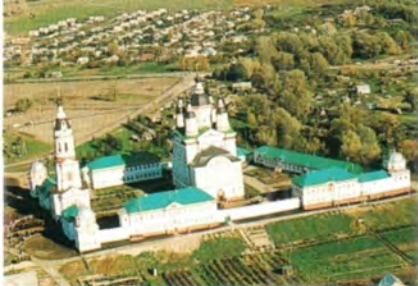
Троице-Сканов женский монастырь в городе Наровчате Пензенской епархии