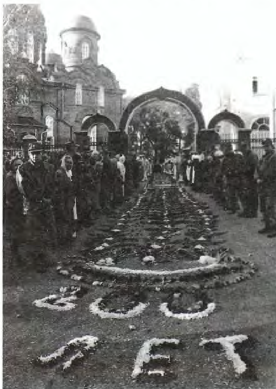
Встреча Святейшего Владыки возле Успенского кафедрального собора