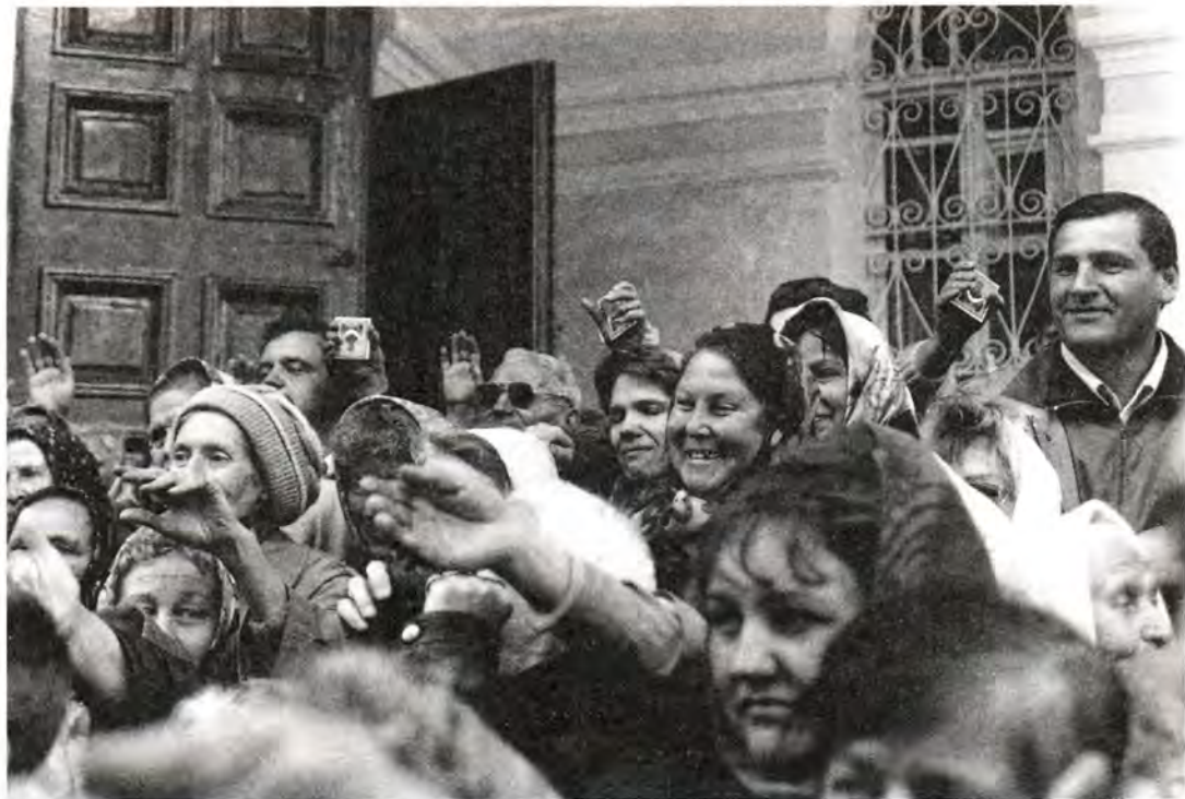
Перед всенощной: встреча Святейшего Владыки с прихожанами Покровского кафедрального собора

Третий день пребывания Святейшего Патриарха Алексия на Самарской земле совпал с праздником Покрова Пресвятой Богородицы. Именно этому событию церковной истории посвящен главный престол Самарского кафедрального собора. В канун престольного праздника здесь прошло торжественное всенощное бдение. Первосвятительская молитва, возносившаяся за этим богослужением, объединила сотни людей. На следующий день Святейший Владыка совершил в Покровском кафедральном соборе Божественную литургию, за которой пели хор Самарской Духовной семинарии и сводный хор учащихся воскресных школ города. Поздравив прихожан храма с престольным праздником, Его Святейшество подчеркнул: «Неоднократно над нашей Русской зем-