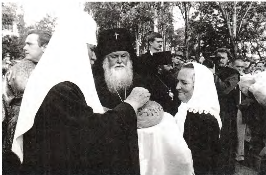
Хлеб-соль Пензенской земли

готовке и проведению торжеств. Историческую дату не оставили без внимания местные СМИ: несмотря на разнобразную политическую ориентацию, все они тепло поздравили своих православных земляков.