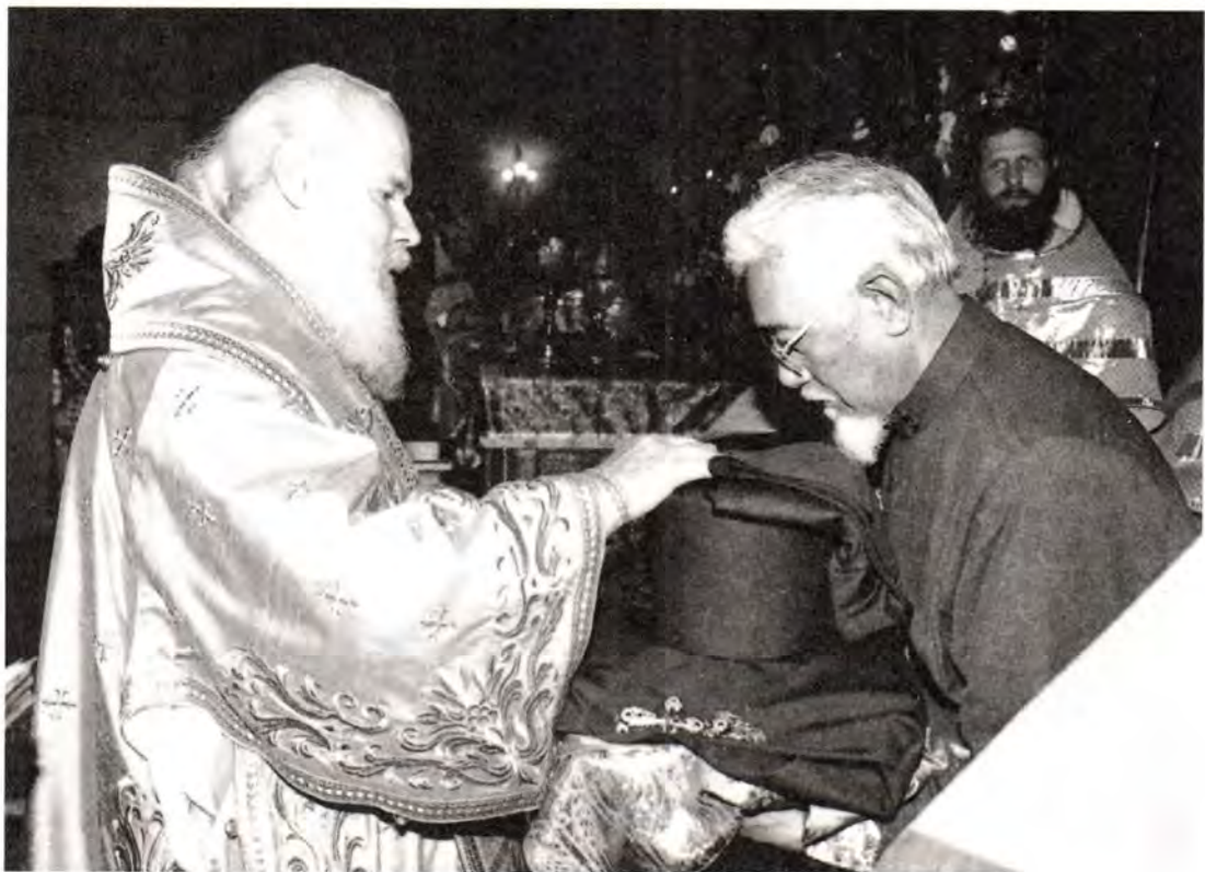
Благословение архиерейской мантии

Святейший Патриарх Московский и всея Руси Алексий в сослужении митрополитов Крутицкого и Коломенского Ювеналия, Смоленского и Калининградского Кирилла, Омского и Тарского Феодосия; архиепископов Керченского Анатолия, Истринского Арсения, Тернопольского и Кременецкого Сергия; епископов Корсунского Иннокентия, Туровского и Мозырского Петра, Орехово-Зуевского Алексия, Тираспольского и Дубоссарского Юстиниана. По окончании Божественной литургии Святейший Патриарх Алексий, вручая епископу Петру архиерейский жезл, произнес Слово: