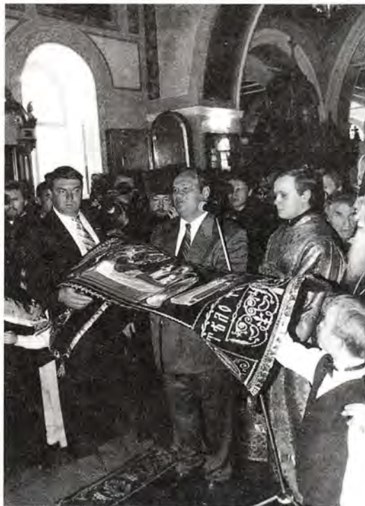
Губернатор Пензенской области В. К. Бочкарев передает в дар Предстоятелю Русской Православной Церкви Святыню Плащаницу

мость вместе, рука об руку строить свое будущее. В этом залог того, что в XXI веке Россия будет жить лучше, чем живет сегодня, а она заслужила лучшей доли своим терпением, сохранением отеческой веры и тех традиций, которые присущи нашему народу». Первосвященническим благословением Свято-Митрофаньевскому храму стала дарохранительница.