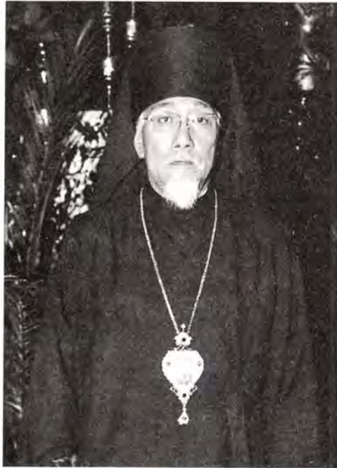
Преосвященный Петр, епископ Иокогамский, викарий Токийской епархии

Постановлением Патриарха и Священного Синода от 6 октября 1999 года игумену Петру (Арихаре), клирику Японской Автономной Православной Церкви, по возведении в сан архимандрита определено быть епископом Японской Автономной Православной Церкви с титулом: епископ Иокогамский, викарий Токийской епархии, с поручением временного управления Токийской епархией.