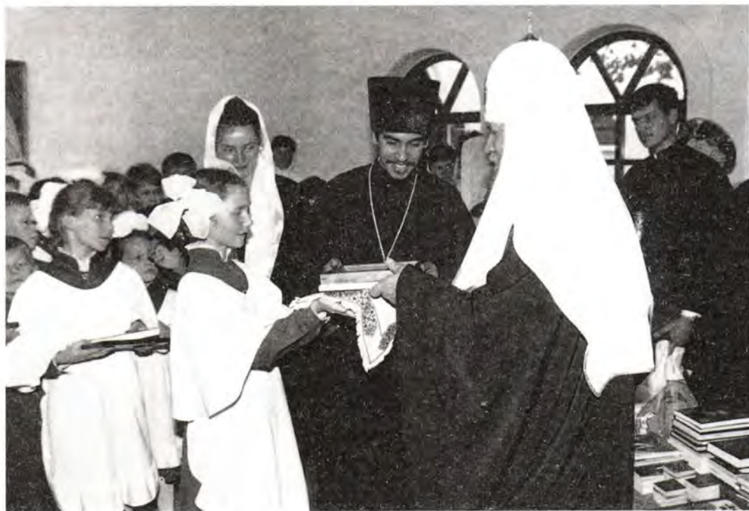
Святейший Патриарх в тольяттинской Православной гимназии