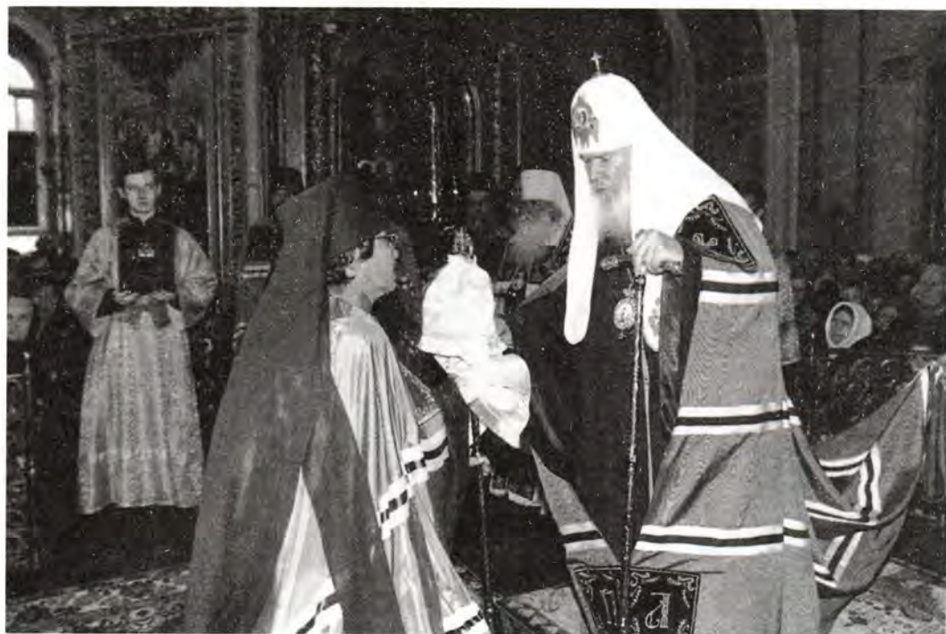
Святейший Патриарх Алексий вручает епископу Даниилу архиерейский жезл

ственной литургии Святейший Патриарх Алексий, вручая епископу Даниилу архиерейский жезл, произнес Слово: