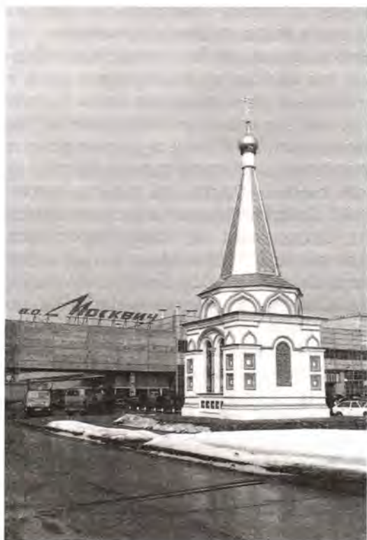
Часовня во имя Преподобного Сергия Радонежского

Одновременно с возведением часовни мы стали думать о ее убранстве.