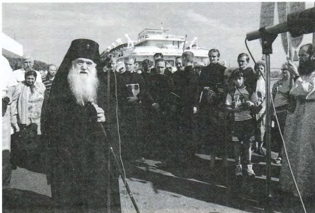
Архиепископ Ярославский и Ростовский Михайл приветствует участников крестного хода на пристани