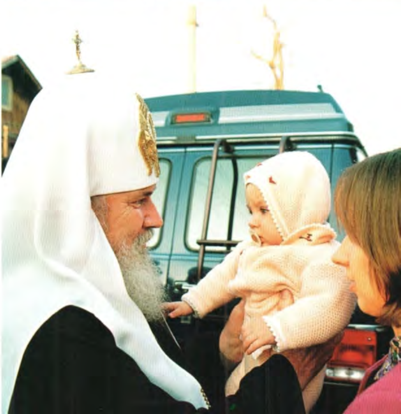
ПОЕЗДКА СВЯТЕЙШЕГО ПАТРИАРХА АЛЕКСИЯ В ПЕНЗЕНСКУЮ ЕПАРХИЮ 1-3 октября 1999 года