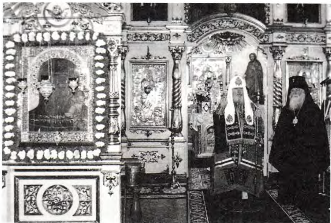
Святейший Патриарх Алексей в Свято-Митрофаниевском храме