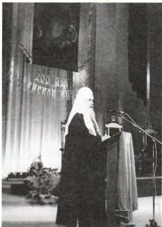
Слово Первосвященителя на юбилейном вечере в честь двухсотлетия Пензенской епархии

тельница Пензы. Зрительный зал был полон. Обратившись к жителям русской глубинки, Святейший Патриарх Алексей призвал их соиздать благоденствие Отечества собственными трудами: «В это ответственное время каждый из нас должен приложить максимум усилий для того, чтобы помочь становлению России, ее духовно-нравственному возрождению. От вклада каждого зависит наше будущее». В ознаменование двухсотлетия епархии Святейший Патриарх Алексей вручил архиепископу Пензенскому и Кузнецкому Серафиму орден святого равноапостольного князя Владимира II степени. Церковных наград также были удостоены областные и городские руководители. Праздничный вечер завершился концертом, подготовленным творческими коллективами области и города.