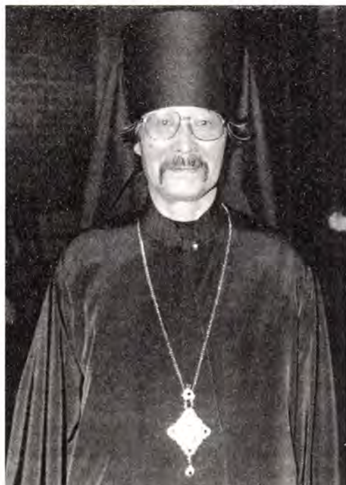
Преосвященный Даниил, епископ Киотоский

Постановлением Патриарха и Священного Синода от 6 октября 1999 года игумену Даниилу (Нуширо), клирику Японской Автономной Православной Церкви, по возведении его в сан архимандрита определено быть правящим епископом Японской Автономной Православной Церкви с титулом: епископ Киотоский.