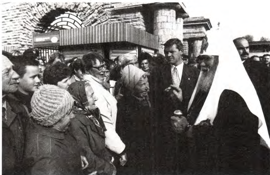
Общение с жителями Любани

ное время... Я благодарю всех, кто принял участие в восстановлении этого храма, который радует нас, внушает нам уверенность в том, что общими усилиями многое можно сделать для возрождения России, для возрождения духовных начал». На молитвенную память Святейший Владыка передал приходу Петропавловской церкви образ Спасителя, пожелав, чтобы Господь укреплял ее настоятеля, тружеников и прихожан в их служении и жизненном подвиге.