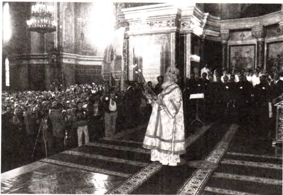
Литургия в Вознесенском кафедральном соборе Новочеркаска

министративно-территориальное образование, существовавшее на землях Юга России, населенных казаками. Казачество на Дону сейчас переживает второе рождение. В торжественной встрече Первоиерарха Русской Православной Церкви приняли участие сотни воспитанников Новочеркасского казачьего кадетского корпуса: стройные шеренги юношей в сине-красной парадной форме заполнили площадь перед собором.