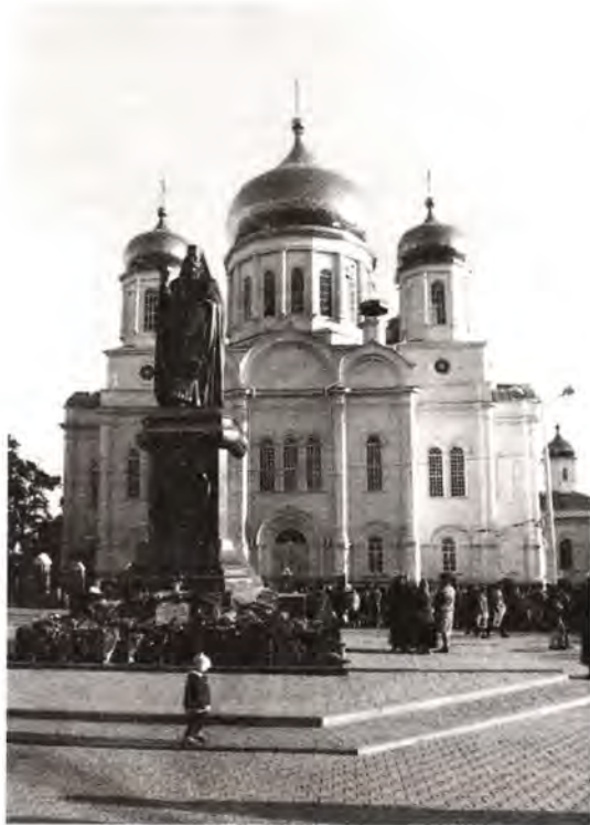
Ростовский кафедральный собор в честь Рождества Пресвятой Богородицы. На переднем плане памятник святителю Димитрию Ростовскому

Преосвященных Платона (Городецкого), Макария (Миролюбова), Иоанна (Доброзракова) и других. К 1917 году на территории епархии насчитывалось семь монастырей, свыше шестисот церквей. Накануне Первой мировой войны численность епархиального духовенства составляла 1121 человек.