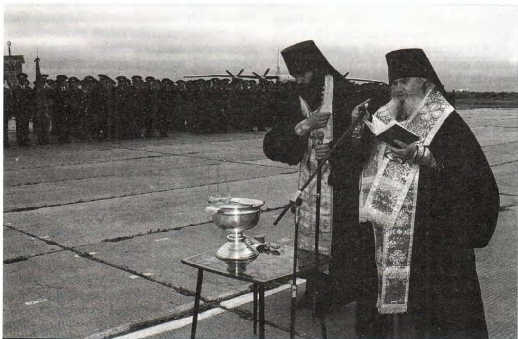
Молебен перед освящением самолета