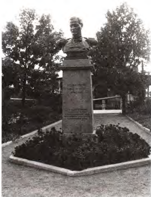
Памятник первому министру путей сообщения Российской империи П. П. Мельникову на станции Любань

По окончании Литургии Его Святейшество поздравил всех собравшихся с великим и памятным событием. «Пройдут годы и будет уже трудно вспомнить то время, когда этот храм был в руинах, — отметил он. — Сегодня, когда совершенно освящение этого святого храма, мы должны высказать глубокую благодарность всем, кто принял участие в его возрождении. Думаю, то, что министерства Российской Федерации имеют свои храмы, — это знамение времени», — подчеркнул Святейший Владыка. Он дал высокую оценку вкладу, внесенному в возрождение православной святыни нынешним главой МПС Н. Е. Аксененко. «Мы с благодарностью вспоминаем Павла Петровича Мельникова, первого министра путей сообщения России, который принял решение о строительстве этого храма, — сказал Святейший Патриарх. — Он был не только министром, не только вдохновенным созидателем Петропавловского храма; выйдя в отставку, он стал благодетелем, создав здесь, в Любани, богадельню для престарелых и сиротский дом, оказывая помощь труженикам Николаевской железной дороги. В наши дни происходит восстановление исторической преемственности. Мы осознаем то, что продолжаем дело, которое совершали наши предки, мы являемся продолжателями их служения Отечеству и народу земли нашей. Сегодня эта церковь святых Первоверховных Апостолов Петра и Павла вновь становится храмом Министерства путей сообщения. Здесь возносится молитва о начальствующих, тружущихся и пу-