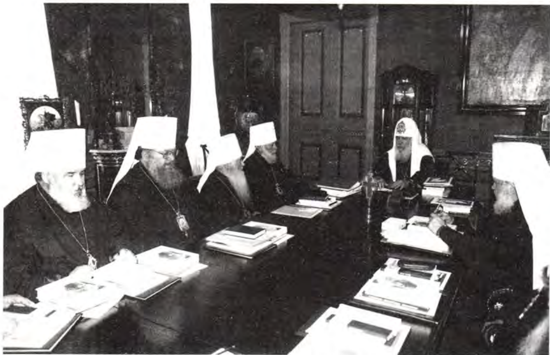
Заседание Священного Синода Русской Православной Церкви 5 октября 1999 года

Пражского, Митрополита Чешских земель и Словакии Дорофея об открытии в Москве Подворья Православной Церкви Чешских земель и Словакии.