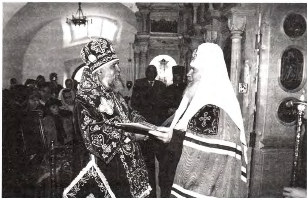
Святейший Патриарх Алексий награждает архиепископа Астраханского и Енотаевского Иону орденом святого благоверного князя Даниила Московского. 27 сентября 1999 года

епископ Пантелеимон преподнес Святейшему Владыке икону святителя Дмитрия Ростовского, а насельницы Свято-Иверского Ростовского женского монастыря – Иверскую икону Божией Матери. Святейший Патриарх передал в дар соборному храму Владимирскую икону Божией Матери и образ святителя Дмитрия Ростовского с частицей его святых мощей, а Владыке архиепископу – святую панагию.