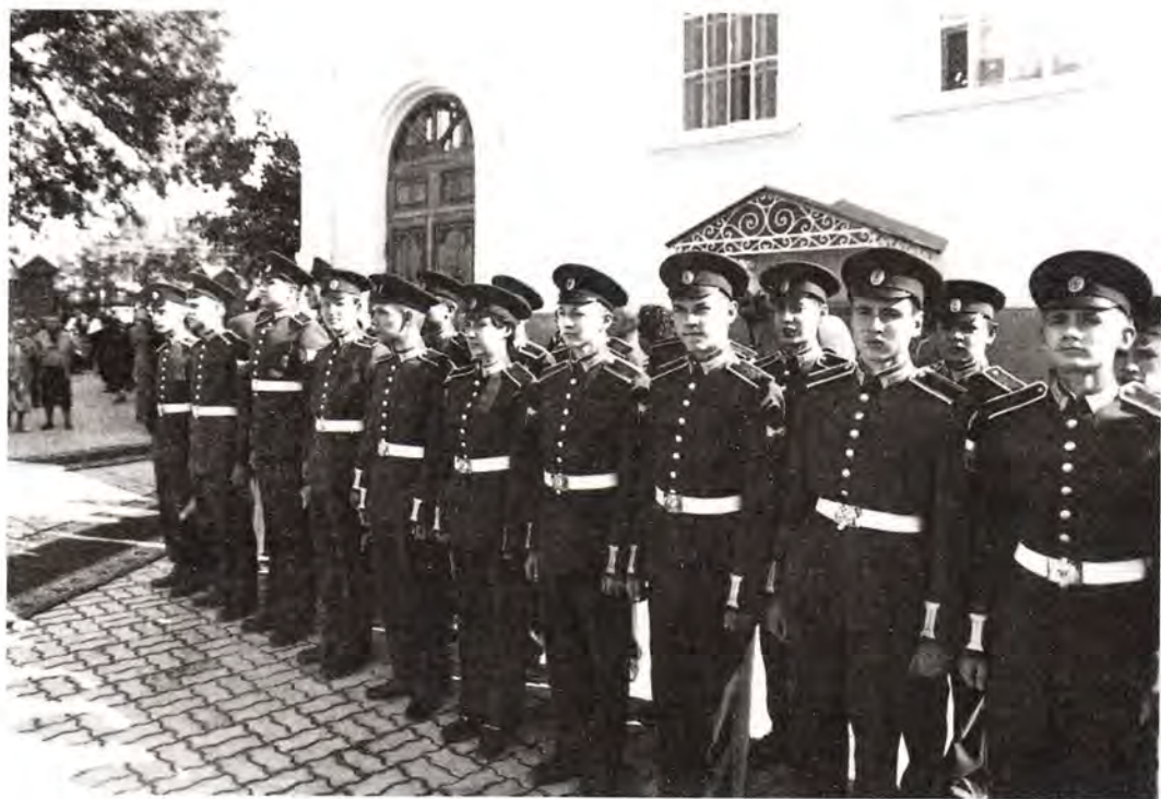
Возрождается донское казачество

славный архиепископ. После войны церковное здание отдали под зернохранилище, затем в нем расположили склад промтоваров. Долгие годы использовавшееся не по назначению, сегодня оно нуждается в серьезной реставрации. Нарушение уникальной системы гидроизоляции привело к скоплению влаги в третьем, нижнем ярусе собора, который сейчас на два метра залит водой. Высокая влажность может стать причиной скорой гибели дивной храмовой росписи, выполненной по эскизам братьев Васнецовых. Для возрождения былого величия Вознесенского собора требуются огромные усилия.