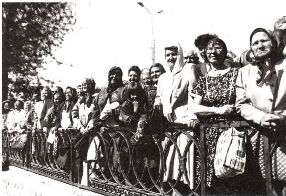
У Богородице-Рождественского собора в день престольного праздника