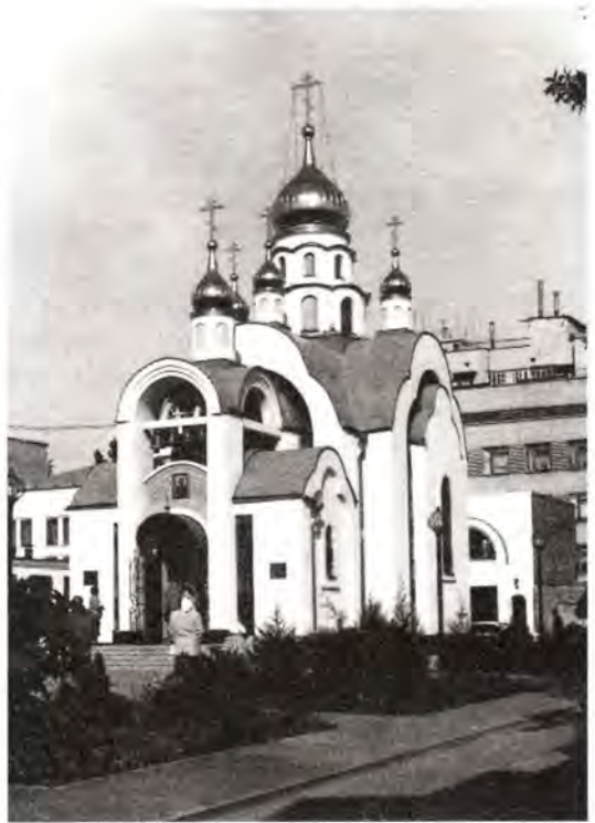
Храм великомученика и целителя Пантелеимона в Ростовском институте онкологии

Святейший Владыка рассказал молодым ростовчанам о своей студенческой юности: «Я вспоминаю конец сороковых годов, когда я поступал в Ленинградскую Духовную семинарию.