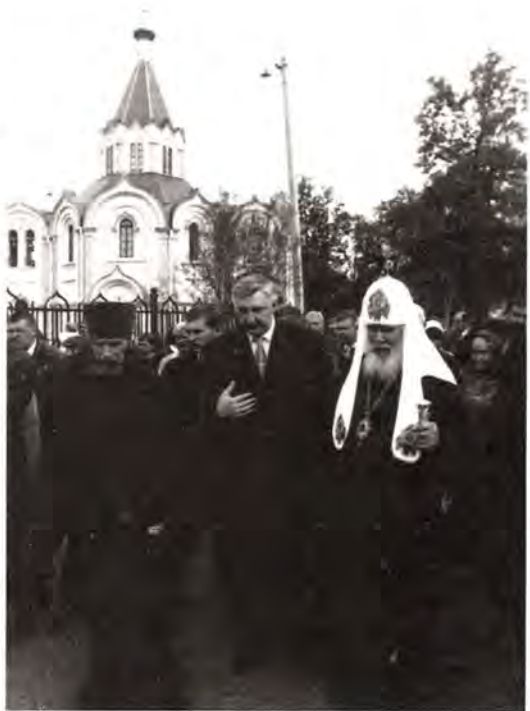
Святейший Патриарх Алексий и вице-премьер Правительства России Н. Е. Аксененко у Петропавловского храма на станции Любань

В 1939 году Петропавловский храм был закрыт. Во время Великой Отечественной войны в результате ожесточенных боев церковное здание сильно пострадало, лишившись крыши и перекрытий. До неузнаваемости обезображен оказался внутренний интерьер. В руинном состоянии оно простояло долгие годы. Начать восстановление храма стало возможным лишь в конце минувшего десятилетия. Первые пожертвования на это благое дело собрали сотрудники музеев Октябрьской железной