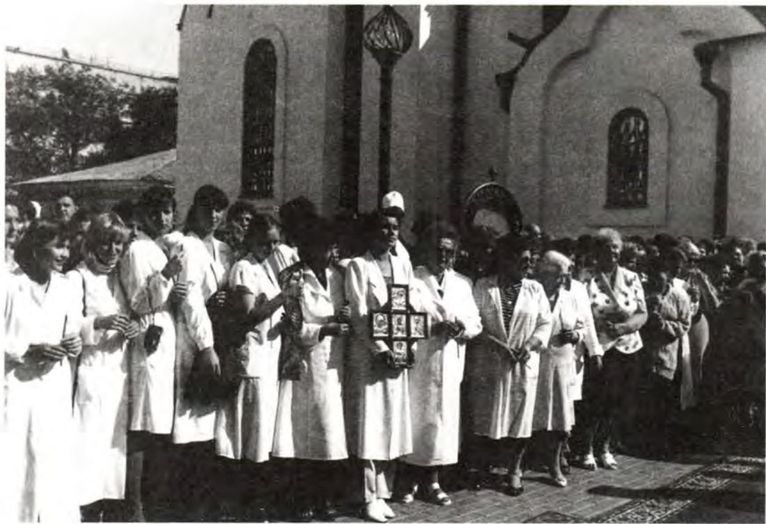
Сотрудники онкологического института встречают Святейшего Патриарха

страции. «Много на нашем жизненном пути тревог, испытаний и трудностей, – сказал он, – но если мы будем обращаться ко Господу с молитвой и с глубокой верой, Господь дарует нам просимое, Господь не оставит нас на нашем жизненном пути. Ведь Он Сам сказал: Где двое или трое собраны во имя Мое, там Я посреди них (Мф. 18, 20)».