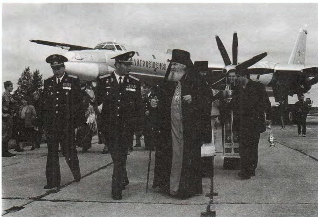
Командование дивизии встречает епископа Благовещенского и Тындинского Гавриила