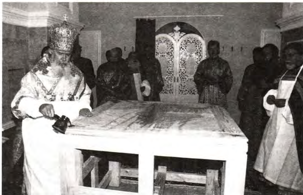
Освящение престола Петропавловского храма