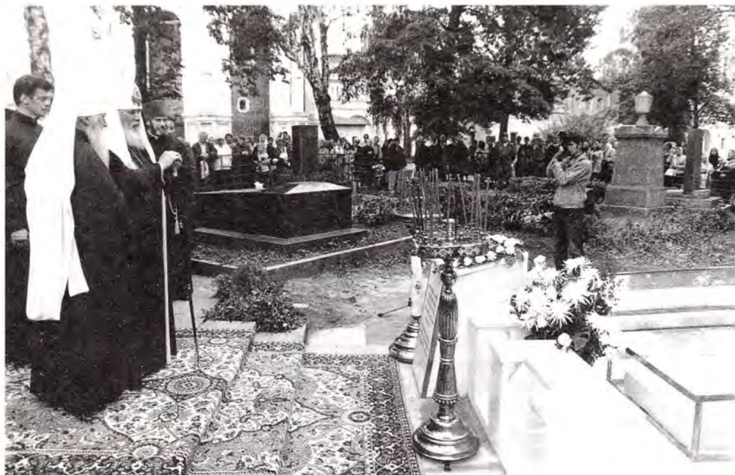
Святейший Патриарх Алексей и митрополит Ювеналий у могилы первой игумении Новодевичьего монастыря

и усердно молившейся о помиловании и спасении страждущих.