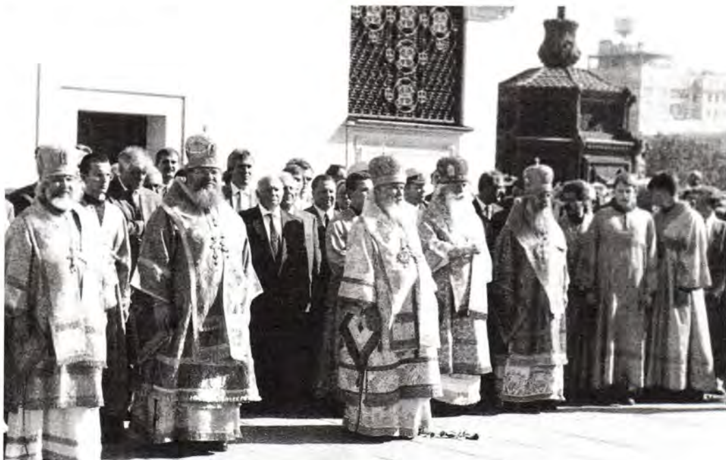
В день города Москвы у Храма Христа Спасителя. 5 сентября 1999 года