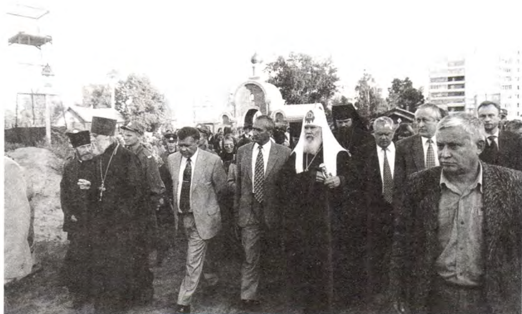
Сыктывкар. У строящегося Свято-Стефаньевского собора