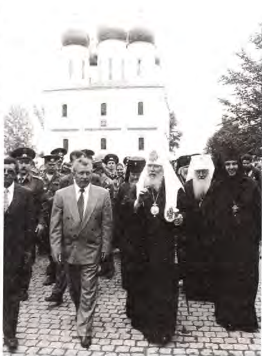
Торжественная встреча Святейшего Патриарха на Соборной площади Коломенского кремля

29 августа 1999 года Святейший Патриарх Московский и всея Руси Алексий совершил великое освящение возрожденного Успенского собора. В этот день здесь собралось множество верующих, в их числе были не только жители Коломенского района, но и всего Подмосковья. Многие из них удостоились причаститься Святых Христовых Таин из рук Первосвященителя Русской