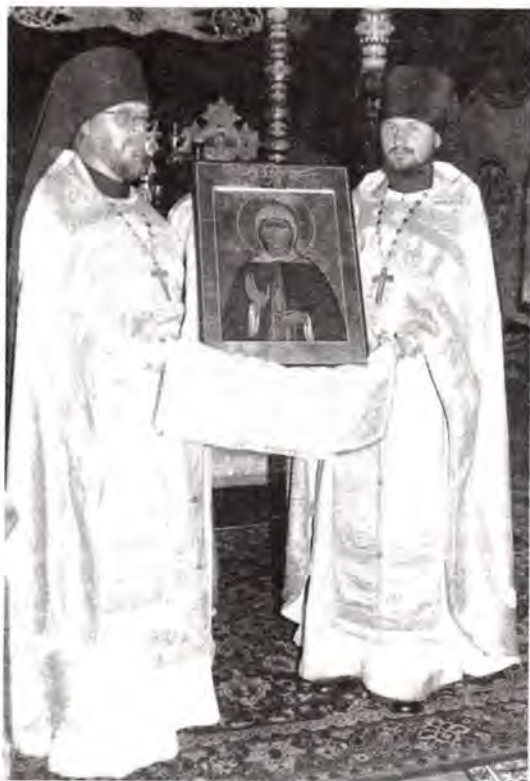
Московское духовенство с иконой преподобной Елены

несли к небесам главки с крестами собора и церквей обители, обустроился крепкими стенами островок молитвенного горения к Спасителю за мир, собрались избранные Его (Мф. 24, 31) служить Ему от всего сердца и от всей души (1 Парал. 28, 9).