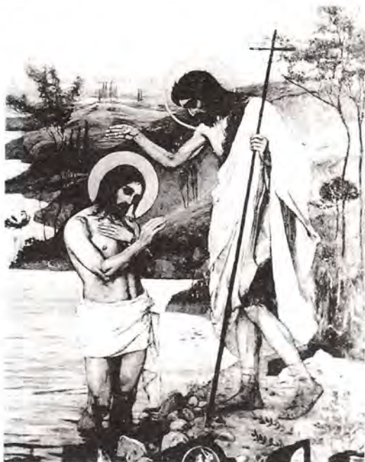
Крещение Господне. Фреска во Владимирском соборе в Киеве

После усекновения беззаконным царем Иродом главы святого Иоанна Предтечи его тело было погребено его