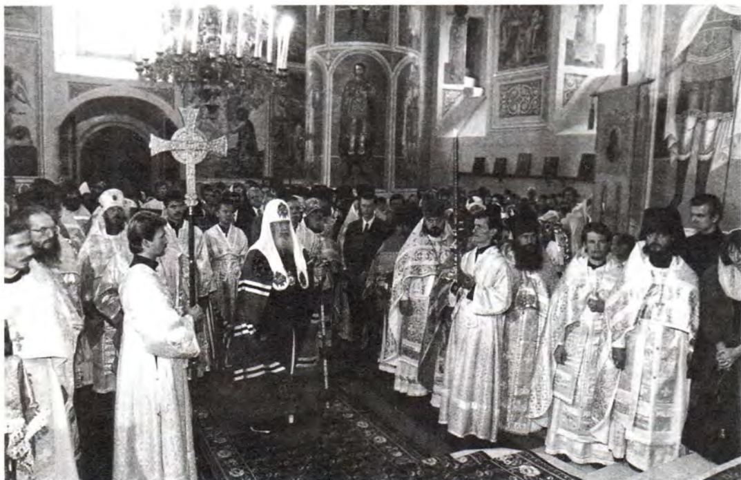
Перед началом богослужения в Успенском соборе Коломенского кремля