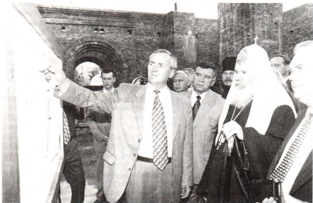
Святейший Владыка знакомится с ходом строительства собора