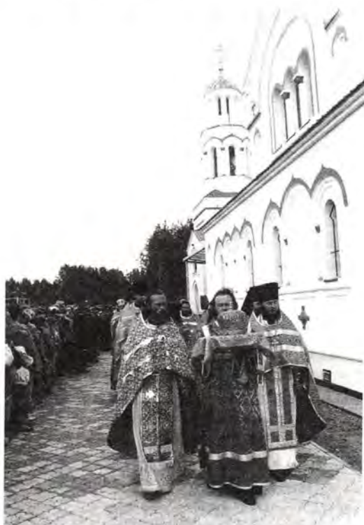
Крестный ход вокруг Казанского храма

Северной Русской земли. И пусть причастников за этим первым богослужением было, по московским меркам, немного, но хочется верить, что для всех присутствовавших прикосновение к святыне, молитва за этой Литургией явились началом пути к вере, к собственному духовному преобразению. Надежду на это выразил в своем обращении к Святейшему Патриарху Алексию епископ Архангельский и Холмогорский Тихон. От лица своей паствы — жителей Русского Севера — он передал Его Святейшеству низкий поклон.