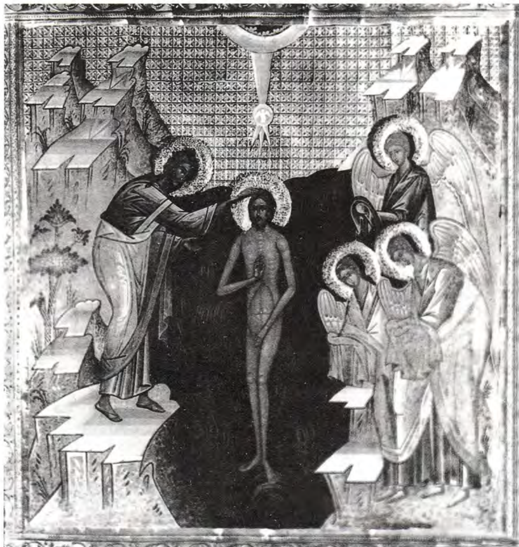
Крещение Господне. Икона из иконостаса Троицкого собора Успенской Почаевской лавры

Землю, чтобы поклонится Гробу Господню и другим святыням, а во-вторых, врачевать раны воинов, которые защищали как сами святыни, так и паломников.