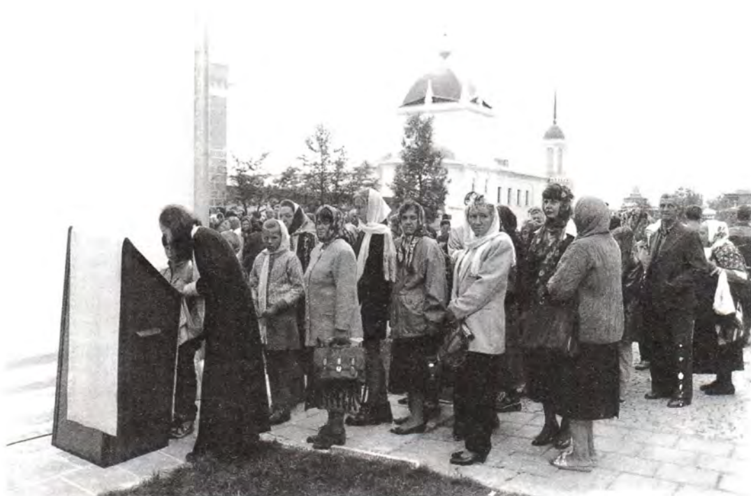
Исповедь под открытым небом