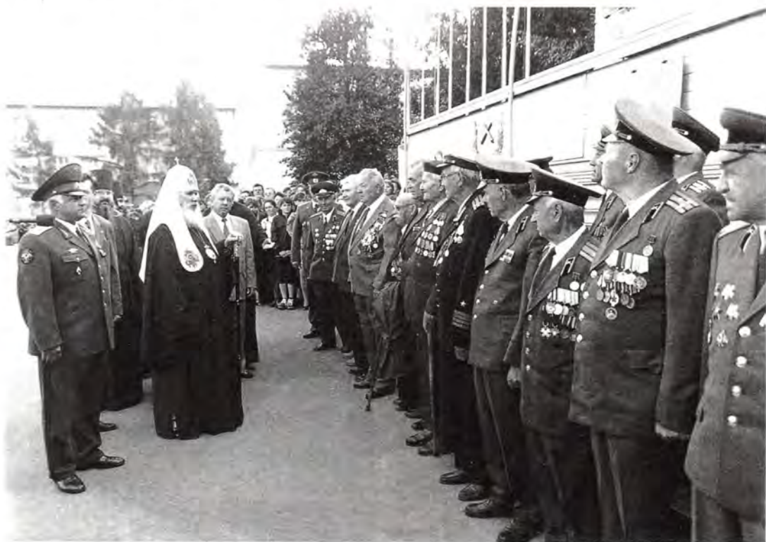
Встреча с ветеранами в Военно-артиллерийском университете