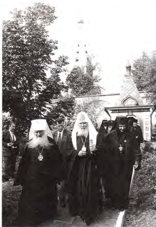
Встреча в Свято-Троицком Ново-Голутвине женском монастыре

Затем к народу обратился Святейший Патриарх Алексий: «На одном из транспарантов, которые я увидел, въезжая в город Коломну, я прочитал слова: “Духовное возрождение – это залог будущего России”. То, что здесь, в этом древнем городе, возрождаются святые, которые соединяют нас с нашей историей, является залогом будущего жителей этого града. Коломна является наглядным примером того, что можно сделать общими усилиями, “всемирно”. Еще одиннадцать лет тому назад во всем Коломенском районе было только два православных храма, а сейчас их уже около сорока и в городе Коломне четыре монастыря. Это свидетельство духовного возрождения, нашего возвращения к исторической памяти, к традициям, к вере отеческой, которой жил наш народ на протяжении своей тысячелетней истории».