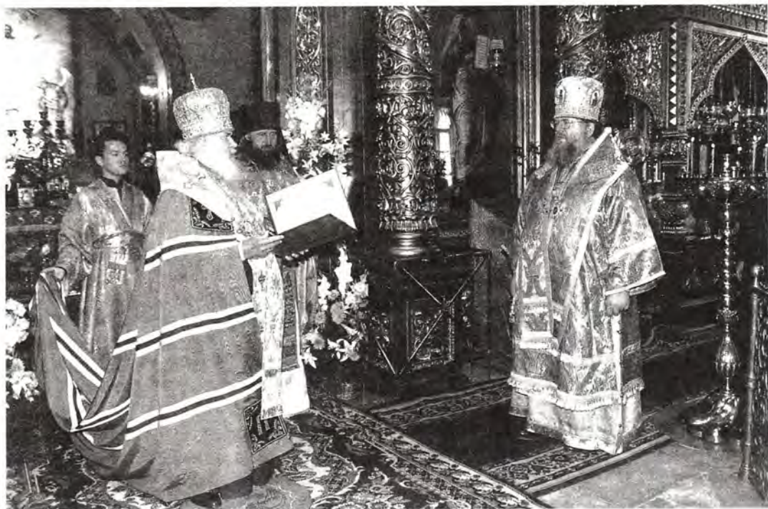
Святейший Патриарх Алексий поздравляет юбиляра