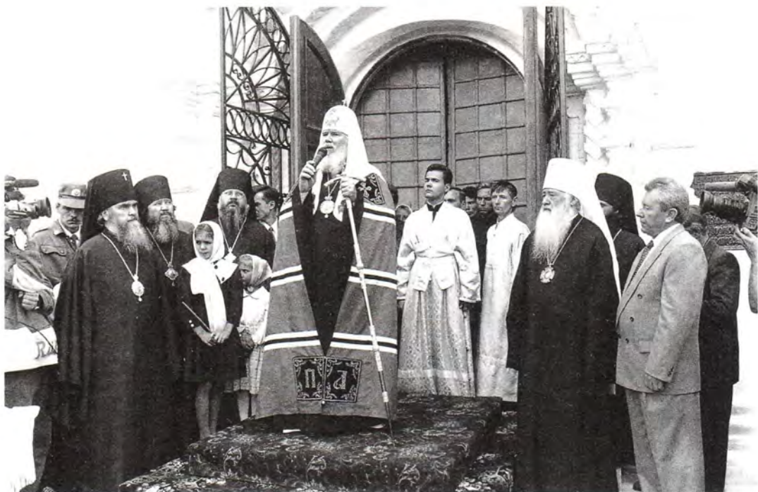
Приветственное Слово Святейшего Патриарха на паперти Успенского собора