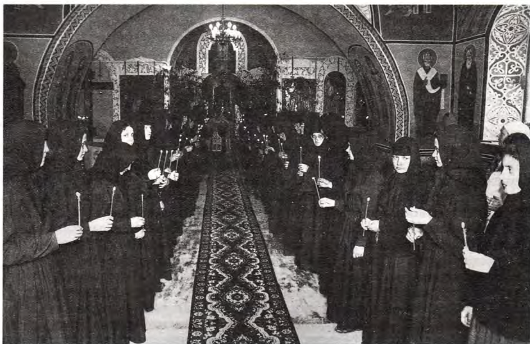
Сестры Свято-Троицкого Ново-Голутвина монастыря

Закон Божий – в монастыре действует детская воскресная школа.