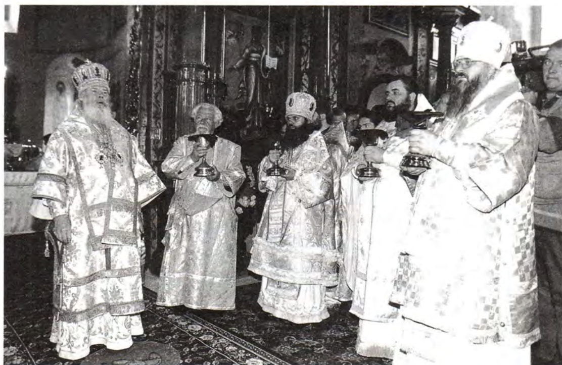
Молитва перед Причастием