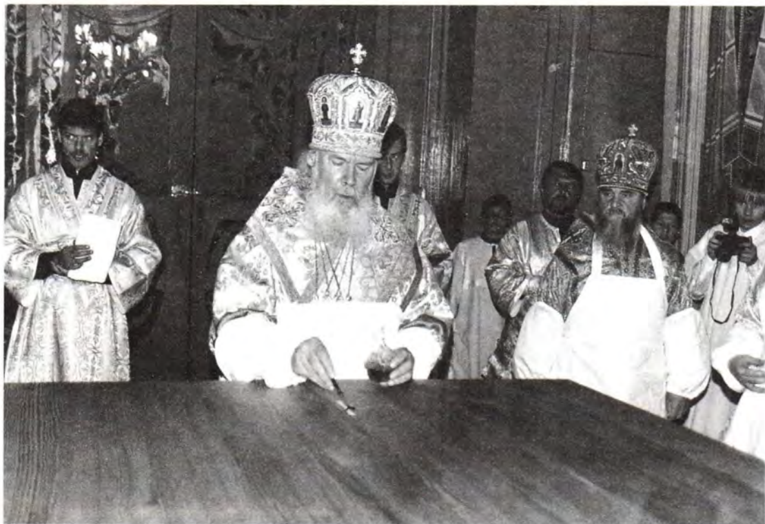
Миропомазание престола Успенского собора