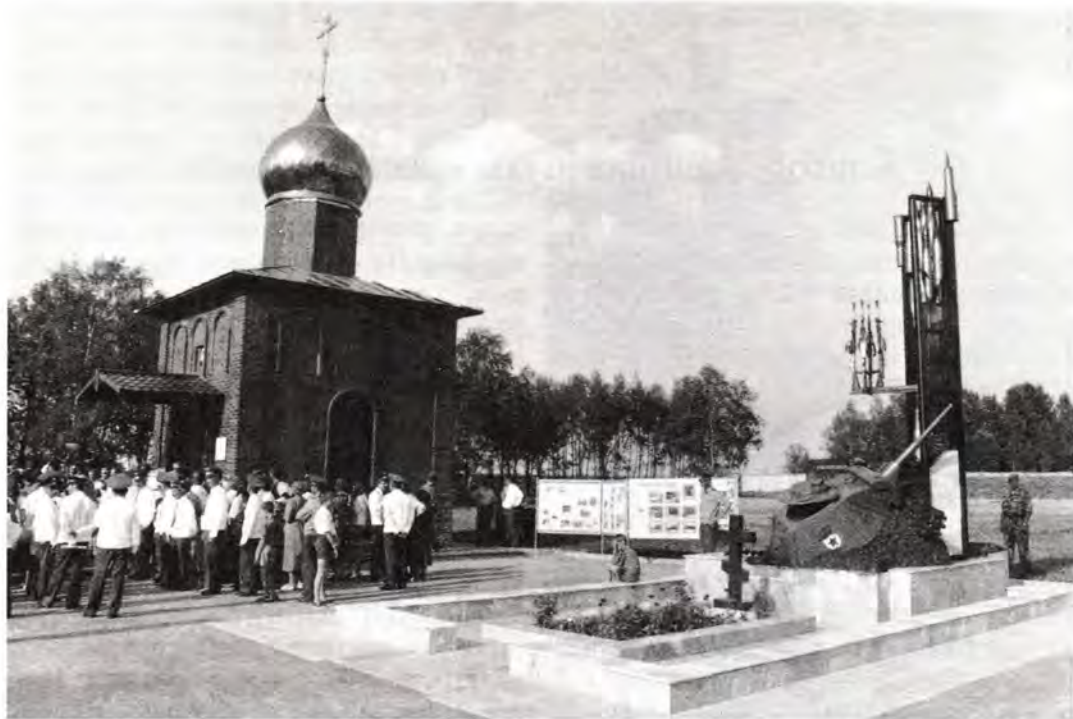
Часовня во имя благоверного князя Димитрия Донского на территории НИИ танковых войск в Кубинке

нили не только о том, что благоверный князь Димитрий прославлен как святой защитник Русской земли, но также и о том, что его именем была названа танковая колонна, созданная на средства верующих в годы Великой Отечественной войны.