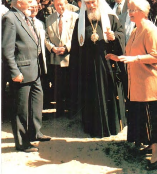
Посещение тульского городского Дома ребенка. 7 июня 1999 года