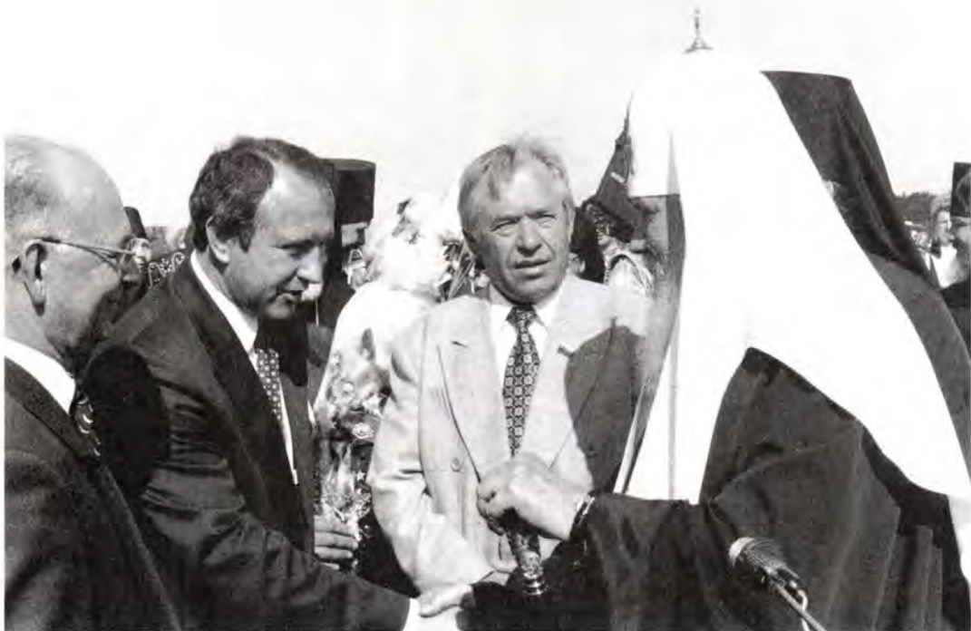
Встреча Предстоятеля Русской Православной Церкви на границе Тульской области

Патриарх Московский и всея Руси Алексий. Большую помощь и поддержку епархии в подготовке и проведении этих торжеств оказали местные власти.