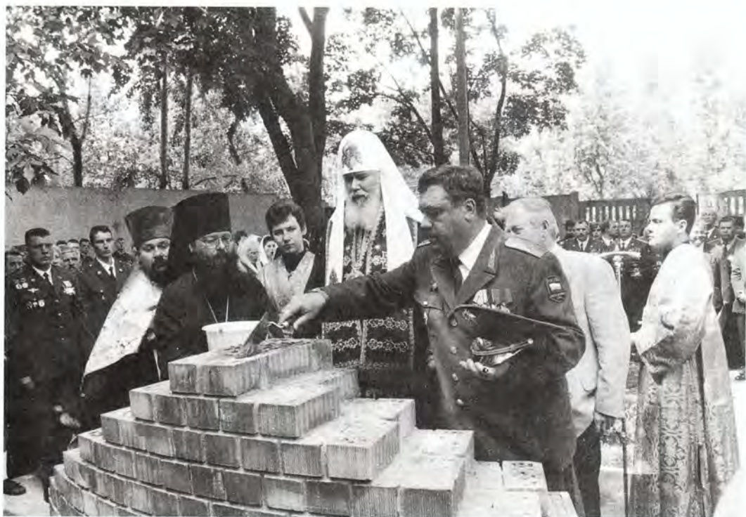
Освящение закладного камня храма во имя святителя Московского Алексия в Артиллерийском институте

Затем в областном драматическом театре состоялась встреча Святейшего Патриарха с тульской общественностью.