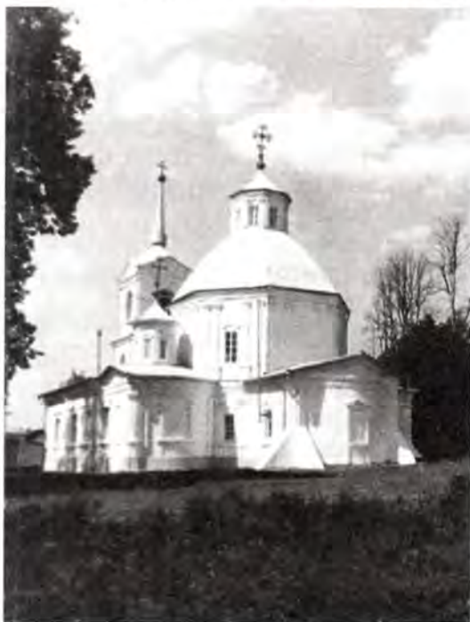
Храм Рождества Пресвятой Богородицы в селе Велегож