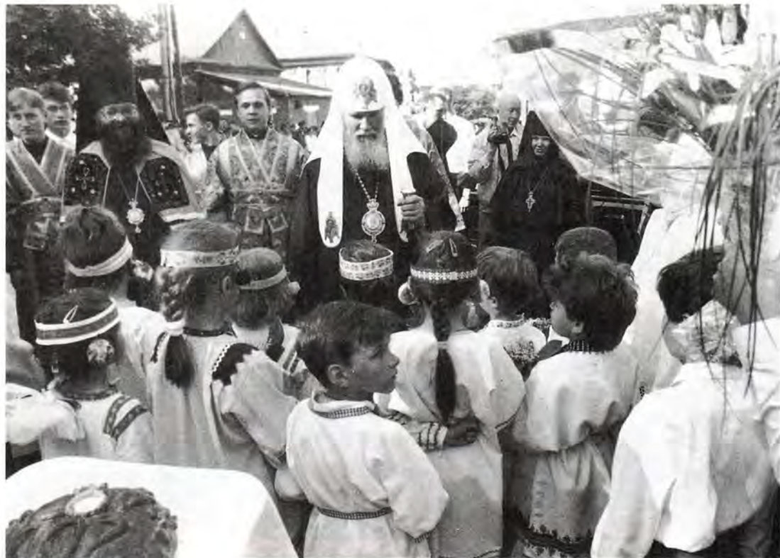
Перед всенощной: торжественная встреча у Всехсвятского кафедрального собора

а также с престольным праздником соборного Всехсвятского храма.