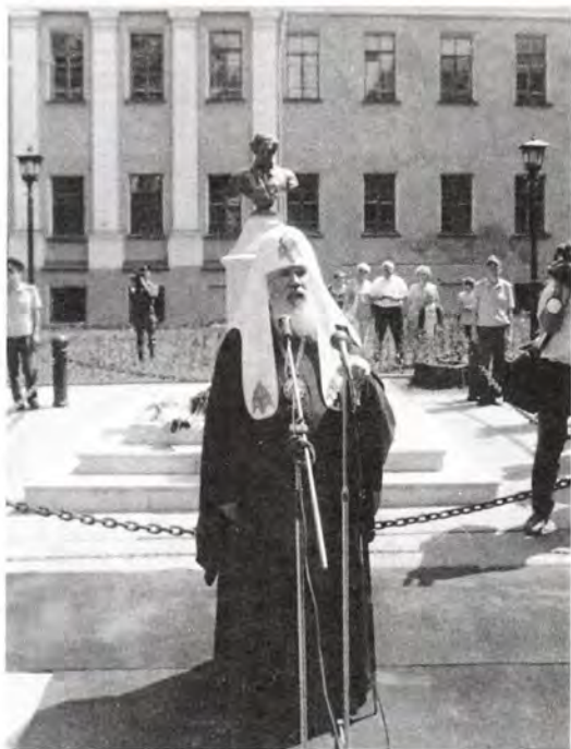
У памятника А. С. Пушкину в день двухсотлетия со дня рождения поэта

Позже состоялся праздничный прием, на котором Святейший Патриарх Алексей вручил губернатору В. А. Стародубцеву орден святого благоверного князя Даниила II степени – «во внимание к помощи в возрождении Святого Православия на Тульской земле». Высокой церковной награды удостоились также глава города С. И. Казаков, глав-