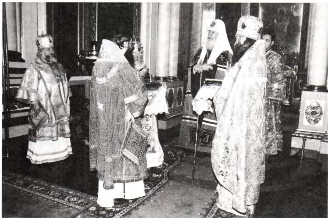
Слово Первосвященителя после Божественной литургии