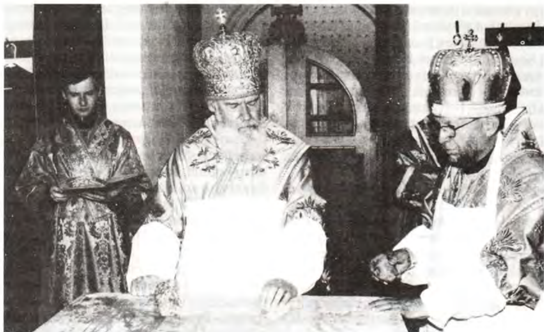
Освящение престола храма святой великомученицы Екатерины на Вespолье

ших, в Патриаршей и Синодальной резиденции в Свято-Даниловом монастыре в Москве.