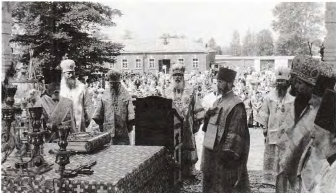
Божественная литургия в Спасо-Бородинской обители

ца Николая. Как известно, Святитель Николай особо чтится на Можайской земле: именно здесь получило распространение редкое скульптурное изображение Святителя Николая, защитника Православной веры, держащего в одной руке храм, а в другой – обнаженный меч.