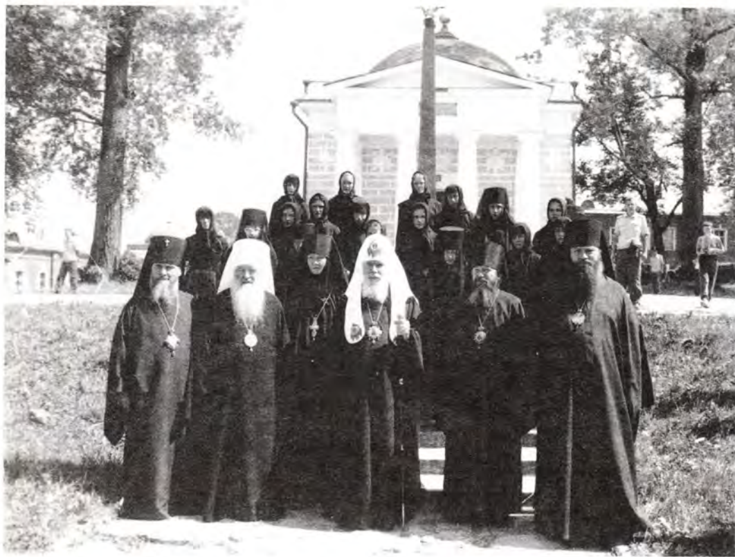
Святейший Патриарх с сослужившими ему архипастырями и насельницами Спасо-Бородинской обители

поле Руси – Куликовом мне пришлось бывать и молиться, и на третьем поле Руси – Прохоровском довелось освящать в преддверии пятидесятилетия нашей Победы в Великой Отечественной войне храм первоверховных апостолов Петра и Павла, но не судил мне Господь до сегодняшнего дня побывать на поле Бородинском, хотя это была моя давняя мечта, ибо один из моих предков в звании генерал-адъютанта сражался здесь... Я думал посетить Бородинское поле, это священное место, чтобы помолиться о душах тех, кто защищал Отечество и, по слову Христа Спасителя, проявил любовь, положил душу свою за други своя. Владыка