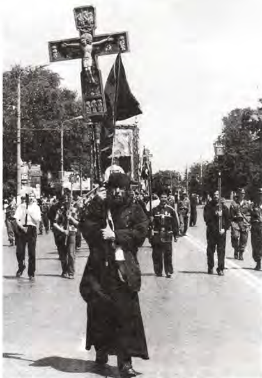
Крестный ход на улицах Тулы