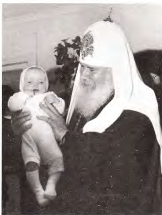
В городском Доме ребенка