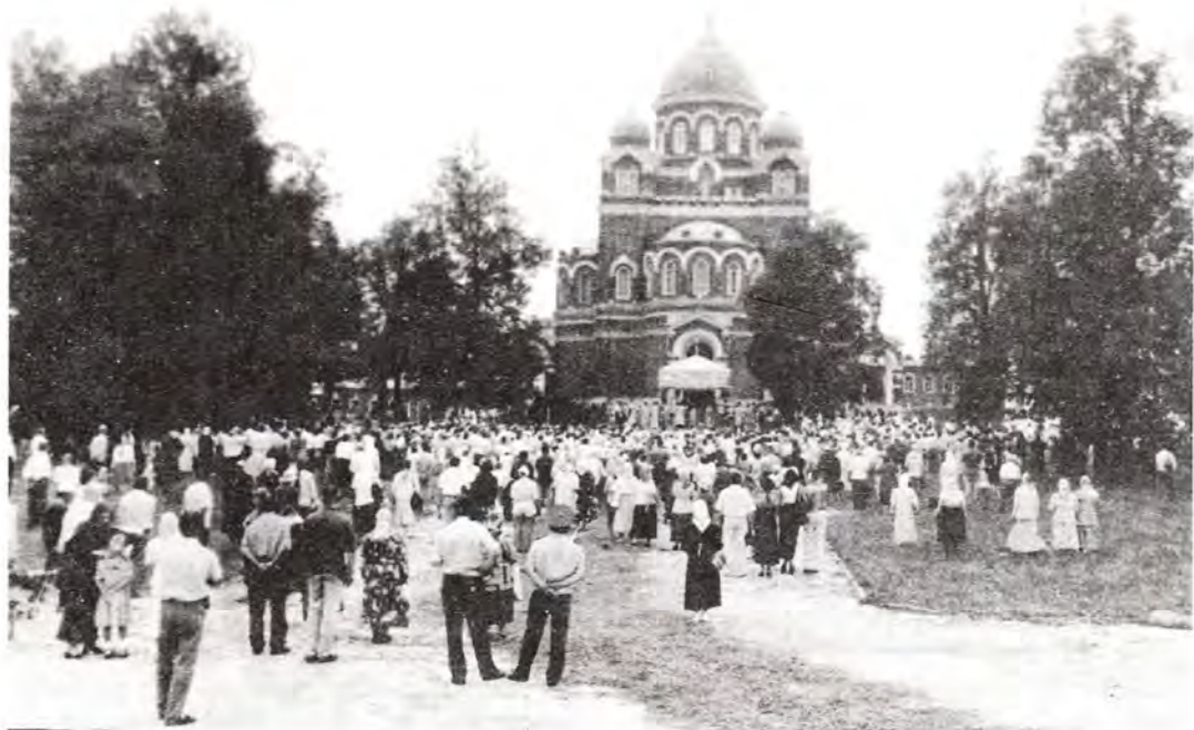
Спасо-Бородинский монастырь. Владимирский собор

праведного Филарета Милостивого возводились на средства Императора Николая I, называвшего Бородино местом государственным. Этот российский самодержец посетил обитель 26 августа 1839 года, во время торжеств по случаю открытия памятника на батарее Раевского.