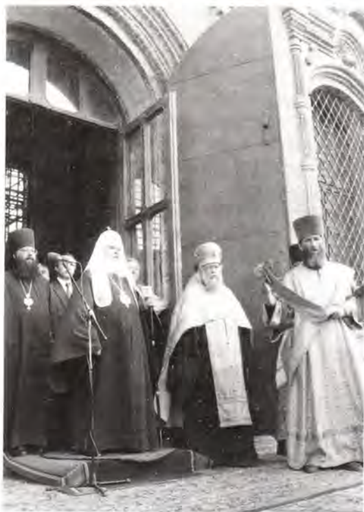
Молебен на паперти Успенского собора Тульского кремля

Церкви. — Получив благословение Преподобного Сергия Радонежского, великий князь Московский Димитрий Донской одержал победу, которая позволила собираться вокруг Москвы землям русским, укрепляться и возвышаться... Тула — город-герой, который явил удивительное мужество и стойкость в годы Великой Отечественной войны, когда выстоял и не был захвачен врагом. Если мы посмотрим на исторический путь нашего Отечества, то увидим, что ему приходилось вынести много испытаний. Но когда народ был един, когда Церковь духовно укрепляла его мужество и стойкость, он преодолевал трудности и побеждал врагов, которые приходили к нам с Востока и Запада и хотели завоевать Русь. Я убежден, что и в это трудное время, если мы будем едины, мы переживем и выстоим. И особенно важно выстоять нам на переломе веков, на пороге нового тысячелетия».