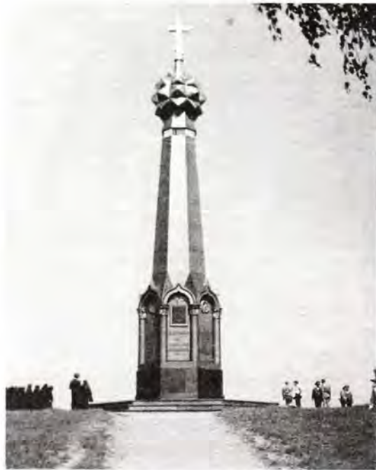
Главный монумент Бородинского поля

мрамора – поживает прах героя Отечественной войны 1812 года прославленного генерала П. И. Багратиона, получившего смертельную рану на Бородинском поле. В тридцатые годы, движимые чувством ненависти к князю – представителю аристократии и классовому врагу, советские активисты взорвали его могилу. Позже с помощью военных удалось собрать то, что осталось от захоронения героя, который вновь обрел здесь упокоение. Святейший Патриарх Алексей совершил у памятника заупокойную литию. Трудно передать величие минуты, когда в благоговейной и строгой тишине над просторами Бородинского поля прозвучала «Вечная память» павшим защитникам Отечества, провозглашенная Предстоятелем Русской Православной Церкви. В почетном карауле у монумента замерли воины российской армии. По окончании литии, воздавая дань памяти своим предкам, доблестно защищавшим Родину, благодарные потомки отсалютовали им оружием залпами, а затем в сопровож-