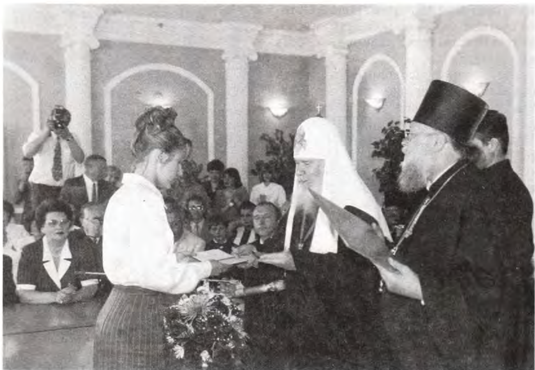
Вручение аттестатов зрелости первым выпускникам Тульской православной классической гимназии