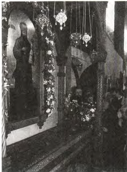
Рака с мощами святителя Илариона в соборе Сретенского монастыря

рейшим из заточенных иерархов, но разом получил в их среде признание высокого, если не первенствующего авторитета. Среди верующих мирян эта авторитетность его достигла еще большей высоты... Силе, исходившей от всегда спокойного, молчаливого Владыки Илариона, не могли противостоять и сами тюремщики: в разговоре с ним они никогда не позволяли себе непристойных шуток, столь распространенных на Соловках, где не только чекисты-охранники, но и большинство уголовников считали какой-то необходимостью то злобно, то с грубым добродушием поиздеваться над “опиумом”. Нередко охранники как бы невзначай называли его Владыкой. Обычно – официальным термином “заключенный”. Кличкой “опиум”, попом или товарищем – никогда никто.