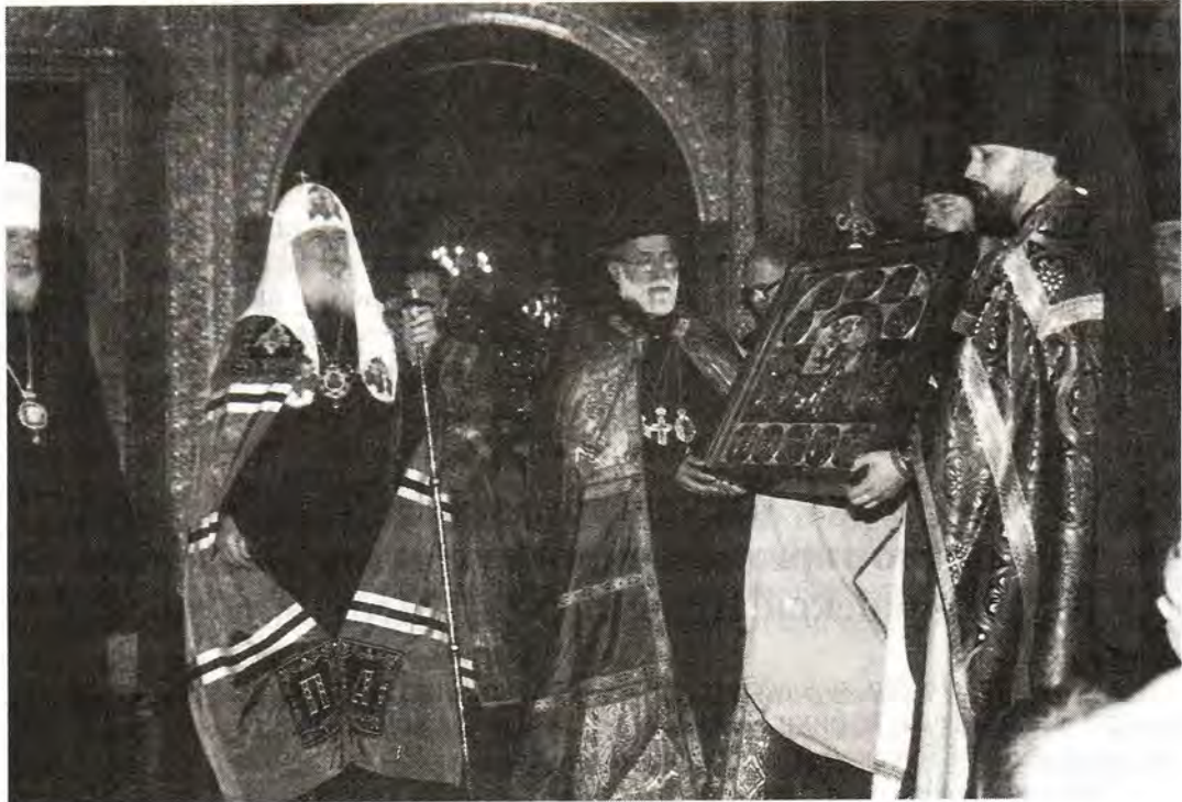
Блаженнейший Патриарх Александрийский Петр передает Святейшему Патриарху Алексию дар Александрийской Церкви – икону Воскресения Христова

дящие в мире: насилие и война, нищета и убожество, бродяжничество, драма изгнанных со своих мест беженцев, националистические выпады и дискриминация, неудержимый технологический прогресс – все это приводит человека к неуверенности и отчаянию. И именно Церковь благовествует миру о бытии Живого Бога и надежде на Царствие Божие. Свидетельство веры имеет особую важность и в борьбе за права человека, за уважение к человеческой личности... С глубоким волнением, которое разделяют со мной и мои спутники, я прибыл к вам, чтобы увидеть и узнать ваш народ – благочестивый и благородный, мученический и верующий, который вместе со своим Патриархом несет свидетельство жизни, которая сильнее смерти, несмотря на испытания и страдания. Видехом ныне за Божественной литургией свет истинный, прияхом Духа Небесного . И это