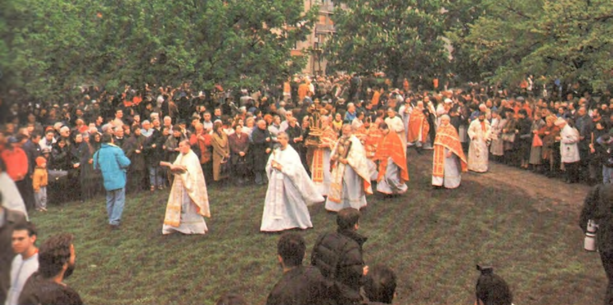
Великий вход во время Божественной литургии в Белграде (из собора святителя Саввы Сербского на площадь перед ним). 20 апреля 1999 года