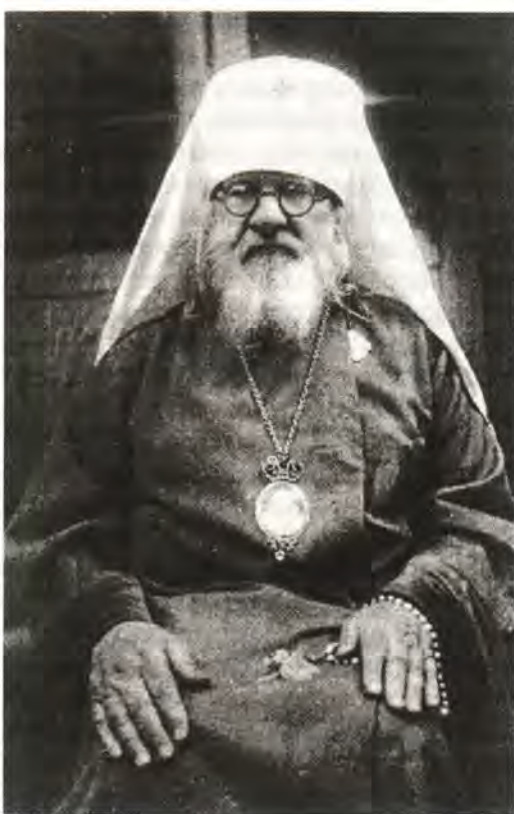
Архиепископ Новосибирский и Барнаульский Варфоломей

реже, преимущественно во время школьных каникул, а после получения указаний Священного Синода по этому поводу от 25 августа 1948 года – прекратил их.