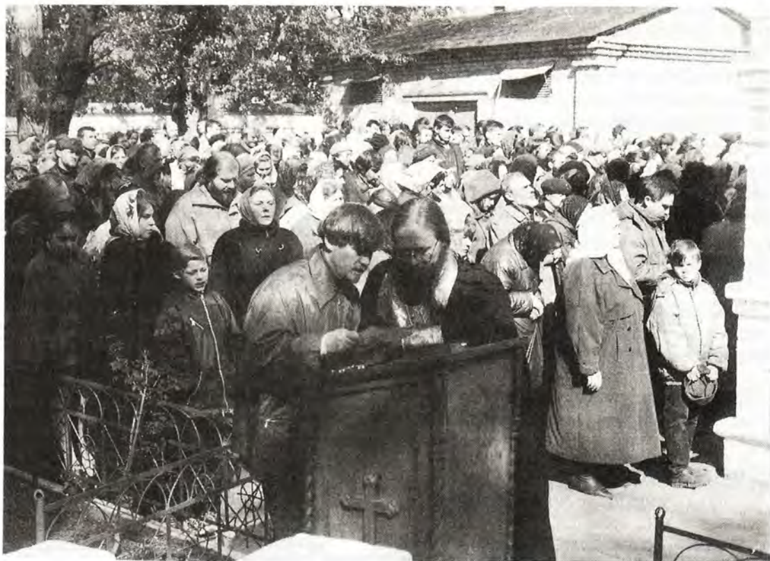
Исповедь в день прославления святителя Илариона. Сретенский монастырь

Несмотря на долгие десятилетия господства богоборческой власти, православные люди помнили пламенного архипастыря, чтили его имя, свято храня память о мученике за веру Христову. Ныне, милостью Божией, пришло время «собирать камни» нашего духовного наследия, воздавая должное подвигу исповедников Русской Православной Церкви XX века.