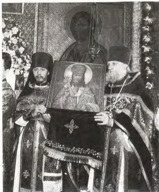
Вынос иконы новопрославленного святого

В нечеловеческих условиях ГУЛАГа архиепископ Иларион с твердостью и достоинством совершал свой крестный путь, вызывая невольное уважение даже у своих палачей. Вот как пишет о нем в своей книге «Неугасимая лампада» другой соловецкий узник тех лет писатель Борис Ширяев: «С первого же дня его соловецкого жития имя Владыки окуталось легендой силы и славы... Легенда возникла и жила, потому что люди хотели видеть реальное воплощение духовной силы Церкви, ее несокрушимой твердыни, и самым подходящим объектом для этого воплощения был Владыка Иларион. Огромная внутренняя сила его проявилась с первых же дней по прибытии на каторгу. Он не был ста-