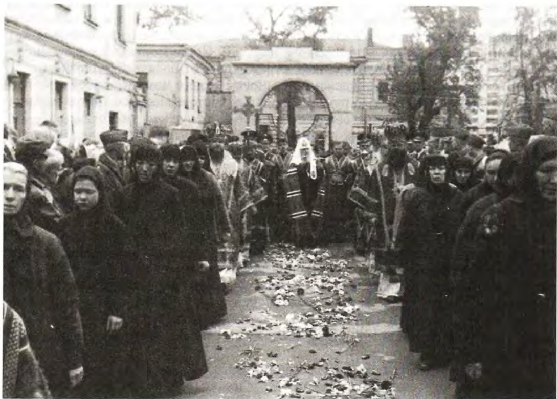
Приезд Святейшего Патриарха в Покровский женский монастырь в Москве

ской губернии в благочестивой крестьянской семье, она была слепой от рождения, но с младенческих лет получила от Бога дар духовного зрения. К отроковице Матроне обращались за советом ее односельчане, а затем и жители дру-