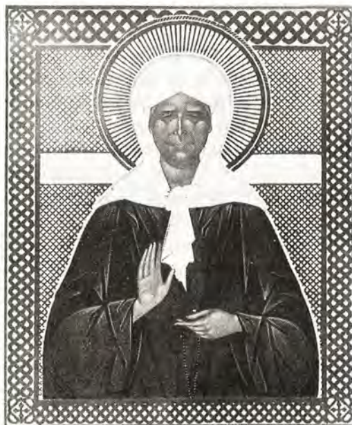
Святая блаженная Матрона

Праздник прошел, но душу не оставляет ощущение свершившегося чуда. Еще одна звезда воссияла на церковном небосклоне, еще одна угодница Божия прибавилась к сонму святых предстателей за наш Первопрестольный град. Нескончаемой чередой идут верующие в Покровскую обитель поклониться блаженной Матроне Московской, веря в силу ее благодатного заступничества, помня ее слова: «Все,