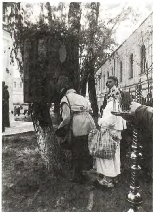
Во дворе Сретенского монастыря

Устраивая других – и духовенство, и мирян – на более легкие работы, Владыка Иларион не только не искал должности для себя, но и не раз отказывался от предложений со стороны Эйхманса, видевшего и ценившего его