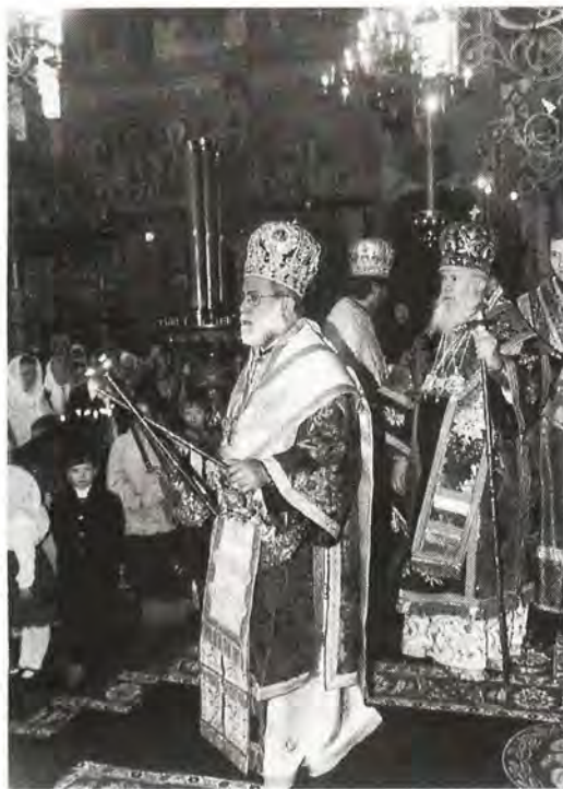
За Божественной литургией в Успенском соборе Московского Кремля