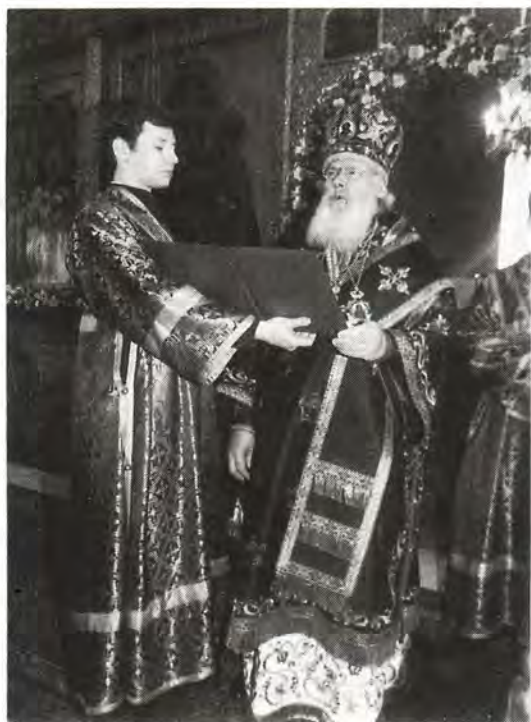
Святейший Патриарх Алексий зачитывает Определение о канонизации

1 января 1924 года епископ Иларион прибыл на пересыльный пункт на Попо-