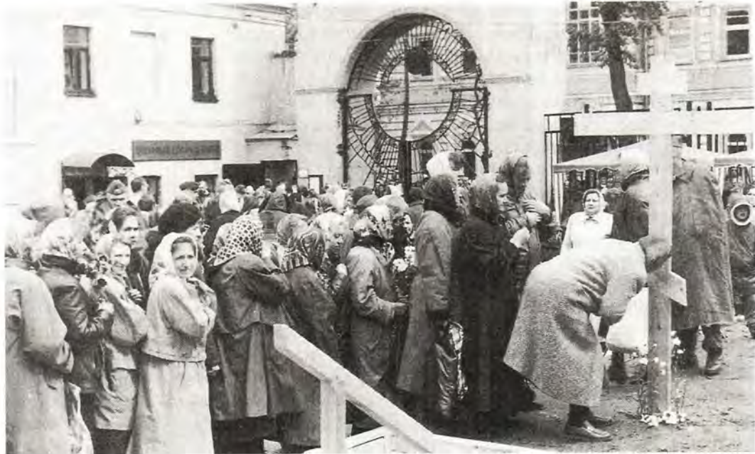
Православный народ у креста, воздвигнутого в Покровском монастыре на месте будущей колокольни

нушки – начинаясь с середины монастырского двора, она огибает половину большого Покровского собора и лишь затем вливается в церковные двери.