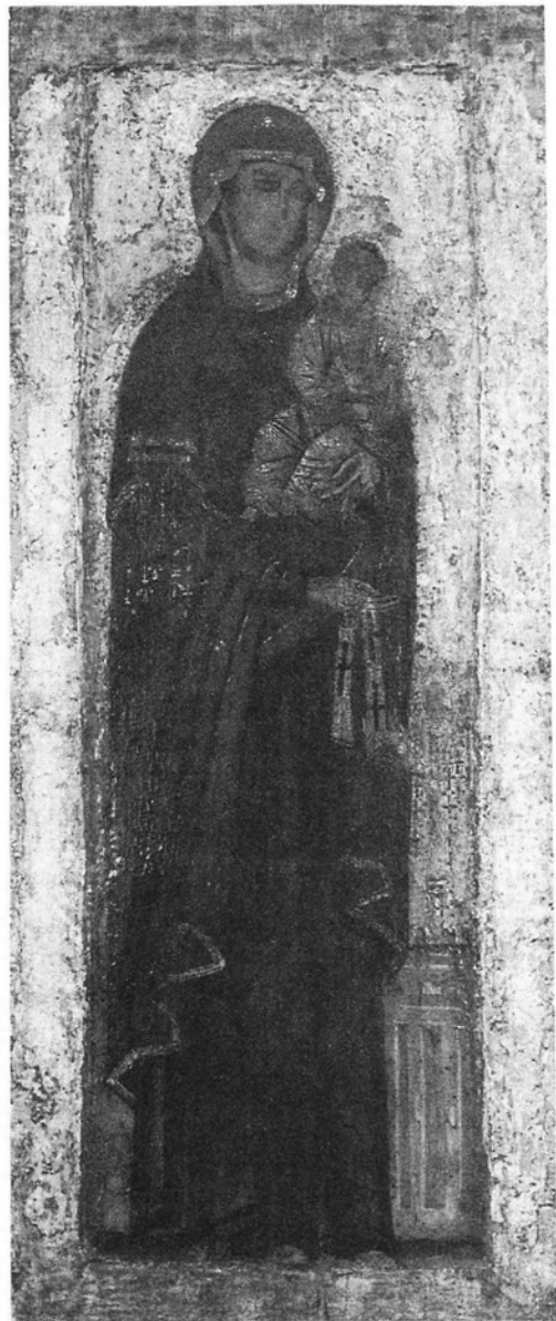
Максимовская икона Божией Матери

В 1299 году Митрополит Максим вынужден был навсегда оставить Киев.