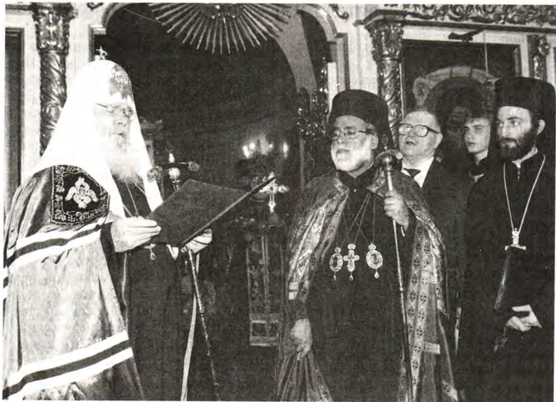
Во время передачи московского храма Всех святых на Кулишках Александрийскому Патриархату для Подворья

Православной Церкви, представители московского духовенства. Здесь же, в аэропорту, была проведена короткая пресс-конференция, на которой Перво-святители ответили на вопросы журналистов. В частности, Блаженнейший Патриарх Александрийский Петр VII отметил, что в Православии существует традиция посещения новоизбранными Предстоятелями Православных Церквей других Предстоятелей Поместных Церквей с визитами. Александрийская и Русская Церкви имеют древнюю историю и прочные взаимоотношения, и нынешний визит также будет способствовать упрочению братских взаимоотношений между Церквями-сестрами.