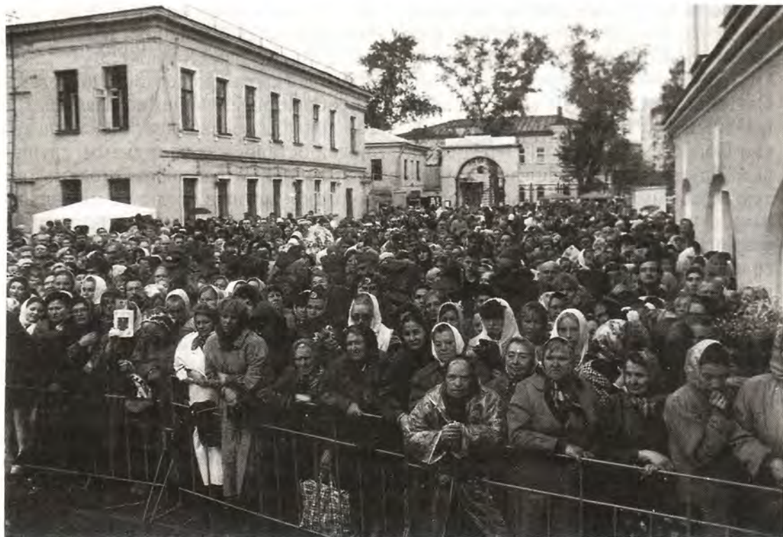
В день прославления блаженной Матроны в Покровском монастыре

На глазах растет очередь желающих поклониться честным мощам Матро-