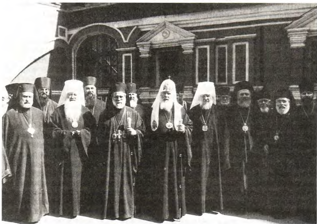
Иерархи братских Церквей у храма Всех святых на Кулишках – Подворья Александрийского Патриархата в Москве

распался и сейчас Одесса находится уже в другой стране. Перенесение Подворья в Москву сблизит наши Церкви. Представитель (Экзарх) Александрийского Патриархата при Московском Патриаршем престоле будет постоянно находиться в Москве, это будет способствовать укреплению живых связей между нашими Церквями. Думаю, что визит Его Блаженства будет мощным стимулом для развития таких связей. Если вспомнить послевоенную историю, то все Предстоятели Александрийской Церкви были частыми гостями в Москве. Визит, с которым прибыл к нам после вступления на престол Александрийских Патриархов Его Блаженство Петр VII, а также открытие Подворья в Москве – эти два события явятся важным этапом в развитии наших связей, сотрудничества между нашими Церквями и лично между Предстоятелями».