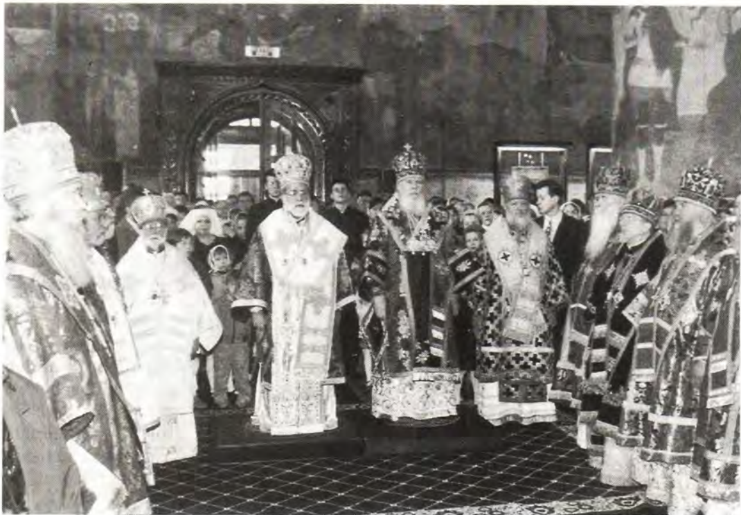
Предстоятели Александрийской и Русской Церкви во время совершения Божественной литургии в Успенском соборе Московского Кремля