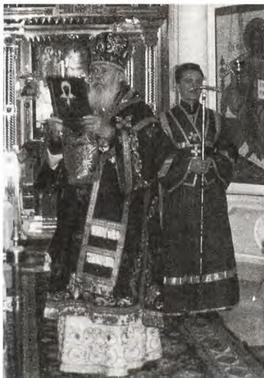
Святейший Патриарх благословляет народ иконой новопрославленной святой

После праведной кончины старицы, последовавшей в 1952 году, люди приходили на ее могилу на Даниловском кладбище, молились, призывали ее в по-