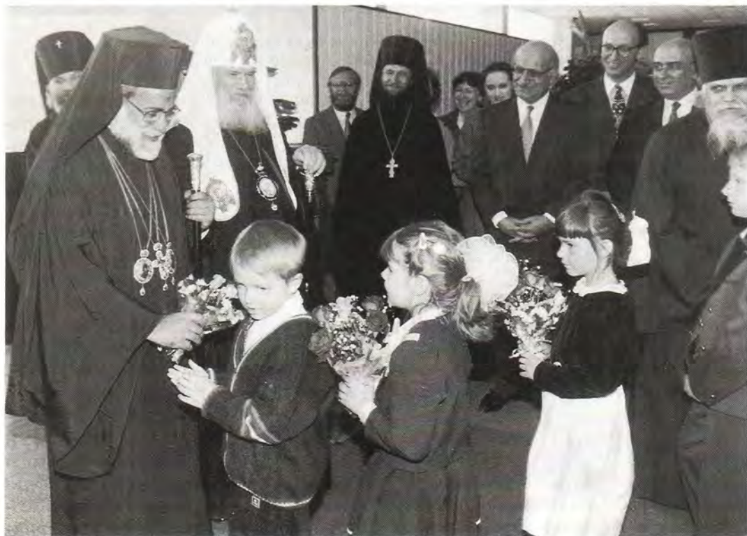
Встреча Блаженнейшего Патриарха Александрийского Петра в аэропорту «Шереметьево»

В аэропорту «Шереметьево» прибывшего самолетом из Каира Предстоятеля Александрийской Церкви встретил Святейший Патриарх Московский и всея Руси Алексей, члены Священного Синода, другие архипастыри Русской