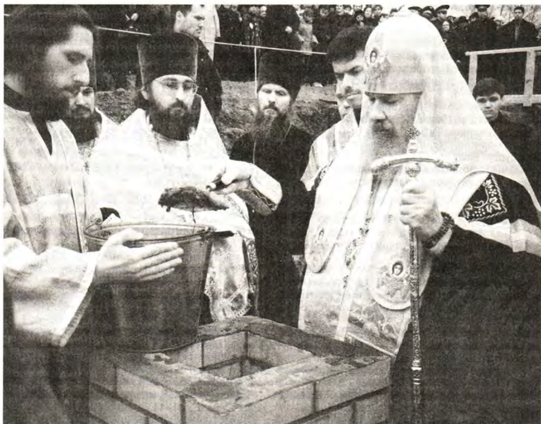
Святейший Патриарх Алексей совершает освящение закладного камня

жайшей церкви в честь иконы Божией Матери «Утоли моя печали» Первосвятытель Русской Православной Церкви освятил закладной камень в основание престола будущего храма во имя святителя Тихона, Патриарха Всероссийского, молитвенно пожелав «труждающимся делателям благопоспешение от Господа во всем подати, и дела рук их благословити, и к совершению силою, действием и благодатию Пресвятого