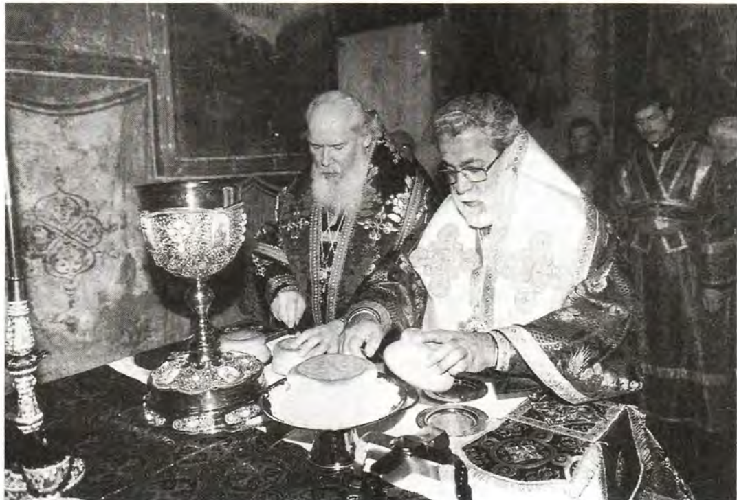
За Божественной литургией в Успенском соборе Московского Кремля. 25 апреля 1999 года

та Александрийских. Существовавшая здесь школа святоотеческого богословия внесла неоценимый вклад в сокровищницу православной богословской мысли. В пределах Александрийской Церкви было положено начало православному монашеству. Здесь подвизался великий столп Вселенской Церкви преподобный Антоний Великий, ее славу умножили своими подвигами преподобные Пимен Великий и Пахомий Великий. «Богоподражательное житие этих славных подвижников благочестия с глубоким благоговением было воспринято сердцем русского православного народа и всегда являлось примером для русского иночества, – подчеркнул Его Святейшество. – С любовью принимая ныне Вас, Ваше Блаженство, в пределах Святой Руси как Предстоятеля древнего Александрийского Патриаршего престола, мы радостно свидетельствуем наше нерушимое единство в вере и