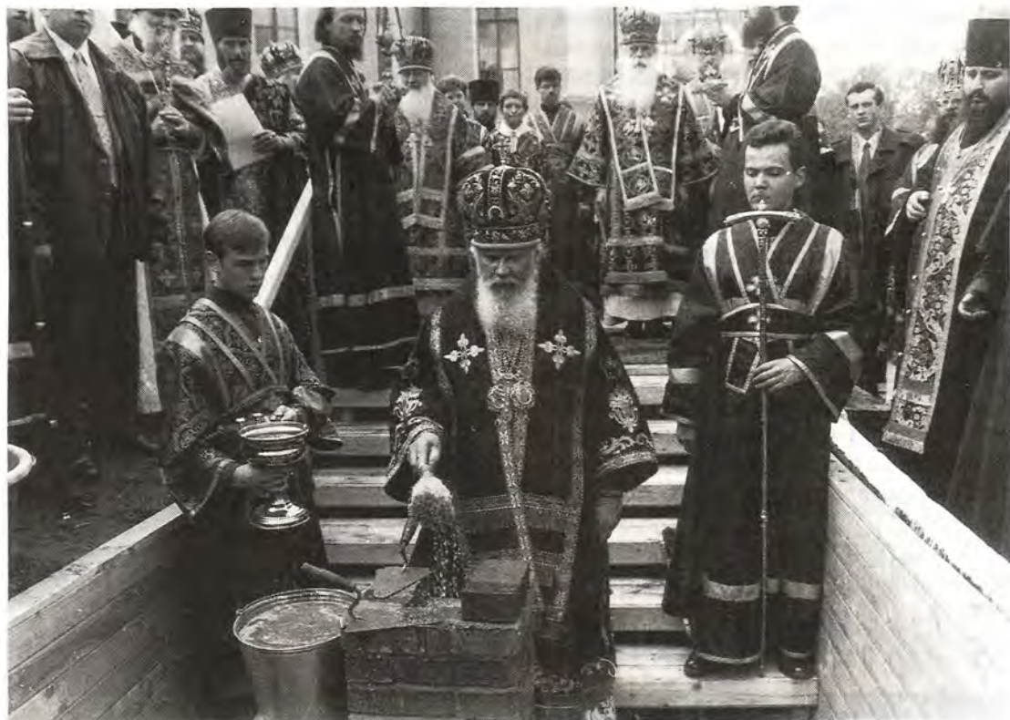
Закладка колокольни в Покровском монастыре. 2 мая 1999 года

вершена заупокойная лития. Гроб с честными останками старицы Матроны был доставлен в Данилов монастырь и помещен в надвратном храме во имя преподобного Симеона Столпника.