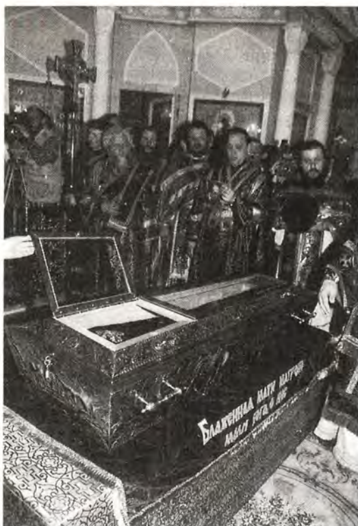
Рака с мощами блаженной Матроны в Покровском соборе