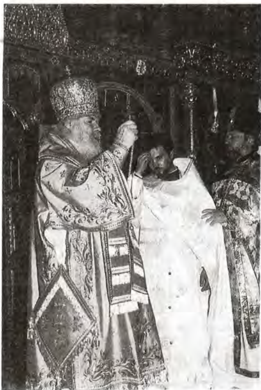
Святейший Патриарх Алексей совершает нерейскую хиротонию. Преображенская церковь Храма Христа Спасителя, 24 января 1999 года.

Накануне праздника Святейший Патриарх совершил всенощное бдение в Спасо-Преображенском храме Патриаршего подворья в Переделкине.