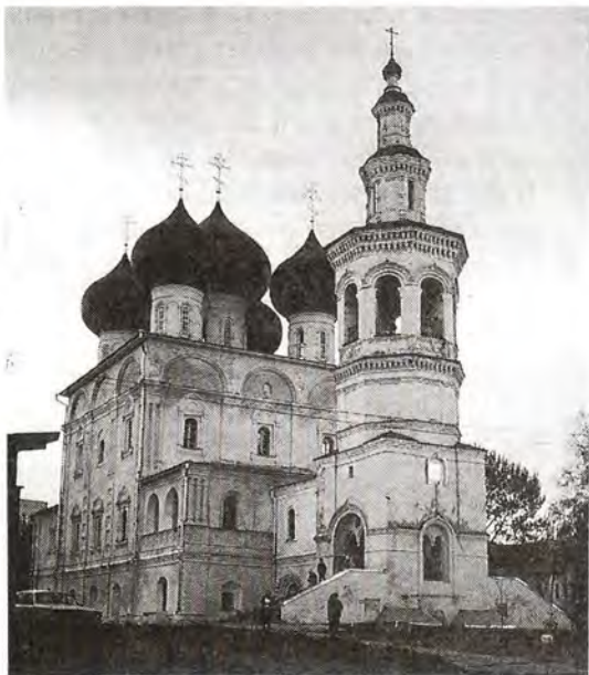
Храм во имя Святителя Николая во Владычной слободе Вологды, где почивают мощи святителя Антония