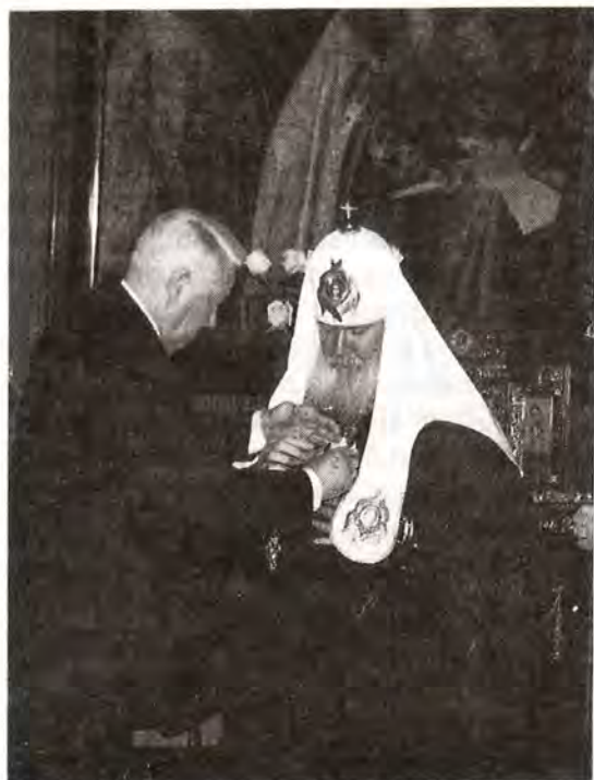
Вручение Святейшему Патриарху ордена Апостола Андрея Первозванного

Церковь всегда призывала и будет призывать людей с честью и достоинством нести то служение, на которое каждый поставлен, ибо от вклада каждого зависит наше будущее. Я в присутствии членов Священного Синода хотел бы заверить Вас, что слу-