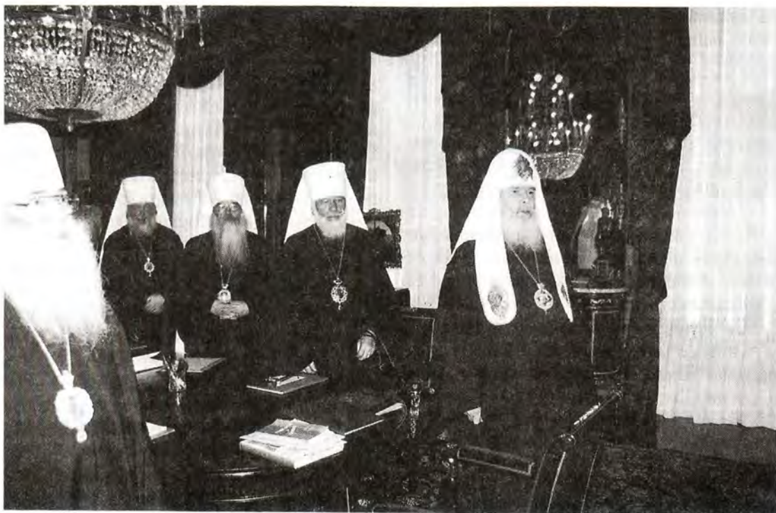
Молитва перед началом заседания Священного Синода

зации святых о соборном прославлении новомучеников и исповедников Российских XX века и передать рассмотрение этого вопроса на предстоящий Архиерейский Собор.