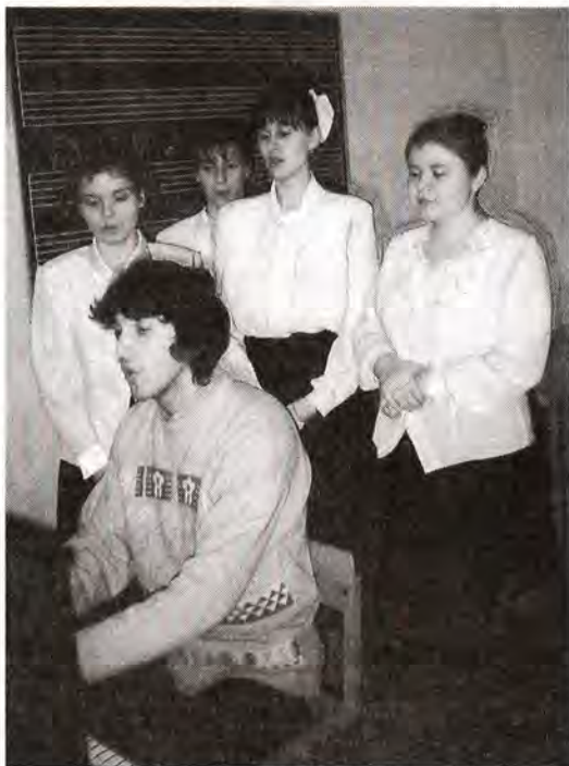
Занятия в регентском классе

И хотя училище еще только начинает свою деятельность, здесь уже складываются традиции, определяется ритм и строй жизни. Занятия начинаются и заканчиваются молитвой. Она является укрепляющей основой всей деятельности Духовного училища, дарует необходимые духовные и душевные силы. Преподаватели и студенты принимают участие в богослужениях, совершаемых епархиальным архиереем в Смоленском