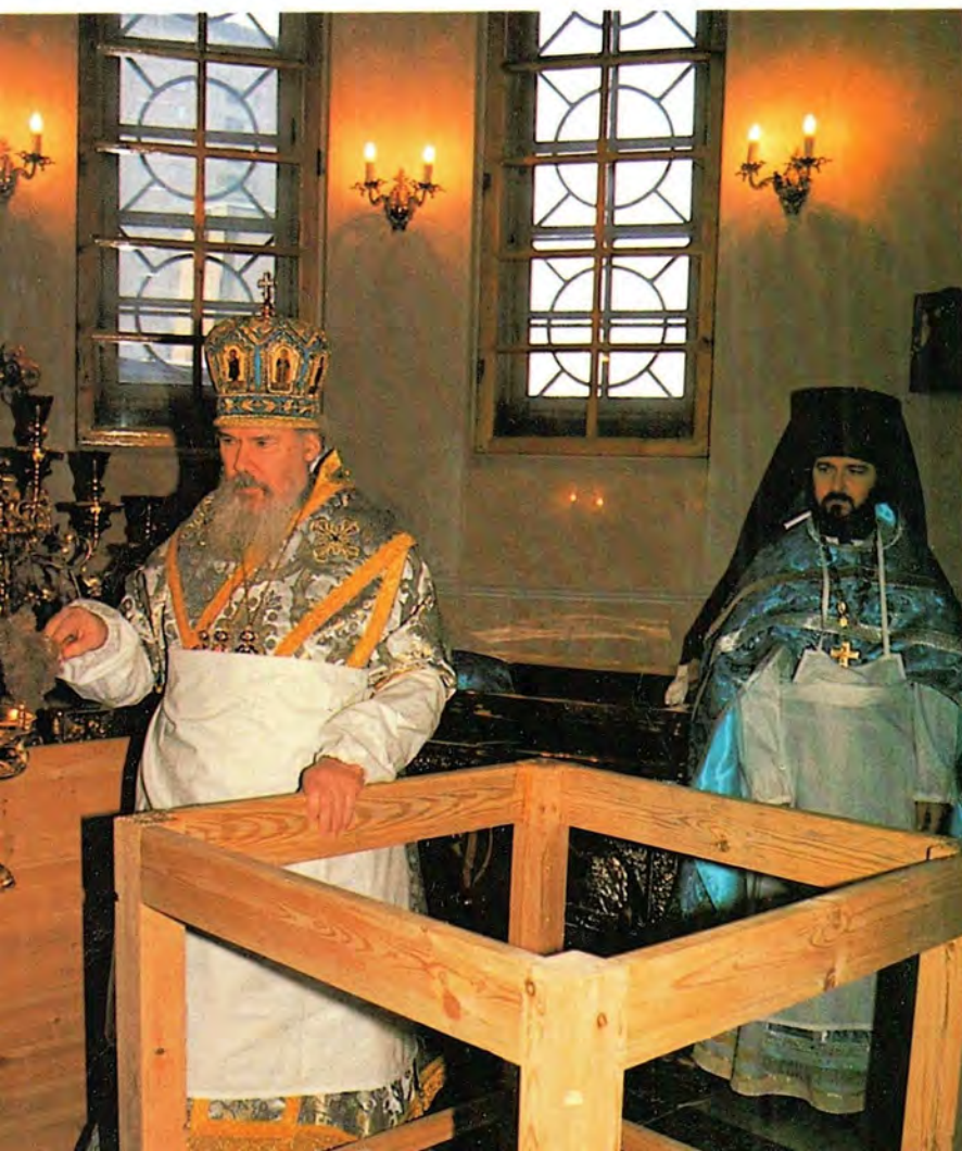
Освящение храма в честь иконы Божией Матери «Отрада и Утешение» при Боткинской больнице в Москве. 3 февраля 1999 года