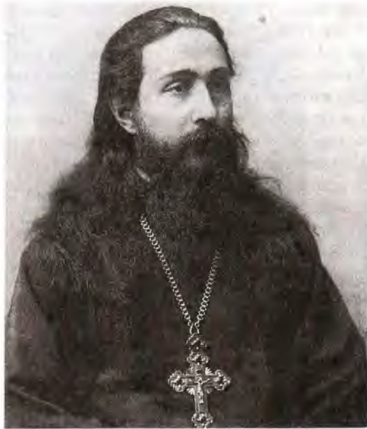
Протоиерей Митрофан Сребрянский в период служения в Орле

княгиня Елизавета переехала в дом, предназначавшийся под обительский.