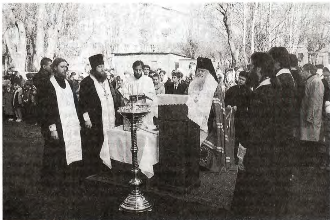
Молебен по случаю открытия Православной гимназии

Для Православной гимназии город предоставил двухэтажное типовое здание детского сада, которое раньше принадлежало одному из пензенских предприятий, но за неимением средств на содержание было заброшено и начало разрушаться. За счет городской администрации здание было отремонтирова-