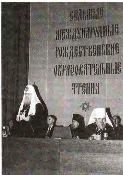
Слово Святейшего Патриарха Алексия на открытии VII Рождественских чтений

Нынешние чтения были посвящены двухтысячелетию Рождества Христова, и основной их задачей являлось осмысление многовекового опыта христианской цивилизации на пороге третьего тысячелетия. Они стали первыми в череде церковно-общественных мероприятий, посвященных историческому юбилею.