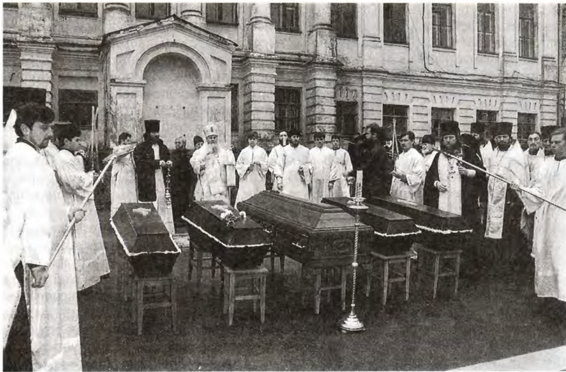
Панихида перед положением в склеп останков Пензенских святителей. В центре – гроб епископа Иннокентия

святых Евлампия и Евлампии. Некролог, опубликованный в «Пензенских епархиальных ведомостях» в 1881 году, позволил соотнести найденное захоронение с могилой епископа Григория. А другой некролог – за 1889 год – показал и место второго склепа, где покоился прах епископа Антония, – прямо напротив первого. Свод этого склепа тоже оказался пробит и заполнен водой, но, слава Богу, и здесь останки архипастыря сохранились полностью. 1 сентября они были извлечены, очищены от грязи и перенесены в специально отведенное временное помещение в бывшем архиерейском доме, недавно переданном местными властями Пензенской епархии.