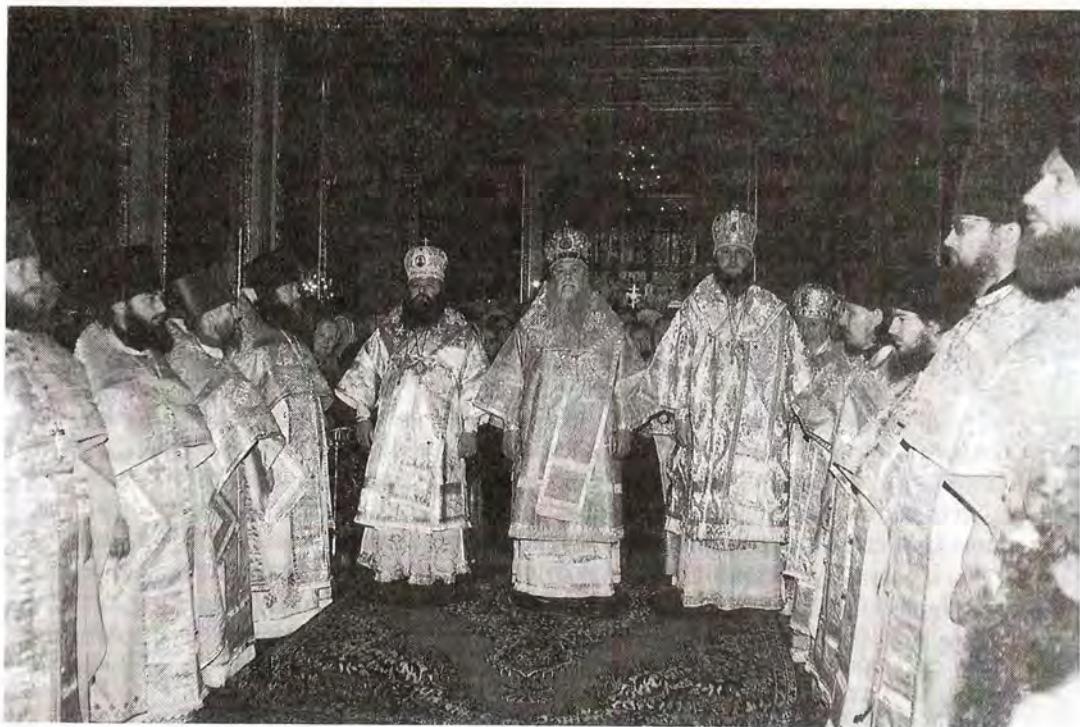
Богослужение в день 20-летия архиерейской хиротонии архиепископа Пензенского и Кузнецкого Серафима

епископ Саранский и Мордовский Варсонофий и епископ Красногорский Савва, который передал юбиляру поздравление от Предстоятеля Русской Православной Церкви Святейшего Патриарха Московского и всея Руси Алексия II: «Сердечно поздравляю Вас, дорогой Владыка, с 20-летием Вашей архиерейской хиротонии. Да умножит Господь дни и лета Вашей жизни, дарует здравие, силы и мудрость для несения многотрудного архипастырского служения. С любовью, Патриарх Алексей».