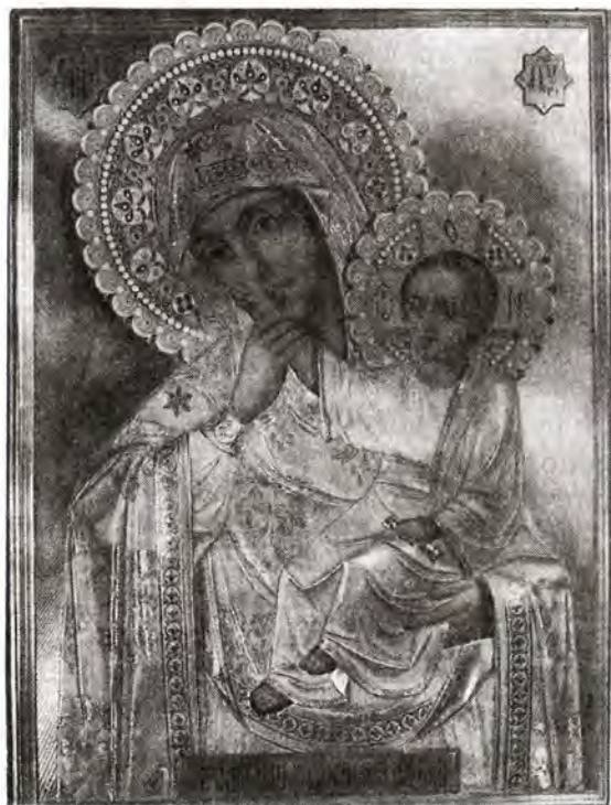
Икона Божией Матери «Отрада и Утешение»

Ее история связана с Афонским Ватопедским монастырем. Образ известен с конца IV века, когда заступничеством Царицы Небесной чудесным образом спасся от гибели в море сын императора Феодосия Великого Аркадий. Упавший за борт корабля во время бури и унесенный волнами, он затем был найден спящим под кустом на берегу, вблизи одного из монастырей. По собственному признанию Аркадия, он был избавлен от неминуемой гибели помощью Божией Матери, к Которой усердно молился. В память о знаменательном событии Афонская обитель получила наименование Ватопед, то есть «куст отрока». В благодарность Господу и Его Пречистой Матери император Феодосий обустроил монастырь: на том месте, где придворные обнаружили спящего мальчика, возвели большой собор в честь Благовещения Пресвятой Богородицы. Один из соборных приделов, был посвящен иконе Божией Матери «Отрада и Утешение», здесь же, близ правого клироса, был помещен и самый чтимый образ. В 807 году Ватопедская обитель чудесной помощью Пресвятой Богородицы была спасена от нападения разбойников: Царица Небесная обратилась со Своей иконы «Отрада и Утешение» к молившемуся перед ней игумену и повелела не отворять монастырских ворот, но подняться на стены и от-