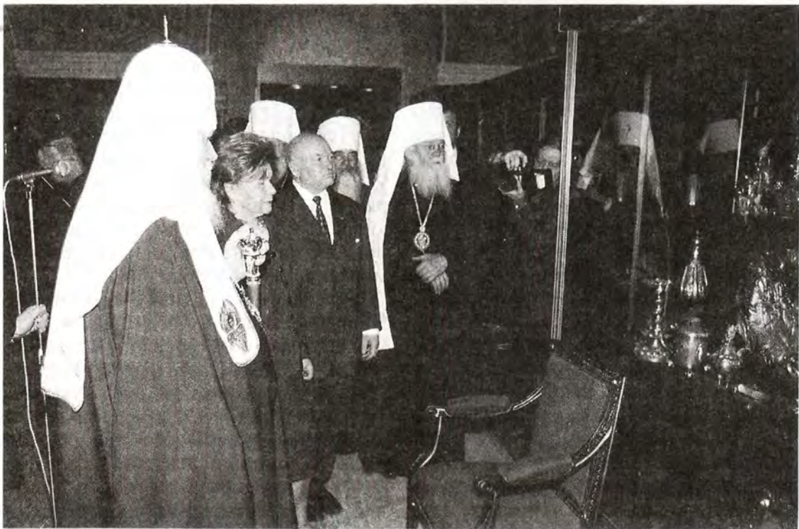
Во время осмотра выставки в Московском Кремле

каждый священнослужитель, каждый православный верующий человек, бывая на богослужениях в Успенском, или Архангельском, или Благовещенском соборе, чувствует свою сопричастность нашей истории – истории Государства Российского. – сказал Его Святейшество. – Все мы, являясь сынами и дочерьми нашего Отечества, должны служить благу России, ее могуществу, будущему нашей великой Родины и народа земли нашей...»