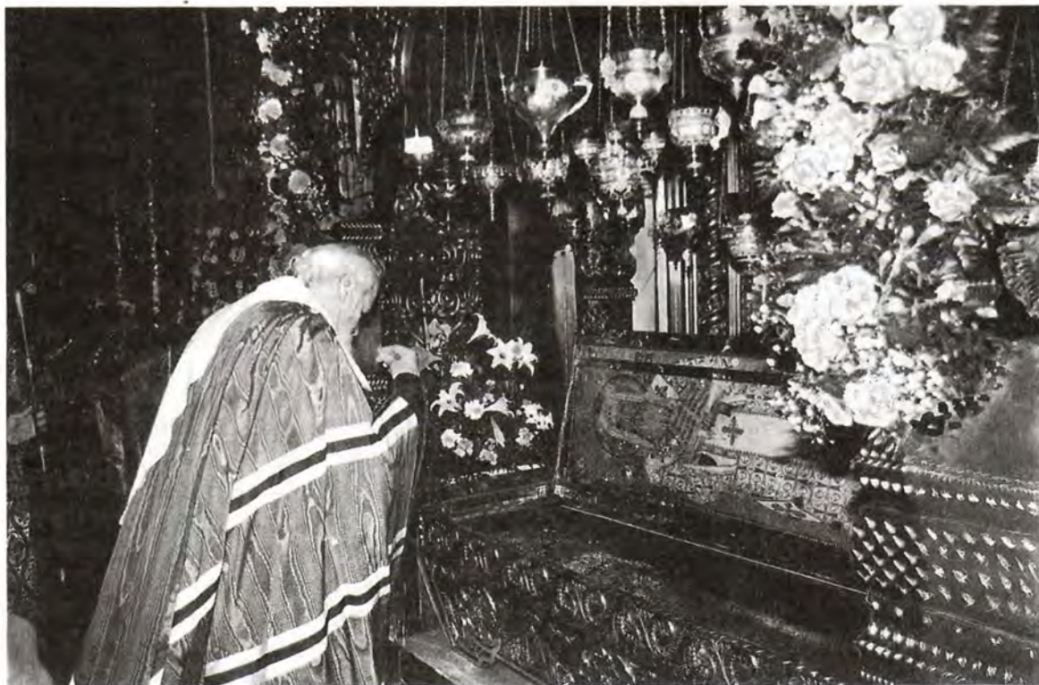
Святейший Патриарх Алексий у мощей своего Небесного покровителя – святителя Московского Алексия

который говорит: Дни лет наших в нихже семьдесят лет, аще же в силах, осмьдесят лет, и множае их труд и болезнь (Пс. 89, 10). Сколько даст мне Господь сил нести мое служение, ведомо Ему Единому. Но, укрепляемый любовью и молитвами архипастырей и пастырей, всего народа Божия, который постоянно проявляет свою любовь, свою поддержку, свое понимание трудностей нашего служения, верю, что, сколько бы Господь ни дал мне и каждому из нас совершать наше служение, мы будем совершать его во славу Божию, на благо Отечество нашего, на благо Святой Церкви,