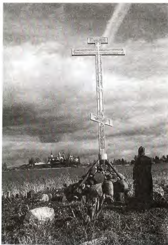
Поклонный крест на острове Патриарха Никона

27 сентября в день Воздвижения Честного и Животворящего Креста Господня был освящен новосооруженный поклонный крест на острове Патриарха Никона в Бородаевском озере. Примечательна история этого креста. Патриарх Никон, будучи здесь в ссылке с 1666 по 1681 год, сам насыпал островок, выбрав для этого самое мелкое место озера – глубиной в две сажени. Вместе с монахами-помощниками Никон сам на плотах возил сюда камни и опускал на дно. А потом поставил среди камней деревянный крест – в память о своем «заточении за слово Божие и за Святую Церковь». Деревянный крест простоял меньше десяти лет и был снесен по приказу Патриарха Иоакима. Летом 1998 года местные жители приняли решение восстановить памятную святыню. Всем миром очистили островок от мусора, от сорных деревьев и кустарников. Шестиметровый никоновский крест изготовили мастера из Чагоды. Ранее ими же был выполнен похожий крест, который установили в селе Воскресенском Грязовецкого района, в память о пребывании в тех местах преподобного Димитрия Прилуцкого. Высотой они почти одинаковы, а вот формой отличаются – никоновский сделан семиконечным и напоминает поморские поклонные кресты. Остров, на котором он водружен, находится близ Ферапонтова монастыря, с которым также связано одно из памятных событий церковной жизни – в нынешнем году этой всемирно изве-