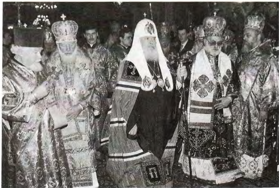
Перед началом богослужения в Богоявленском кафедральном соборе

исходит таинственное единение наше с Богом и друг с другом. Вы восприняли крест Первосвятителя нашей Церкви в сложное и многотрудное время, хотя в это время Церковь получила многие возможности для совершения своего служения, своей миссии. Насколько высок Ваш крест, посланный Вам изволением Духа Святого и тайным избранием Поместного Собора, настолько он труден. Он требует от Вас печалиться о всей нашей Святой Церкви, чада которой находятся в России и в странах ближнего и дальнего зарубежья... Вы всего себя отдаете на служение, показывая пример нам – епископату, духовенству и простому верующему народу. Поздравляя и приветствуя Вас, Ваше Святейшество, я желаю, чтобы Господь обогатил Вас многими годами, многими высокими свершениями во славу Божию, на благо и пользу нашей Святой Русской Православной Церкви и нашего боголюбивого народа». Бла-