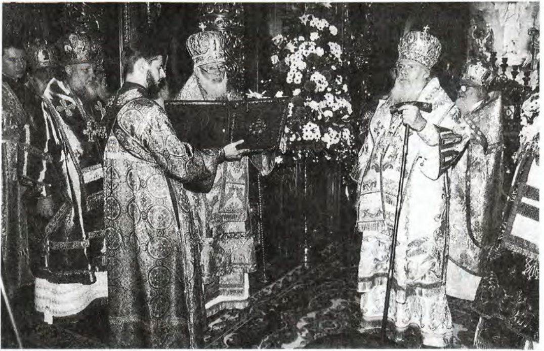
Святейшего Патриарха поздравляет митрополит Киевский и всея Украины Владимир