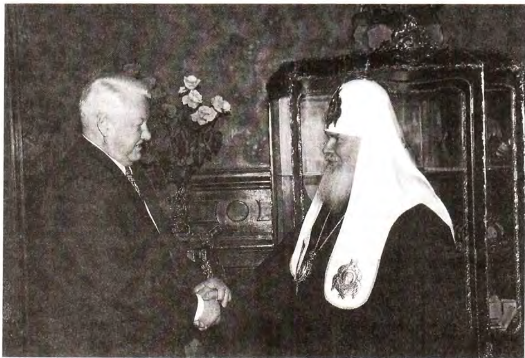
Встреча в резиденции Святейшего Патриарха в Чистом переулке

Каждый священнослужитель Русской Православной Церкви, где бы он ни совершал свое служение, призыва-