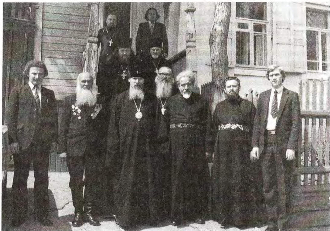
Архиепископ Оренбургский и Бузулукский Леонтий с Управляющим делами Московской Патриархии митрополитом Алексием. Оренбург, 1983 год