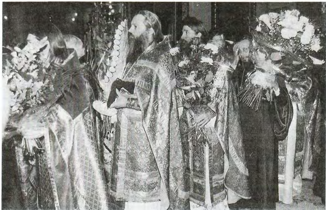
Московское духовенство готовится поздравить своего Первосвященителя