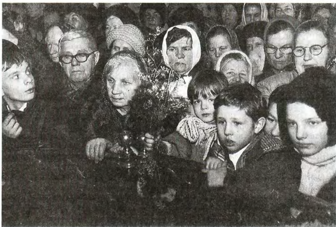
Во время богослужения в Богоявленском кафедральном соборе