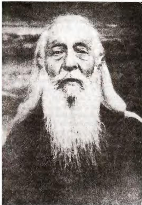
Архимандрит Сергий (Сребрянский) в последние годы жизни

Перед мысленными созерцательными взорами старца раскрывается таинственный духовный мир с неисчерпаемыми красотами и умилением... Он в миру вел жизнь пустычника. Несомненно, эта способность созерцания стояла в связи с его душевной чистотой. Его ангельская чистота и бесстрастие, которыми была проникнута последняя предсмертная исповедь, которую я принимал от него, привела меня в какой-то священный ужас. Я после этого понял душевное состояние Петра, когда он воскликнул: “Господи, отойди от меня, ибо я человек грешный”. В нем меня все удивляло, все было необыкновенно. Удивляло его незлобие. Как-то раз он заметил мне: “Плохих людей нет, есть люди, за которых особенно нужно молиться”. В беседах его не было даже и тени неприязни к людям, хотя он и много страдал от них. Не менее поразительно было и смирение его. Как-то