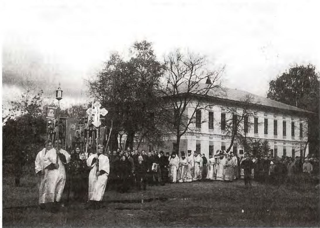
Перенесение мощей святителя Антония из Софийского собора Вологды в храм во имя Святителя Николая во Владычной слободе