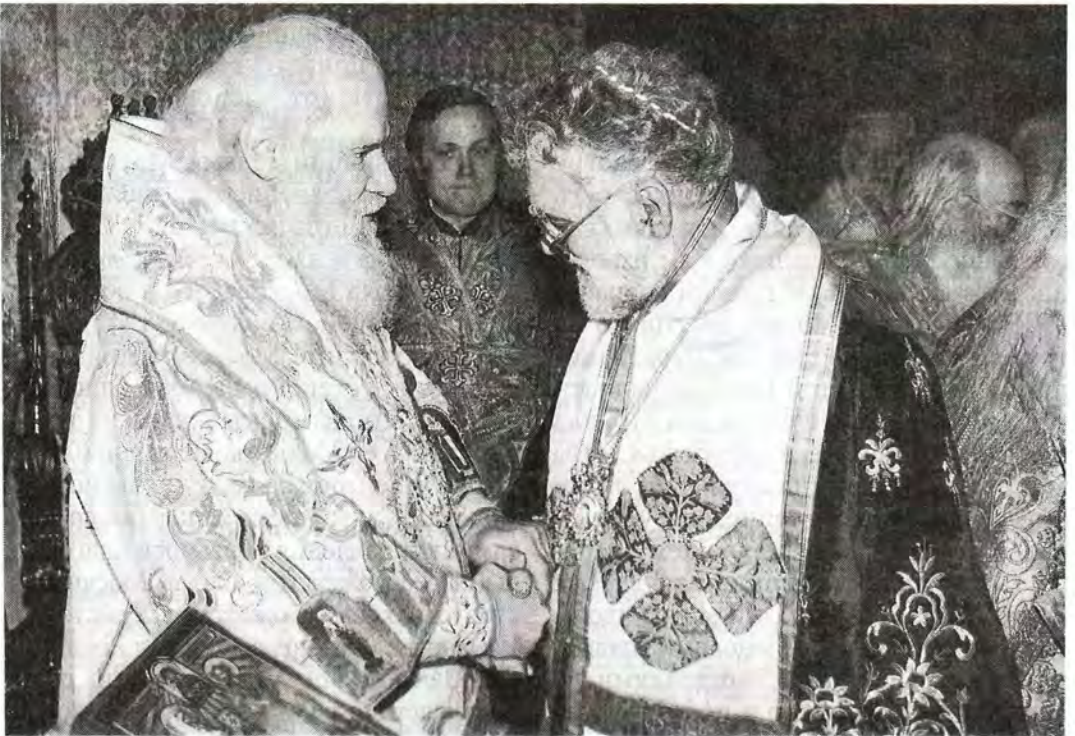
Юбилера поздравляет представитель Константинопольского Патриархата