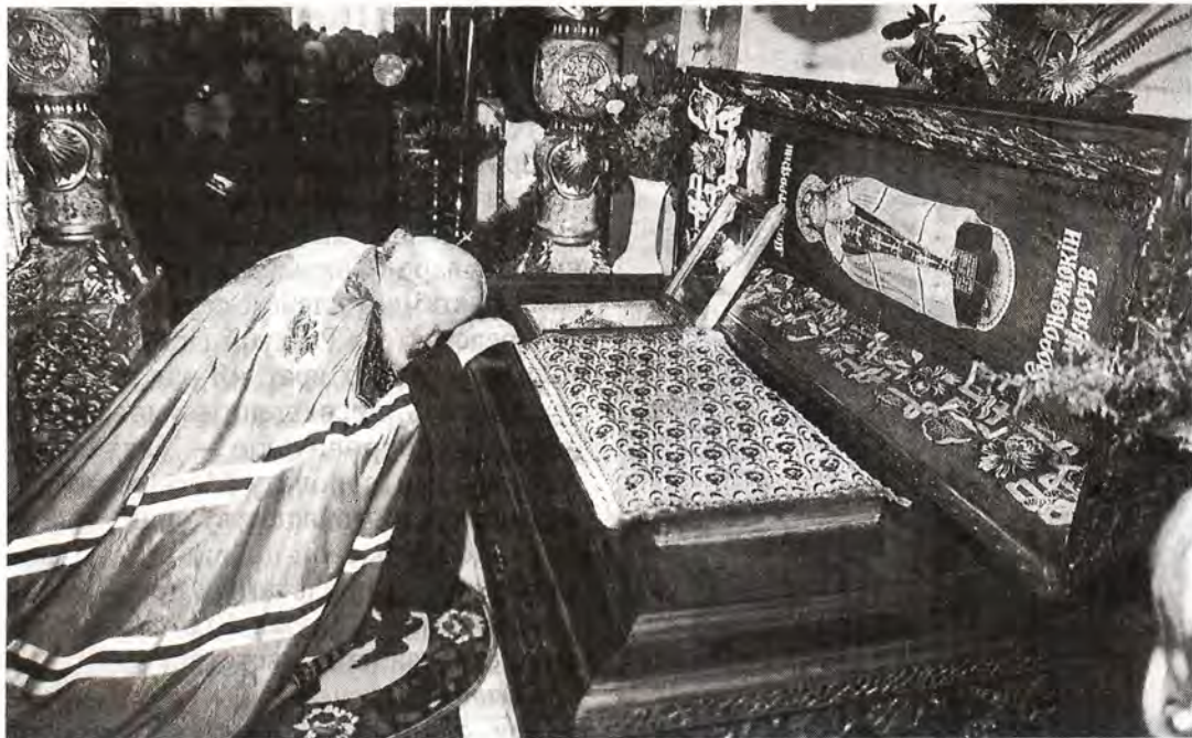
Предстоятель Русской Православной Церкви у мощей святителя Митрофана Воронежского

ны церковном здании разместился антирелигиозный музей. Во время войны Покровский храм был сильно поврежден в результате бомбежек и артобстрелов. Сам Воронеж в ходе боев был практически уничтожен: постановлением правительства его включили в число пятнадцати наиболее пострадавших от войны городов, в восстановлении которых принимала участие вся страна. Это постановление, разумеется, не касалось православных «объектов»: свой храм воронежцы восстанавливали сами. 10 мая 1948 года по многочисленным просьбам жителей города церковь Покрова Пресвятой Богородицы была возвращена верующим. Немалую роль в этом сыграло и общее послевоенное «потепление» в церковно-государственных отношениях. Нынешний год для Покровского храма юбилейный: пятьдесят лет назад в нем была возобновлена богослужб-