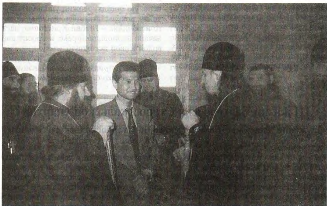
Встреча с президентом Калмыкии Кирсаном Илюмжиновым в строящемся храме святого великомученика и Победоносца Георгия. 24 сентября 1998 года