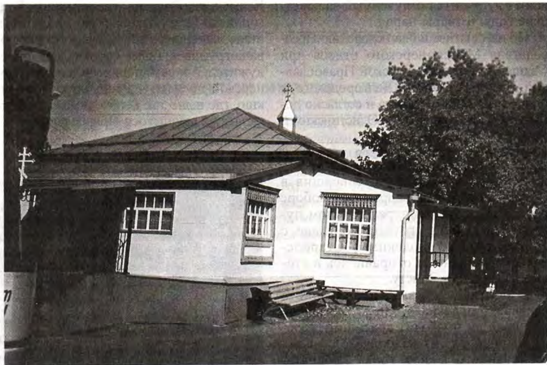
Крестовоздвиженский храм в Элисте

же получили это одноэтажное здание, оборудовали его под храм и воскресную школу. С тех пор и поныне этот храм – действующий. Мы пропели тропарь Честному и Животворящему Кресту, приложились к чтимому образу Пресвятой Богородицы (от которого не раз совершались исцеления больных), другим святыням храма.