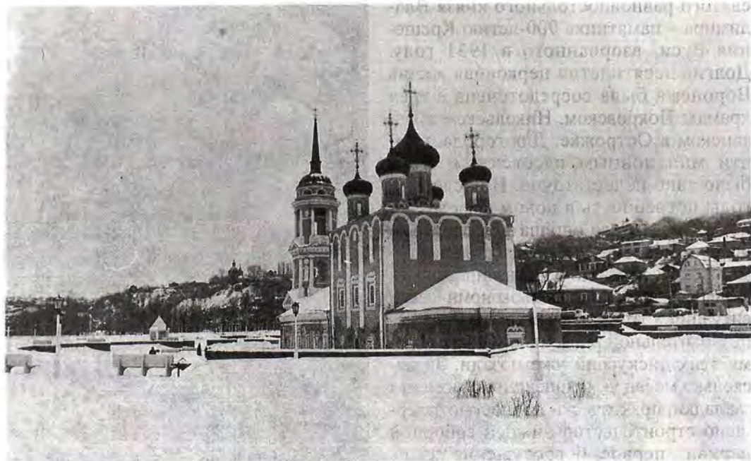
Адмиралтейская Успенская церковь на Петровском острове

иерарх Русской Православной Церкви выразил убежденность в том, что идея строительства собора найдет живой отклик в сердцах горожан. «Этот храм, — отметил он, — не только памятник истории. Его строительство — акт покаяния за грехи наших отцов и дедов, которые разрушали святыни Отечества».