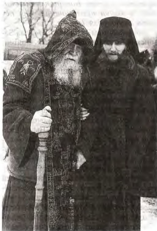
Насельники прославленной Задонской обители

В 1919 году Богородицкий монастырь был закрыт и разорен. Народная святыня вызвала ожесточенную ненависть новых «хозяев» страны. 28 января 1919 года кощунниками были вскрыты мощи святителя Тихона. Это событие было зафиксировано на киноплёнке, которую затем повсеместно показывали в целях антирелигиозной пропаганды. Владимирский собор заняли под элеватор, а затем он превратился в склад готовой продукции овощесушильного завода: автокары, заезжавшие прямо в церковное здание, развозили по нему банки с кабачковой икрой и томатным соусом. Кроме овощесушильного завода на обширной территории обители сосуществовали еще несколько организаций: районная больница с поликлиникой, пищекомбинат и общежитие культпросветучилища. Часть монастырских зданий использовалась под жилье. Возвращенные Церкви постройки Задонского монастыря являли ужасающую картину: разрушенная колокольня, поросшая травой и кустами крыша Владимирского собора, встуду разор и запустение. Укрепляемые молитвенной помощью Задонских чудотворцев, и в первую очередь святителя Тихона, новые насельники обители принялись за ее восстановление. Значительную помощь в этом им оказал Новолипецкий металлургический комбинат, руководство которого считает своим