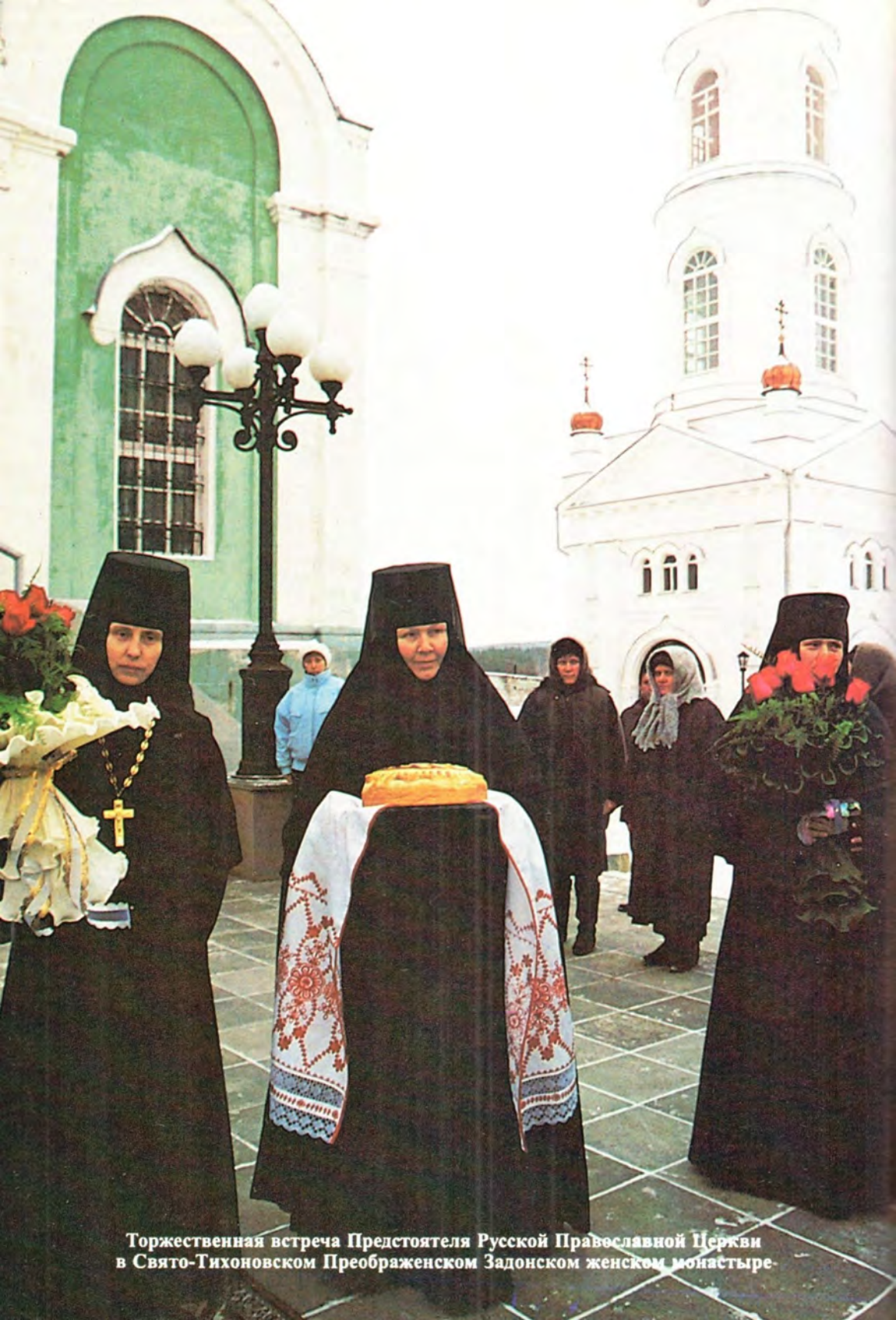
Торжественная встреча Предстоятеля Русской Православной Церкви в Свято-Тихоновском Преображенском Задонском женском монастыре.