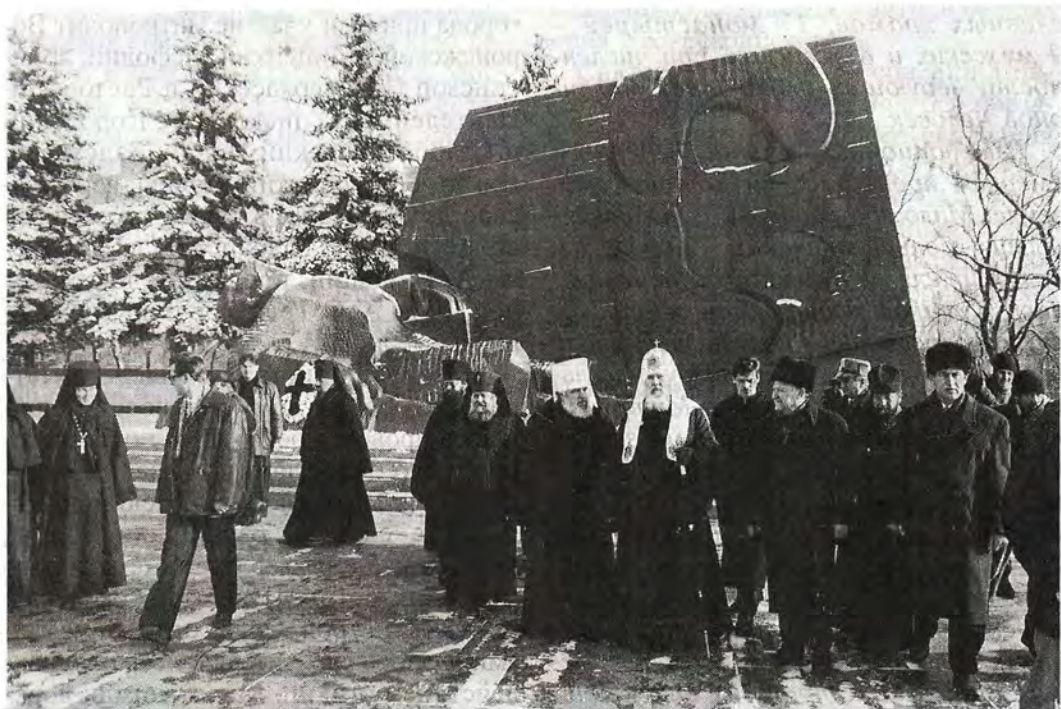
Святейший Патриарх Алексий и члены делегации у мемориала воинской Славы