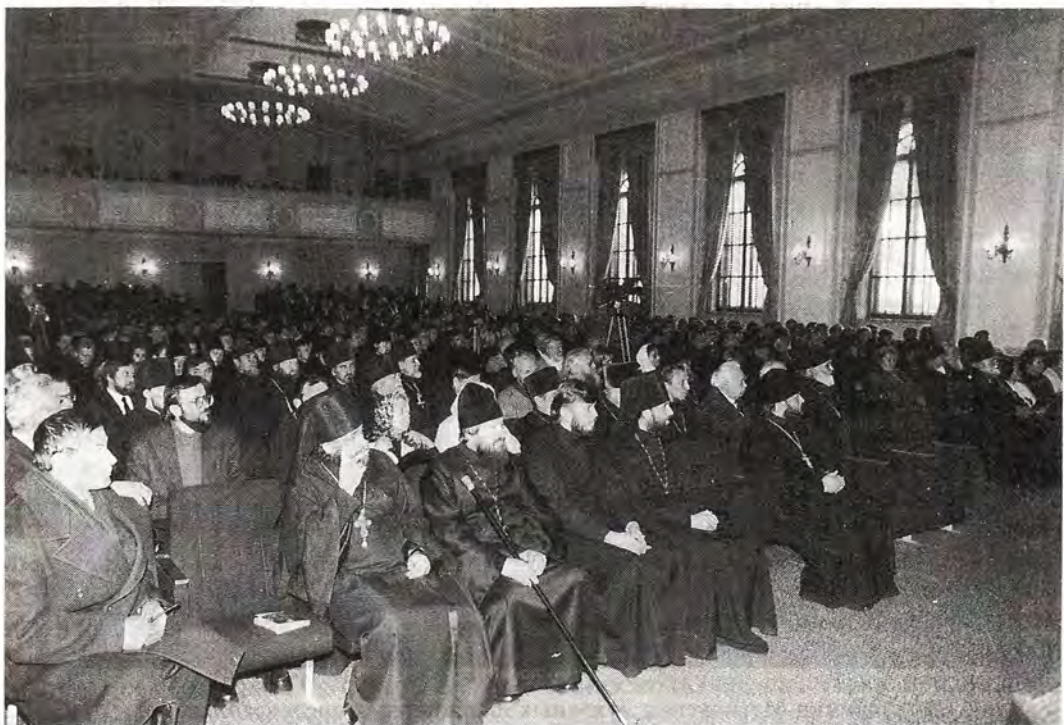
Участники юбилейного Филаретовского вечера

С заключительным Словом к участникам вечера обратился Святейший Патриарх Алексий. Он поздравил уча-