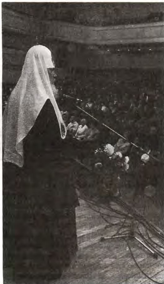
Святейший Патриарх приветствует жителей города Воронежа во время встречи с общественностью в Центре культуры АПЕКС

Воскресный день подходил к концу: в усыпанном снегом городе наступали ранние ноябрьские сумерки. С тоскливой атмосферой осеннего вечера контрастировало радостное оживление, царившее в городском Центре культуры АПЕКС, где была назначена встреча Святейшего Патриарха Алексия с воронежской общественностью. Со всех сторон к АПЕКСу спешили горожане: многие шли семьями, ведя с собой детей. Залитый светом зрительный зал был переполнен людьми. Обращаясь к воронежцам, Святейший Владыка под-