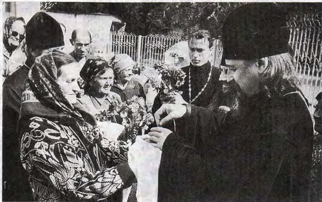
Встреча в Яшалте. 23 сентября 1998 года