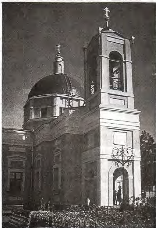
Казанский кафедральный собор Элисты

Кафедральный собор построен в соответствии с канонами православного зодчества. В его интерьере нашли от-