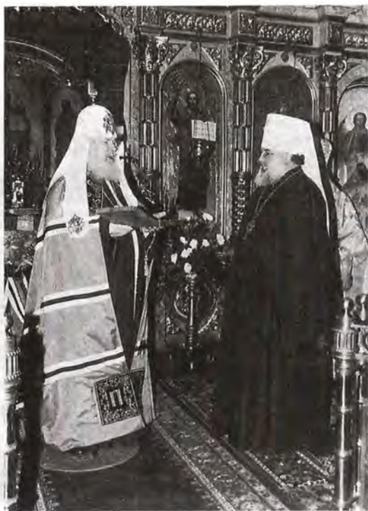
После Божественной литургии Святейший Патриарх Алексий передает в дар митрополиту Воронежскому и Липецкому Мефодию святую панагию и крест

В ответном Слове Святейший Патриарх Алексий выразил признательность Владыке Митрополиту, Председателю Воронежской областной Думы, а также представителям юного поколения православных воронежцев за приветствия и сердечные пожелания, высказанные в его адрес. «Я хочу поблагодарить за возможность нашего общения здесь, на Воронежской земле, в связи с нашим посещением одной из центральных епархий и областей России и возможность поклониться святыням этой земли: мощам святителей Митрофана, первого епископа Воронежского, и Тихона Задонского. Большая разница, – подчеркнул Его Святейшество, – между тем, какую получаешь информацию, что читаешь в годовых отчетах епархии, и тем, что видишь своими глазами. Я могу свидетельствовать, что здесь, на Воронежской земле, трудами, вдохновением и подвигами Владыки митрополита Мефодия, пастырской деятельностью и ревностью священнослужителей, монашествующих и православных верующих людей, при содействии и понимании задач, которые мы ставим перед собой, со стороны областных и городских властей возрождается церковная, монашеская и приходская жизнь во всем ее многообразии. Мы часто говорим о том, что живем в непростое время, но в наши годы закладывается будущее Церкви и будущее нашего Оте-