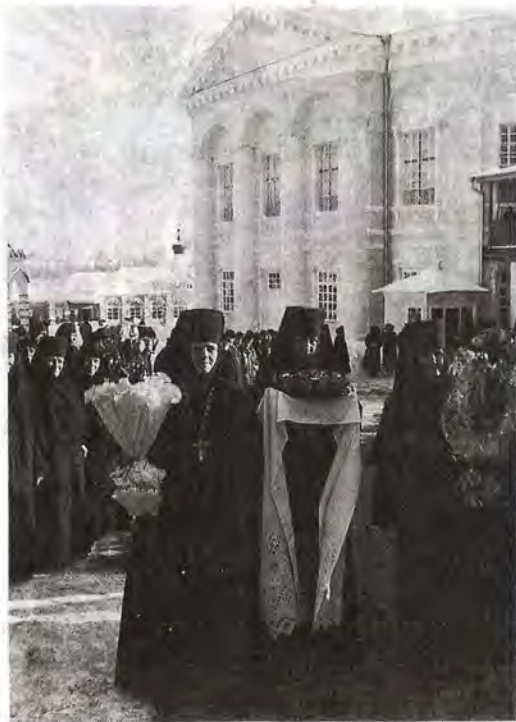
Встреча Его Святейшества в Свято-Алексиевском Акатове монастыре