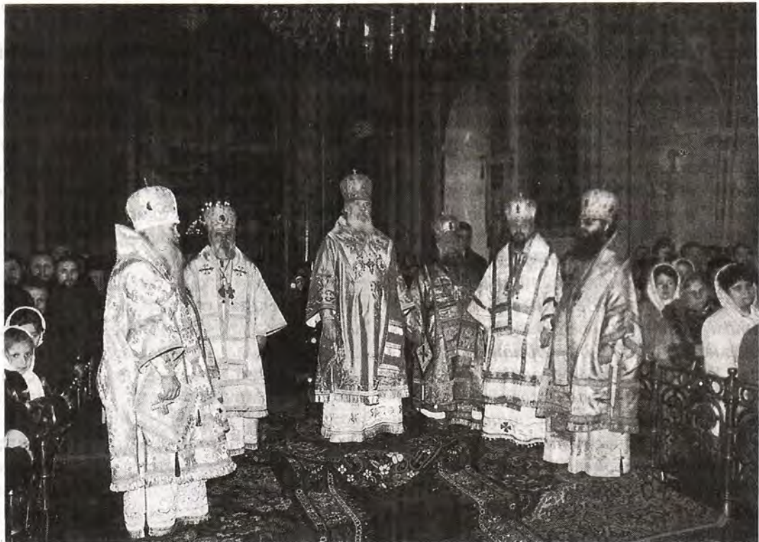
Всенощное бдение в Покровском кафедральном соборе

бдение в Покровском кафедральном соборе Воронежа. За этим первым в истории города Патриаршим богослужением молились сотни воронежцев. Каждый из них после помазания освященным елеем получил из рук Первосвященителя иконку Божией Матери, именуемую «Утоли мои печали».