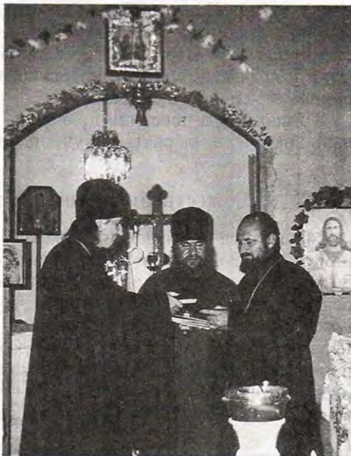
В храме святых мучеников Андриана и Наталии. Поселок Яшалта

Из Приятного мы выехали в Яшалту – районный центр на границе Калмыкии со Ставропольским краем. Яшалта была основана в прошлом веке немецкими и эстонскими поселенцами, их потомки живут здесь и сейчас. И потому наряду с православной общи-