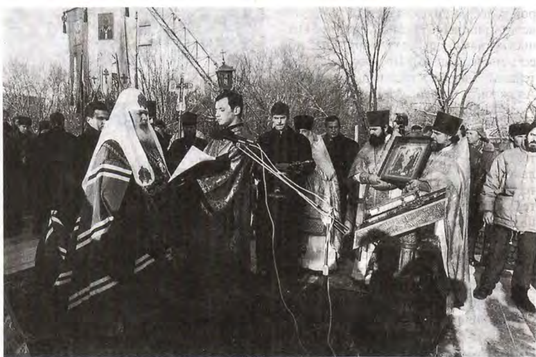
Первосвятительская молитва на месте строительства Благовещенского кафедрального собора