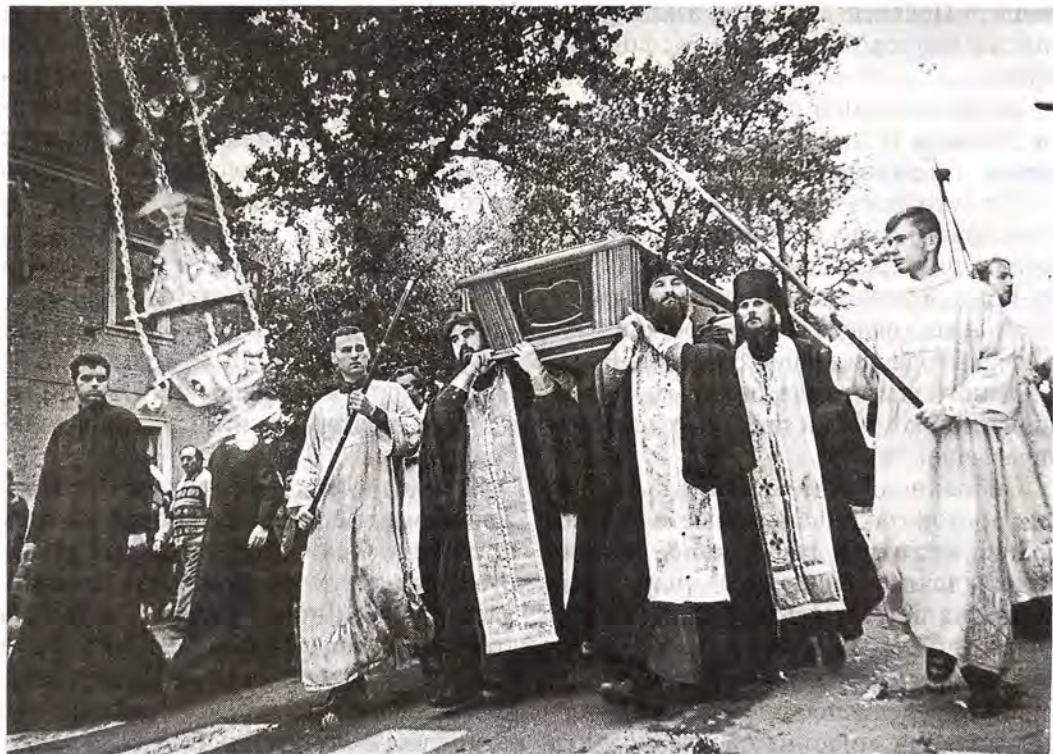
Перенесение мощей святителя Иоасафа Белгородского. 19 августа 1998 года