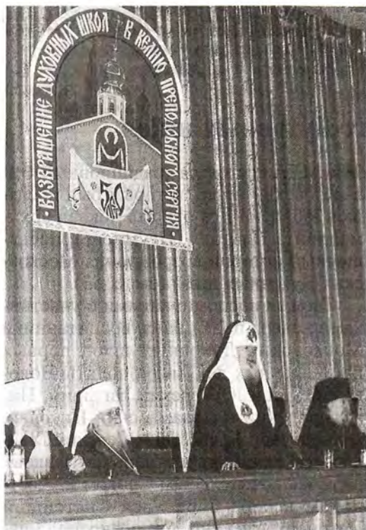
Святейший Патриарх выступает с заключительным Словом

щих и учащихся Московских Духовных школ с «золотым» юбилеем. «Воспоминания очевидцев событий пятидесятилетней давности, когда только что возрожденные Московские Духовные школы возвращались в Лавру Преподобного Сергия, – сказал Святейший Владыка, – очень важны и полезны для тех, кто сегодня учится в наших Духовных учебных заведениях. Сегодняшним пастырям нужно знать, через какие трудности и испытания прошли их отцы и деды. У них не было условий, которые созданы теперь, но они преодолевали все трудности, стремясь получить богословское образование. В те годы в Семинарии и Академии царила особая атмосфера духовного подъема возрождающейся церковной жизни. Сегодня мы находимся в совершенно новых условиях, когда Духовные школы живут своей внутренней жизнью, без вмешательства извне, да и вся церковная жизнь в России избавлена от государственной опеки. Но молодые священнослужители должны помнить и знать, через какие трудности