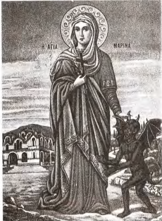
Икона святой великомученицы Марины из монастыря в д. Вóни