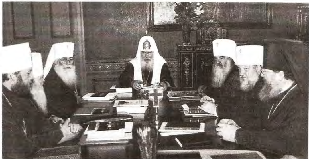
Заседание Священного Синода Русской Православной Церкви 9 июня 1998 года