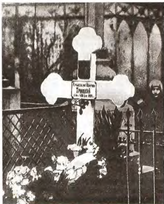
Могила Владыки Илариона на Новодевичьем кладбище Петербурга

Отпевание закончилось в четыре часа дня. После этого подняли гроб и понесли на кладбище Новодевичьего монастыря. Впереди гроба шли певчие, певшие «Помощник и Покровитель бысть мне во спасение...» Дойдя до могилы, поставили гроб, отслужили последнюю литию, поклонились почившему архипастырю и стали опускать гроб в могилу. Епископ Амвросий взял первый комок земли, бросил на гроб, сказав: «Господня земля, и исполнение ея, вселенная и вси живущие на ней...» Быстро вырос небольшой холмик, и был поставлен белый крест с надписью: «Архиепископ Иларион Троицкий». Затем все стали расходиться с кладбища; и в это время торжественно и празднично затрещивали колокола, обгоняя один другого. И вспомнились одному из участников погребения слова, звучавшие на отпевании: «Господня земля, и исполнение ея, вселенная и вси живущие на ней. Той на морях основал ю естъ, и на реках уготовал ю естъ. Кто взыдет на гору Господню? Или кто станет на месте святем Его? Неповинен рукама и чист сер-