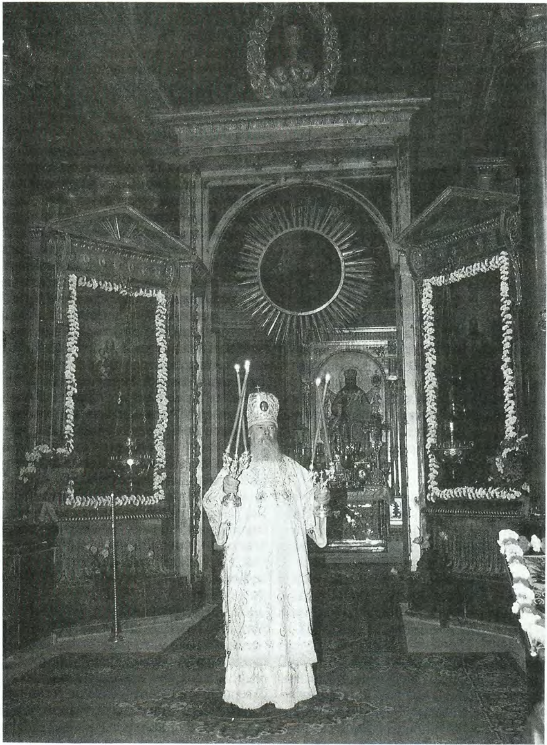
Святейший Патриарх Алексий совершает Божественную литургию в храме святителя Мартина Исповедника в Москве в праздник Вознесения Господня, 28 мая 1998 года