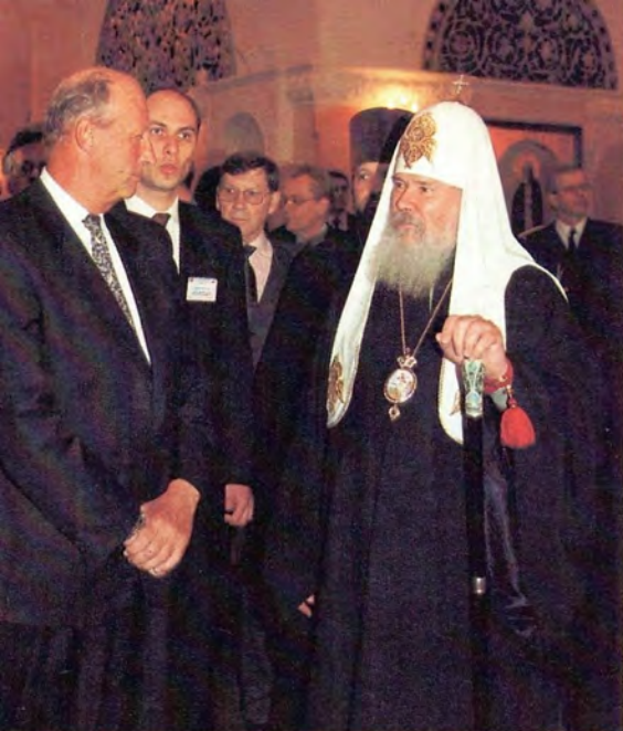
ВСТРЕЧА СЯТЕЙШЕГО ПАТРИАРХА АЛЕКСИЯ С КОРОЛЕМ НОРВЕГИИ 26 мая 1998 года

Предстоятель Русской Православной Церкви и король Норвегии Харальд V в нижней, Преображенской церкви Храма Христа Спасителя