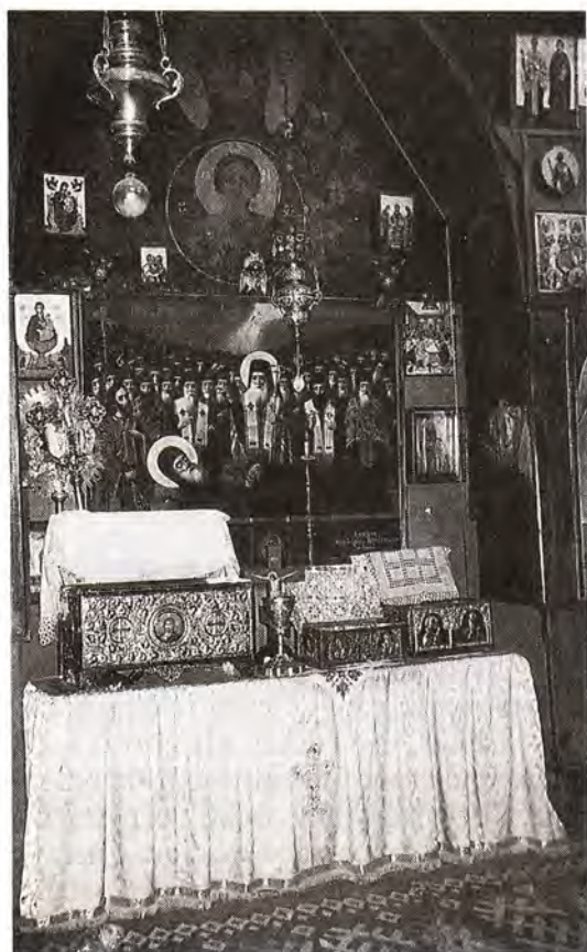
Монастырь преподобного Георгия Хозевита в Святой Земле; в одном из ковчегов справа находится частичка мощей святой великомученицы Марины

— А где покоятся мощи святой Марины? — спросил я.