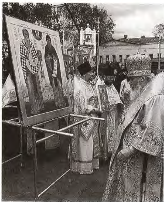
Святейший Патриарх Алексей у иконы славянских Первоучителей Кирилла и Мефодия на Славянской площади Москвы

Подмосковья. Более шестисот ребятшек посетили Троице-Сергиеву Лавру, Спасо-Бородинский и Новоиерусалимский, Саввино-Сторожевский и Новодевичий монастыри, побывали в обителях Коломны и Серпухова. Детская праздничная программа завершилась 1 июня торжественным обедом ее участников в Свято-Даниловом монастыре. В Государственной детской библиотеке Москвы открылась экспозиция книг «В начале было Слово...», посвященная истории развития славянской письменности и культуры.