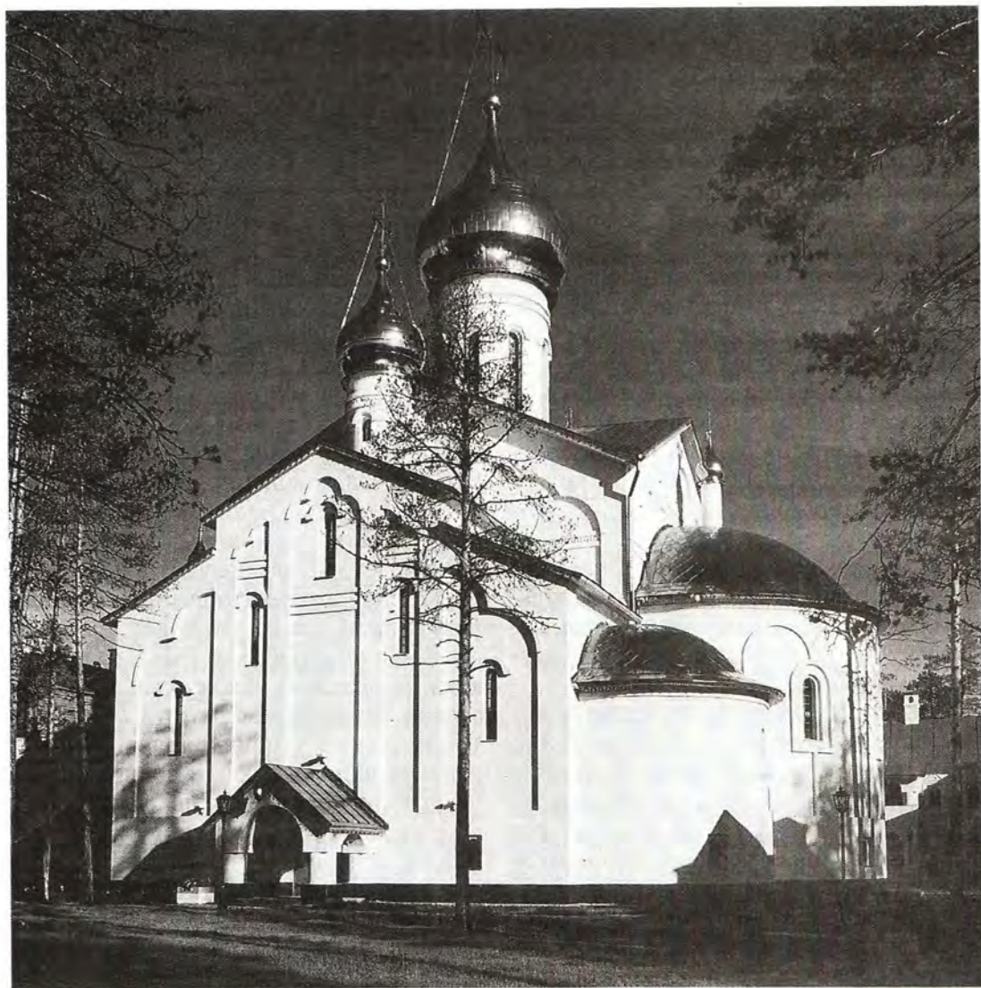
Храм во имя святых первоверховных апостолов Петра и Павла в Когалыме