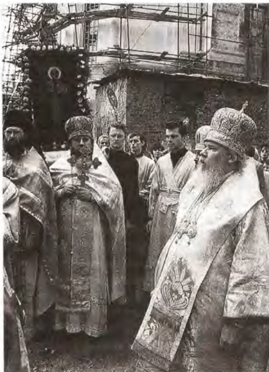
Во время крестного хода в Николо-Угрешском монастыре. На втором плане чтимая святыня обители – чудотворная икона Святителя Николая

От часовни крестный ход во главе с Предстоятелем Русской Православной Церкви направился к памятному знаку в честь святителя и чудотворца Николая, установленному неподалеку от монастырских стен. Памятный знак по проекту скульптора В. Клыкова создан на средства, собранные жителями Дзержинского, а также на пожертвования городских предприятий. Святейший Патриарх совершил освящение памятного знака. Он также обратился к духовенству, администрации и жителям города Дзержинского с архипастыр-