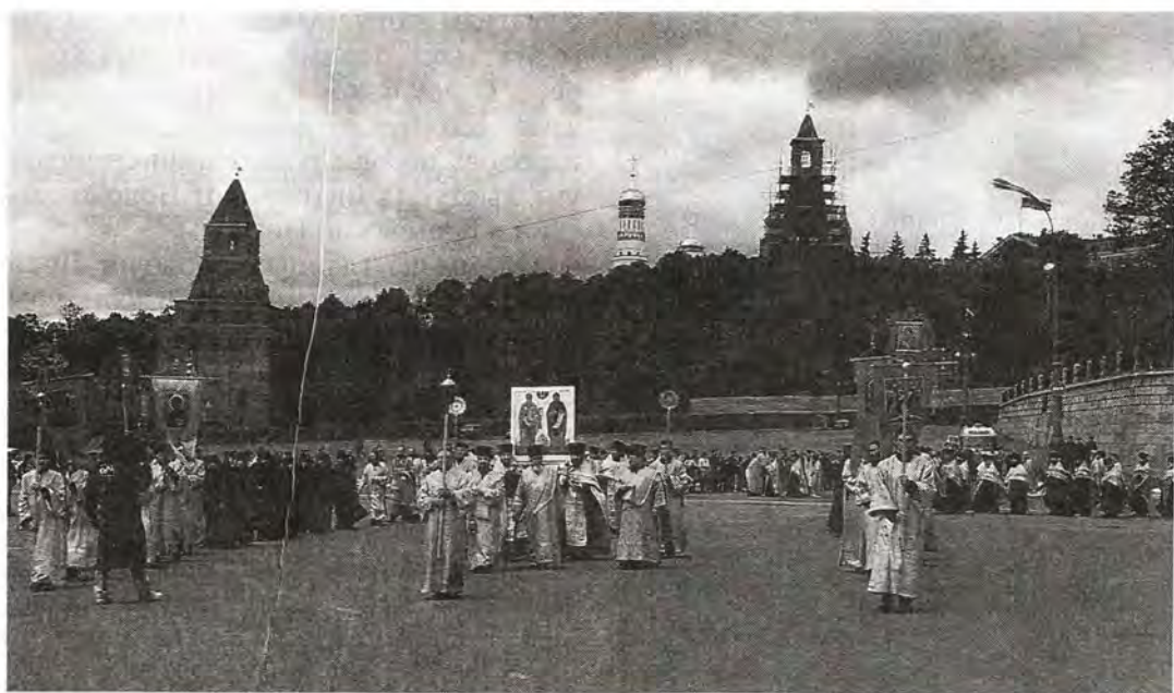
Начало крестного хода из Московского Кремля

вил президент Республики Белоруссия А. Лукашенко. Свое приветствие участникам празднования направил президент России Б. Ельцин.