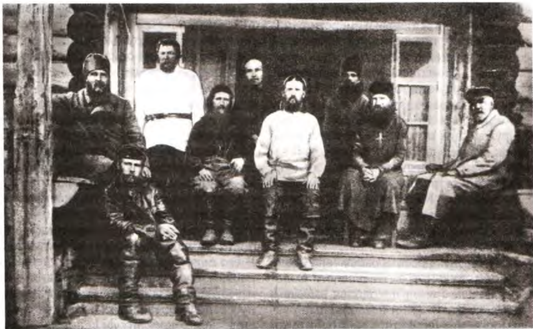
В Соловецком лагере особого назначения. 1924–1926 годы. Архиепископ Иларион (слева сидит на скамье) среди вольнонаемных рабочих, бывших монахов, оставшихся на Соловках (в центре), и заключенных — сотрудников сетевязальной мастерской

В январе 1924 года архиепископ прибыл на пересыльный пункт на Поповом острове. Здесь его застало известие о смерти Ленина. В то время, когда в Москве опускали в могилу гроб с телом