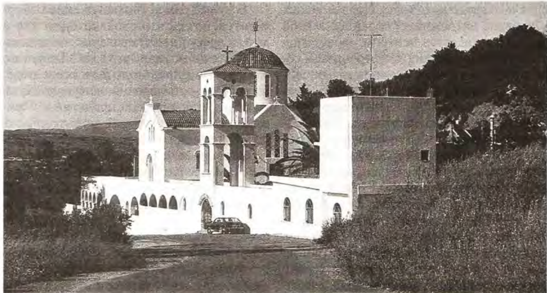
Монастырь святой великомученицы Марины в д. Вóни (остров Крит)

ремешками, то ныряет в долину, то опять поднимается на отлогую возвышенность. Довольно часто встречаются деревушки – небольшие, ослепительно белого цвета – как будто дети, играя, сложили их из аккуратных кубиков.