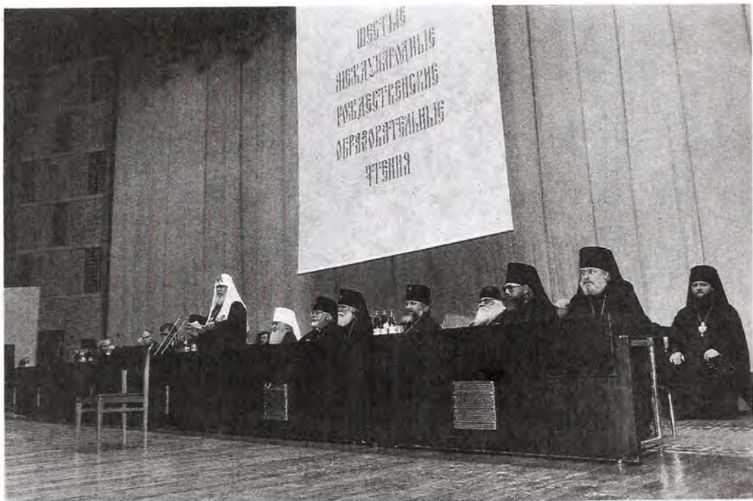
Открытие VI Международных рождественских образовательных чтений в Парламентском центре в Москве

Спасителя. За богослужением молились многие участники Чтений. Затем в большом конференц-зале Совета Федерации состоялось торжественное открытие VI Рождественских чтений. С приветственным Словом к участникам обратился Святейший Патриарх Московский и всея Руси Алексий.