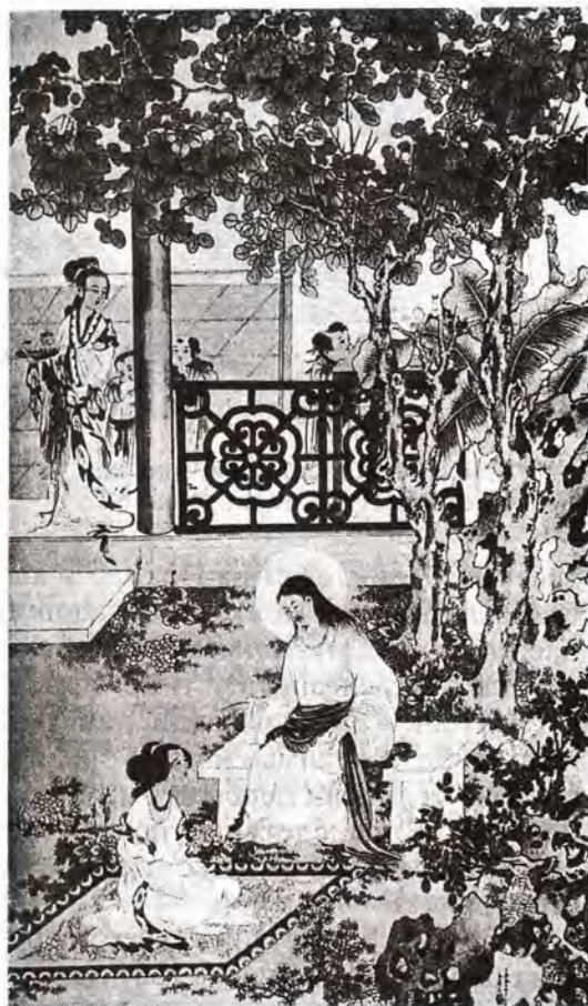
Марфа и Мария. Художник Ван Суда (Георгий Ван)

Если отец Исаия с течением времени все более и более упрощал язык