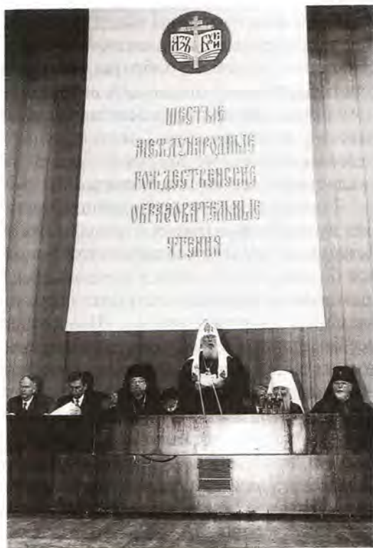
Выступление Святейшего Патриарха на открытии VI Рождественских чтений

Всем православным учебным заведениям приходится очень нелегко, нет у них ни достаточных помещений, пригодных для занятий, ни средств для обеспечения учебного процесса и возможностей развития, ни государственной поддержки. Мы все еще находимся в условиях глубокого общественного кризиса, и не только экономического. Продолжает оставаться значительной проблемой духовная дезориентация, охватившая широкие слои нашего общества. Многие люди утрати-