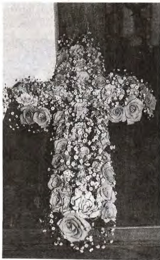
Аналойный крест. Серафимо-Дивеевский монастырь

Живые цветы, естественно, требуют присмотра и ухода. Чтобы они не увядали подольше, их сразу же после срезки держат в воде. Перед расстановкой в храме стебли растений укорачивают: новый срез также способствует лучшей сохранности этого нежного материала. Обрезают стебли в воде, дабы не подсыхали пучки проводящих волокон. Ведерки, поставцы, плоски – вот в чем надлежит держать цветы в храме. Емкости с водой декорируют шелковыми лентами, бумагой, ветками туи, вайями папоротника. Чтобы убрать цветами крупную по размерам икону, по ее периметру устраивают дощатую раму, на которую и крепятся сосуды с водой. За цветами и декором они не видны.