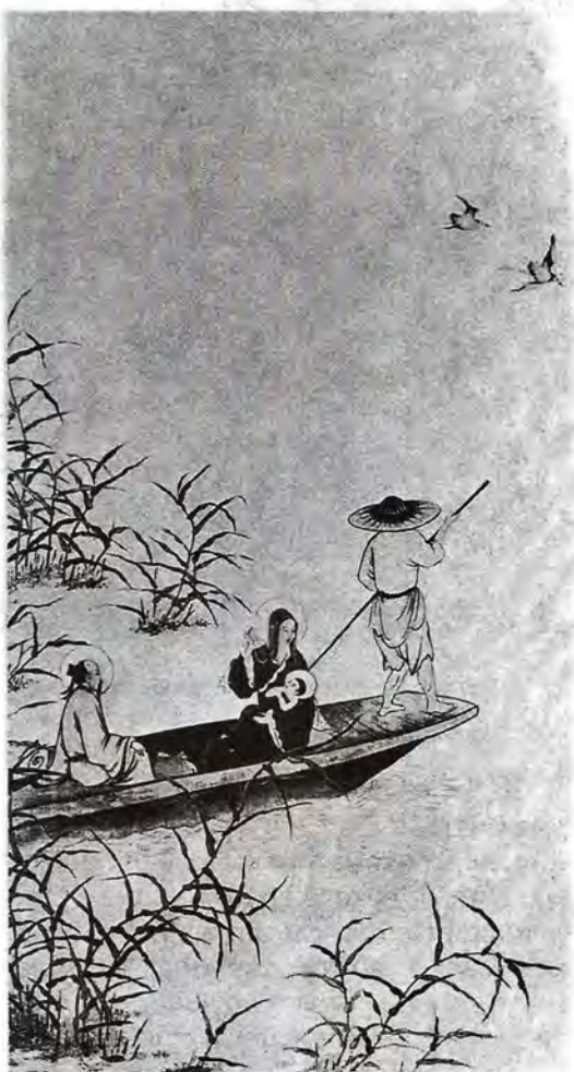
Бегство в Египет. Художник Лу Хуннянь (Иоанн Лу)

С этого списка другой художник напишет полууставом, как должно быть напечатано в книге. Новая поверка: нет ли пропусков, все ли крючки и точки на месте, верно ли сделаны переносы. Резчик берет этот лист, накладывает на доску и по писанному вырезывает. Но и в этой работе не без ошибок. Лист накладывается на доску так, что все буквы приходятся наоборот. Поэтому резчик с самостоятельным взглядом на вещи, которому никакой оригинал не указ, иногда такую поставит букву, которой ни по каким законам быть не следует. Новые хлопоты; и так ежедневно» 4 .