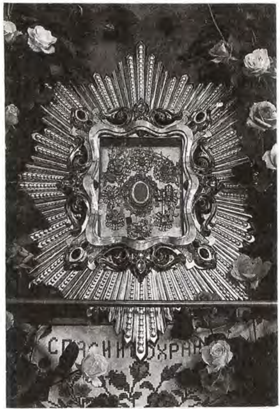
Жиговицкая икона Божией Матери. Жиговицкий мужской монастырь

В многоцветный букет включают так называемый центр интереса – изящное, оригинальное по величине и форме цве-