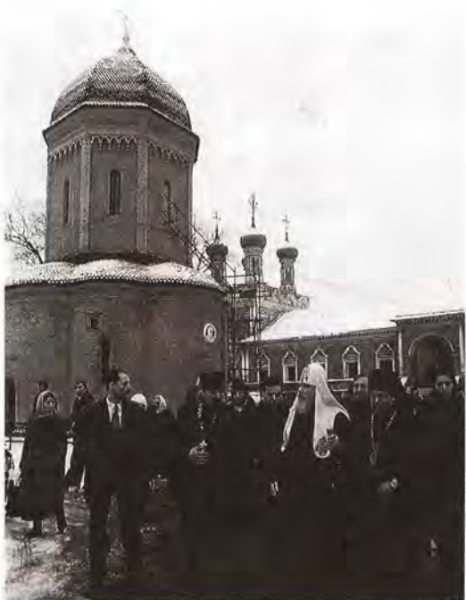
Святейший Патриарх Алексей в Высокопетровском монастыре

Его Святейшеству сослужил архиепископ Истринский Арсений.