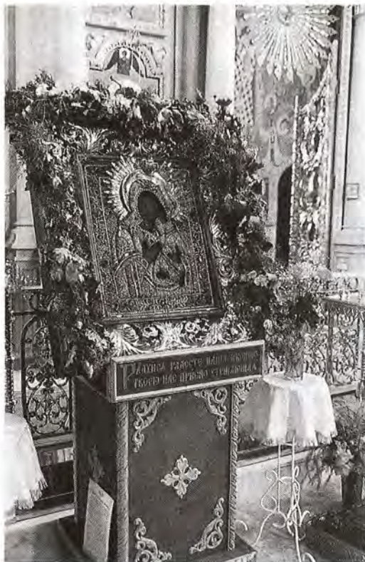
Чудотворная Толгская икона Пресвятой Богородицы. Свято-Введенский Толгский женский монастырь, день празднования в честь Толгской иконы, 8/21 августа 1997 года. Кроме этого единственного дня в году, икона по-прежнему находится в Ярославском художественном музее

пышными садовыми. В отдельных букетах они привлекательнее. Фиалки, дубравные ветреницы, ландыши, а летом васильки, бессмертники (иммортели), поставленные в маленьких сосудах, привлекут внимание своим трогательным, застенчивым обликом.