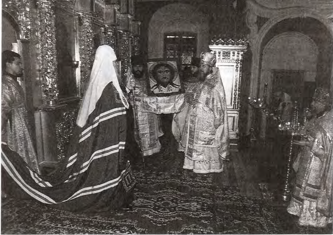
Дар Святейшего Патриарха Богоявленскому собору – икона Спаса Нерукотворенного Образа

утреню в Богоявленском кафедральном соборе Москвы, а в самый день праздника – Божественную литургию и чин великого освящения воды. По окончании богослужения Святейший Владыка обратился к молящимся со Словом.