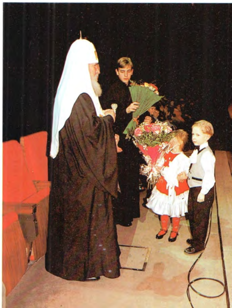
На Рождественской елке в Большом театре. 11 января 1998 года