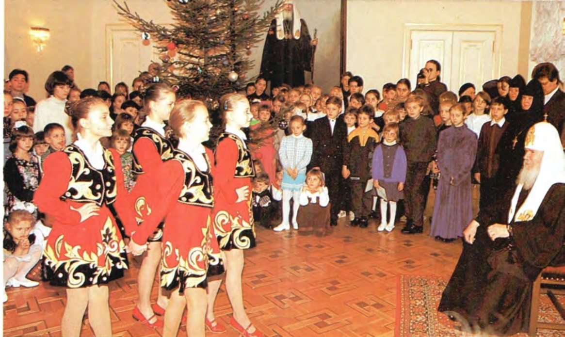
Рождественская елка в Патриаршей резиденции в Свято-Даниловом монастыре.