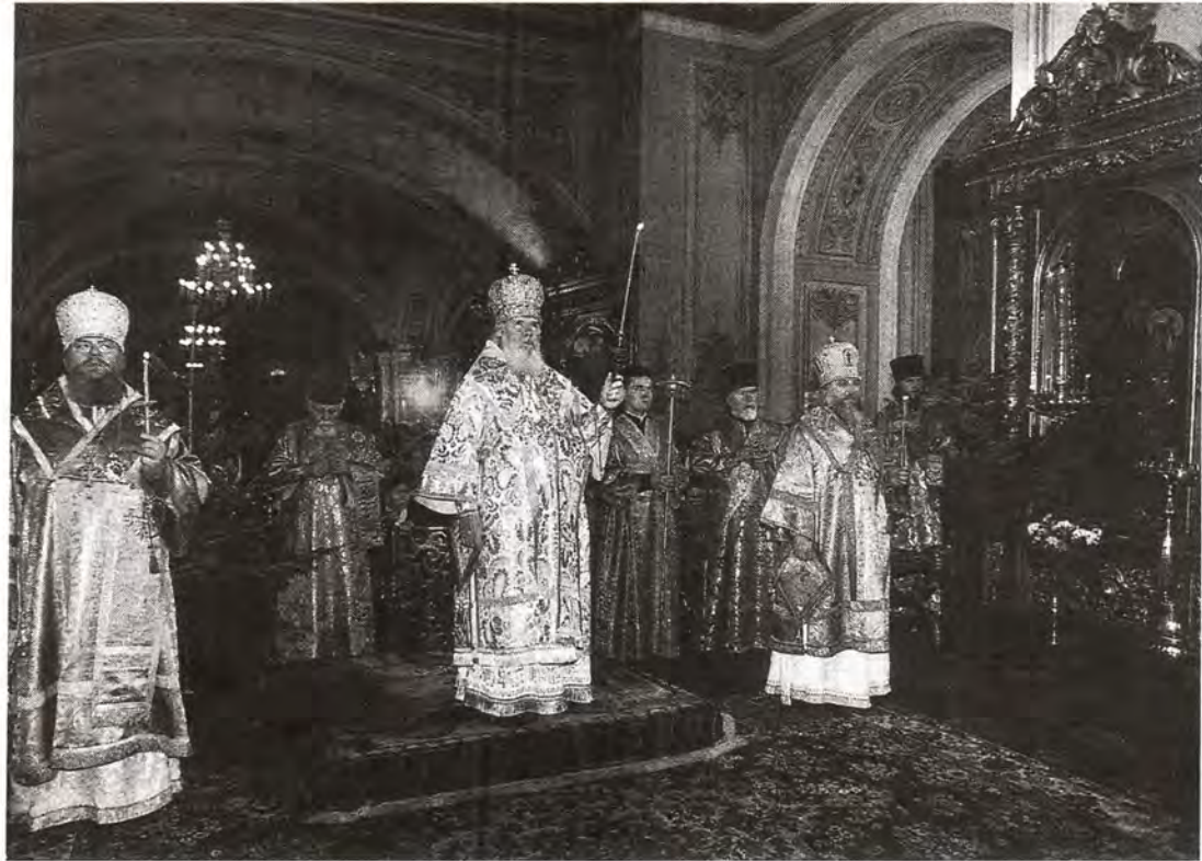
Великое повечерие в канун Рождества Христова. Богоявленский кафедральный собор, 6 января 1998 года

Во второй половине дня 7 января Предстоятель Русской Православной Церкви совершил Рождественскую вечерню в Храме Христа Спасителя.