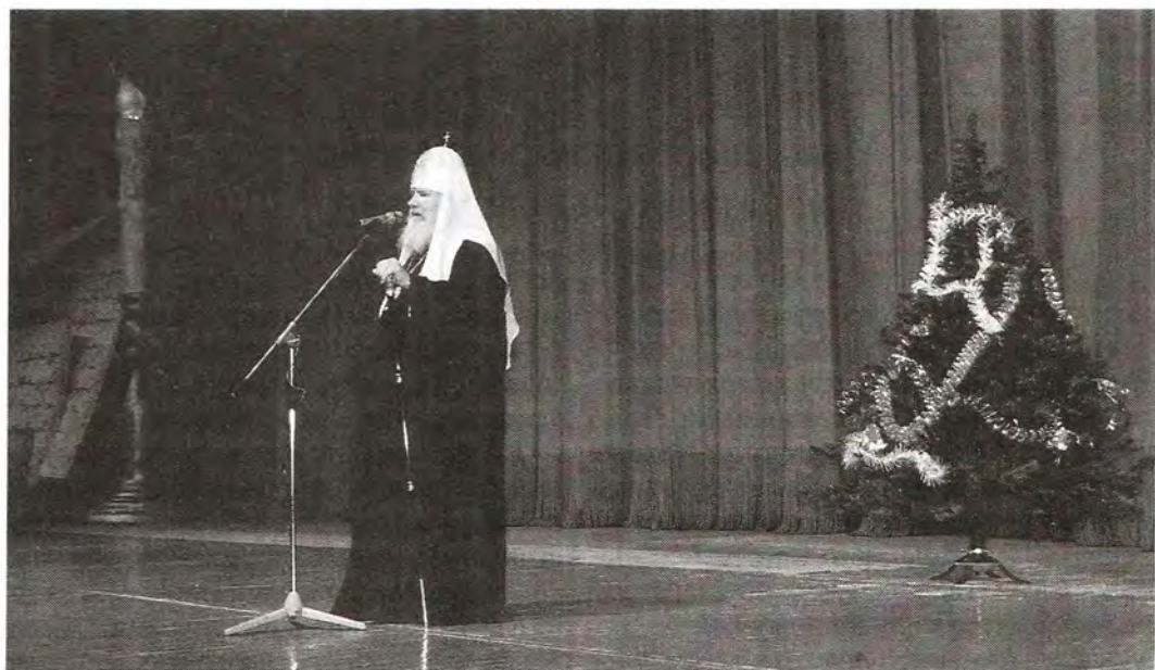
Святейший Патриарх Алексий приветствует детей на Рождественской елке в Кремле. 9 января 1998 года