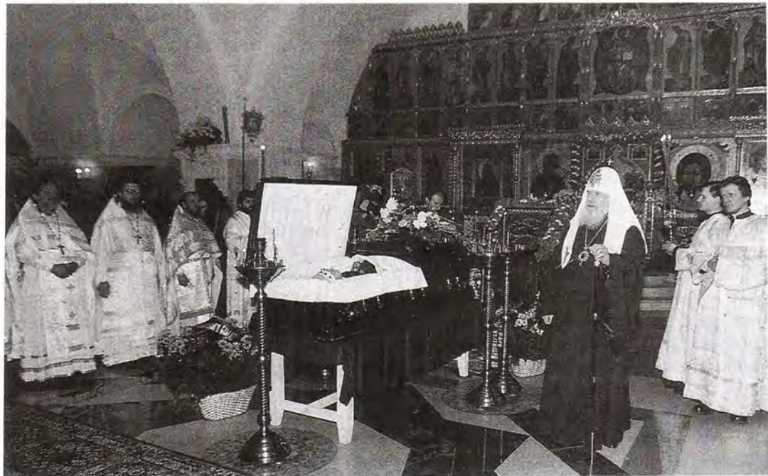
Отпевание Георгия Свиридова в Храме Христа Спасителя

Святейшество, – потому что Свиридов был действительно сыном России. Я выражаю соболезнование москвичам, потому что он был почетным гражданином нашего города. Мы совершаем его погребение и провожаем в путь “вся земля” в рождественские дни, когда Церковь прославляет родившегося в Вифлееме Спасителя мира, и мы вознесем нашу молитву о том, чтобы Господь упокоил его душу там, где нет