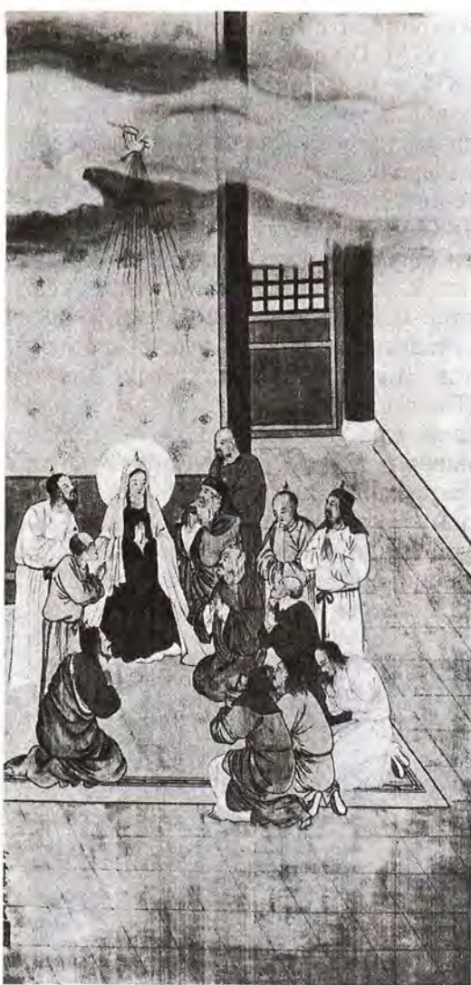
Сошествие Святого Духа на апостолов. Художник Сюй Цзихуа (Галл Сюй)

ний всех двенадцатых праздников, Страстной и Светлой седмиц, Литургий святителя Иоанна Златоуста, святителя Василия Великого и Преждеосвященных Даров, а также Часослова.