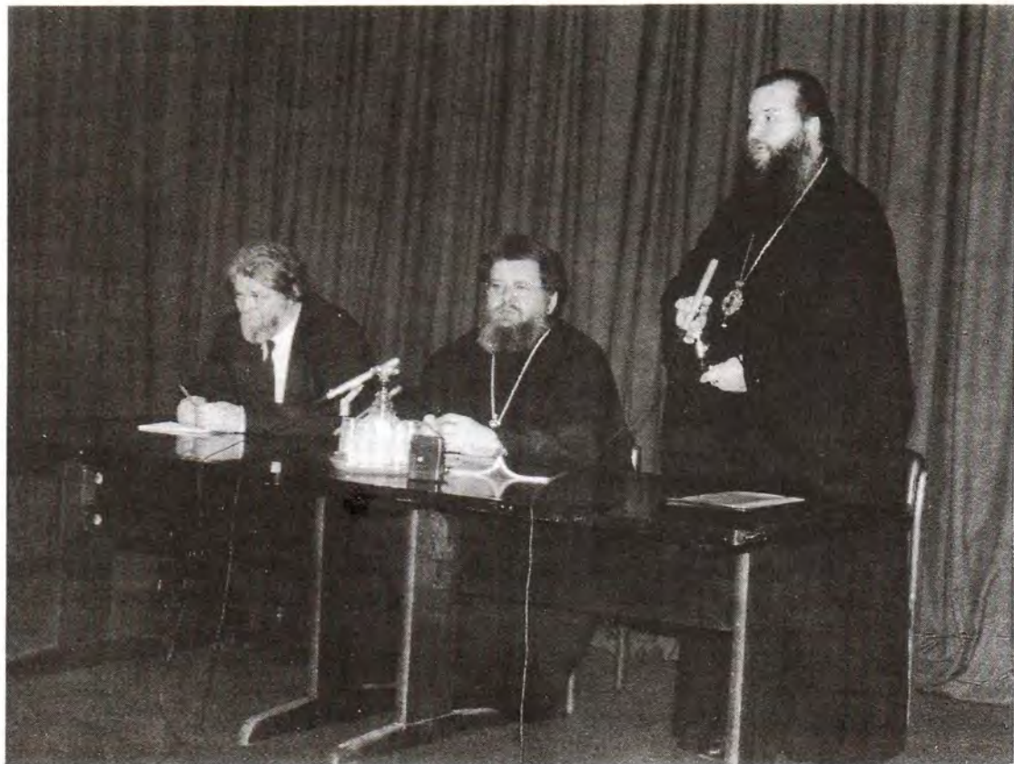
Выступление епископа Бронницкого Тихона на заседании секции VI Рождественских чтений в Издательстве Московской Патриархии 29 января 1998 года

московских, но и региональных средств массовой информации.