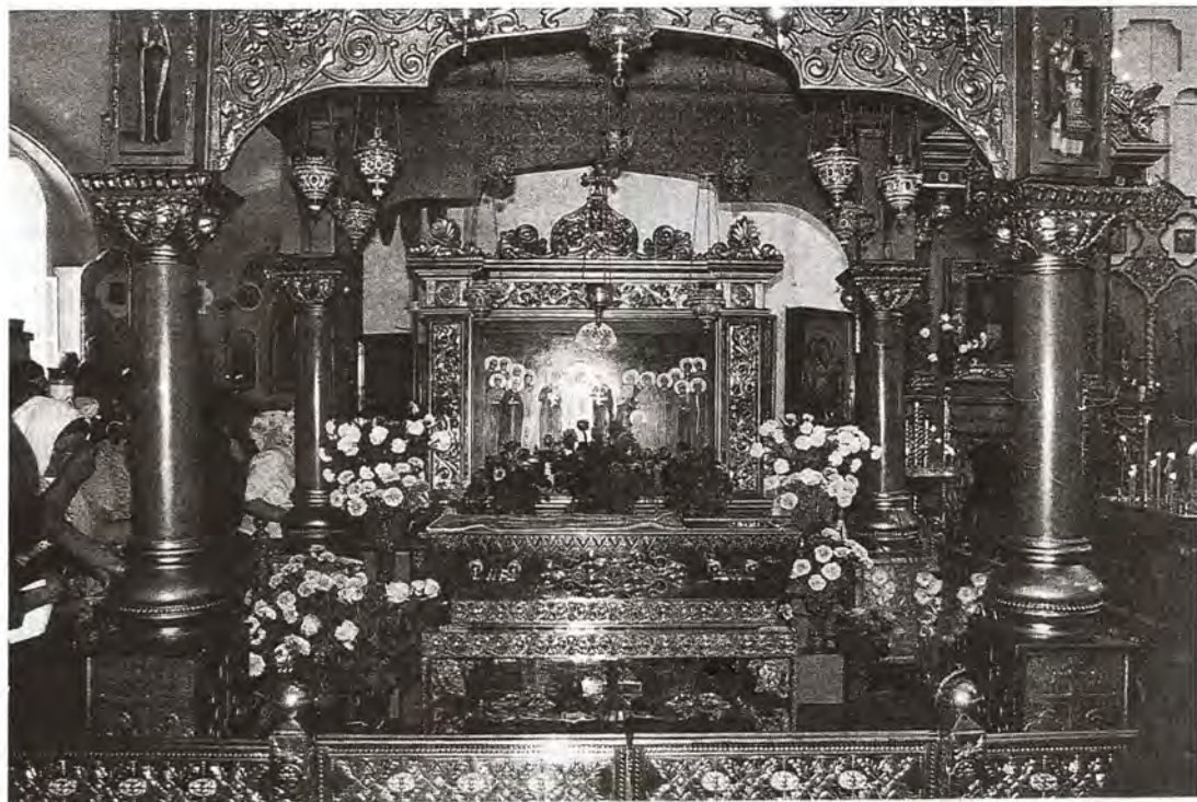
Рака преподобного Серафима Саровского. Троицкий собор Серафимо-Дивеевского монастыря

Разумеется, подбор растений во многом связан с тем или иным сезоном, с своеобразием местности и возможностями. И все же определилась и выдерживается в аранжировке своя традиция. Так, после Крестопоклонной недели, начинающей четвертую седмицу Великого поста, в растительные композиции вводится красный цвет — знак приближающихся Страстей Христовых. На Преображение господствует белый цвет. Богородичным иконам полагаются в украшение цветы светлых колеров, но подойдут и голубые, и синие. Ленту вплетают голубую, под стать чистоте Небесной. К дням Архангела Гавриила — а их отмечают в году два раза, 26 марта и 13 июля, — его икону наряжают лилиями, в старину их называли кринами. Благоуханные крины напоминают нам о Приснодеве Марии, Кото-