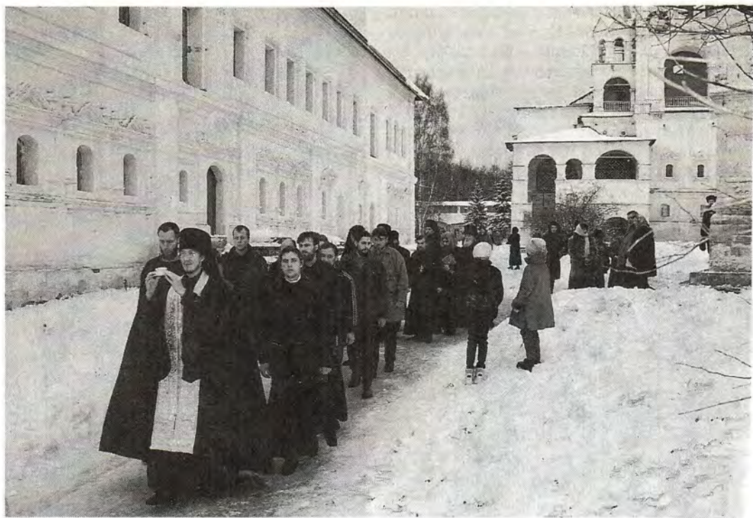
Чин о Панагии