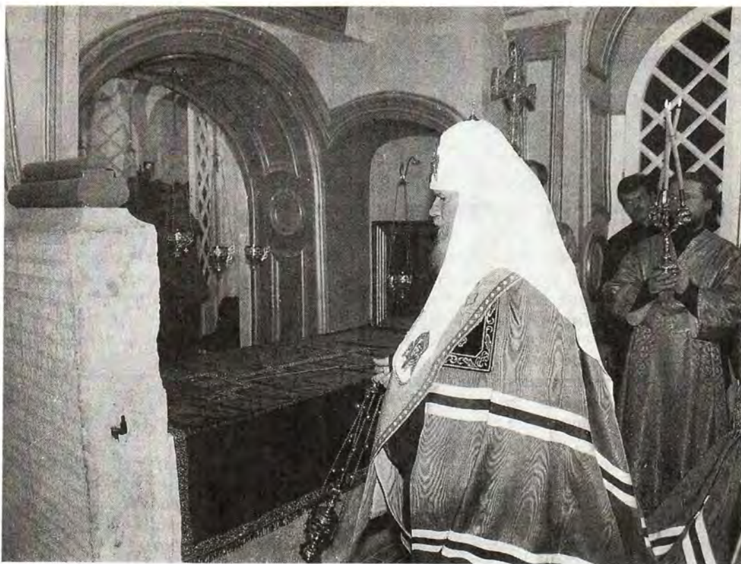
Заупокойная лития у гробницы Святейшего Патриарха Никона

Святейший Патриарх Никон, основывая этот монастырь, ставил задачу здесь, на Русской земле, создать места, связанные с земным подвигом и Искупительной Жертвой Господа и