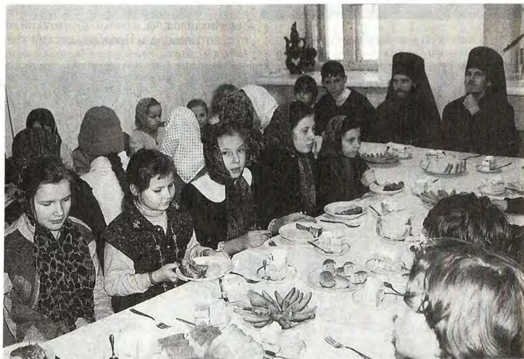
Иконостас собора Рождества Пресвятой Богородицы Звенигородские дети в гостях у насельников обители