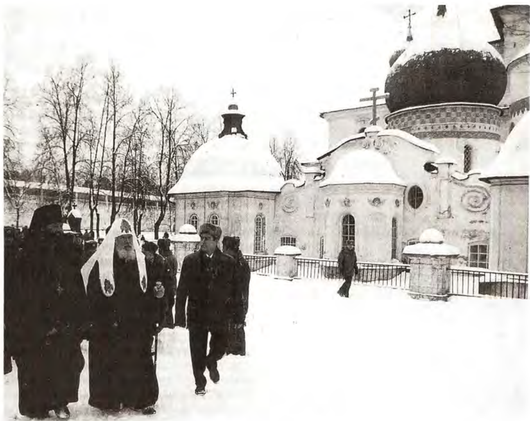
Прогулка по монастырю

Спасителя нашего Иисуса Христа. Храм Воскресения Христова Новоиерусалимского монастыря был подобием храма Гроба Господня в Иерусалиме, посреди него была кувуклия – изображение Живоносного Гроба Спасителя.