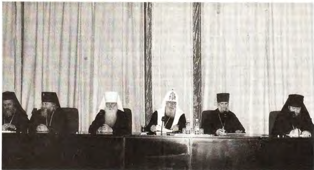
Президиум Епархиального собрания города Москвы

Теперь же я хочу более подробно остановиться на основных моментах, вехах годовой церковной жизни нашего города.