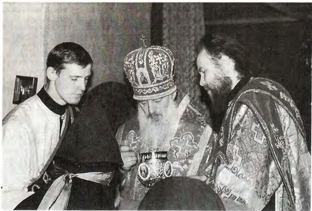
Святое Причастие в восстановленном храме

У восстанавливаемой святыни оказалось немало доброхотов, людей право-