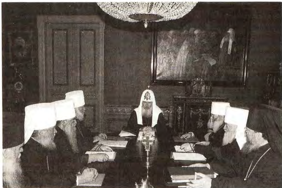
Заседание Священного Синода Русской Православной Церкви 25 декабря 1997 года

шних церковных сношений, о Свято-Троицком приходе Русской Православной Церкви в Улан-Баторе (Монголия).