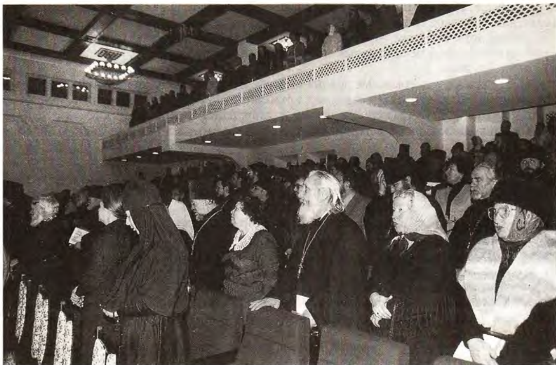
В зале заседаний

градской областной Думе, в Доме культуры завода «ЗиЛ», за «круглым столом», проведенным Московской Духовной академией и Московским государственным институтом международных отношений.