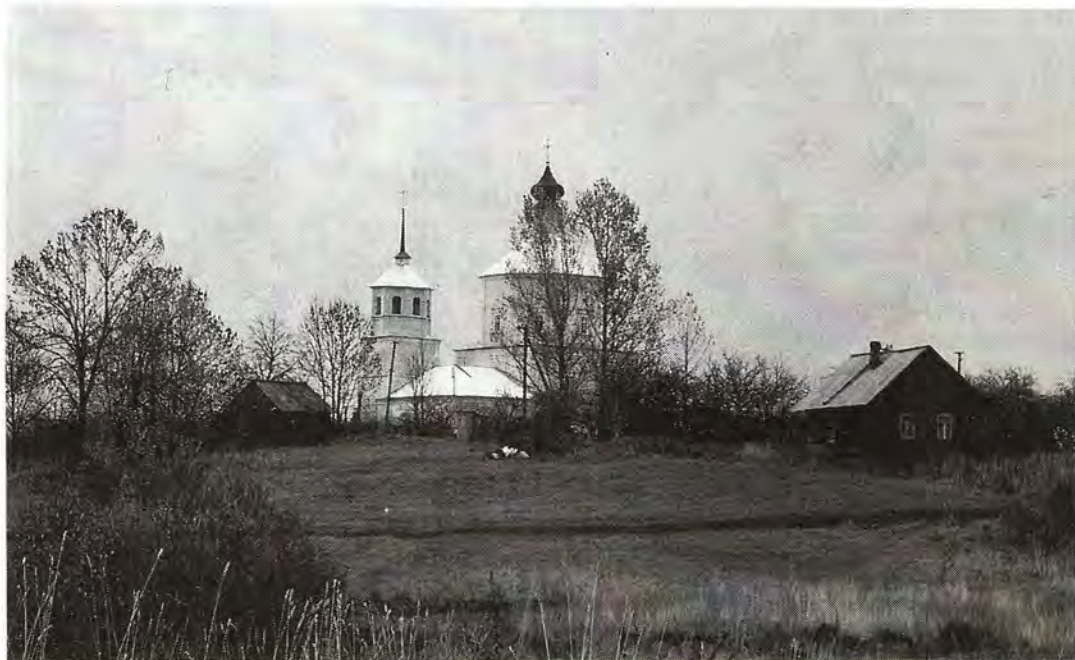
Храм Воскресения Христова

Еще несколько лет назад запустелым выглядел Свято-Воскресенский храм погоста Клин, построенный в 1733 году на юге древней Псковской земли, неподалеку от Великих Лук. Лошади топтали святые камни его алтаря, находя под старинными сводами приют и защиту от жаркого полуденного солнца. Стояла почти пер-