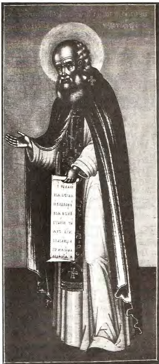
Преподобный Савва Сторожевский

Основателем этого монастыря был преподобный Савва, один из первых учеников Сергия Радонежского. Время рождения и обстоятельства жизни до пострижения его в Сергиевой обители неизвестны. Сохранились только известия, что еще в юности, с первых же дней пребывания в обители, он сразу обратил на себя внимание тем, что проводил жизнь в совершенном послушании, привыкая к порядку иноческого жития, любил воздержание и бдение, крайне заботился о соблюдении чистоты, прежде всех входил в храм Божий и последним оставлял его. Умиление этого подвижника было таково, что во время Божественной службы он не мог удерживаться от сильного плача и рыданий. Когда преемник Преподобного Сергия по управлению его обителью Никон ушел в уединение, братия избрала своим начальником Савву. Известный своей строго подвижнической жизнью настоятель такой видной обители не мог остаться незамеченным и влиятельными людьми того времени. На преподобного обратил свое внимание звенигородский князь Юрий Дмитриевич, который часто посещал Сергиеву Лавру и полюбил Савву за его строгое иноческое житие. Он-то и умолил преподобного основать в его отечестве – Звенигороде – обитель, на месте вблизи города, называвшемся Сторожки. Преподобный не мог устоять пред неотступными просьбами