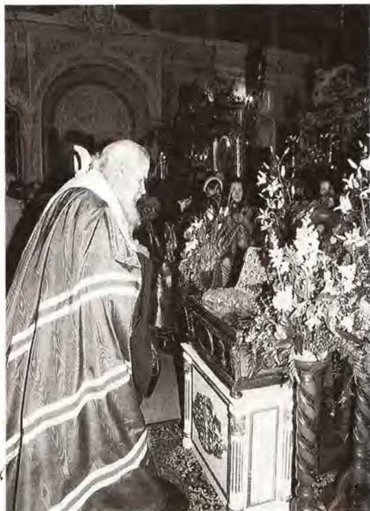
Святейший Патриарх Алексий у мошей великомученицы Варвары в храме Иоанна Воина на Якиманке

Всенощное бдение накануне вечером и Божественную литургию Святейший Патриарх Алексий совершил в Богоявленском кафедральном соборе в Москве. За Божественной литургией Святейший Вла-