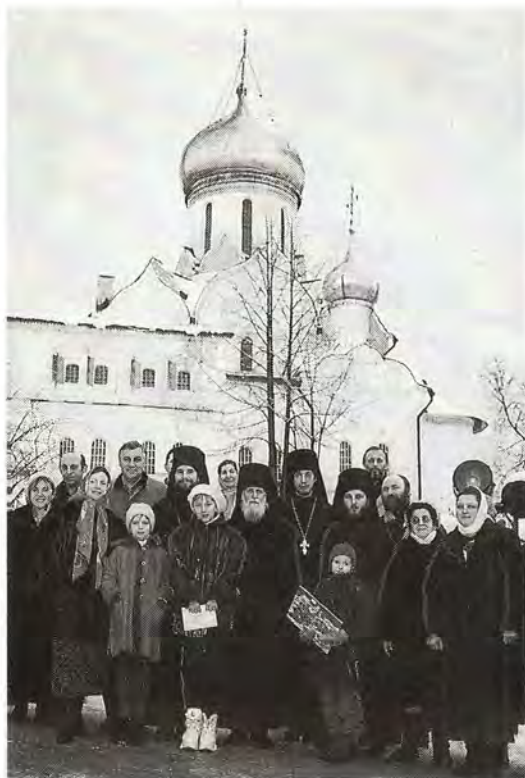
Гости в монастыре

придела преподобного Саввы сохранился верхний ряд икон. В главном алтаре только фрески сохранились и тябла. Иконы из него вынуты, но находятся в монастыре — в экспозиции музея в Троицком соборе. Когда мы в первый раз пришли в храм Рождества Богородицы, там была температура +2°C. Мы сделали обогреватель, и теперь в храме уже +17°C. У нас было совещание с работниками музея о том, как сохранить иконы. Реставрация их ляжет на наши плечи. Пока мы закрыли полотном современную кирпичную кладку в иконостасе, украсили его елочками, сделали царские врата. Кстати, Троицкий собор в Троице-Сергиевой Лавре построен по подобию здешнего Рождественского собора. Так же, как рака с мощами Преподобного Сергия, стояла в нашем Рождественском соборе рака с мощами преподобного Саввы.