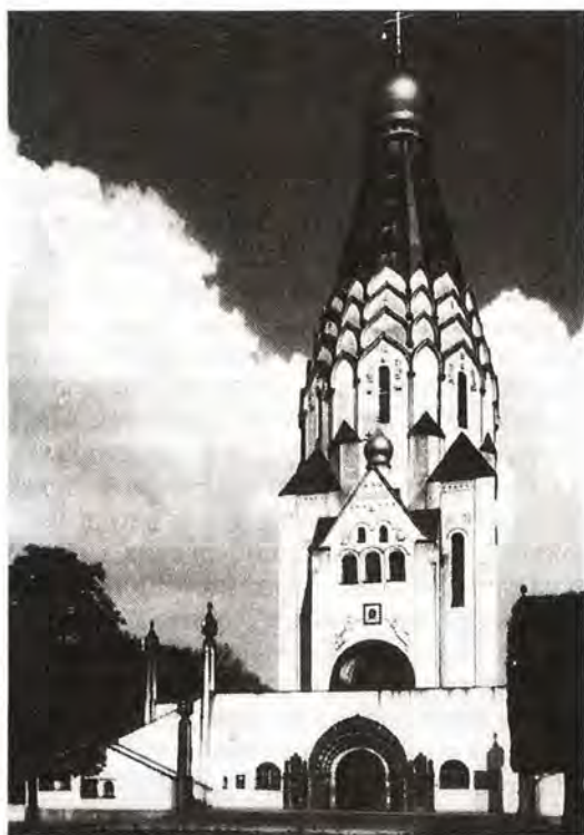
Свято-Алексиевский собор в Лейпциге

Храм был освящен 17–18 октября 1913 года в воспоминание славного подвига 127 тысяч русских солдат и союзных войск, а также на вечную память более