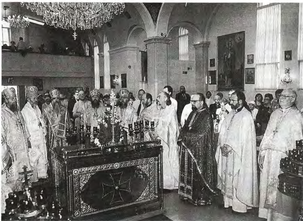
Божественная литургия в Свято-Варваринском кафедральном соборе 28 июля, в день памяти святого равноапостольного великого князя Владимира. Слева направо – епископ Оттавский и Канадский Серафим (Православная Церковь в Америке), митрополит Торонтский Афанасий, Экзарх Канады (Константинопольский Патриархат), митрополит Минский и Слуцкий Филарет, архиепископ Днепропетровский и Павлоградский Ириней, епископ Каширский Марк

После доклада митрополит Минский и Слуцкий Филарет вручил награды Русской Православной Церкви многим прихожанам и священнослужителям Патриарших приходов.