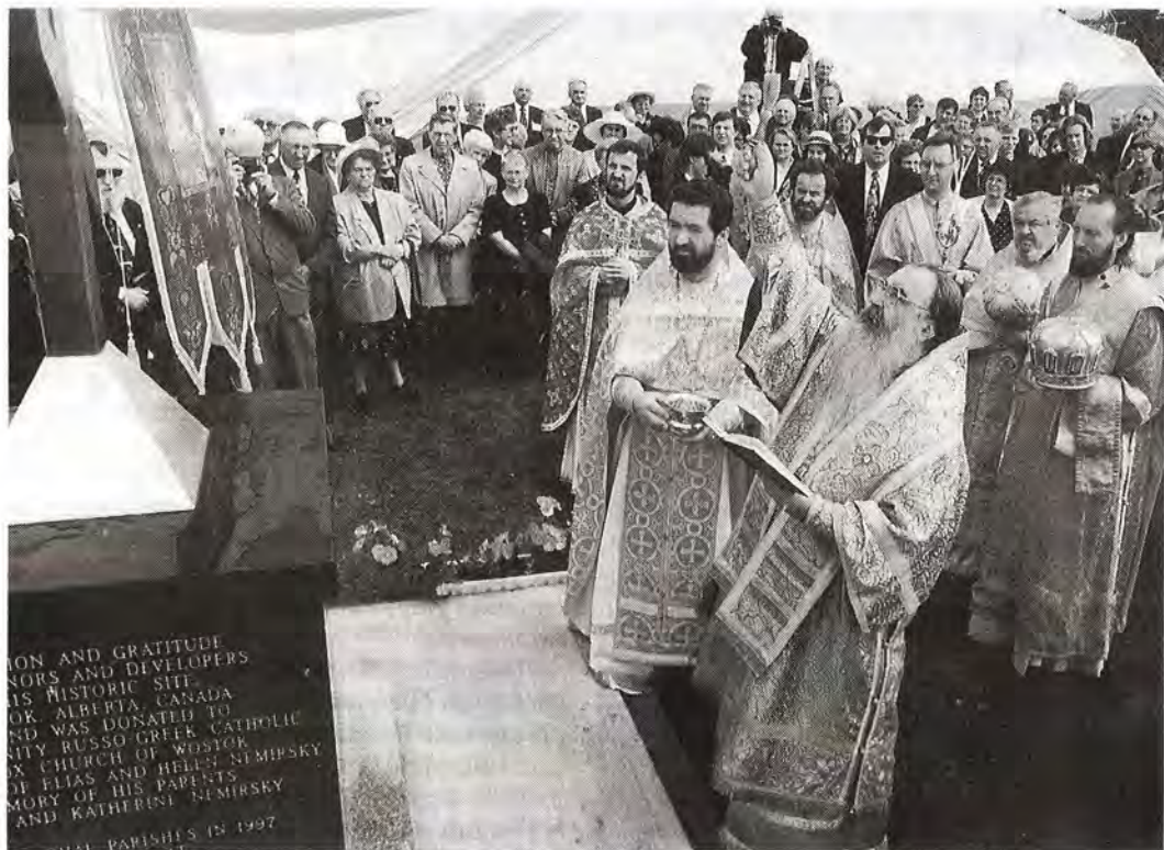
Освящение памятника, сооруженного в честь 100-летия первой православной Литургии и в память всех потрудившихся для распространения и утверждения православной веры в Канаде