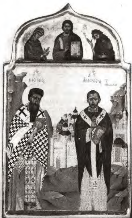
Святители Василий Великий и Амвросий Медиоланский

После этого была представлена специально написанная к юбилею икона святителей Василия Великого и Амвросия Медиоланского. Образ святителя Амвросия на ней может показаться непривычным: он изображен с небольшой бородкой, тогда как на наших прорисках его представляют длиннородым. Между тем иконописец строго следовал древнейшему (V–VI века) изображению святителя на мозаике в приделе святого Виктора Миланской базилики.