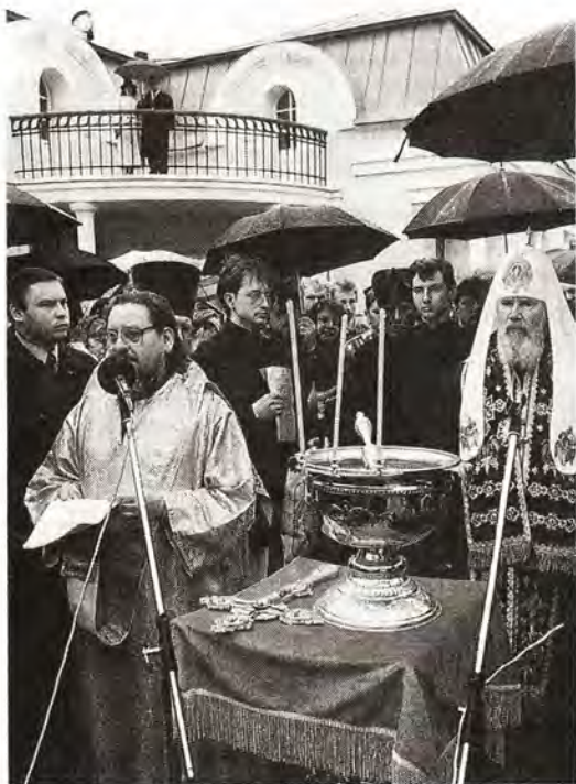
Открытие Сибирского подворья в Москве

Его Святейшеству сослужили архиепископ Истринский Арсений и епископ Красногорский Савва.