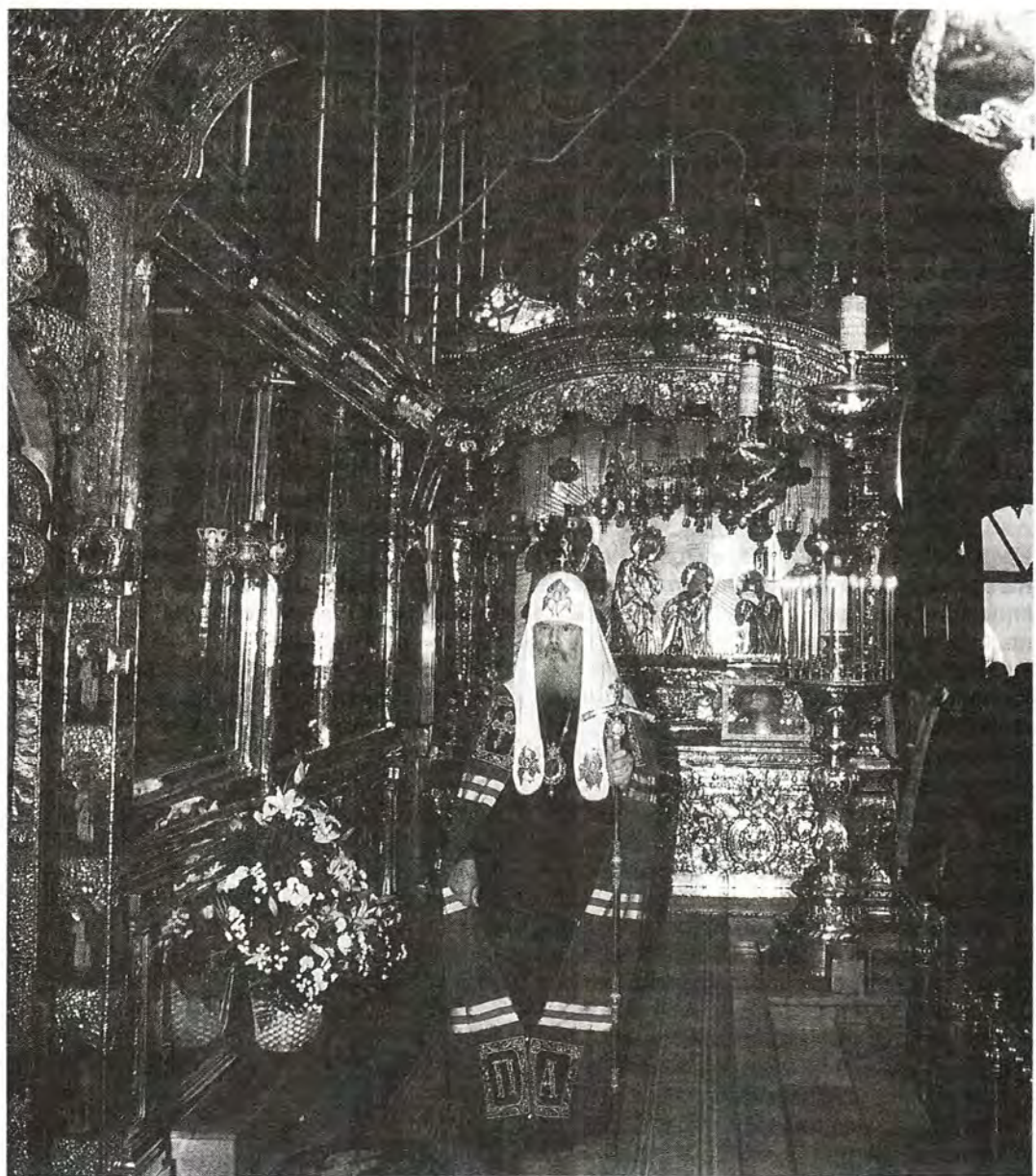
Святейший Патриарх Алексий у мощей Преподобного Сергия Радонежского в Троицком соборе Троице-Сергиевой Лавры