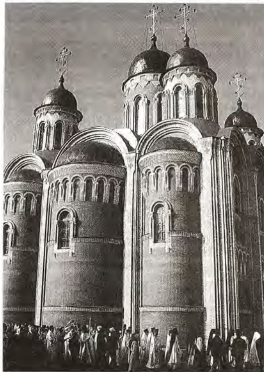
Освящение собора в честь Всех святых, в земле Российской просиявших, в Домодедове

В день освящения храма вместе с жителями Домодедова торжествовала вся земля Московская. Со всех концов области собрались на праздник многочислен-