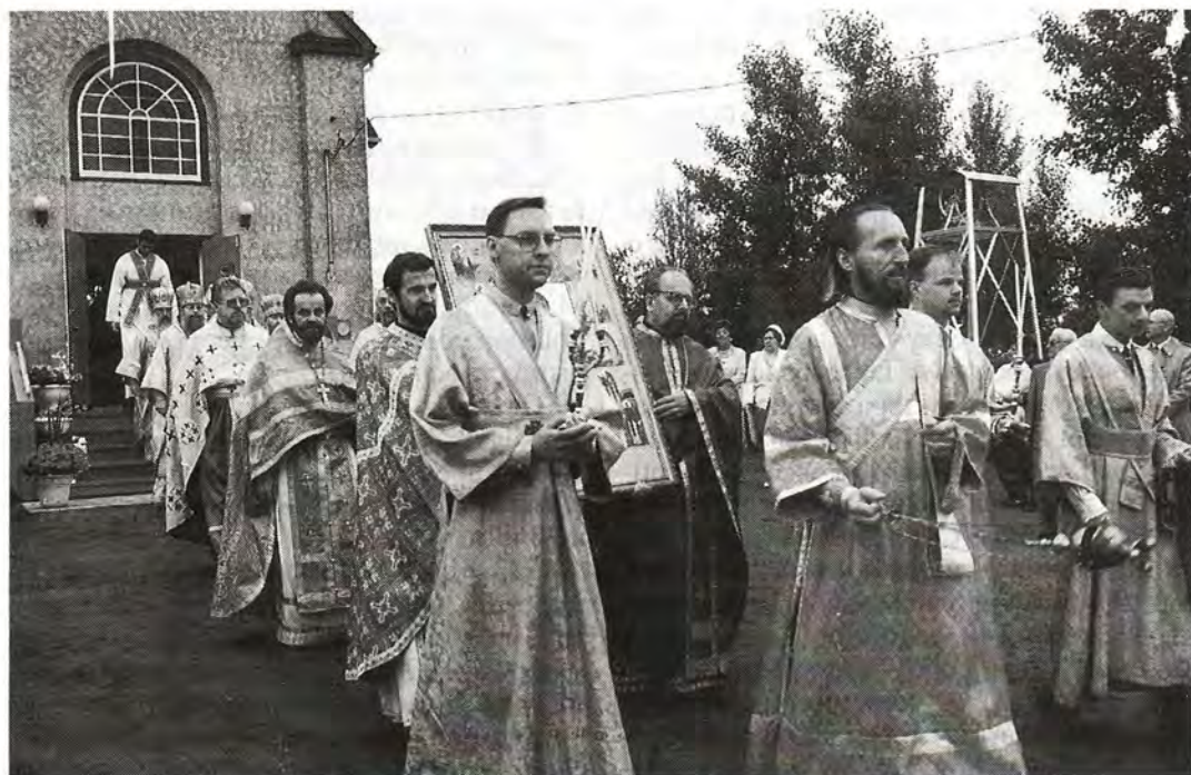
Крестный ход из храма Святой Троицы к месту совершения первой православной Божественной литургии в Канаде