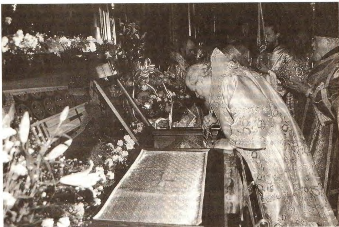
Святейший Патриарх Алексий у мощей святителя Московского Иннокентия