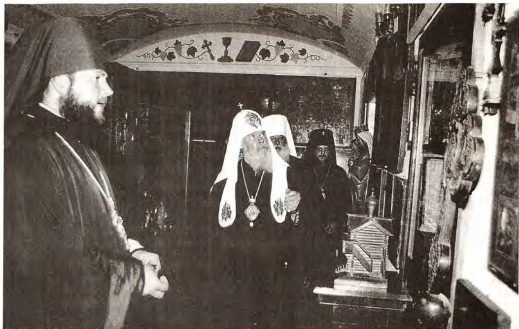
Святейший Патриарх Алексий в музее Одесской Духовной семинарии

ский и Измаильский Агафангел. Одесская Духовная школа имеет долгую и славную историю – в 1998 году ей исполняется 160 лет. Первым ректором Семинарии был архимандрит Порфирий (Успенский), впоследствии известный ученый-востоковед, археолог, историк, создавший и возглавивший Русскую Духовную Миссию в Иерусалиме. Архимандрит Порфирий являлся одновременно настоятелем Одесского Свято-Успенского мужского монастыря, поэтому с момента создания Семинарии между ней и Успенской обителью сохраняется тесная духовная связь.