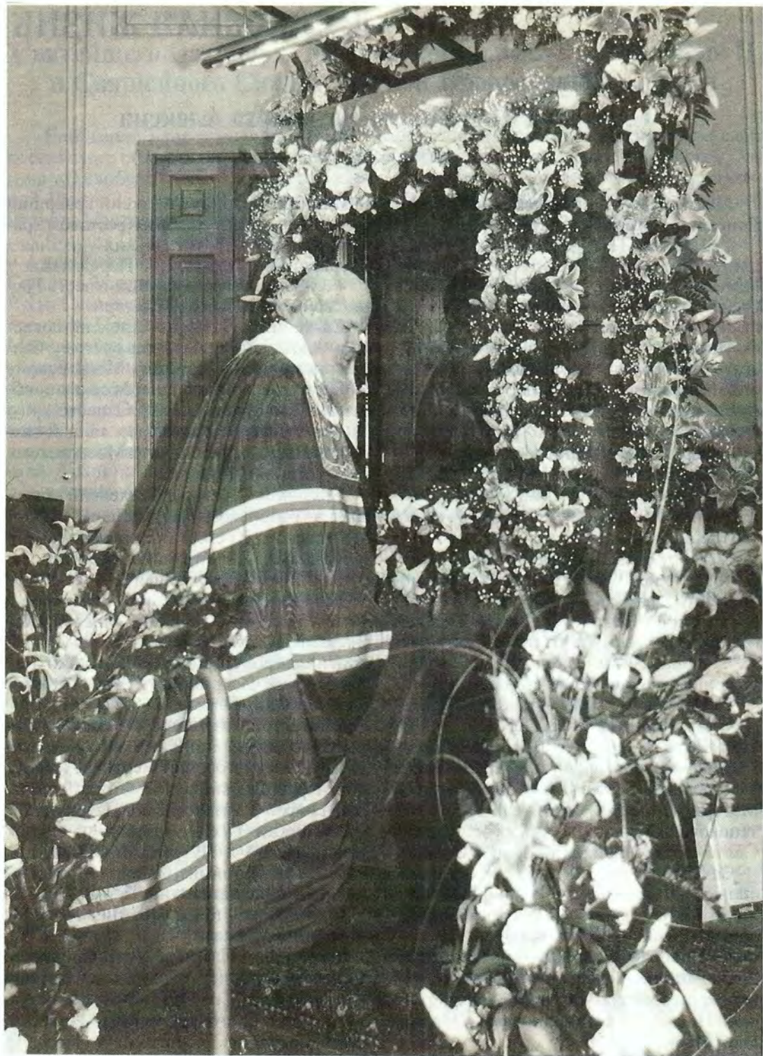
Святейший Патриарх Алексей у чудотворной Владимирской иконы Божией Матери в храме Святителя Николая в Толмачах. 8 сентября 1997 года