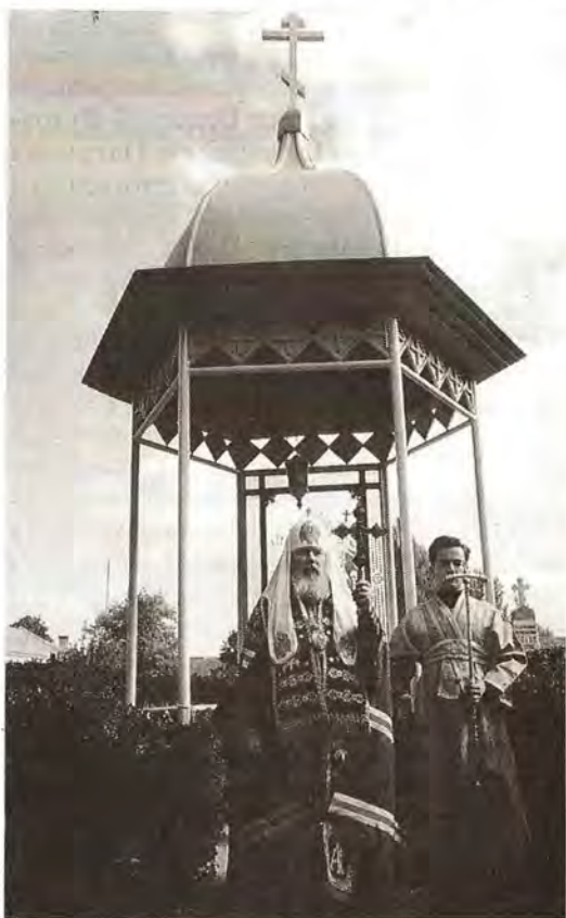
Лития на братском кладбище Успенского монастыря

В целом встреча двух Святейших Патриархов имела конструктивный характер и придала новый импульс межправославным взаимоотношениям. По окончании встречи ее участники вместе с сопровождавшими их лицами прибыли на борт теплохода «Элевфериус Венизелос». Здесь