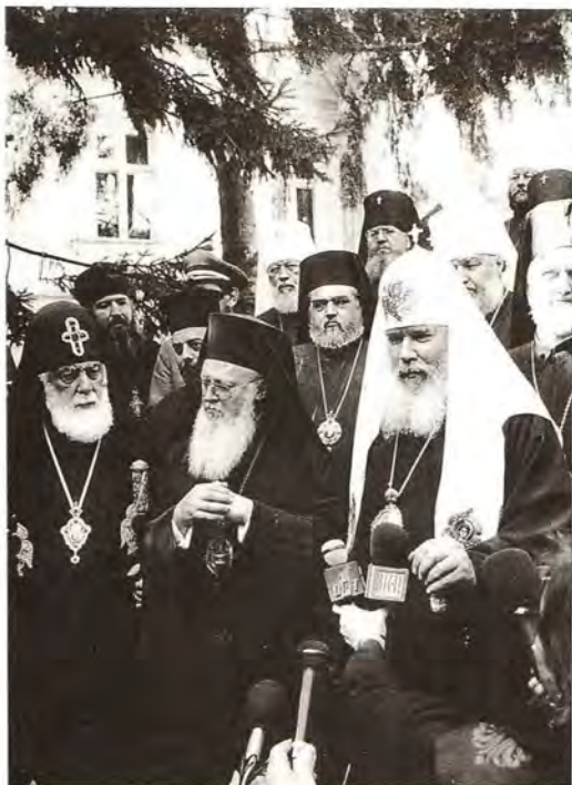
После встречи в Патриаршей резиденции: ответы на вопросы журналистов

На встрече был также поднят вопрос об отношении к современному экуменическому движению. В настоящее время в связи с выходом Грузинской Православной Церкви из Всемирного Совета Церквей возникла необходимость всеправославного обсуждения этой проблемы. К такому шагу призвала Сербская Православная Церковь, к ней присоединилась и Русская Православная Церковь. В ходе встречи оба Патриарха выразили уверенность в том, что такое обсуждение необходимо осуществить до Генеральной Ассамблеи ВСЦ в Хараре, которая состоится в декабре 1998 года. Принятое решение должно стать общим для всех Православных Церквей.