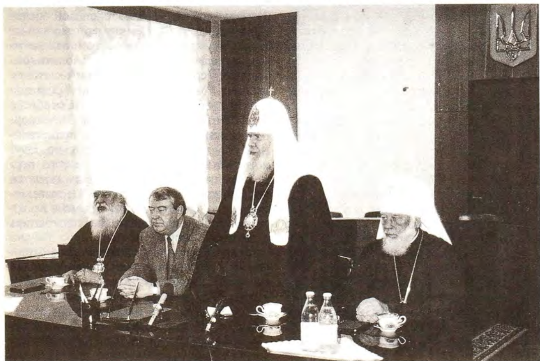
На встрече с главой администрации Одесской области