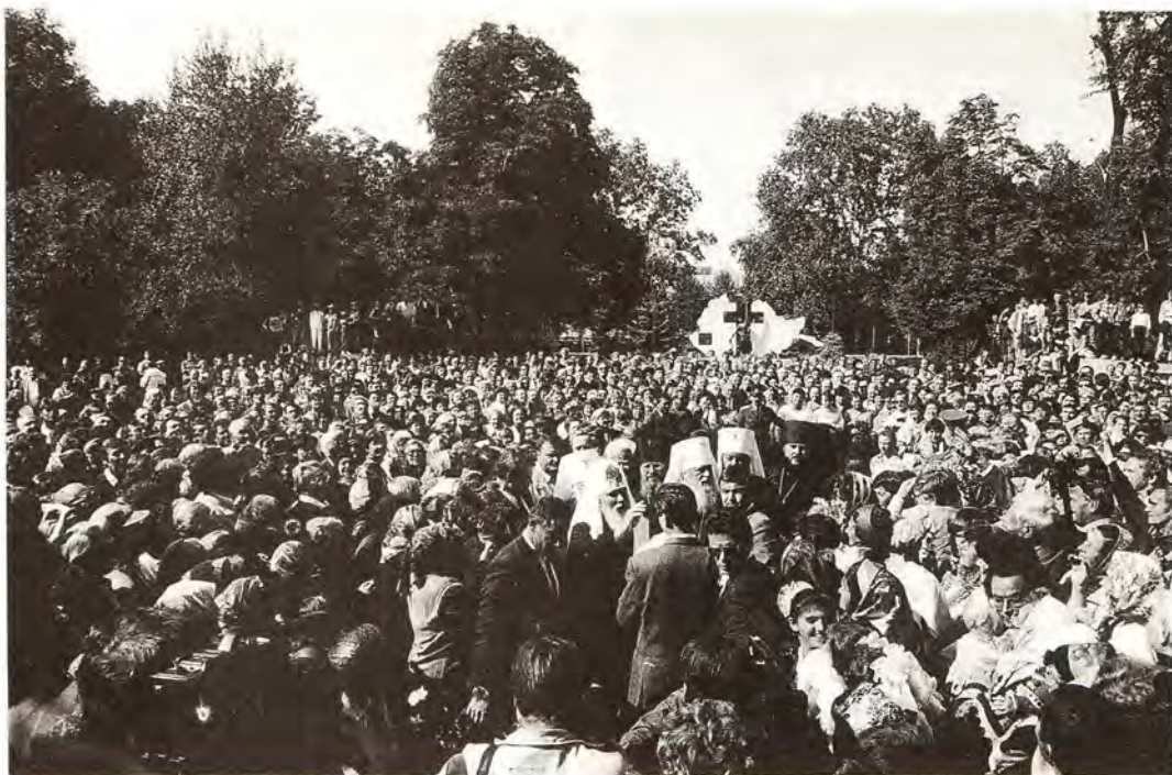
Жители Измаила приветствуют Предстоятеля Русской Православной Церкви