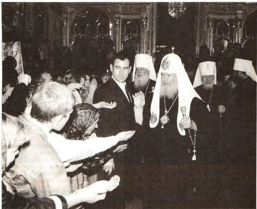
В Успенском соборе Одессы

ние с маленькими детьми и, несмотря на тесноту в храме, подводили их под благословение Его Святейшества. Как отметила одна из прихожанок, такое стечение народа бывает в соборе только на Пасху. И действительно, только с пасхальной можно было сравнить ту радость, которая озаряла лица людей, с надеждой и любовью устремлявших свои взоры на Предстоятеля Русской Православной Церкви. За всенощным бдением Святейший Патриарх собственноручно помазывал каждого из присутствующих освященным елеем и благословлял Владимирской иконкой Пресвятой Богородицы. Такие же иконки раздавались верующим во всех храмах Одесской епархии, которые он посещал. По окончании всенощного бдения Его Святейшество благословил всех находившихся в храме чудотворным Касперовским образом Пресвятой Богородицы.