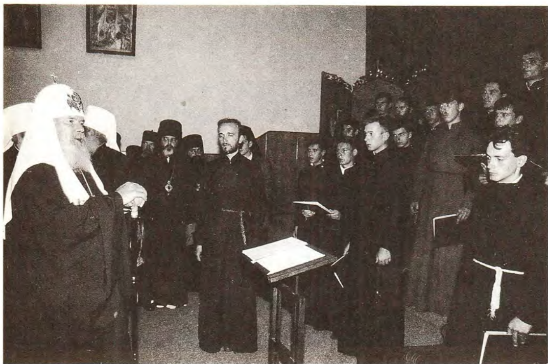
Святейший Патриарх Алексий с воспитанниками ОДС после концерта духовной музыки