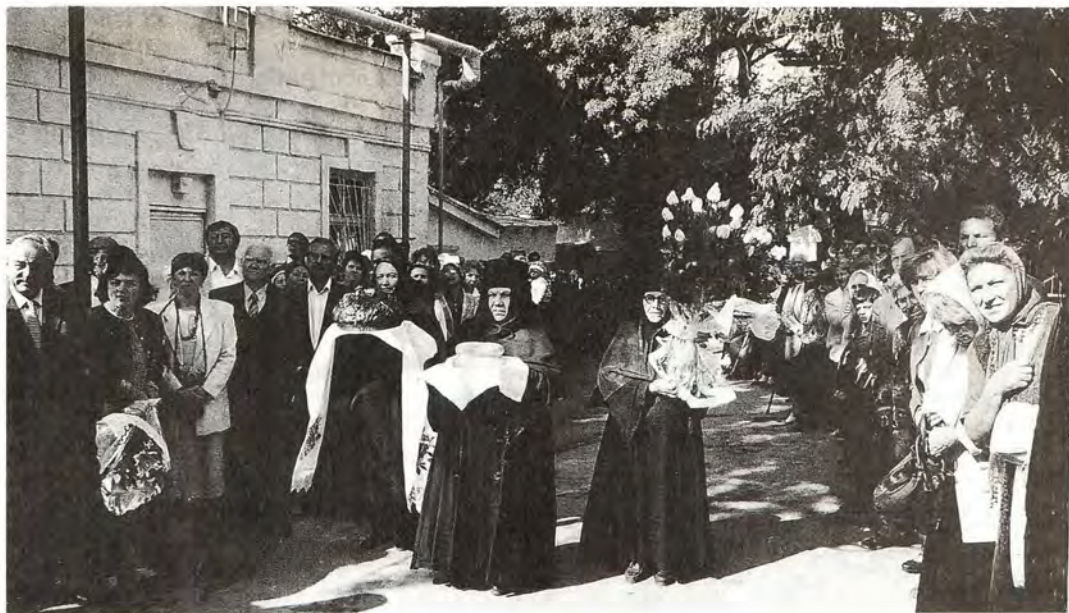
Насельницы Архангело-Михаиловского женского монастыря встречают Святейшего Патриарха Алексия