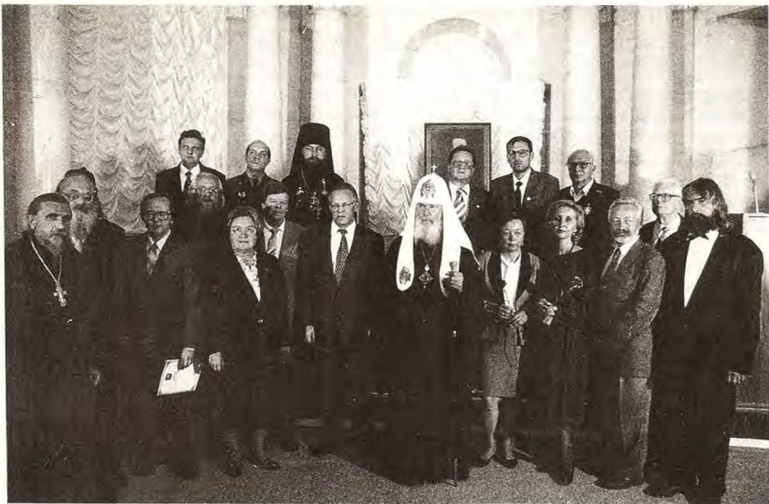
Святейший Патриарх Алексей с лауреатами конкурса

Алексием и Ю. М. Лужковым утвердил в ходе персонального обсуждения лауреатов Макариевского конкурса.