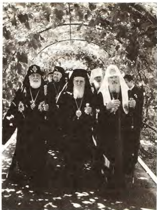
Предстоятели Поместных Православных Церквей в Одесском Успенском монастыре