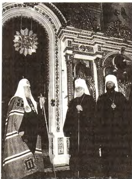
Слово Предстоятеля Русской Православной Церкви в Успенском кафедральном соборе

Во второй половине дня Святейший Патриарх Алексий посетил Одесскую Духовную семинарию. Он побывал в семинарском храме Апостола Андрея Первозванного, осмотрел экспозицию музея в помещении Духовной школы. Затем состоялась встреча с ее воспитанниками и преподавателями. От лица учащихся и учащихся Святейшего Патриарха приветствовал ректор Семинарии митрополит Одес-