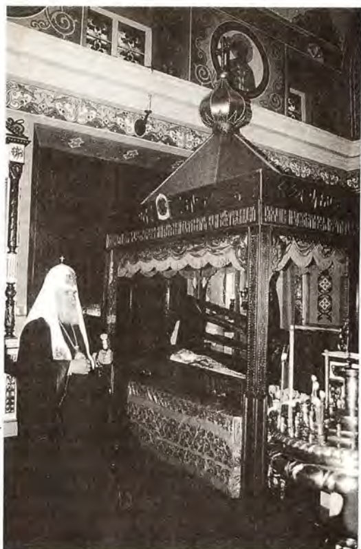
Святейший Патриарх Алексей у мощей преподобного Кукши Одесского

Святейший Патриарх Алексей поблагодарил отца наместника за теплые слова: «Мы рады и благодарны Господу, благодарны Блаженнейшему Владыке митрополиту