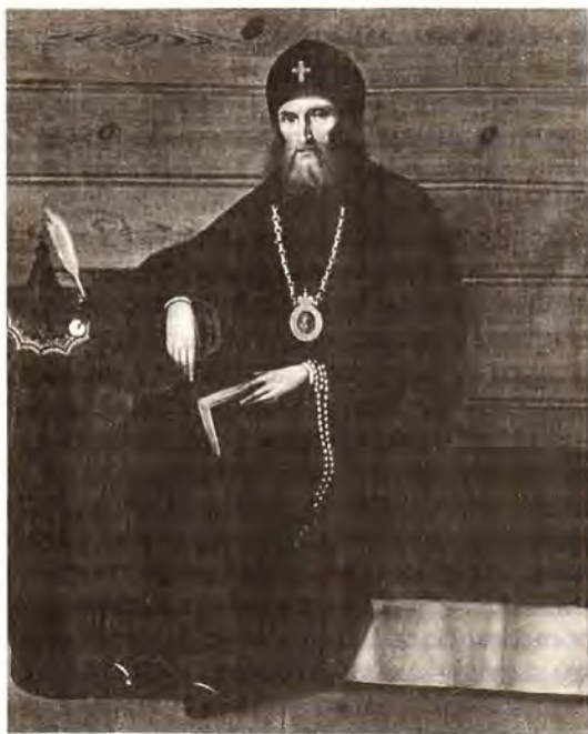
Святитель Московский Филарет

19 ноября/2 декабря 1997 года исполняется 130 лет со дня преставления святителя Московского Филарета – одного из самых замечательных деятелей Русской Православной Церкви XIX столетия. Всем известны его заслуги перед Российским государством и Церковью. Но среди многочисленных дарований святителя хочется выделить удивительный дар проповедничества. Современники сравнивали его со святым Иоанном Златоустом. Он сделал для языка проповеди не меньше, чем Карамзин и Пушкин для языка художественной прозы и поэзии.