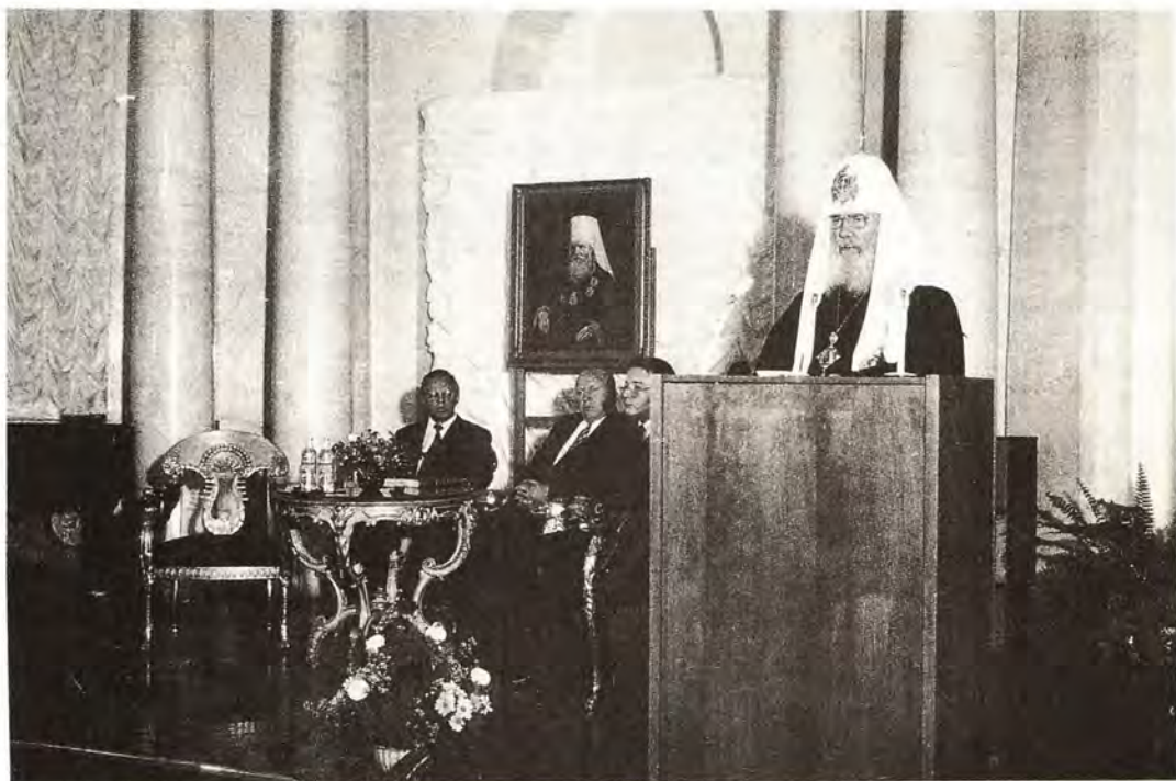
Выступление Святейшего Патриарха Алексия

мира как введение в историю Русской Церкви» стало свидетельством появления в русской исторической науке нового выдающегося исследователя. С 1857 года, в бытность свою епископом Винницким, будучи ректором Санкт-Петербургской Духовной академии, Преосвященный Макарий начал издавать свою «Историю Русской Церкви», последний том которой увидел свет уже после кончины знаменитого ученого, почившего в сане митрополита Московского и Коломенского.