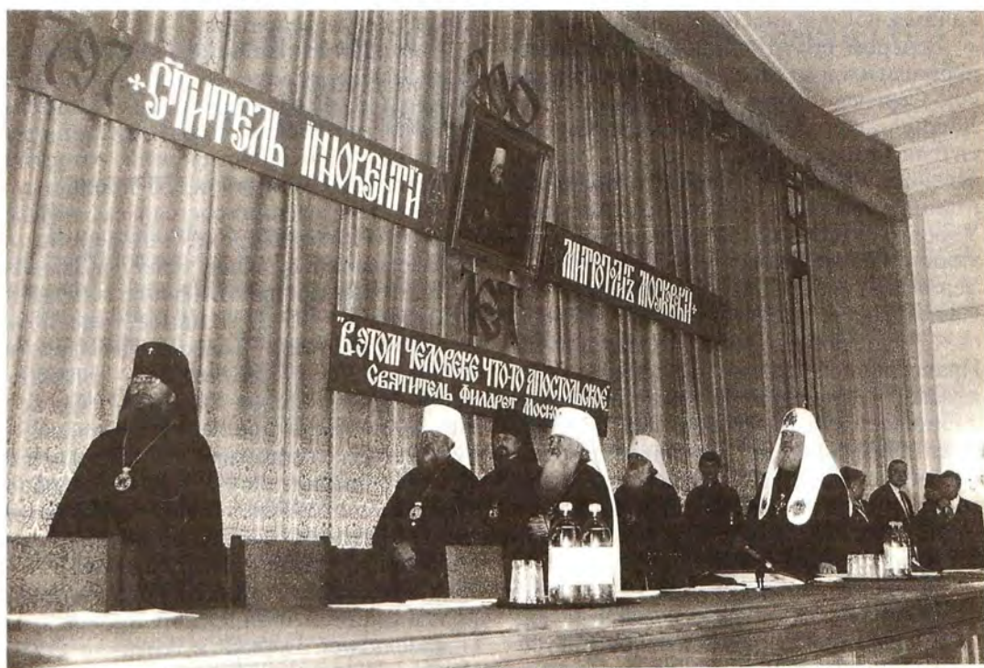
Молитва перед началом торжественного акта