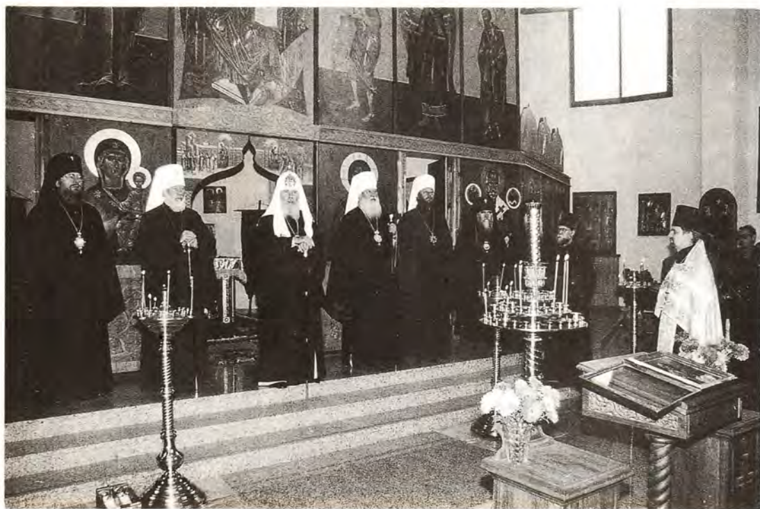
В храме Святителя Николая на Одесском морском вокзале