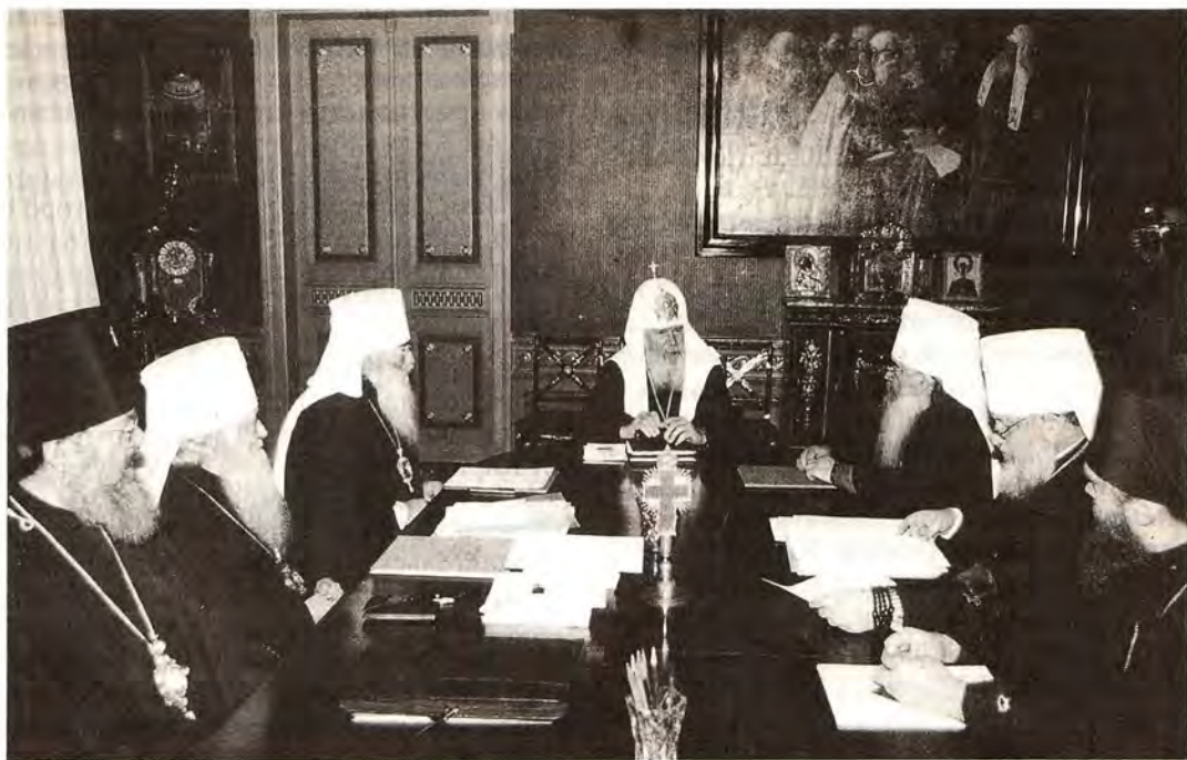
Заседание Священного Синода Русской Православной Церкви 2 октября 1997 года

верного князя Даниила Московского I степени. На встрече с премьер-министром Святейший Патриарх поблагодарил правительство Литвы за справедливое решение религиозных проблем и проблем национальных меньшинств.