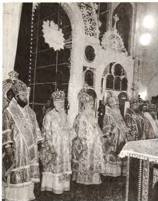
Во время Божественной литургии в Успенском кафедральном соборе Одессы

тери – кафедральном Успенском соборе, и мы молились вместе с Вами, Ваше Святейшество, о мире всего мира, о благостоянии святых Божиих Церквей и о соединении всех. Единство – это неотъемлемая сущность Церкви Христовой, это воля и желание ее Основателя Господа нашего Иисуса Христа, Который молился Отцу Своему Небесному о таком единстве, о том, чтобы было едино стадо и един пастырь. Тяжелый жребий выпал на долю украинского Православия, оно разделяемо и разрываемо. Мы скорбим по этому поводу, хотя осознаем, что, если против нас восстают все адские силы, значит, есть в нашей Церкви Божественная истина и Божественная благодать. Мы молимся и просим Вас, Ваше Святейшество, помолиться о том, чтобы водворился мир среди православных и всех людей, которые населяют сегодня пределы Украины». Блаженнейший митрополит Киевский Владимир передал в дар Святейшему Патриарху Алексию список чудотворной Касперовской иконы Пресвятой Богородицы.