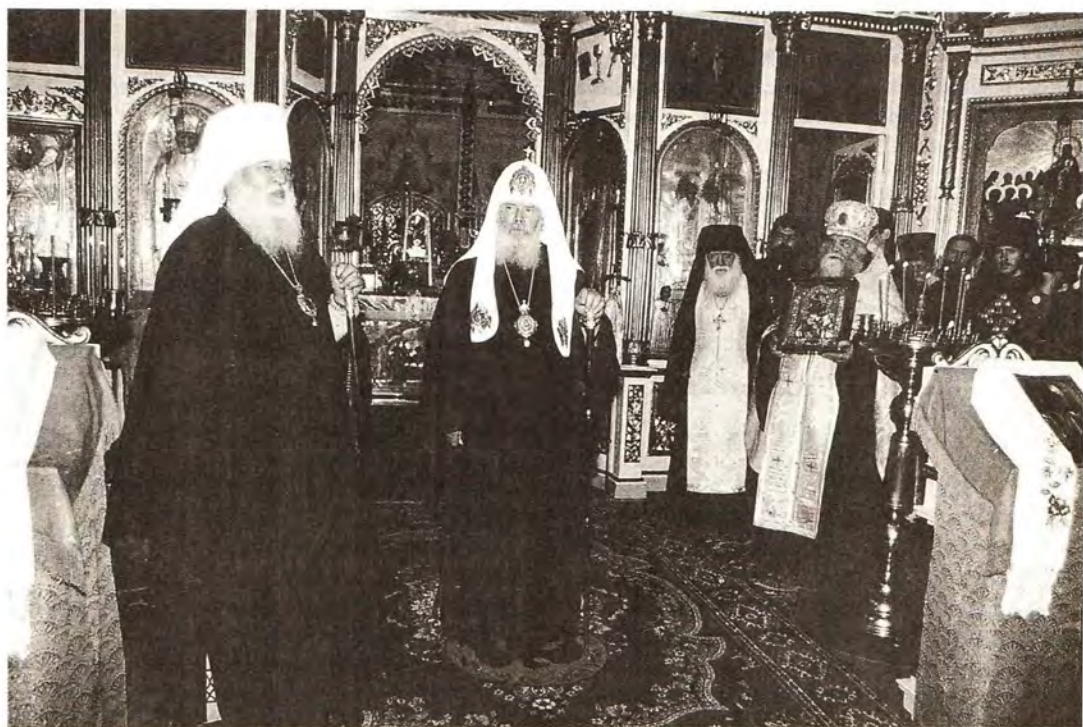
Святейший Патриарх Алексий в Успенском монастыре. Последний день визита