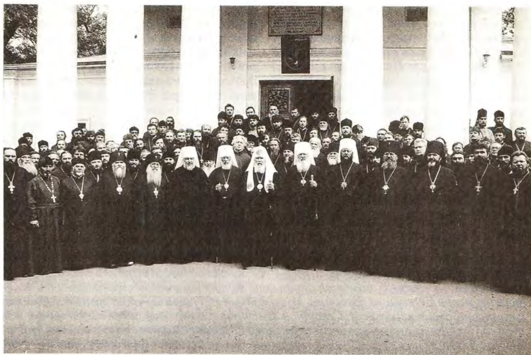
Святейший Патриарх Алексий с духовенством Одесской епархии