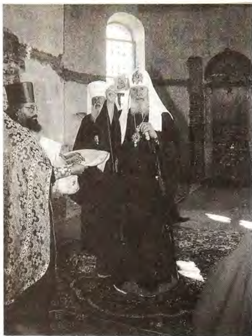
Первосвятительское благословение. Никольский храм Измаила

Церкви передал Покровскому храму Казанскую икону Божией Матери с дарственной надписью.