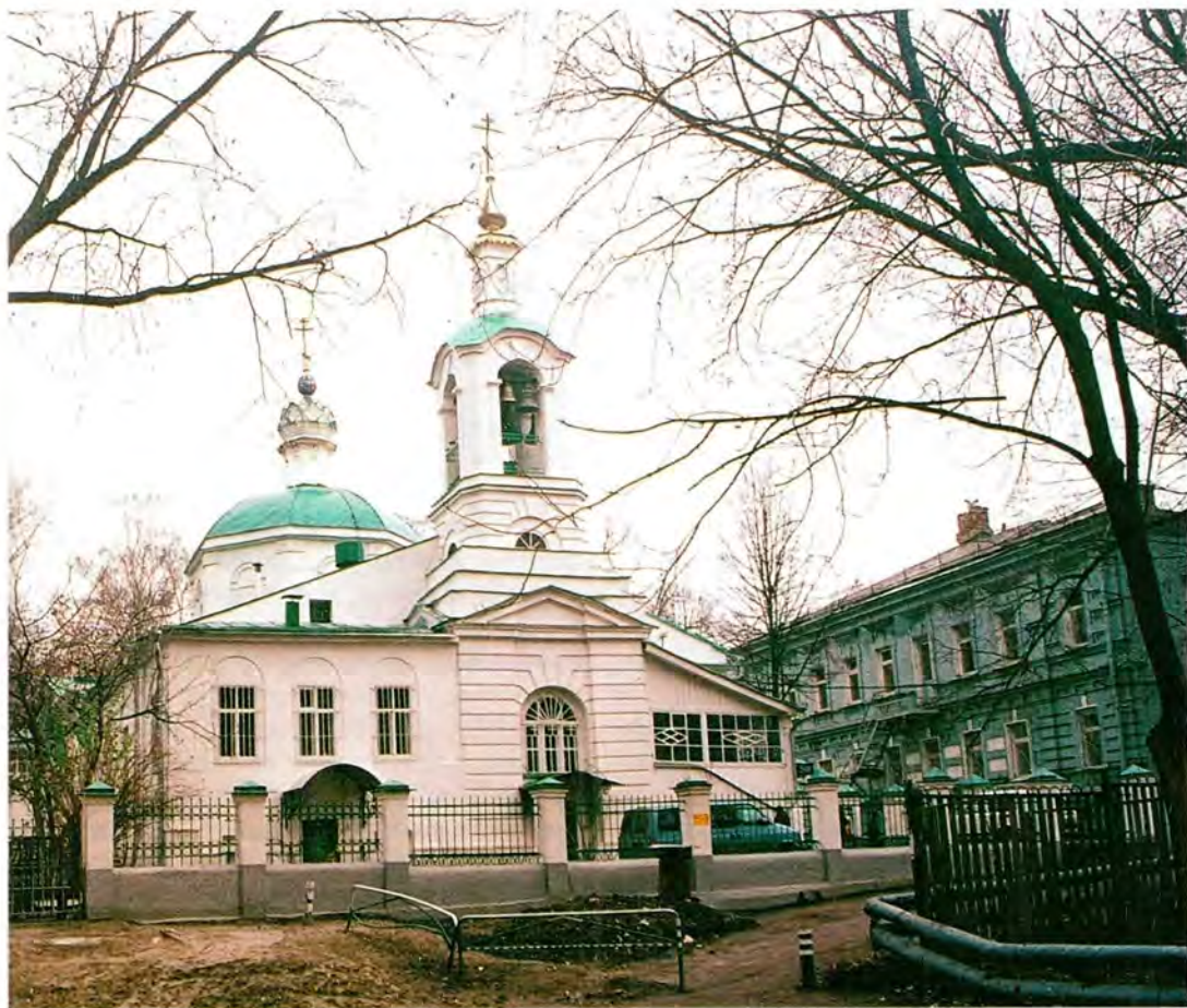
Храм Пресвятой Богородицы на Лышиковой горе с домом причта (справа)

Лышикова переулкa, которая воспринимается как «дорога, ведущая к храму».