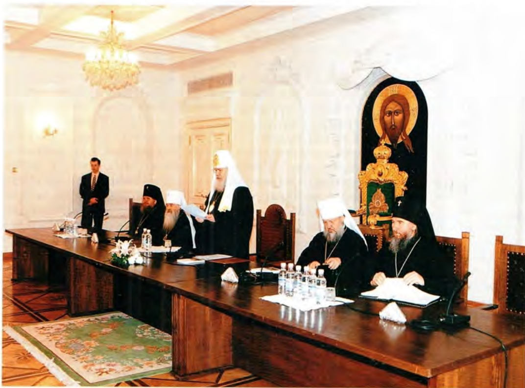
Приветственное слово Святейшего Патриарха Алексия участникам конференции

Многовековая традиция паломничества ко Гробу Господню иерархов, клириков, монашествующих и мирян Русской Православной Церкви духовно сблизила Матерь