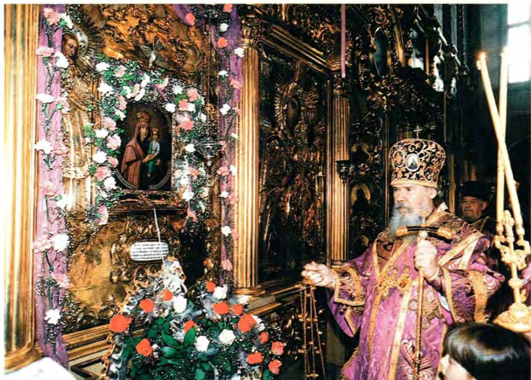
Святейший Патриарх Алексий у празднуемой иконы Пресвятой Богородицы «Споручница грешных» в храме Святителя Николая в Хамовниках. 20 марта 1997 года