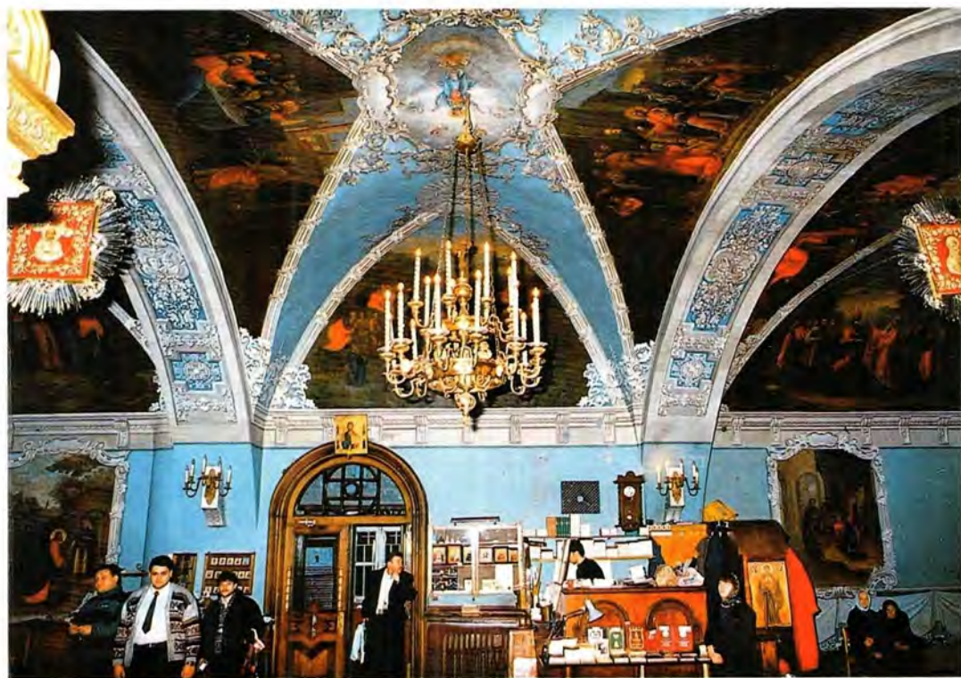
Фрагмент интерьера Покровского храма. Трапезная

В современной Москве, напоминая сегодня не прежнюю златоглавую столицу, а скорее интернациональный полис, сохранились островки мира прошлого. Одним из таких островков — и в символическом, и в топографическом смысле — стал комплекс Покровской церкви на Лыщиковой горе. в настоящее время он состоит из храма, церковного дома по северной границе двора и дома причта. Храм с близко поставленной оградой зрительно гармонирует с небольшим садиком, разбитым на месте существовавшего здесь до 1917 года двора священника. Эта территория получила островной характер, так как со всех четырех сторон ее окружают внутриквартальные проезды. Проездом дом причта отделен от огражденного церковного двора с храмом и церковным домом 1950-х годов, которые в наши дни полностью утратили