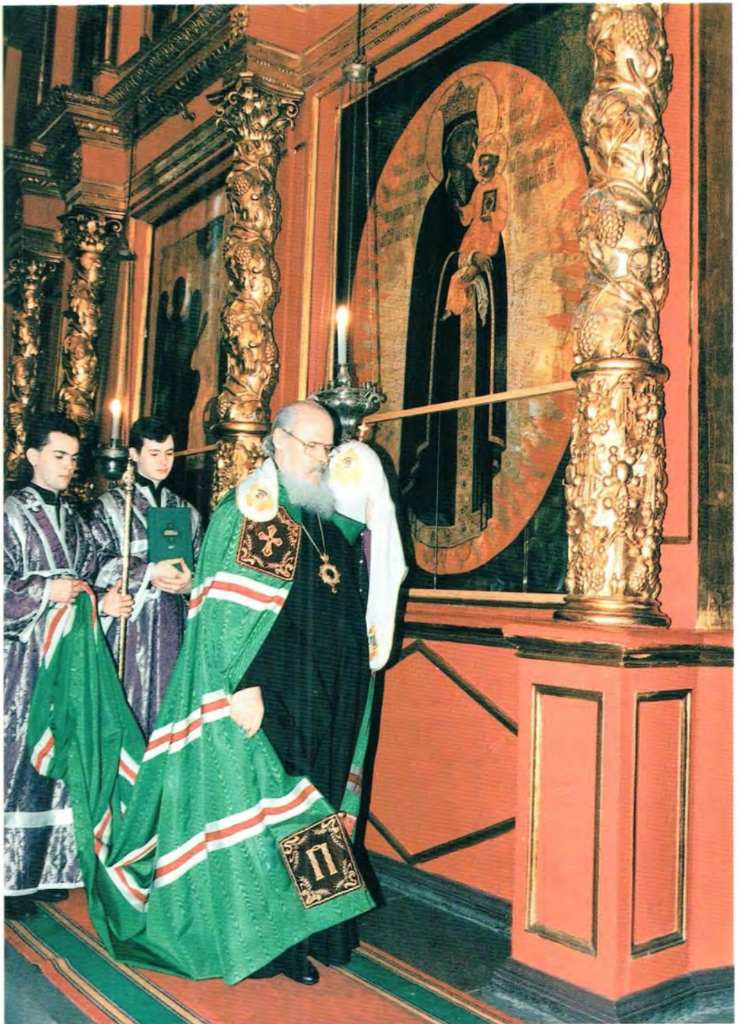
Святейший Патриарх в Архангельском соборе Московского Кремля у иконы Божией Матери «Благодатное Небо». 19 марта 1997 года