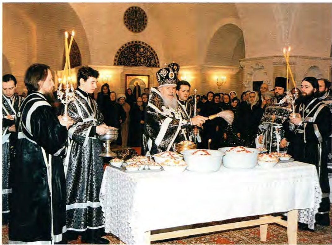
Освящение колива в Преображенской церкви Храма Христа Спасителя после молебного канона великомученику Феодору Тирону 14 марта 1997 года

шил накануне вечером всенощное бдение в Троицком соборе Свято-Данилова монастыря в сослужении митрополитов Крутицкого и Коломенского Ювеналия, Волоколамского и Юрьевского Питирима, архиепископа Истринского Арсения, епископов Орехово-Зуевского Алексия и Красногорского Саввы.