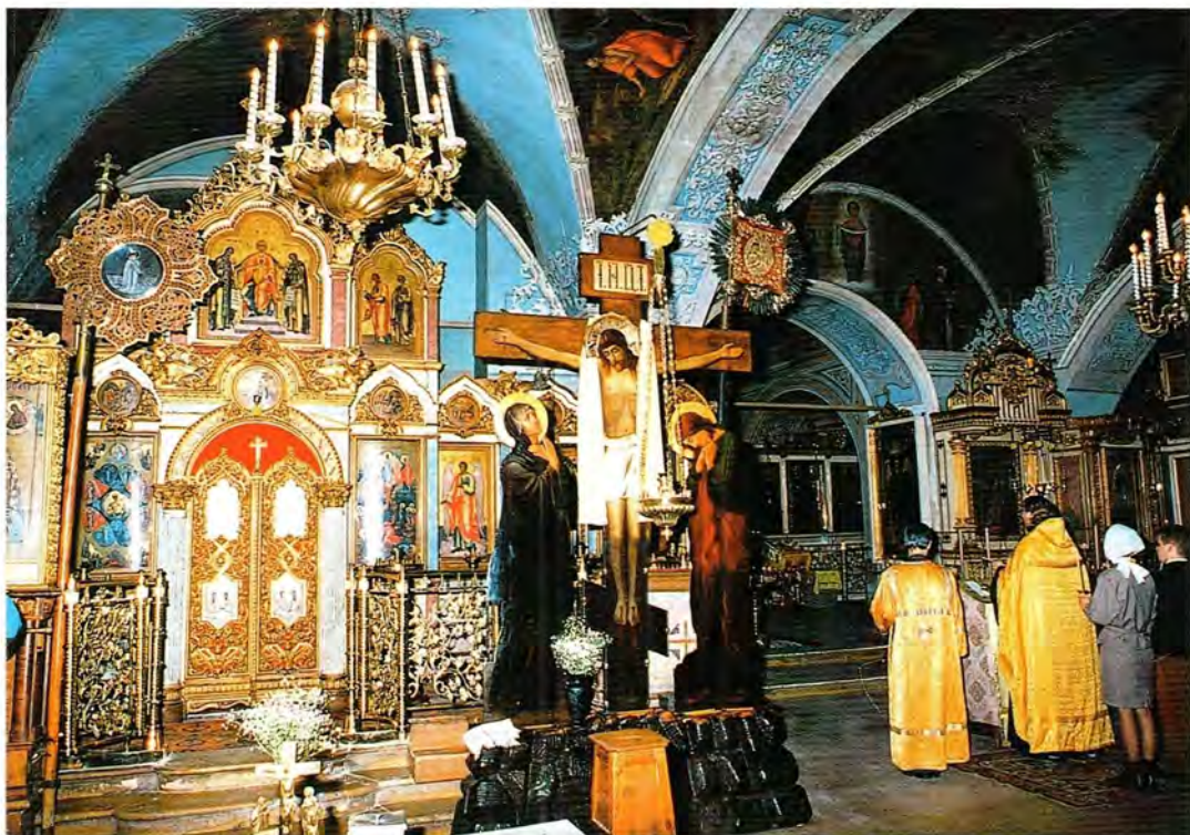
Придел во имя преподобного Иоанна Дамаскина