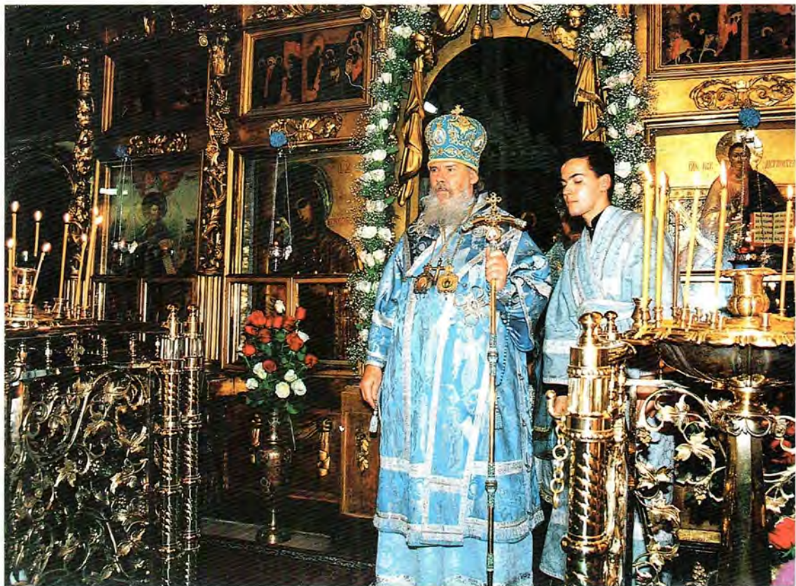
Святейший Патриарх Алексий во время Божественной литургии в день 300-летия храма

органичную для них среду исторической застройки. Среди современных многоэтажных зданий существующее церковное владение воспринимается как отдельный, сугубо ценный фрагмент историко-градостроительной среды квартала. Территория памятника архитектуры — храма Покрова Пресвятой Богородицы, что на Лыщиковой горе, — сохранила важное значение, являясь композиционным и смысловым ядром исторической застройки квартала.