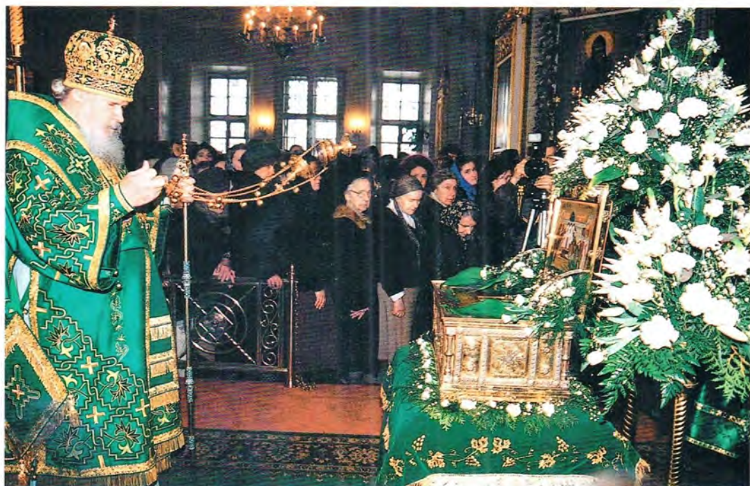
Святейший Патриарх Алексий у мощей святого благоверного князя Даниила Московского. Троицкий собор Свято-Данилова монастыря в Москве. 17 марта 1997 года