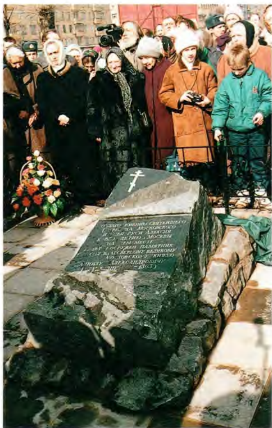
Закладной камень памятника святому благоверному князю Даниилу Московскому на Серпуховской площади близ Свято-Данилова монастыря в Москве

венника, родоначальника всех князей и государей Московских.