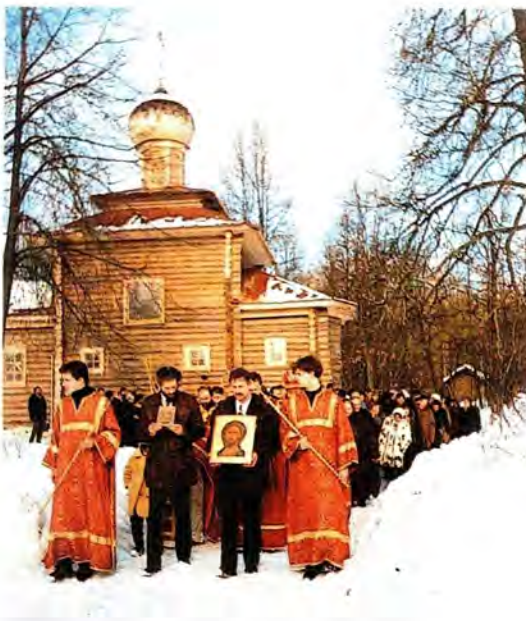
Крестный ход к Памятному кресту, установленному на полигоне

по всем убиенным за веру в годы гонений. На литии поминались многие из тех, кто погиб на полигоне. А ведь названы по именам далеко не все. Сколько безвестных страдальцев лежит в этой земле! Имена их, в точности исполнивших заповедь Христа: «Нет больше той любви, как если кто положит душу свою за друзей своих» (Ин. 15, 13), знает только Сам Господь.