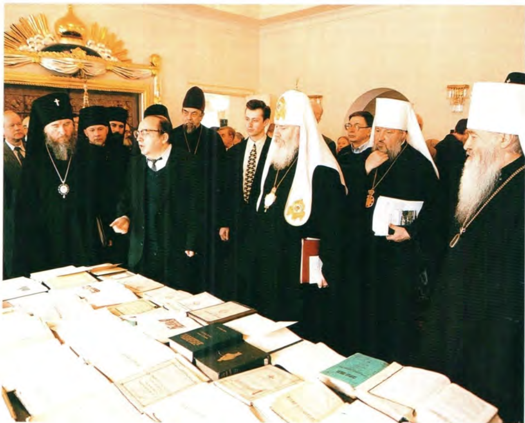
Святейший Патриарх Алексей с участниками конференции осматривает выставку литературы

ский и всея Руси Алексей, обратившийся к ее участникам с кратким вступительным словом. Святейший Патриарх пожелал участникам конференции успеха в предстоящих научных трудах, выразив надежду на то, что их результаты будут достойным вкладом в празднование юбилея Русской Духовной Миссии в Иерусалиме. Выступивший затем митрополит Смоленский и Калининградский Кирилл, председатель Отдела внешних церковных сношений Московского Патриархата, зачитал приветственное послание,