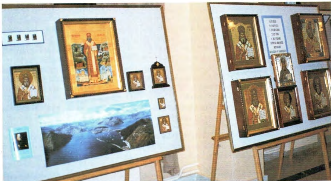
Выставка, посвященная святителю Московскому Иннокентию

Выступивший затем председатель Юбилейной комиссии митрополит Крутицкий