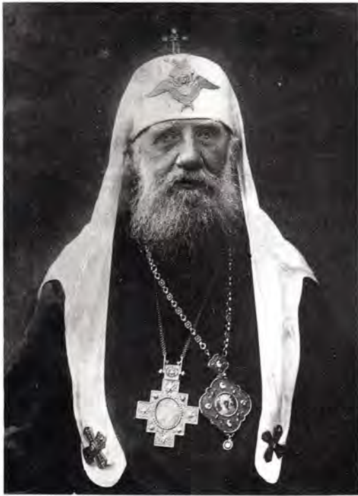
Святейший Патриарх Тихон

Но в ближайшие грядущие годы оно станет для всей страны еще более тяжким: оставленная без помощи, недавно еще цветущая и плодородная земля превратится в бесплодную и безлюдную пустыню, ибо не родит земля непосеянная и без хлеба не живет человек.