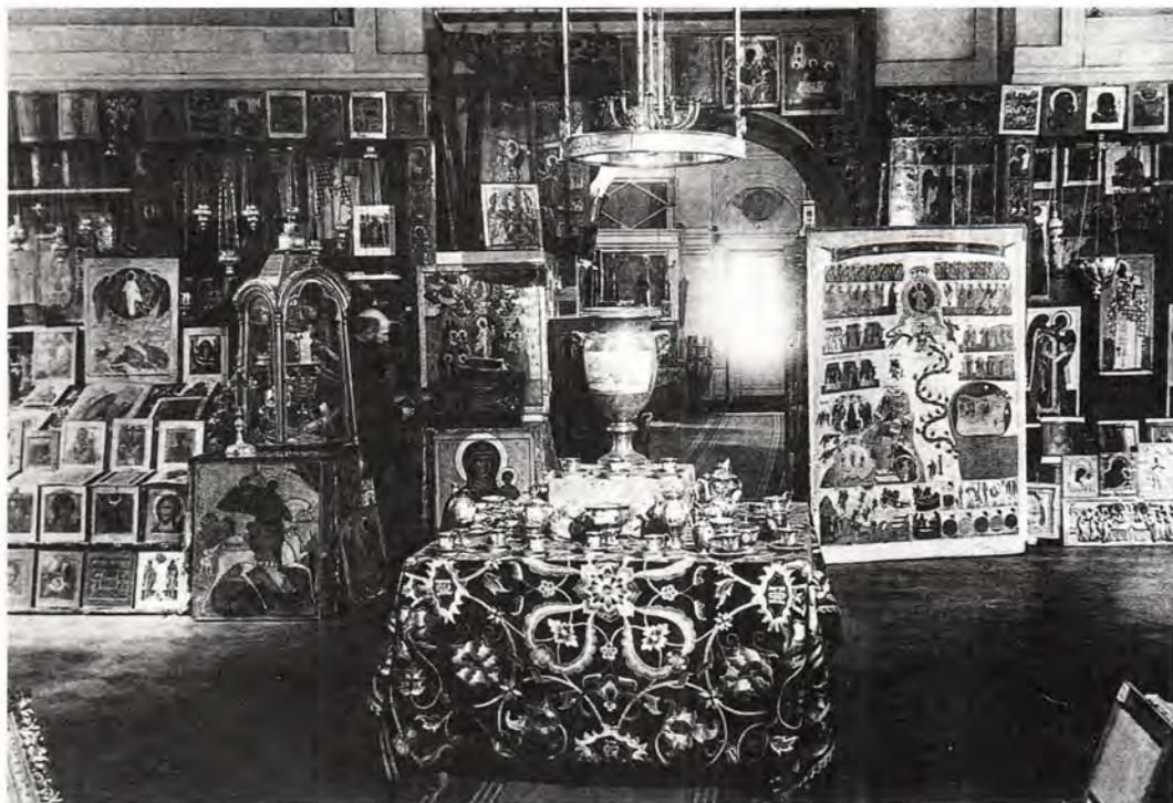
Приготовлено для продажи за границей. Фотография 1920-х годов

Председатель Петроградской Губернской Комиссии по изъятию церковных ценностей — подпись.