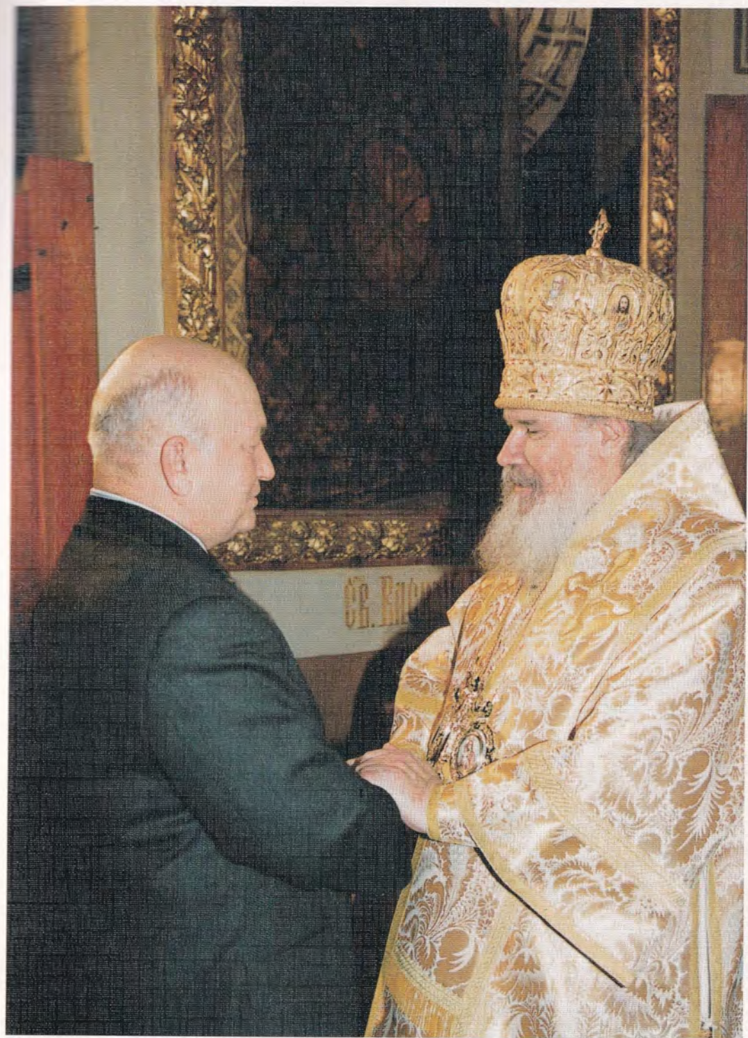
Святейший Патриарх Алексий с мэром Москвы Ю. М. Лужковым в Богоявленском кафедральном соборе г. Москвы после рождественского богослужения