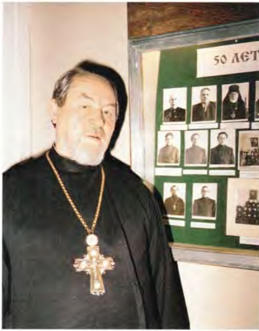
Протоиерей Василий Ермаков возле стенда с фотографиями первых выпускников

Санкт-Петербурга и их настоящем дне. На одном из стендов были помещены фотографии первых выпускников возродившихся Духовных школ, среди которых — портрет Святейшего Патриарха Московского и всея Руси Алексия II, тогда еще выпускника академии.