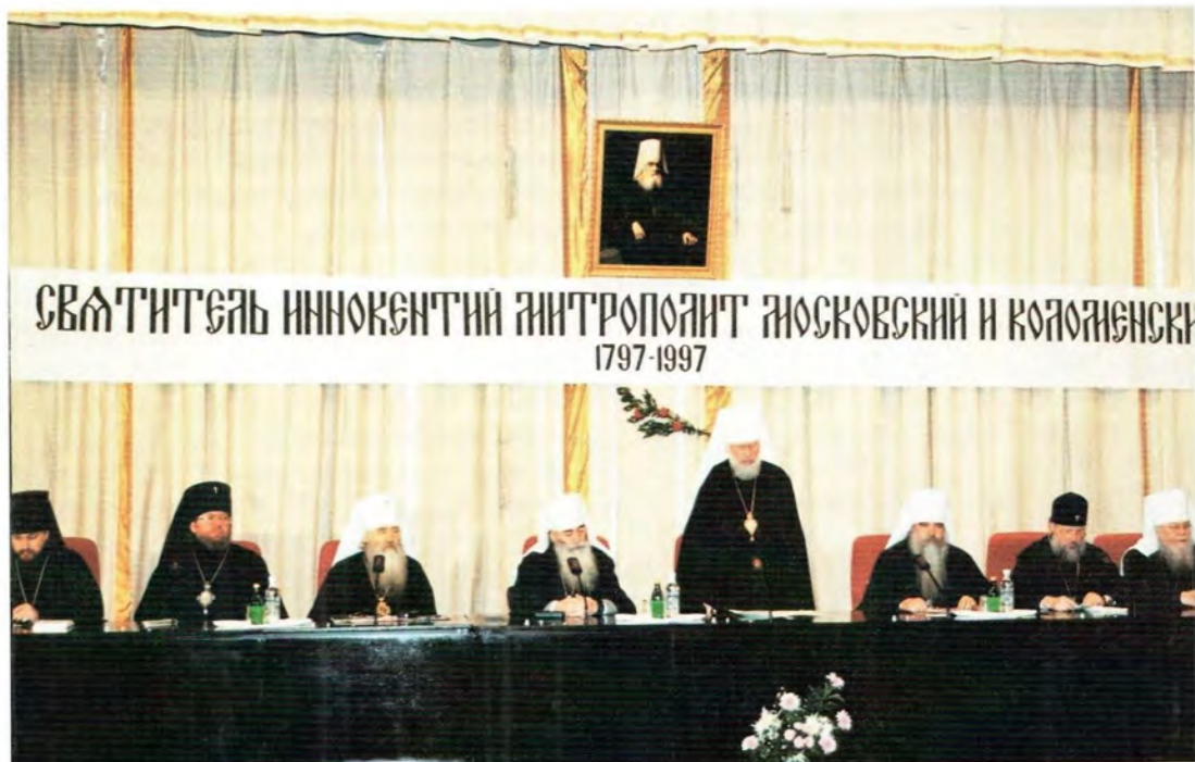
Открытие юбилейной программы

внесет особый вклад в дело христианского просвещения и духовного возрождения народов нашей страны». По благословению Предстоятеля 1997 год объявлен в