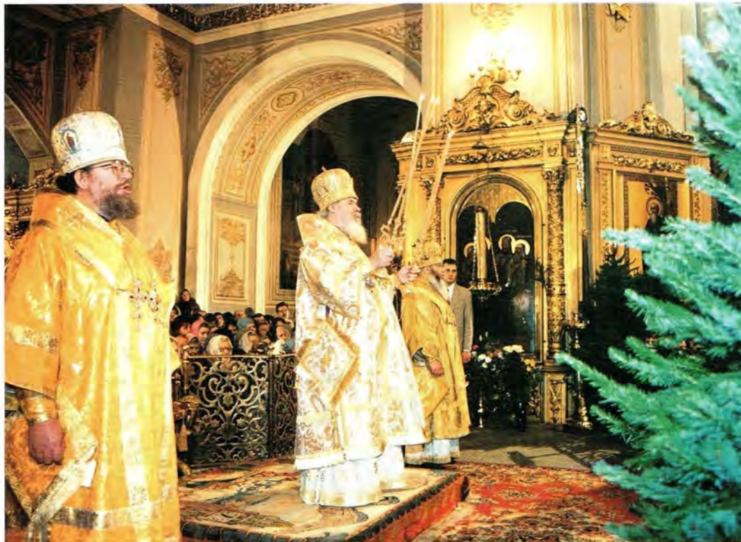
Божественная литургия в Богоявленском кафедральном соборе Москвы. Рождество Христово. 7 января 1997 года

и в Богоявленском кафедральном соборе в Москве великое повечерие, утреню и Божественную литургию в сослужении архиепископов Солнечногорского