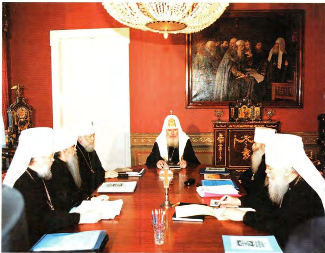
Заседание Священного Синода Русской Православной Церкви. 27 декабря 1996 года

о состоявшихся 15–17 ноября 1996 года в монастыре святой Отtilии (Германия) Четвертых богословских собеседованиях между делегациями Русской Православной Церкви и Германской Епископской Конференции Римско-Католической Церкви по теме «Авторитет в Церкви».