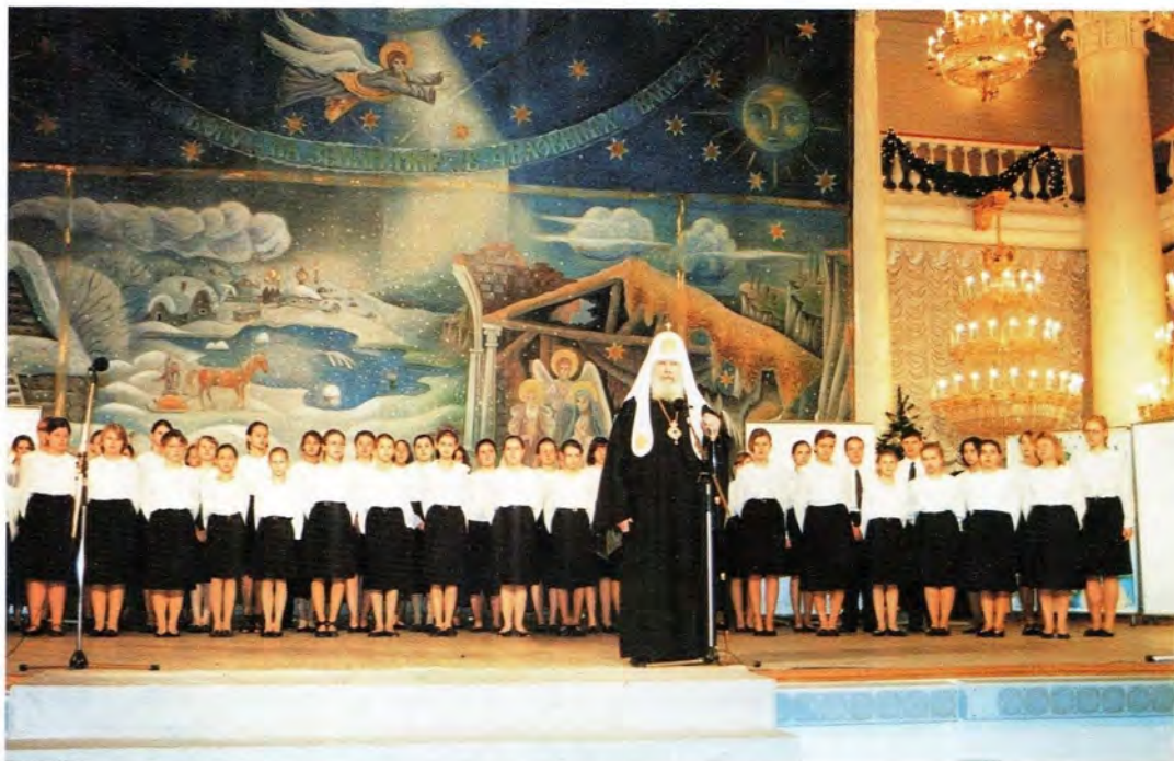
Святейший Патриарх Алексий на рождественском благотворительном вечере в Колонном зале Дома Союзов. 8 января 1997 года