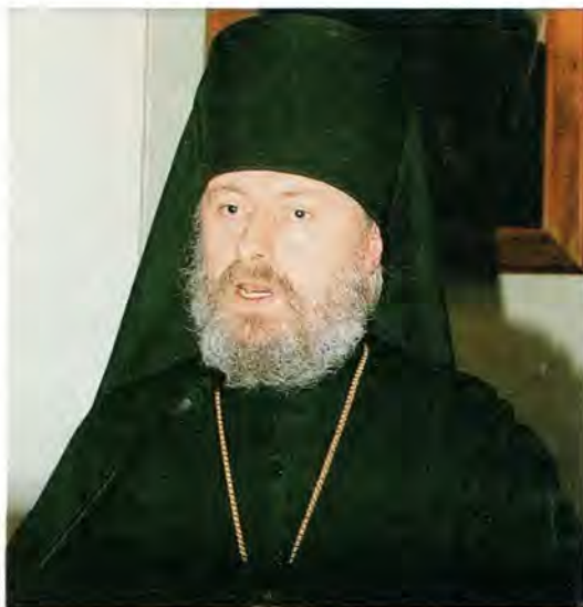
Выступление епископа Верейского Евгения, ректора Московских Духовных академии и семинарии

От имени Московских Духовных школ со словом приветствия выступил епископ Верейский Евгений, и. о. Председателя Учебного комитета при Священном Синоде Русской Православной Церкви, ректор Московских Духовных академии и семинарии. В своем кратком выступлении он упомянул наиболее выдающихся цер-