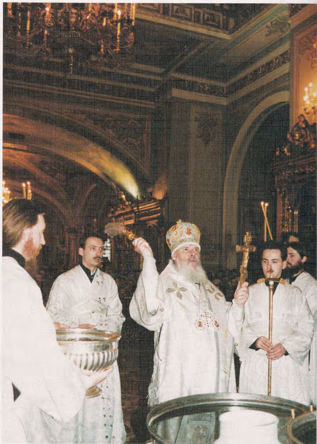
Святейший Патриарх Алексий окропляет народ после великого освящения воды в день Богоявления Господня