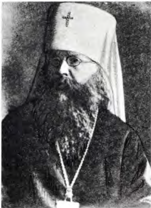
Митрополит Петроградский Вениамин

6) Если бы слово мое о предоставлении Церкви права самостоятельной помощи голодающим на изъясненных в нем основаниях услышано не было и представителю