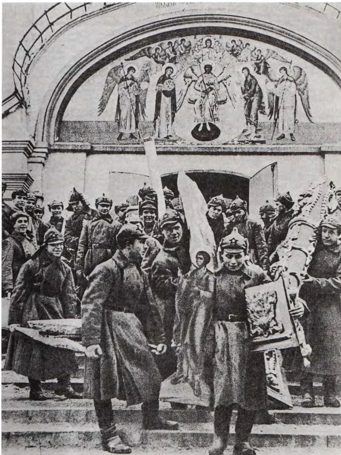
Разорение монастыря. Фотография 1920-х годов