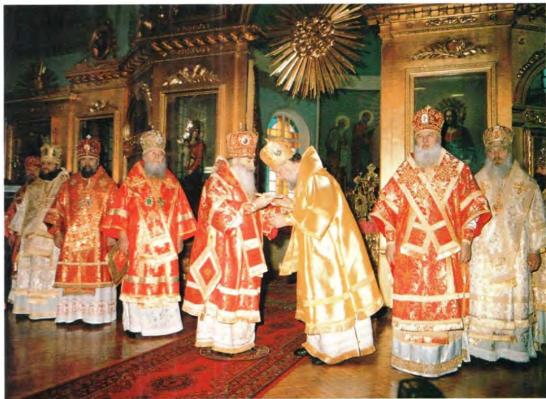
Божественная литургия в академическом храме во имя апостола Иоанна Богослова