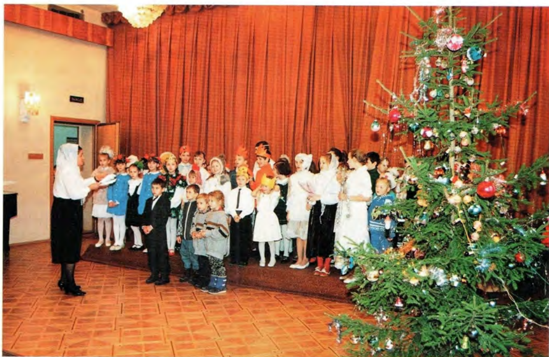
Рождественская елка в Издательстве Московской Патриархии. 9 января 1997 года