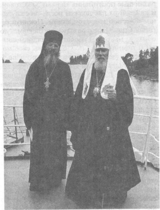
Святейший Патриарх Алексий и архимандрит Панкратий на палубе парохода по пути в Никольский скит

Всегда, когда покидаешь отдаленные святые места, не знаешь, судит ли Господь посетить их вновь. Сможем ли мы еще когда-нибудь приобщиться к святыне, которая хранится здесь, к этому святому месту, намоленному многими поколениями православных монахов, свершавших здесь свой подвиг и свое служение?