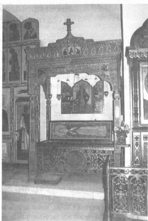
Рака с мощами преподобного Амвросия в Свято-Введенском соборе

И вот сегодня мы с вами являемся свидетелями большого церковного события, участниками прославления в ряду местночтимых святых еще тринадцати Оптинских старцев. На Божественном Небосводе воссияли новые великие молитвенники и заступники за всех живущих, которые вместе со всеми святыми небожителями будут предстоять у Престола Божия в