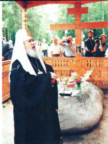
Святейший Патриарх Алексей в ближней пустыньке преподобного Серафима Саровского