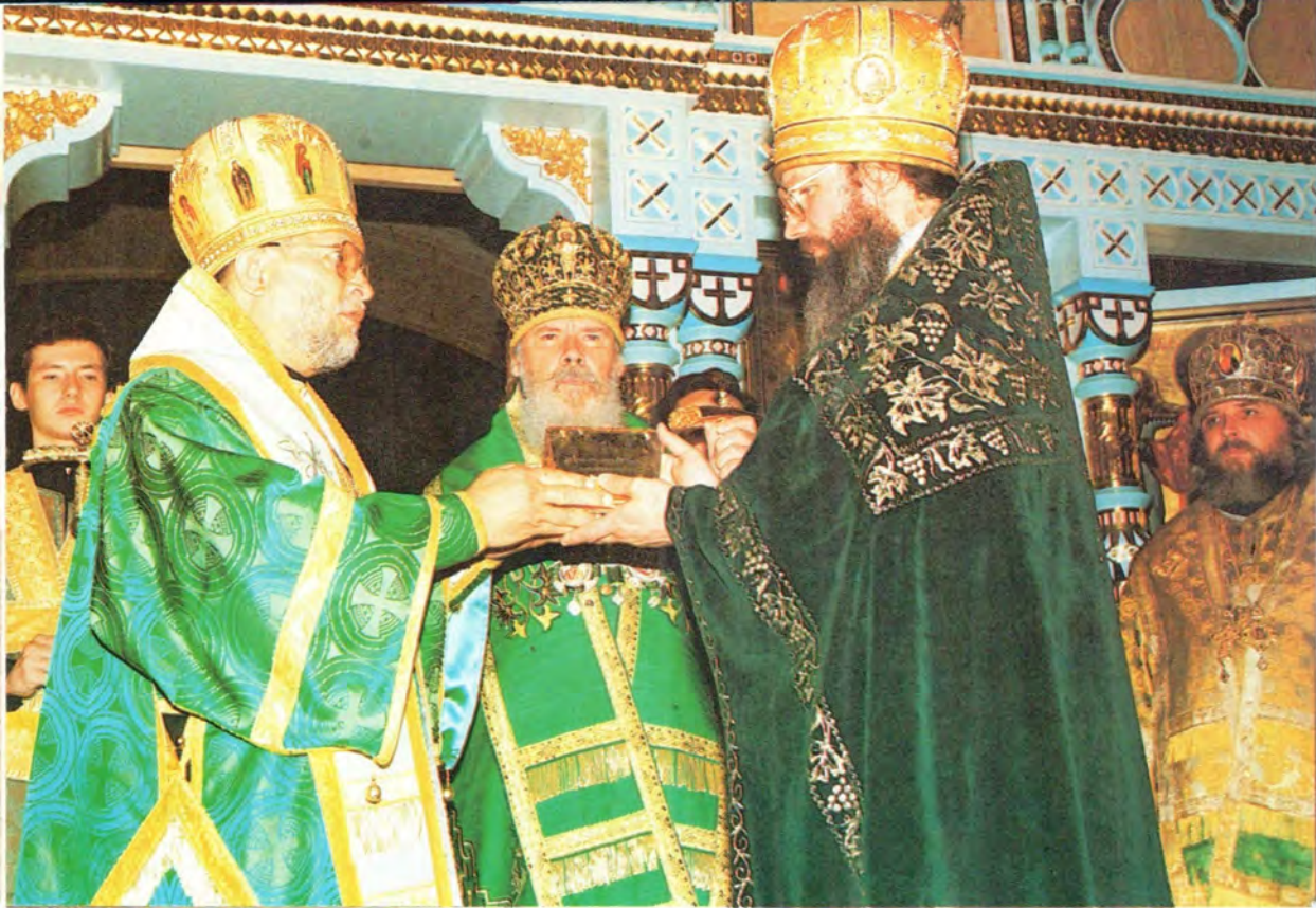
Передача частицы мощей преподобного Германа Аляскинского Митрополитом Канадским и всей Америки Феодосием в дар Валаамскому монастырю