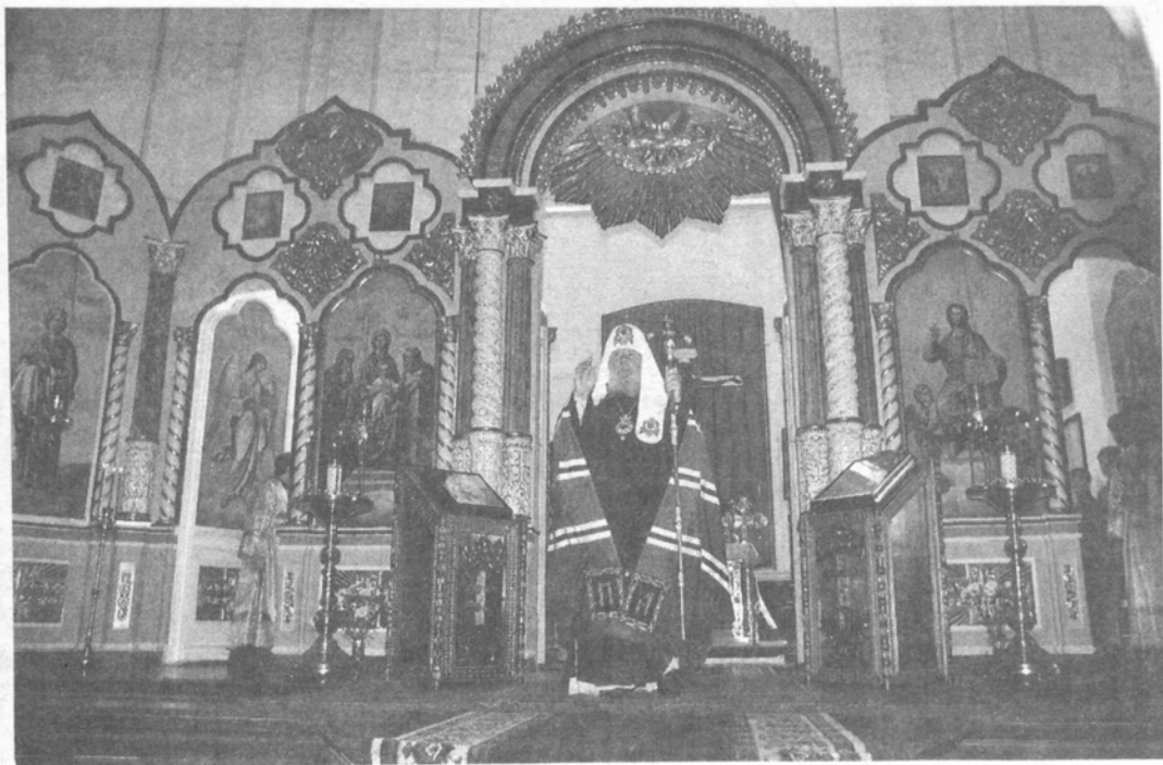
Святейший Патриарх в Троицком соборе Дивеевского монастыря

Святейший Патриарх обратился к присутствующим с приветственным словом: