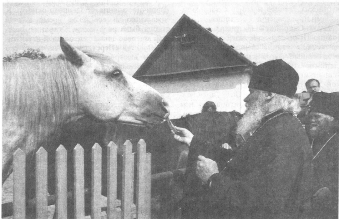
Святейший Патриарх осматривает монастырское подсобное хозяйство

Дай Бог, чтобы каждый из нас в жизни, в наставлениях старцев Оптиных черпал для себя указания, как жить, как искать Царство Божие и правду его. И если мы будем искать это, верим, что преподобные старцы будут теплыми о нас молитвенниками пред Престолом Всевышнего.