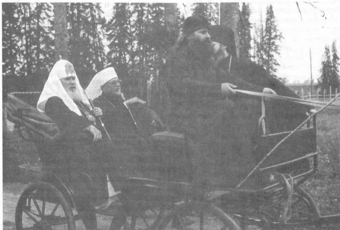
Поездка на игуменское кладбище

Позже Его Святейшество посетил Всехсвятский скит – один из двух на Валааме,