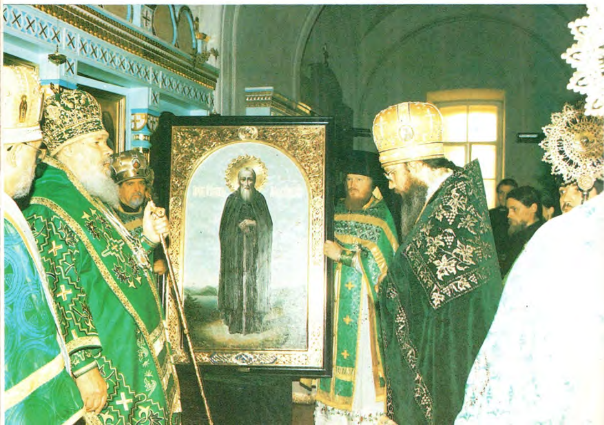
Святейший Патриарх Алексий передает в дар обители икону преподобного Германа Аляскинского