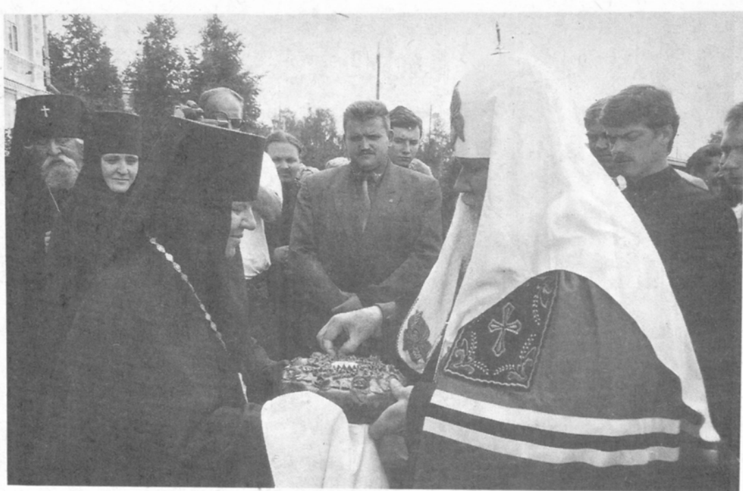
Встреча Святейшего Патриарха у ворот монастыря

вечерню и Акафист преподобному Серафиму Саровскому.