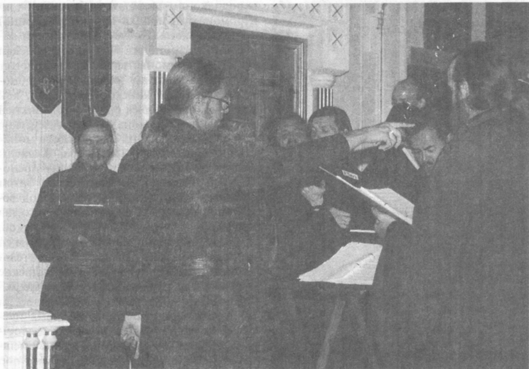
Сводный хор валаамских монахов

условия, длинные, многочасовые службы, на телесный труд, все равно люди приходят и остаются: и молодые и пожилые. Я это объясняю только тем, что по молитвам преподобных наших старцев благодать ощущается даже людьми, далекими от Церкви, – говорил отец Панкратий. – Место это особое – богоизбранная обитель. Мы стараемся жить по уставу – не так, как полегче, но как заповедовали отцы. Святая Русь была огромным монастырем, не случайно Преподобного Сергия называли Игуменом земли Русской».