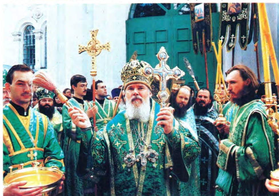
Святейший Патриарх у мощей преподобного Серафима Саровского