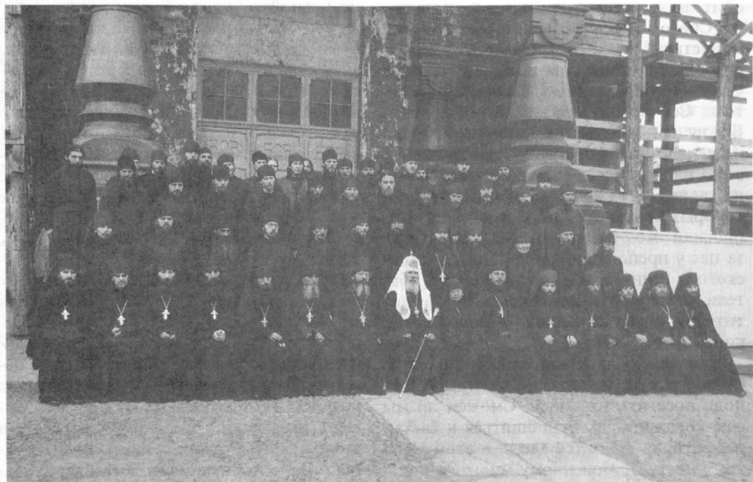
Святейший Патриарх с насельниками Спасо-Преображенского Валаамского монастыря

Да благословит Господь дальнейшие труды Ваши, отец наместник, и братия обители! Мы будем помнить вас и молитвенно разделять ваш подвиг, зная ваши труды, видя их плоды и уповая на ваши