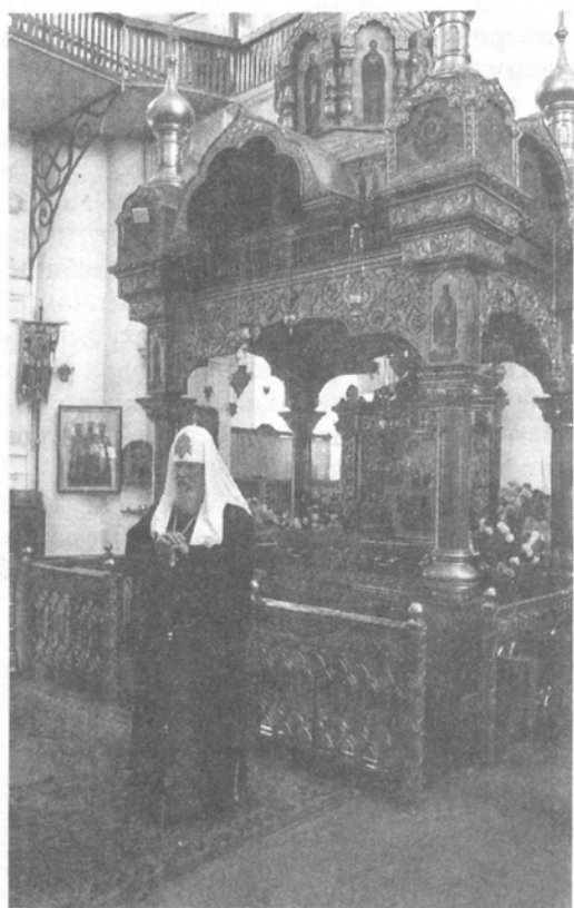
Святейший Патриарх у мощей преподобного Серафима Саровского

Я сердечно поздравляю вас с пятой годовщиной возвращения святых и многоцелебных мощей преподобного Серафима Саровского в обитель Дивеевскую. Казалось, они были безвозвратно утрачены, но по милости Божией они были обретенны и проделали путь с Севера до Свято-Дивеевской обители. И ныне мы радуемся духовному возрождению обители, радуемся тому, что вновь возрождается здесь иконописное искусство, и тому, что сестры Дивеевской обители под руководством Вашим и матушки игуменни совершают свой молитвенный подвиг, трудятся во многих скитах на земле, выращивая урожай, все необходимое для жизни обители и паломников, которые во множестве приходят в Дивеево. Преподобный Серафим Саровский стал как бы ближе к нам, потому что ныне мы имеем возможность поклониться его цельбоносным мощам. Он является молитвенником и представителем за всех нас перед Престолом Всевышнего. Мы верим, что преподобный принимает всех приходящих в эту святую обитель к