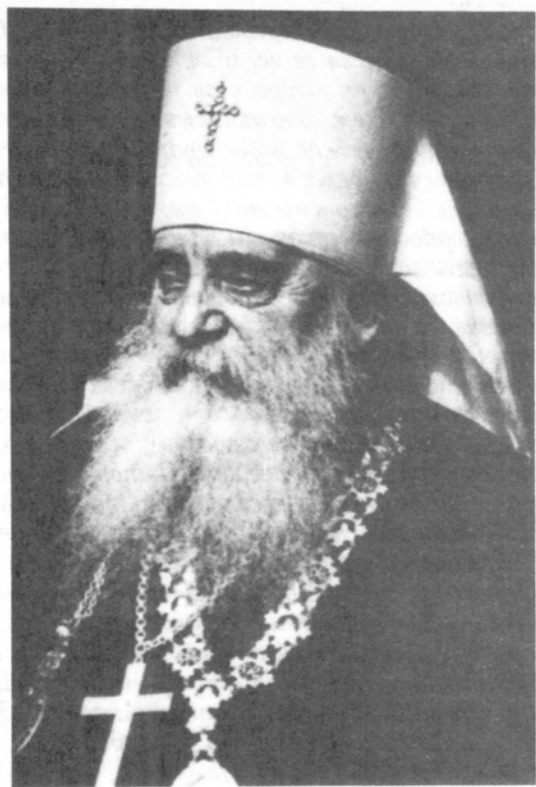
Митрополит Антоний Храповицкий