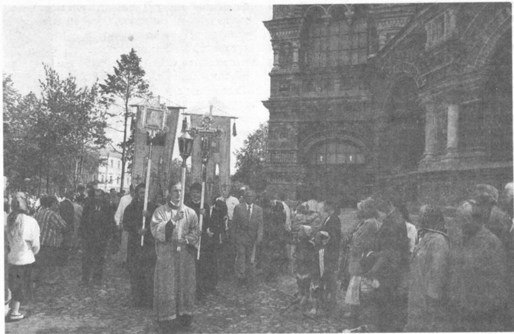
Крестный ход в престольный праздник Петропавловского собора в Петергофе

памяти святых первоверховных апостолов Петра и Павла. Святейший Патриарх Алексий совершил Божественную литургию в Петропавловском храме Петергофа в сослужении Митрополита всей Америки и Канады Феодосия, митрополита Санкт-Петербургского и Ладожского Владимира, архиепископа Филадельфийского и Восточно-Пенсильванского Германа, епископов Истринского Арсения, Петрозаводского и Олонецкого Мануила и Орехово-Зуевского Алексия. Этот нарядный храм, построенный в русском стиле, Его Святейшество, будучи еще митрополитом Ленинградским и Новгородским, впервые посетил в 1987 году, когда там царила полная разруха. Вскоре после этого началось восстановление храма, в чем очень велика заслуга ктитора Петропавловского собора В. В. Канюкова. Божественная литургия завершилась крестным ходом, затем Святейший Патриарх вместе с Митрополитом Феодосием и сопровождавшим их духовенством осмотрел парк Петергофского дворца.