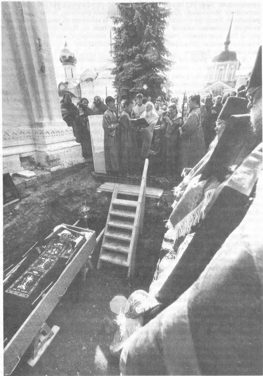
Святейший Патриарх читает молитву преподобному Максиму Греку у открытых святых мошей преподобного перед их поднятием