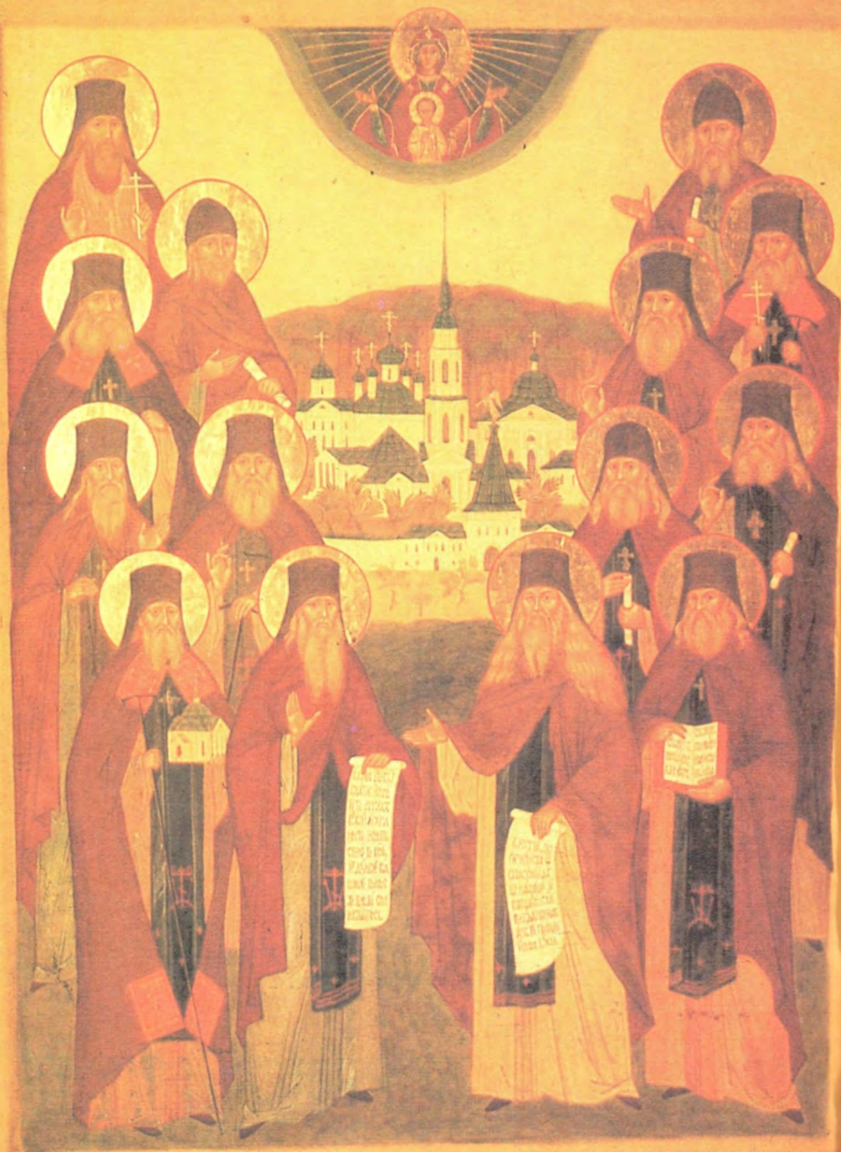
СОБОР ПРЕПОДОБНЫХ ОТЕЦЪ И СТАРЦЕВЪ ОПТИНСКИХЪ