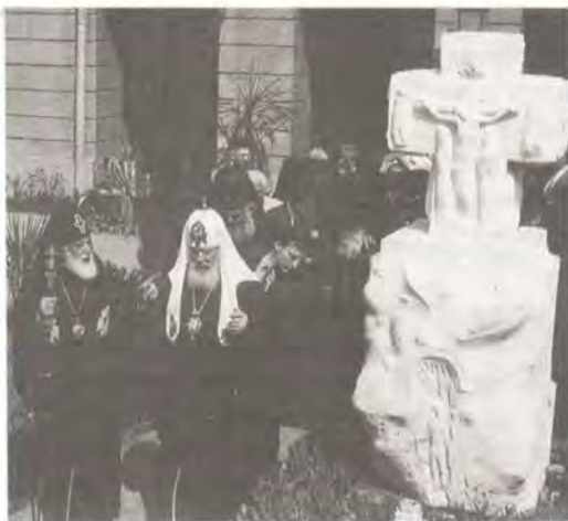
Святейший Патриарх Алексей у резиденции Католикоса-Патриарха всей Грузии Или

В соборе Светицховели была совершена Божественная литургия, возглавленная