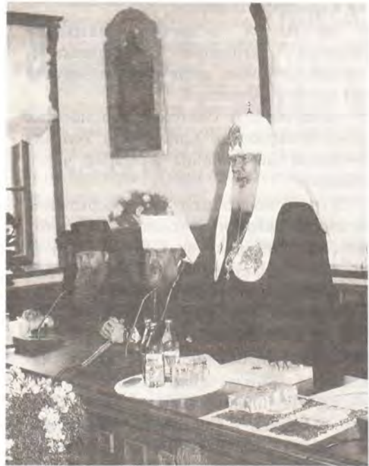
Посещение ОВЦС Святейшим Патриархом Алексием

Его Святейшество приветствовали Председатель Отдела митрополит Кирилл и его заместители. В конференц-зале состоялась встреча Святейшего Патриарха с коллективом Отдела. Митрополит Кирилл от имени собравшихся сердечно приветствовал Предстоятеля Русской Православной Церкви и особо отметил, что призванием Отдела является служение Церкви и помощь ее Первосвятителю и Священному Синоду во всех необходимых вопросах текущей жизни Церкви и ее миссии. К участникам встречи обратился