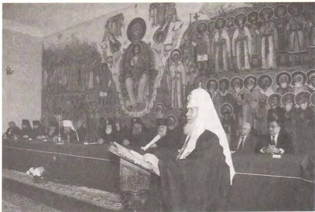
Доклад Святейшего Патриарха Алексия в Тбилисской Духовной академии

На следующий день, 29 апреля, в Тбилисской Духовной академии состоялся торжественный акт, посвященный присуждению Святейшему Патриарху Московскому и всея Руси Алексию II ученой степени доктора богословия honoris causa