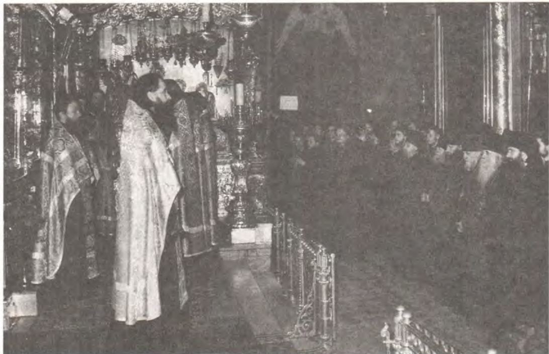
Молебен в Троицком соборе

Сегодня вместе с пастырями Русской Православной Церкви выходят на само-