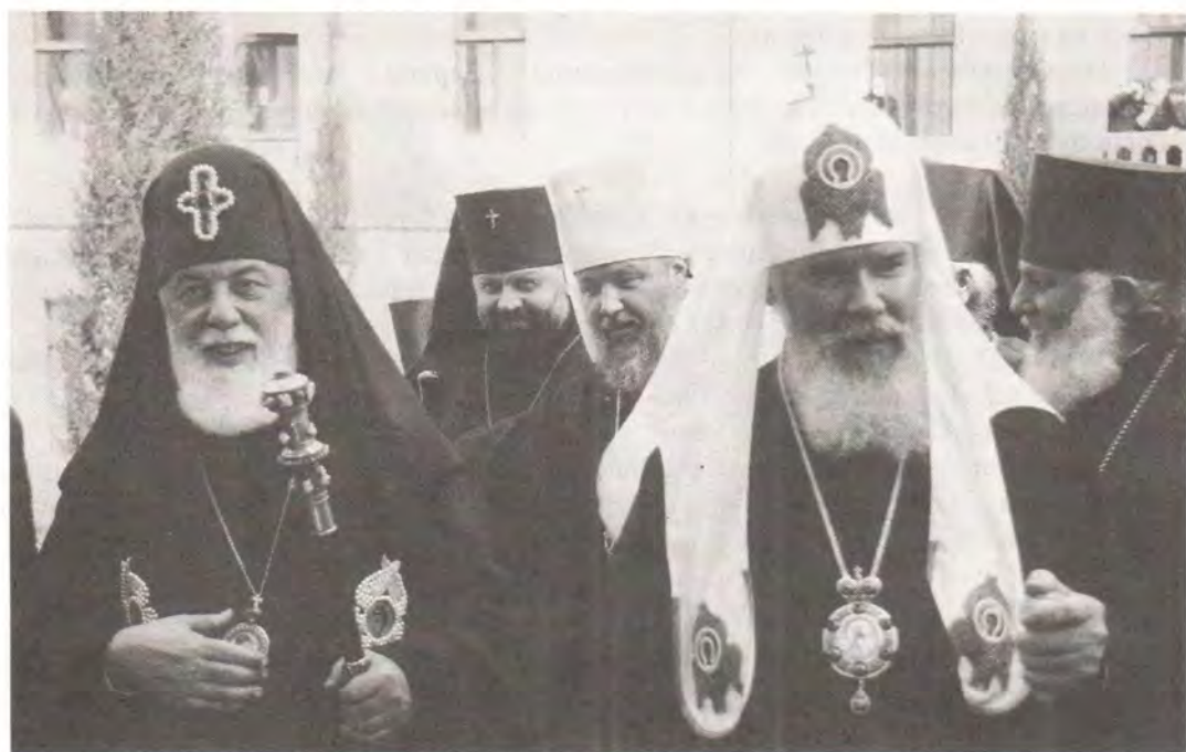
Встреча в аэропорту г. Тбилиси