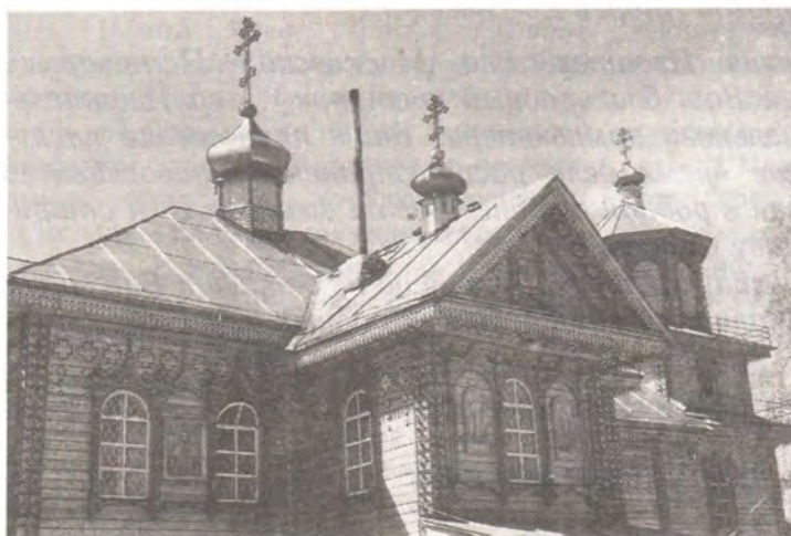
Троицкий храм, п. Темир-Тау (перестроен из жилого дома в 1994 году)