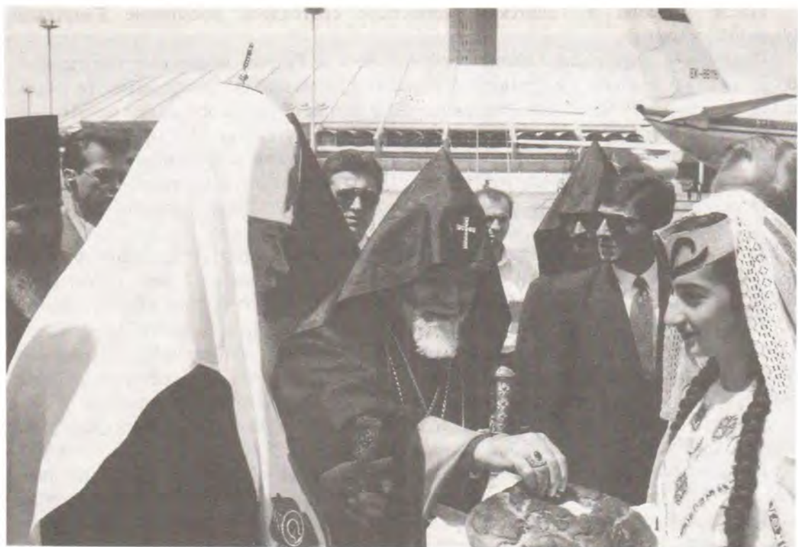
Встреча Святейшего Патриарха в аэропорту г. Еревана

В приветственном Слове Святейший Патриарх Алексий сказал: «Многовековая дружба связывает народы Армении и России... Мы рады, что сегодня, когда Армения приобрела суверенитет, сохраняется близость между нашими народами и Церквями... Историческое разделение между Церквями, произошедшее в 451 году во время Халкидонского Собора, продолжает оставаться незаживающей раной до сих пор. И сейчас мы стремимся ее полностью уврачевать. Мы высоко оцениваем результаты диалога с Нехалкидонскими Церквями. И хотя еще остаются неразрешенными некоторые вопросы, путь к единству открыт».