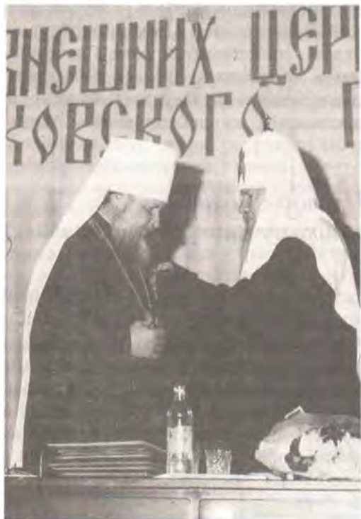
Святейший Патриарх вручает награду председателю ОВЦС митрополиту Кириллу

Святейший Патриарх еще раз поблагодарил тружеников Отдела, особенно