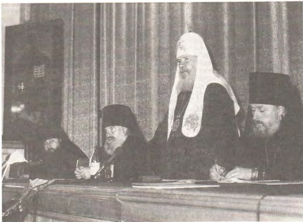
Святейший Патриарх Алексей напутствует выпускников