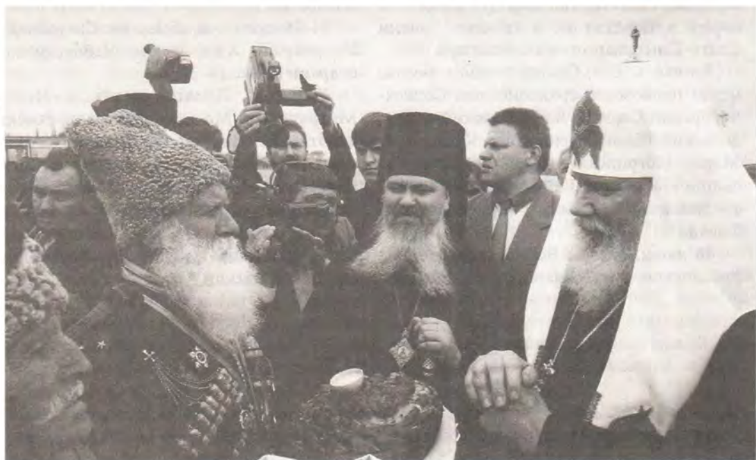
Встреча Святейшего Патриарха в г. Майкопе