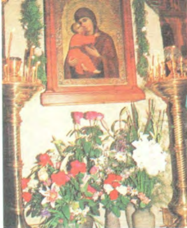
Празднование в честь Владимирской иконы Божией Матери в Сретенском мужском монастыре. Москва, 6 июля 1996 года