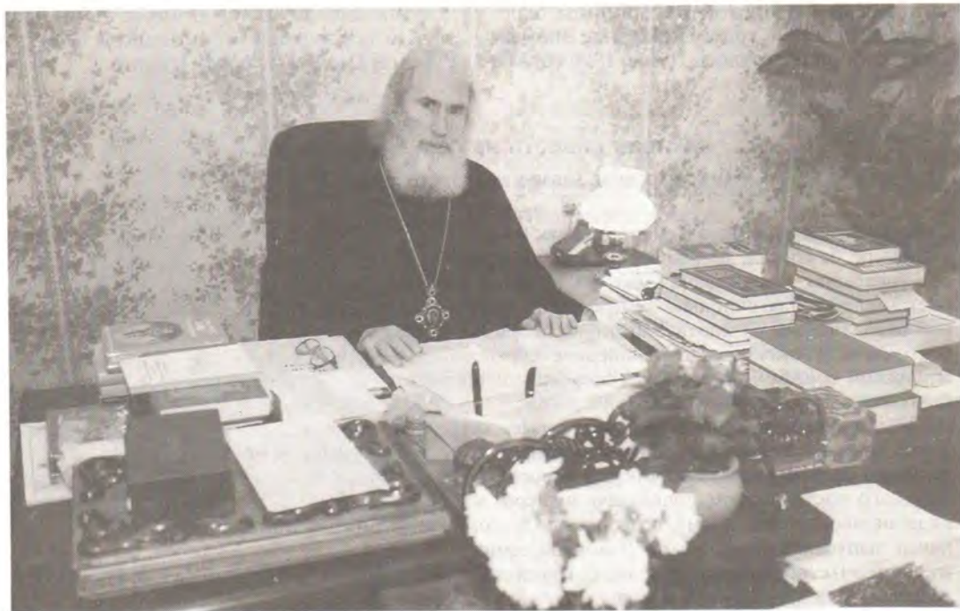
Епископ Софроний в своем кабинете

Возникновение Кемеровской епархии относится к середине 1993 года, когда на заседании Священного Синода Русской Православной Церкви 11 июня было принято решение: «Образовать епархию Московского Патриархата в Кемеровской области, выделив ее из состава Красноярской епархии с последующим утверждением этого решения на Архиерейском Соборе. Временное управление Кемеровской епархией поручить Преподобнейшему Софронию, епископу Томскому, викарию Новосибирской епархии». Он же заседанием Священного Синода от 1–2 ноября 1993 года был утвержден епископом Кемеровским и Новокузнецким.