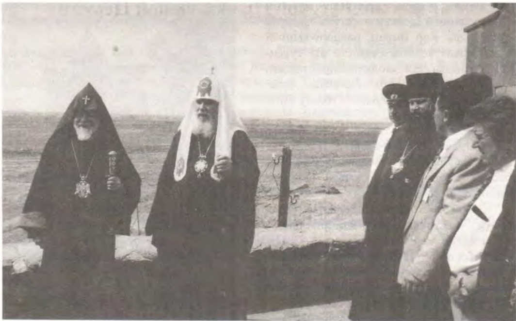
Посещение монастыря Хор Вирап

которые защищали священный Эчмиадзин и эту землю во время русско-персидской войны. На этом месте нашли себе вечное упокоение два полковых священника и свыше полутора тысяч воинов Российской армии... Мы благодарны армянскому народу за то, что он свято сохраняет это место... Мы должны помнить завет Христа Спасителя: «Нет больше той любви, как если кто положит душу свою за друзей своих» (Ин. 15, 13).