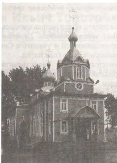
Петропавловский храм г. Салаира (построен в 1907 году)