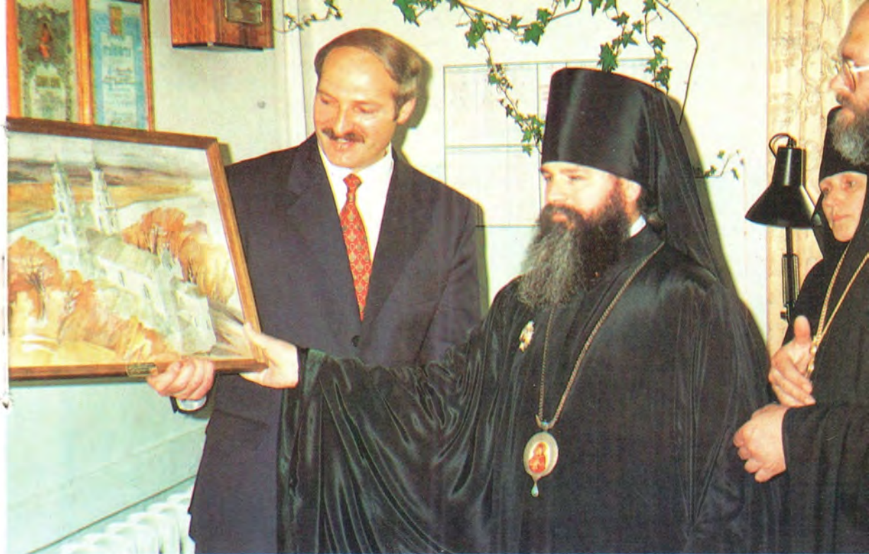
Президент Белоруссии А. Г. Лукашенко во время посещения Минской Духовной семинарии ПРАЗДНОВАНИЕ ДНЯ ПАМЯТИ БЛАГОВЕРНОГО ЦАРЕВИЧА ДИМИТРИЯ в Свято-Димитриевском училище при Первой Градской больнице

Сестры училища у Архангельского собора Московского Кремля