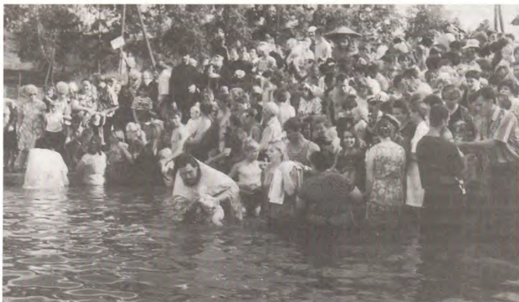
Крещения на Гавриловском водохранилище в Салаире