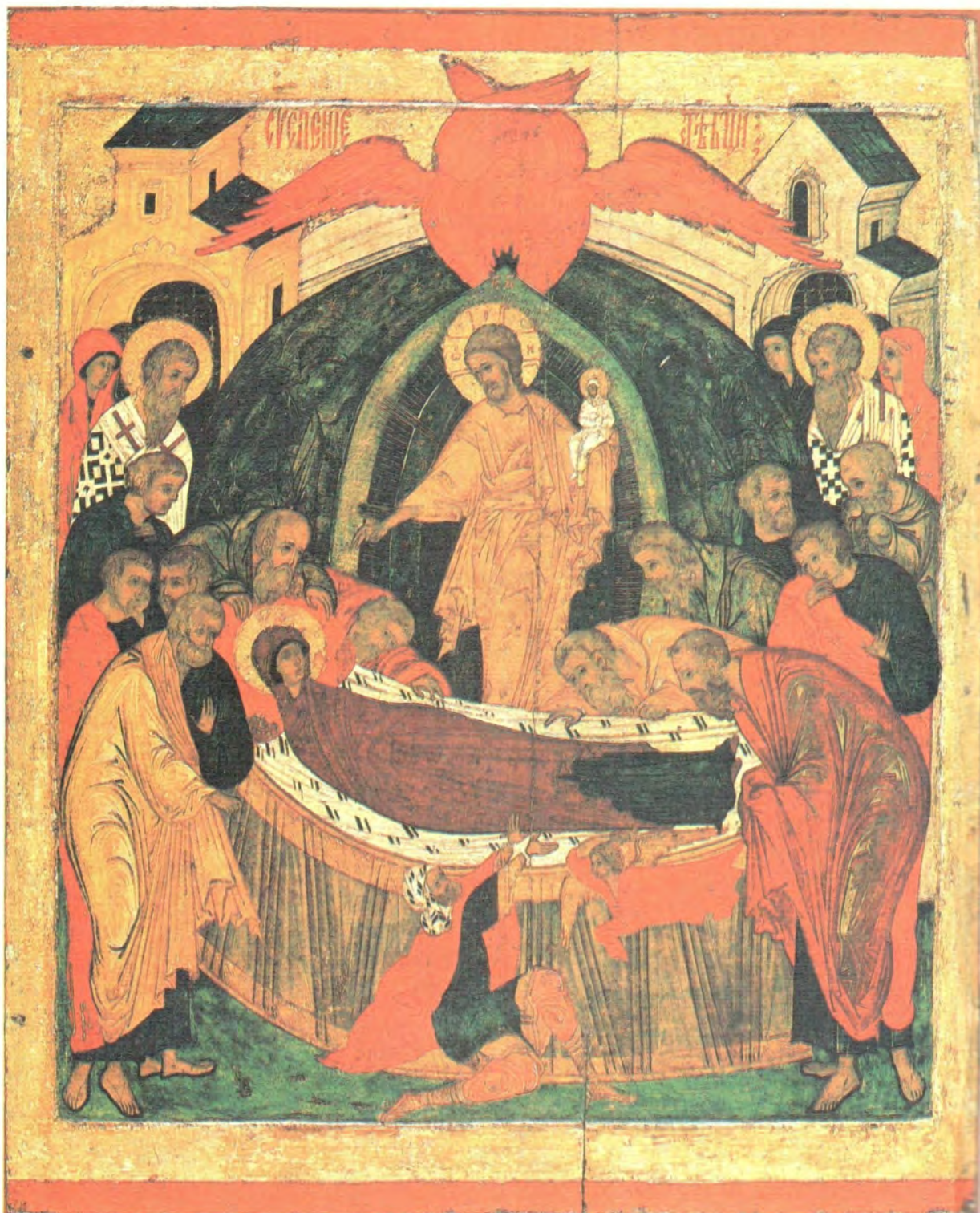
Успение Пресвятой Богородицы. Икона XVI века. Храм во имя апостола Петра и Павла в Кожевниках, Новгород