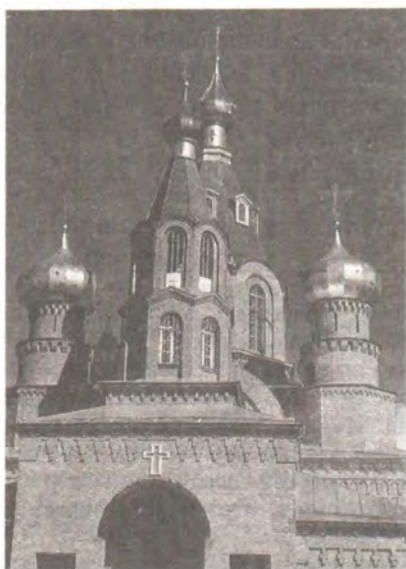
Троицкий храм, с. Красное (построен в 1909 году)