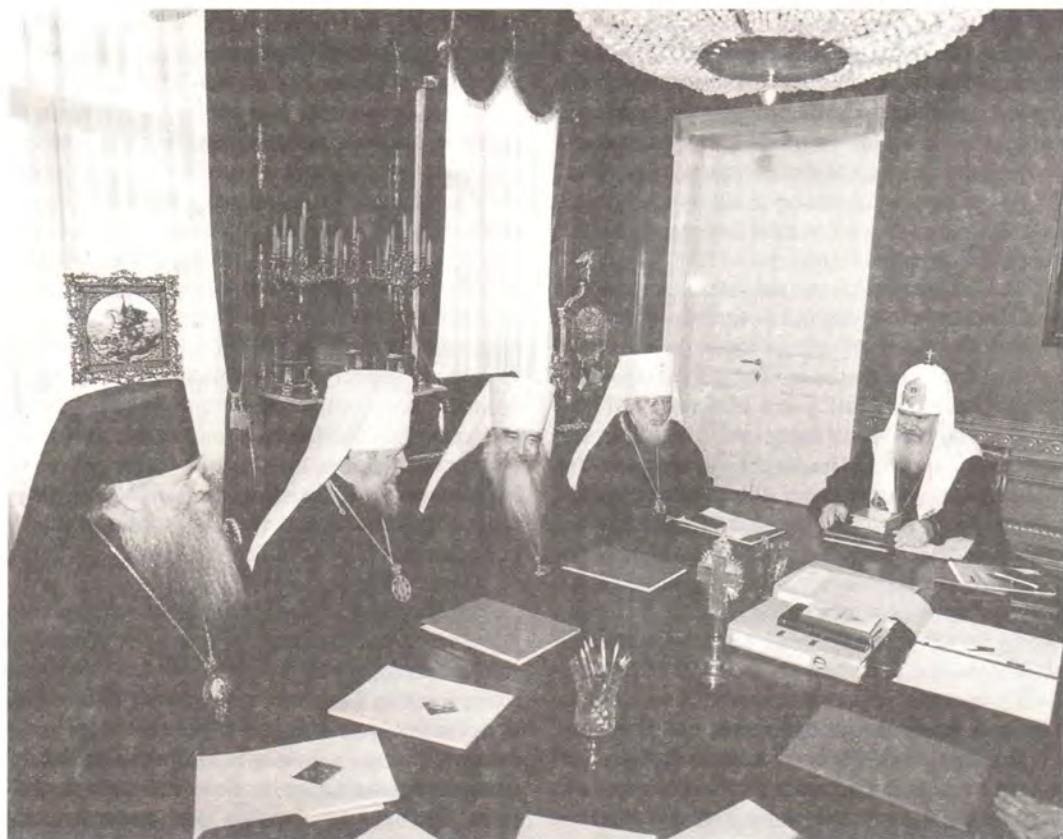
Заседание Священного Синода

Слушали: Доклад Преосвященного митрополита Смоленского и Калининградского Кирилла, Председателя Отдела внешних церковных сношений, о работе сотрудников Отдела и представителей международной христианской организации «Церкви в совместном действии» по созданию и обеспечению деятельности гуманитарной миссии в связи с трагическими событиями в Чечне.