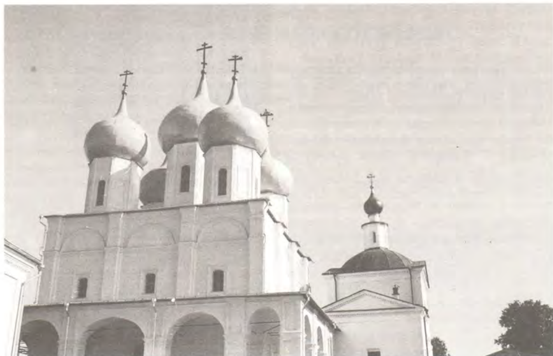
Собор в честь Зачатия Пресвятой Богородицы святой праведной Анной Высоцкого мужского монастыря

Афонского и Сергия Радонежского отнюдь не «портила» монастырский ансамбль, который являлся отражением в камне всей истории государства Российского. Между восточной стеной Покровской и Похвальской церквей и западной частью соборной паперти как бы парил в воздухе над ракой преподобного Афанасия легкий шатровый верх, окаймленный остроконечными кокошниками, увенчанными восьмиконечными крестами.