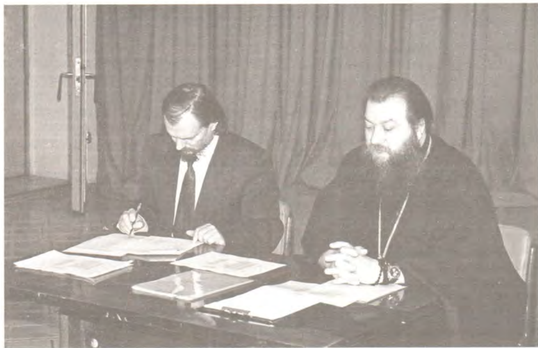
Занятие в Институте церковной журналистики проводит главный редактор Издательства Московской Патриархии епископ Бронницкий Тихон

турному, техническому и художественному редактированию, а также основам корректуры. Отдельные лекции были посвящены звукозаписи, киножурналистике, экономике издательского дела.