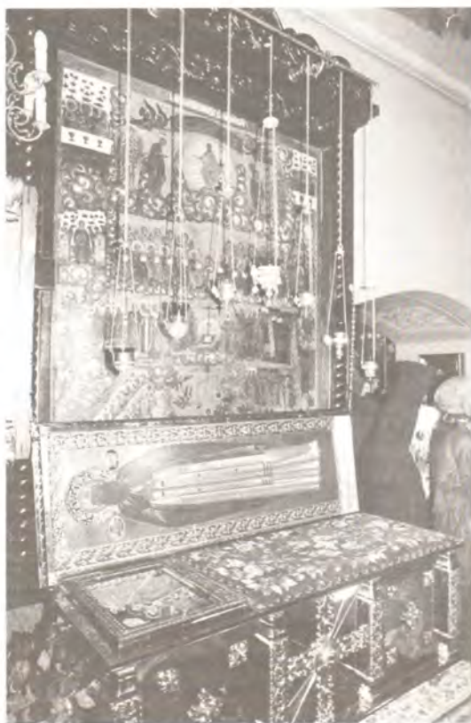
Рака преподобного Афанасия Младшего

Посетители монастыря не видят эту рабочую, прозаическую сторону жизни насельников. Они замечают только, как похорошел монастырь, став украшением города. В свободное время даже неверующие горожане тянутся сюда, чтобы полюбоваться прекрасными видами, открывающимися с холма, на котором расположена обитель. И начинают прозре-