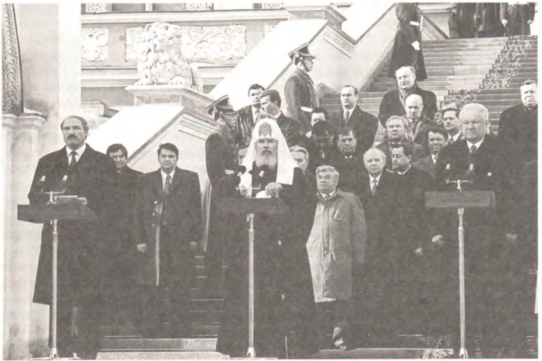
Святейший Патриарх Алексий и Президенты России и Белоруссии у Красного крыльца Грановитой палаты в Московском Кремле

Падают искусственные преграды, мешавшие двум народам сотрудничать в хозяйстве и политике, торговле и культуре, науке и просвещении. Уходит в прошлое средостение, прошедшее через народы и семьи, через души людские, приносившее раздоры и боль.