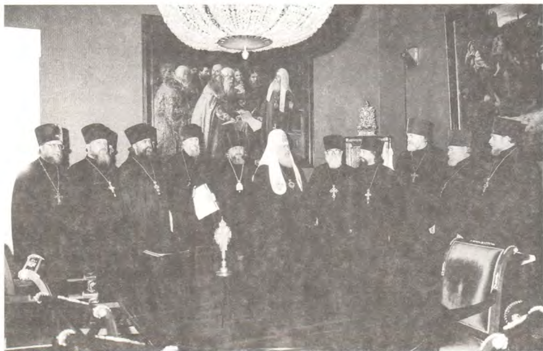
Святейший Патриарх с благочинными города Москвы