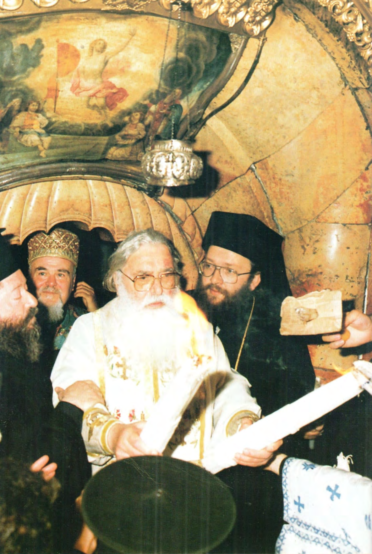
Великая Суббота. Патриарх Иерусалимский Диодор выходит с благодатным огнем из Гроба Господня