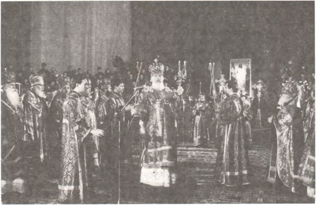
Святейший Патриарх Алексий во время Пасхальной вечерни в Храме Христа Спасителя

став от Гроба, вдохнул в мир дыхание новой жизни, мы этим первым богослужением приносим жизнь, приносим веяние Духа Святого во вновь воздвигнутые стены этого величественного храма.