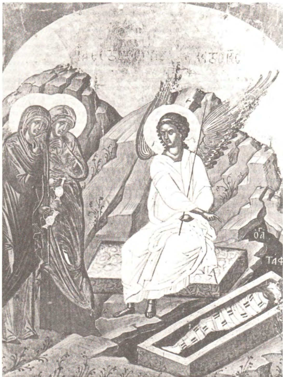
Жены-мироносицы у Гроба Господня