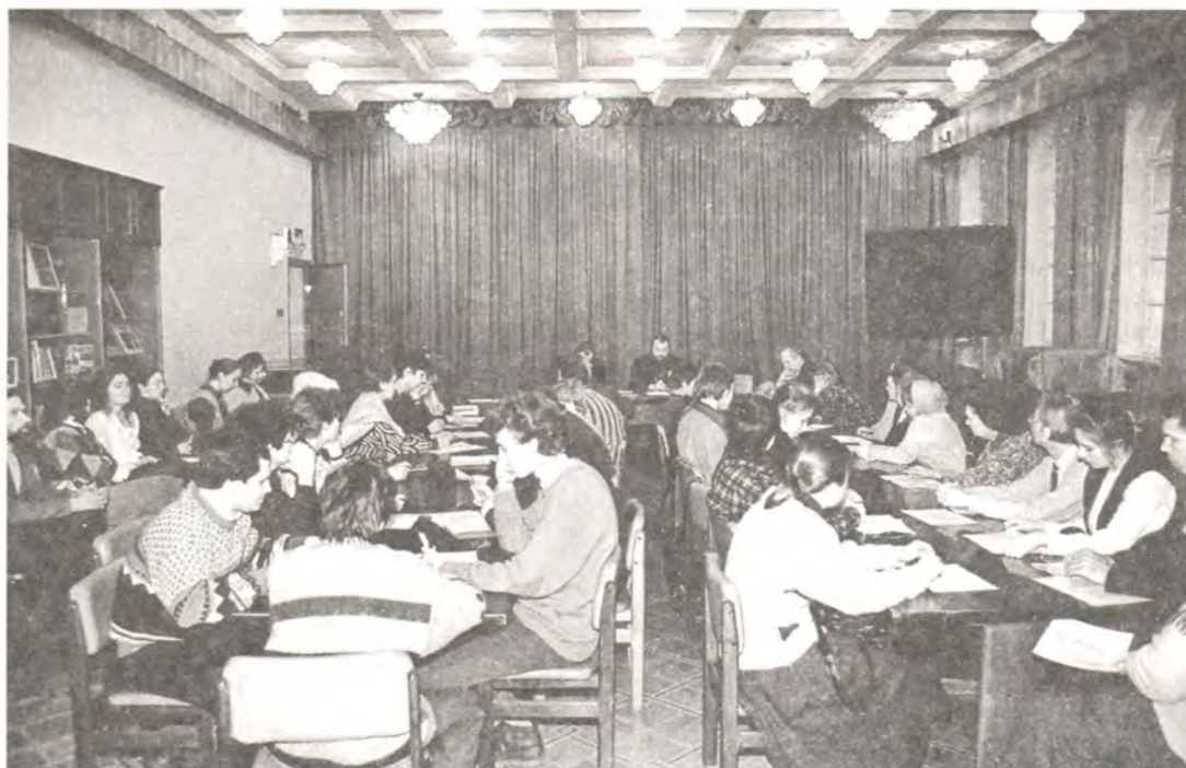
Студенты Института церковной журналистики