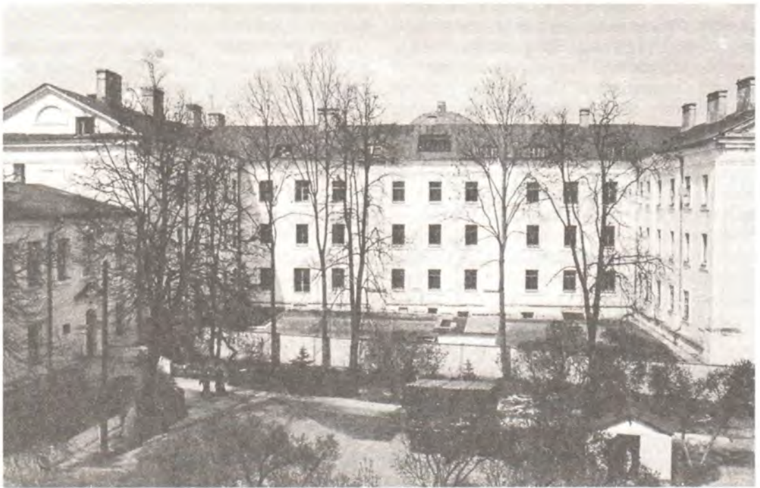
Минская Духовная семинария. Весна 1995 года

И мы переживаем сегодня тяжелые времена. Жестокий кризис, вызванный разделением, коснулся всех аспектов нашей жизни. Не обошел он стороной и Жировичи. В семинарии то тепла нет, то месяцами студенты и преподаватели страдают без воды. Помимо нашей воли и желания, идет испытание на стойкость, на умение учить и учиться в любых условиях. Как тут не вспомнить голодных, срывавших колосья учеников Сына Божия и богатого юношу, отказавшегося следовать за Христом. Некоторые искушаются бедностью и забитостью белорусского народа и соблазняются силой и богатством Ватикана или протестантских Церквей Запада. Горе и позор нам, если мы будем стыдиться поруганной и разоренной за 70 лет большевистского безбожия нашей Матери Русской Православной Церкви, которая в то время дала Богу больше святых мучеников, чем весь мир за все века гонений на христианство.