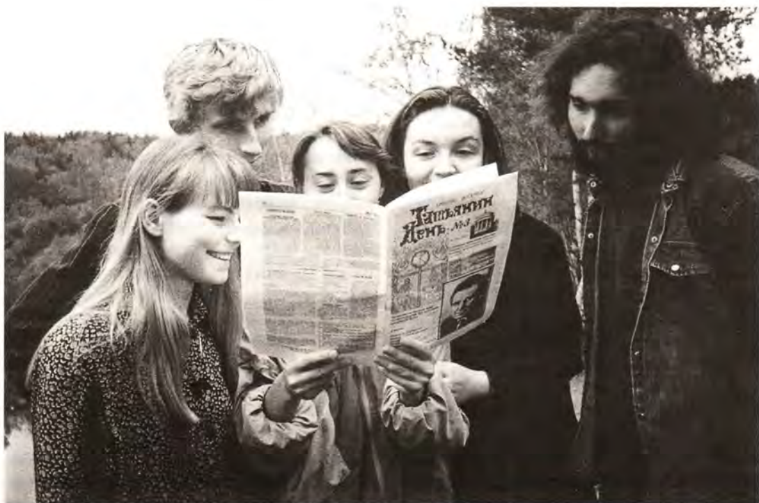
Паломническая группа из Московского университета в Пеково-Печерском Свято-Успенском монастыре

Сознание в университете, надо сказать, постепенно меняется. Уже несколько лет в программе нет дисциплины под названием «научный атеизм»: теперь студенты изучают религиоведение. Большинство преподавателей сочувствуют Православию и пытаются что-то передать своим питомцам, но, увы, не всегда благие намерения приводят к благим результатам. Не так давно, например, руко-