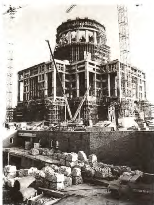
Строющийся Храм Христа Спасителя. Октябрь 1995 года

Мы видим, что есть у нас мастера и есть таланты. И вопрос, нужно ли строить Храм Христа Спасителя, так настойчиво поднимавшийся в средствах массовой информации, отпал сам собой – он уже построен. Кстати, те же средства массовой информации старательно убеждали и убеждают нас в нашей беспомощности и неспособности