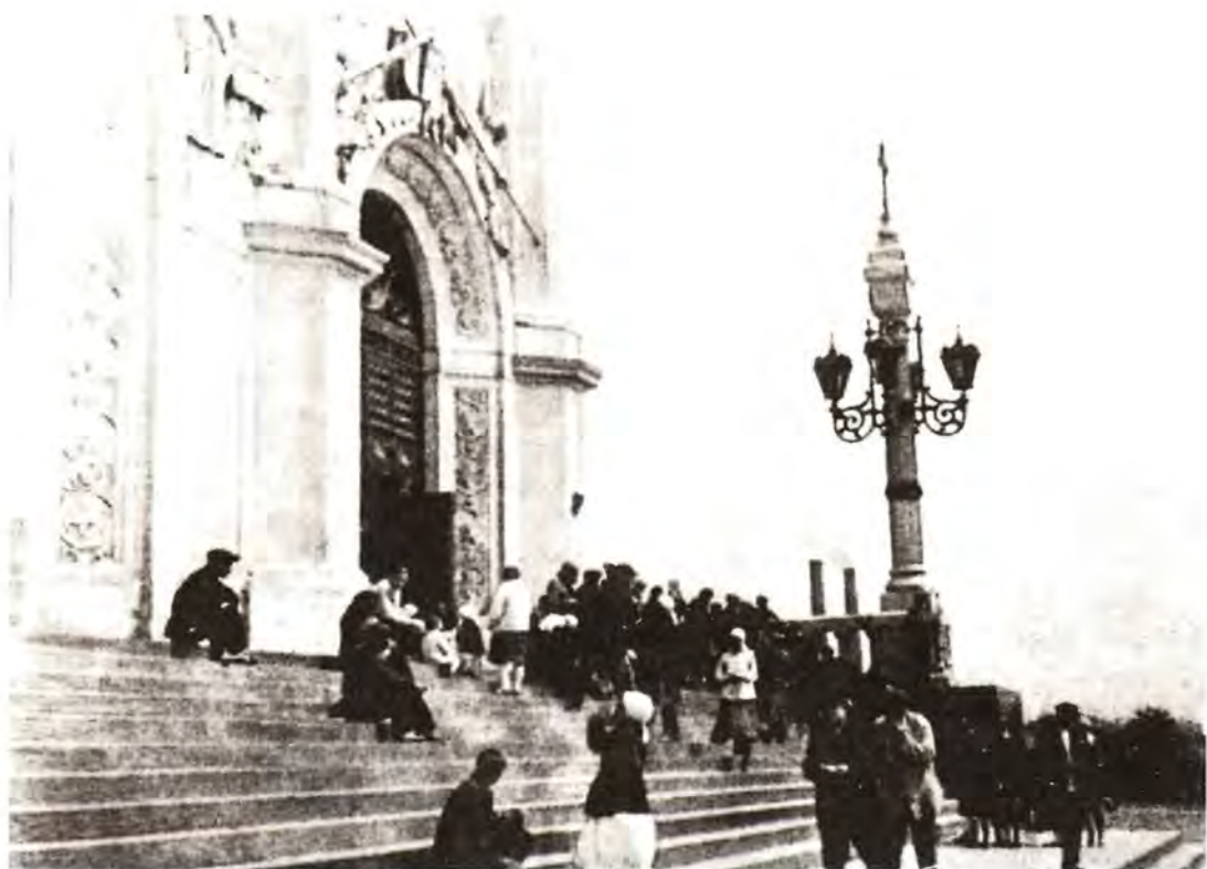
На ступенях Храма Христа Спасителя. 1920-е годы

Так как Храм Христа Спасителя, согласно воле царя-завещателя, должен быть памятником религиозным, благодарственным, ясно свидетельствующим о Божественном заступлении за русский народ в Отечественную войну 1812 года, и вместе с тем памятником историческим, на котором неизгладимыми чертами изображены славные деяния предков, то на всех четырех стенах Храма помещены священо-исторические изображения, напоминающие или имеющие тождество с событиями Отечественной войны 1812 года, и фигуры святых заступников и молитвенников за Русскую землю, некоторых отечественных деятелей, потрудившихся для утверждения и распространения православной веры, а также и князей русских, положивших свою жизнь за свободу и целостность Русской земли. Выбор сюжетов был предоставлен по Высочайшей воле Преосвященному Московскому митрополиту Филарету, который в 1844 году и произвел все назначения.