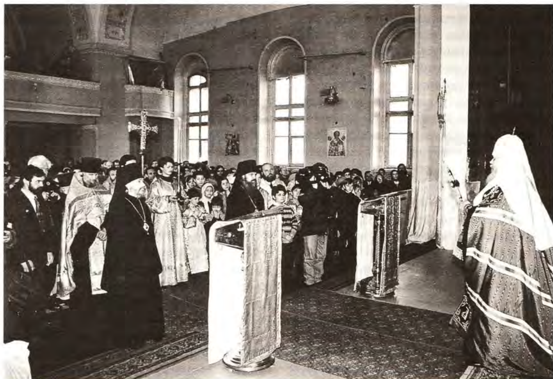
25 января 1996 года. Молебен в храме святой мученицы Татианы

водитель семинара по религиоведению предложил студентам, желающим сдать зачет, выучить наизусть «Отче наш» и «Верую». Казалось бы, прекрасная идея – ведь в святоотеческих сочинениях описаны случаи, когда и не вполне осмысленное призывание Имени Божия являлось спасительным. Но педагог не учел, что далекие от Церкви «юные дарования» легко могут превратить святые слова в повод для кощунственных насмешек и богохульства, упражняясь друг перед другом в остроловии... Серьезный повод задуматься для тех, кто надеется на «массовый эффект» религиозного просвещения.