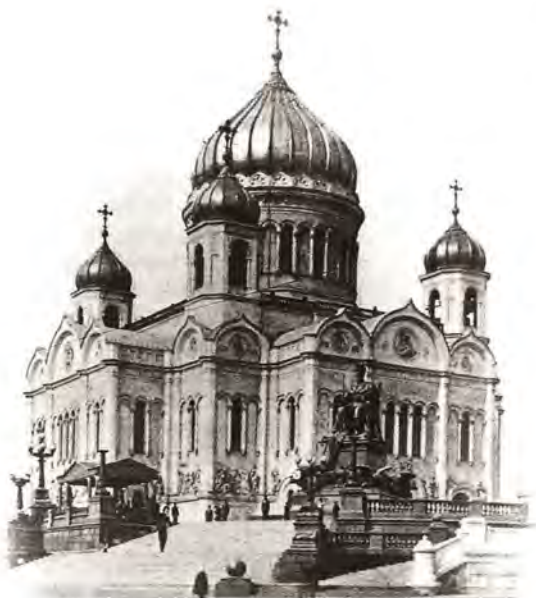
Вид Храма Христа Спасителя со стороны Кремлевской набережной. На переднем плане – памятник Александру III