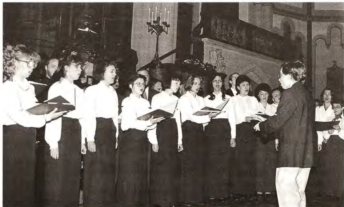
Выступление церковного хора из Костромы в соборе Мюнстер, Бонн

В ответном слове Святейший Патриарх Алексей поблагодарил за приглашение посетить Германию и оказанный добрый прием, за возможность обратиться от лица паствы Русской Православной Церкви к католическим верующим Германии со словами христианской любви. Его Святейшество подчеркнул, что русский народ никогда не отождествлял немецкий народ и нацизм, в победу над которым внесли свой весомый вклад и религиозные деятели Германии. Святейший Патриарх дал высокую оценку богословскому диалогу между Русской Православной Церковью и Германской Епископской Конференцией, выразил глубокую благодарность католическим немецким организациям за гуманитарную помощь нуждающимся россиянам, оказываемую через Русскую Православную Церковь. Он поблагодарил также ректора Института Восточных Церквей в Регенсбурге монсеньора д-ра Альберта Рауха, монсеньора д-ра Николая Вирволя и их коллег за помощь нашей Церкви: