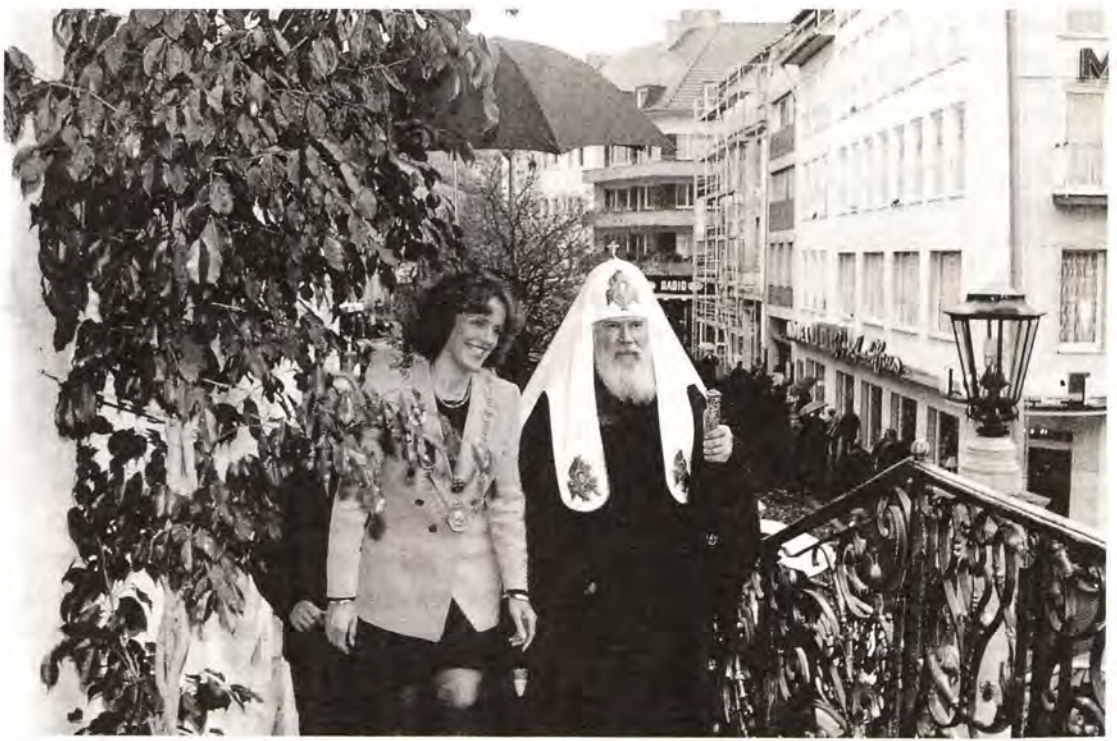
Святейший Патриарх Алексей и бургомистр г. Бонна г-жа Дикманн поднимаются в городскую ратушу

тейший Патриарх Алексей, о людях, живущих подчас на территории многовекового исторического расселения русских, где они до сих пор составляют подавляющее большинство населения и, несмотря на это, подвергаются политической, экономической и культурной дискриминации. В ряде государств их понуждают к выезду, который обычно сопряжен с оставлением нажитого трудами поколений имущества. Попытки поставить русских в юридическое или фактическое неравноправие идут вразрез с действующими международными стандартами и оказывают негативное влияние как на взаимоотношения новых независимых государств с Россией, так и на международную обстановку в целом.