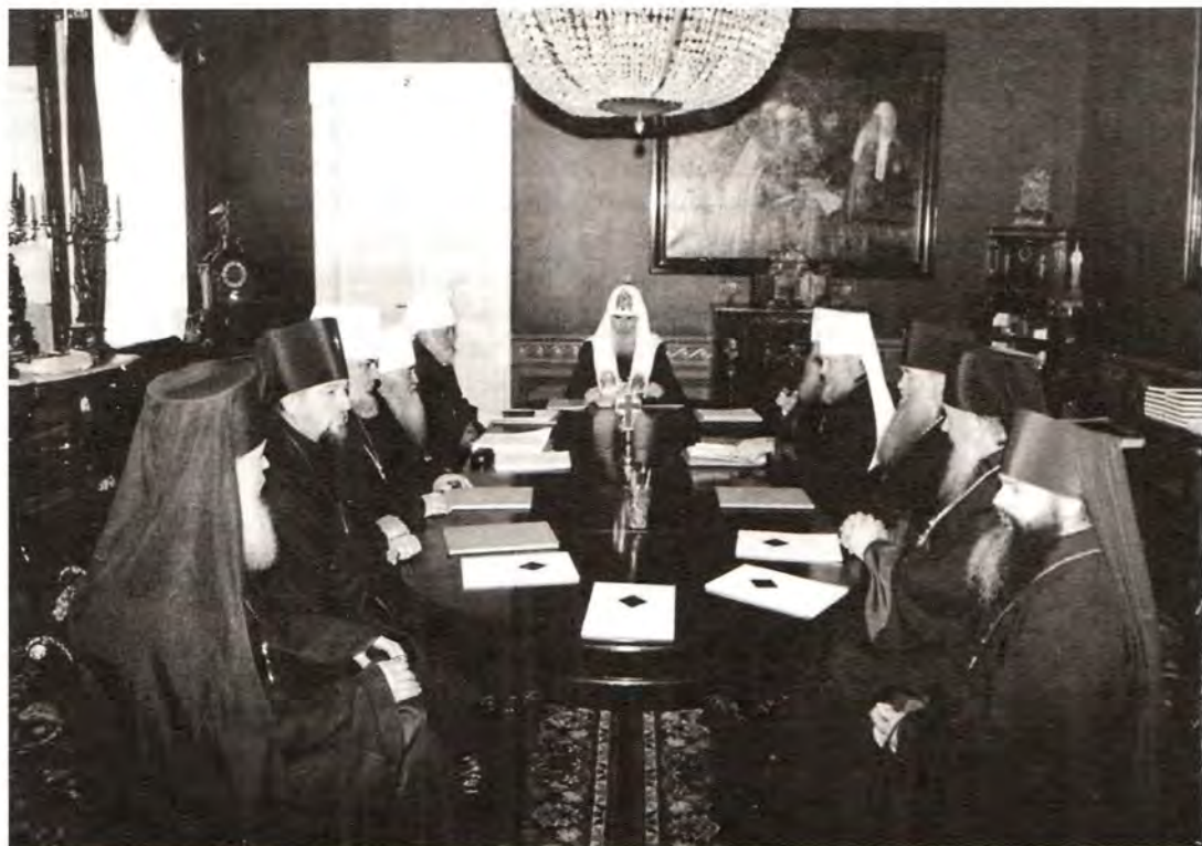
Заседание Священного Синода 26 декабря 1995 года