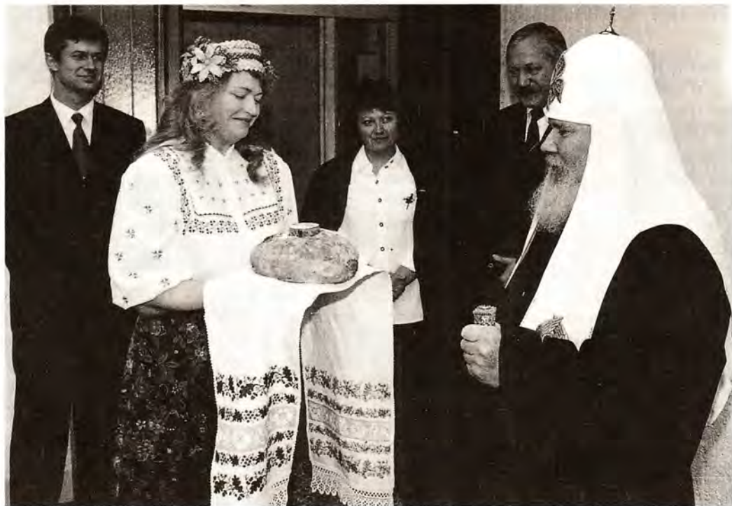
Встреча Святейшего Патриарха в Покровском храме, Дюссельдорф

Церквами и народами. Существенные заслуги в этом деле принадлежат всем архипастырям и пастырям, которые несли свое служение на немецкой земле и окормляли православных верующих, верных чад Московского Патриаршего престола. Завершая молитвенное общение, Святейший Патриарх Алексий пожелал всем присутствующим не ослабевать в любвеобильном открытии друг другу своих сердец.