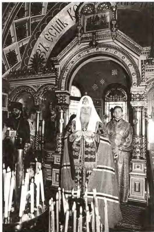
Святейший Патриарх Алексий произносит слово в православном Воскресенском кафедральном соборе, г. Берлин

но» изготовило новый металлический престол, Святейший Патриарх Алексий передал его в дар собору и совершил на нем первую литургию.