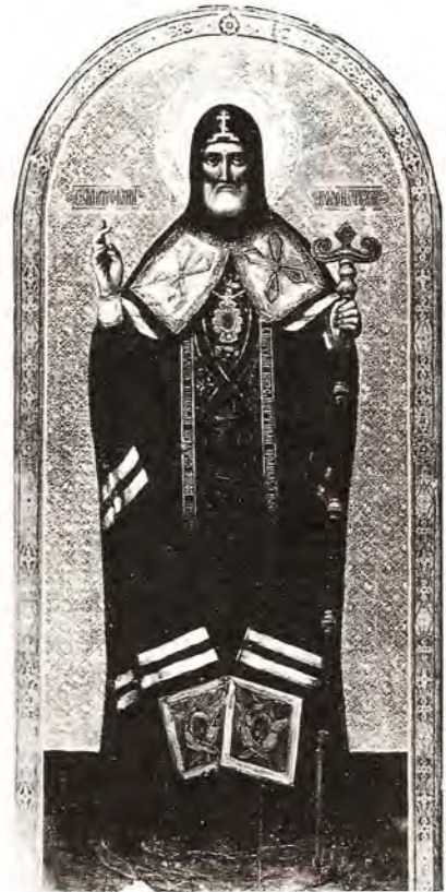
Святитель Митрофан, епископ Воронежский