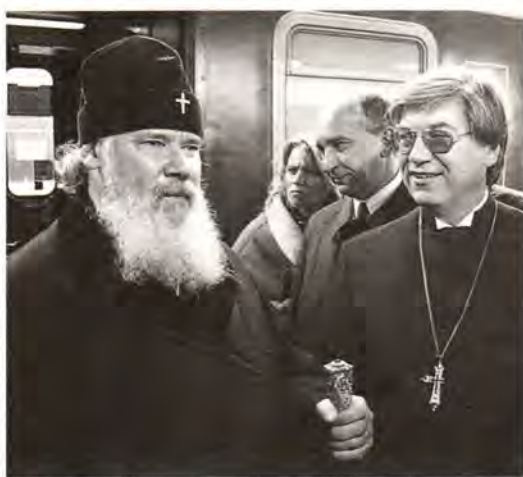
Отъезд Святейшего Патриарха Алексия в г. Ганновер

Непосредственно после этого состоялась встреча Святейшего Патриарха с представителями евангелических структур, организующих участие германской стороны в восстановлении храмов в городах-побратимах в России и в осуществлении различных форм диаконического служения. По завершении этой встречи Святейший Патриарх и сопровождающие его представители Русской Православной Церкви присутствовали на молитве в евангелическом храме Хорренхаузер. Молитва была посвящена жертвам Второй мировой войны. В своем слове на этом богослужении Святейший Патриарх Алексий сказал: «Мы молимся о миллионах павших на полях сражений, погибших в