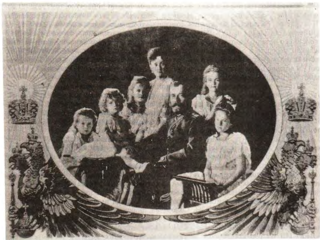
Государь Император Николай II и Его Семья

быть открытыми для их изучения как отечественными, так и зарубежными учеными, желающими и могущими внести свой вклад в решение данной проблемы. Пока высказываются какие-либо сомнения в отношении результатов исследований, нельзя приступать и к вопросу об официальном захоронении. Указывалось также на необходимость дать заключение по вопросу о так называемых «ритуальных убийствах», ибо оставление без внимания этой темы чревато вспышкой антисемитских настроений. В качестве возможного места захоронения указывался Санкт-Петербург.