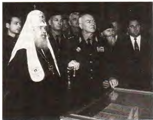
Святейший Патриарх Алексий в сопровождении начальника Академии Генерального штаба генерал-полковника И. Н. Родионова, военных и духовенства осматривает музей Академии

Но не только данью исторической памяти и восстановлению связи поколений стала первая служба Божия в стенах Академии Генштаба для солдат, офицеров и генералов, многие из которых находятся в самом начале пути к вере. Литургия в этот день была в буквальном смысле слова «общим делом»: Господь, по молитвам святого Архистратига Михаила, зримо осенял благодатью присут-