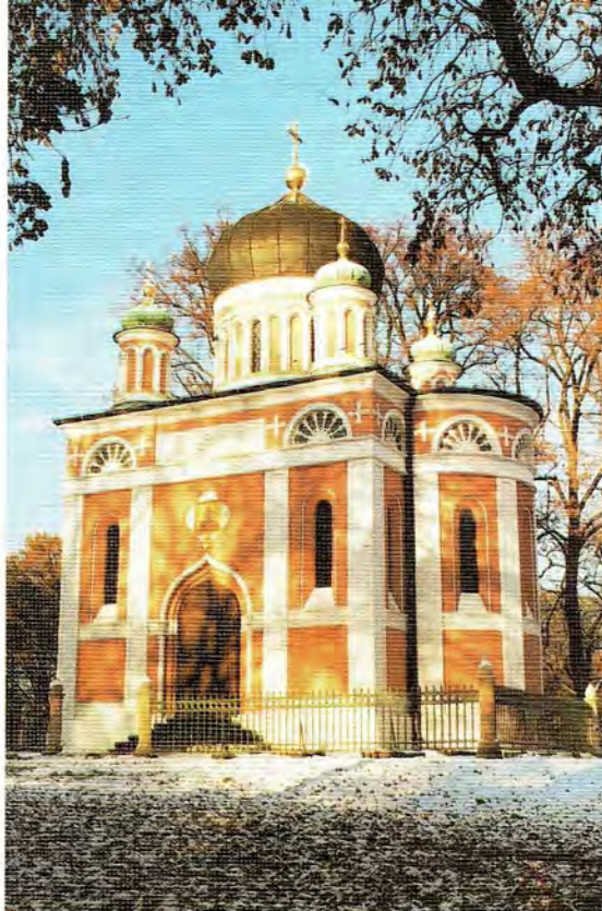
Храм во имя святого благоверного князя Александра Невского, г. Потсдам