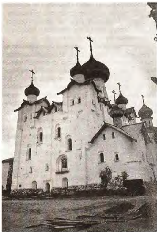
Спасо-Преображенский собор Соловецкого монастыря

Обычно, когда группа православных верующих собирается в паломническую поездку, она должна обратиться с просьбой принять ее в обители. В нашем монастыре есть человек, который занимается паломниками, он и рассматривает письма, определяя время посещения Соловков. Ответное письмо служит приглашением. Вместе с ним высылается специальная памятка. По древней традиции, паломников в течение трех дней, бесплатно кормят и размещают на ночлег. Если же они намерены прожить на острове длительное время, то должны, по благословению,