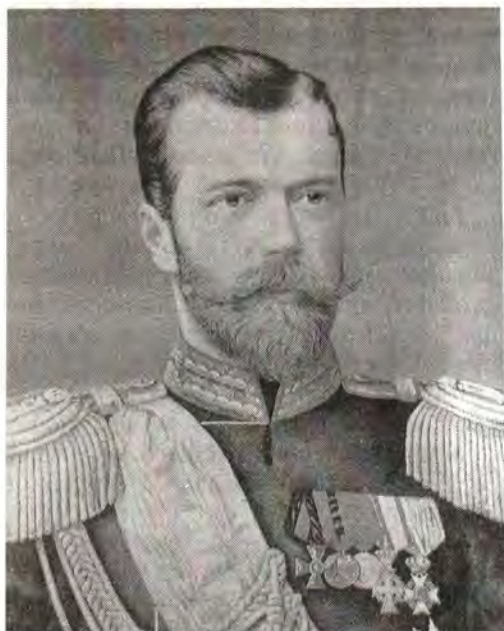
Государь Император Николай Александрович