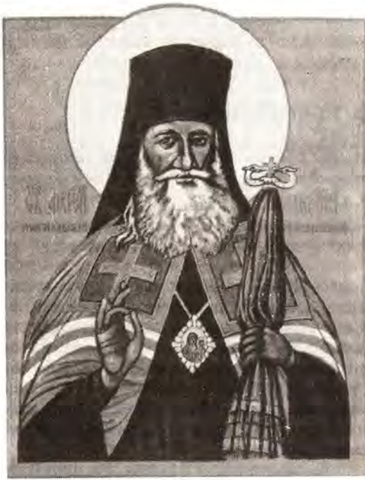
Святитель Могилевский и Белорусский Георгий

вызванного годами угнетения и гонений на Православие. «Подъехавши к Могилеву, — писал он, — я прежде всего узрел свою кафедру по великому безобразию ее сравнительно с римскими костелами... Она была жалка, угнетена и зело страждуща». Помимо разрухи и нищеты приходов, ученый архипастырь столкнулся с духовным невежеством не только своей паствы, но и пастырей, незнакомых даже с основами священнического делания.