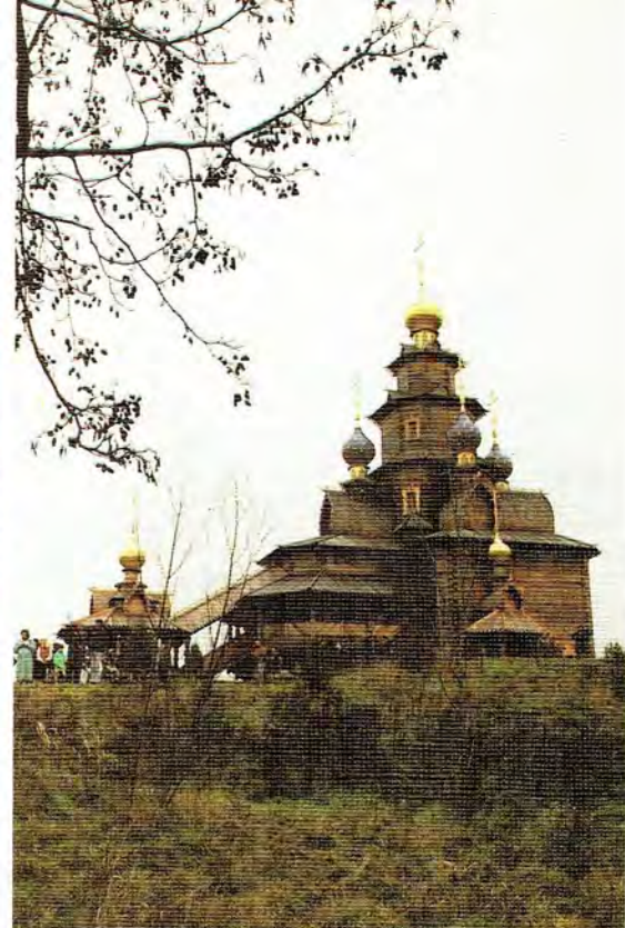
Новопостроенный храм во имя Святителя Николая Чудотворца, г. Гифхорн