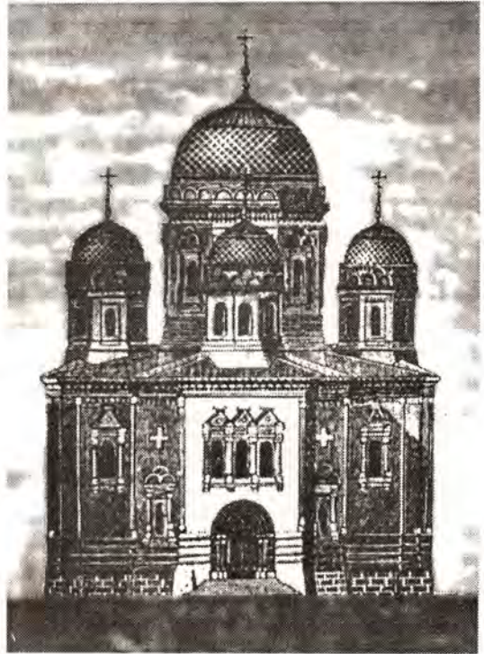
Александр-Невский храм в Акатовском женском монастыре

В 1891 году в Троицкий храм были привезены с Афона, из русского Пантелеимонова монастыря, икона Божией Матери «Скоропослушница» и икона святого великомученика и целителя Пантелеимона, которые стали главными святынями Акатовской общины. В обители установили правило каждый день читать Акафисты перед этими иконами. В 1894 году в монастырь были привезены списки Боголюбской иконы Божией Матери и Всемилоственного Спаса.