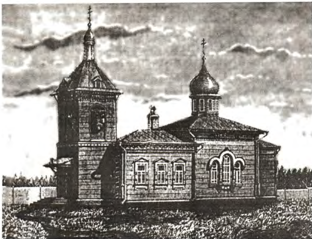
Свято-Троицкий храм в Акатовском монастыре

князя Александра Невского. Строительство его продолжалось почти шесть лет.