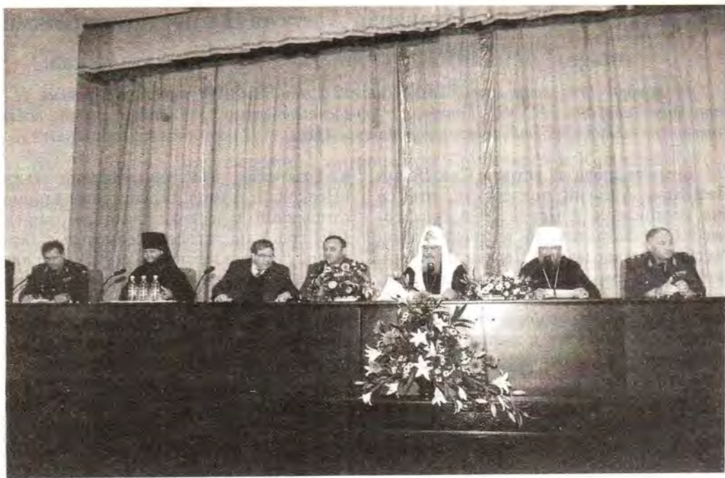
Святейший Патриарх Алексей на встрече с представителями Вооруженных Сил России

Красногорский Савва, Святейший Патриарх Алексей сказал, что залогом успеха в продолжении этого благого дела, начатого ранее под руководством митрополита Смоленского и Калининградского Кирилла в Отделе внешних церковных сношений, является вся история Государства Российского и наша вера в будущее России, строить которое невозможно без опоры на прекрасные и благородные традиции предков. Так, воссоздаваемый ныне Храм Христа Спасителя, символ русской государственности, памятник победы в Отечественной войне 1812 года, будет хранить имена всех воинов, которые с тех времен и до наших дней положили жизни свои на полях сражений, защищая Отечество.