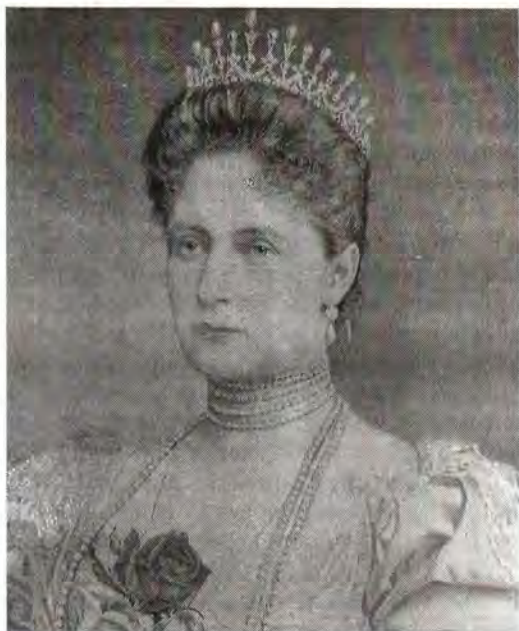
Государыня Императрица Александра Феодоровна

На этом заседании было принято решение продолжить исследования. Был также поднят вопрос об эксгумации останков Великого Князя Георгия Александровича. Было отмечено, что принятие такого решения – это прерогатива Прокуратуры.