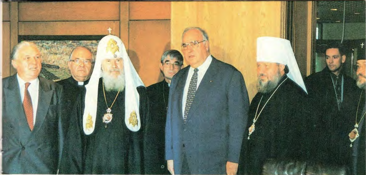
Встреча Святейшего Патриарха Алексия с федеральным канцлером ФРГ г-ном Гельмутом Колем