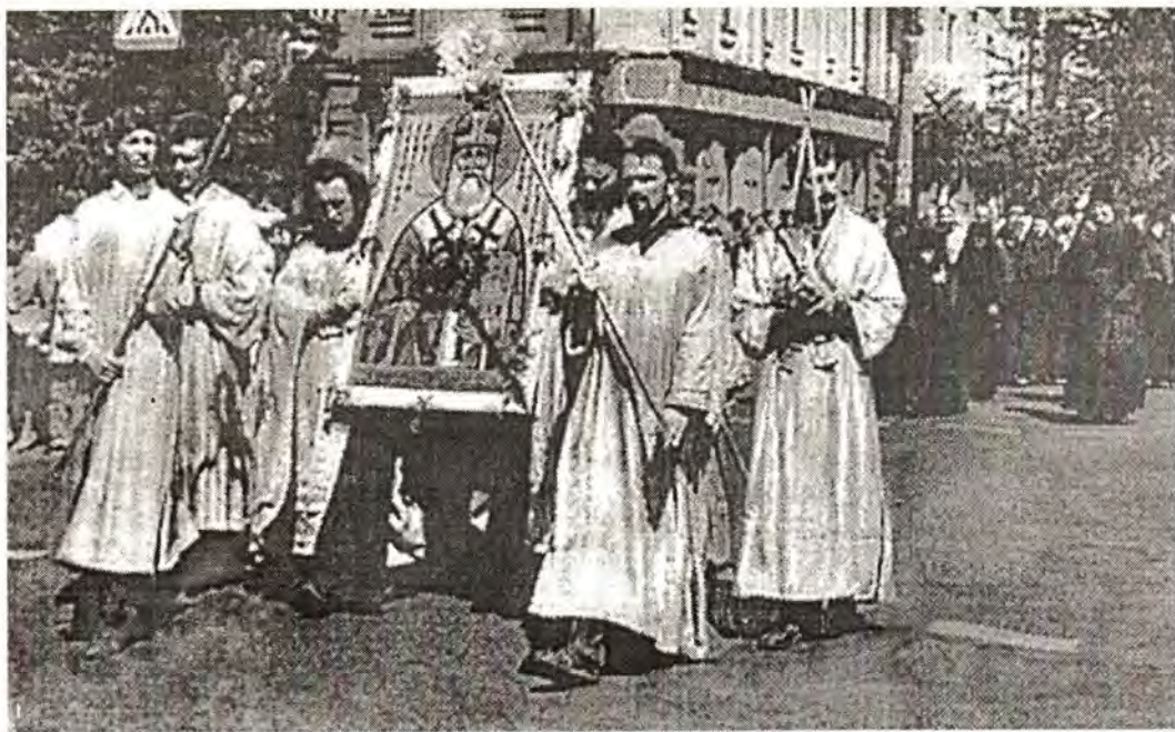
Крестный ход к месту подвигов святителя Георгия

ва окормляемой им паствы, добиваясь возвращения отобранных униатами храмов и монастырей, стремясь предоставить возможность добровольного возвращения в лоно Матери-Церкви всем тем, кто был насильно обращен в униатство или католичество. Деятельность святителя, особенно его проповеди, его Послания к желающим воссоединиться с Православием, разосланное по всей Белой Руси, привело к тому, что многие приходы вместе со священниками вновь обращались к Православной Церкви. Только в 1773–1775 годах благодаря его усилиям в лоно Матери-Церкви возвратились более 112 тысяч униатов.