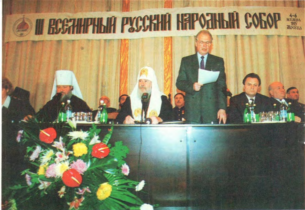
Открытие III Всемирного Русского Народного Собора Святейший Патриарх Алексий в новоосвященном домовом храме в Академии Генерального штаба