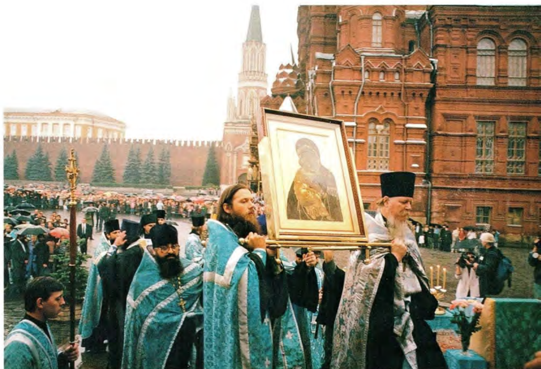
Крестный ход с Владимирской иконой Божией Матери