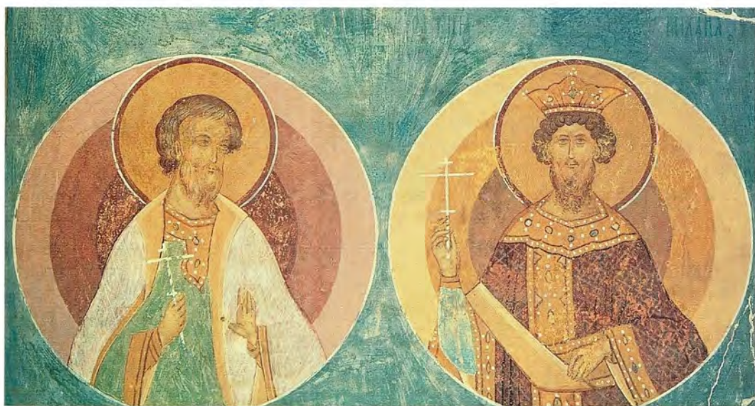
Святой благоверный князь Михаил Черниговский и боярин его Феодор Фреска Рождественского собора Ферапонтова монастыря. Дионисий. 1500-1502 гг.