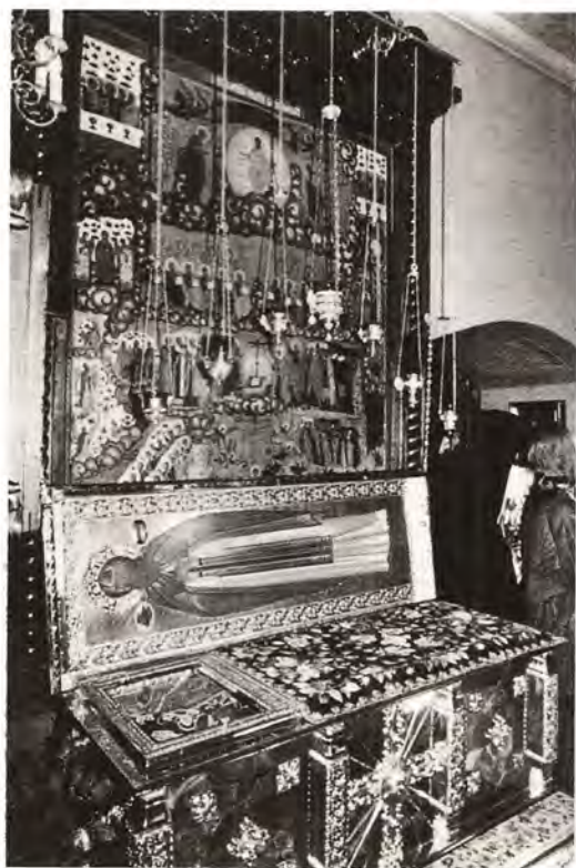
Рака с мощами преп. Афанасия Младшего, 2-го игумена Высоцкого мужского м-ря в Серпухове

цу по окончании вечернего богослужения перед ними братией монастыря совершается молебен с Акафистом преподобному Афанасию.