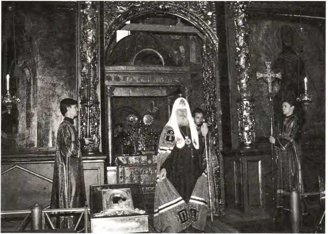
Святейший Патриарх Алексей совершает Божественную литургию в Архангельском соборе Кремля 3 октября 1995 года, в день 750-летия мученической кончины князя Михаила Черниговского и боярина Феодора

Сторожевский монастырь в г. Звенигороде, Московская епархия, и совершил молебен в соборе обители.