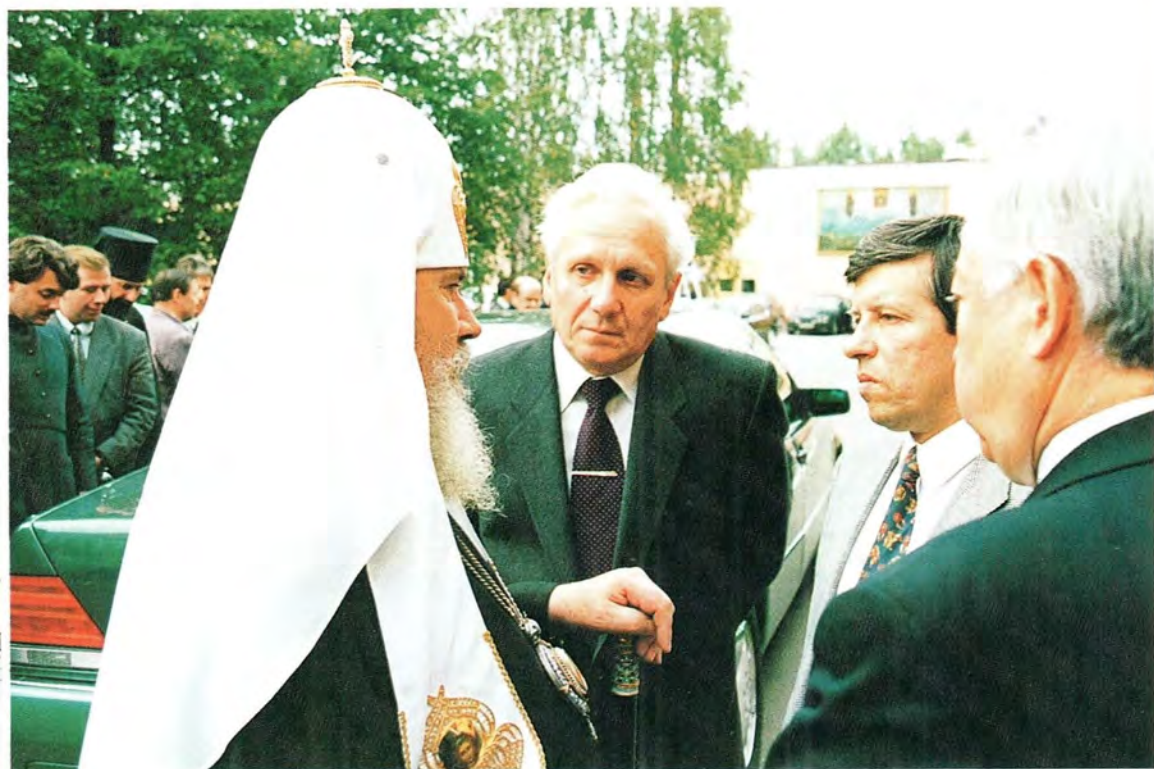
Святейший Патриарх Алексий II беседует с почетными гостями – руководителем Администрации Президента РФ Филатовым С.А. (верхний снимок) и заместителем Председателя Правительства РФ Яровым Ю.Ф. (нижний снимок).