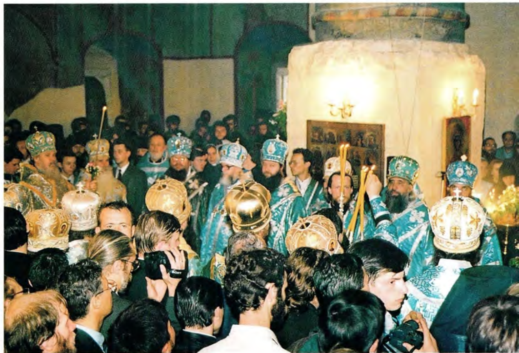
Торжественное богослужение в Сретенском монастыре