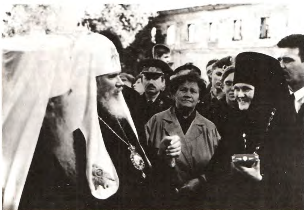
Посещение Святейшим Патриархом Алексием II Владычного женского монастыря в Серпухове

XVI века. За ним сохранилось старинное местное название – Никола Белый. Святейший Патриарх Тихон утвердил за ним наименование собора, в 20-е годы храм стал кафедральным, а в 1929 году был закрыт. В апреле 1995 года Указом митрополита Крутицкого и Коломенского Ювеналия храм передан в качестве подворья Высоцкому монастырю. Подворьями этой обители стали и Ильинский, и Успенский храмы, которые также посетил Святейший Патриарх Алексий.