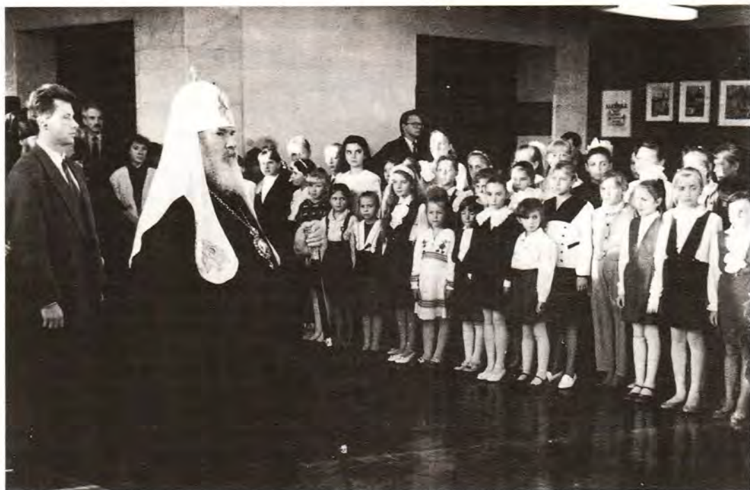
Юные серпуховчане приветствуют Святейшего Патриарха Алексия

жителей города, верят ли они, что он будет восстановлен, и все с оптимизмом говорили мне: "Будет восстановлен, и скоро".