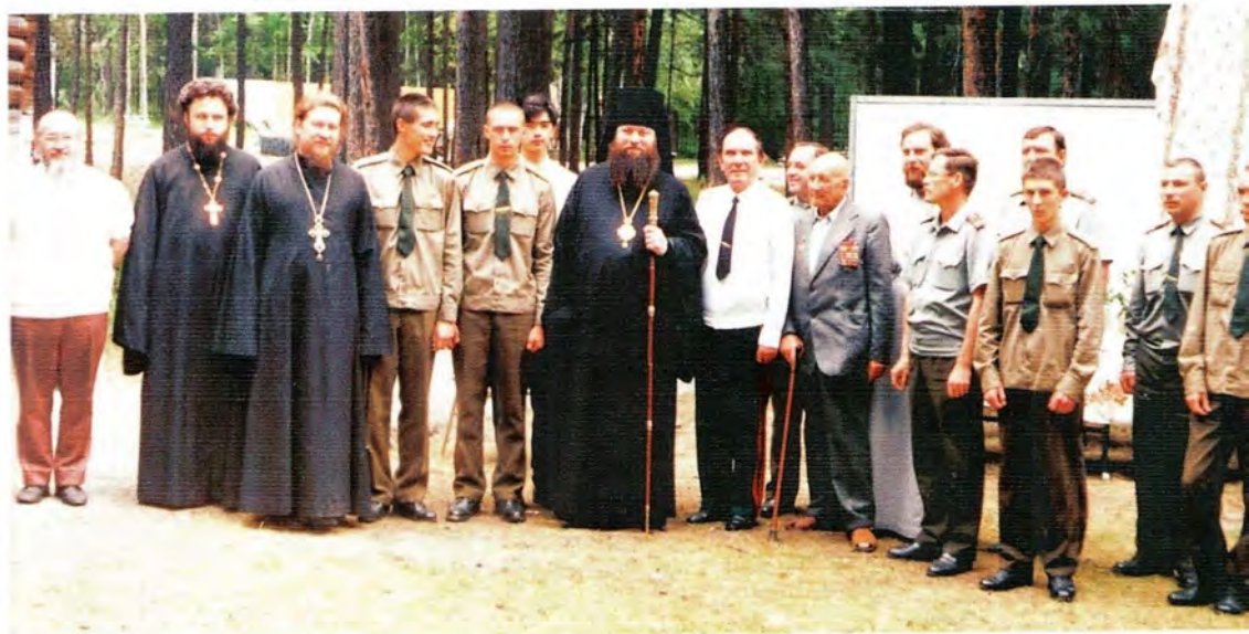
II Съезд православной молодежи, посвященный 50-летию Победы в Великой Отечественной войне, г. Новосибирск, 6-10 июля 1995 года