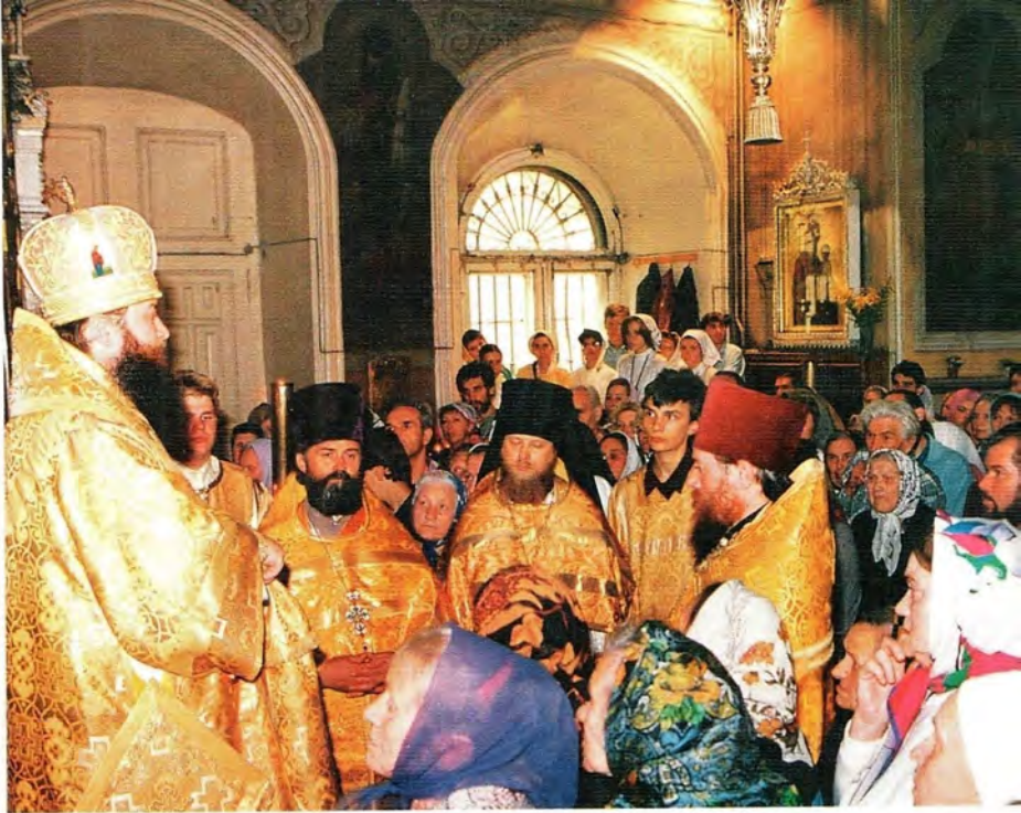
Епископ Бронницкий Тихон произносит проповедь в храме во имя Всех святых в Москве в день памяти святителя Тихона Задонского, 26 августа 1995 года