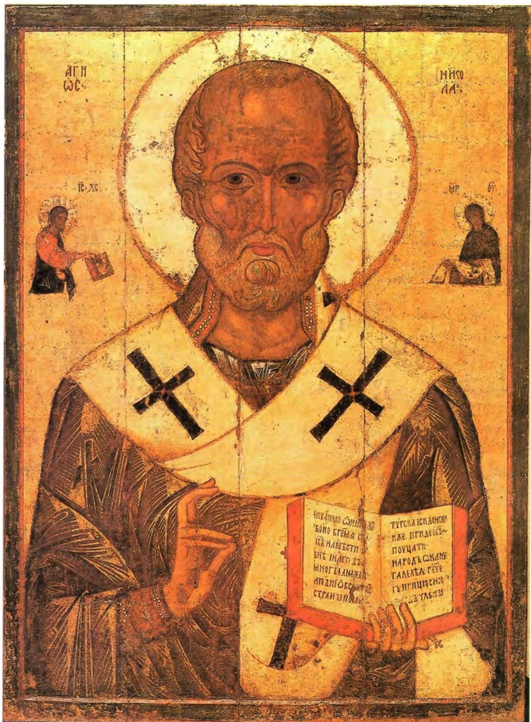
СВЯТИТЕЛЬ НИКОЛАЙ, АРХИЕПИСКОП МИР ЛИКИЙСКИХ, ЧУДОТВОРЕЦ