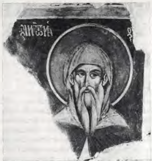
Преподобный Антоний Великий Фреска из музея Андрея Рублева

ную христианскую школу в Александрию. Будучи любознательным юношей, я изучил не только Священное Писание и святых отцов наших, но и греческую и римскую премудрость. У меня была сестра. Родители, умирая, разделили имение между нами. Муж моей сестры был несчастный человек – он задумал предать меня, как христианина, городскому правителю на мучения, а потом завладеть тем, что родители мои оставили мне. В это время шло страшное гонение на христиан от императора Декия, и в Фиваиде многие гибли от истязателей, исповедуя Христа. Я не хотел, чтобы из-за меня страдала сестра и чтобы муж ее совершил злое – отдал им все, взял хлеба и воды и ушел в пустыню. Сам Господь назначил мне место обитания здесь, дал мне воду и финики.