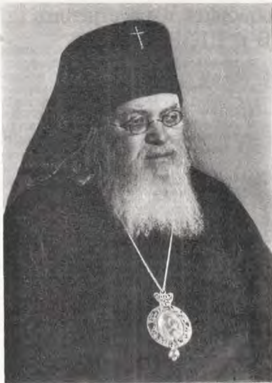
Архиепископ Лука (Войно-Ясенецкий)

попросил вывести его из комнаты, подзвал родителей, сказал им: "Уповайте на Господа, должен вам сказать правду: не пройдет и десяти дней, как сын ваш отойдет от вас в небесные обители". Все случилось так, как предсказал Владыка Лука.