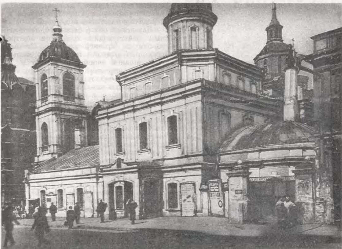
Казанский собор на Красной площади до начала реставрации.