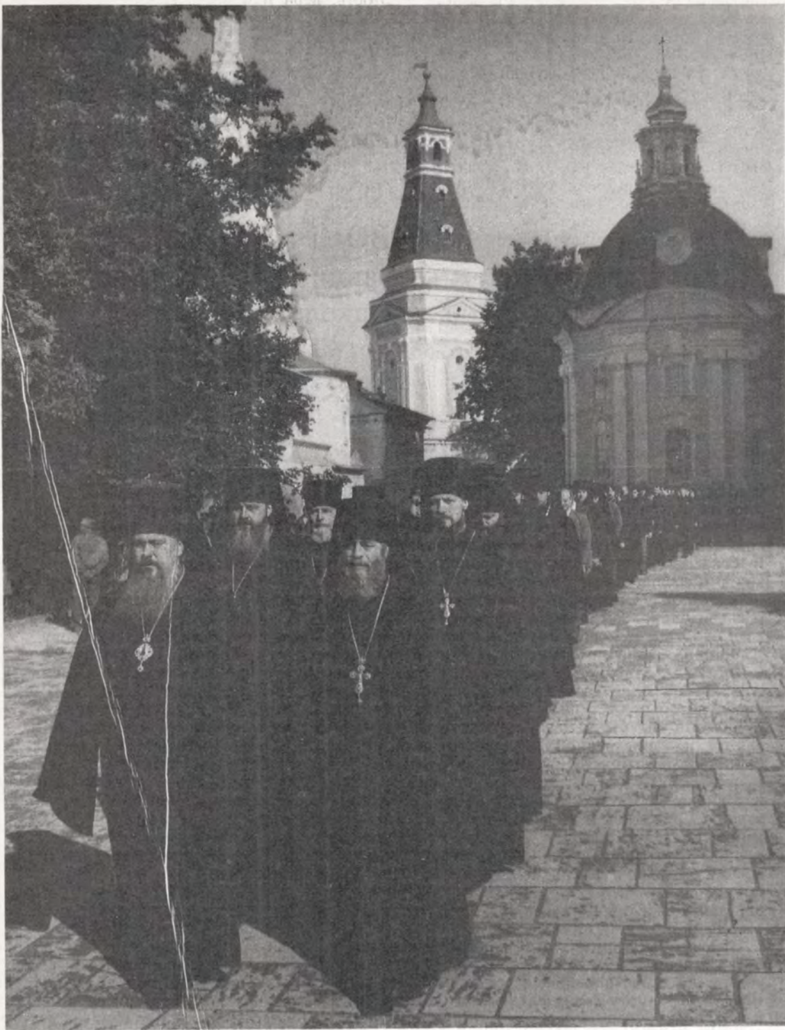
Епископ Дмитровский Филарет возглавляет шествие учащихся и учащихся в Троицкий собор на традиционный молебен перед началом учебного года

Отсюда следует, что принадлежность к Церкви, возрастание в вере и утверждение в нравственном достоинстве взаимно определяют друг друга. Более того, очевидным и важным является приоритет нравственного начала над рационально-познавательным, и это составляет один из основополагающих принципов жизни Духовной школы в целом. Внутренние сокровища духа, христианские качества души, высокие нравственные добродетели — честность,