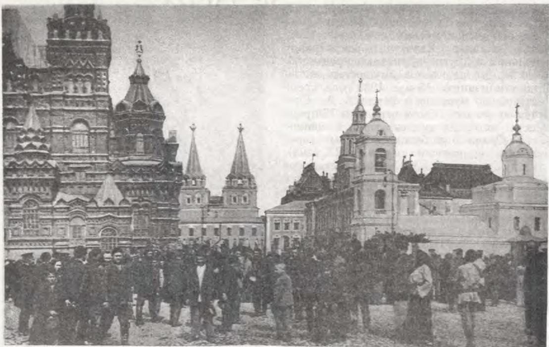
Казанский собор на Красной площади. После крестного хода. Фотооткрытка начала XX века

диум Моссовета принял решение о сносе здания Казанского собора и прилегающих к нему домов. Власти почему-то очень торопились: на переселение жильцов из дома отпустили лишь 10 дней. Метрострой был обязан срочно освободить помещение собора (с начала 1936 года там размещалась гидроаккумуляторная станция шахты № 69). Разборку Казанского собора и прилегающих к нему зданий указано было произвести не позднее 15 сентября. На снос выделили 120 тыс. руб. "Мосразборстрой" с честью справился с возложенной задачей и 1 октября 1936 года Президиум Моссовета уже обсуждал вопрос об асфальтировании площадки на месте храма.