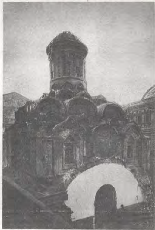
Снос Казанского собора на Красной площади.

Сгустилась угроза закрытия и над Казанским собором, который благодаря усилиям реставраторов засиял своим великолепным древним обликом. Но