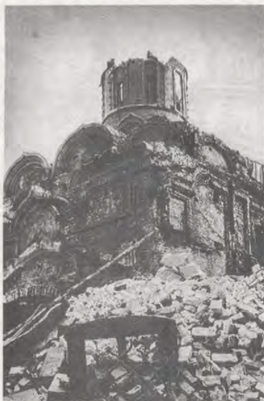
Казанский собор. Вид после сломки трапезной.