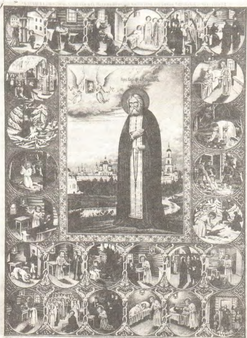
Преподобный Серафим Саровский. Икона нач. XX века из храма во имя святого апостола Филиппа в Новгороде

Жизнеописание преподобного и богоносного отца нашего Серафима Саровского, всея России чудотворца