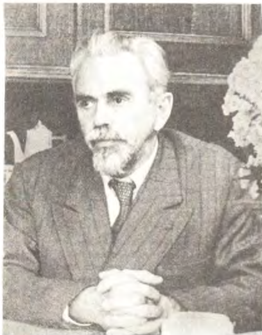
Борис Александрович Васильев. Фото 70-х годов

Ясно, что сомнение в том, что Пушкин — христианин, было у многих. Наша задача — попытаться проследить духовный путь величайшего русского поэта, приведший его к христианской вере».