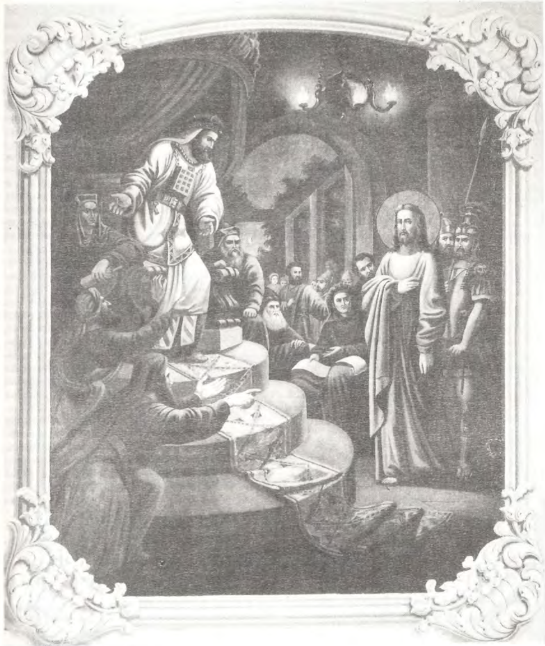
Суд Понтия Пилата над Христом Живопись на юго-западной стене Спасской церкви (XVIII в.) в г. Солнечногорске, Московская обл.

Бичевание, которому Христос подвергся у Пилата, можно объяснить желанием прокуратора унять страсти иудеев и угодить им. У евреев не разрешалось наносить подсудимому более 39 ударов. В Риме, где бичевание применялось в основном к рабам, такого ограничения не было. Удары наносились тройными бичами, на концах которых были острые металлические шипы.