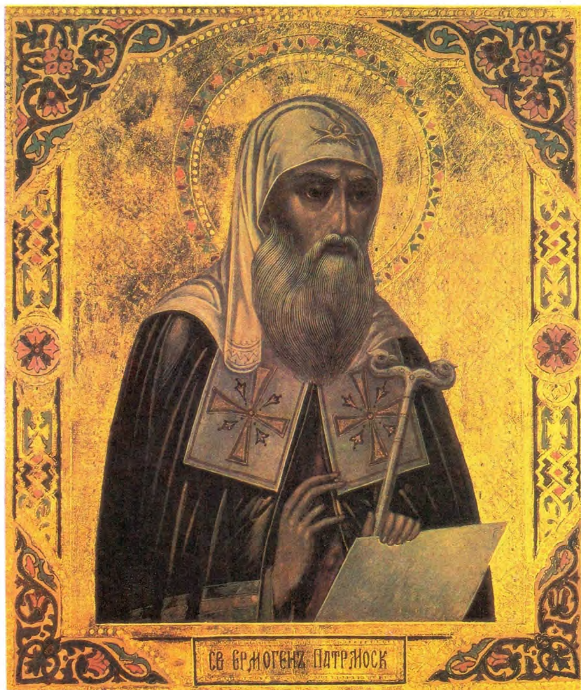
СВЯЩЕННОМУЧЕНИК ЕРМОГЕН, ПАТРИАРХ МОСКОВСКИЙ И ВСЕЯ РОССИИ (память 17 февраля / 2 марта и 12/25 мая)