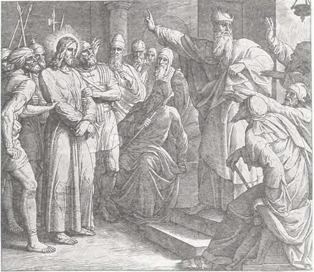
Иисус перед Каиафой. Евангелие от Матфея 26, 57—66.

Гравюра на дереве Юлиуса Шнорр фон Карольсфельда