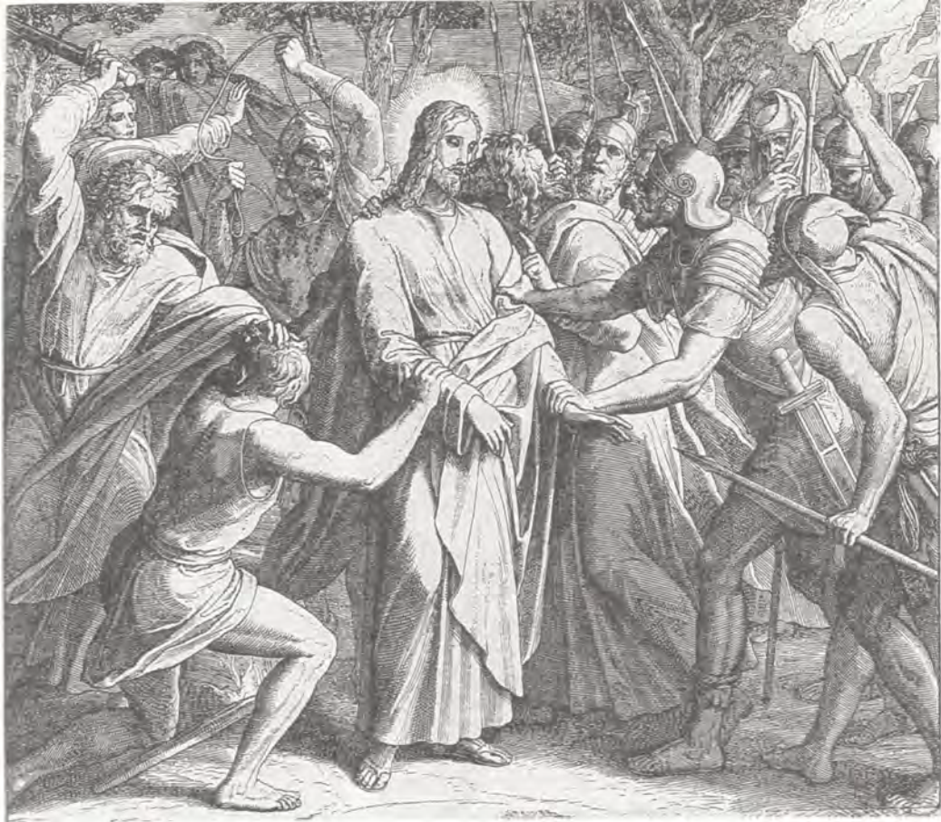
Взятие Иисуса Христа. Евангелие от Матфея 26, 47—56. Гравюра на дереве Юлиуса Шнорр фон Карольсфельда

необходимо исполнение закона. Но Синедрион мог использовать Иуду для своих целей как человека, близкого Иисусу, эффективнее, чем других, случайных свидетелей. Первосвященники имели для этого и достаточно сильные средства — сребреники.