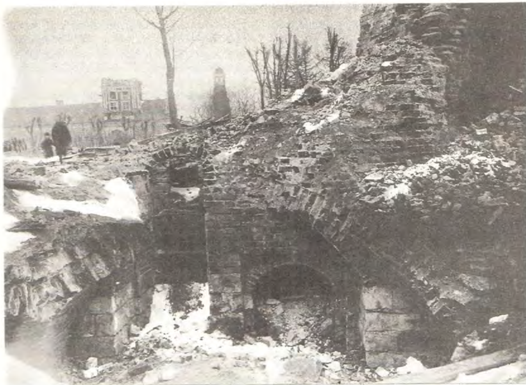
Успенский собор Симонова монастыря после взрыва, последовавшего в 1930 году