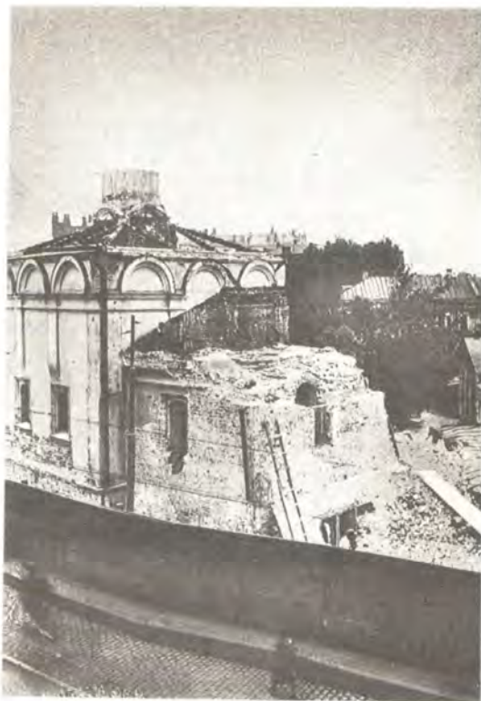
Сретенский монастырь в Москве, 1928 год

Узнав о таких намерениях, верующие десятков храмов Москвы и Подмосковья выступили в защиту святыни. Вот что написали в Совнарком прихожане крупнейшей в Москве церкви Василия Кесарийского на Тверской (сносена в конце 1930 года): «К мукам голода, холода и всяческих нестроений для православного русского населения... присоединились новые тяжкие испытания: вскрываются гробницы почивающих в храмах святых мощей, чем нарушается их вековой могильный покой и что недопустимо ни с православной, ни с какой иной точки зрения. В гробницах святых праведников русский народ чтит священные останки независимо от того,