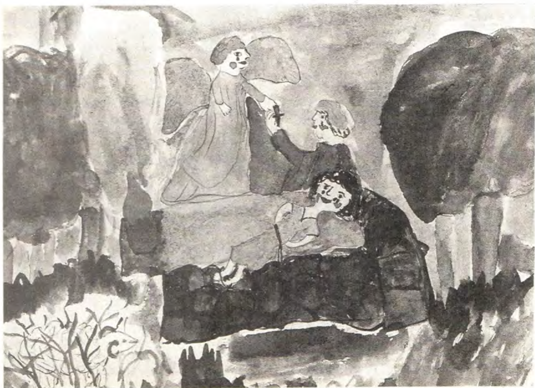
Жертвоприношение Авраама (ср.: Быт. 22, 6—13). Рисунок Ажажи Светы, 9 лет