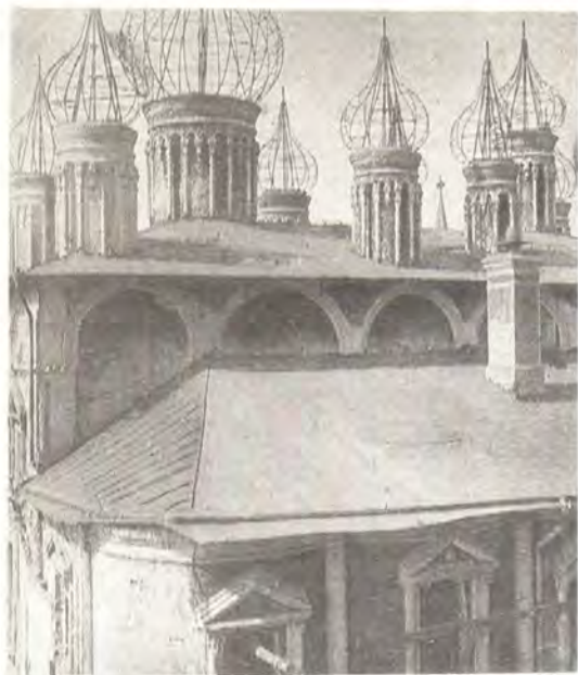
Чудов монастырь в Московском Кремле, 1930 год

законность «вскрытия и ликвидации» мощей, которые не имели никакой материальной ценности и с точки зрения законов не подлежали изъятию. Неопубликованные архивные документы доносят до нас весь драматизм происшедшего. С 1919 года местные власти по указанию Наркомюста не раз пытались вывезти мощи из монастырей и церкви. Население далеко не всегда спокойно принимало эти акты вандализма. Лишь с помощью военного отряда удалось усмирить верующих Вельска Вологодской губернии, выступивших против вывоза мощей преподобного Проккопия Устьянского из их родного города. Другой случай: после вскрытия власти не раз делали попытку увезти мощи основателя Спасо-Суморина монастыря преподобного Феодосия в Вологду. Удалось это сделать лишь силой: октябрьской ночью отрядом милиции предварительно были арестованы несколько монахов. Мощи были увезены на пароходе в Вологодский музей. Однако началось паломничество к мощам в музей. Власти пытались даже отправить мощи Феодосия в один из музеев Москвы 9 .