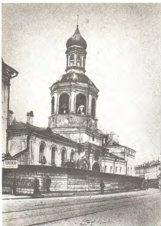
Сретенский монастырь в Москве до разрушения

случаев Н. Д. Кузнецов писал в Совнарком: «Вообще в последнее время начинают возникать вопросы о выселении целых монастырей, существующих уже целые сотни лет, причем на выселение представляется невозможно краткий срок»... 4