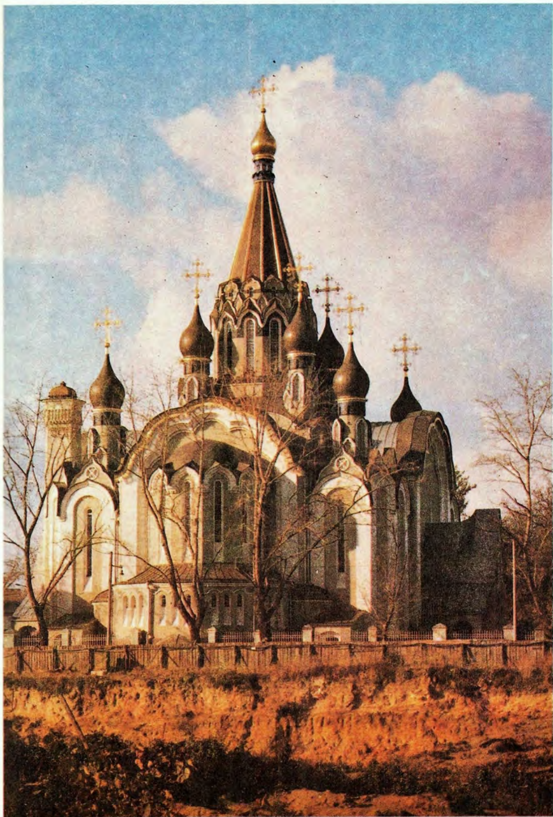
ХРАМ ВОКРЕСЕНИЯ ХРИСТОВА В СОКОЛЬНИКАХ, МОСКВА