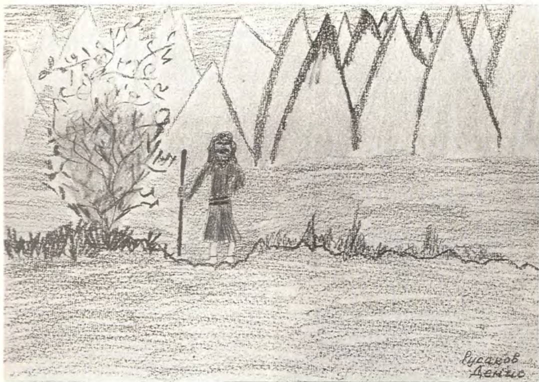
Неопалимая купина (ср.: Исх. 3, 2—3). Рисунок Русакова Дениса, 9 лет