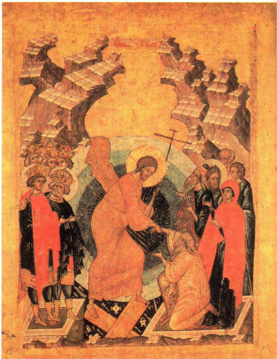
СОШЕСТВИЕ ВО АД, ИЛИ ВОСКРЕСЕНИЕ ХРИСТОВО