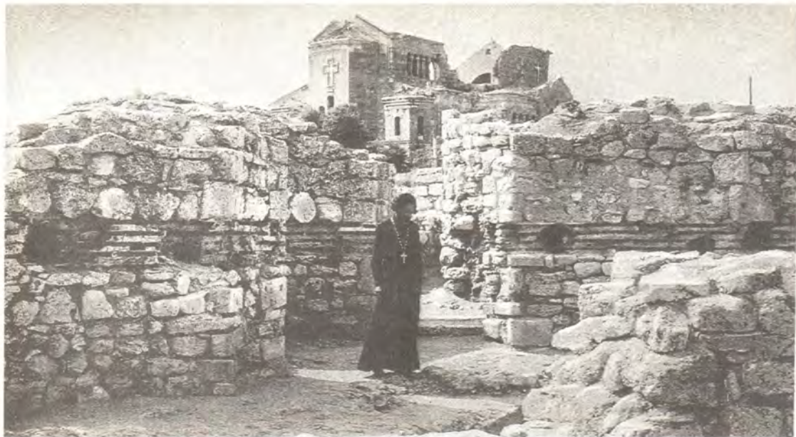
На развалинах Владимирского собора

читать этот перевод Священного Писания. К VIII веку относят первые отдельные факты крещения русских, как из знати, так и из простолюдинов.