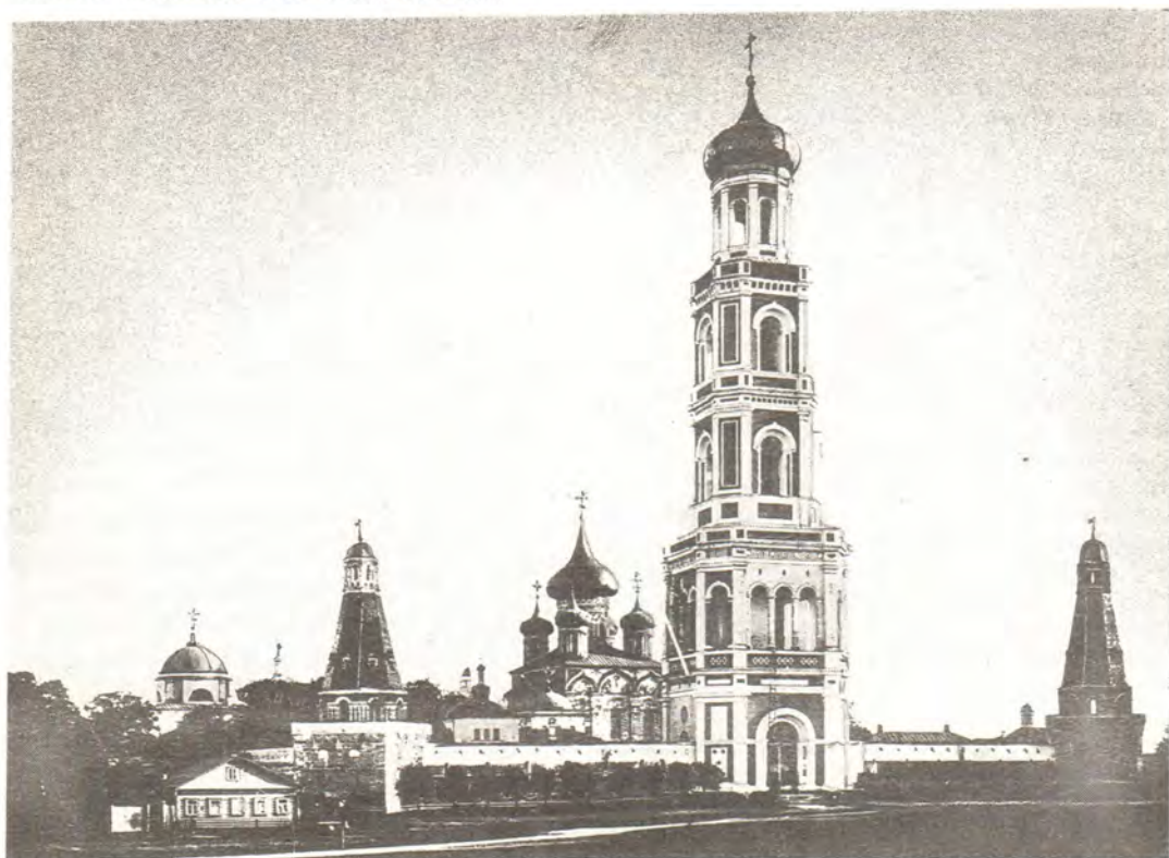
Симонов монастырь. Фото конца XIX века

Наконец, наиболее показательно богорборческая политика новой власти проявилась в известном декрете Совнаркома РСФСР от 23 января 1918 года «Об отделении церкви от государства и школы от церкви» и последующих инструкциях по его выполнению. После этого все церковные организации, в том числе и монастыри, потеряли право юридического лица, владения собственностью 1 . Волна наступления на монастыри возра-