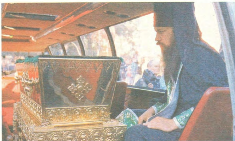
Рака со святыми мощами перенесена в специальный автобус, который совершит путь до Дивеева