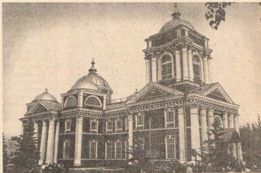
Преображенский собор Белгорода, в котором отныне почивают мощи святителя Иоасафа