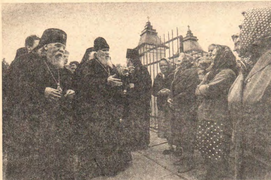
Встреча Патриарха с верующими у храма во имя праведных Иоакима и Анны, с. Долгое