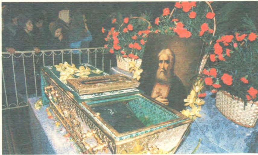
Рака с мощами преподобного Серафима Саровского