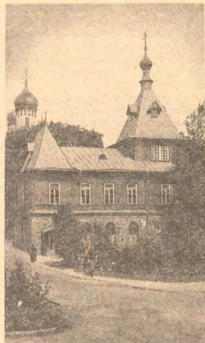
Трапезная Симоно-Аннинская церковь

В последней четверти XIX века Пюхти становится широко известным местом в Северо-Западном крае. Там образуется православный приход, рядом с Успенской часовней возводится деревянный Успенский храм. На живоносном источнике устанавливается на-