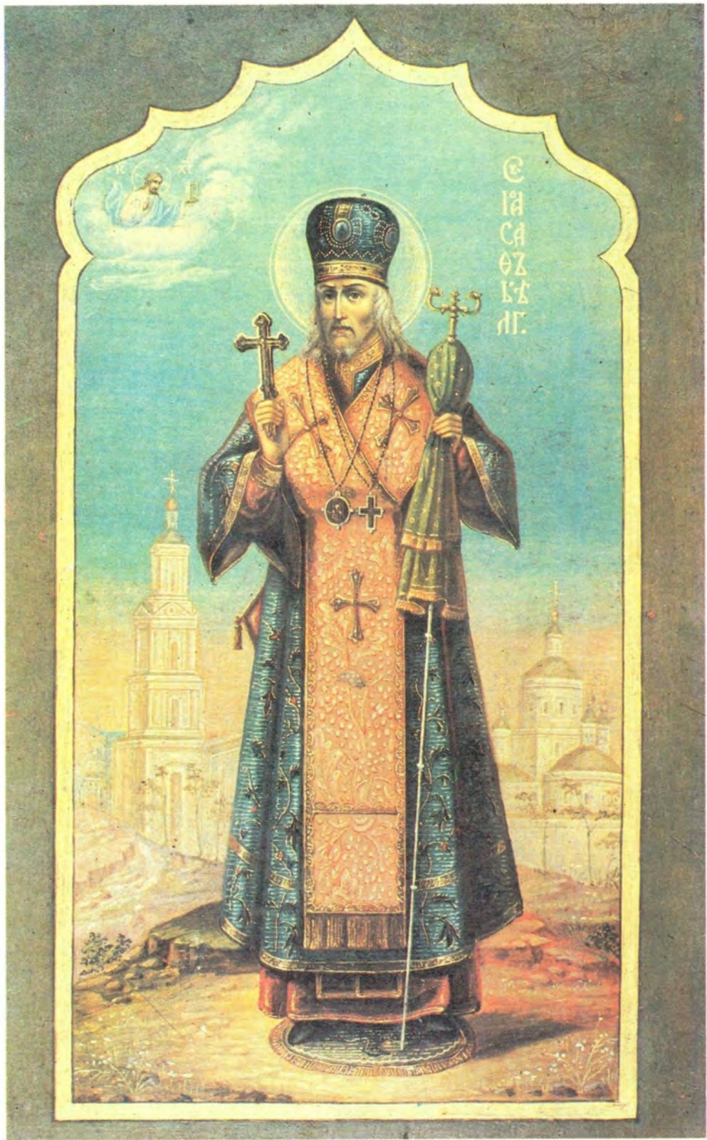
СВЯТИТЕЛЬ ИОАСАФ БЕЛГОРОДСКИЙ