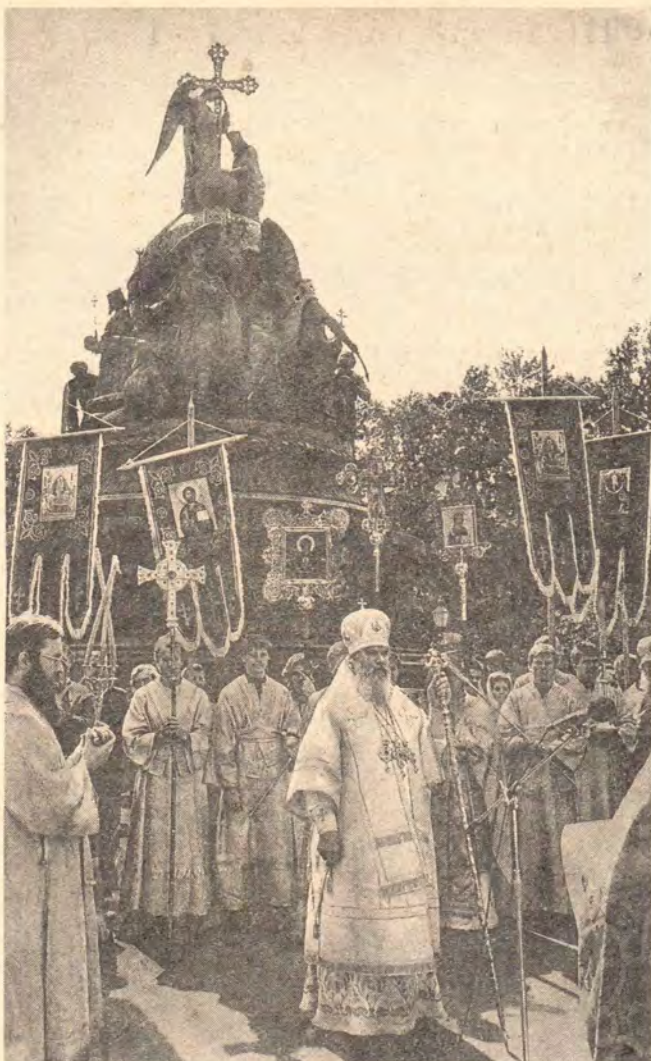
Святейший Патриарх Московский и всея Руси Алексий II произносит слово в Новгородском кремле возле памятника 1000-летию России 16 августа 1991 года

также министр культуры РСФСР Ю. М. Соломин, представители политических партий и общественных организаций, действующих в Новгороде.