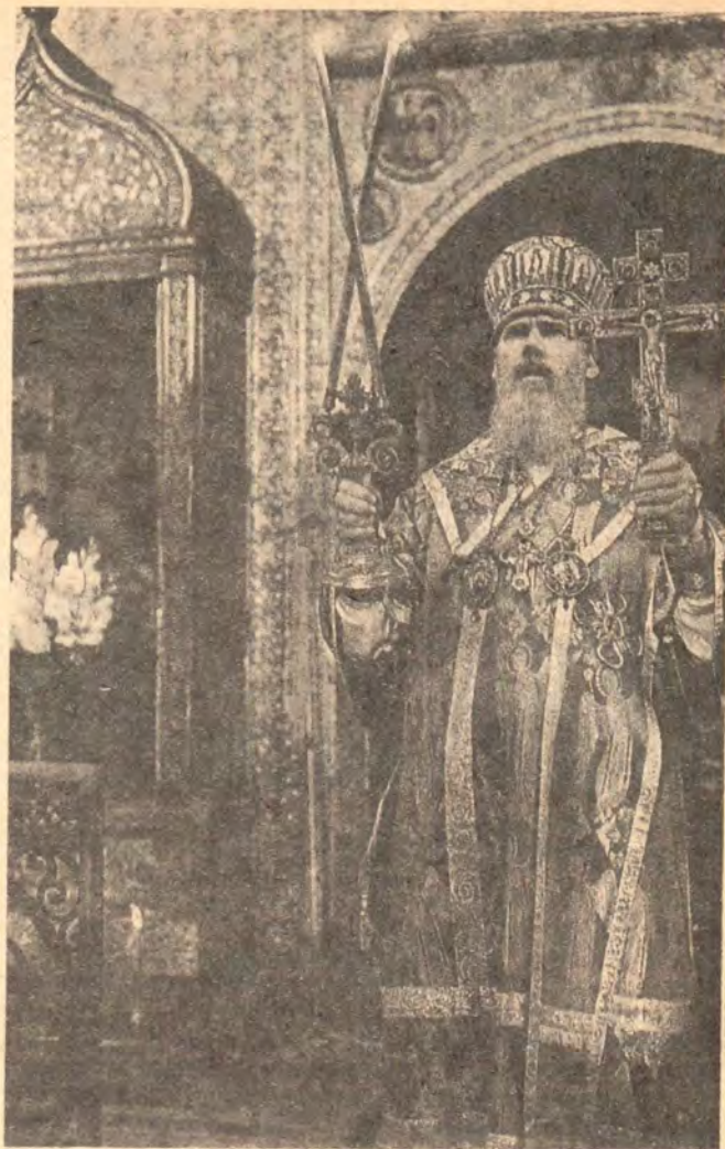
Святейший Патриарх Московский и всея Руси Алексий II совершает Божественную литургию в Успенском соборе Московского Кремля 19 августа 1991 года, в праздник Преображения Господня, в день открытия Конгресса соотечественников-россиян

Церковь не может и не должна выступать в качестве политической силы, но происшедшее в те дни вышло за рамки политического события. Утром 20 августа