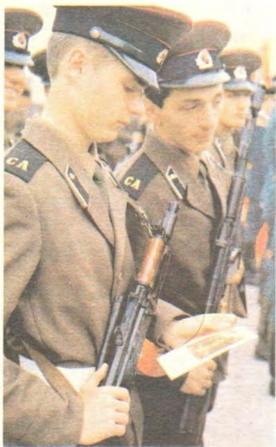
Иконка преподобного Серафима — благословение Святейшего Патриарха молодому воину