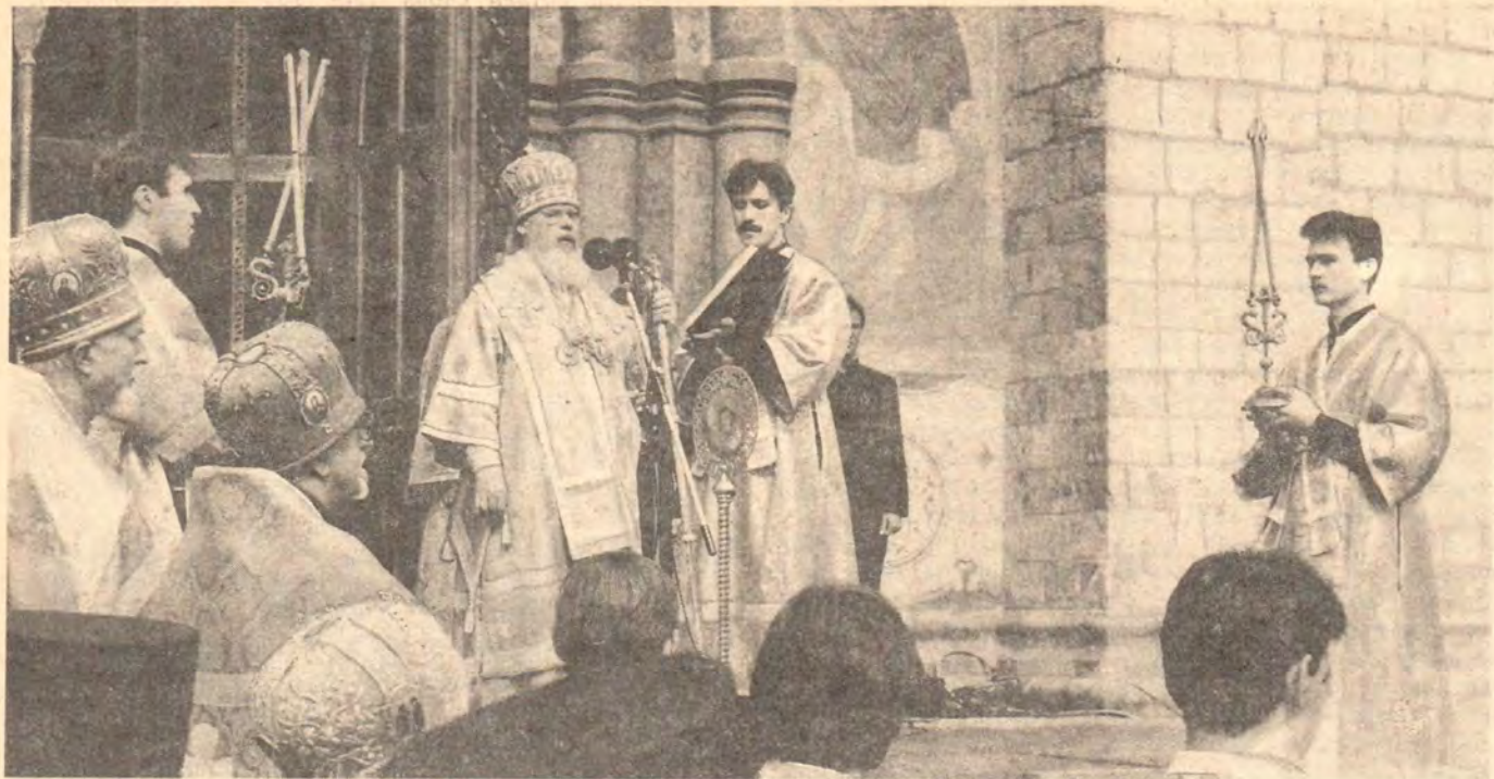
Святейший Патриарх Алексий II обращается к своей пастве с паперти Успенского собора Московского Кремля в праздник Успения Божией Матери, 28 августа 1991 года

«Россия переживает поворотный момент в своей истории... Конгресс соотечественников — это конгресс возрождения, приглашение к созиданию», — когда оргкомитет вставлял эти слова в первый выпуск информации для прессы, еще никто, наверное, не догадывался, как актуально зазвучат они в дни его проведения... Победа у Белого дома наложила отпечаток на все мероприятия конгресса, который, кстати, был задуман нестандартно: привычных для разного рода форумов пленарных заседаний не было; вся программа состояла из ряда встреч, экскурсий, дискуссий за «круглым столом», богослужений. Обширная религиозная программа предусматривала паломнические поездки, «круглый стол» по проблемам церковной благотворительности и милосердия, посещение Издательского отдела Московского Патриархата и Софринского художественно-производственного объединения Русской Православной Церкви.