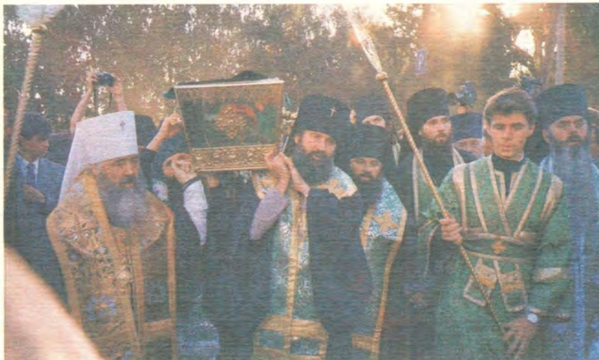
Преосвященные архиереи несут раку с мощами преподобного Серафима. В первом ряду — митрополит Крутицкий и Коломенский Ювеналий и архиепископ Тамбовский и Мичуринский Евгений