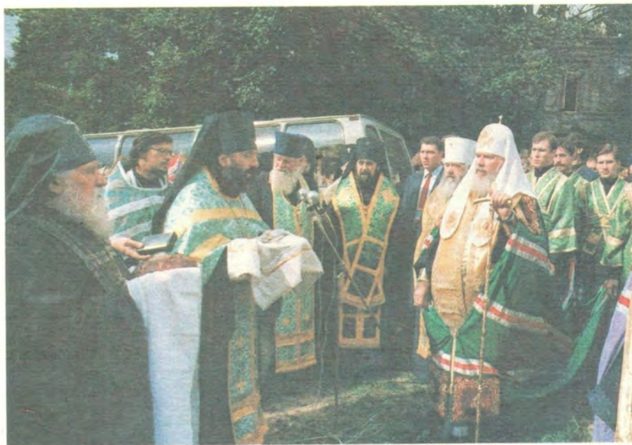
Встреча крестного хода, возглавляемого Святейшим Патриархом Алексием, у храма в городе Вязники Владимирской области