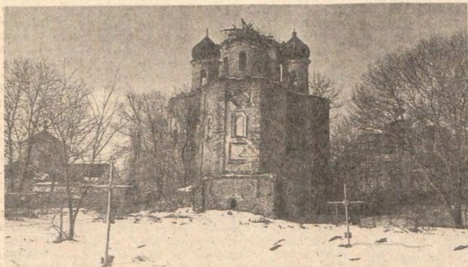
Густынский Троицкий монастырь (XVII век) под Прилуками Черниговской области, где в детские годы часто бывал будущий святитель Иоасаф Белгородский. Сегодня в монастыре расположен интернат для душевнобольных