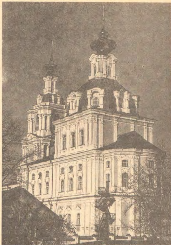
Курский Сергиево-Казанский кафедральный собор.

19 сентября Святейший Патриарх Алексий освятил храм Рождества Пресвятой Богородицы в Курской Коренной пустыни, а затем совершил в нем Божественную литургию в сослужении архиепископов Курского и Белгородского Ювеналия, Корсунского Валентина, епископов Тверского и Кашинского Виктора, Истринского Арсения и Петрозаводского и Олонецкого Мануила. После литургии Святейший Патриарх прочитал молитву перед чтимым списком чудотворной Курской Коренной иконы Знамения Божией Матери (об этой иконе и о Курской Коренной пустыни см.: ЖМП, 1989, № 8; 1990, № 9).