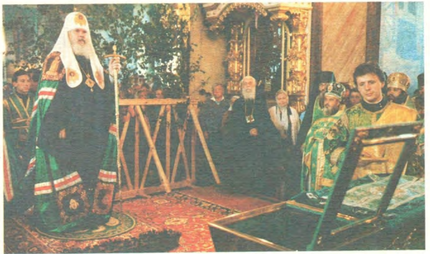
Святейший Патриарх Алексей совершает молебен перед мощами