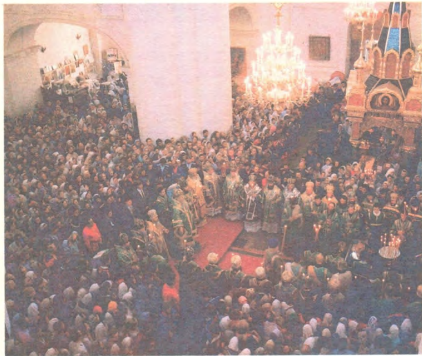
Всенощное бдение в Богородицерождественском соборе Дивеевской обители 31 июля совершил Святейший Патриарх Алексий в сослужении собора архипастырей и духовенства