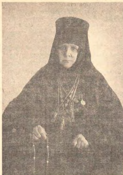
Игуменья Варвара (Блохина; 1892—1897) — основательница обители