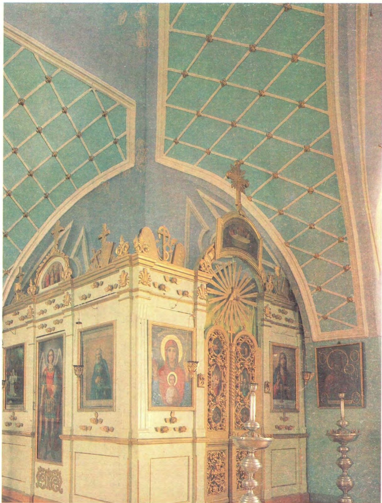
ПРИДЕЛ ВО ИМЯ ПРЕПОДОБНОГО СЕРАФИМА САРОВСКОГО В СЕРГИЕВО-КАЗАНСКОМ СОБОРЕ г. КУРСКА