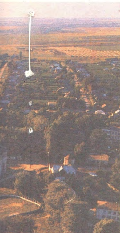
Богородице- рождественский Дивеевский женский монастырь

СВЯТЫЙ ПРЕПОДОБНОГО СЕРАФИМА САРОВСКОГО Дивеево, 23 июля — 1 августа 1991 года