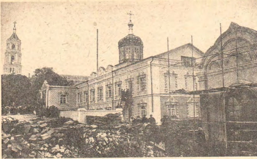
Курская Коренная пустынь, собор в честь Рождества Пресвятой Богородицы