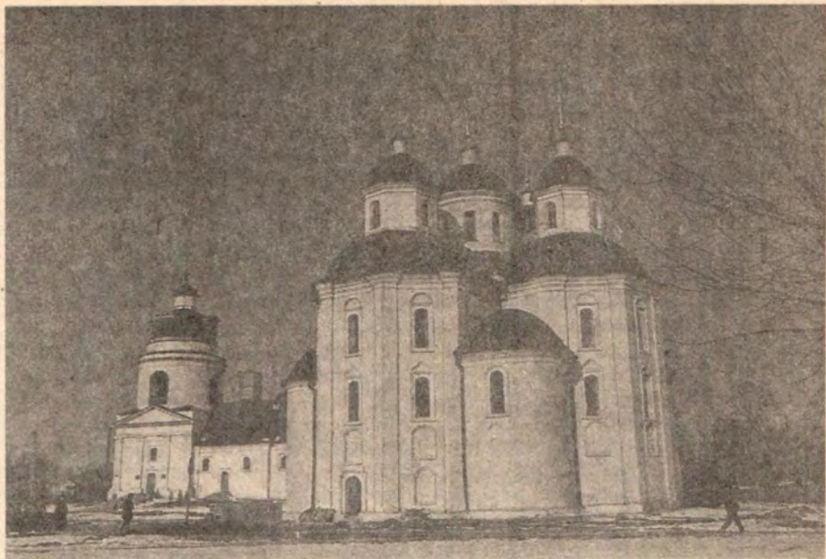
Преображенский собор (1718—19) в Прилуках Черниговской области на родине святителя Иоасафа, епископа Белгородского, который он посещал в детстве. Храм возвращен Церкви в 1990 году