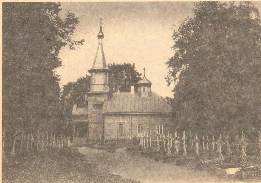
Никола-Арсеньевский кладбищенский храм

1888 год оказался годом знаменательным и для будущего Пюхтицкого монастыря, и для всего Северо-Запад-