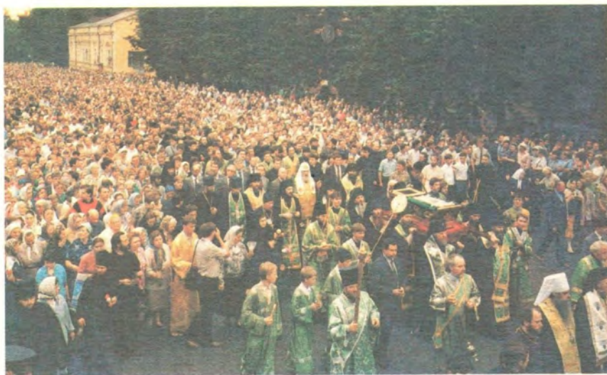
Начало пути: крестный ход со святыми мощами преподобного Серафима движется от Богоявленского патриаршего собора по Спартаковской улице Москвы