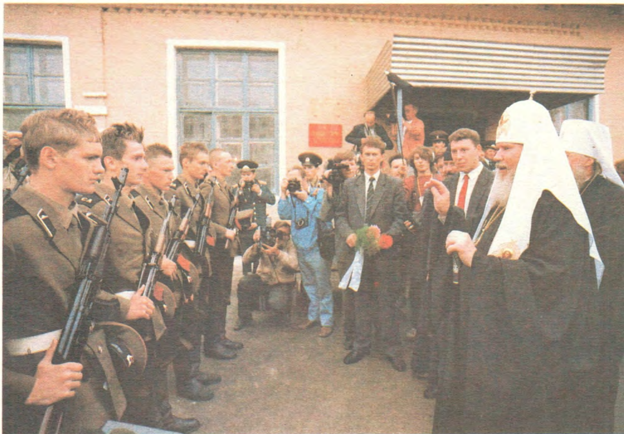
На пути следования крестного хода. Встреча Святейшего Патриарха Алексия с православными воинами №-ской части