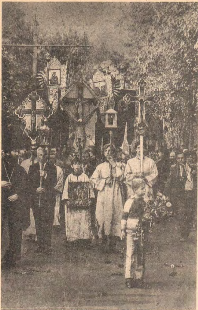
Крестный ход с мощами святителя Иоасафа по улицам Белгорода 16 сентября 1991 года

много лет, после того когда плоть была уже полностью высохшей, так как края разреза плотно примыкают друг к другу, через разрез просматриваются высохшие внутренние органы. ...На левой стопе под пятой имеется повреждение мягких тканей и отсутствует большой палец... На груди с правой стороны на плоти имеется отпечаток четырехконечного креста 4×7 см. После осмотра тело очищено от пыли и обтерто святой водой. Затем оно было обернуто чистой тканью и накрыто погребальной пеленой.