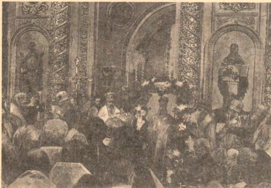
Святейший Патриарх Алексий II принимает поздравления по случаю 30-летия архиерейской хиротонии

— Я сердечно благодарю за все теплые слова и молитвенные поже-