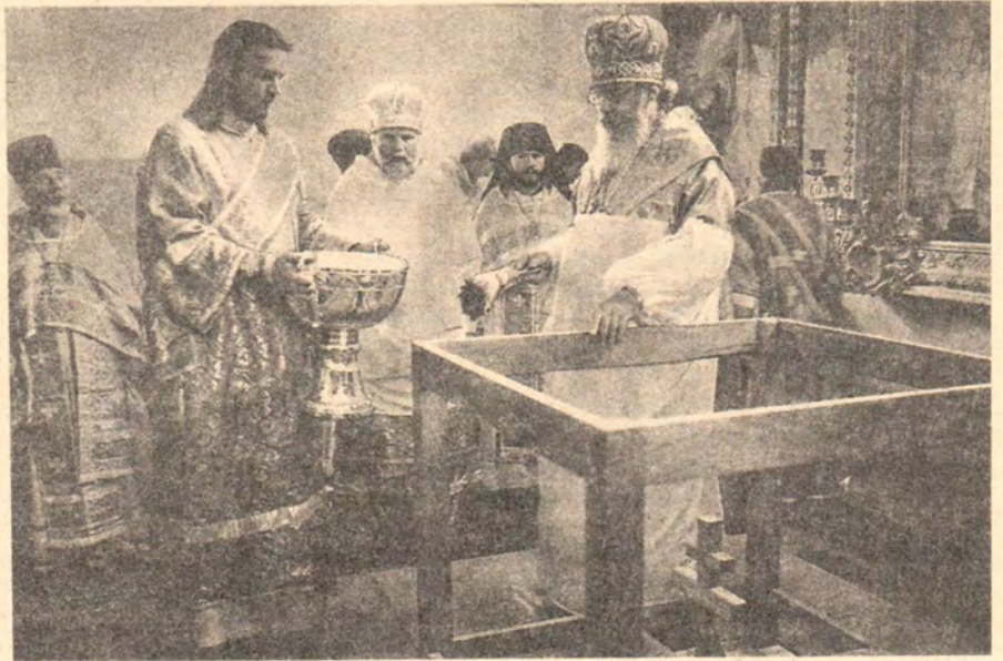
Освящение престола собора Рождества Богородицы в Курской Коренной пустыни совершает Святейший Патриарх Алексий II 19 сентября 1991 года