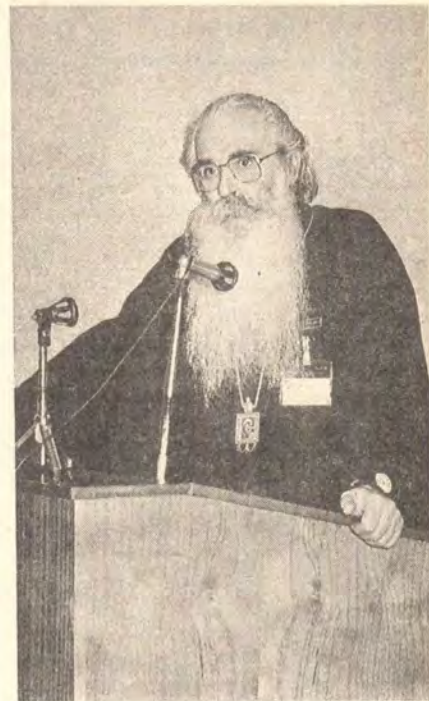
Выступает митрополит Волоколамский и Юрьевский Питирим

И наконец, в этом двуедином синтезе есть еще третий компонент. Это социальное служение. Его наследовали русские монастыри в той высокой степени, которую теперь уже никто не может ни опровергать, ни отрицать. Соловецкие иноки почти за Полярным кругом выращивали южные овощи, вологодская система рек была торговой артерией, монастыри кормили бесчисленное множество людей, и не только калек переходящих, но и окрестных жителей. И тот же