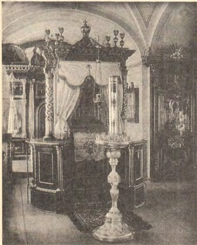
Коневская икона Божией Матери в Сретенском монастырском храме. Фото 1896 года

Сейчас в обители трудятся активисты ленинградского