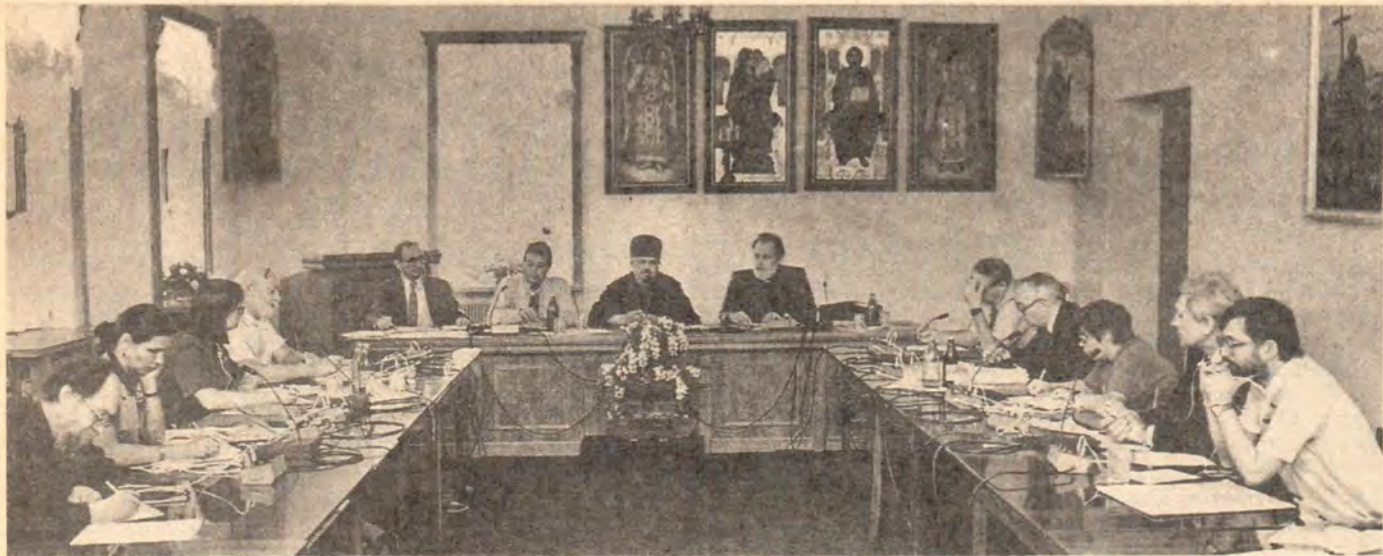
Во время заседания координационного комитета, на котором было принято совместное заявление

в Советском Союзе и в Соединенных Штатах, основное внимание при проведении которых будет уделено беднякам и которые включают в себя быстрые шаги в направлении экономической конверсии военных расходов на социальные;