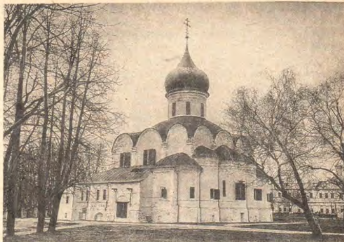
Свято-Троицкий собор Успенского монастыря (г. Александров)

Келейный корпус, о котором уже шла речь и который в настоящий момент пустует, во второй раз неожиданно становится предметом коммерческого интереса сильных