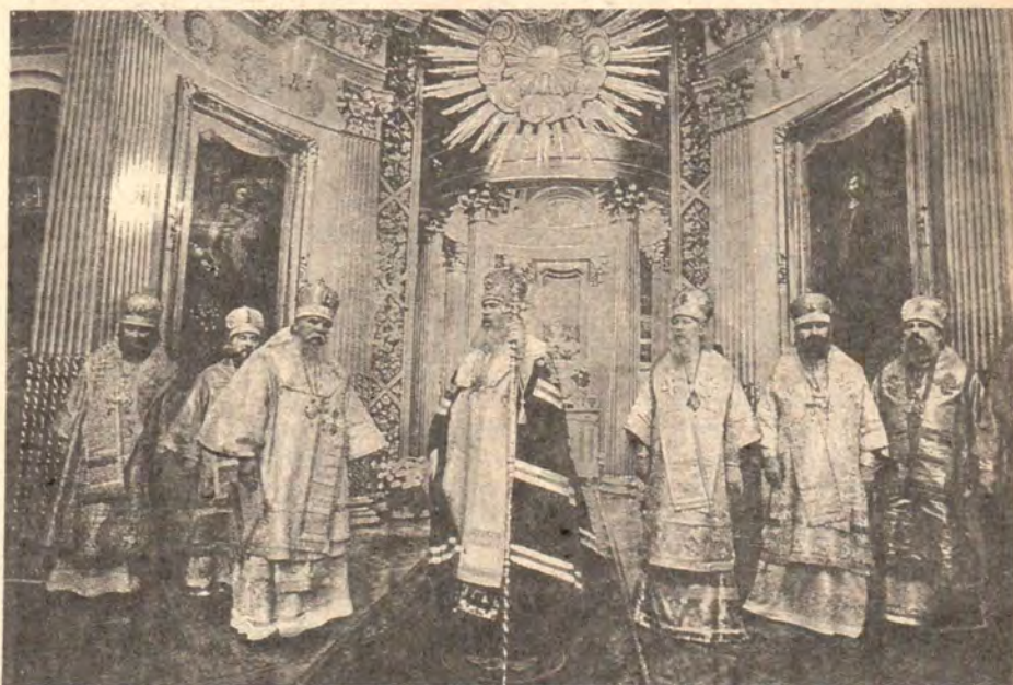
Святейший Патриарх Алексий поздравляет архиепископа Курского и Белгородского Ювеналия с обретением мощей святителя Иоасафа Белгородского