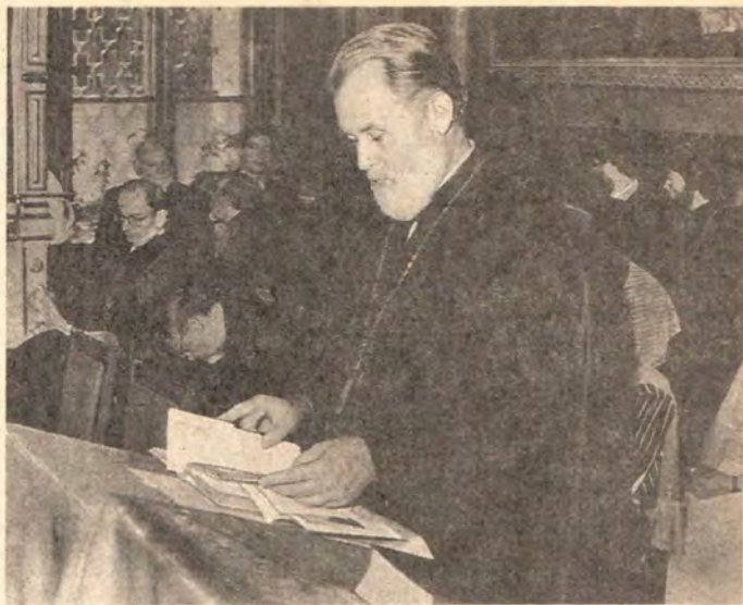
Молитву читает президент НСЦХ в США протоиерей Леонид Кишковский (Православная Церковь Америки)

В молитве приняли участие представители Русской Православной Церкви, Грузинской Православной Церкви, Союза евангельских христиан-баптистов, Евангелическо-Лютеранской Церкви Литвы, настоятель подворья Антиохийской Православной Церкви в Москве епископ Филиппопольский Нифон, настоятель подворья Болгарской Православной Церкви в Москве архимандрит Гавриил.