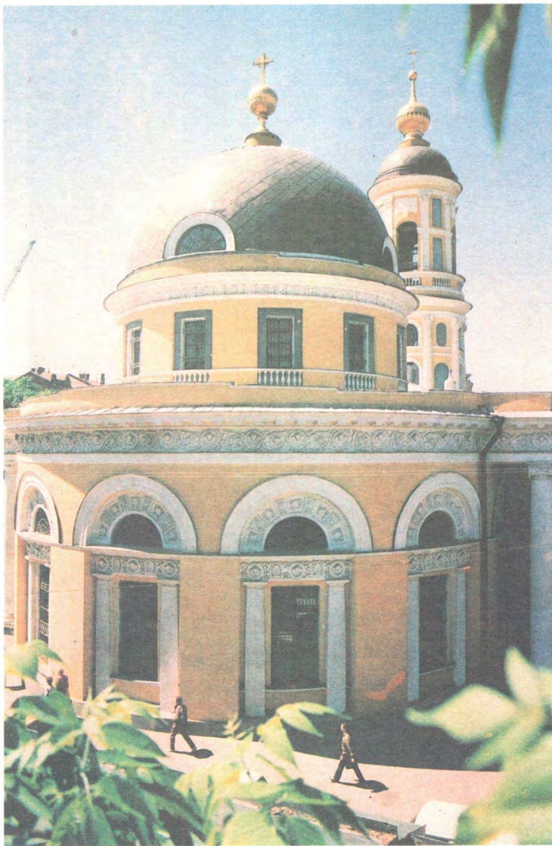
СКОРБЯЩЕНСКИЙ ХРАМ НА ОРДЫНКЕ В МОСКВЕ