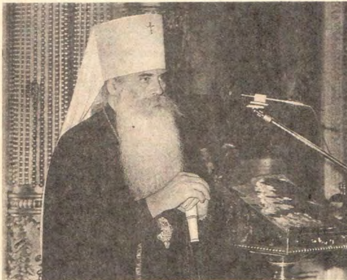
Митрополит Волоколамский и Юрьевский Питирим обращается с приветственным словом к участникам совместной молитвы в храме Воскресения словущего