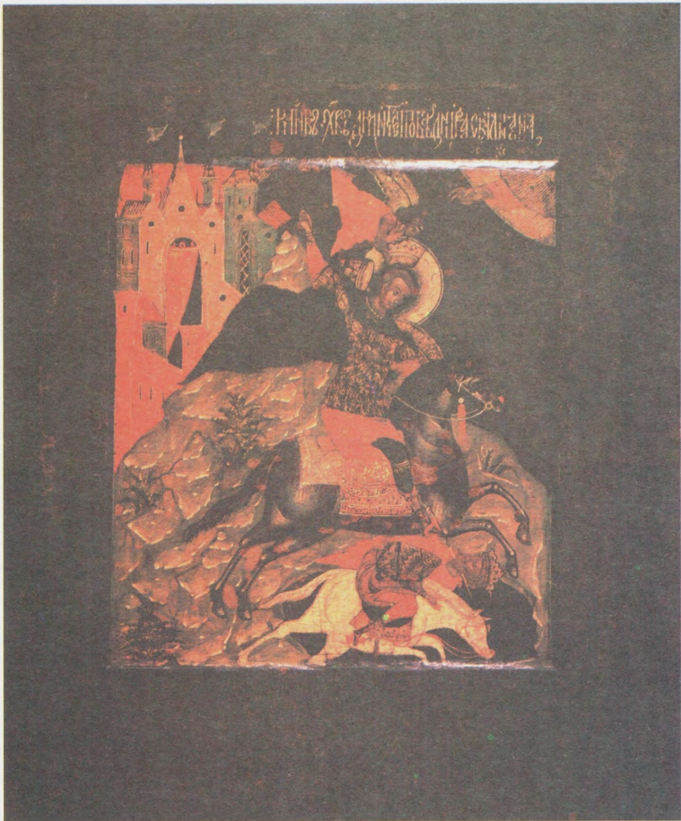
ЧУДО ДИМИТРИЯ СОЛУНСКОГО