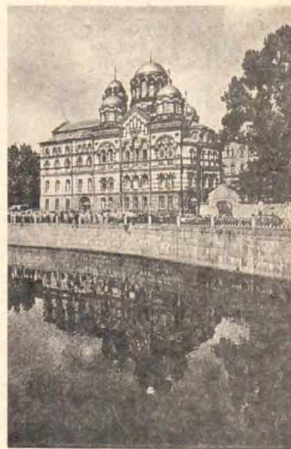
Иоанновский монастырь в Ленинграде

иже Соломону широту и пространство сердца даровавший, и тем древний храм возставивый... сохрани его (освящаемый храм) даже до скончания века непоколебима... дерзаем бо не на наших рук служение, но на Твою неизреченную благодать».