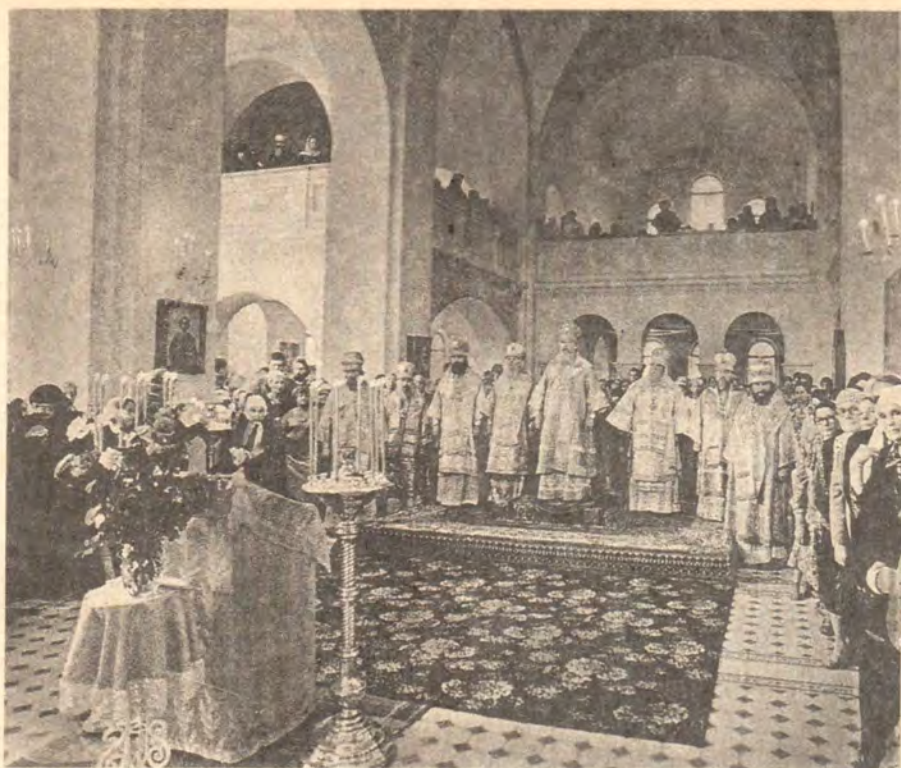
Святейший Патриарх Алексий в сослужении архиереев совершает литургию в храме Двенадцати апостолов Иоанновского монастыря

живают сегодня наше Отечество и Церковь Христова.