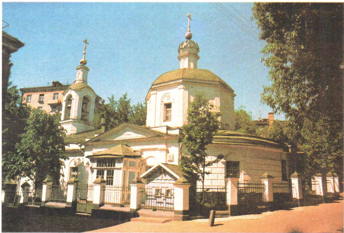
Покровский храм на Землянке в Москве