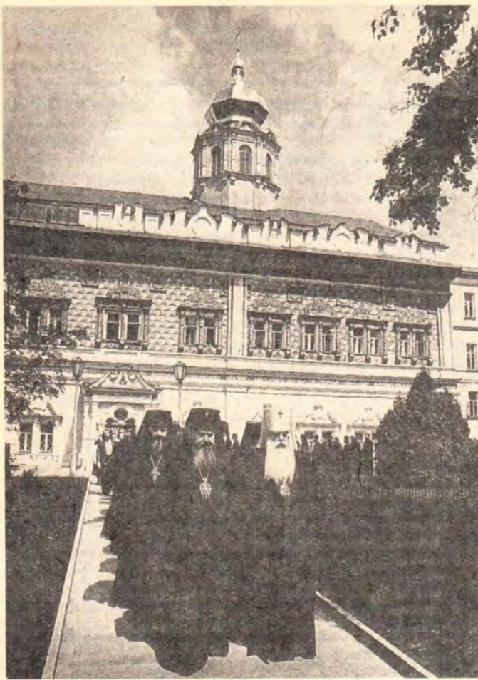
Шествие на молебен в Троицкий собор Лавры

в процесс нравственного обновления и преобразования жизни. Ваше пастырское делание должно быть подчинено главной и всеобъемлющей цели — исполнению высоких и неизменных Божественных предназначений о служении человеку независимо от его положения и мировоззрения, от его взглядов и убеждений. Помочь современному человеку обрести смысл жизни, ее нравственные и духовные основы, согреть его своим пастырским сердцем, носить в себе его боль и страдание, вселить в него радость и надежду — вот что чаще всего ждет от Церкви и от ее пастырей современный человек с утраченными идеалами и несбывшимися надеждами. Будьте всем для всех (1 Кор. 9, 22), носите немощи немощных, престарелых, одиноких, больных, обездоленных. Излучайте для всех радость, свет и тепло.