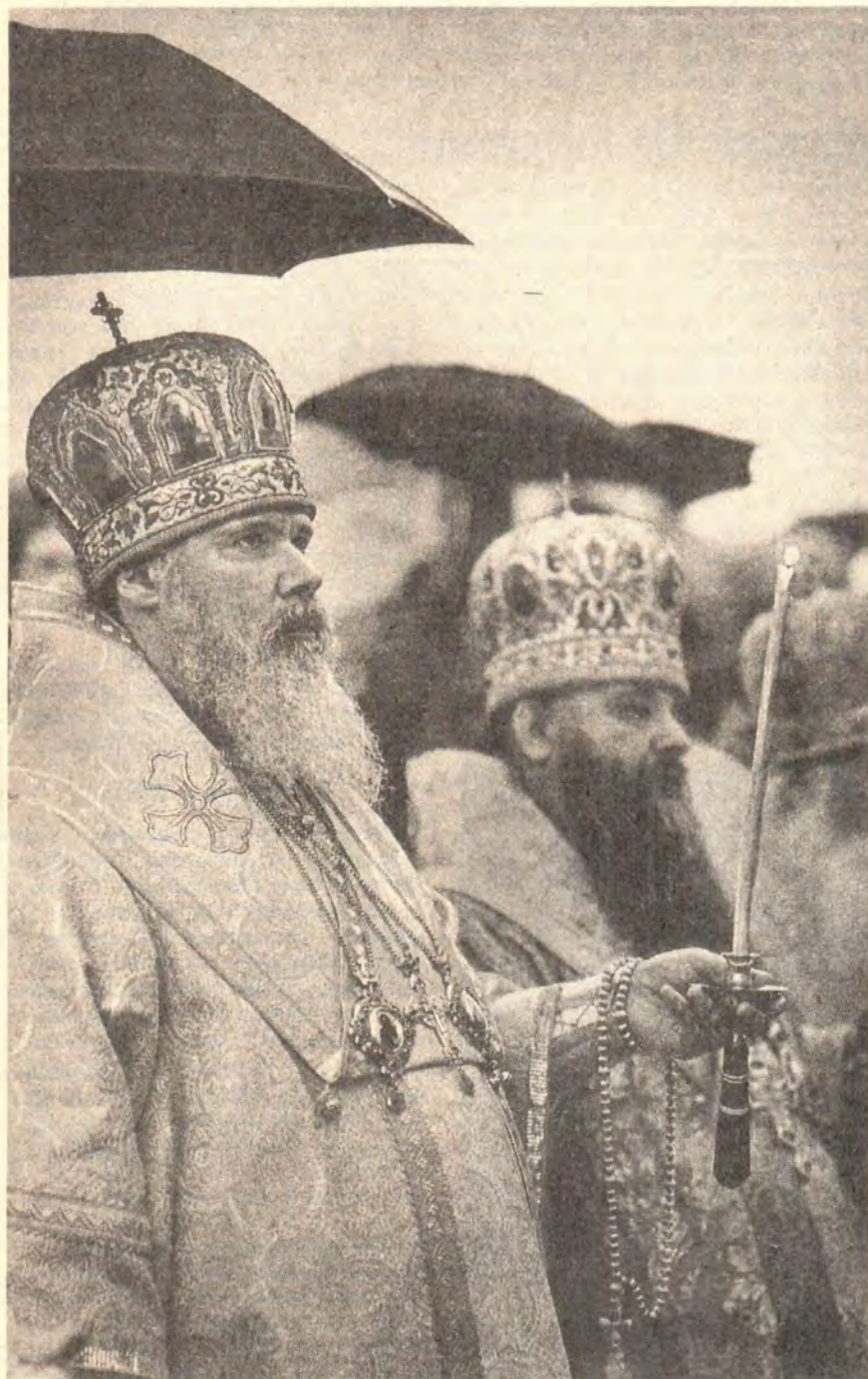
Святейший Патриарх Алексий за богослужением у Минского кафедрального собора

34 % территории Могилевской области заражены радиацией. 90 % населения соседней Гомельской области, которую также посетил Святейший Патриарх, проживает на территории, зараженной в той или иной мере. Обращаясь к народу 18 июня после молебна перед возвращением Церкви Трехсвятительским собором Могилева, Патриарх Алексий подчеркнул: Церковь разделяет скорби и испытания, выпавшие на долю белорусов: в молитве, которая не знает расстояний, мы с вами. В нашей жизни много скорбей, нетерпимости, противостояний, но мы должны быть милосердными, должны в каждом человеке видеть брата и сестру во Христе. И будем хранить святую православную веру, которая всегда укрепляла нас; в Церкви мы найдем опору и силы.