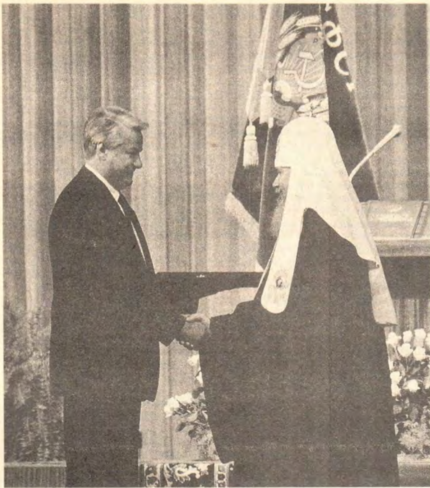
Святейший Патриарх Московский и вся Руси Алексий II приветствует Президента России Б. Н. Ельцина

важнее научиться замечать и понимать, чем зло.