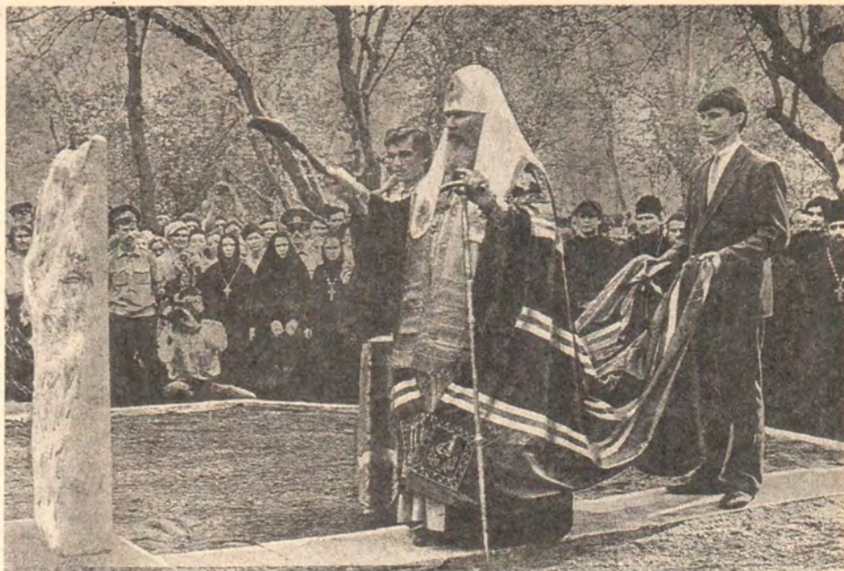
Святейший Патриарх Алексий освящает закладку часовни на месте разрушенного кафедрального собора Томска