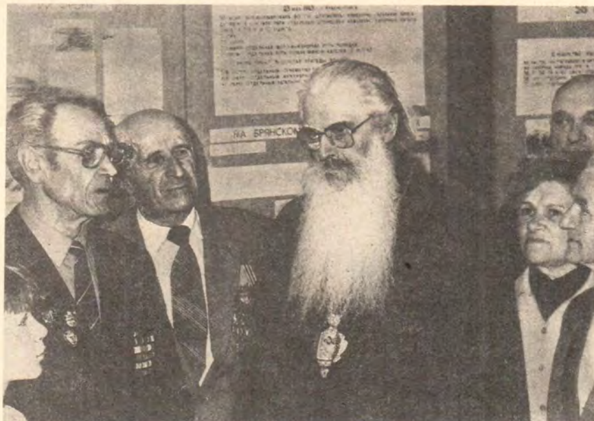
Митрополит Питирим среди ветеранов Великой Отечественной войны

Встреча прошла в обстановке сердечности, открытости и духовного подъема.