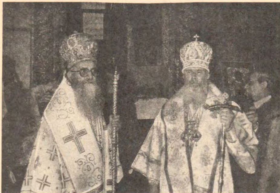
Святейший Патриарх Димитрий обращается с приветственным словом к Святейшему Патриарху Алексию

вопросам. Патриарх Димитрий передал средства в фонд строительства храма в Москве, посвященного 1000-летию Крещения Руси.