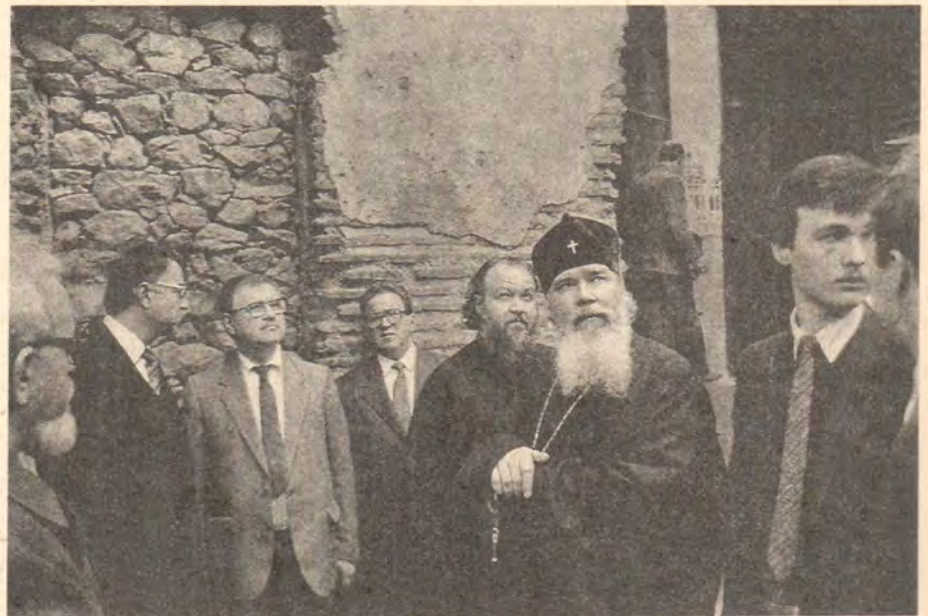
Осмотр достопримечательностей Никеи

В сопровождении митрополитов Халкидонского Варфоломея, Селевкийского Кирилла, профессора Статуридиса и патриаршего хора теплоходом мы добрались до острова. От причала до монастыря, расположенного на холме, нас доставили на конных экипажах: ради сохранения экологической чистоты на острове отсутствует какой-либо иной транспорт. У ворот монастыря была устроена теплая встреча. Игумен митрополит Феодорупольский Герман, митрополиты Амфипольский Феоклит и Тианский Филипп пригласили нас в Свято-Троицкий храм. Совершив краткий молебен, который возглавил Патриарх Алексий, митрополит Герман обратился к Предстоятелю Русской Православной Церкви со словом приветствия, в котором выразил признательность делегации Русской Православной Церкви за посещение острова Халки. Митрополит Герман пожелал Патриарху Алексию помощи Божией в его служении на благо Русской Православной Церкви и всего Православия. Поблагодарив за добрые слова, Святейший Патриарх