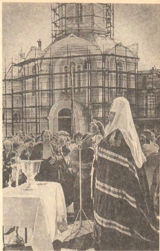
Святейший Патриарх Алексий освящает закладку келейного корпуса Александро-Невского женского монастыря в селе Колывань