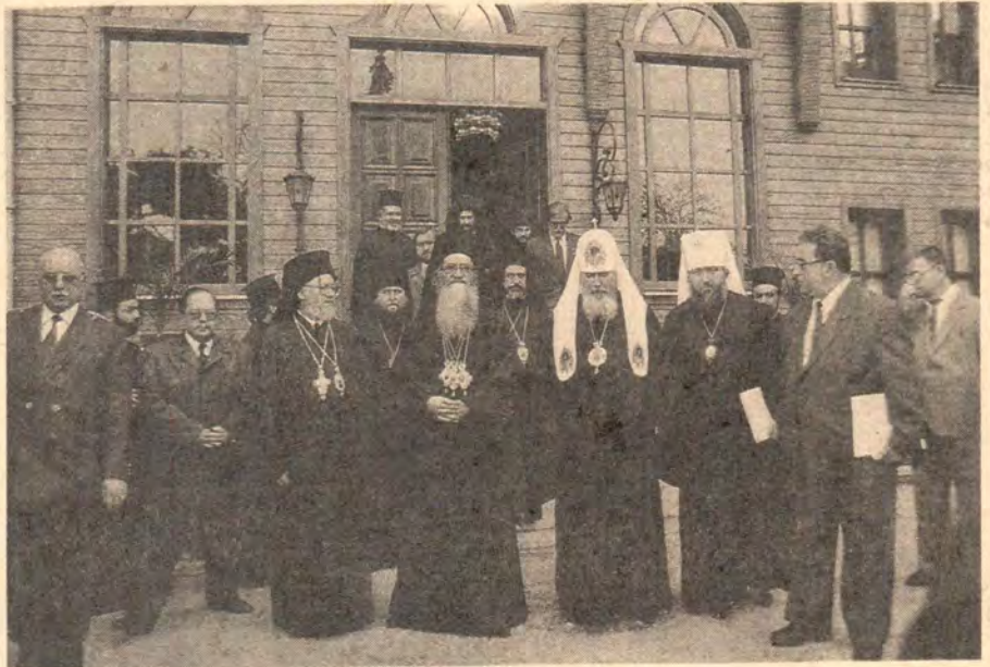
Святейший Патриарх Димитрий I и Святейший Патриарх Алексий II у нового здания Патриархии

Во время трапезы состоялся обмен мнениями по различным проблемам, волнующим обе Церкви.