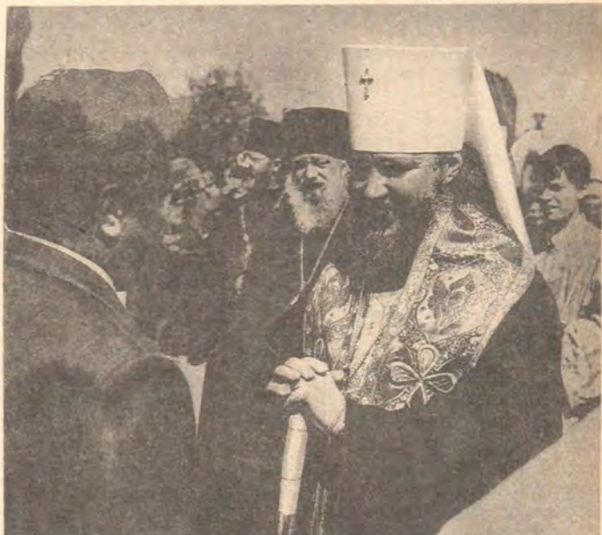
Во время встречи митрополита Кирилла на Смоленской АЭС

Далее Владыка призвал вознести из глубины сердец молитву ко Господу, дабы Он взял под Свой покров это место: Сам же Бог мира да освятит вас во всей полноте