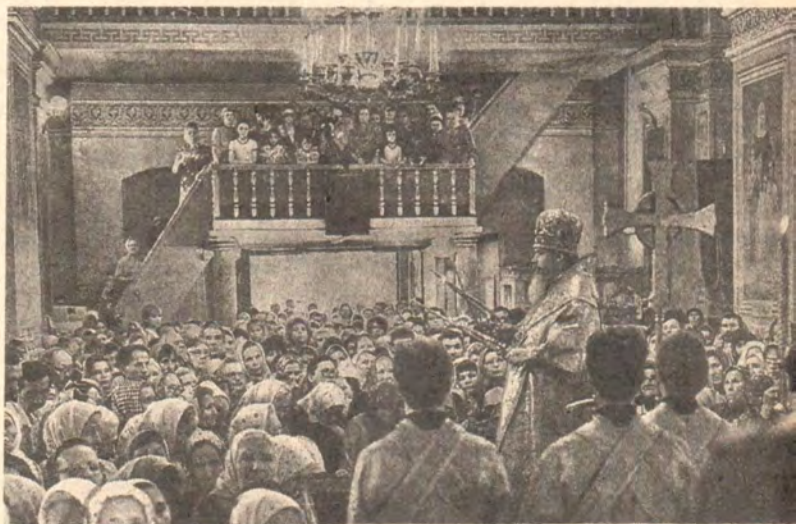
Святейший Патриарх Алексий совершает богослужение в Покровском соборе Барнаула