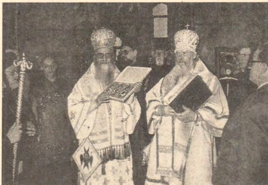
Святые панагии — дар Святейшего Патриарха Алексия Константинопольскому Патриарху Димитрию

По возвращении в гостиницу Святейший Патриарх Алексий устроил прием в честь Святейшего Патриарха Димитрия и членов Священного Синода Константинопольской Православной Церкви. Во время него Предстоятели Церквей выразили удовлетворение по поводу проходящего визита и братских взаимоотношений, продолжили обмен мнениями по актуальным церковным