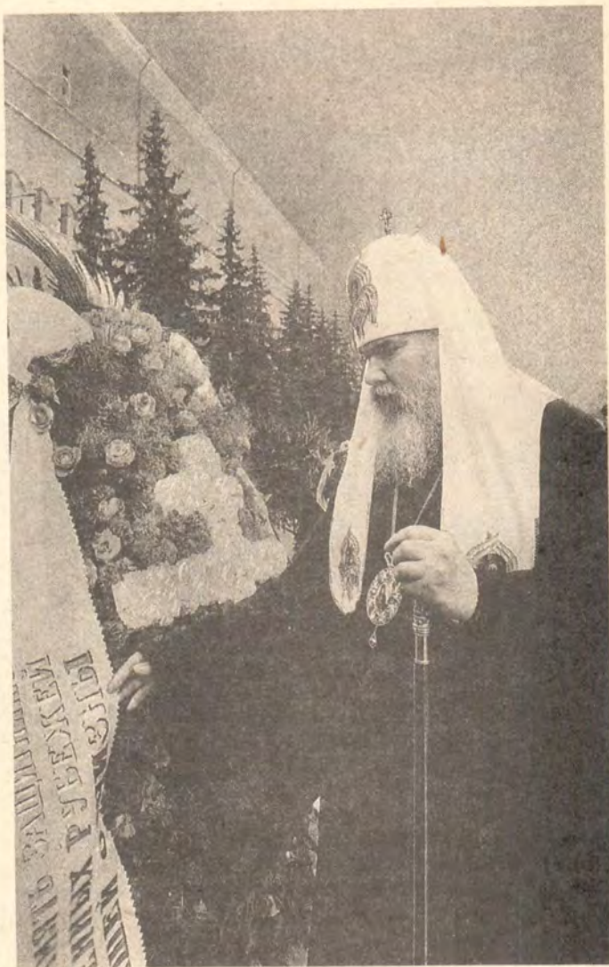
Святейший Патриарх Московский и всея Руси Алексей II во время возложения венка к могиле Неизвестного солдата, 8 мая 1991 года