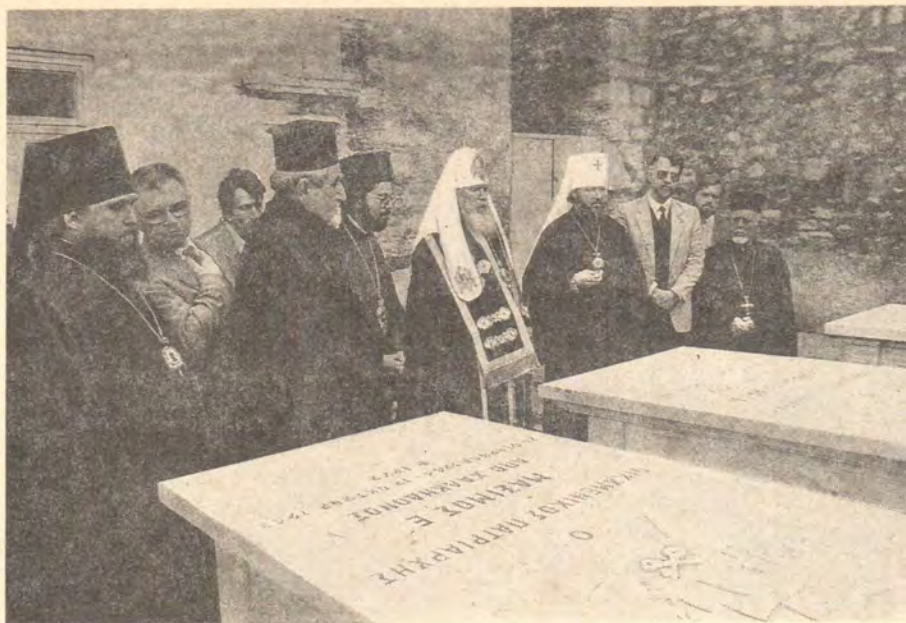
Святейший Патриарх Алексей совершает заупокойную литию у могилы Патриарха Афинагора и других Константинопольских Патриархов