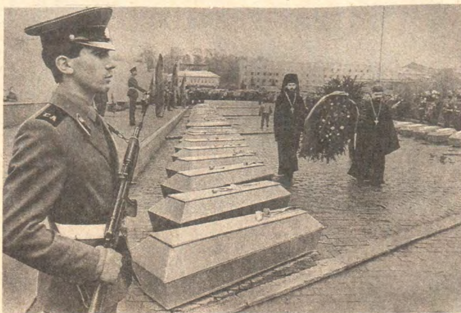
Траурная церемония перезахоронения останков воинов 9 мая 1991 года