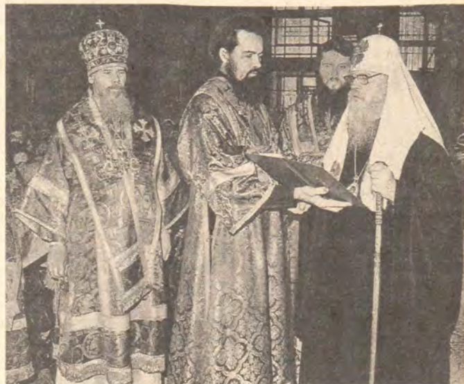
Святейший Патриарх Пимен в Богоявленском патриаршем соборе поздравляет прихожан с Пасхой. Слева — митрополит Ленинградский и Новгородский Алексей (ныне Святейший Патриарх)

И после своего избрания в 1971 году на Патриарший престол новый Предстоятель Русской Православной Церкви оставался прежде всего монахом. Его тяготила внешняя, парадная сторона патриаршего служения. За все время своего Патриаршества, по свидетельству современников, он позволил себе сшить лишь одно новое пальто. Ища прежде всего молитвы и уединения, Святейший не любил пользоваться официальными дачами