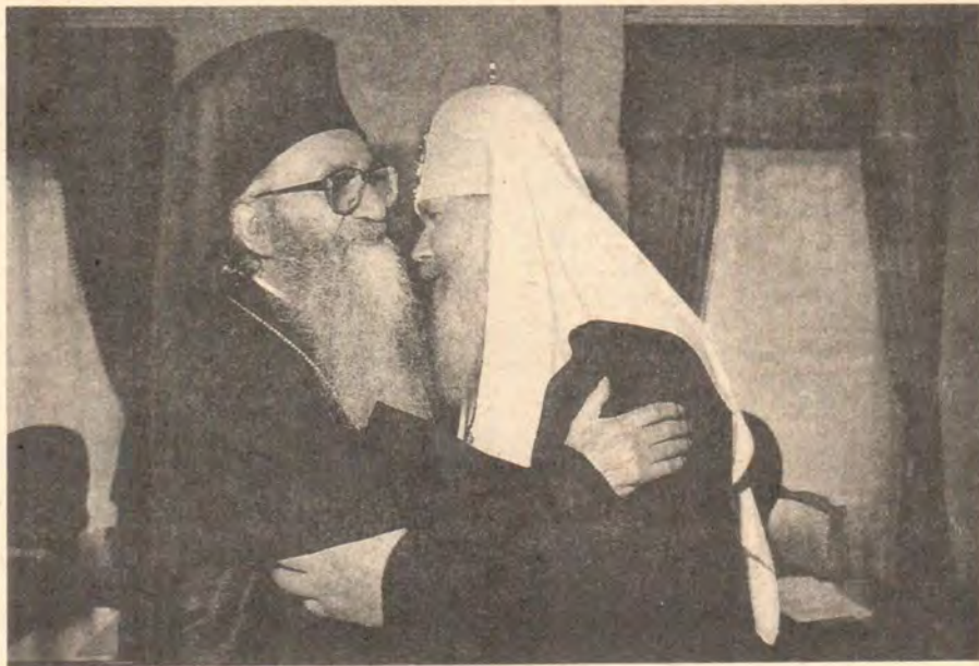
Братская встреча Предстоятелей двух Церквей

В интервью Святейший Патриарх сказал и о проблемах Православных Церквей, прежде всего о давлении на православных Западной Украины со стороны униатов. Его Святейшество подчеркнул, что нажим испытывает не только Русская