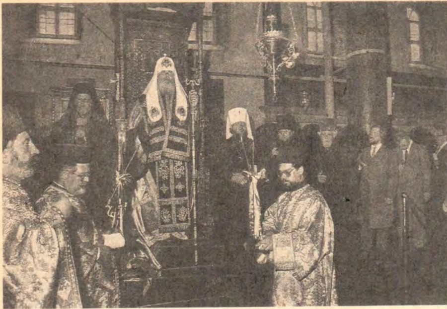
Святейший Патриарх Алексий совершает благодарственный молебен в патриаршем соборе в день прибытия в Стамбул

Православная Церковь, но и Иерусалимская, Румынская, Болгарская, Чехословацкая и другие Православные Церкви.