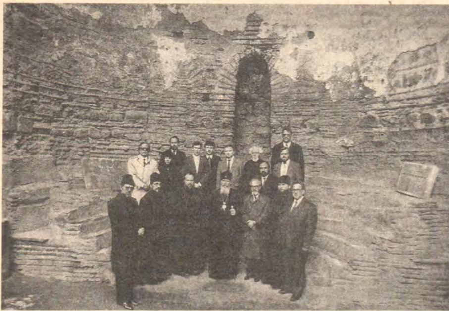
Святейший Патриарх Алексий с членами делегации в храме Никеи, где заседали отцы VII Вселенского Собора

анские символы, орнамент и натуралистические изображения птиц, животных, плодов, исполненные с поразительным мастерством и излучающие внутренний оптимизм.