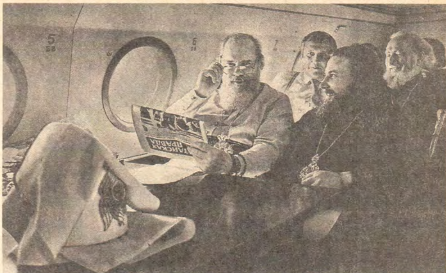
Встреча Святейшего Патриарха Алексия в аэропорту Бийска