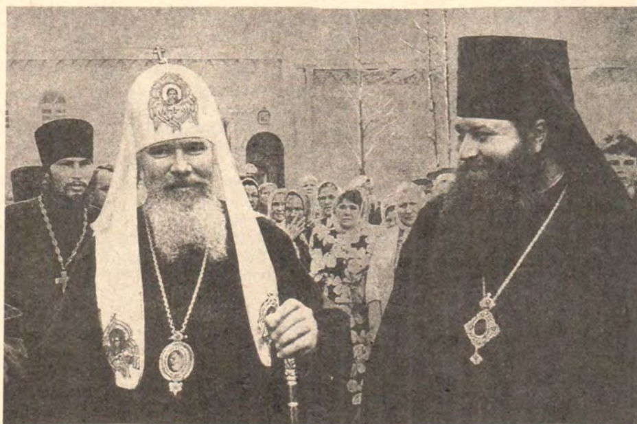
Святейший Патриарх Алексий и епископ Новосибирский и Барнаульский Тихон среди духовенства и верующих в Томске