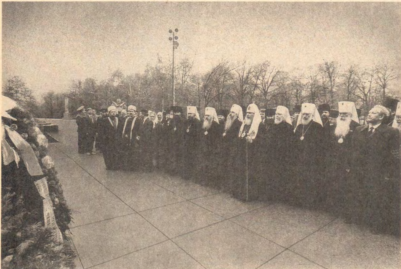
Возложение венка к могиле Неизвестного солдата у Кремлевской стены, 8 мая 1991 года