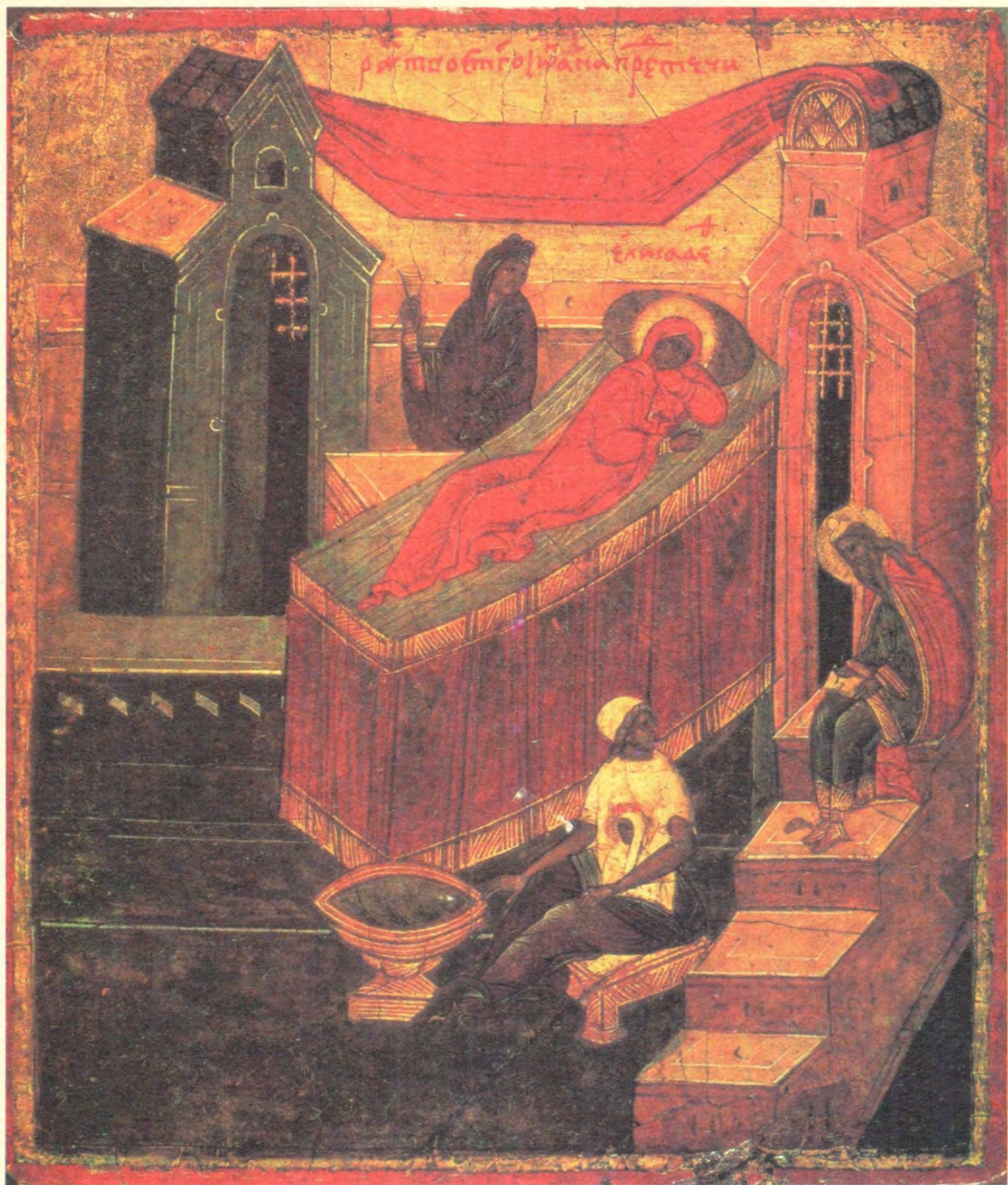
РОЖДЕСТВО ЧЕСТНОГО СЛАВНОГО ПРОРОКА, ПРЕДТЕЧИ И КРЕСТИТЕЛЯ ГОСПОДНЯ ИОАННА Икона конца XVI века