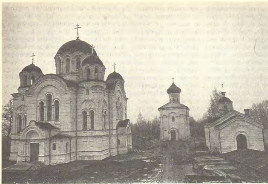
Спасо-Евфросиньевский женский монастырь в г. Полоцке. Слева — Крестовоздвиженский собор, в центре — Спасо-Преображенский храм, справа — трапезная

дит к Богу и что на ней почивает Дух Святой, как венец на главе царской. Епископ подарил Евфросинье указанный Ангелом участок земли, где располагался загородный архиерейский дом, с деревянным Спасским храмом.