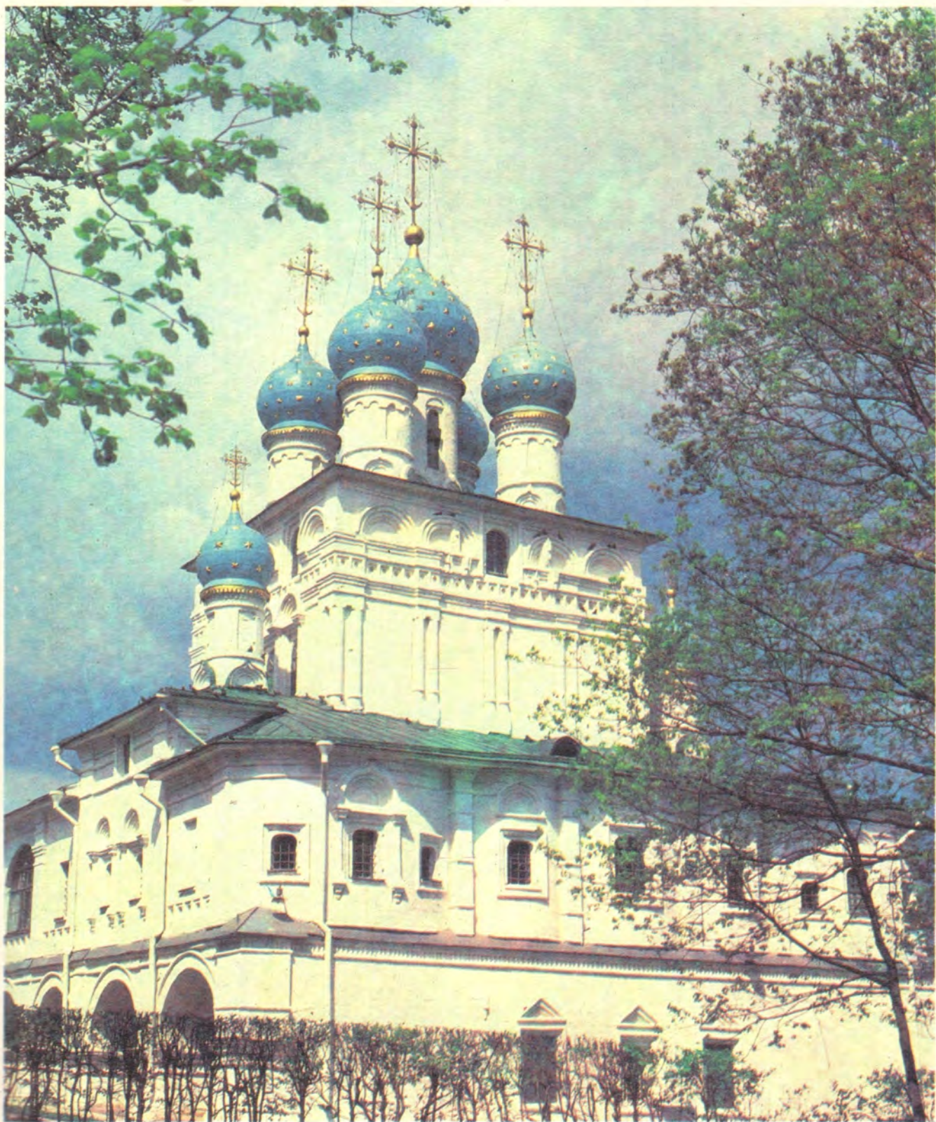
ХРАМ В ЧЕСТЬ КАЗАНСКОЙ ИКОНЫ БОЖИЕЙ МАТЕРИ В с. КОЛОМЕНСКОМ, МОСКВА