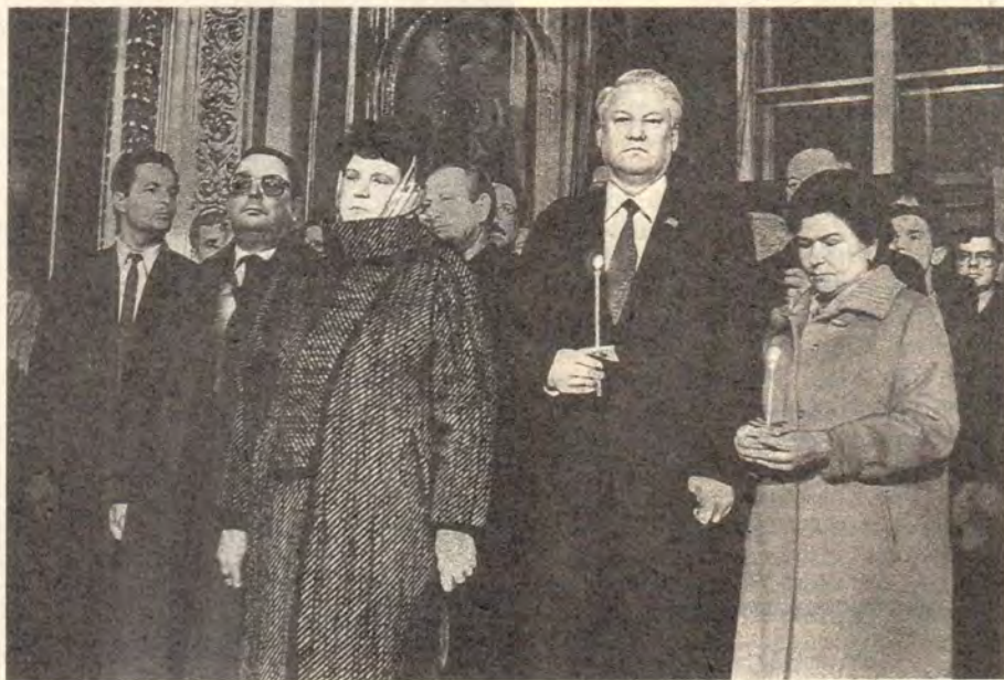
Премьер-министр СССР В. С. Павлов и Председатель Верховного Совета РСФСР Б. Н. Ельцин с супругами на пасхальном богослужении в Богоявленском патриаршем соборе

Сейчас у Церкви есть большие возможности проповедовать слово Божие, просвещать народ светом Евангелия, совершать Таинства, призывать людей к милосердию, добру, к умножению любви. Я сердечно благодарю Вас, Высокопреосвященнейший Владыка митрополит,