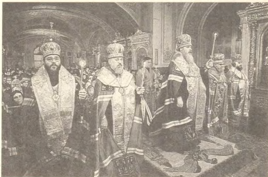
Святейший Патриарх Алексий II в сослужении иерархов совершает молебен в Богоявленском патриаршем соборе о здравии пострадавших от чернобыльской аварии

Богослужение Святейшего Патриарха Алексия и его слово получили отражение в программе «Время» Центрального телевидения, о них сообщалось в прессе.