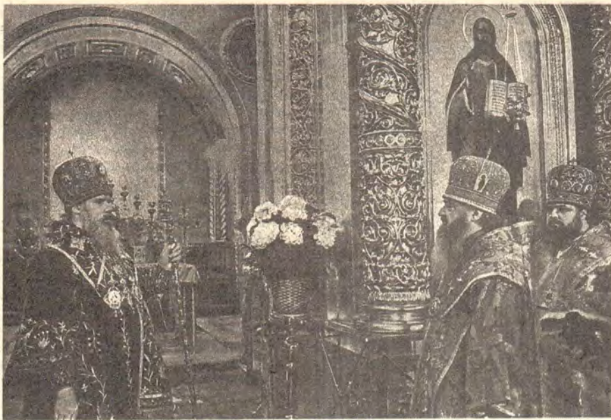
Митрополит Крутицкий и Коломенский Ювеналий поздравляет Святейшего Патриарха Алексия II с Пасхой Христовой 8 апреля 1991 года

Григорий, Истринский Арсений и Подольский Виктор. После литургии состоялся крестный ход, во время которого Святейший Патриарх обратился к верующим с пасхальным поздравлением: