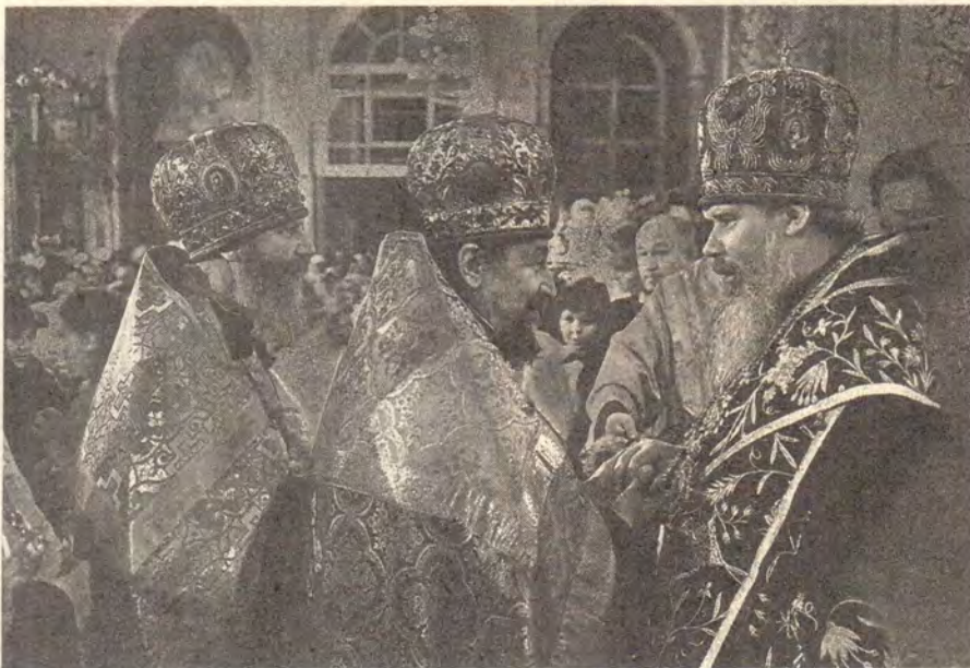
Его Святейшество принимает поздравления с Пасхой Христовой от московского духовенства

Обычно, Ваше Святейшество, приветствуя Предстоятеля Церкви, мы несем ему все наши радости, а больше — скорби и заботы. Но сегодня мне хотелось бы сделать исключение по многим причинам: во-первых, потому что Вы, входя во всю глубину патриаршего управления, больше, чем кто-либо из нас, знаете все нужды нашей Церкви, знаете те заботы, те тревожения, которыми живет вся Ваша паства и наша страна. Я не буду об этом говорить, потому что, встречая Пасху Господню, мы свято верим, что Спаситель мира Сам по молитвам Церкви может это уврачевать. Именно об этом размышляя, святой Иоанн Златоуст восклицал: «День Воскресения Господа нашего Иисуса Христа — основание мира, начало примирения, прекращение вражды, разрушение смерти, поражение дьявола». Мы верим, что Вашими святыми молитвами Воскресший Господь даст все