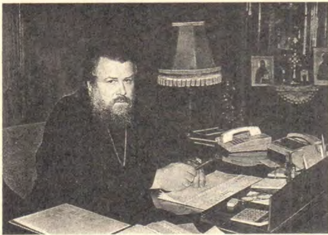
Епископ Подольский Виктор, председатель Хозяйственного управления Московской Патриархии, в рабочем кабинете

Определением Священного Синода Русской Православной Церкви от 20 июля 1990 года епископ Подольский Виктор (Пьянков) назначен председателем Хозяйственного управления (ХОЗУ) Московской Патриархии. Владыка Виктор хорошо знаком со строительными и производственными аспектами жизни Церкви: с 1983 по 1986 год он в сане архимандрита возглавлял