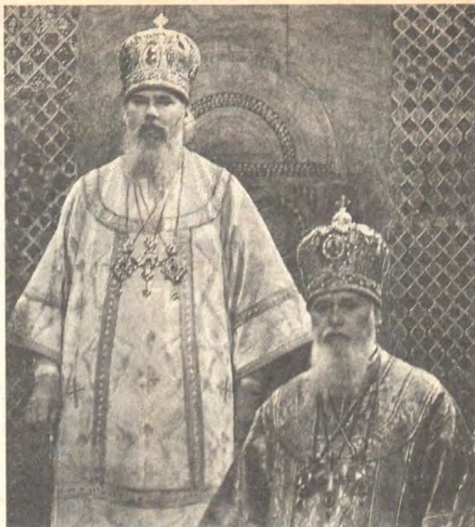
Святейший Патриарх Алексий II и Блаженнейший митрополит Филарет Киевский и всея Украины в алтаре Софийского собора

5 ноября Святейший Патриарх совершил всенощное бдение в Преображенском храме на Б. Ордынке в сослужении архиепископа Чебокс-