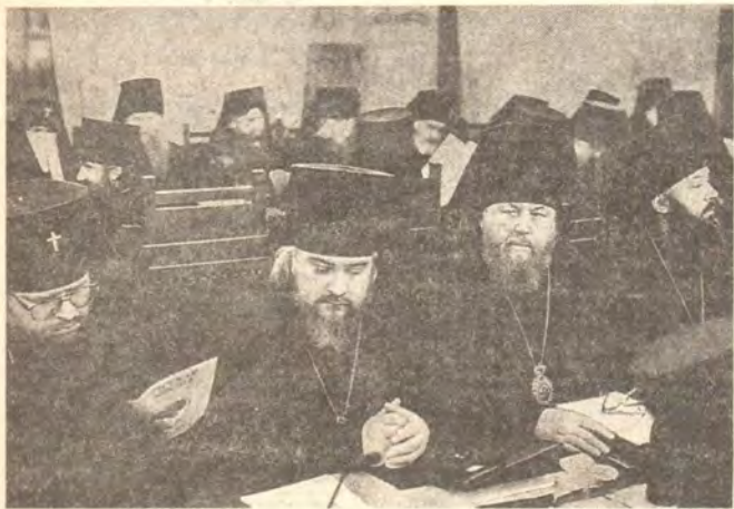
Во время работы с документами Архиерейского Собора

Обращаясь к появившимся в нашей стране своим последователям, иерархи Русской Зарубежной Церкви предписывают им «не вступать в евхаристическое общение с Московской Патриархией», пока последняя не отречется от Декларации Митрополита Сергия и не отстранит от церковного управления иерархов, которым они вменяют в вину «антиканонические и аморальные поступки». Такое предписание клирикам и мирянам относительно их разрыва с иерархией, имеющей каноническое признание со стороны всей Православной Полноты в лице епископата Автокефальных и Автономных Поместных Православных Церквей, в соответствии с первым правилом святого Василия Великого может быть однозначно квалифицировано как подстрекательство к раско-