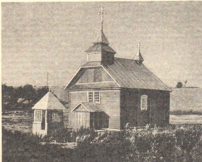
Восстановленный храм во имя Пророка Божия Илии в селе Комайске

А через день, 2 августа, Святая Православная Церковь праздновала память святого Пророка Божия Илии. Это престольный праздник возрожденного храма — «кирмаш». На протяжении всей истории села он был самым главным (наряду с днем памяти местночтимого святого Исидора) праздником сельчан. Весть об освящении церкви привлекла на молитву в нее множество народа из дальних сел и деревень. Люди разных возрастов, женщины, мужчины и множество детей, приобщились Святых Христовых Таин. Причащение длилось