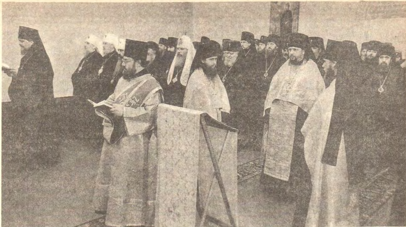
Молитва перед открытием Архиерейского Собора