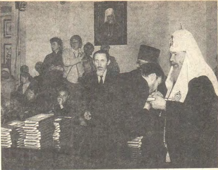
Святейший Патриарх Московский и всея Руси Алексий II вручает дипломы выпускникам ЛДАиС