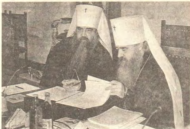
За столом президиума Собора — Патриарший Экзарх всея Белоруссии митрополит Минский и Гродненский Филарет и митрополит Крутицкий и Коломенский Ювеналий

Позже в дополнение к указанным документам Архиерейский Синод Русской Зарубежной Церкви обратился с посланием «К верным чадам Русской Православной Церкви, в Отечестве и в рассеянии сущим», в котором, повторяя прежние обвинения в адрес Священноначалия Московского Патриархата, заявляет о своем неприятии решений Поместного Собора, проходившего в Троице-Сергиевой Лавре в июне 1990 года. Так, они отказываются признавать выборы нового Всероссийского Патриарха в качестве «соборного волеизъявления Русской Церкви» и вообще намекают, что в своих деяниях Собор не был внутренне свободен. Но если весь мир был свидетелем как острых дискуссий в ходе соборных заседа-