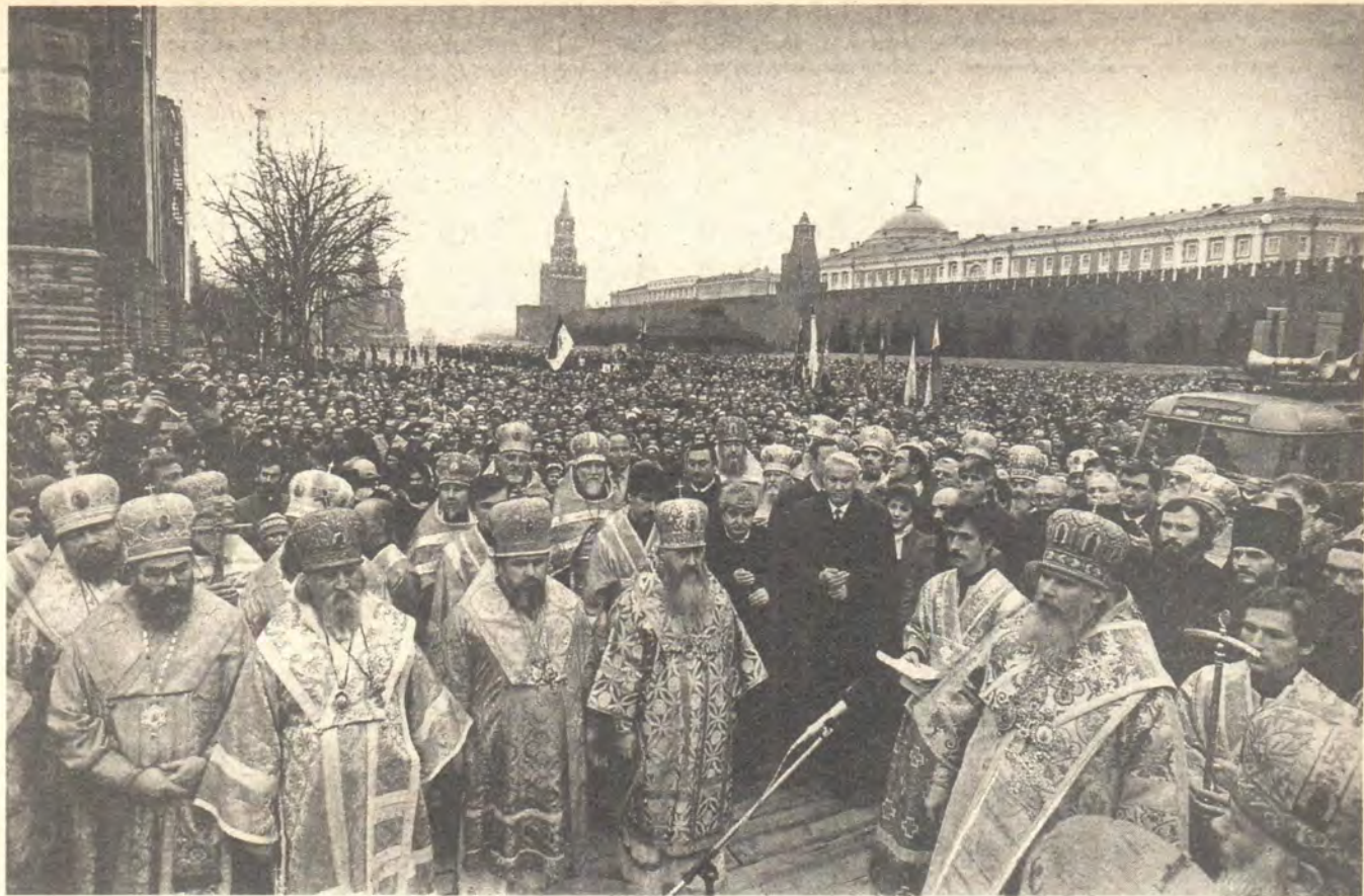
На Красной площади в день празднования Казанской иконы Божией Матери и торжественной закладки камня воссоздаваемого Казанского собора, 4 ноября 1990 года

для участия в воспитании подрастающего поколения. Этому способствует принятый недавно Закон о свободе совести. Будем же стремиться к нравственному возрождению.