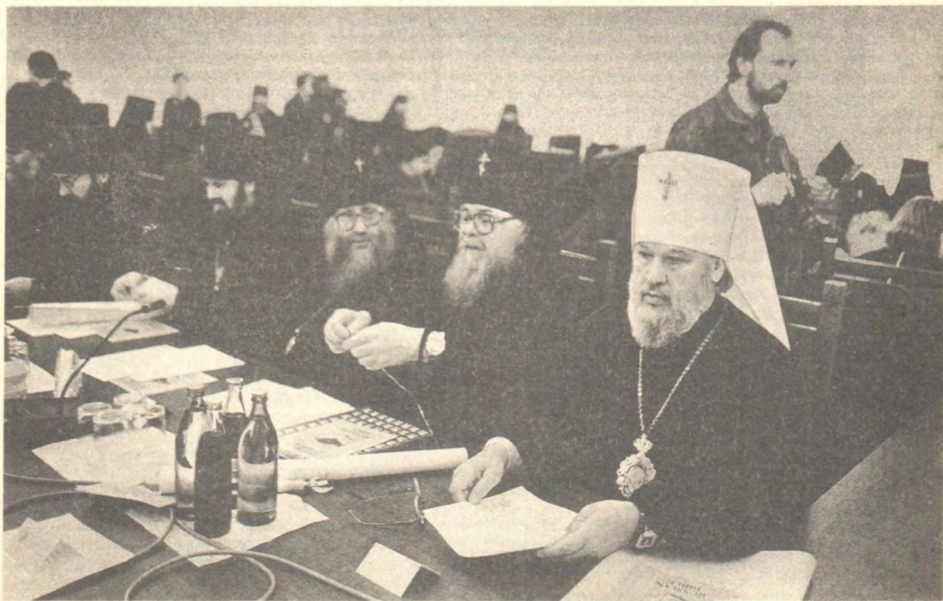
В зале заседаний