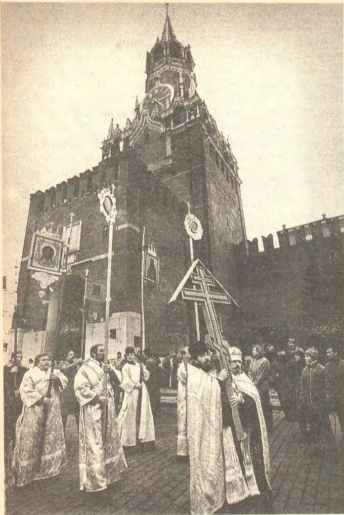
Во время крестного хода 4 ноября