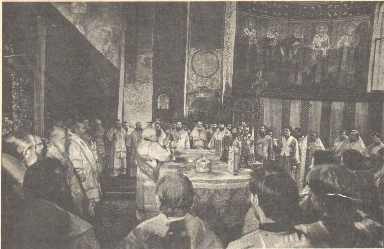
Во время Божественной литургии в Софийском соборе Киева 28 октября 1990 года