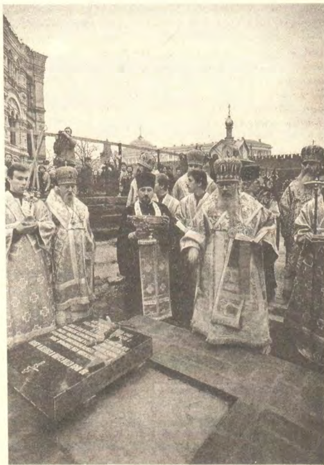
Освящение закладного камня воссоздаваемого Казанского собора

Святейший Патриарх поблагодарил тех, кто способствовал началу воссоздания Казанского собора. «Прошу только помнить, — сказал он, — о том, что труду храмостроителя должен сопутствовать подвиг молитвы. В кондаке Казанской иконе Бо-