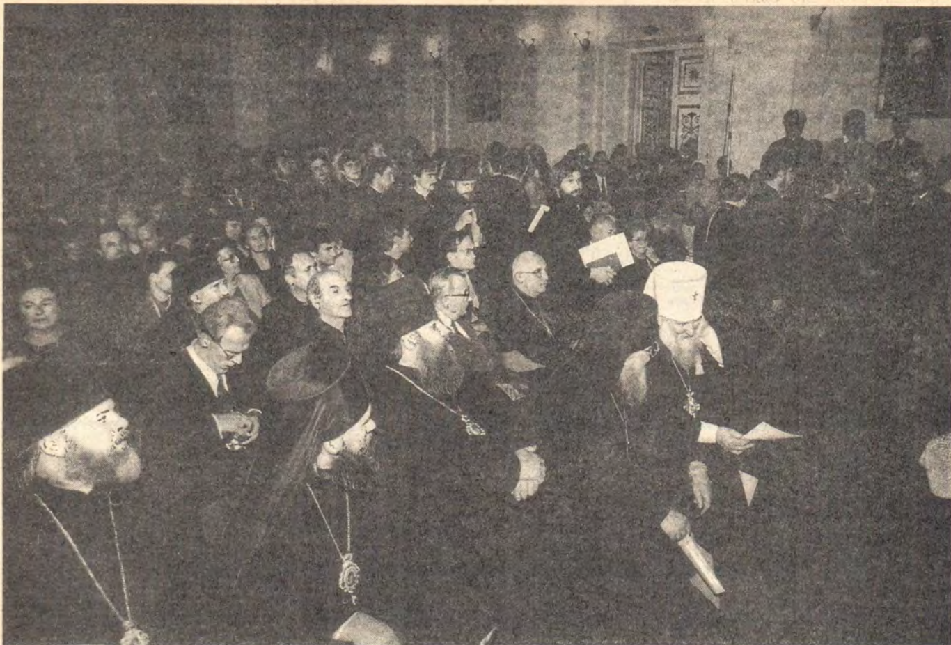
В актовом зале Ленинградских Духовных школ

ву. Через все испытания Церковь пронесла неповрежденными духовно-нравственные ценности и сегодня готова поделиться ими с обществом, которое нуждается в духовно-нравственном обновлении».