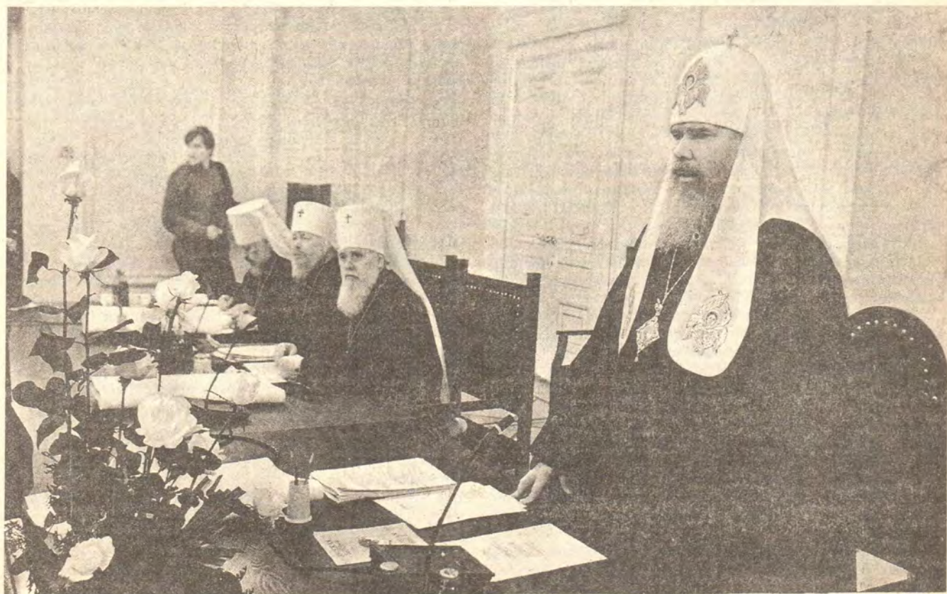
Святейший Патриарх Алексий II обращается к участникам Собора