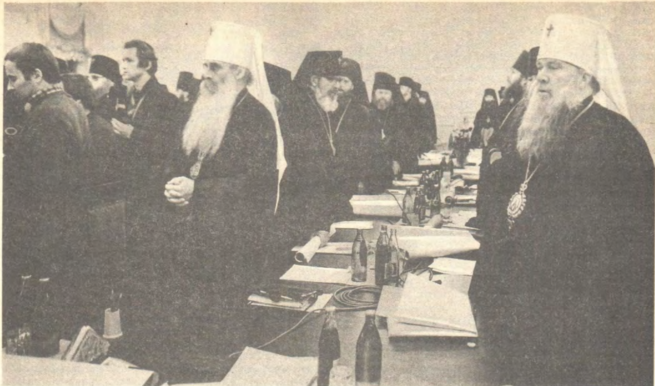
Участники Архиерейского Собора