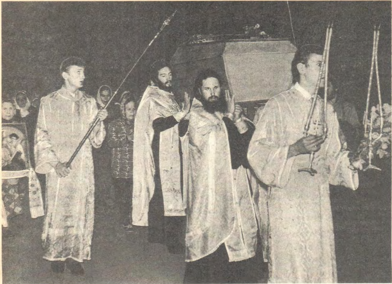
Перенесение мощей святителя Иннокентия в кафедральный собор, г. Иркутск