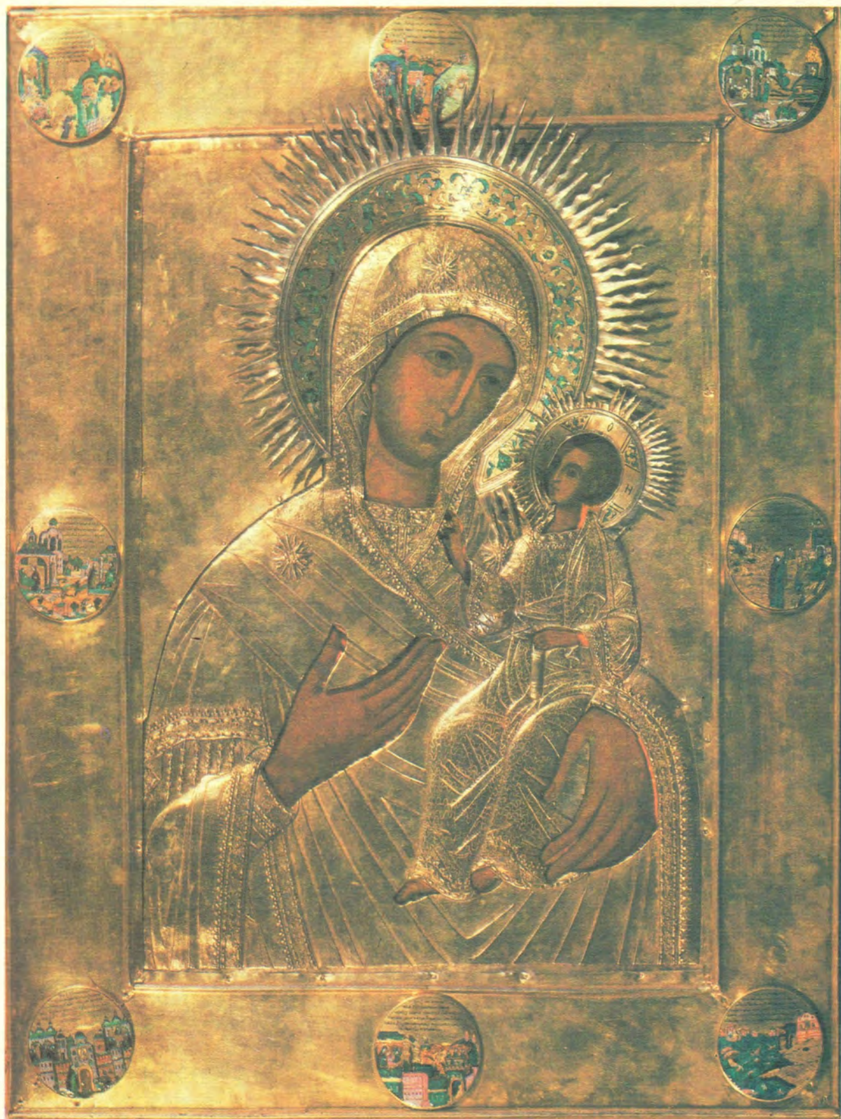
ИВЕРСКАЯ ИКОНА БОЖИЕЙ МАТЕРИ, С КЛЕЙМАМИ XVII ВЕКА (келейный образ царевны Софии)