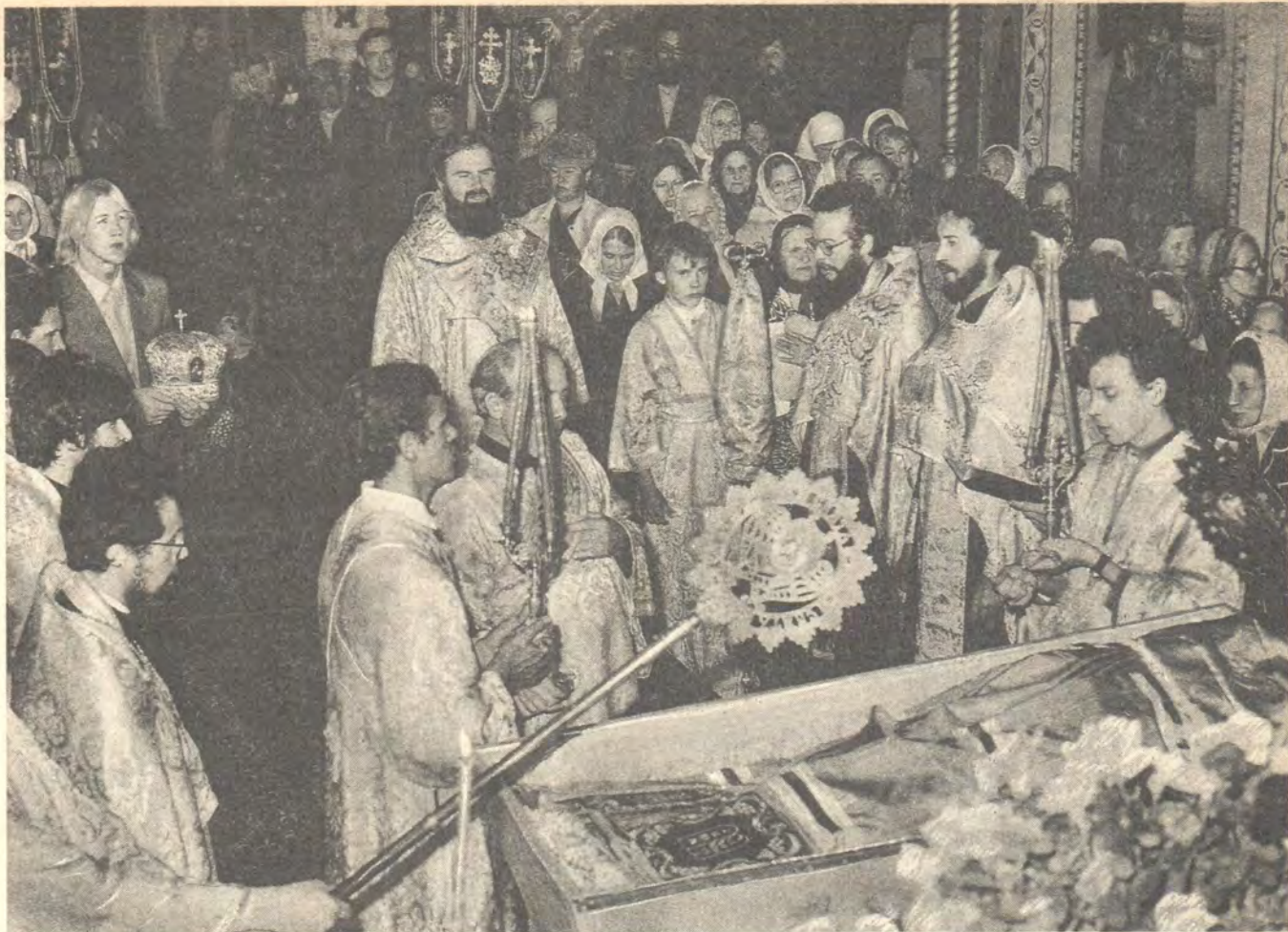
Торжественный молебен у раки с мошами святителя Иннокентия