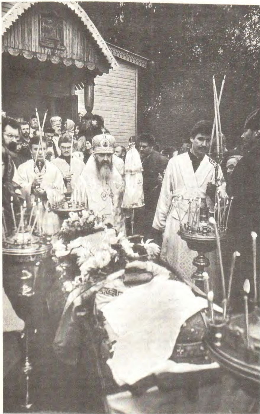
Отпевание отца Александра Меня совершает митрополит Крутицкий и Коломенский Ювеналий

Я помню одну из последних бесед с отцом Александром, когда он с глубоким восторгом говорил о тех возможностях, которые сегодня открылись для Церкви. И я спросил его тогда: «Вы популярный человек. Почему же Вы не баллотировались в народные депутаты?» И он мне ответил со свойственной ему искренностью и детской простотой: «Владыка!