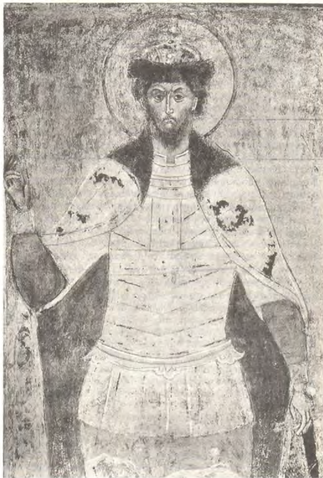
Святой благоверный князь Андрей Боголюбский. Фреска XV—XVI веков собора в честь Успения Пресвятой Богородицы Княгинина монастыря во Владимире

Аняния Феодоров, опираясь на свидетельство соборного протопопа Иоанна Виноградова, жившего до 1741 года, пишет, что «третьи входныя церковныя двери Корсунския, кои имелись с полунощной стороны ...и Живоворящий крест Господень Корсунский, пребогато украшенный камением и жемчугом драгоценным», были увезены в Москву в Успенский собор. Это произошло в 1401 году. Упомянутые северные врата из