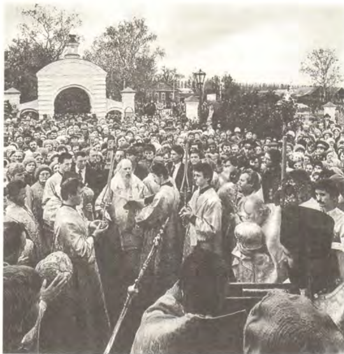
Крестный ход в день празднования 600-летия храма Рождества Богородицы в селе Городня (Тверская епархия) 30 сентября 1990 года

Выйдя из храма, Святейший Владыка направился к площади, где собрались тысячи людей — жители Городни, окрестных сел и поселков Радченко, Редкино, Видогощи. Обратившись к народу, Его Святейшество отметил, что на протяжении шести веков этот храм был домом молитвы и училищем благочестия. «Шесть веков люди Божии несли сюда свои радости и скорби, принимали Святое Крещение, здесь провожала их Церковь в путь вся земля... Увидим же друг в друге