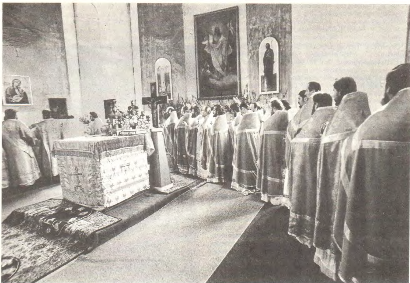
В алтаре собора Задонского монастыря

После революции 1917 года, когда Задонск вошел в Орловскую область, мощи святителя были конфискованы и помещены в Областной краеведческий музей. Во время Великой Отечественной войны их вернули Церкви, несколько лет они почивали в Богоявленском кафедральном соборе города Орла, но в начале 60-х годов, перед закрытием собора, были вновь конфискованы.