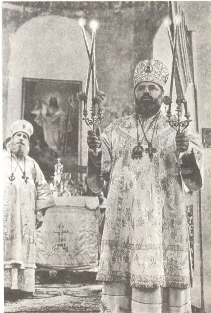
Божественную литургию совершают митрополит Мефодий и архиепископ Пимен

В 1767 году святитель из-за слабого здоровья удалился на покой в Толшевский монастырь, а спустя два года перешел в Богородицкий монастырь города Задонска. Там он написал самые известные свои творения: «Сокровище духовное, от мира собираемое» (1770) и «Об истинном христианстве» (1776).