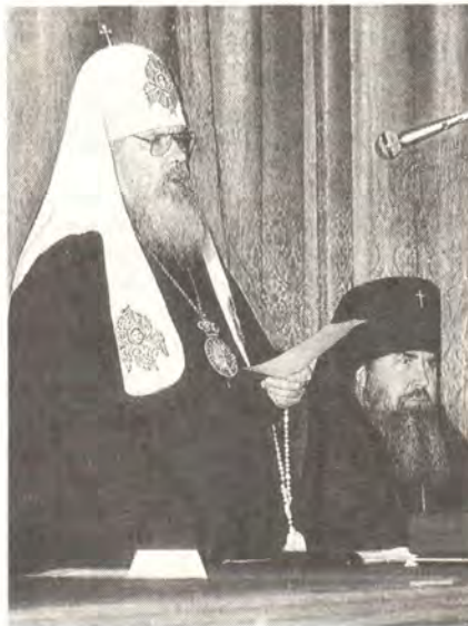
Патриарх Московский и всея Руси Алексий II выступает на годичном акте в МДАиС

Затем Божественную литургию совершили Высокопреосвященный архиепископ Александр, ректор Московских Духовных школ,