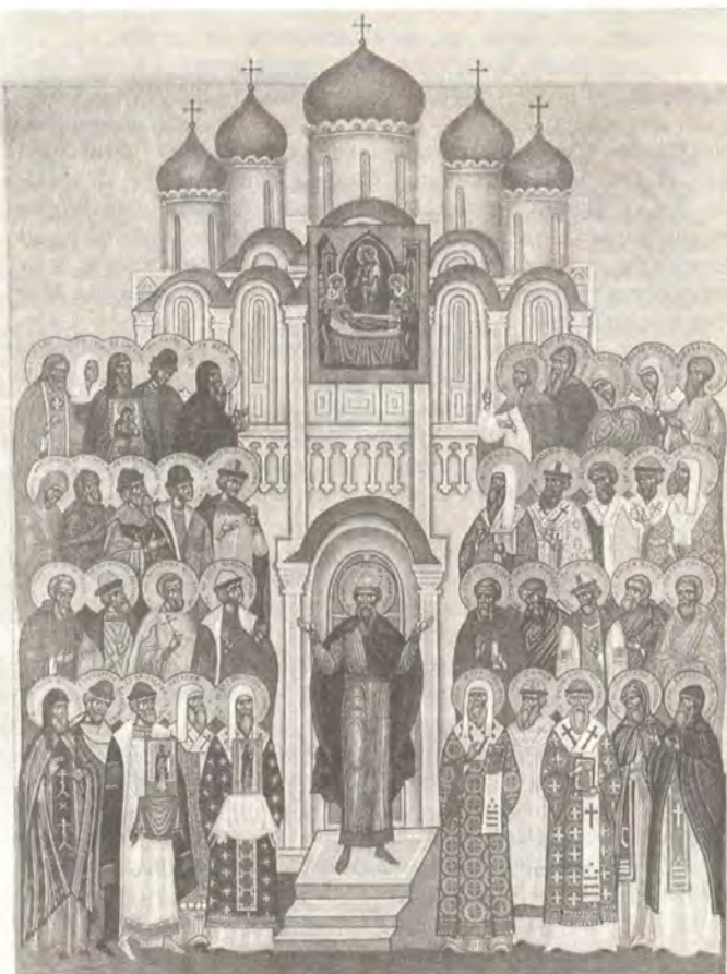
Икона «Собор Владимирских святых» из Успенского собора во Владимире

Не всегда одинаково сообщают тексты и о числе епископов, прибывших со святым князем Владимиром в Суздальскую землю. Киевский и Российский Синописи