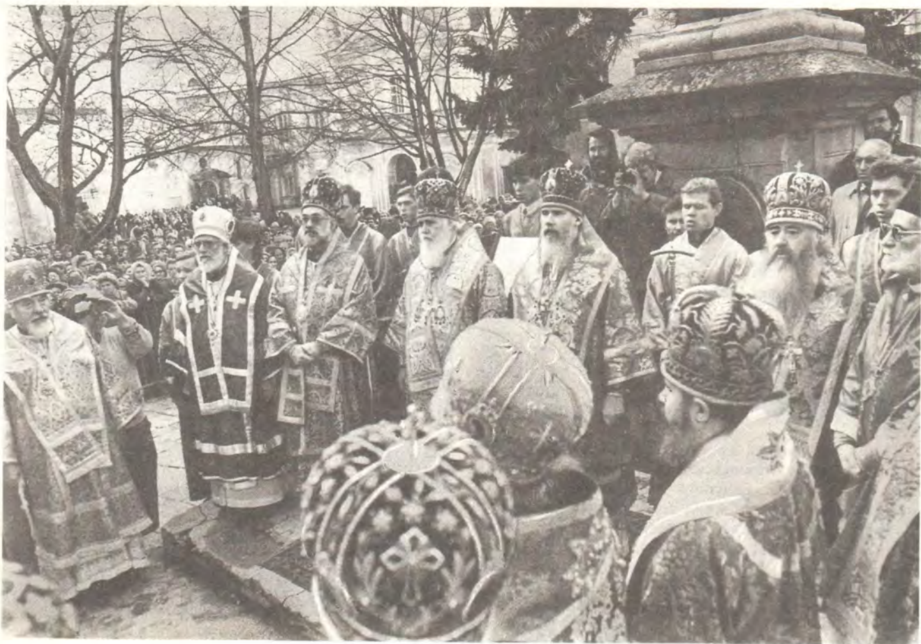
Молебен в Троице-Сергиевой Лавре в день памяти Преподобного Сергия 8 октября

братьев и сестер», — сказал Его Святейшество в заключение.