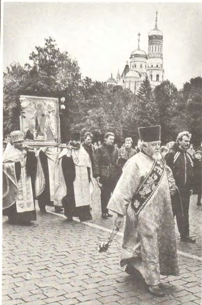
Крестный ход из Московского Кремля направляется к храму Большого Вознесения

Поддержать эту жизнь — зависит от нас, от нашей верности Христу. К Нему, Спасителю нашему, укрепленные молитвой Всех святых земли Русской, мучеников и исповедников веры Христовой и нашей с вами общей молитвой, мы обращаемся: да осенит Господь Своим благословением наши благие дела, наши духовные искания и возрождение!