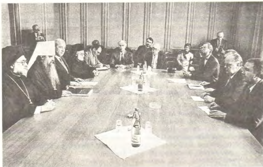
Участники встречи во время приема в Доме правительства 4 октября 1990 года

храм во имя Марии Магдалины и ныне восстанавливаемый кладбищенский храм-памятник во имя святого благоверного князя Александра Невского, а также совершили поездку в Жировицкий монастырь и находящуюся в нем Минскую Духовную Семинарию.