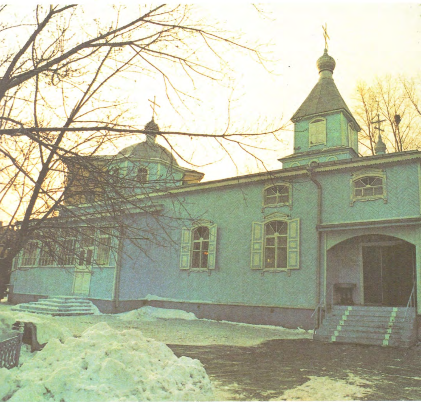
ХРАМ РОЖДЕСТВА ХРИСТОВА В г. ХАБАРОВСКЕ