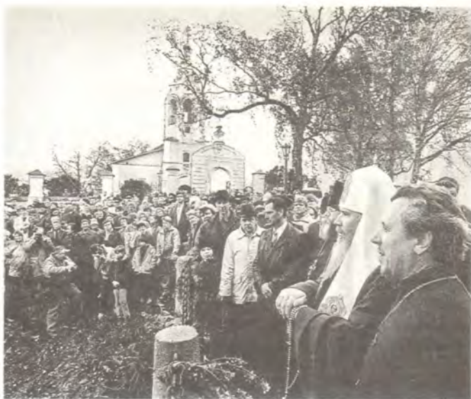
Святейший Патриарх Алексий беседует с прихожанами храма Рождества Богородицы в селе Городня

Святейший Патриарх сердечно поблагодарил