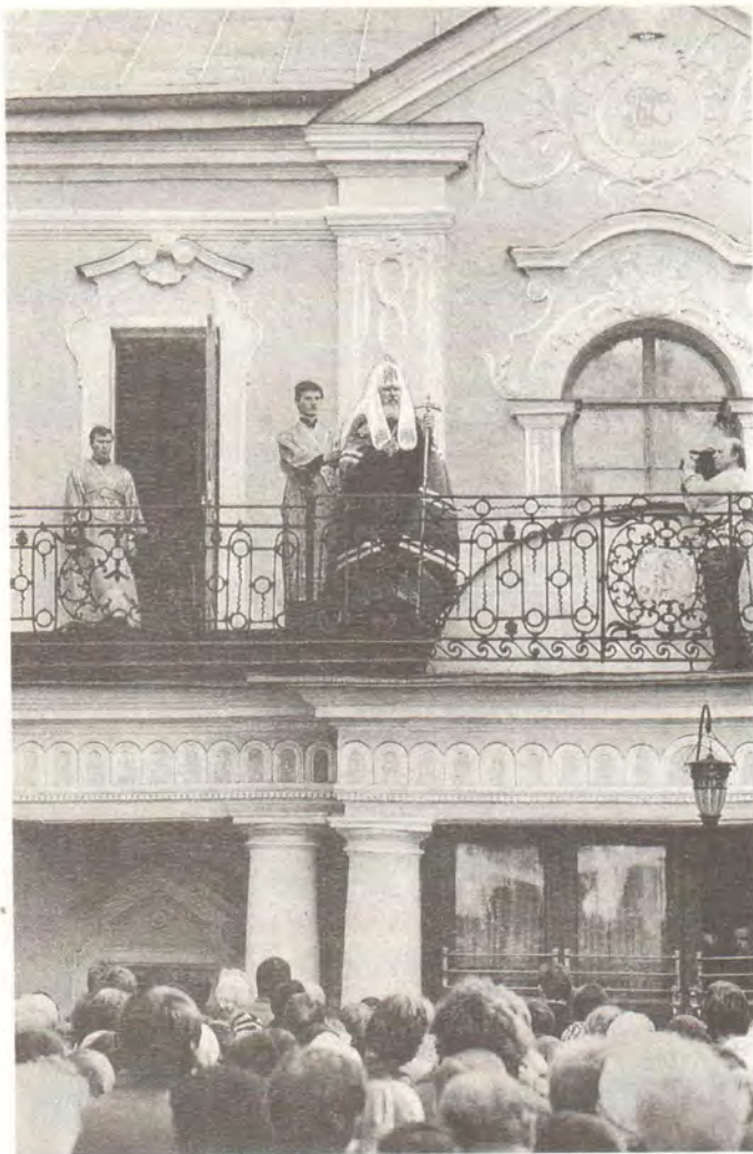
Святейший Патриарх Московский и всея Руси Алексий II благословляет народ с балкона Патриарших покоев

8 октября, в день преставления Преподобного Сергия, игумена Радонежского и всея России чудотворца, в Успенском соборе Троице-Сергиевой Лавры Святейший Патриарх совершил Божественную литургию в сослужении митрополитов Тирольского и Серентийского Пантелеимона (Константинопольский Патриархат), Нубийского Дионисия (Александрийский Патриархат), Лемесского Хрисанфа (Кипрская Архиепископия), Одесского и Херсонского Леонтия, Воронежского и Липецкого Мефодия, архиепископов Смоленского и Калининградского Кирилла, Нижегородского и Арзамасского Николая, Рязанского и Касимовского Симона, Калужского и Боровского Климента, Солнечногорского Сергия, епископов Филиппопольского Нифона (Антиохийский Патриархат), Ташкентского и Среднеазиатского Владимира, Тамбовского и Мичуринского Евгения, Аргентинского и Южноамериканского Марка, Тверского и