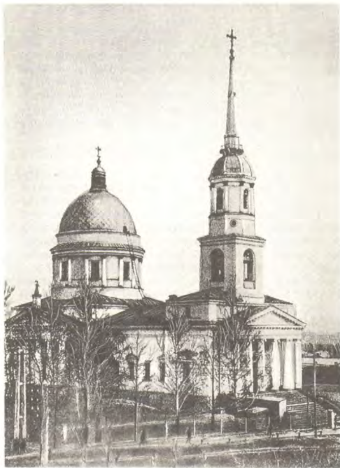
Собор во имя Александра Невского в г. Ижевске. Снимок начала 20-х годов

В Ижевске, где до революции было в десять раз меньше населения, но почти во столько же раз боль-