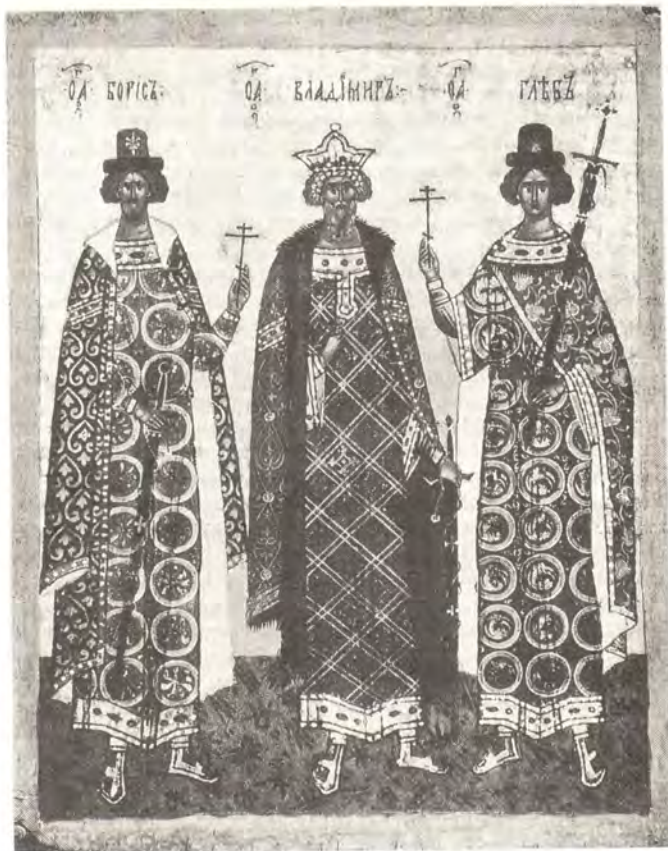
Икона святого равноапостольного великого князя Владимира и святых благоверных князей Бориса и Глеба. Новгородская школа

Архиепископ Суздальский Серапион (1634—1653) по указу царя Михаила Феодоровича в 1635 году