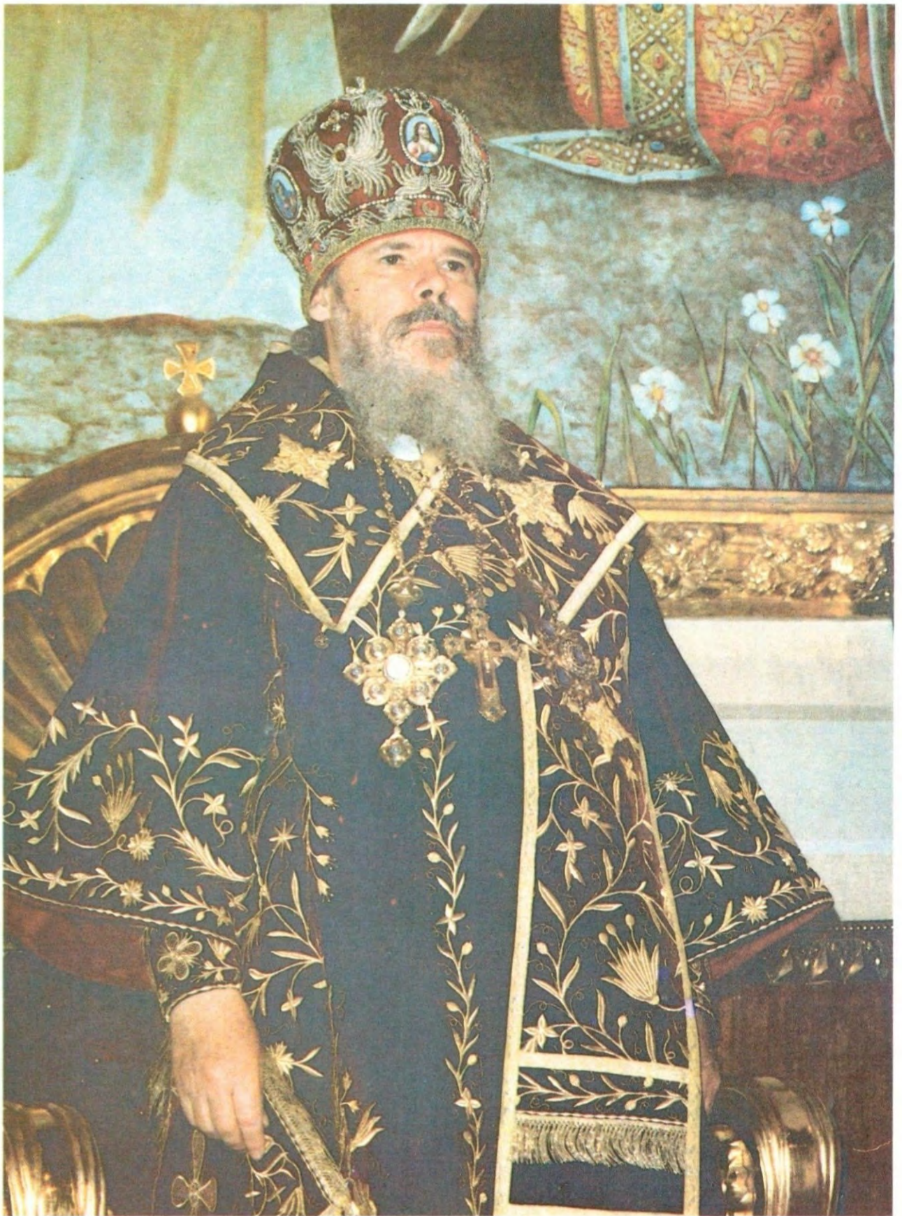
Святейший Патриарх Алексий II на горнем месте в Богоявленском патриаршем соборе в день интронизации