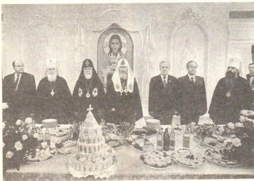
На официальном приеме в Свято-Даниловом монастыре в честь Святейшего Патриарха Алексия II

— Ваше Святейшество, дорогой и зело возлюбленный во Христе брат! Сегодня невольно вспоминаются слова святого апостола Иоанна Богослова: Всякий, рожденный от Бога, побеждает мир (1 Ин. 5, 4). Велика наша радость, так как по воле Божией сегодня взошел на Патриарший престол достойный преемник Всероссийских Первоиерархов Святейший Патриарх Московский и всея Руси Алексий Второй. Свершилась воля Божия — рожденный от Бога победит мир. Вам, Ваше Святейшество, сегодня Господь верил обширную всерос-