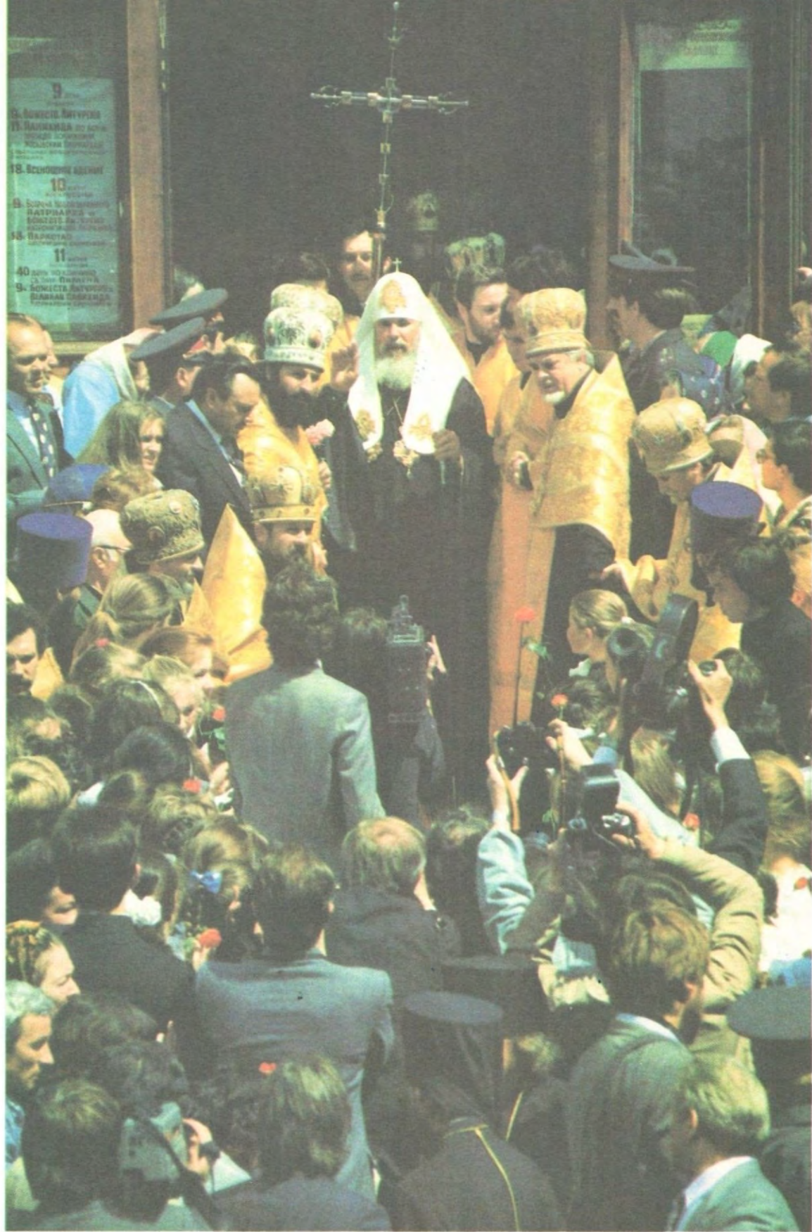
При выходе из Богоявленского собора после интронизации Святейший Патриарх Алексий преподает верующим свое первосвятительское благословение