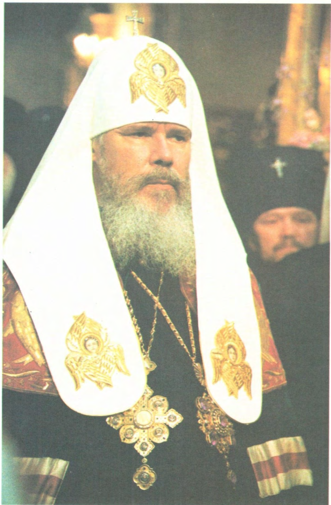
СВЯТЕЙШИЙ ПАТРИАРХ МОСКОВСКИЙ И ВСЕЯ РУСИ АЛЕКСИЙ