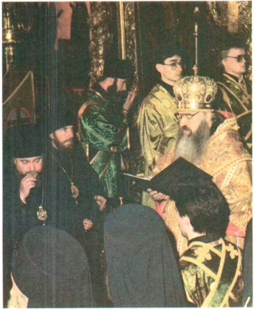
Митрополит Крутицкий и Коломенский Ювеналий зачитывает Деяние Поместного Собора о канонизации отца Иоанна Кронштадтского. Успенский собор Лавры, 8 июня 1990 года