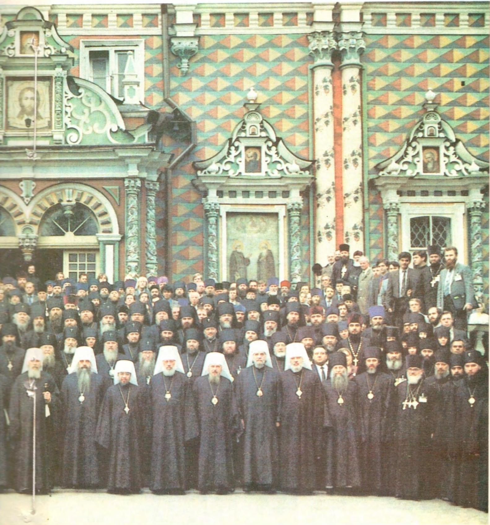
ОЙ ПРАВОСЛАВНОЙ ЦЕРКВИ В ТРОИЦЕ-СЕРГИЕВОЙ ЛАВРЕ — 8 июня 1990 года