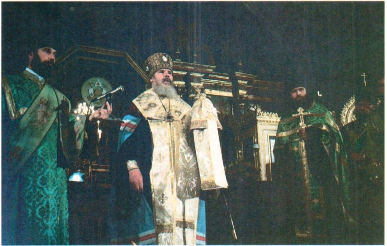
Благодарственный молебен после избрания митрополита Ленинградского и Новгородского Алексия Патриархом Московским и всея Руси, 7 июня 1990 года