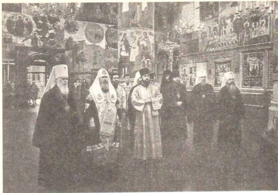
Святейший Патриарх Алексий II и постоянные члены Священного Синода во время молебна в Успенском соборе Кремля

Москве, и Гавриил, представитель Патриарха Болгарского, настоятель Болгарского подворья в Москве, представители Армянской Апостольской и Римско-Католической Церкви в СССР.