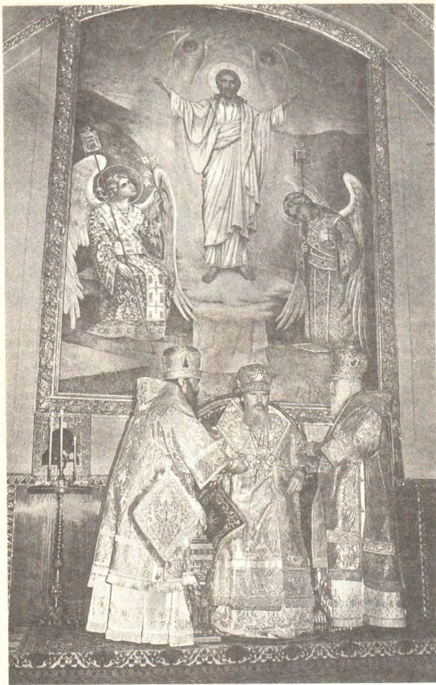
Митрополит Киевский и Галицкий Филарет и митрополит Минский и Гродненский Филарет на горнем месте в алтаре Богоявленского собора посаждают на Престол святых Первосвятителей Российских новоизбранного Святейшего Патриарха Алексия II

отче праведный Иоанне... моли Всезлагодного Бога умирить мир и спасти души наша,— молился Собор.