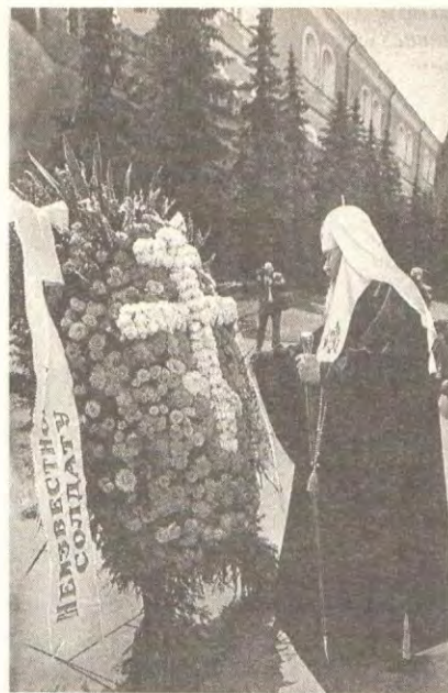
Святейший Патриарх Алексий II у могилы Неизвестного солдата

— Мне очень приятно передать поздравление от нашего святого Антиохийского престола, от имени Блаженнейшего Патриарха Великой Антиохии и всего Востока Игнатия IV по случаю Вашего восше-