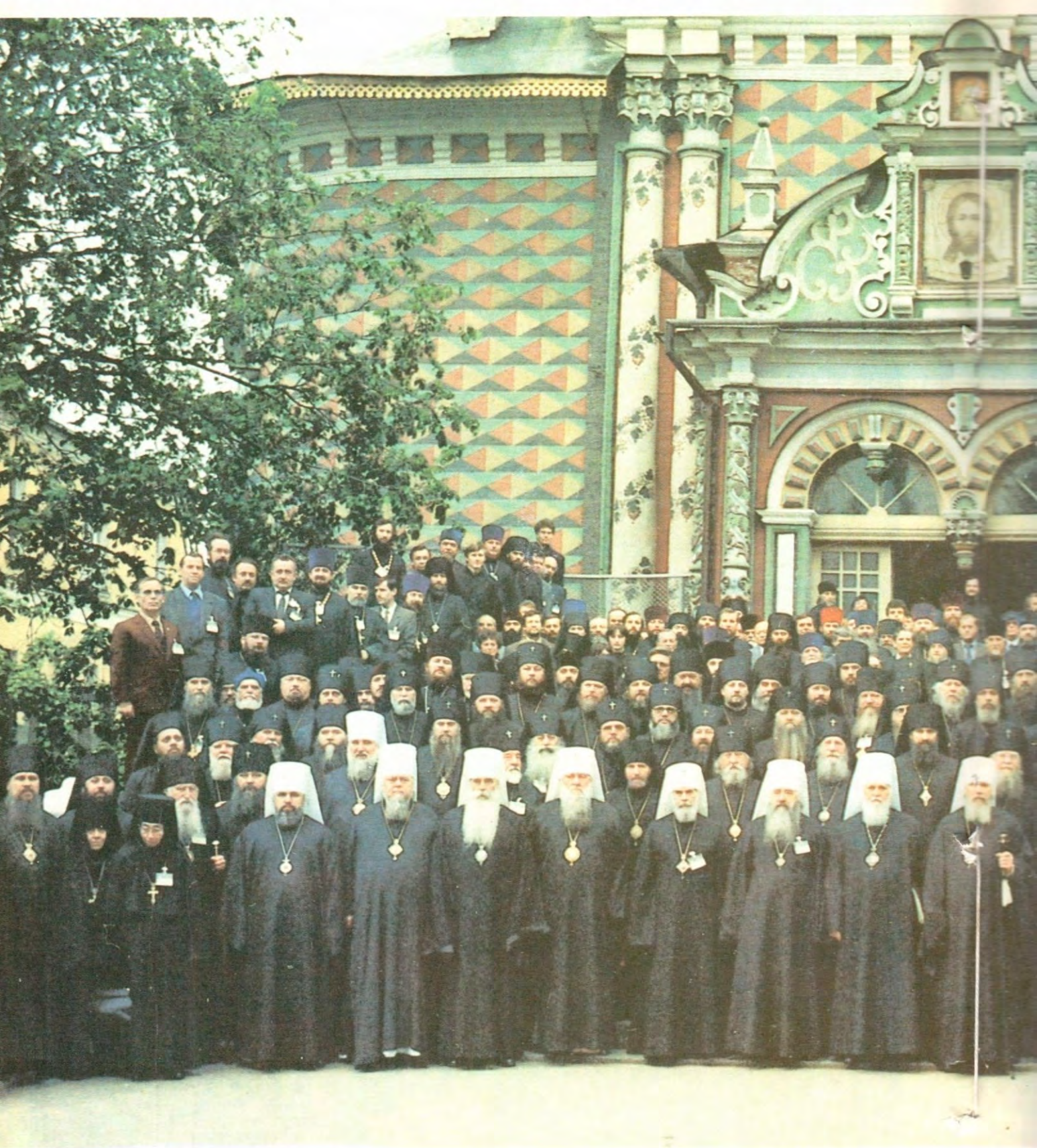
УЧАСТНИКИ ПОМЕСТНОГО СОБОРА РУССКОЙ ПРАВОСЛАВ 7—8 июня 1990 го