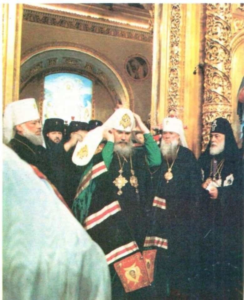
Возложение патриаршего кукуля