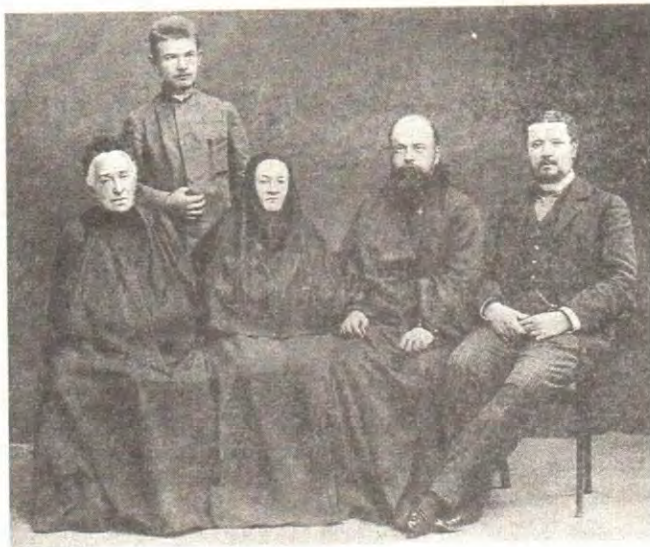
Митрополит Серафим с отцом Святейшего Патриарха Алексия († 1970) Сергеем Владимировичем Симанским (крайний справа)

Такой поступок оперившегося птенца, скажем мы, простителен, ибо он не приносит зла никому из себе подобных; но это более чем преступно для разума человеческого, создающего науки, которыми пользуется весь мир. Неверие, например, представителей такой науки, как естествознание, ведет к пагубным последствиям, и особенно ясно сказываются эти последствия в наш просвещенный век. По разумению Святой Церкви, высшая степень просвещения состоит в том, чтобы иметь по возможности ясное понятие о Боге, а сыны нашего века и поклонники просвещения, исчерпавшие, по их словам, всю премудрость, никак не могут дойти до главного, то есть до познания Бога и усмотрения следов всеприсутствия Творца в мире, что отчасти разумели и язычники. Как часто мы слышим из уст людей, не видящих присутствия ядов чумы или тифа в воздухе и воде, но утверждающих о их существовании при эпидемиях, подобную фразу: «Я не знаю Бога, потому что не вижу Его!» Не явное ли противоречие: «просвещенный» — «не вижу!»? Он не видит души в человеке, не видит того, что существует, но признает бактерии, бактерии или пылинки, которые человек не в состоянии различить и сильно вооруженным глазом. Их просвещение довело до такой премудрости, что они не видят в себе ничего,