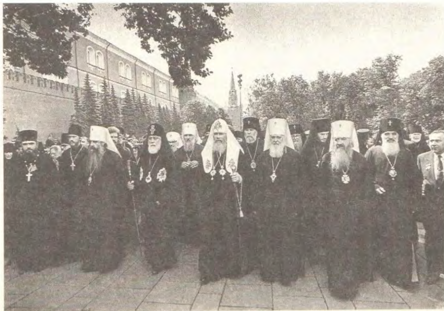
Святейший Патриарх Алексий II, Святейший и Блаженнейший Католикос-Патриарх Илия II и участники Поместного Собора во время возложения венка к могиле Неизвестного солдата у Кремлевской стены

Святейшего Патриарха Алексия II поздравили также архимандриты Феодор, представитель Патриарха Александрийского при Патриархе Московском, настоятель Александрийского подворья в Одессе, Феофилакт, представитель Патриарха Иерусалимского, настоятель Иерусалимского подворья в