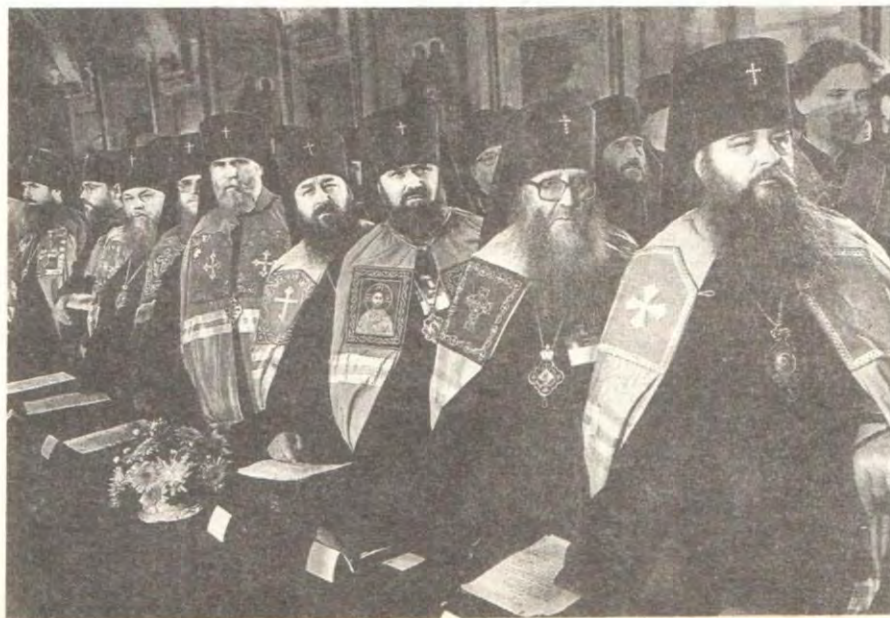
Участники Поместного Собора

Законодатели присвоили себе право подменять собственными понятиями представления верующих о своей Церкви и, например, упорно хотят провести подмену свойственной Церкви монолитной иерархической структуре конгрегационалистским ее устройством. Этим они вмешиваются во внутреннюю церковную жизнь, намеренно хотят ее исказить и это искажение законодательно закрепить. Мы не можем допустить этого, потому что правильное каноническое устройство Церкви жизненно важно для верующих. Мы просим законодателей уважать нашу веру, которая для нас так же дорога, как и жизнь. Позвольте напомнить законодателям, что они не вправе злоупотреблять своим положением и должны строго соотносить свои формулировки со смыс-