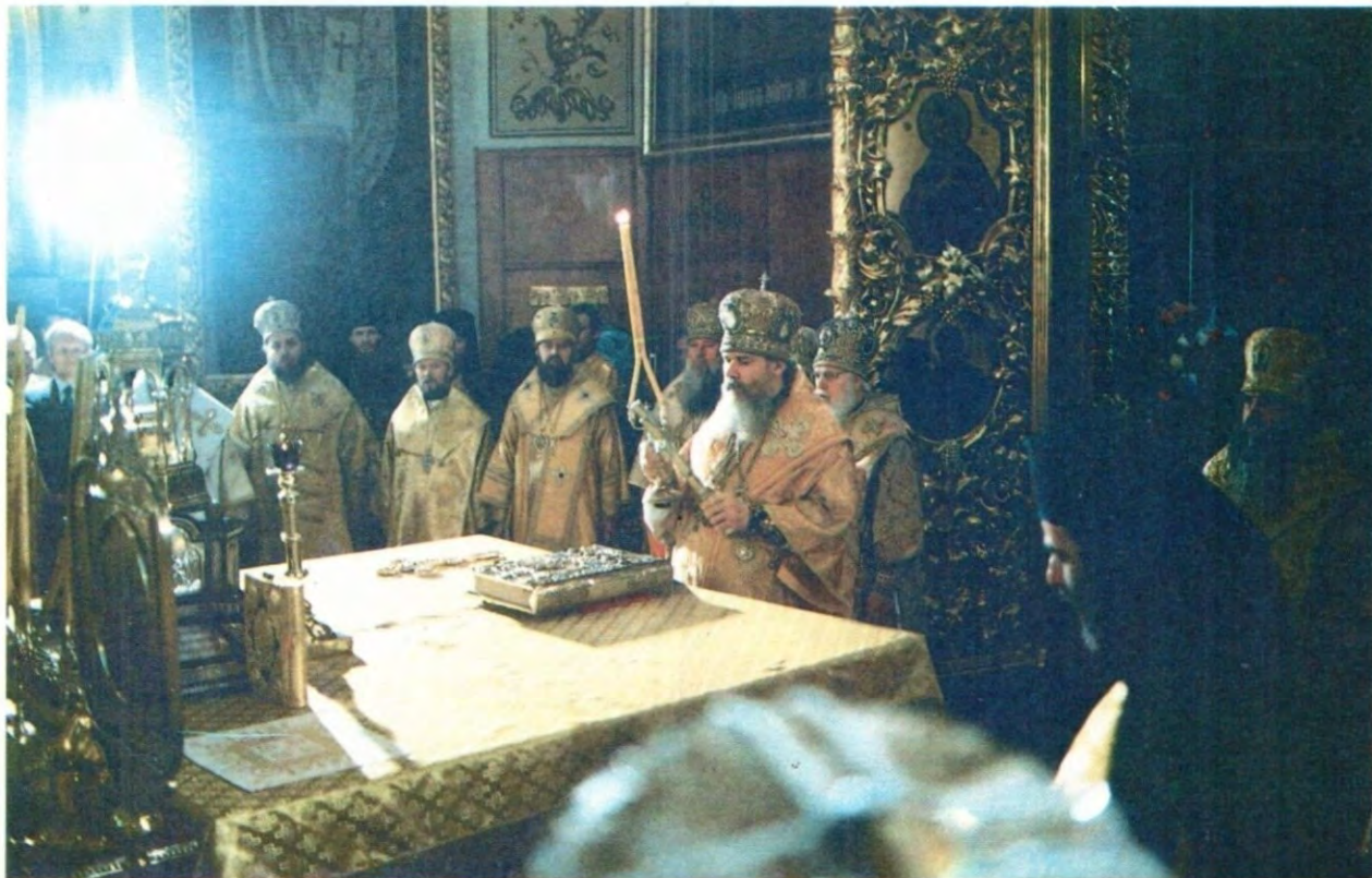
За Божественной литургией